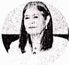
DIP. MAYELA DEL CARMEN SALAS SÁENZ INTEGRANTE