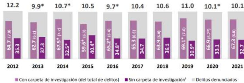
Porcentaje de delitos denunciados ante Ministerio Público o Fiscalía estatal

Durante 2021 , se denunció e inició una carpeta de investigación en 6.8% del total de delitos. En 93.2% de delitos no hubo denuncia o no se inició una carpeta de investigación .