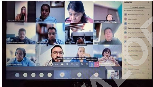
Capacitación sobre materiales LEGO impartida por el INE

Finalmente, se agradeció al INE la disposición y el apoyo para el impulso de estos proyectos y para la consolidación de una estrategia de educación cívica a nivel estatal