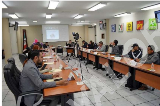
Tercera Reunión sobre el 12º Parlamento de las Niñas y Niños