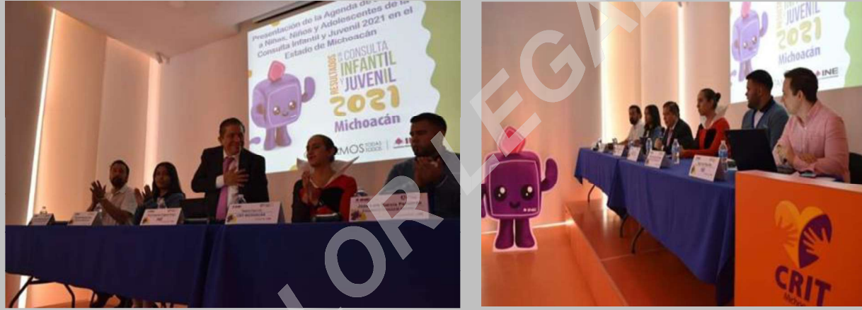
Presentación de la Agenda de Atención a Niñas, Niños y Adolescente de la CIJ2021 en Michoacán

Dentro de la presentación de la Agenda se destacó la presentación y análisis de resultados por parte del estudiantado, así como los compromisos pactados por el GCIM.