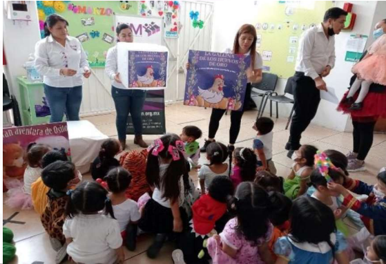
Explicación para identificar en la urna la carátula del cuento y poder votar.