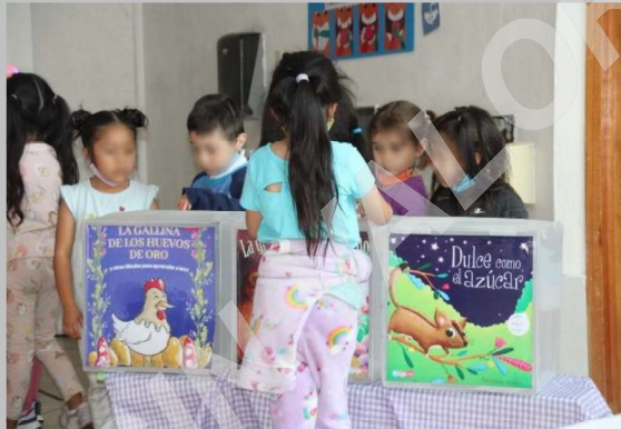
Niños y niñas haciendo efectivo el voto.