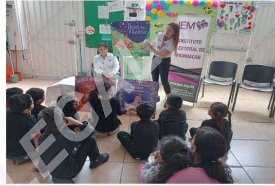
Explicación de cómo sería la votación de cada uno de los cuentos.