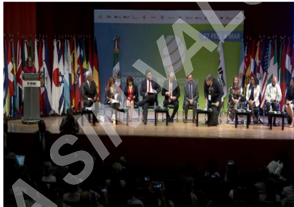
Inauguración del Foro Global