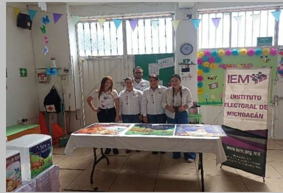
Personal que apoyó en la realización de la votación.