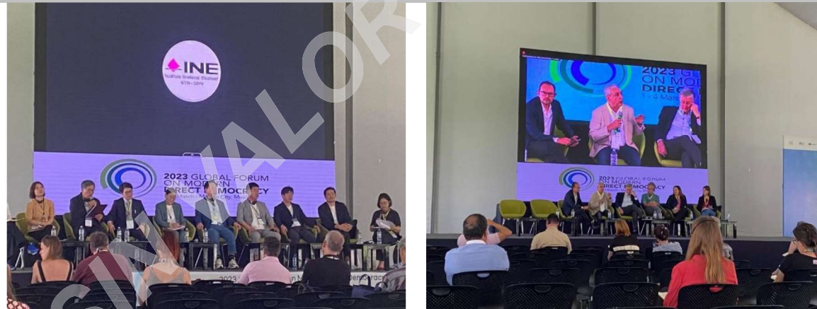
Conferencias plenarias en el Tecnológico de Monterrey

De igual forma que en la Escuela de Medicina, en múltiples salones de la institución educativa se llevaron a cabo diversos paneles y talleres como fueron: