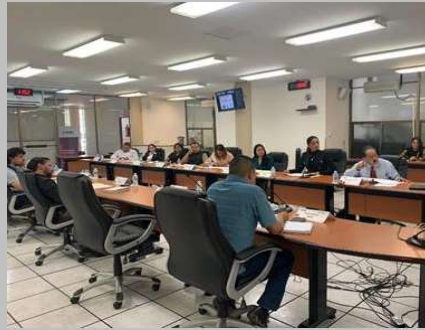
Integrantes del GECIM