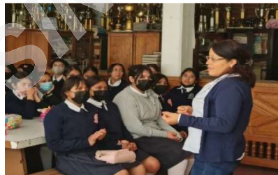
Plática y capacitación: “Proceso Electoral y Día de la Jornada Electoral”

En la plática y la elección escolar estuvieron presentes 319 personas de entre 12 y 29 años.