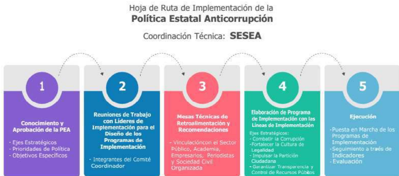
Gráfico 107. Planeación Estratégica para la implementación de la Política