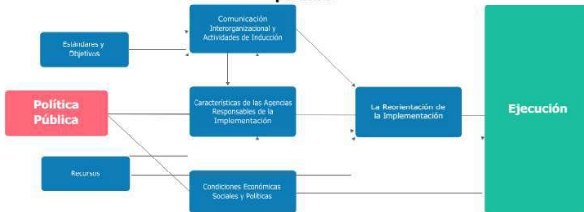
Gráfico 108. Modelo del proceso de Implementación de las políticas