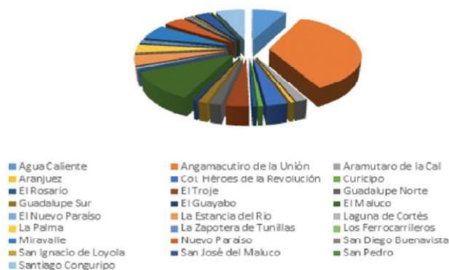
Distribución de Población por comunidades