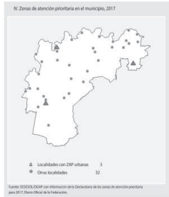
Figura 14. Zonas de atención Prioritaria