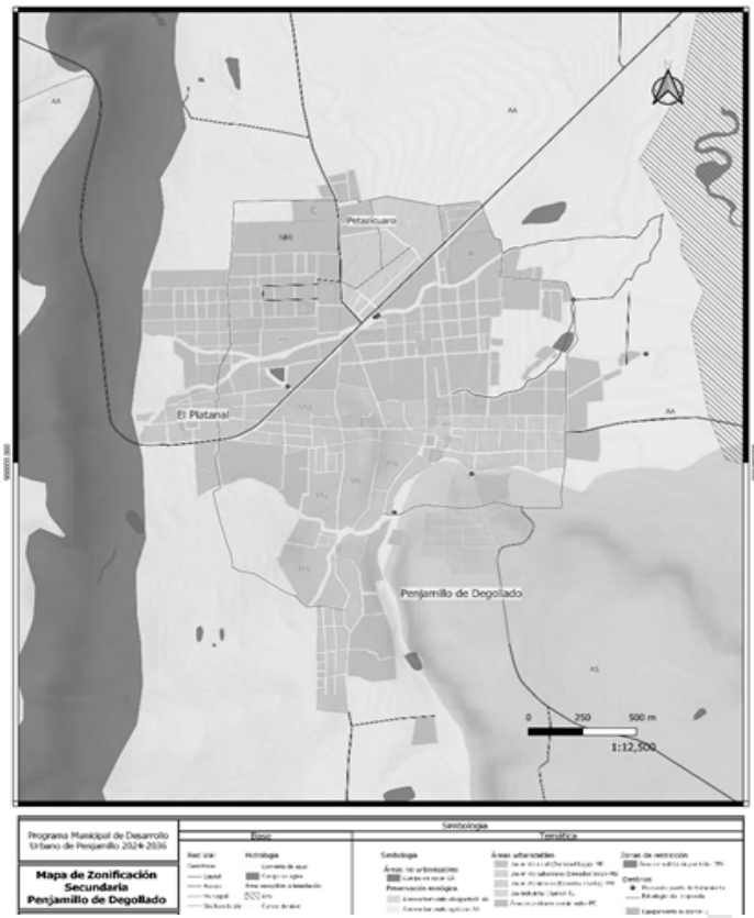
Figura. 3.2.2. Zonificación Secundaria (cabecera municipal)