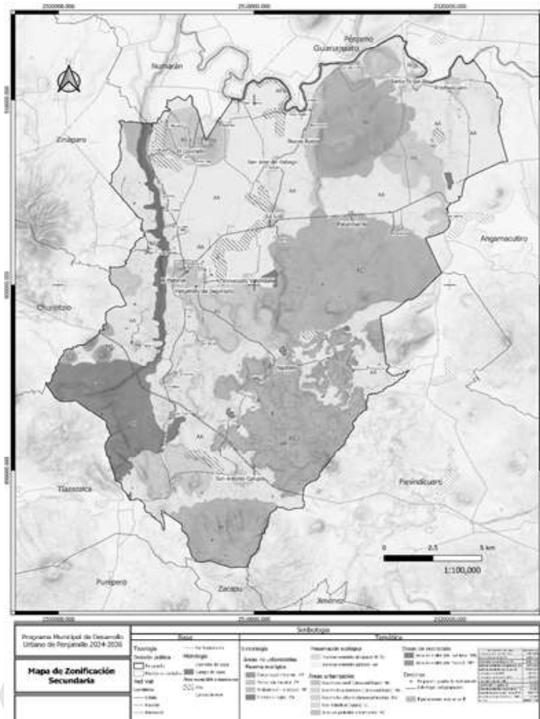
Figura. 3.2. 1. Zonificación Secundaria (municipio)