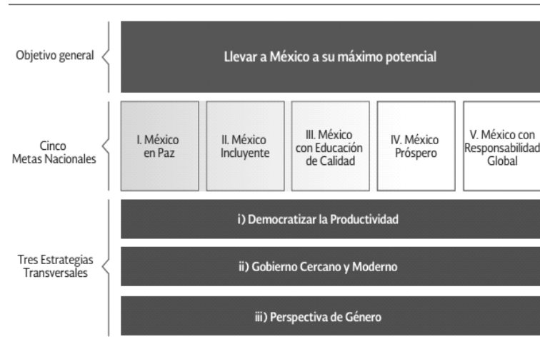
FIGURA 1.1. ESQUEMA DEL PLAN NACIONAL DE DESARROLLO 2013-2018.