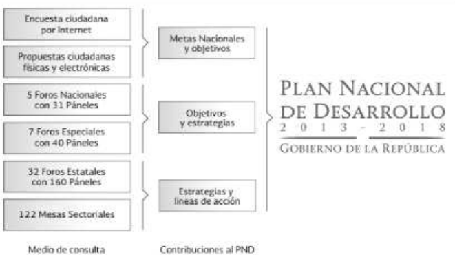
FIGURA A.1. ESQUEMA DEL PROCESO DE CONSULTA DEL PLAN NACIONAL DE DESARROLLO.

la página de Internet pnd.gob.mx , para la recepción de propuestas en archivos interactivos. De manera paralela, se abrieron ventanillas de recepción física de