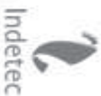
Cumplimiento a la Matriz de Indicadores para Resultados del Programa presupuestario que Opera con Recursos del FONIE 2019