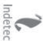
Cumplimiento a la Matriz de Indicadores para Resultados del Programa presupuestario que Opera con Recursos del FONE 2018

Evaluación Estratégica del Desempeño del Programa Educación Básica Financiado con Recursos del FONE EJERCICIO FISCAL 2020