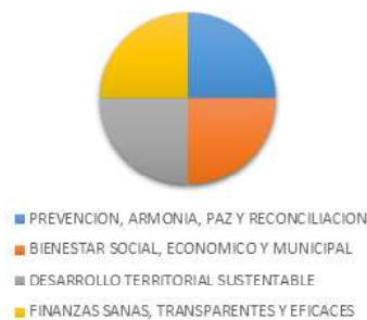
Fig. 1. Gráfica proporcional de los ejes rectores.