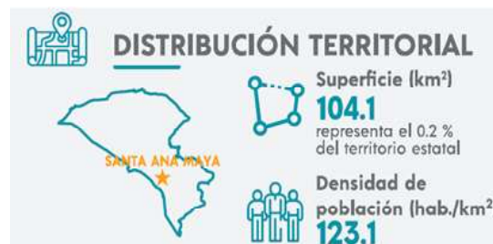
Fig.2 Descripción de la distribución territorial tomada de los datos del INEGI 2021.

De acuerdo al censo de población y vivienda 2020 y 2021 efectuado por el INEGI se cuenta con una superficie territorial de 104.1 km 2 que representa el 0.2 % del territorio estatal, contando además con una densidad de población de 123.1 hab./km 2 .