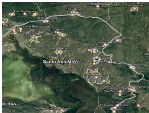
Fig. 1. Mapa del relieve de la extensión territorial total del municipio de Santa Ana Maya.

Se localiza al norte del Estado, en las coordenadas 20°00' de latitud norte y 101°01' de longitud oeste, a una altura de 1,840 metros sobre el nivel del mar. Limita al norte y este con el Estado de Guanajuato, al sur y oeste con Cuitzeo y al sur con Álvaro Obregón. Su distancia a Morelia la capital del Estado es de 63 km aproximadamente.