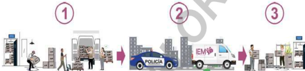
Imagen 1. Envío y recepción de las boletas y demás documentación y material electoral

así como los nombres y cargos de las personas funcionarias que entregan las boletas y demás documentación electoral, personas funcionarias que reciben, representaciones partidarias presentes y en su caso de candidaturas independientes que participaron en la actividad, entre otros detalles que se consideren relevantes de dicha actividad, en relación con lo señalado en el artículo 8, numeral 1, inciso c) de los presentes Lineamientos, como a continuación se observa: