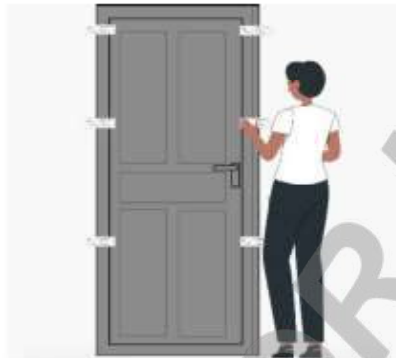
Imagen 3. Clausura y sellado de bodega electoral