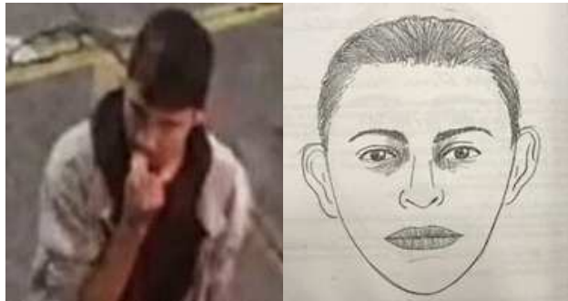
[* El archivo contiene datos no válidos | En línea.JPG *]

oscuro, nariz recta de base regular, boca chica de labios regulares, mentón cuadrado y barba partida.