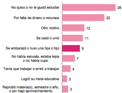
Distribución porcentual de las mujeres de 15 a 19 años que no asisten a la escuela, por causa de abandono escolar 2018