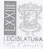
DIP. ADRIANA CAMPOS HUIRACHE INTEGRANTE