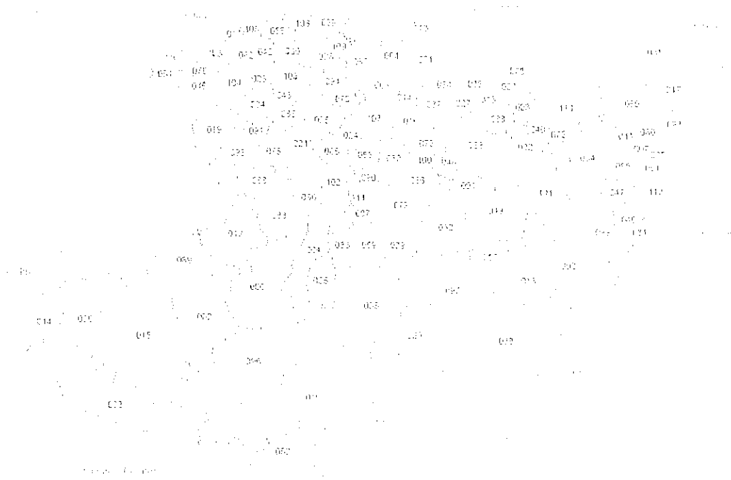
Despoblamiento acumulado de Michoacán 2010-1990

En cuanto a la regionalización de la migración internacional en Michoacán, existen 5 regiones que se indican en color azul, en el siguiente mapa: