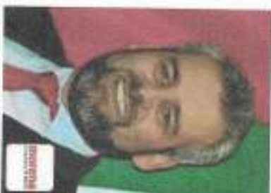
C. Diputado Alfredo Ramírez Bedolla Integrante