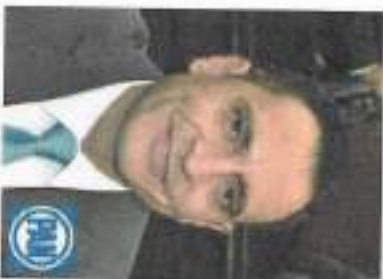
C. Diputado Hugo Anaya Ávila Integrante