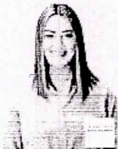
DIP. MÓNICA ESTELA VALDEZ PULIDO PRESIDENTA