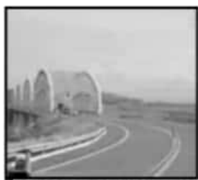
TRANSPORTISTAS LLAMAN A AMPLIAR LA PISTA Y DAR SEGURIDAD.

Cabe señalar que en casos como Jiquilpan no se cuenta con datos que puedan establecer puntos centrales para el análisis como el número de jiquilpenses en el extranjero, las principales ciudades en que se ubican y cuál es el impacto económico en lo local que esto genera.