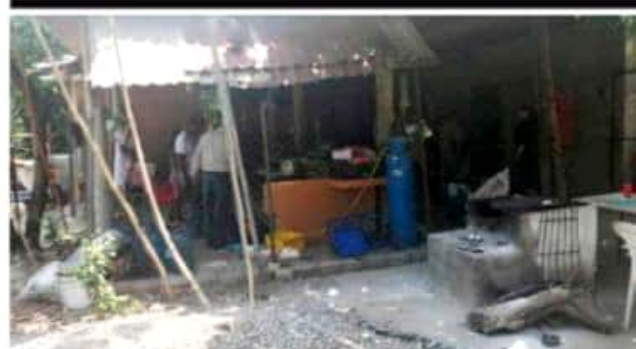
CD. LÁZARO CÁRDENAS, MICH.- La CNTE aseguró que la CFE miente a los usuarios al querer justificar el cobro de un recibo que supera los 6 mil pesos, ya que la vivienda en cuestión no cuenta con aparatos eléctricos que justifiquen un consumo tan grande como el que quiere justificar la CFE.