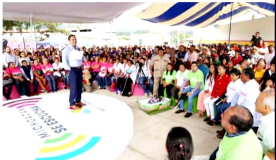
MORELIA, MICH.- El gobernador Silvano Aureoles, entregó la sustitución del Centro de Salud en Ocampo, donde reconoció la labor de auxiliares para cuidar la salud de las y los michoacanos que viven en comunidades alejadas.

estén embarazadas o sean madres de niños de hasta 3 meses de edad, con el objetivo de abatir la muerte infantil y coadyuvar en el desarrollo oportuno de las primeras etapas de los recién nacidos.