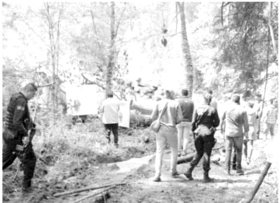
El gobierno del estado a través de la Mesa de Seguridad Ambiental procedió al decomiso de un lote de madera de pino ilegalmente obtenida en el predio La Carbonera, municipio de Charo.

La explotación ilegal de recursos maderables en el Estado se encuentra ligada al cambio de uso de suelo forestal ilícito, en predios donde se pretende instalar huertas de aguacate o desarrollos habitacionales, sin disponer del permiso correspondiente de la Semarnat.