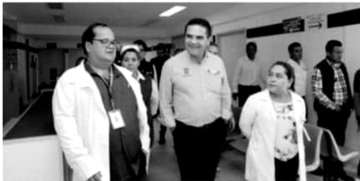
TUXPAN, MICH.- Garantizar las condiciones para que los adultos de la tercera edad accedan a una mejor calidad de vida, será siempre una prioridad para mi gobierno, señaló el gobernador de Michoacán, Silvano Aureoles Conejo.

También escuchó y se acercó a las y los derechohabientes y saludó a los pacientes que actualmente reciben atención médica.