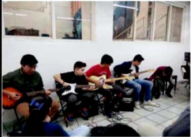
URUAPAN, MICH.- Concluye sus talleres de verano el Centro de las Artes Uruapan.