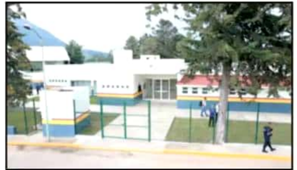
LA CLÍNICA DE OCAMPO TENÍA 40 AÑOS DE NO HABER SIDO ATENDIDA.