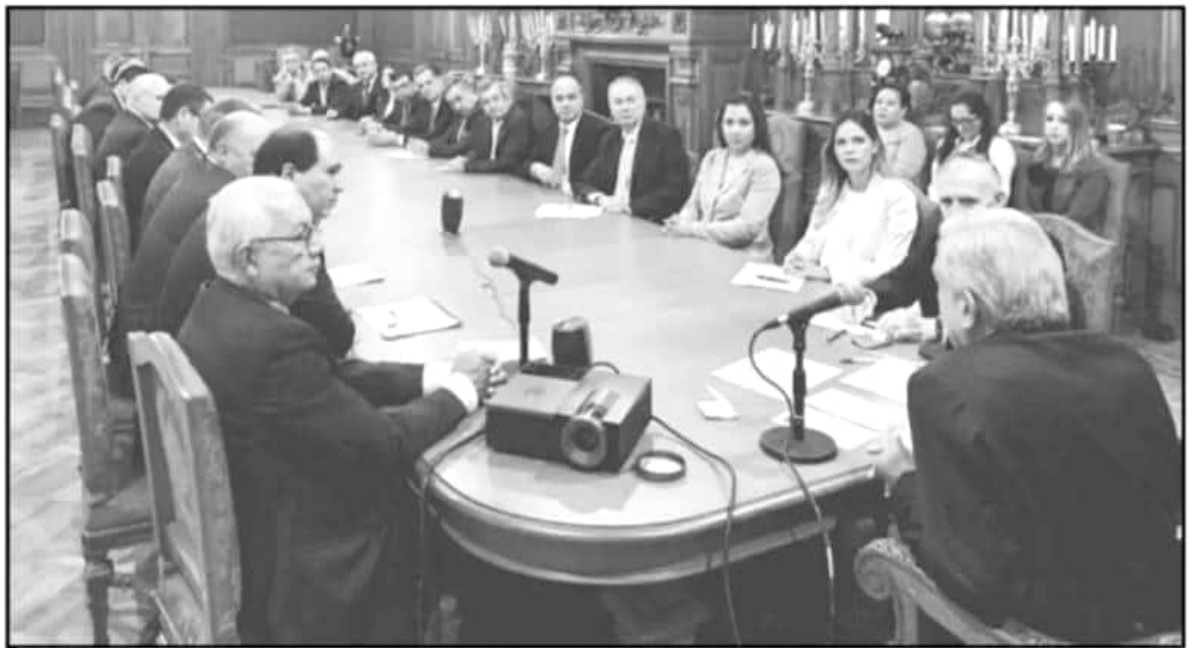
EMPRESARIOS E INDUSTRIALES DEL ESTADO EXPONEN A AMLO LAS RAZONES POR LA QUE SE DEBE SEGUIR INVIRTIENDO SIN DEJAR DEL LADO LA INSEGURIDAD.

expusieron cuáles son las razones por las que se debe seguir invirtiendo en acciones que fomenten la productividad, esto sin dejar el lado de la seguridad, “puesto que ambos factores se deben mejorar”.