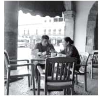
Están pendientes de expedir 26 permisos más.