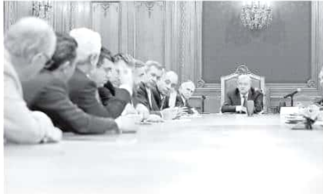
Cinco ejes prioritarios de atención para Michoacán fueron expuestos en la junta

Previo al encuentro, los michoacanos convocados definieron con funcionarios de Presidencia una agenda de temas a abordarse con López Obrador: seguridad, infraestructura carretera y conectividad, federalización de la nómina federal y ma-