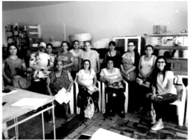
MORELIA, MICH.- El esquema de crédito grupal que se integra por un mínimo de 12 mujeres y máximo de 40.

Para las interesadas en acceder a los créditos Palabra de Mujer, pueden acercarse a las oficinas de la Seimujer, ubicadas en Avenida Acueducto, No. 1106, en la colonia Chapultepec Norte de Morelia, para el interior del estado en el teléfono 443 113 6700.