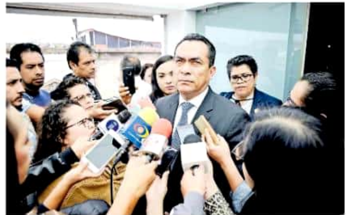
El fiscal mencionó que los aspectos a plantear será el uso de nuevas tecnologías y técnicas de investigación.