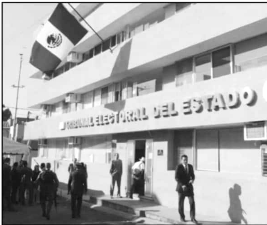
EL TRIBUNAL ELECTORAL DEL ESTADO (TEEM) ORGANIZARÁ UN FORO ESPECIAL PARA EL SIGUIENTE FIN DE SEMANA.

representadas en las diferentes ponencias