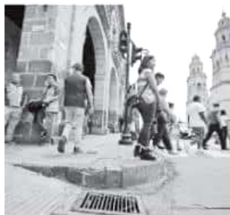
En el primer cuadro se colocarán ocho rejillas nuevas.

Mencionó que el recurso para estas reparaciones proviene de un fondo municipal para emergencias e infraestructura y que la colocación no fue un gasto mayor.