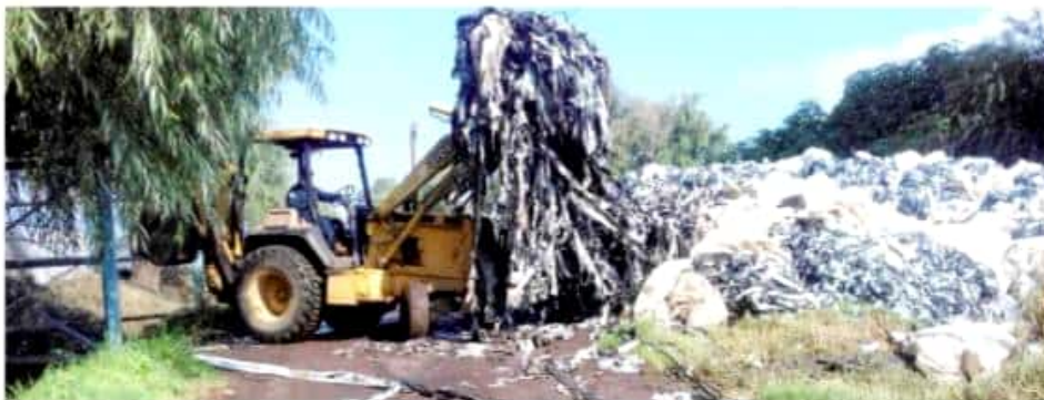
TANGANCÍCUARO, MICH.- En esta cabecera municipal se intenta cuidar el medio ambiente y la salud de los tangancicuarenses, por lo que las autoridades municipales realizan limpieza de desechos agroplásticos.

Señaló que la disminución de frutilla sembrada responde a los riesgos que prevén los productores por pérdidas debido al cambio climático, los altos costos de insumo e incluso las pérdidas por robo que sufren los productores.