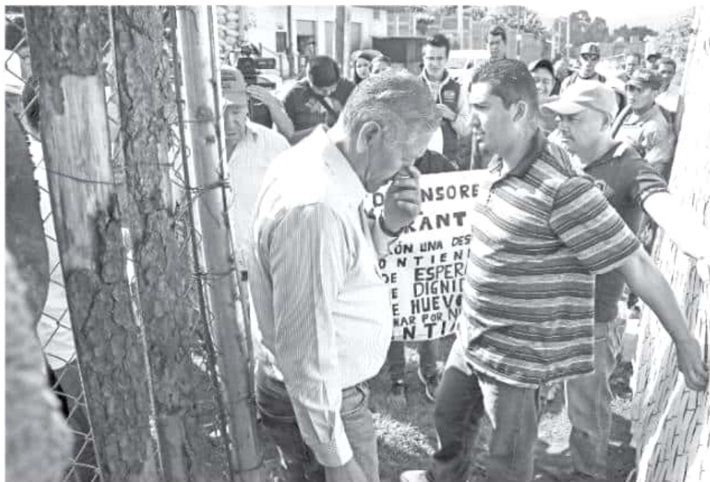
El secretario del Ayuntamiento visitó la comunidad pero no fue bien recibido por la población.