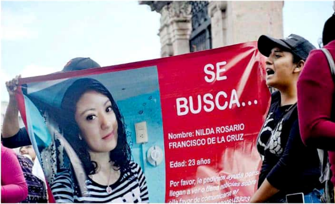
"No sé, pero yo creo que hay algo turbio ahí", añadió el papá de la joven