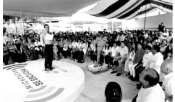
MORELIA, MICH.- Las y los michoacanos tienen garantizados los servicios de atención primaria de salud, aseguró el gobernador Silvano Aureoles Conejo.