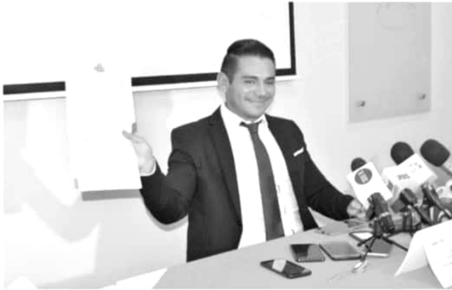
Al solapar actividades ilícitas de empresas irregulares, se atenta además contra las normas sanitarias.

«Nos bajaron del vehículo en el que íbamos entre palabras y amenazas y todo esto sin ningún tipo de documento que ostentara como una orden, no nos dijeron