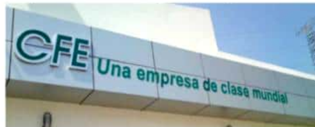
CD. LÁZARO CÁRDENAS, MICH.- Diversas organizaciones civiles como grupos sindicales protestarán hoy ante la CFE por el cobro de tarifas excesivas, así como indebidas hacia colonos.

un refrigerador. Acompañada las organizaciones "Colon Unidas por Las Guacamayas" y Frente Popular Revolucionario (FPR), la afectada visitó un par de ocasiones las instalaciones de la Comisión Federal, sin recibir respuesta alguna.