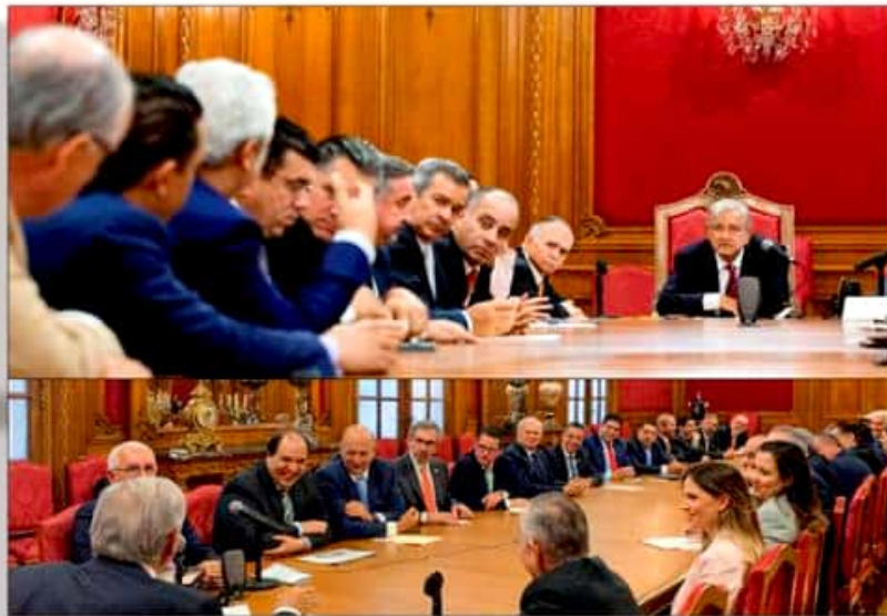
Empresarios michoacanos se reunieron con AMLO.