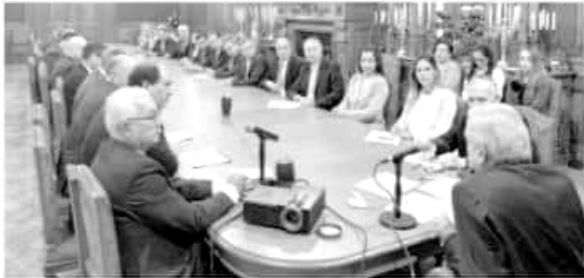
Aspecto de la audiencia del pasado miércoles.

▶ En el diálogo previo externaron inquietud por la seguridad en el estado la inversión en infraestructura, como también la economía en el Puerto LC