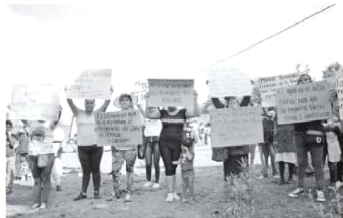
Vecinos del lugar esperaban a autoridades municipales y a representantes del comité con lonas y pancartas

de acordar la zona, se dedicaron únicamente a observar la trifulca que se llevaba a cabo, no hablemos de la prevención y acompañamiento.