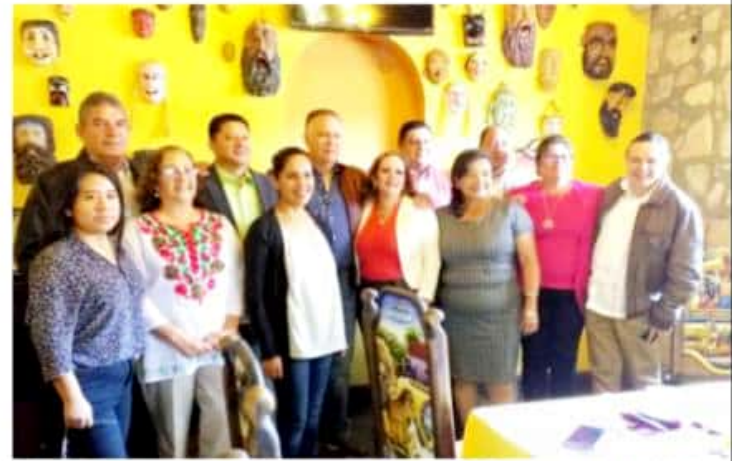
ZAMORA, MICH.- Se llevó a cabo en esta ciudad un encuentro de los legisladores federales de Michoacán abanderados por Morena y el Delegado del Instituto Mexicano del Seguro Social en la zona Michoacán.

derechohabientes y beneficiarios del Seguro Social, donde se requiere mayor gestión de recursos para ampliar espacios, contratar personal médico especializado para el tratamiento de los pacientes. La legisladora que encabezó el encuentro, señaló que se trabajará para garantizar que las aportaciones patronales del IMSS se realicen en la entidad donde se localiza la empresa en físico, esto a fin de garantizar que se cuente con recurso para destinar a obras, personal y lo que requiere en la dependencia. Y es que, dijo, se debe coadyuvar para hacer crecer a una de las instituciones que atiende a una gran cantidad de habitantes, para que aumente la zona de atención médica-hospitalaria, especialmente para los trabajadores, sector que por su ubicación difícilmente puede acceder a un servicio de Unidad de Medicina Familiar (UMF).