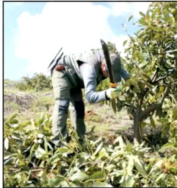
LAS CAMPAÑAS PARA DESMONTAR HUERTAS ILEGALES COMBATEN SOBRE TODO M

y social que se ha encontrado esta medida que busca desincentivar la proliferación desmedida de monocultivos, Michoacán recuperó 601 hectáreas de bosque convertidas en huertas frutícolas, entre agosto de 2017 y abril de 2019, dijo.