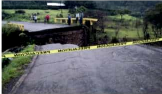
LOS REYES, MICH.- Colapsó el puente "La Guajolota" de la carretera a Atapan, a causa de una creciente.

"Desde que nos enteramos del lamentable acontecimiento comenzamos a gestionar el apoyo necesario, primero para restablecer la comunicación por esa carretera, con todas las medidas de seguridad necesaria y segundo para aterrizar recursos que nos permitan reconstruir el puente en el menor tiempo posible; la respuesta ha sido positiva y desde este viernes esperamos maquinaria pesada trabajando en el lugar", puntualizó el alcalde.