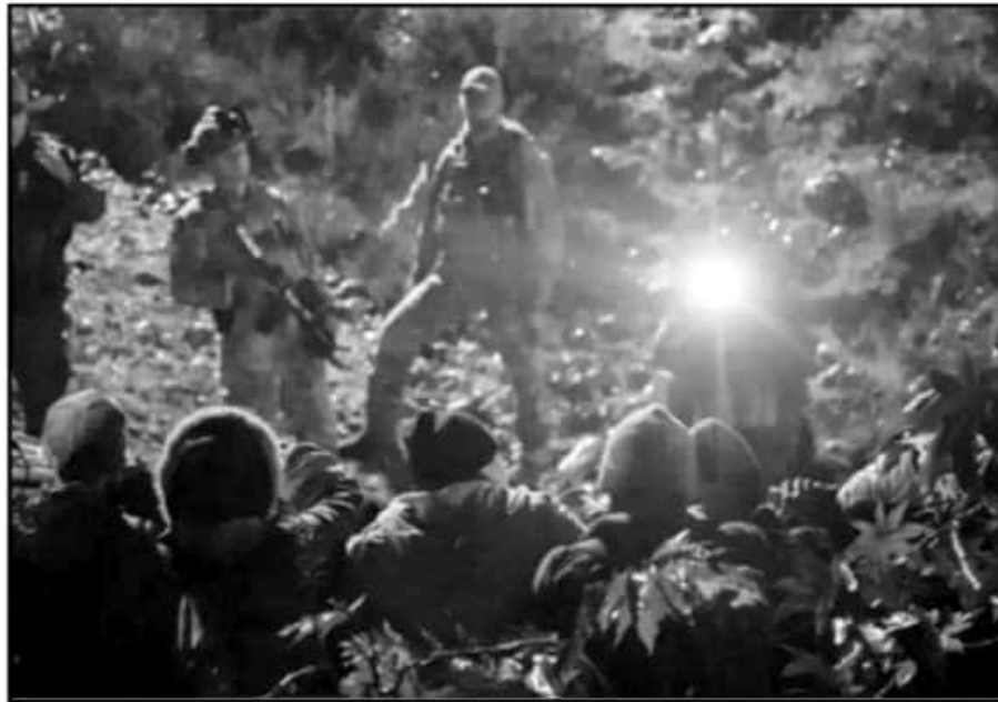
ACADÉMICOS BUSCAN MEJORAR LAS POLÍTICAS PÚBLICAS A FAVOR DE LA POBLACIÓN MIGRANTE DE MICHOACÁN.

Entre los temas propuestos a desarrollarse el próximo ocho de agosto al mediodía se plantean las causas y consecuencias del paso por Michoacán de las caravanas centroamericanas y el paso en pe-