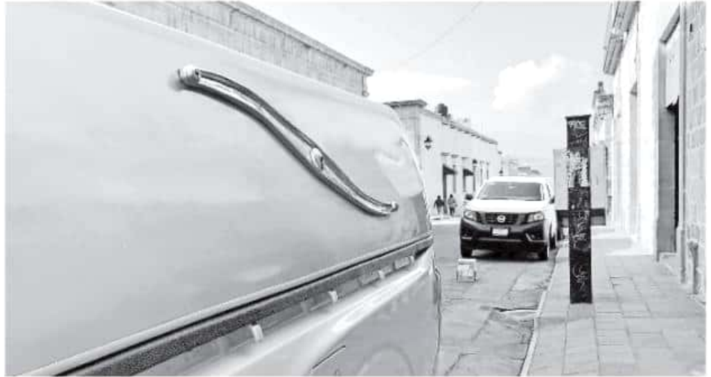
En la capital michoacana existen sólo seis compañías regulares que ofrecen este servicio.