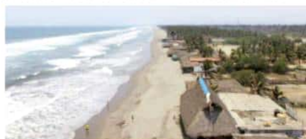
CD. LÁZARO CÁRDENAS, MICH.- Enramaderos de este municipio están solicitando a las autoridades federales la construcción de unas escolleras en playa Jardín, ya que el fuerte oleaje del que dicen malamente se le denomina "mar de fondo", no es otra cosa que el fuerte oleaje que consecuencia de la construcción de escolleras de la empresa ArcelorMittal.

embargo, añade Beltrán Arreola, éstas vendrían a beneficiar en un 100%, en dos situaciones, una de ellas reduciendo la afectación de terrenos del mar a los establecimientos, así como la tranquilidad de olas para el turista. La solicitud fue entregada formalmente y recibida por parte de la Federación, en espera de ser evaluada para dar una respuesta a la petición, a la que consideran como urgente.