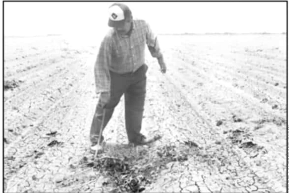
CONFÍA GOBIERNO ESTATAL EN QUE EL CLIMA NO SERÁ TAN EXTREMO PARA QUE HAYA MÁS RENDIMIENTO EN EL AGRO.

“Hay presupuesto, pero hace falta terminar la adquisición de los seguros”