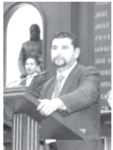
Comprometido con los michoacanos, el congresista en estos primeros meses, además de la labor legislativa, ha emprendido acciones permanentes en materia de gestión social, para beneficio de miles de ciudadanos.

Así también uno más para demandar al Gobierno Federal que se establecieran las Oficinas Centrales de la Sagrapa en la entidad y otro para solicitar a los legisladores integrantes de la LXXIV Legislatura Local su respaldo económico para ayudar a las personas damnificadas por la contingencia