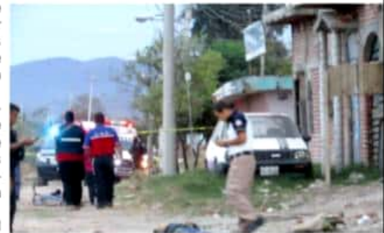
ZAMORA, MICH.- La esperanza del cambio en materia de seguridad no ha llegado a Zamora, región que por el contrario, como ocurre en otras del país, registra aumentos en la violencia extrema, señalan estudios del Colmich.