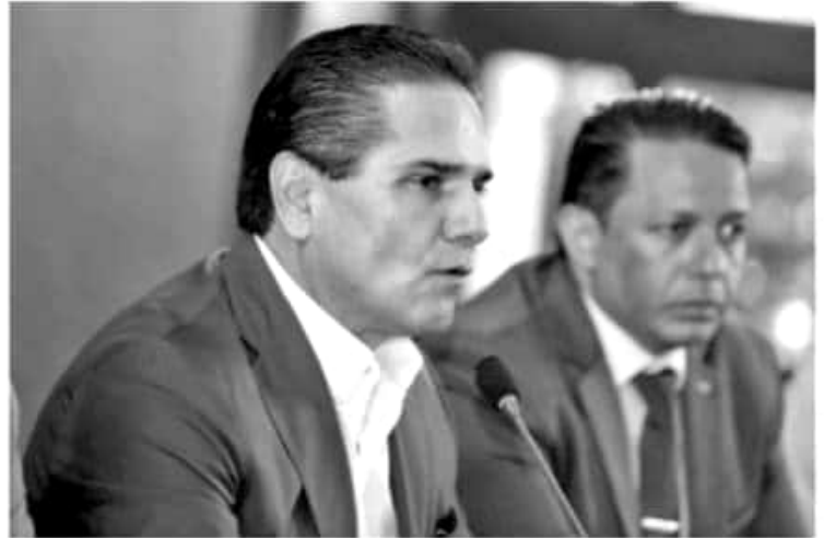
MORELIA, MICH.-En entrevista, el titular del Ejecutivo estatal señaló que se estará a la espera para ver la mezcla de recursos entre Federación y el Estado, de manera tal que no se deje de pagar a los maestros.

Por lo pronto, el perredista informó que el gobierno de Andrés Manuel López Obrador reconoce el déficit de 5 mil 700 millones de pesos, luego de que se conciliaron las cifras entre las dos partes. Reportes del propio Gobierno dan cuenta de que el Estado tiene una capacidad endeble para asumir el pago de las quincenas venideras.