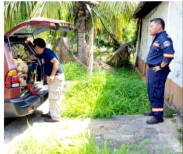
CD. LÁZARO CÁRDENAS, MICH.- La empresa acerera ArcelorMittal hizo una donación de equipo a la agrupación de voluntarios "Bomberos Costa-Sierra".

Cabe destacar que el equipo donado, fueron usados por el propio personal de la empresa ArcelorMittal durante algunos años y los mismos se encuentran en buenas condiciones para seguir laborando.