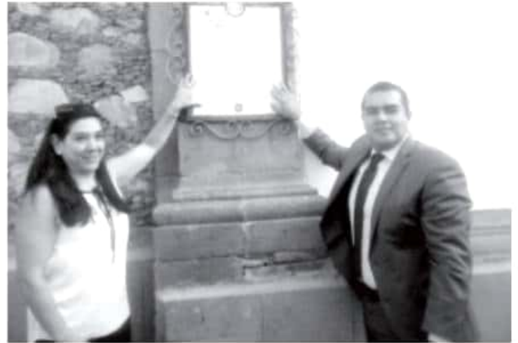
El 19 de agosto debe ser la fecha más importante a nivel nacional, ya que la Junta de Zitácuaro fue el primer Gobierno Independiente, y por lo tanto representa la genesis del constitucionalismo, palabras del presidente municipal.

Consideró que el 19 de agosto debe ser la fecha más importante a nivel nacional, ya que la Junta de Zitácuaro fue el primer Gobierno Independiente, y por lo tanto representa la