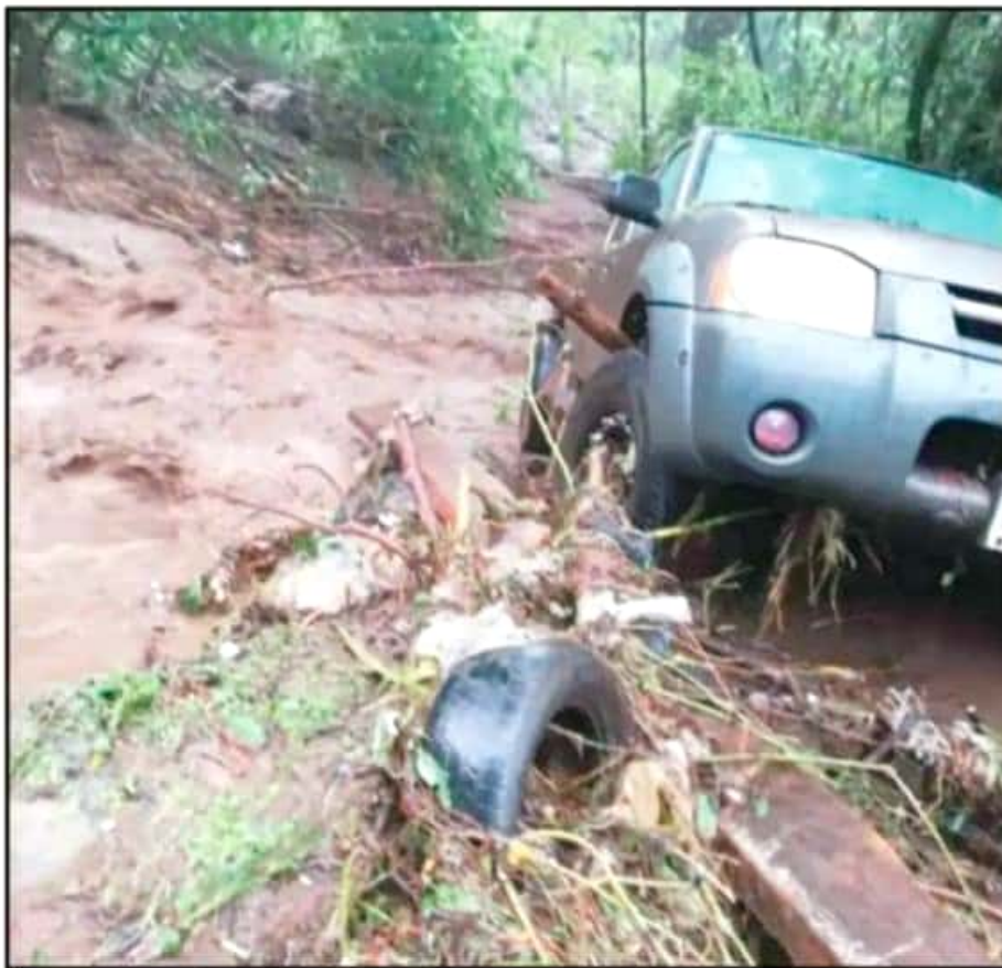
AUNQUE NO HUBO VÍCTIMAS QUE LAMENTAR, SÍ QUEDARON CUANTOSOS DAÑOS MATERIALES POR LA CORRIENTE.