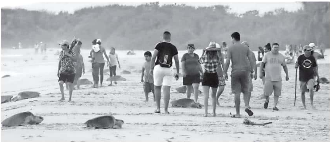
En la región aún no se ha realizado un estudio específico que indiquen el porcentaje de tortugas que han ingerido este tipo de desechos.

Lo único que puede salvar esta situación es la llegada del fenómeno de mar de fondo, que propicia el incremento del nivel de las olas que provocan la suficiente humedad que requieren las tortugas, para depositar sus huevos, por lo cual en un 40 por ciento no surtirán efecto las altas temperaturas que se presenten.