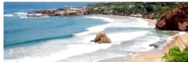
CD. LÁZARO CÁRDENAS, MICH.- El que pueda lograrse edificar el proyecto de muelle pesquero y turístico para Caleta de Campos, depende de las aportaciones de los tres niveles de gobierno y "correatar" los recursos ante Hacienda.