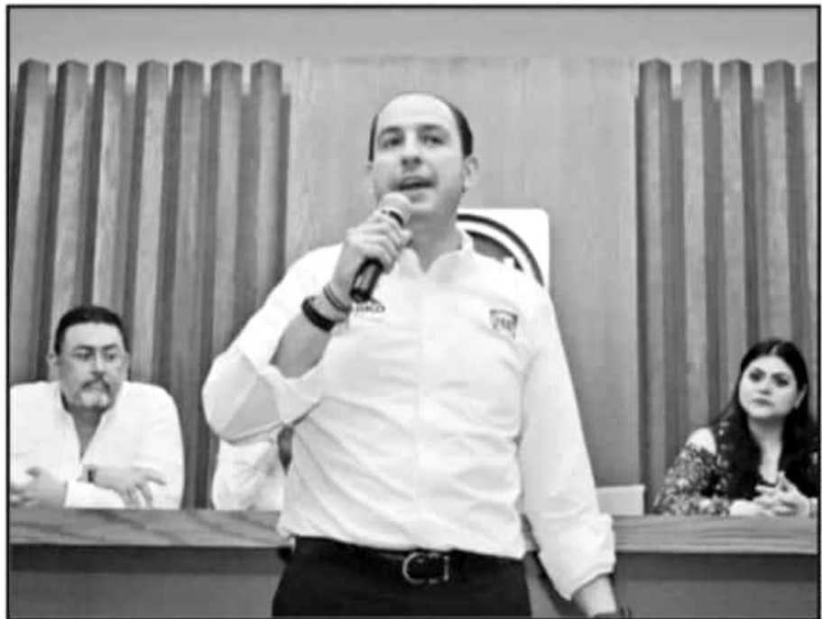
MARKO CORTÉS TIENE LA MISIÓN DE REFORZAR LA ESTRUCTURA INTERNA DE ACCIÓN NACIONAL RUMBO AL 2021

bastarán para validar una asamblea electiva