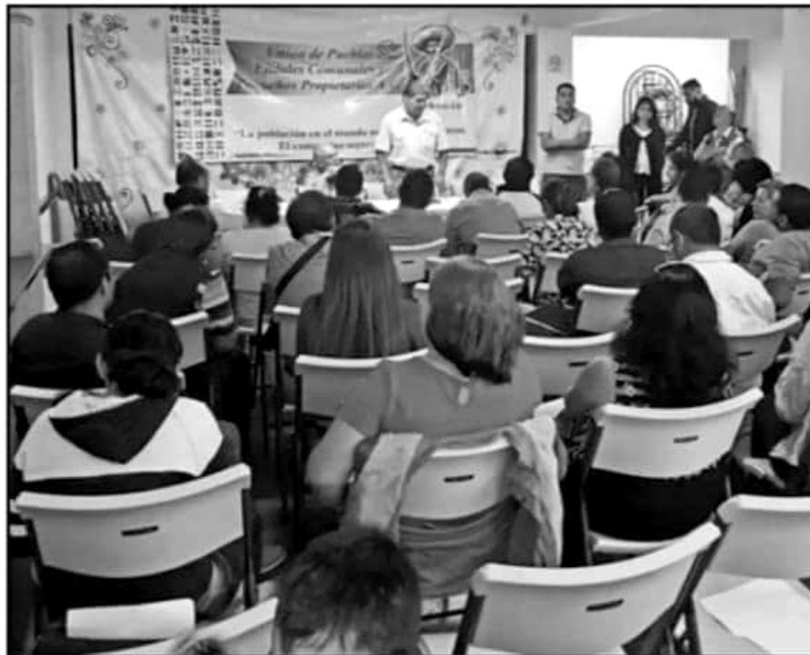
SE ENTREGARON CERTIFICACIONES A LOS PROMOTORES AUTORIZADOS DEL PROGRAMA QUE BUSCARÁN LOS PROYECTOS.

Destacó que el beneficiado con los empréstitos de 5 mil a más de 100 mil pesos, estará condicionado a pagar una tasa anual del 1 por ciento, intereses que no serán devueltos a la FAO o países patrocinadores, se depositarán