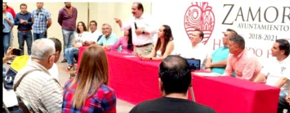
ZAMORA, MICH.- A través de un convenio con el municipio, la UIIM, abrirá una extensión en esta región.

nacionales, doctores, maestros, es una institución consolidada, el lunes 5 de agosto se apertura el proceso de inscripción en presidencia municipal; al recordar que cuentan con su registro. Los requisitos para los interesados son original y copia del certificado de la preparatoria, original y copia del acta de nacimiento, un certificado médico, 4 fotografías tamaño infantil y llenar su registro por el aspirante.