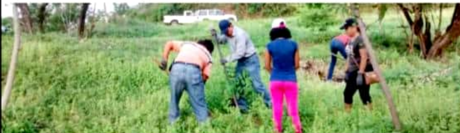
CD. LÁZARO CÁRDENAS, MICH.- Luego de la segunda etapa efectuada el pasado sábado 27 de agosto, donde se logró plantar 500 árboles de diferentes especies, la tenencia de La Mira va por su tercera etapa de reforestación.

Por ello el objetivo es sembrar en esta tercer etapa un total de mil árboles maderables, los cuales ya están disponibles en el vivero municipal y donados por el ayuntamiento local, pero aún no se define la fecha para llevar a cabo esta reforestación que impactaría de manera positiva al ambiente y sus pobladores.