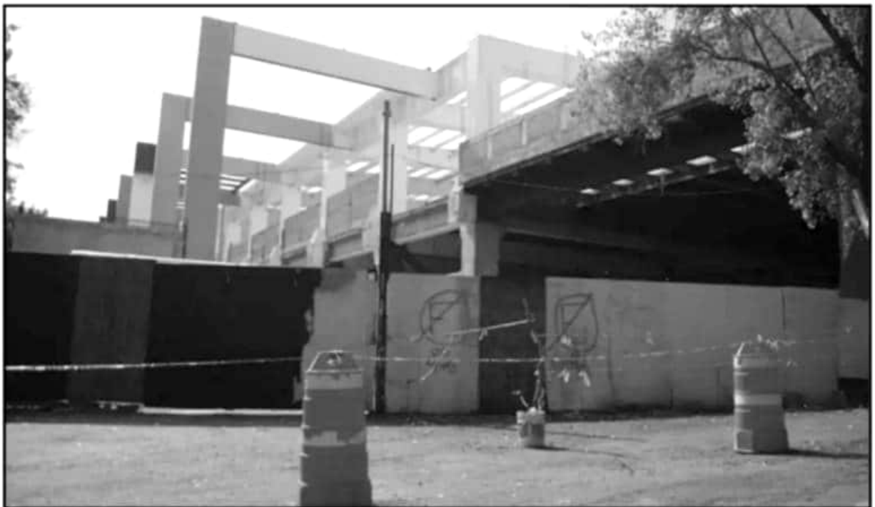
OBRAS COMO LA REMODELACIÓN DEL CENTRO DE CONVENCIONES HAN SIDO AFECTADAS POR LA FALTA DE RECURSO FEDERAL COMPROMETIDO AL ESTADO.