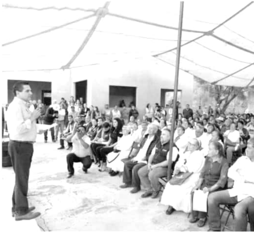
Arranca la segunda etapa de la Estancia Diurna del Adulto Mayor en el municipio de Tuxpan.

También se estima que el jefe del Ejecutivo federal brinde más detalles respecto a la Campaña Contra las Drogas denominada «Escuchemos Primero», la cual anunció ayer en la capital del país y el cual comenzará en la región de Tierra Caliente en Michoacán.