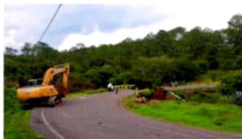
LOS REYES, MICH.- Inició la habilitación de un paso provisional en la carretera hacia Atapan, luego del colapso del puente "La Guajolota".

Méndez Escalera comentó que para los dos frentes de trabajo, el ayuntamiento aportará alrededor de 240 viajes de grava y que en las labores participan, 3 camiones de 7 metros cúbicos y 3 de 14 metros cúbicos; 2 motoniveladoras, 1 excavadora y 1 retroexcavadora.