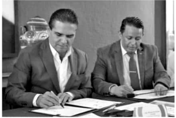
MORELIA, MICH.- El gobernador Silvano Aureoles Conejo firmó con la Cámara Mexicana de la Industria de la Construcción (CMIC), un convenio modificatorio, al convenio de colaboración con fecha del 21 de septiembre de 2017.

En el evento, el mandatario estatal se refirió a los avances que se han logrado en la federalización de la nómina educativa, que al concretarse permitirá contar con mayor solvencia económica para ejecutar obras importantes de infraestructura para Michoacán, principalmente en el tema carretero.