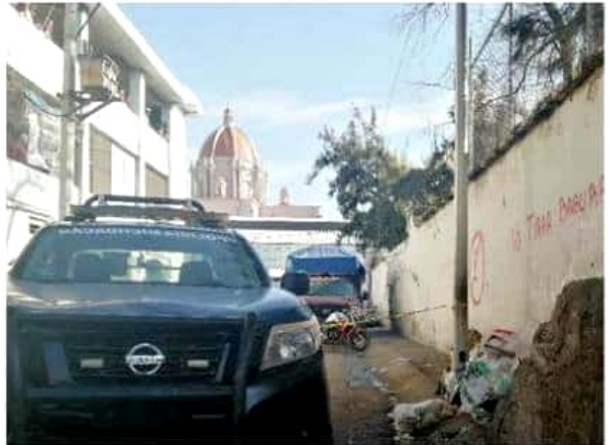
En Sahuayo, moto sicarios asesinaron a balazos a un funcionario de Reglamentos del ayuntamiento de ese lugar.

Personal de la Fiscalía General del Estado acudieron al sitio donde recolectaron siete casquillos percutidos calibre 9 milímetros, para después trasladar el cadáver al Semefo local.