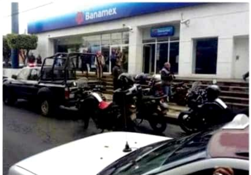
Ayer en Morelia, moto rateros asaltaron con violencia a un cuentahabiente, a quien le quitaron 200 mil pesos en efectivos, que apenas había retirado de una sucursal de Bancomer.

Además informó que uno de los asaltantes tenía un tatuaje en letras "Chinas".