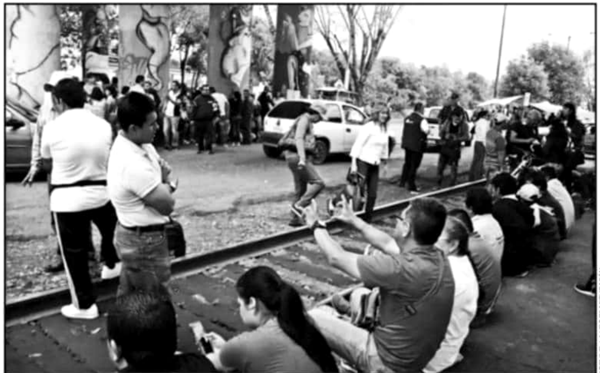
EN MICHOACÁN SON COMUNES LOS BLOQUEOS A LAS VÍAS CARRETERAS Y FERREAS POR PARTE DE GRUPOS DE MAESTROS DE LA CNTE O NORMALISTAS.

En ese sentido, el morenista Ramírez Bedolla consideró que el PAN intenta revivir su ley de marchas, que propuso desde hace tres legislaturas, la que si busca limitar el derecho a la libre manifestación en Michoacán, aprovechando la coyuntura política. La reforma penal en Tabasco constituye una medida contra una forma de delinquir, consis-