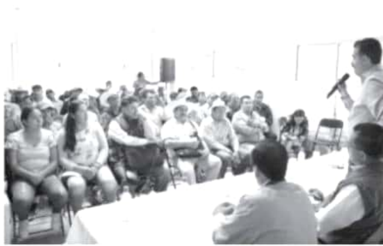
Son 11 los ejidos y comunidades, como El Rosario, Arroyo Seco, Contepec y Crescencio Morales, que comenzarán a percibir un monto de 300 pesos por hectárea para impulsar la preservación de la cobertura vegetal.

Luna García mencionó que este monto corresponde a la aportación que efectuará el Gobierno de Michoacán, a través del Fondo Ambiental, instrumento que ha concentrado la participación económica que, por remediación de daños ambientales, han realizado productores aguacateros en proceso de regularización de cultivos