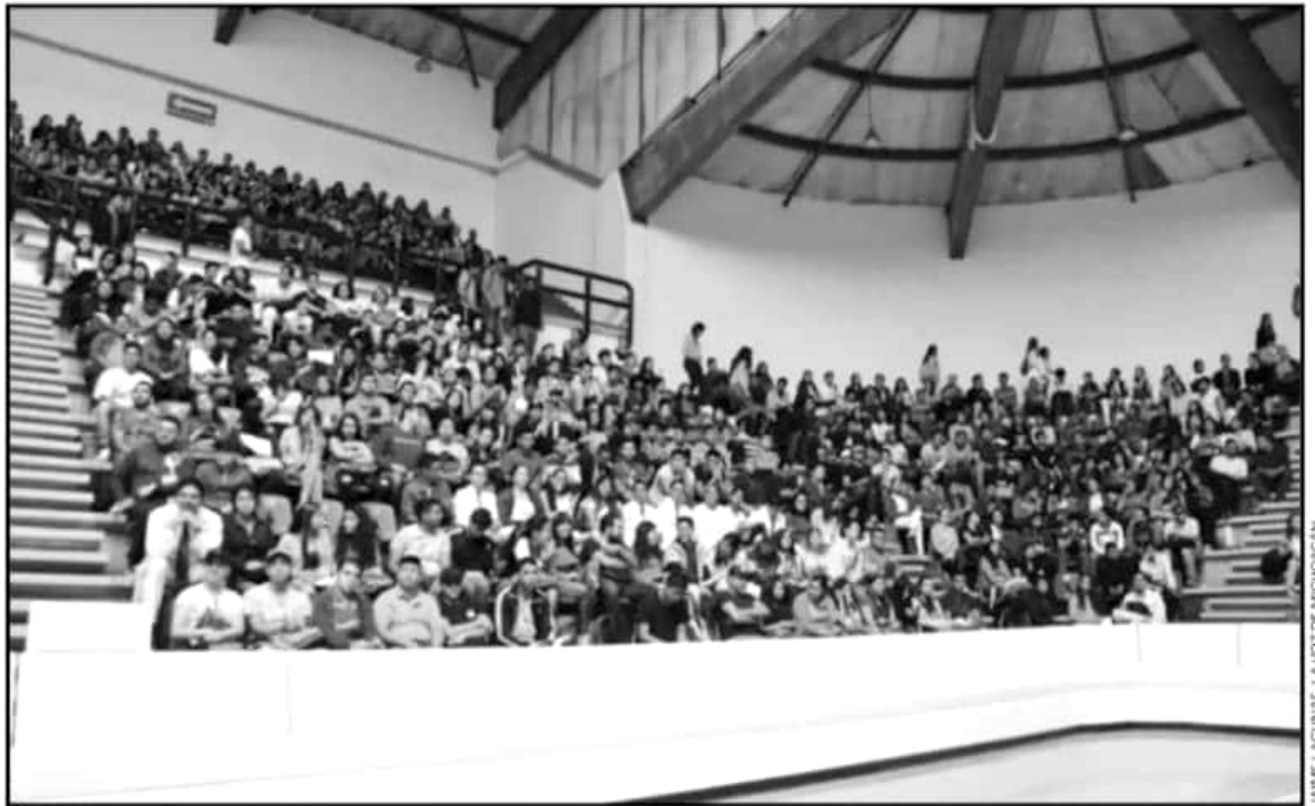
EL GIMNASIO AUDITORIO DE USOS MÚLTIPLES DE CIUDAD UNIVERSITARIA Y EL CENTRO DE INFORMACIÓN DE ARTE Y CULTURA FUERON LA SEDE DEL EVENTO.

Este es un paso muy importante en su vida personal y pro-