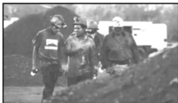
SUPERVISARÁ LA STPS QUE EMPRESAS CLIMPLAN ESTÁNDARES LABORALES

que, con el inicio de la temporada de lluvias, sólo se ha atendido al municipio de Jiquilpan, demarcación que hace dos semanas reportó el daño en por lo menos 700 hectáreas, aunque no detalló el tipo de cultivo ni la inversión para sanear los daños ocasionados.