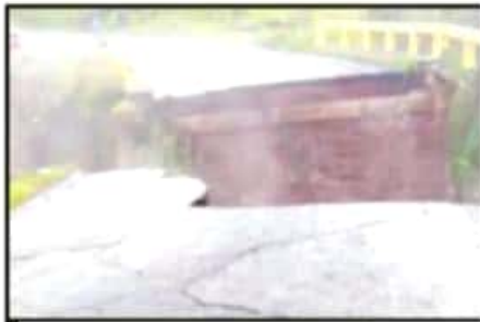
VARIAS COMUNIDADES DE LOS REYES ESTÁN INCOMUNICADAS TRAS EL DERRUMBIE DEL PUENTE DE LA GUAJOLOTA.

El productor agrega que debido a lo inaccesible de los parajes deforestados y para "ocultar", hasta cierto punto la tala clandestina, es echando a las barrancas; la destrucción del bosque, lo que ocasiona que el agua tormentosa no se consuma en el subsuelo, por carencia de materia vegetal que retenga al vital líquido, por lo que este es arrastrado también