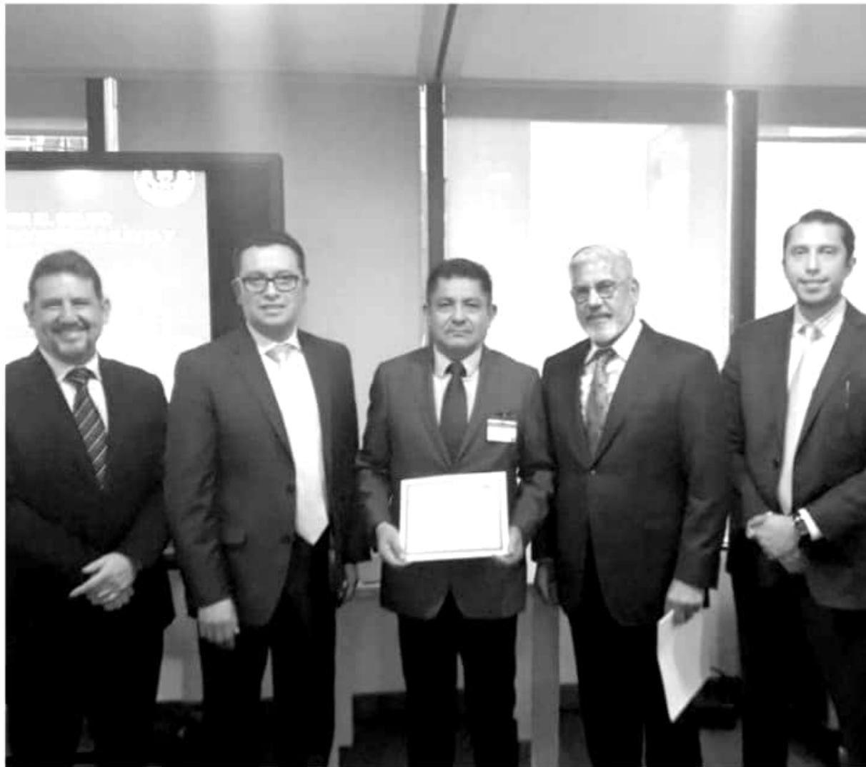
Se capacita Fiscalía Anticorrupción en curso internacional de investigación financiera.

Finalmente, el Ayuntamiento de Morelia, descarta la existencia de una red para beneficiar a algunas funerarias, puesto que la administración municipal ha procurado conducirse de manera igualitaria con los ciudadanos y empresas en general.