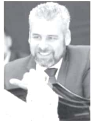
Es claro que para el Gobierno de México, Michoacán representa un motor de la economía por su liderazgo en la producción primaria, pero también por el potencial que tiene el puerto para el comercio internacional.

El diputado local se mostró confiado en que el encuentro celebrado ayer en Palacio Nacional derivará en políticas favorables para Michoacán, ya que el