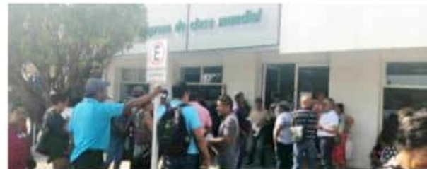
CD. LÁZARO CÁRDENAS, MICH.- Este viernes y luego de la protesta, CFE e Inconformes llegaron a acuerdos para esclarecer "cobros excesivos" que se han venido presentado en contra de usuarios.

El funcionario federal estimó que esto cuesta sobre 400 mdp y es competencia de todos "correatar" el recurso para su concreción, en tanto aseguró que otro compromiso de la API es la construcción de un paso a desnivel en donde confluye la autopistas con la avenida Las Palmas, ya está trabajándose con los estudios topográficos, y se están solicitando recursos en espera de que los libere Hacienda.