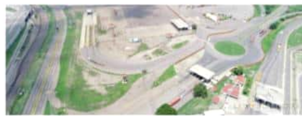
CD. LÁZARO CÁRDENAS, MICH.- El ASLA del Puerto Lázaro Cárdenas reportó durante el primer semestre del año un total de ingresos de 28 mil 342 camiones entre las diversas terminales de este recinto.