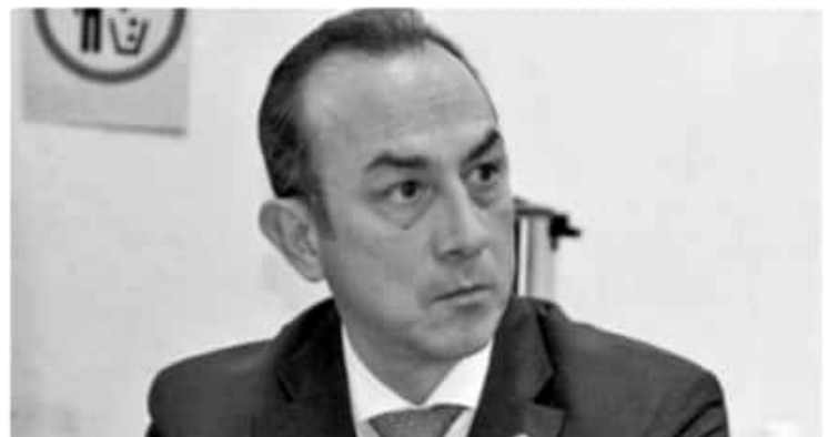
MORELIA, MICH.- El gobierno federal debe responder por delitos de lesa humanidad cometidos en contra de migrantes centroamericanos.