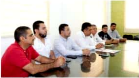
APATZINGÁN, MICH.- Este fin de semana inicia la campaña de prevención "Motociclista Responsable", de acuerdo a las autoridades municipales.

Tras ser golpeado un inspector de la Contraloría del Ayuntamiento por un empleado de un locatario del Mercado Central "Ignacio López Rayón", se procedió a la aplicación de multas económicas por diez salarios mínimos a un total de seis comerciantes de ese inmueble por insistir en invadir los espacios que se marcaron como límite para la colocación de cajas u otras mercancías, con la advertencia que de continuar violando el Reglamento Municipal de Mercados, la próxima