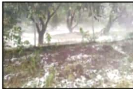
LA TROMBA TAMBIÉN DEJÓ SERIOS DAÑOS EN CULTIVOS DE AGUACATE EN LA REGIÓN DE LOS REYES-PERIBÁN.