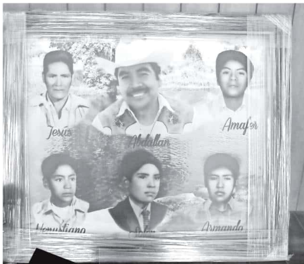
Entre 1974 y 1976, sus parientes sufrieron desaparición forzada por parte de elementos del Ejército.

Tras trámites realizados desde la década desde principios de los años 90 en la Comisión Nacional de Derechos Humanos (CNDH), fue hasta el 2001 que esta emitió el Informe sobre el Programa de Presuntos Desaparecidos. De ese documento se pudo establecer que existen elementos