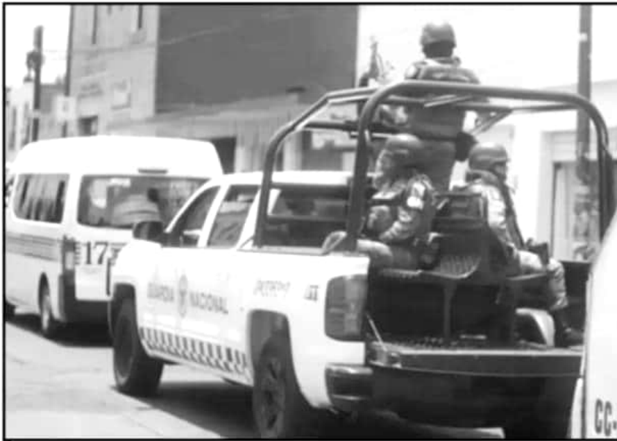
SE ESPERABA QUE CON LA GUARDIA NACIONAL DISMINUYERA LA INCIDENCIA DELICTIVA, PERO LA OLA CONTINÚA.