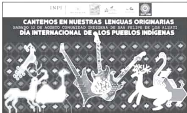
El encuentro es abierto para toda la población pero mucho más para todos aquellos que habitan alguna comunidad indígena del oriente de la entidad.

Posteriormente, como ya es tradición el alcalde colocó el primer bando solemne de actividades en la pared de palacio municipal, a esta acción le siguieron los demás integrantes del cabildo y funcionarios municipales, durante el recorrido por las principales calles de la ciudad, por donde realizaron el tradicional recorrido, acompañados de una banda de música.