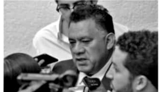
MORELIA, MICH.- El Grupo Parlamentario de Morena en el Congreso local se enfocará en reducir los índices de drogadicciones que enfrenta la entidad.

"El hecho de que la campaña Juntos por la Paz inicie en la región de Tierra Caliente nos dice que el presidente está consciente de la problemática que enfrenta Michoacán en adicciones, pero sobre todo del compromiso que tiene con el desarrollo socioeconómico de la entidad", finalizó.