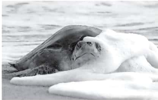
Para este ciclo se contempla liberar un millón de crías de al mar.

Se tiene registro de dos especies que han consumido plástico en cantidades alarmantes: La caguama y la verde. Sin embargo, hay que destacar que en con la ingesta de un solo artículo, el 22 por ciento de las tortugas pueden morir por rompi-