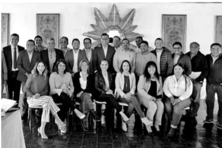
MORELIA, MICH.- El Comité Ejecutivo Estatal (CEE) del Partido de la Revolución Democrática (PRD), respaldó las acciones y resultados de las y los Presidentes Municipales "Territorio Amarillo".