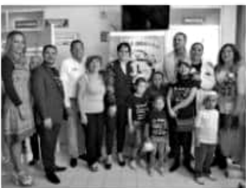
MORELIA, MICH.- El Gobierno de Michoacán se suma al proyecto del Hospital San Judas, de Estados Unidos, con la implementación de la estrategia de atención médica denominada "Hora Dorada".

Cabe destacar que Yucatán, Guanajuato, Sinaloa, Sonora, Quintana Roo, Nuevo León, son algunos de los estados que ya implementan este tipo de atención con muy buenos resultados.