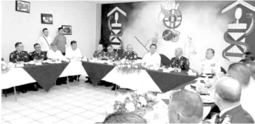
El mandatario estatal, Silvano Aureoles constato los avances de Plan Integral de Seguridad en Tierra Caliente.

«Brindar mejores condiciones de seguridad a las y los michoaca-