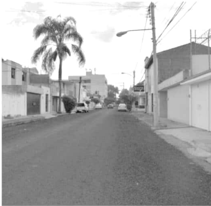
El Ayuntamiento de Morelia trabaja en el reencarpentamiento de seis calles y avenidas, veinte riegos de sello y a través de las brigadas de bacheo que diariamente atienden diversas colonias de la ciudad

Participan cámaras y asociaciones empresariales, 14 universidades públicas y privadas y diferentes dependencias gubernamentales.