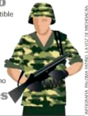
INFOGRAFÍA PALOMA PATRINO, LA VOZ DE MICHOACÁN

ILÍCITOS | REPORTA PEMEX 6,621 TOMAS ILEGALES HASTA MAYO