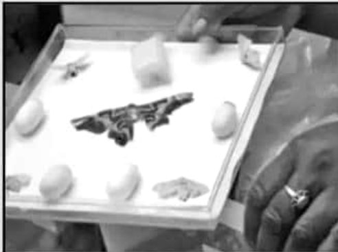
Las especies son valiosas, pero no han sido atendidas: especialista.