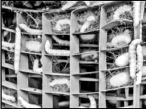
El gusano de seda ha pasado a segundo término en la región.

El gusano de seda puede representar una veta importante de producción y rescate de actividades artesanales y productivas.