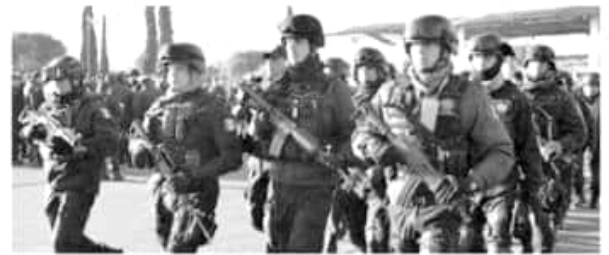
En la mayoría de los homicidios se utilizan armas de fuego.

También, en el mes en referencia los municipios de Uruapan, Morelia y La Piedad, fueron los que registraron la tasa más alta de homicidio doloso de la entidad.