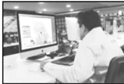
INTERESADOS CONTARÁN CON ASESORÍA DE EXPERTOS.