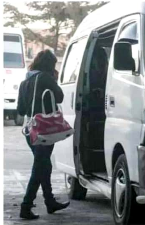
Se pretende capacitar a los transportistas de las 27 rutas que hay.

Sin embargo, destacó que los estudios con los que cuentan indican que 70 de cada 100 mujeres que utilizan algún medio de transporte —combis, camiones urbanos o semirurbanos— han sido víctimas de hostigamiento sexual, acoso físico, verbal y miradas lascivas, principalmente de