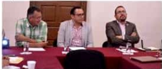
Legisladores de la Comisión de Fortalecimiento Municipal, anuncian foro de consulta en Coahuacán.