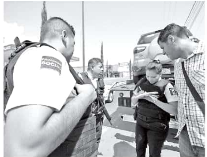
La Cocobra no tiene capacidad para otorgar m s concesiones para Uber o cualquier otro sitio digital.

Asimismo y al negar que los operativos para revisar aquellas unidades que circulaban por las calles de la ciudad de manera irregular se trat  de "una cacer a", co-