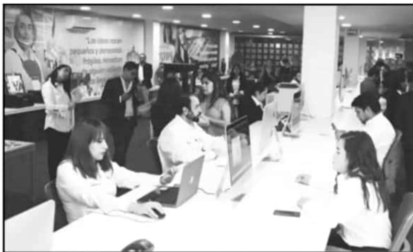
CONFÍA EL GOBIERNO ESTATAL QUE EL ESPACIO EMPRENDEDOR PERDURE Y SE CONVIERTA EN HERRAMIENTA ÚTIL.

estado, Silvano Aureoles Conejo, señaló que el tema del acompañamiento en el proceso de emprendimiento es fundamental para que las empresas no cierren antes de cumplir los dos años de incursión en el mercado nacional, pues de acuerdo con las estadísticas del Instituto Nacional de Estadística y Geografía (Inegi) más del 80 por ciento de las unidades económicas cierran en el periodo citado a consecuencia de una mala administración del personal como de los recursos que se cuentan para potenciar el negocio.