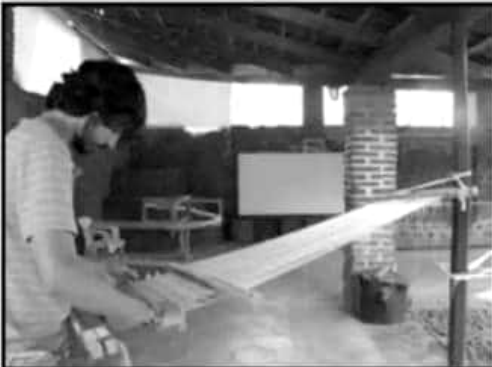
La producción textil se rescataría mediante este proyecto con la UE.