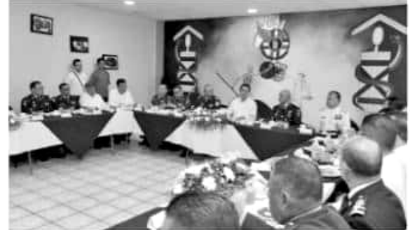
APATZINGÁN, MICH.- Este miércoles el gobernador de Michoacán, Silvano Aureoles Conejo, revisó los avances de la segunda fase del Plan Integral de Seguridad en la región de Tierra Caliente.

Evento, en el que refrendaron el compromiso de las autoridades, de los tres órdenes de gobierno, en la lucha contra la inseguridad, con el objetivo claro de garantizar paz y tranquilidad a las y los michoacanos.