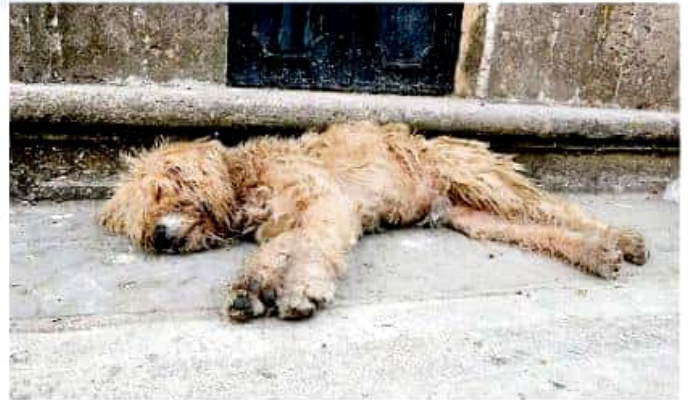
El Ayuntamiento de Lázaro Cárdenas comenzó a regular el crecimiento de la fauna canina y felina en el municipio.

Un hombre dio muerte a un perro a machetazos sin recibir sanción; igual suerte corren otros ejemplares sin que se aplique la ley en esta ciudad