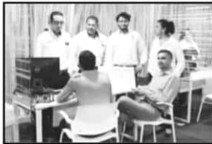
JÓVENES PODRÁN EMPRENDER SUS PROYECTOS.