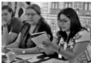
MORELIA, MICH.- La legisladora emanada del PT reconoció que si bien se han dado grandes avances en temas de igualdad y equidad de género, la realidad es que aún persiste una diferencia enorme entre ser hombre y ser mujer en México.

"La lucha ha sido constante y desde muchos años atrás, se han logrado cosas muy importantes, también hemos sufrido derrotas que nos han dolido, pero de ninguna manera podemos doblar las manos y dejar de luchar, todas y todos somos iguales, todas y todos tenemos los mismos derechos y posibilidades, nosotros desde nuestra trinchera seguiremos trabajando por esta igualdad total que tanto anhelamos", finalizó.