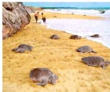
Al menos 4 millones de huevos se desovarán en esta temporada. GEORGINA GASCA

AQUILA, Mich. - La maravillosa vida acuática protagonizada por la especie de tortuga marina golfina, en el Santuario Ixtapilla, ubicado en la comunidad nahua de Ixtapilla, municipio de Aquila, espera este año el arribo de 45 mil quezonios con desove de al menos cuatro millones de huevos en esta temporada durante el verano.