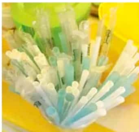
La medida fue aprobada el pasado viernes por el Cabildo de Morelia. | CUARTOSURCO

"No es tan sencillo, primero porque no toman en cuenta las inversiones que hay para la fabricación para este tipo de