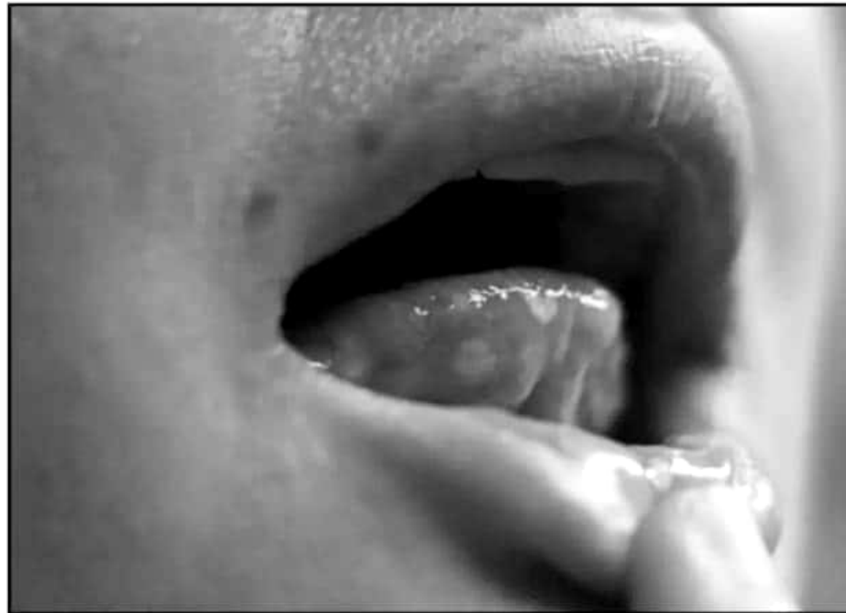
LAS LLAGAS EN LA BOCA SON MÁS COMUNES EN LOS ADULTOS QUE TIENEN LA ENFERMEDAD, LAS CUALES PUEDEN RESULTAR

"No hay un tratamiento específico para la enfermedad porque se autolimita, simplemente con analgésicos e hidratación. Lo principal es la prevención, que es el lavado de manos y el evitar compartir utensilios y alimentos en los niños infectados, también es muy importante el lavado de manos, es fundamental para evitar la transmisión, sobre todo en las guarderías".