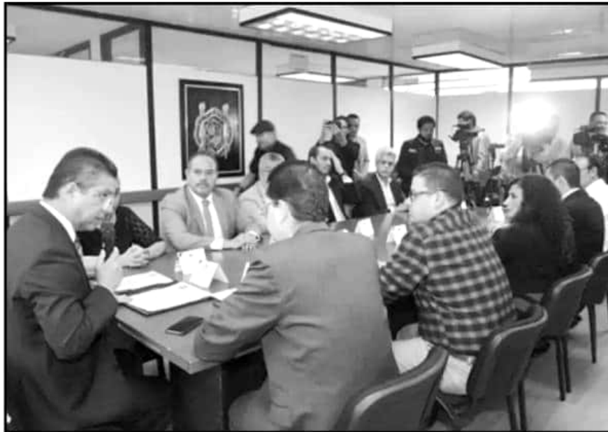
EL RECTOR NICOLAITA ENCABEZÓ LOS TRABAJOS EN LA PRIMERA REUNIÓN DEL RECIÉN CREADO COMITÉ NICOLAITA.

Dijo que uno de los proyectos que impulsará en su administración es brindar informes trimestrales a la Comisión de Presupuesto y Control del Consejo Universitario