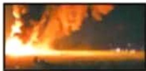
Se cumplen seis meses de la 'ordenía' en Tlahuelilpan que dejó 154 muertos.

Entre las entidades con mayor dificultad de huachicol destaca Hidalgo.