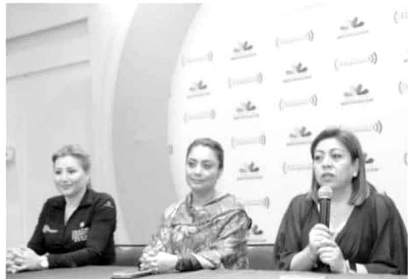
Enlaces de redes sociales de la institución, procedentes de Morelia y varios municipios del interior del estado, participaron en el taller.

«De ahí la importancia que sigamos capacitándonos y actualizándonos en el manejo de las redes sociales, para conocer todas las herramientas disponibles y cómo aprove-