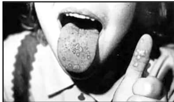
CONOCIDA COMO LA "ENFERMEDAD MANOS, PIES Y BOCA", EL SARPULLIDO APARECE EN TODAS ESTAS PARTES, Y ES EL SÍNTOMA MÁS VISIBLE DEL COXSACKIE.