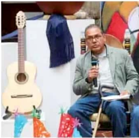
Para todos los concursos se tiene contemplada una bolsa de 540 mil pesos en premios.