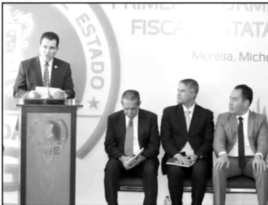
EL FISCAL ANTICORRUPCIÓN, ALEJANDRO CARRILLO, PRESENTÓ EL LUNES SU PRIMER INFORME ANUAL DE ACTIVIDADES.

Alejandro Carrillo, FISCAL ANTICORRUPCIÓN