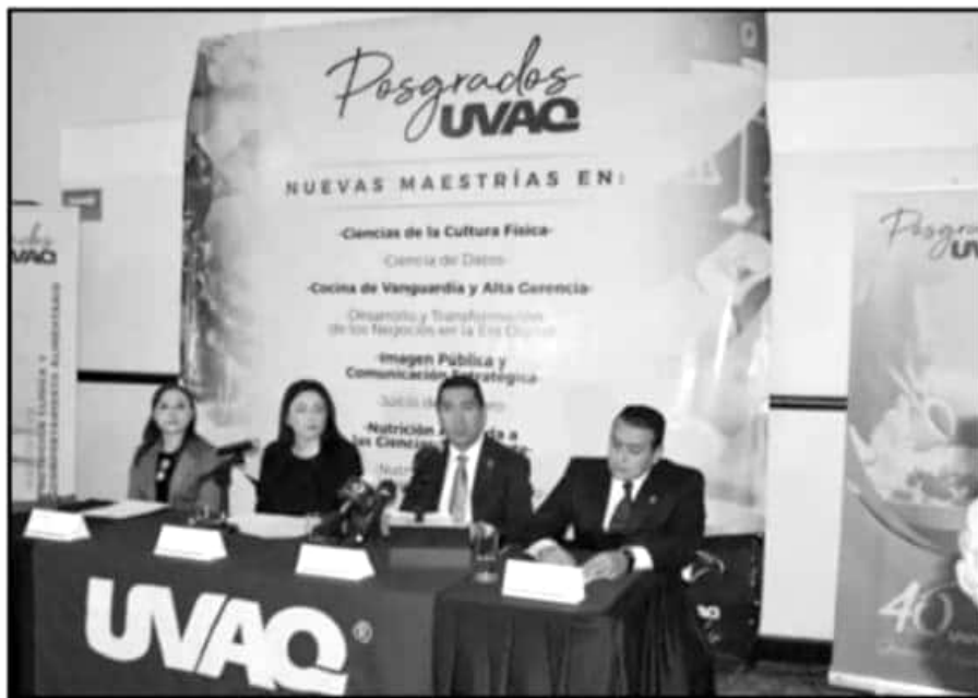
EN RUEDA DE PREENSA, DIRECTIVOS DE LA UNIVERSIDAD VASCO DE QUIROGA ANUNCIARON LA NUEVA OFERTA.

Apuntó que el objetivo es dar respuesta los profesionistas que desean seguir actualizándose y pertenecer a sectores