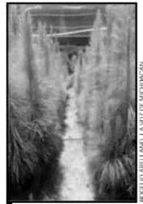
LO PLANTADO SERÁ, PRINCIPALMENTE, RECURSO MADERABLE.