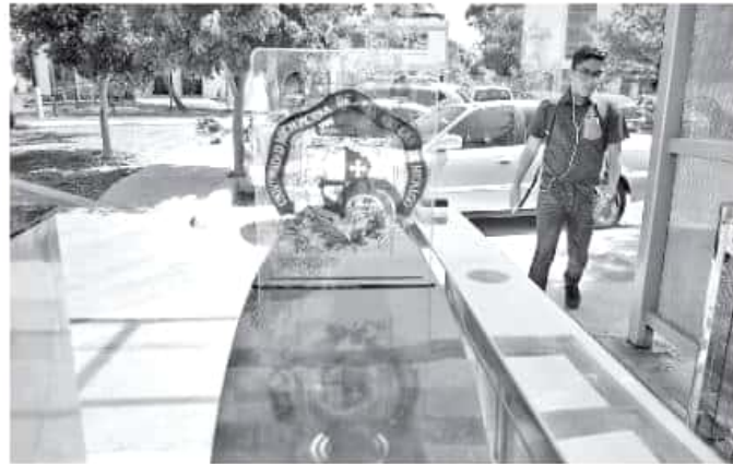
Para consensuar la modificación del actual régimen, se buscará instalar mesas de diálogo con los sindicatos y la comunidad nicolaita. CARMEN HERNÁNDEZ

Reiteró que existen avances en cuatro de los cinco rubros comprometidos por la anterior administración para la recepción de 500 millones de pesos, para cumplir con los compromisos salariales y de prestaciones del último trimestre de 2018, siendo el único pendiente el de modificaciones al Régimen de Jubilaciones y de Pensiones.