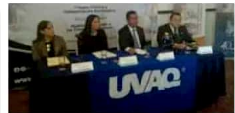
Las maestrías comenzarán en agosto.