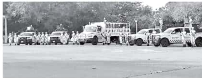
El contingente que llegó a Lázaro Cárdenas pertenece a la Marina GEORGINA GASCA

"Ahí está el compromiso del Presidente, la idea es que más adelante se integre el resto que estará conformado con 200 elementos de la Secretaría de Marina (Semar), 190 de la Defensa Nacional (Sedena) y 60 de la Policía Federal (PF)", informó. Explicó que el lunes primero de julio,