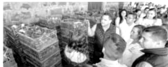
ESPECIAL Más de 400 familias resultaron beneficiadas.