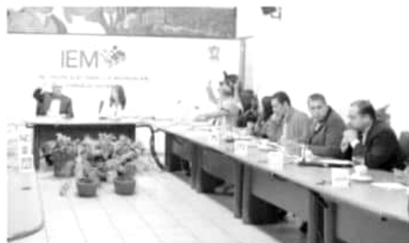
La sesión la tarde de este martes.