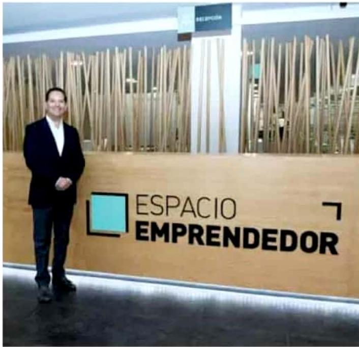
Espacio Emprendedor se ubica en las inmediaciones de las oficinas de la Sedeco.

Por ello, en dicho espacio se dará prioridad a tener una mejora regulatoria ideal y simplificación administra-