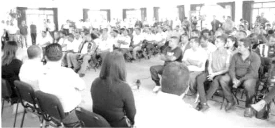
Seimujer y Cocotra iniciaron la segunda etapa de capacitaciones a las y los operadores del servicio público de Morelia

Por su parte, los líderes del transporte agradecieron al gobierno del estado, por involucrarlos en estas acciones que están dirigidas a mejorar ellos en su trabajo, pero también contribuyen a mejorar la calidad de