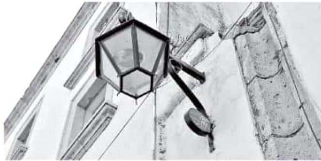
En la ciudad se cambian 500 lámparas diariamente por parte de la empresa Sola Basic.

Actualmente se cambian 500 lámparas diariamente por parte de la empresa