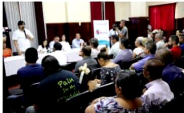
APATZINGÁN, MICH.- Comerciantes y empresarios fueron capacitados a través de un taller impartido por Sí Financia, ello como alternativa para apoyar la reactivación de negocios locales.

En representación del presidente municipal, asistió el secretario de Desarrollo Económico