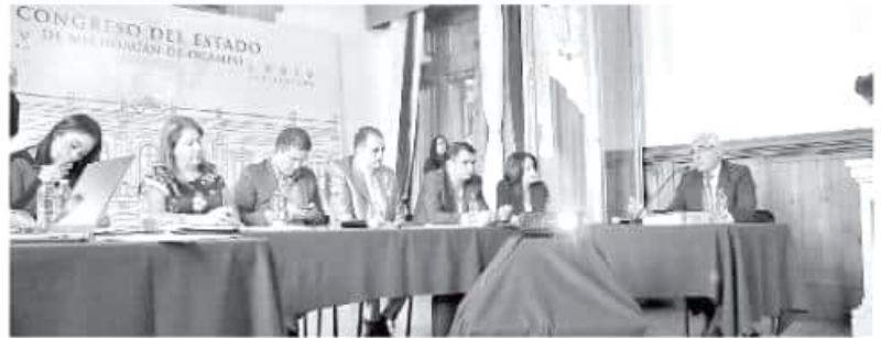
Legisladores locales realizaron la actividad en el salón de recepciones.