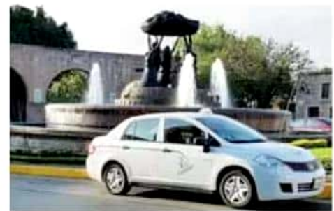
En los 30 puntos establecidos la tarifa no rebasa los 90 pesos, afirman autoridades en el rubro.