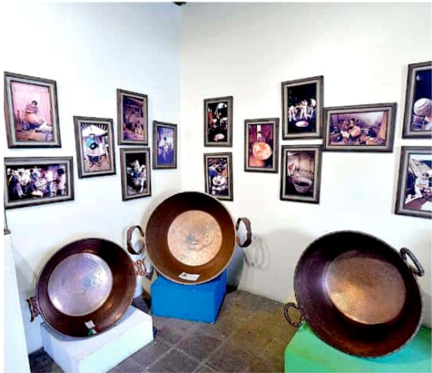
Habrà una bolsa de 440 mil pesos a repartirse en 80 premios; actualmente se tiene registro de 248 artículos a este concurso.

Nota: Las letras IP al final de una información significan: Ingreso de Pagada. Prohibida la reproducción total o parcial de las informaciones y material de esta edición, sin autorización previa de la Dirección. No se devuelven originales.