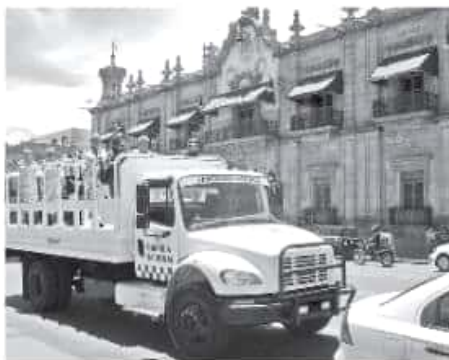
El cuerpo policial trabaja para que se dé un periodo vacacional tranquilo en el estado.