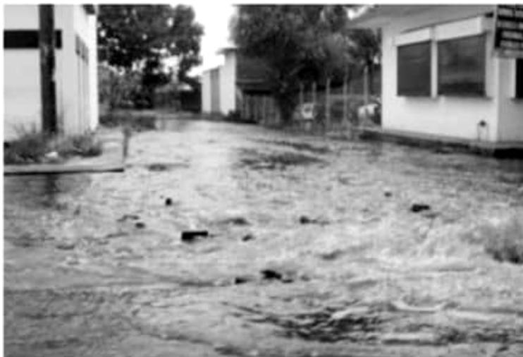
URUAPAN, MICH.- El sistema Dif trabajará de manera coordinada con la unidad de Protección Civil, ya que esta última cuenta con un mapa de riesgo, por la temporada de lluvias.

Reconoció que se han presentado bastantes afectaciones en algunas casas, pero ya se atendieron. Por lo general son personas en estado de vulnerabilidad que encuentran en zonas de mucho riesgo. Del Río Ambríz, destacó que es un tema complicado por el cambio climático que lamentable afecta cada vez a más personas, por ello, invitó a que se acerquen a la unidad de protección civil o el sistema Dif, instancia que busca resguardar a las familias y puedan estar lo mejor posible. Dijo que cuentan con un mapa de riesgo que revisa protección civil mediante recorridos que realiza y verificar afectaciones y en su caso dotar de láminas, cobijas y colchonetas. Informó que todavía bien en existencia estos productos ya que deben estar preparados por cualquier eventualidad. Añadió que "ojalá no sea necesario", pero el Dif debe estar prevenido con temas de albergues por si se llega a necesitar estar preparados y atender cualquier eventualidad.