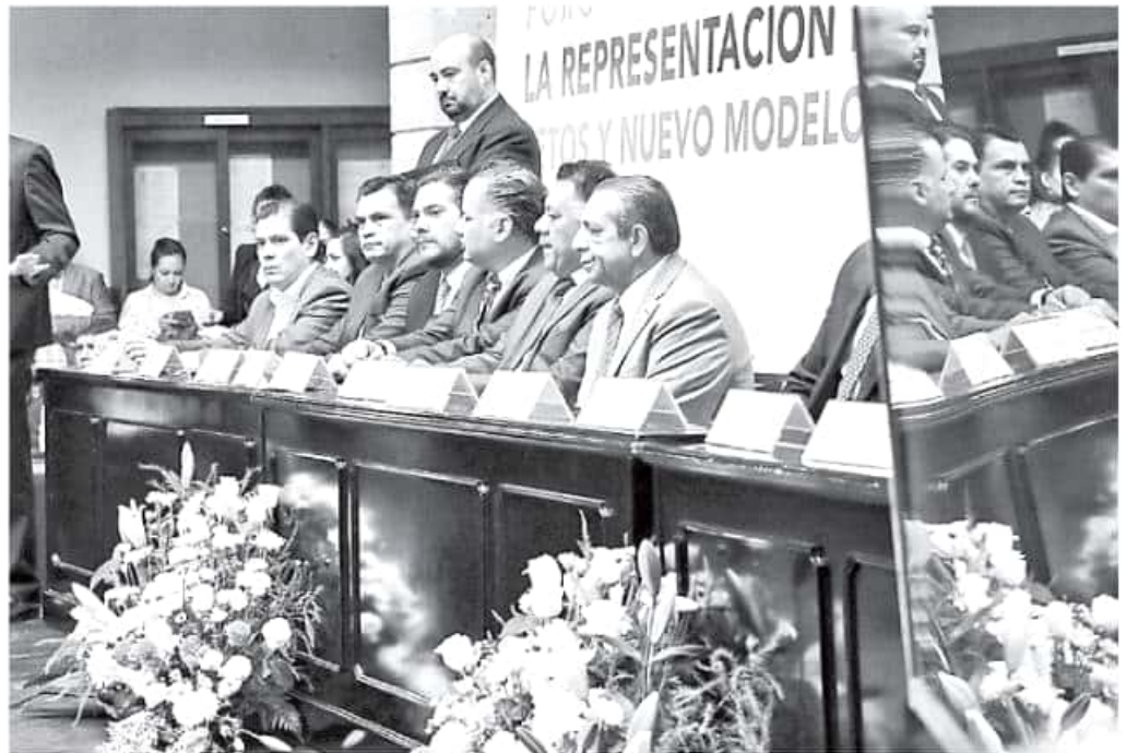
Ayer se realizó el foro "La representación política en Michoacán, retos y nuevo modelo", en el Congreso. FERNANDO MALDONADO