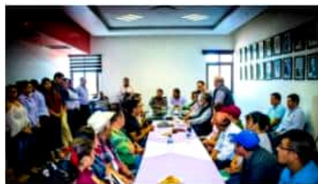
PERIBÁN, MICH.- Inició el proceso de escrituración de predios para los damnificados por el desbordamiento del río Cutio el pasado 23 de septiembre.

Finalmente, la presidenta municipal señaló que con la firma de un convenio con Instituto de la Vivienda del Estado de Michoacán se está estableciendo la formalidad para la construcción de las 19 viviendas que se tienen contempladas para igual número de familias afectadas.