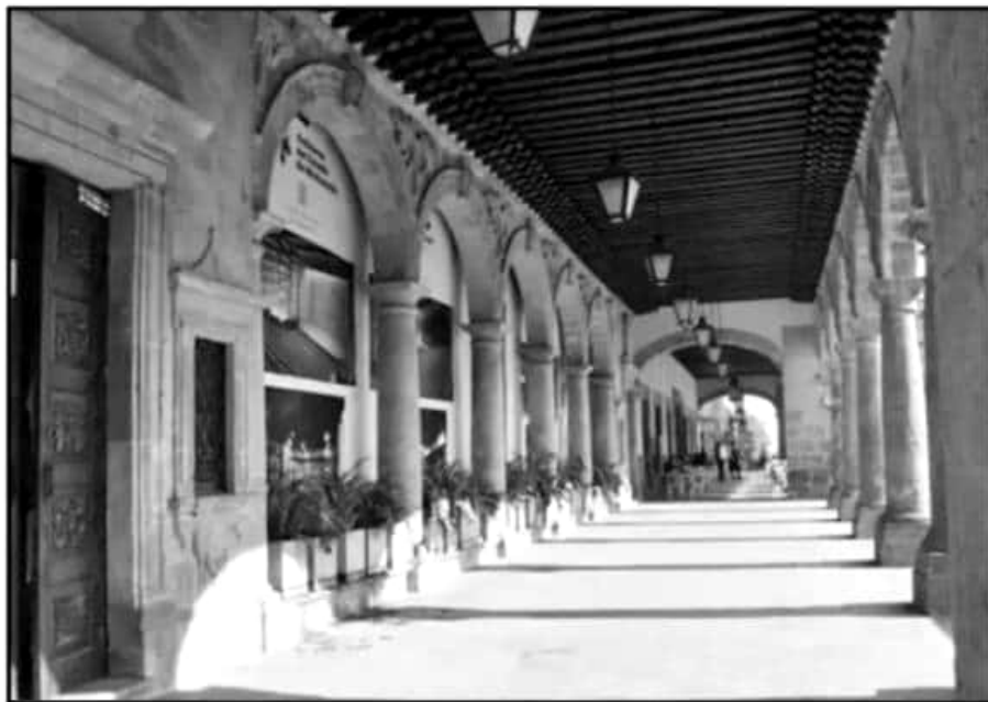
EL TEATRO MATAMOROS DEBÍO HABER TENIDO MAYOR INVERSIÓN A FINAL DE AÑO. SIGUE CON LOS MISMOS 30 MDP DE 2018.

Actualmente, el Teatro Matamoros trabaja únicamente con un contrato de 30 millones de pesos en su estructura civil, prácticamente el mismo recurso que se anunció hace un año sin un solo