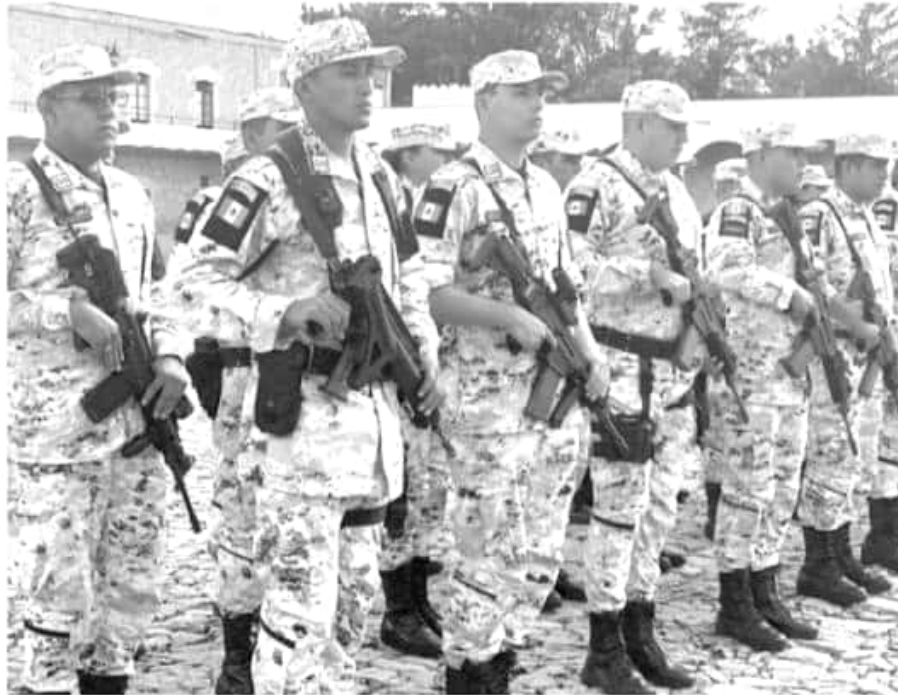
Morelia cuenta ya con una fuerza policía de mil 200 elementos con el apoyo de la Guardia Nacional.