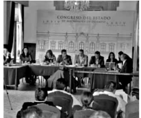
MORELIA, MICH.- Ante la Comisión Inspectora de la Auditoría Superior de Michoacán, comparecieron 6 aspirantes a ocupar el cargo de Auditor Superior.