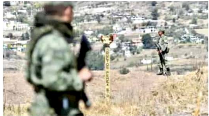
El funcionario federal dijo que los casos de robo de combustible siguen en investigación. | CUMTOSCURO

"Todos los casos han sido denunciados ante la Fiscalía General de la República; tuvimos en total 25 casos de denuncias por temas relacionados con el robo de hidrocarburos en entidades federativas, y se bloquearon montos por 900 millones de pesos. Están relacionados por términos generales, hay temas relacionados con Michoacán,