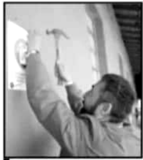
LA INVITACIÓN A REDUCIR EL USO DE PLÁSTICOS SERÁ TRADUCIDA AL PURÉPECHA Y AL INGLÉS.