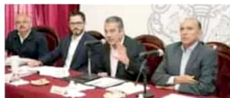
El programa Juntos Iluminando Morelia podrá ejecutarse en su totalidad en lo que resta del año, señalaron.