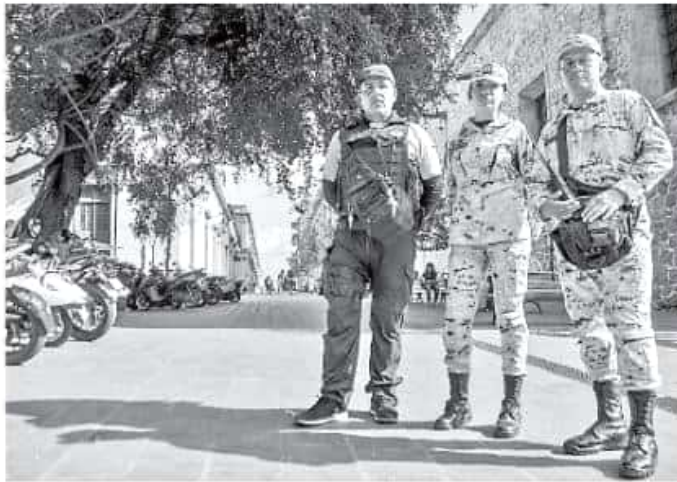
Los agentes federales estuvieron recorriendo la ciudad, sobre todo las zonas turísticas de esta capital. CARMEN HERNÁNDEZ

Será una vez que concluya el proceso de certificación de los elementos cuando se espera que más contingentes lleguen a Morelia, y mientras tanto se están coordi-