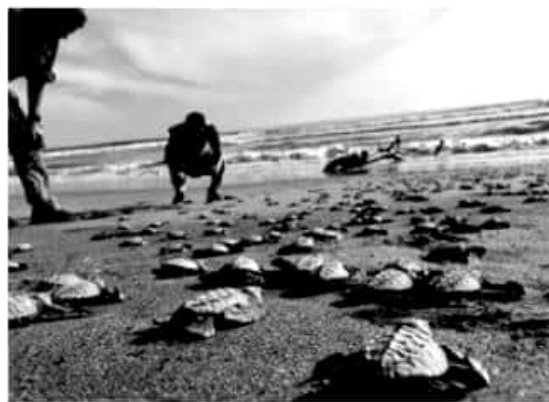
MORELIA, MICH.- Michoacán es el sitio de anidación de tres especies de tortugas marinas, laúd, golfina y negra.

La falta de planificación en el desarrollo urbano y turístico de las zonas costeras, la pérdida del hábitat de las tortugas marinas, la pesca incidental, la contaminación y la depredación son algunos de los factores que atentan contra la supervivencia de las tortugas marinas. Las tortugas marinas participan en el equilibrio ecológico, al conservar en buenas condiciones las praderas de pastos marinos e