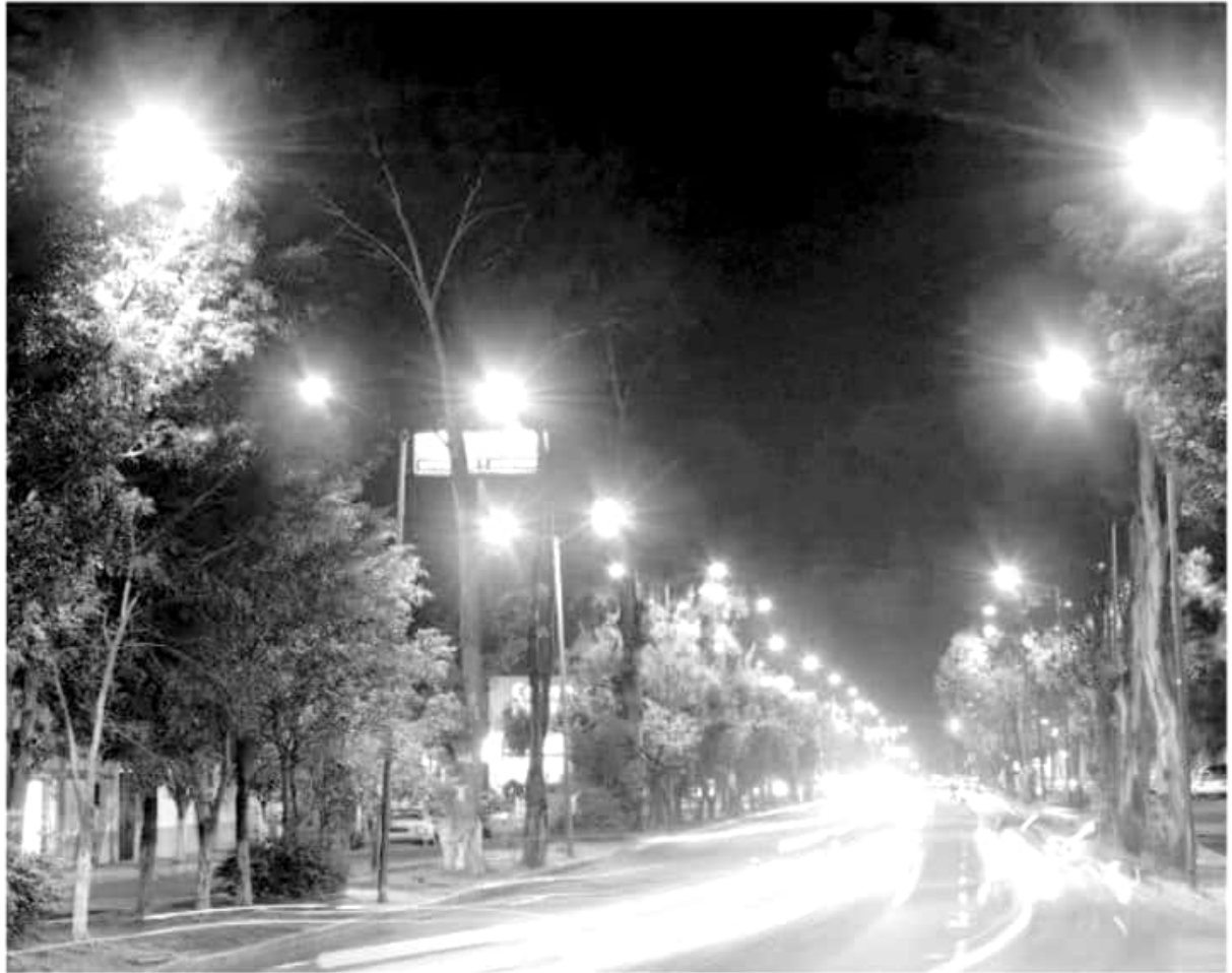
El Ayuntamiento de Morelia contempla realizar la segunda fase del programa de sustitución de luminarias.