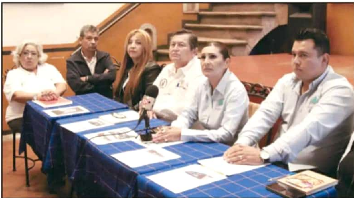
LA LIDERESA DEL IIFEEM REFIRIÓ QUE LEGISLADORES DEBEN COMPROBAR LAS ACUSACIONES SOBRE COSTOS ELEVADOS ANTES DE EMITIR COMENTARIOS.

La principal preocupación que existe para este año es que no hay certeza alguna de que habrá repartición de recursos para la construcción de impor-