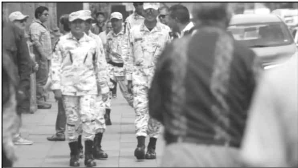
DESDE EL DÍA DE AYER SE PUEDEN APRECIAR ELEMENTOS DE LA GUARDIA NACIONAL RECORRIENDO LAS CALLES DEL CENTRO, PRINCIPALMENTE.

AGENTES se prevé que lleguen a la capital del estado