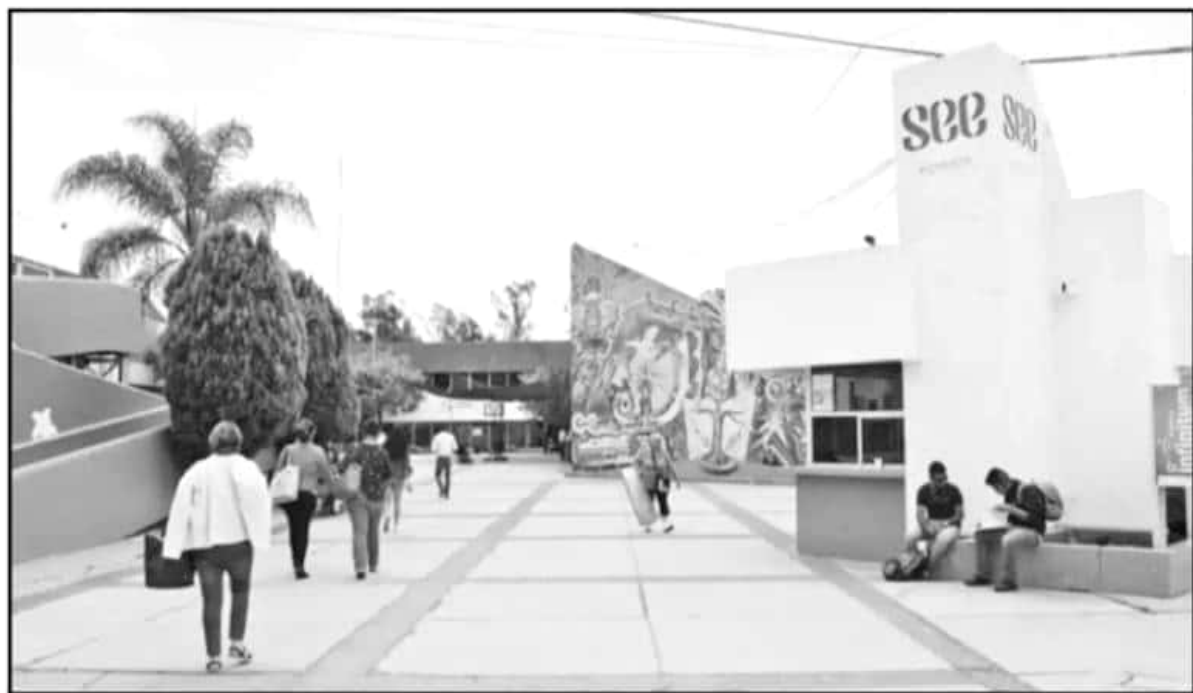
EN LAS OFICINAS CENTRALES DE LA SECRETARÍA DE EDUCACIÓN ESTATAL ES DONDE SE ANTICIPA PODRÍA HABER UN ALTO NÚMERO DE PLAZAS DOBLES O FICTICIAS.