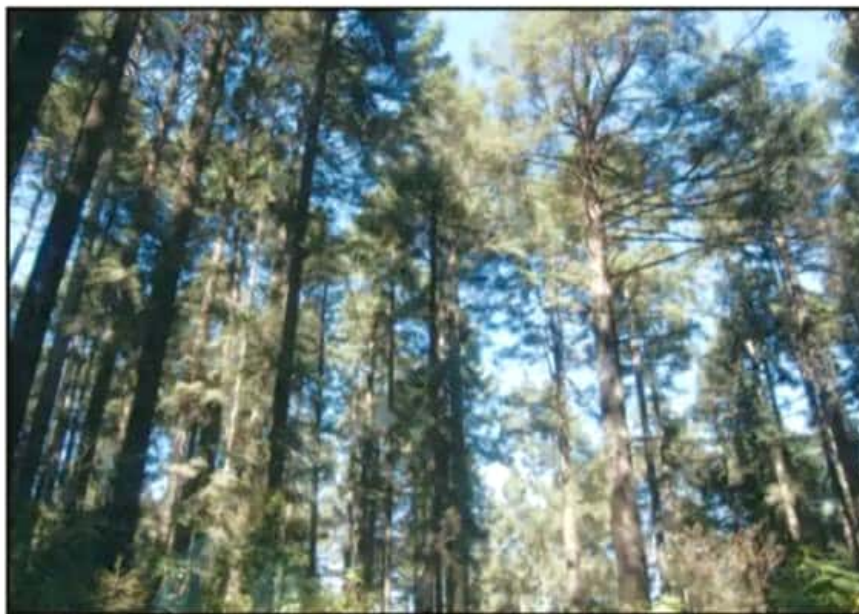
EL OBJETIVO ES HACER UN FRENTE COMÚN CONTRA LA DEFORESTACIÓN Y GANARLE HECTÁREAS AL PROBLEMA.

Sabemos que la situación económica en el país no es la más oportuna para los recursos naturales, ha habido recortes, por lo cual hemos decidido ir de la mano con la iniciativa privada