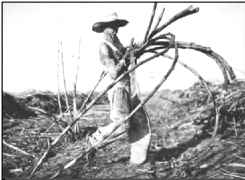
JORNALEROS SEÑALAN QUE LA SITUACIÓN DEL PRODUCTO CAÑA ESTÁ MUY ABANDONADO POR AUTORIDADES.