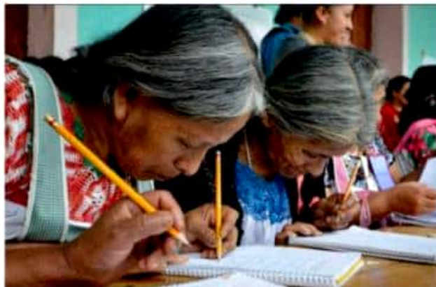
ZAMORA, MICH.- A través del programa ALFA 10-14 que coordina el INEA se busca atender a más jóvenes y adultos para que terminen su primaria y secundaria.

La presidenta honoraria hace la invitación para que los niños y jóvenes que no han terminado su secundaria o primaria se animen y se inscriban en el programa y se superen, "hoy en día es indispensable para un trabajo la secundaria" comentó. Del mismo modo invitó a los adultos inclusive que no sepan en lo absoluto leer y escribir para que comiencen sus estudios, "nunca es tarde", puntualizó.