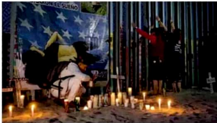
El cruce hacia Estados Unidos es el que más muertes provoca en el continente.

La historia no acaba ahí. De regreso en su país se enteró de que sus captores secuestraron a su tío y pidieron a la familia $3,500 por liberarlo. De inmediato supo que su familia no sería capaz de juntar ese dinero; su tío sería asesinado. Así fue. Lo mataron porque su familia, que no sabía leer ni escribir, logró juntar los $3,500 en moneda local. Sus captores