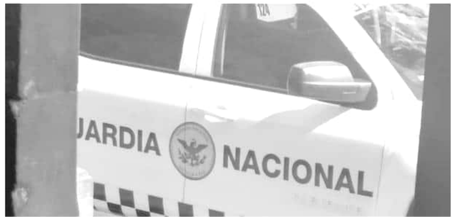
Disfrazados de animalitos de la selva y otros personajes.

Ninguna autoridad dio a conocer los motivos, aunque esto pudo ser por el problema que se suscitó el miércoles pasado en la Ciudad de México, cuando varios elementos de la Policía Federal, se negaron a formar parte de la Guardia Nacional, además de haberse revelado a sus superiores. Ahora no se sabe hasta cuándo será la presentación de los elementos que estarán en esta región y que también de manera extraoficial se dijo que el cuartel estará ubicado a la altura de la comunidad de San Juan Tumbio, perteneciente a este municipio.