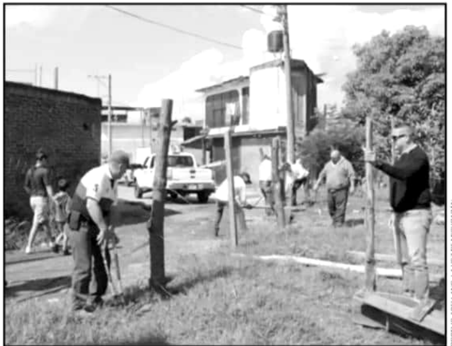
LAS BRIGADAS DEL AYUNTAMIENTO RETIRARON PALOS Y VALLAS QUE INVADIAN ESPACIOS PÚBLICOS Y DE RIESGO.