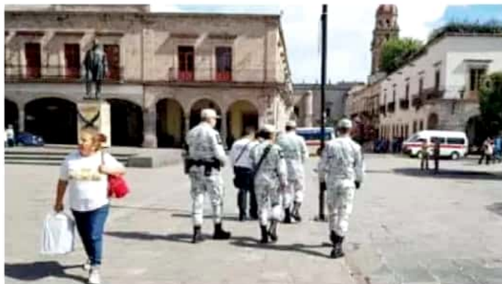
Los elementos del nuevo cuerpo de seguridad y policías municipales realizan los patrullajes.