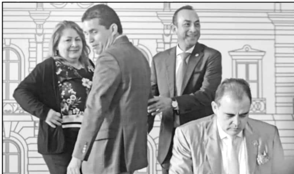
LEGISLADORES RECIBIERON A LOS PRIMEROS ASPIRANTES A LA AUDITORIA SUPERIOR, UN "MONSTRUO POLITICO" CON MILES DE CARPETAS DE REZAGO EN SU HABER.