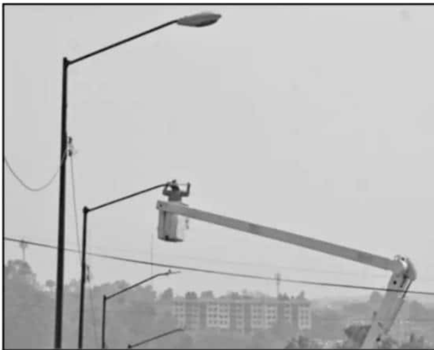
PESE A LA COLOCACIÓN DE LAS NUEVAS LUMINARIAS, VECINOS ASEGURAN QUE MUCHAS YA NO FUNCIONAN.

Pese a que algunos de los votantes denunciaron no contar con información completa, además de que el Congreso del Estado advirtió una posible irregularidad en el proceso, el Comité de Obras y Adquisiciones del Ayuntamiento de Morelia aprobó el dictamen de la segunda etapa del programa de sustitución de luminarias de la ciudad capital, que implica una adjudicación directa por 170 millones de pesos.