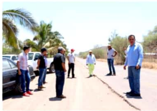
APATZINGÁN, MICH.- De acuerdo a funcionarios locales y de la SCT, en las próximas dos semanas se iniciarán los trabajos de conservación del camino Apatzingán-El Alcalde.

Cabe destacar que los montos de inversión serán dados a conocer en las próximas semanas.