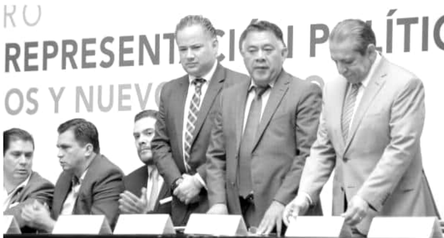
Aspecto del Foro La Representación Política en Michoacán, retos y nuevo modelo.

mente continúa en investigación una campaña 'sucia' que se hizo en contra del actual presidente de México, Andrés Manuel López Obrador, la cual está en poder de la Fiscalía Especializada para la Atención de los Delitos Electorales (Fe-