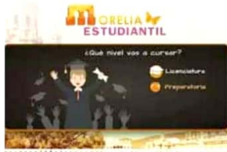
Morelia.Estudiantil es un proyecto sin fines de lucro.

"Yo vi cómo muchos amigos abandonaron la carrera, porque cuando ingresaron ya no les gustó o se dieron cuenta de que no era realmente lo que buscaban. En otros casos