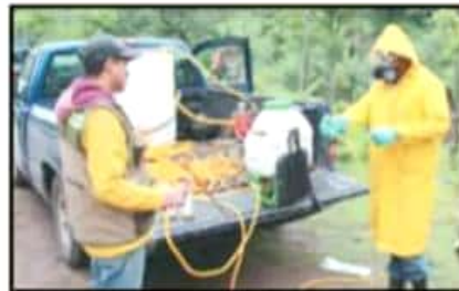
ADÉMÁS DE PLANTARLOS, EL COMPROMISO DE LAS EMPRESAS ES CUIDAR CINCO AÑOS LOS NUEVOS ÁRBOLES