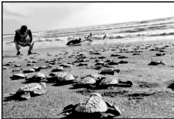
MICHOACÁN ES IMPORTANTE PARA LA CONSERVACIÓN DE LAS TORTUGAS.

Al indicar lo anterior el Magistrado Presidente del TJAM reiteró que los servicios que brinda el tribunal son gratuitos y están disponibles para todos los ciudadanos.