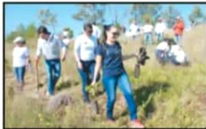
EN ÚLTIMAS SEMANAS SE HAN FORTALECIDO LAS LABORES DE REFORESTACIÓN EN VARIOS PUNTOS DEL ESTADO