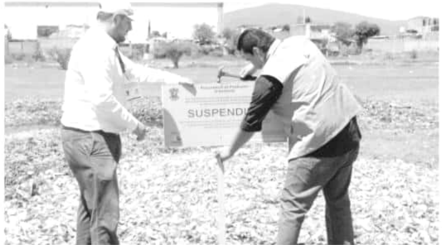
Fue gracias a una denuncia presentada por las autoridades municipales, quienes alertaron a la Procuraduría de Protección al Ambiente.

sentada por las autoridades municipales, quienes alertaron a esta Procuraduría sobre la disposición inadecuada de los residuos de manejo especial, consistentes en la cascara y hueso de mango, mismos que se presume, fueron dispuestos en el sitio por algunas de las agroindustrias que operan en la región.