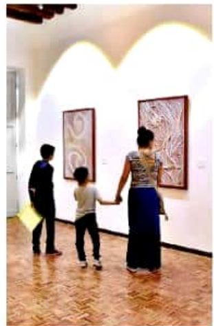
Serán seis semanas de una gran diversidad de eventos.