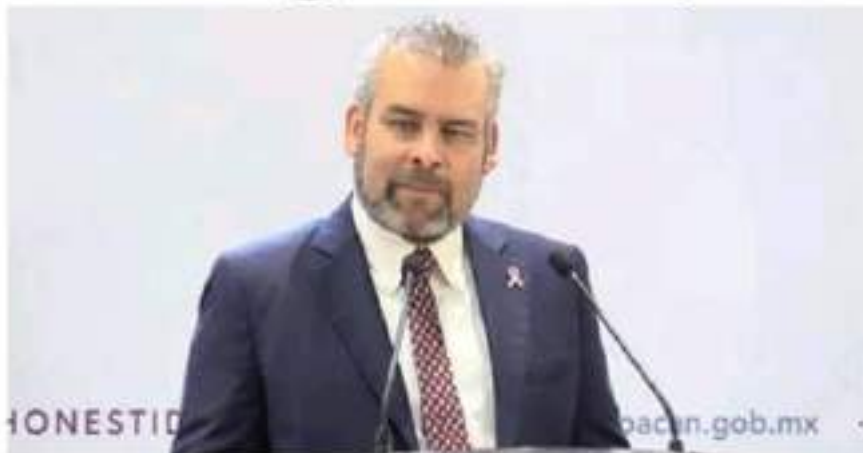
El gobernador Alfredo Ramírez Bedolla, aseguró ayer que no habrá más firma de minutas con el magisterio michoacano.