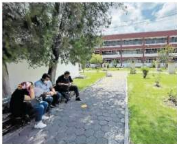
El Consejo de Seguridad de Salud sesionará el día viernes y ahí se valorarán nuevas medidas generales ante la pandemia.

El gobernador anunció también que el Consejo de Seguridad de Salud sesionará