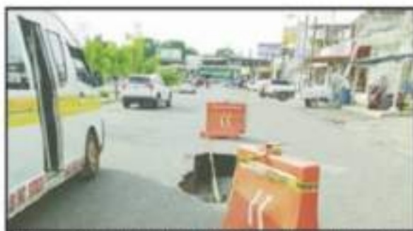
VARIOS DE LOS BUCARDONES NO HAN SIDO ATENDIDOS DESDE HACE MESES.