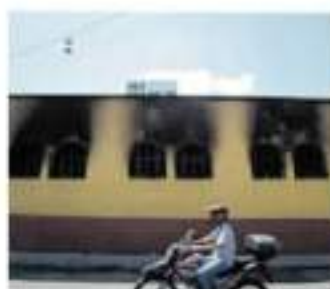
Las denuncias no procedieron / ASESORÍA

Refirió que muestra de ello es lo que ha ocurrido en algunos puntos de la geografía michoacana, donde han violentado a sus integrantes físicamente e incluso a un profesor lo dejaron moribundo. "A noso-