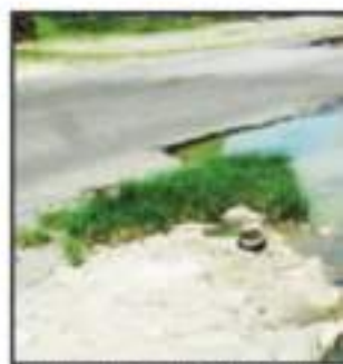
HUNDIMIENTOS DE PAVO TIENEN COMO

RECORRIDO PUERTO SE LLENA DE VIALIDADES EN 'ZONA DE DESA