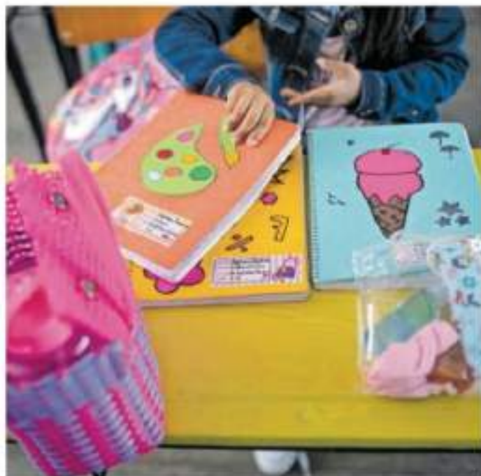
El tercer filtro será al interior de las escuelas, donde los maestros deberán cuidar que los alumnos no intercambien sus útiles escolares.

Por su parte, el titular de la Secretaría de Salud de la entidad (SSM), Elías Ibarra Torres, informó que para el regreso a los salones de clase habrá cuatro filtros de prevención sanitaria. El primero será en la casa de los alumnos, donde los papás deberán revisar que no haya síntomas de Covid-19 en su familia, y que los estudiantes lleven sus respectivos cubrebocas y gel a las instituciones.