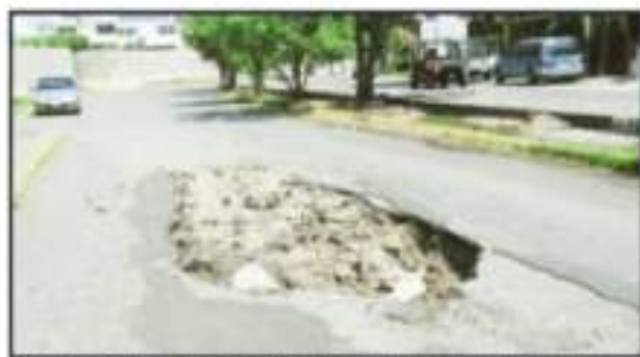
EN LA AVENIDA MELCHOR OCAMPO HAY SECCIONES DE VARIAS DIMENSIONES.