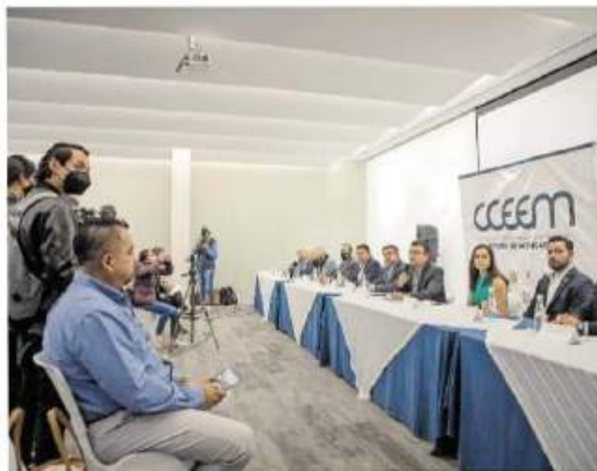
El CCEEM confía en trabajar con la nueva administración estatal.

El líder empresarial se dijo confiado en que habrá una próxima reunión de trabajo con el gobierno estatal, para plantear el tema del convenio y marcar una estrategia que dé certidumbre a la iniciativa pri-