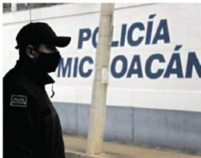
En Seguridad hay un déficit de 728 millones de pesos.