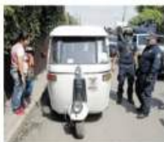
Motocicletas con estructuras de tipo todo terreno como unidades de transporte público.

En el municipio transportistas temerosos por su seguridad indican que han buscado que se regule la situación.