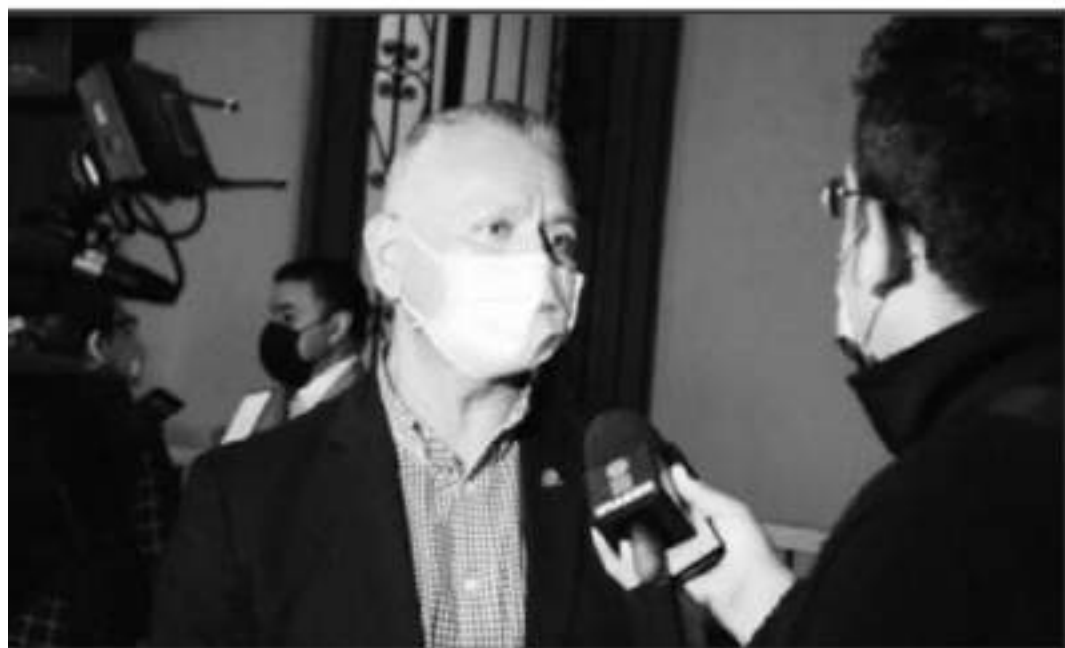
EL TITULAR DE LA COPARMEX DESTACÓ LOS TEMAS PRIORITARIOS QUE SE DEBEN ATENDER CON EL NUEVO GOBERNADOR.