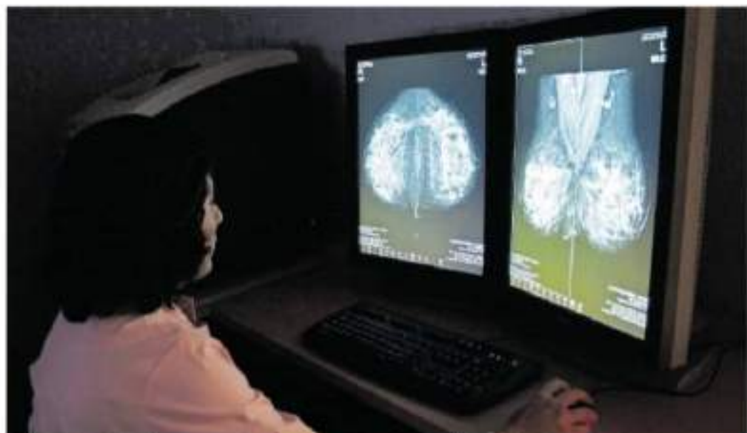
Se han emitido 500 tarjetas para ser utilizadas en laboratorios, centros radiológicos, hospitales, /100 fotos