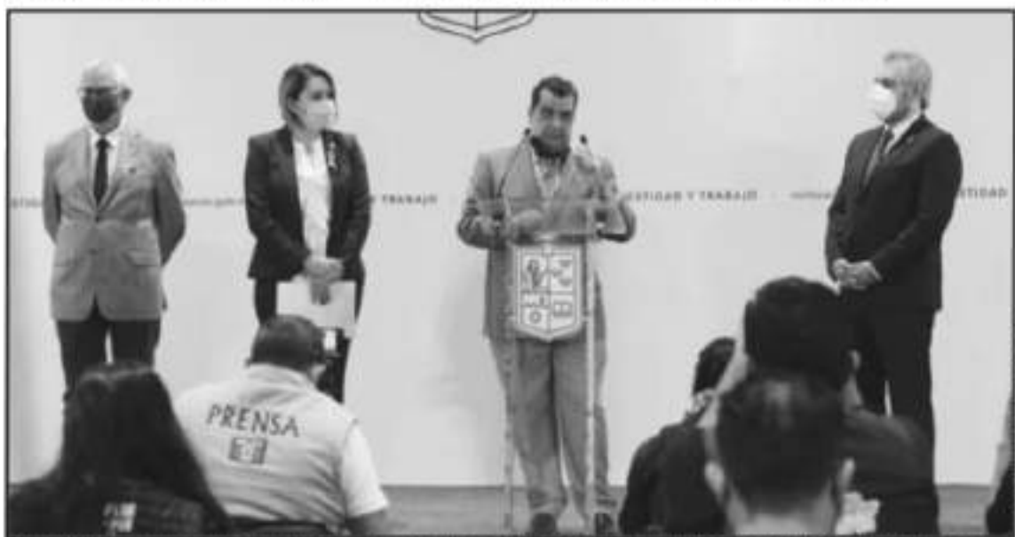
SE INFORMÓ QUE EL VIERNES SE TENDRÁ LA SESIÓN DEL CONSEJO DE SEGURIDAD EN SALUD PARA PREVER LAS ACCIONES PARA LLEVAR EL ARRANQUE PRESENCIAL.