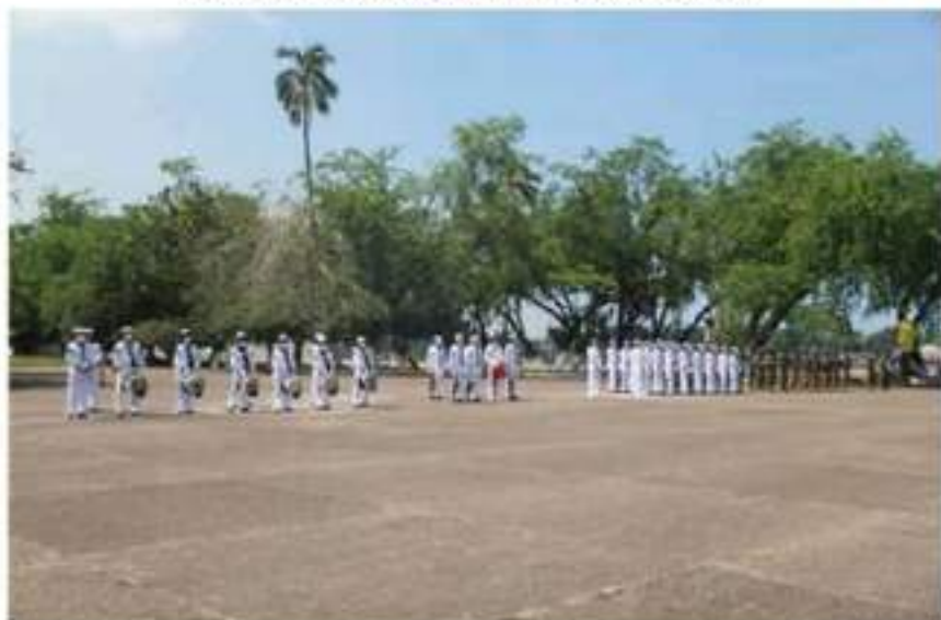
Elementos de la Décima Zona Naval Militar de este lugar, durante la ceremonia conmemorativa del 200 aniversario de la creación de la Armada de México.