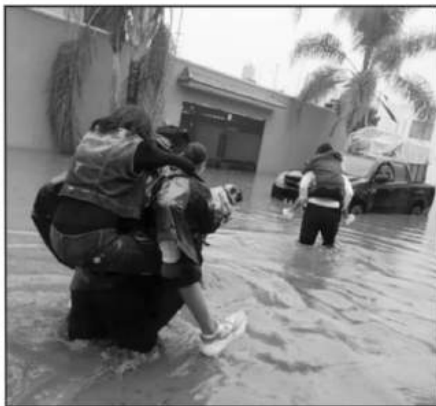
DEMARCACIONES QUE FUERON AFECTADAS POR FENÓMENOS HIDROMETEOROLÓGICOS SIGUEN SIN SUS CONSEJOS.

mano con los 112 municipios en la gestión de riesgo en donde tenemos que estar pendientes de ellos. Hay muchas condiciones que están detenidas por la pandemia como los atlas de riesgo como los que se hicieron que para por los efectos de la misma enfermedad. Es de que todos los municipios deben de tener su coordinación, vamos a trabajar que cada uno tenga su propio consejo