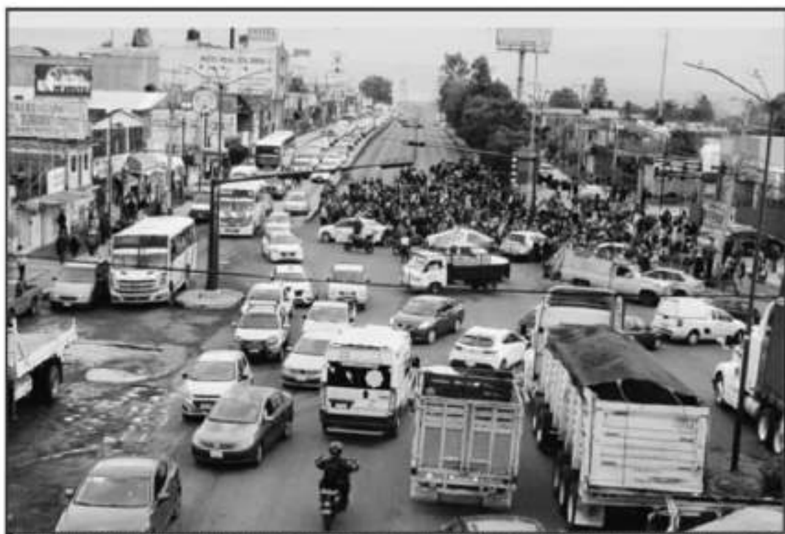
LUEGO DE REALIZAR BLOQUEOS A VÍAS DE COMUNICACIÓN EL DÍA DE AYER, AUTORIDADES SE COMPROMETEN A ENDEJAR DEMANDAS DE LOS MAESTROS.

Agregó que por el momento vanarán las acciones de presión y que no afectan a personas físicas, solamente se cerrarán las oficinas administrativas de cada subsistema para no dejar que entre ningún nombramiento que está