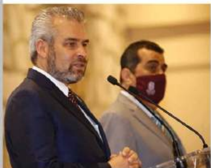
MORELIA, MICH.- El gobernador Alfredo Ramírez Bedolla, informó que las escuelas de todos los niveles estarían en clases presenciales de manera obligatoria, en próximos días.

"Mandar mensaje sincero a la Universidad Michoacana de San Nicolás de Hidalgo y sistema de educación superior que deben poner el ejemplo y volver a clases presenciales de manera normal", apuntó.