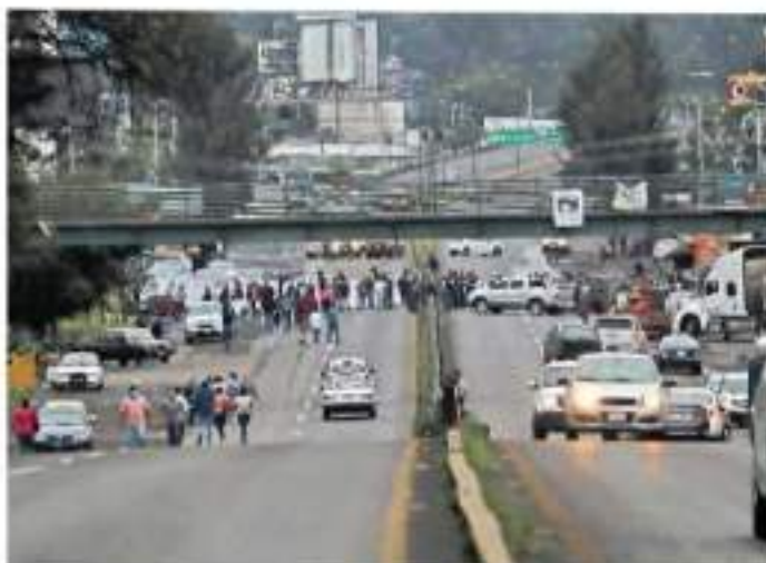
Integrantes del FESEMS cerraron varias vialidades