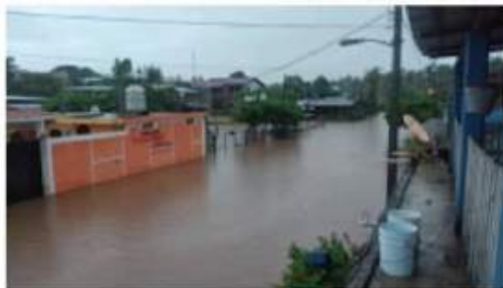
CD. LÁZARO CÁRDENAS, MICH.-Familias damnificadas podrían acceder a recursos federales para pagar un poco lo perdido por las tormentas.

Estos apoyos van dirigidos a viviendas que sufrieron daños en su estructura, a través del levantamiento de un censo de afectación y este formato permitirá solicitar enseres, en caso de familias que perdieron sus muebles.