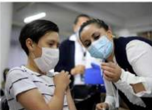
MORELIA, MICH.- Ayer, 33 adolescentes michoacanos fueron vacunados contra Covid-19, tras aprobarse su solicitud de amparo.

En tanto negó que existan reportes de casos positivos en escuelas que han iniciado actividad presencial y explicó que los reportes en menores se han dado desde el inicio de la pandemia, y también que es difícil determinar puesto el alto porcentaje de asintomáticos que se estima es superior al 50 por ciento.