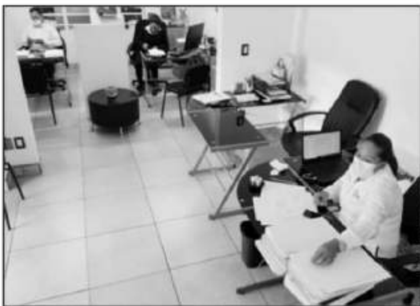
EL OBJETIVO ES EVITAR SE HAGA USO DE LOS DERECHOS QUE MARCA LA LEY FEDERAL DEL TRABAJO COMO HUELGA.

rios; el alcalde, creemos, recapacitará. Él es sindicalista cien por ciento, el conoce del tema, conoce muy bien de los movimientos sindicales, mientras nosotros vamos el ya viene, por ello se le está apostando a que se apacigüen las aguas que han sido agitadas por quienes están cerca de él, sobre todo aquellos nuevos funcionarios que llegan y observan todo con duda y sospechoso".