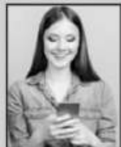
EXPERTOS RECOMIENDAN TENER OTRAS ALTERNATIVAS

Recomienda tener instalada al menos una aplicación como 'plan B' en los grupos de trabajo o familiares, como Telegram o Line, que tienen distintas funcionalidades y prestaciones que WhatsApp. Twitter, como red social puede ser útil, ya que, Facebook dio informes de su caída de forma oficial en esta red.