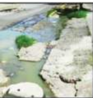
COMO DRIEN LA TEMPORADA DE LLUVIAS