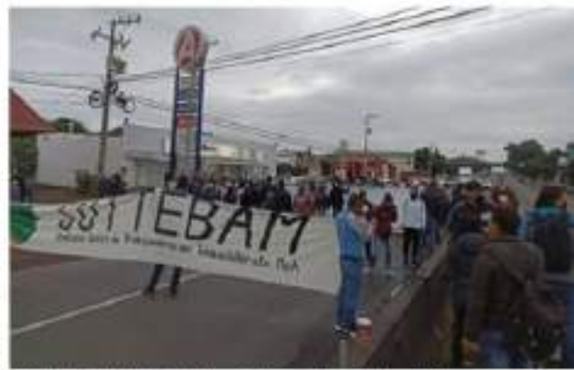
MORELIA, MICH.- Desde las 8:00 horas las salidas a Pátzcuaro, Quiroga y Salamanca fueron bloqueadas por integrantes del Frente Estatal de Sindicatos de Educación Media Superior y Superior (Fesemss), quienes exigen se pague el adeudo de 50 millones de pesos que mantiene el gobierno del estado.