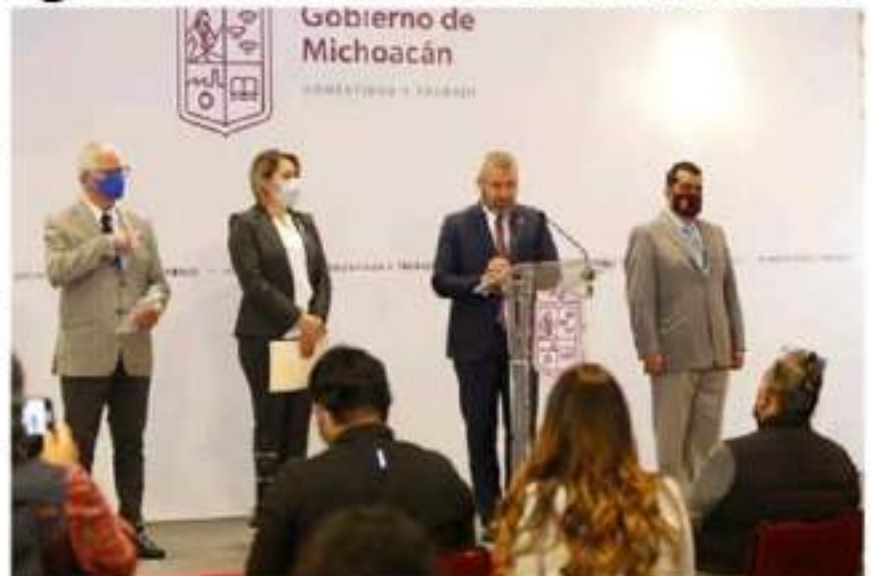
El gobernador Alfredo Ramírez Bedolla, durante su primera conferencia de prensa como mandatario michoacano el día de ayer, donde habló sobre temas de crisis económica, educación, salud y seguridad.

Ramírez Bedolla señaló que el regreso a clases va justamente de la mano del pago oportuno a los profesores, por lo que indicó que se sigue trabajando para que se les garantice tanto sus quincenas atrasadas como las que faltan para el resto del año.