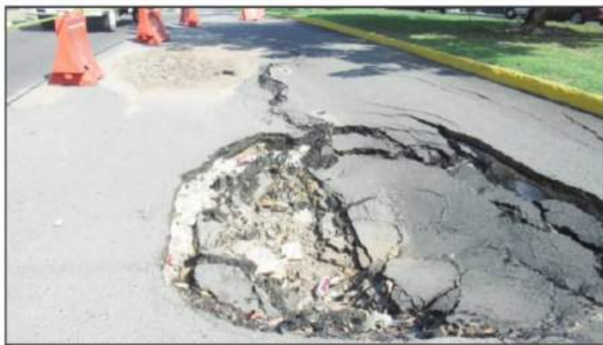
SE PUNTO CALDO QUE SE REGISTRAN DAÑOS A LA TUBERÍA DEL DRENAJE SANITARIO POR LA PRESENCIA DE BASURA Y SÓLIDOS, ACERCA DE UN PUNTO DE LA RED DEL SISTEMA.

En la misma vialidad, 300 metros más adelante en la ruta que