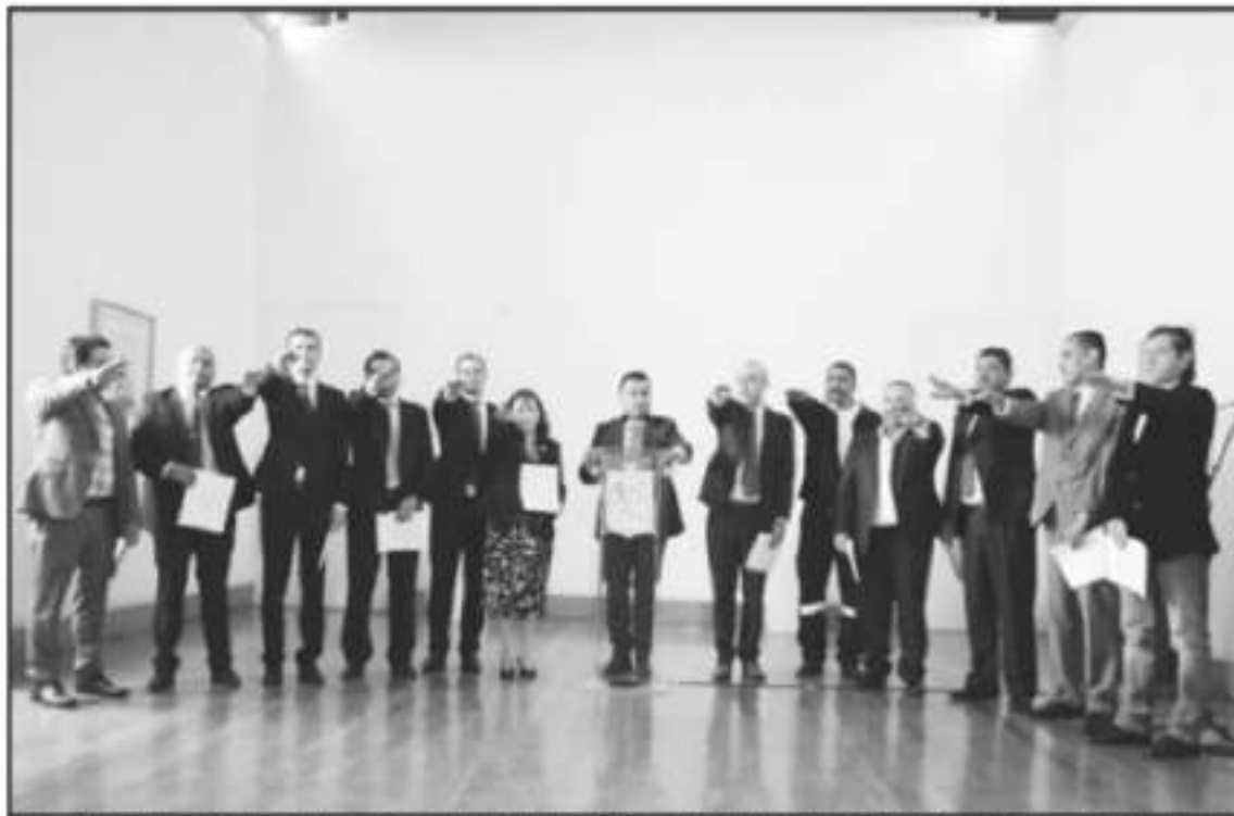
DURANTE ESTE LUNES SE CONTINUÓ CON LA ENTREGA DE MÁS NOMBRAMIENTOS, DE LOS QUE DIÓ FE EL SECRETARIO DE GOBIERNO EN LA TOMA DE POSESIÓN.

Incluso, la Secretaría del Migrante dará un giro en atribuciones y pasará de enfocarse a atender a los connacionales en Estados Unidos, a también incluir la atención a los michoacanos desplazados por la