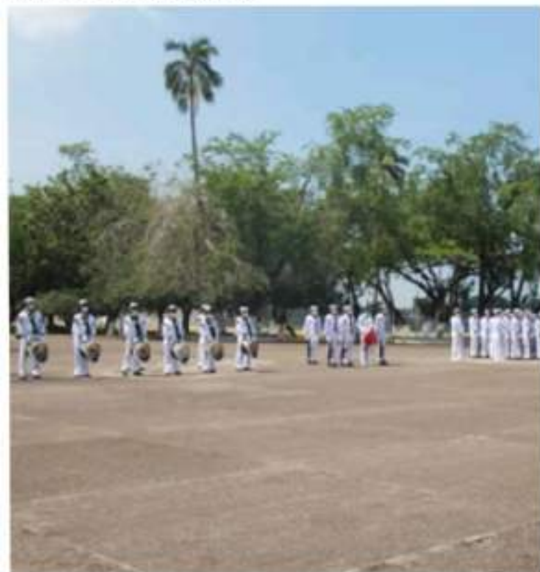
CD. LÁZARO CÁRDENAS, MICH.- La Décima Zona Naval, con sede en Lázaro Cárdenas, Michoacán llevó a cabo la ceremonia conmemorativa a los "200 Años de la Creación de la Armada de México".

Los elementos de Tránsito hicieron el llamado de conciencia a los automovilistas a no dejar sus vehículos obstruyendo accesos, rampas, sitios de emergencia, o acceso para discapacitados, pero, sobre todo, a no invadir carriles, ya que ello podría generar accidentes viales.