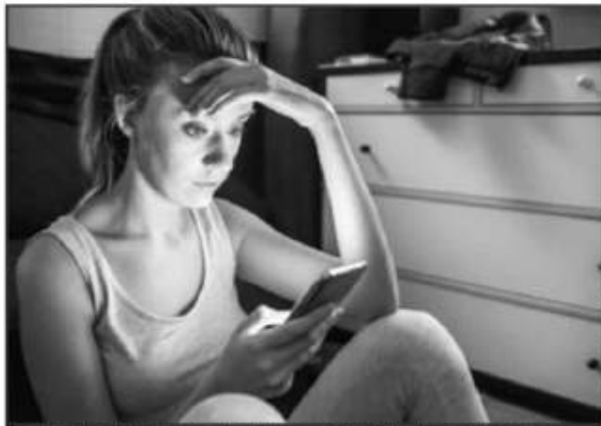
DURANTE CASI SIETE HORAS ESTUVERON FUERA DE SERVIDO ESSAS PLATAFORMAS, JUNTO CON INSTAGRAM

Apenas el domingo pasado, Frances Haugen, una fuente inicialmente no identificada públicamente, dio una entrevista a la CBS que prendió nuevamente las alarmas sobre este tema al decir que como investigadora de datos de la compañía admitió que podían hacer mucho