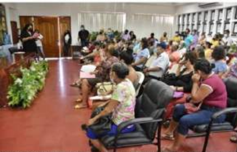
CD. LÁZARO CÁRDENAS, MICH.- El programa "Esperanzas de Amor" beneficiará a adultas mayores para el reencuentro con sus familiares que residen en Estados Unidos.

Se puso en marcha el programa Esperanzas de Amor Alcaldesa ayuda con traslado a la embajada de EU