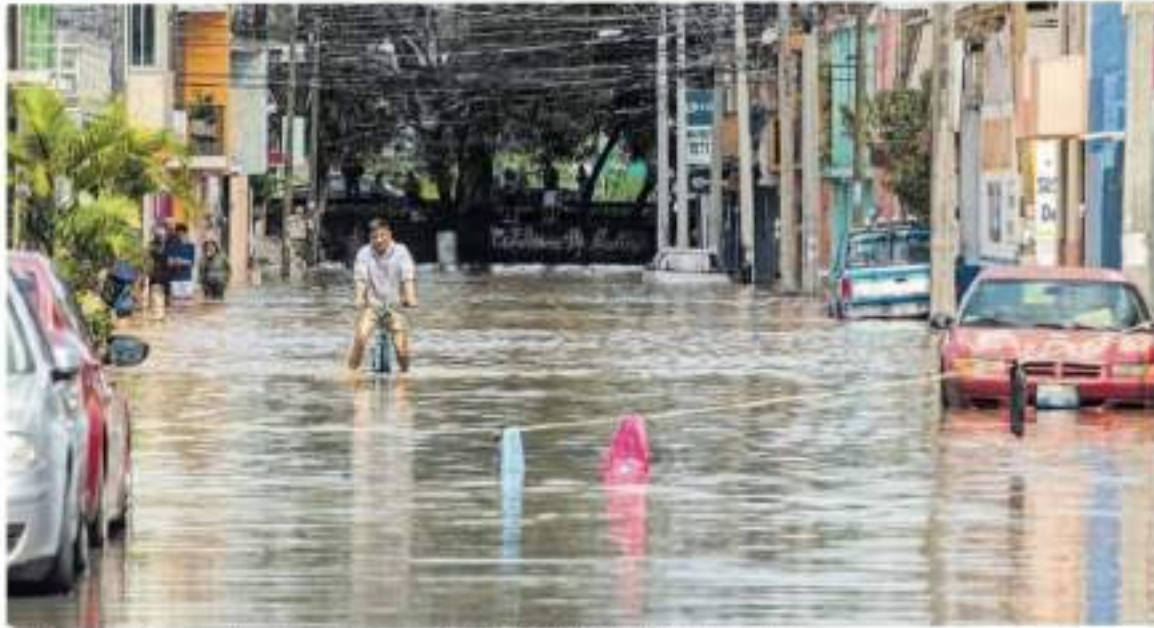
Dichos documentos permiten ahorro de recursos públicos al evitar desgracias.