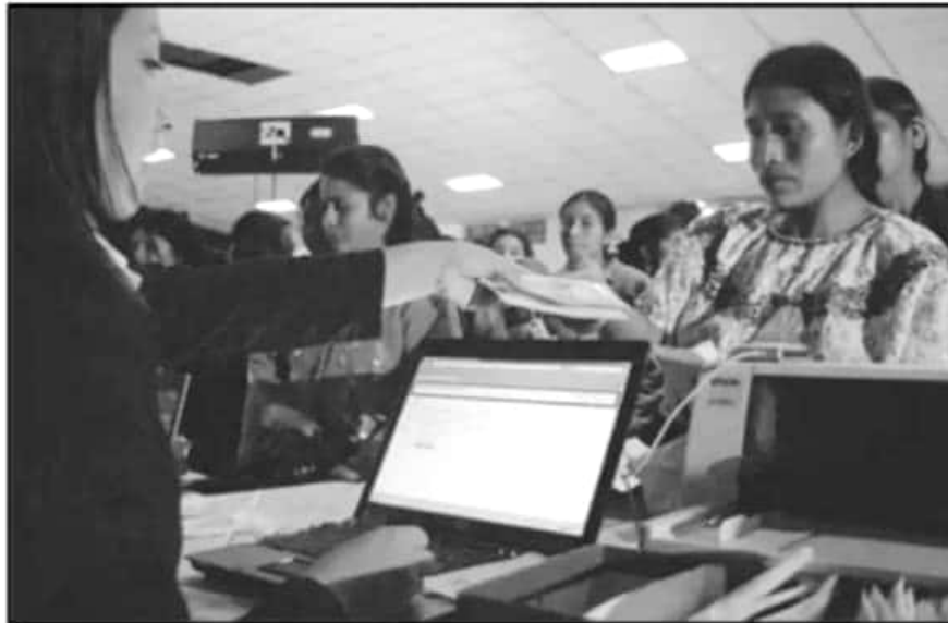
LAS REINAS DEL HOGAR SON A QUIENES ENVÍAN MÁS REMESAS DESDE ESTADOS UNIDOS. DE ACUERDO AL CEMLA.

En entrevista, menciona que en mayo de 2018 se recibieron 315 mil remesas por día, mientras que el promedio diario en