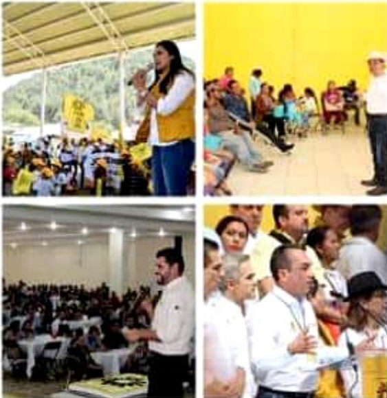
El PRD ha sido pilar en la transformación democrática del país, afirmaron integrantes del grupo parlamentario del Sol Azteca en el Congreso del estado.

"Como perredistas mantenemos nuestra convicción de continuar en la defensa de las conquistas históricas que se han construido a la par de los ciudadanos, alzaremos siempre la voz para denunciar retrocesos e intentos de minar la conquista de las libertades que tanto han costado al pueblo de México", recalcaron.