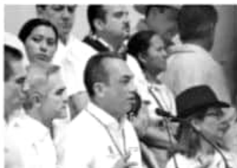
MORELIA, MICH.- En sus 30 años de vida, el Partido de la Revolución Democrática ha sido pilar fundamental en la transformación democrática nacional.