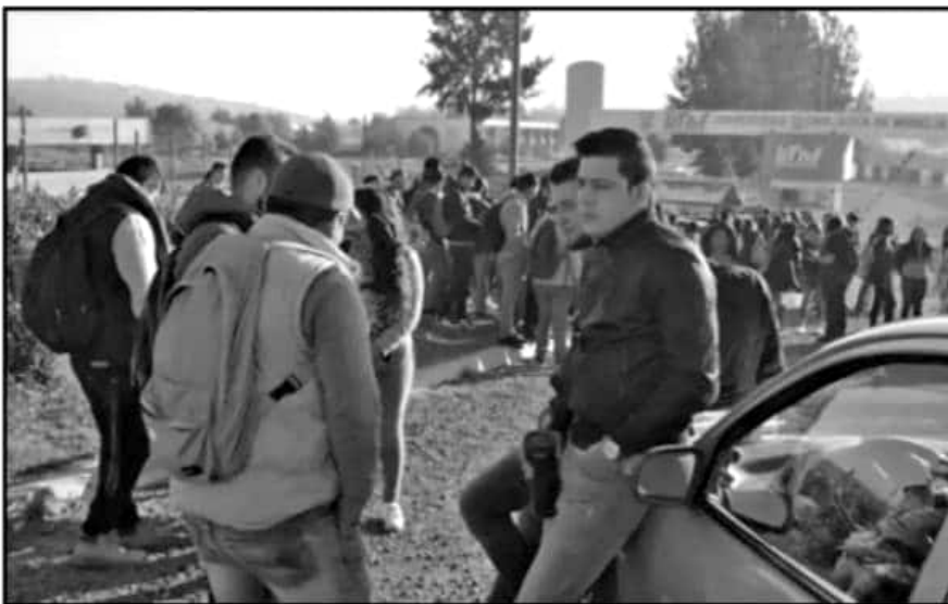
JÓVENES SIGUEN A LA EXPECTATIVA POR LOS PROBLEMAS QUE HA GENERADO LA 'LUCHA' ENTRE SINDICATO Y RECTORÍA

Consideró que el caso seguir el curso de su despido comenzaría una defensa legal, pero también una amplia movilización desde el ámbito sindical, por lo cual consideró que el escenario más plausible es el diálogo con el gobierno, más allá de las acciones de la Rectoría.