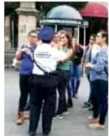
Se tiene contemplado brindar cursos de capacitación a los prestadores de servicios y guías.

constante. Los varones son el grupo de población más afectado, ya que son cuatro hombres por cada mujer confirmada.