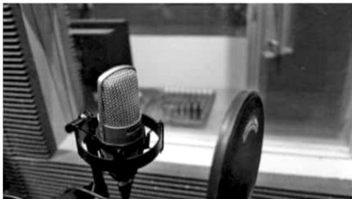
MORELIA, MICH.- Radio Nicoláita, la emisora de la Universidad Michoacana de San Nicolás de Hidalgo, celebrará 43 años al aire.

Acompañará a esta charla el ensamble de cuerdas "Amadeus", que estará interviniendo a lo largo de la conversación. Cabe mencionar que ambas actividades se transmitirán en vivo por el 104.9 de FM, la señal de Radio Nicoláita "Un radio cerca de ti", por www.emisoras.com.mx/nicolaita