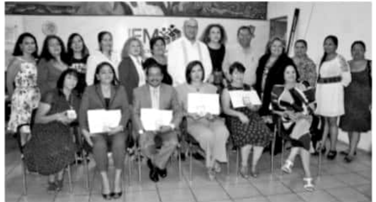
MORELIA, MICH.-Durante el evento se reconoció la trayectoria de quienes han impulsado el desarrollo de las femininas en los diversos sectores de nuestra sociedad.

Finalmente en el marco de la conmemoración del XV Aniversario se acordó, seguir trabajando de manera coordinada en pro de las mujeres y llevar a todos los rincones de Michoacán proyectos y acciones en su beneficio.