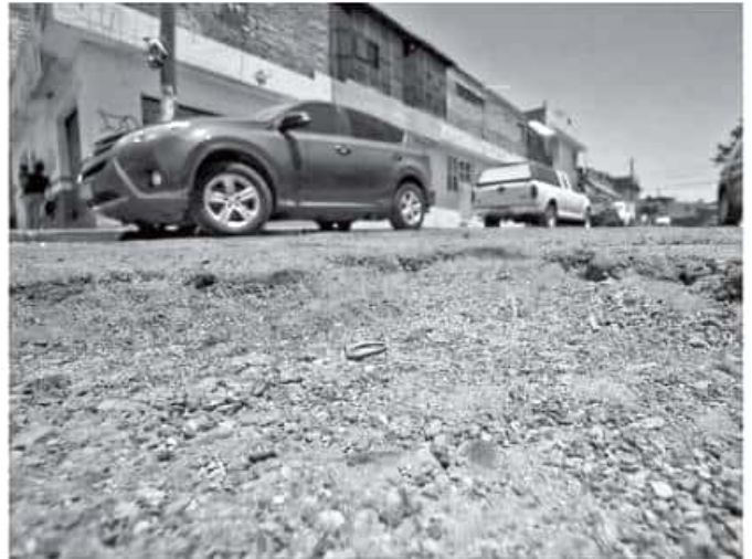
La tecnología utilizada es una técnica de bacheo en frío a base de concreto asfáltico. Fernando Maldonado