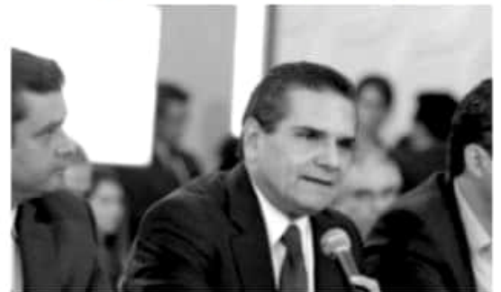
MORELIA, MICH.- El PRD enfrenta grandes retos y dificultades, por lo que es necesario revisar la línea política y corregir la dispersión ideológica, manifestó el gobernador Silvano Aureoles.

"Debemos lanzarnos a la conquista y abrazar las nuevas circunstancias, reencontrarnos con la Sociedad Civil, jóvenes, mujeres, y hombres de pensamiento libre. Nuestra lucha debe regresar de manera urgente y contundente hacia la transformación de la realidad nacional que hoy todavía está zanjada por profundas desigualdades", apuntó. Agregó que por ello, se debe abrir las puertas a organizaciones sociales que históricamente han pugnado por mejorar las instituciones, y en conjunto, construir un gran observatorio de los tres órdenes de gobierno.