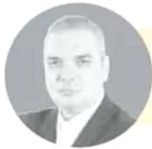
VÍCTOR AMERICANO EJE POLÍTICO @AMERICANOVICTOR