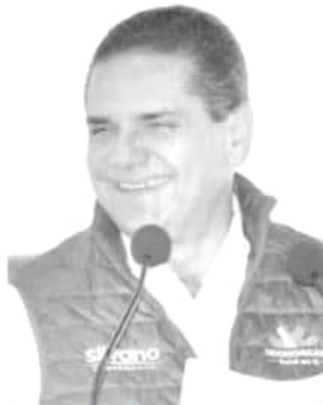
Silvano Aureoles Conejo.

Y además se dé vista en su momento a la autoridad competente y presente un informe de la coordinación con la Auditoría Superior de la Federación (ASF), a efecto de dar seguimiento a las observaciones y determinar la procedencia de los resultados preliminares en la auditoría de la Unidad Programática Presupuestal