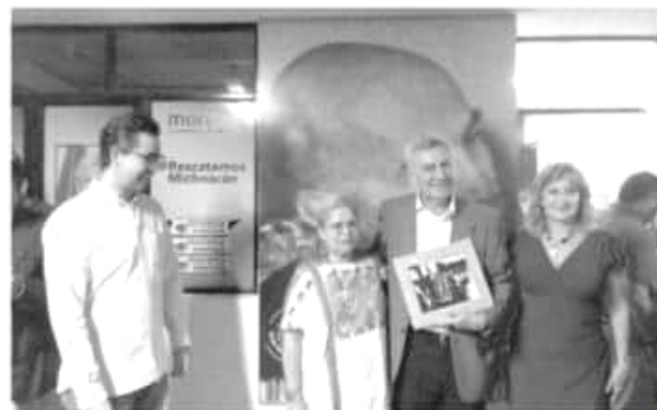
ESPECIAL En este espacio se pretende impulsar la lectura y el estudio.

Luego de hacer un llamado a que se donen tomos de académicos que enriquezcan el acervo cultural, expresó que en este espacio los interesados podrán acceder a ejemplares de todo derecho, legislaciones que se aprueban en las Cámaras, poesía, literatura y hasta tratados internacionales e investigaciones ambientales.