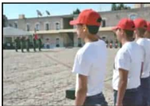
CON EL SMN, JÓVENES BUSCAN LIBERAR SU CARTILLA.