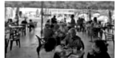
MORELIA, MICH.- La funcionaria invitó a quienes se den cita en la Expo Fiesta Michoacán 2019, a deleitar su paladar con la cocina tradicional michoacana.

cimiento de "Cultura ancestral y viva -El paradigma Michoacán", uno que "nos llena de orgullo y nos obliga a trabajar intensamente para difundir esta riqueza que tiene sus orígenes en lo más profundo de nuestra historia y tradiciones", citó. Finalmente, recordó que, las y los cocineros tradicionales de las diferentes regiones del Estado, estarán en el recinto ferial todos los días hasta el 19 de mayo, en horarios de las 13 a 24 horas.