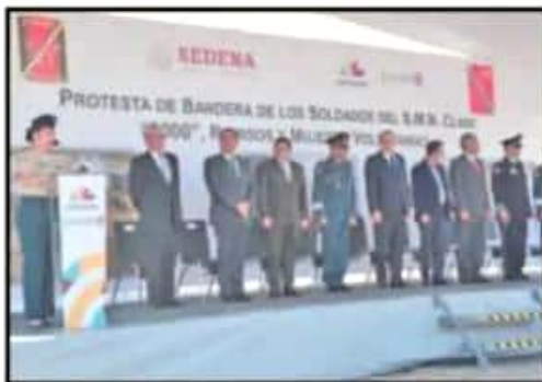
AUTORIDADES DE LOS TRES NIVELES ASISTIERON AL EVENTO.