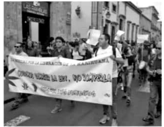
MORELIA, MICH.- Bajo el lema queremos cambiar la ley, no romperla, un grupo aproximado de 100 personas marchó en el primer cuadro de Morelia en el marco del Día Mundial por la Liberación de la Marihuana.

Cabe destacar que durante su recorrido, se escuchaba música reguá con instrumentos que portaban los activistas.