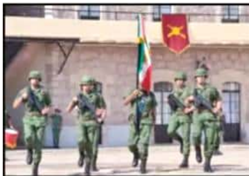
LA CEREMONIA DIO INICIO CON LOS HONORES A LA BANDERA.