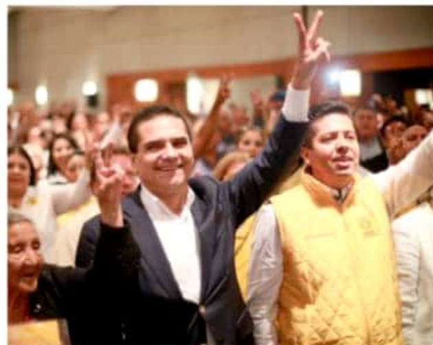
CIUDAD DE MÉXICO.- Silvano Aureoles Conejo, durante el aniversario del PRD en la Ciudad de México.

"Hoy como ayer la razón está de nuestro lado, somos herederos de la visión y las motivaciones más justas y nobles del pensamiento liberal. Nadie nos va a arrebatar nuestro sueño de un México más justo, más incluyente, democrático y próspero para todos", concluyó Silvano Aureoles Conejo, quien es fundador y militante del PRD.