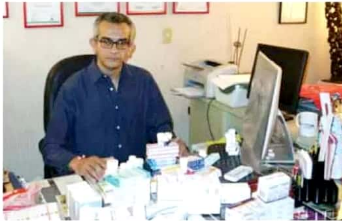
De las 25 claves de medicamentos en la SSM, cinco se están terminando.

El activista explicó que estos medicamentos tienen tres compuestos, pero si éstos se alteran, el tratamiento deja de ser viable y provoca que el paciente se encuentre