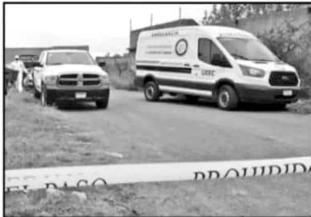
EN LAS ÚLTIMAS SEMANAS SE HA REGISTRADO UNA OLA DE VIOLENCIA EN VARIOS PUNTOS DEL ESTADO, QUE MÁS RECIENTEMENTE ALCANZÓ YA A MORELIA.