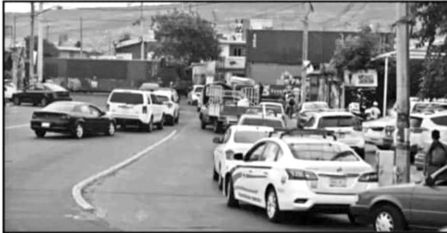
EL CRUCE DEL TREN CON LA AVENIDA SIERVO DE LA NACIÓN ES UNO DE LOS PUNTOS DONDE SE PODRÍA CONSTRUIR EL PUENTE.

"No tengo información de que estén viendo otros proyectos. Más bien, lo que nos están pidiendo es que ya hagamos el puente para el que fue destinado este recurso de 6.5 millones de dólares que tenemos todavía en el fideicomiso y en esa ruta estamos. La voluntad de Kansas City sigue en los mismos términos que antes, no se explican por qué en