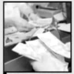
EN LOS ENVÍOS EL NOMBRE DE 'MARÍA' ES RECURRENTE.

En el caso de la madre el porcentaje es más reducido porque a lo mejor recibe envíos de otros miembros de la familia.