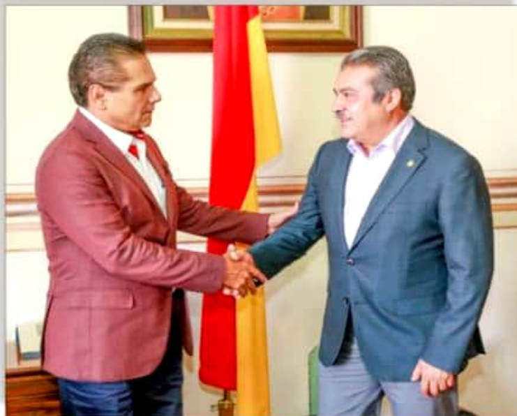
Gobernador SAC y Alcalde Morón se unen en materia de seguridad.

Estado", como lo dijo Aureoles Conejo al encabezar la Mesa de Coordinación de Seguridad en Morelia tras señalar que con esa reunión, inició "la nueva etapa del Plan Integral de Seguridad , donde se dará atención especial a los municipios"... COMO VERÁN pues, estimados lectores, es bueno observar que dejando a un lado sus camisetas y partidos, se unen los gobernantes para buscar solución a una de las principales demandas de la población como lo es la seguridad, ¿o no?... PERO CAMBIANDO de temas, aunque siguiendo con gobierno, pues la Feria de