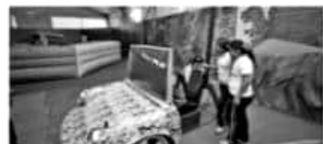
LA GOLETA, MUNICIPIO DE CHARO, MICH.- Una de las principales atracciones de la Expo Fiesta Michoacán 2019, es la Villa Jurásica, espacio gratuito dedicado a las y los niños mayores de tres años.

Hay un espacio donde los asistentes se colocan un visor y con él pueden ver en realidad virtual, el hábitat y comportamiento de los dinosaurios.