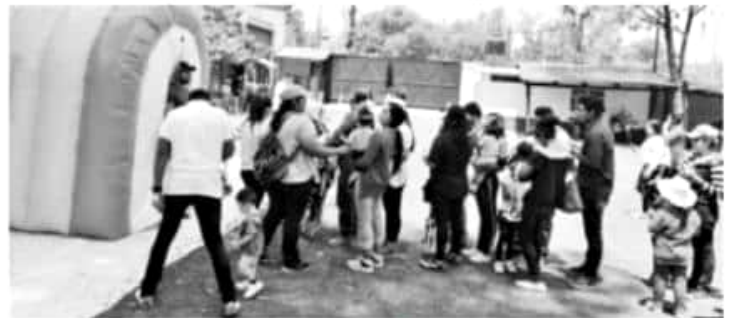
MORELIA, MICH.- Un domingo de diversión y aprendizaje vivieron este fin de semana las y los visitantes del Parque Zoológico "Benito Juárez".

versas instancias para ampliar la cobertura de los programas. La Burbuciencia -un cine móvil inflable que proyecta en su interior películas documentales en tercera dimensión-, constituye uno de los activos del ICTI con mayor demanda para la divulgación y apropiación social de la ciencia. Montañez Espinosa, concluyó que, con la participación en el Zoológico de Morelia, se cumplió el ciclo de actividades programadas en tres fines de semana a partir del 30 de abril, como parte de los festejos de Día del Niño.