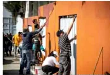
Se prepara una tercera etapa para agosto, ahora en secundarias.

escuelas primarias del municipio serán beneficiadas con pintura para fachadas y patios.