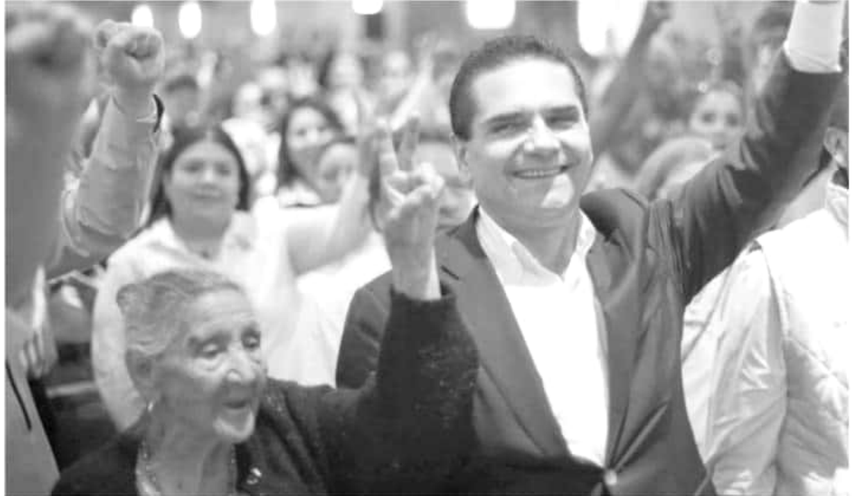
El gobernador de Michoacán, Silvano Aureoles.

«De las ocho entidades en las que originalmente se planteó y proyectó un modelo especial de desarrollo, hoy sólo están consideradas Oaxaca y Veracruz, lo