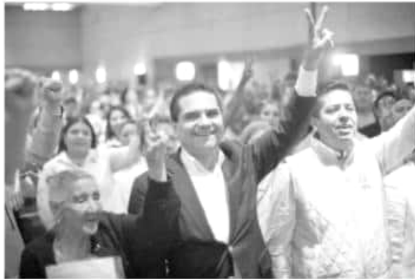
ESPECIAL El gobernador de Michoacán, Silvano Aureoles Conejo fue el orador oficial del evento realizado en la Ciudad de México.

Refirió que el PRD llega a sus 30 años, en un momento complejo para el país, donde se ha agudizado tanto la violencia como la inseguridad, y una época en la que la desigualdad sigue siendo un gran desafío.