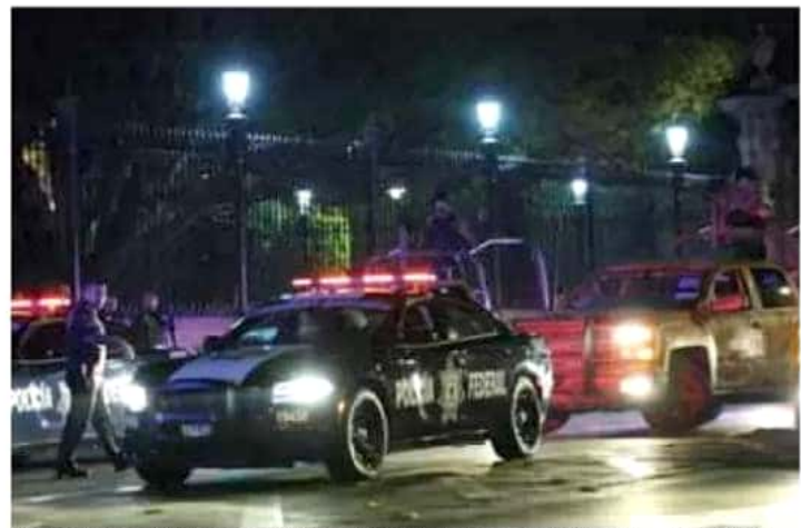
Debido a los hechos violentos, se puso en marcha un operativo especial de seguridad en el municipio de Morelia.

En entrevista colectiva, López Solís expresó que lo sucedido en el municipio de Erongaricuaró, donde también se encontraron cinco