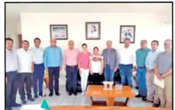
DISTINTOS LIDERAZGOS ESTATALES DEL PARTIDO REVOLUCIONARIO INSTITUCIONAL SE REUNIERON PARA DEFINIR LA RUTA HACIA LA RENOVACIÓN.