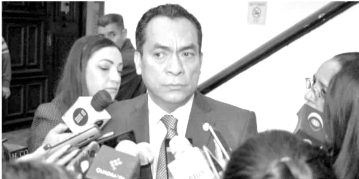
El fiscal general del estado, Adrián López Solís.

fenómeno de células delictivas que intentan reagruparse para el control territorial del estado, pero la acción de la autoridad ha impedido que ese esfuerzo termine en la conformación de un grupo hegemónico» comentó López Solís quien aseguró que mediante estrategias de seguridad buscan que está intención no se materialice.