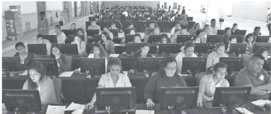
Para dar cauce a este problema es necesaria la revisión integral de la nómina que fue anunciada por el gobierno federal.