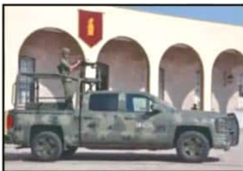
LA TOMA DE PROTESTA DUE EN LA XXI ZONA MILITAR.