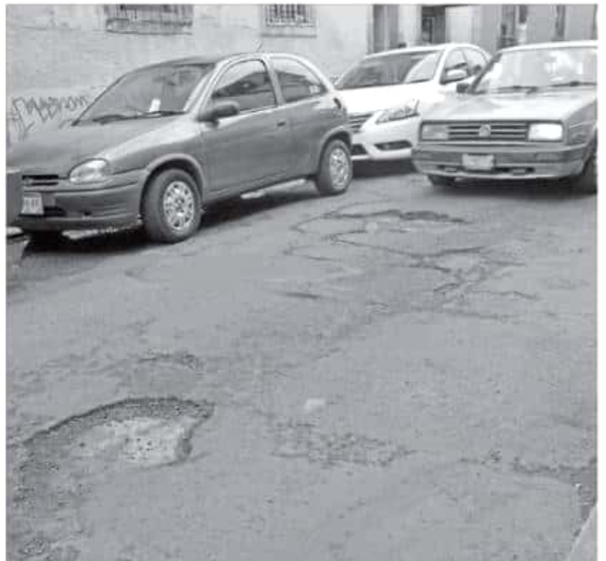
El actual edil Raúl Morón Orozco afirmó que en un lapso no mayor a tres meses acabaría con el problema de baches. Lázaro Morales