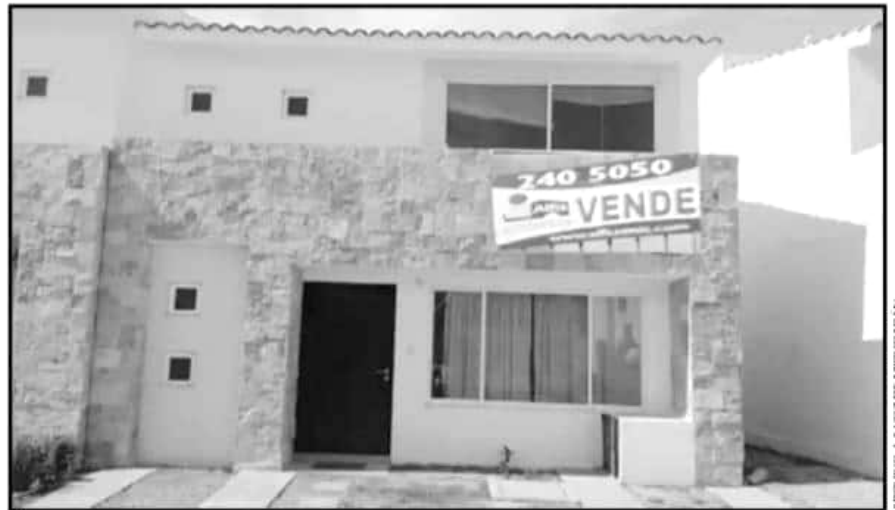
LA TITULAR DE LA PIMAC SEÑALA QUE NO TODAS LAS OFERTAS DE VIVIENDA EN LAS REDES SON CONFIABLES.

yendo de manera importante la posibilidad de un fraude.