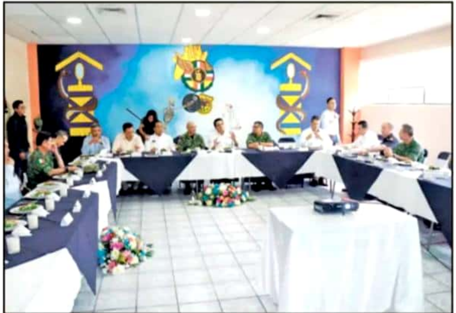
DURANTE LA CHARLA SE DEJÓ VER LA IMPORTANCIA DE CONTAR CON ELEMENTOS BIEN ADIESTRADOS EN LA POLICÍA.

Silvano Aureoles, GOBERNADOR DE MICHOACÁN