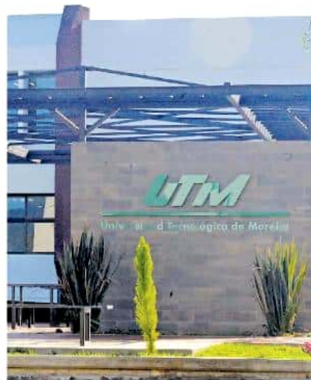
Esta misma semana se realizará una sesión de consejo de la universidad.

Tras una primera respuesta negativa de parte de la Secretaría de Finanzas, se ha continuado en busca de apoyo, primero para sacar adelante compromisos de este año, pero también para que se pueda tener ese techo financiero de forma regular en los años subsecuentes, con lo que además