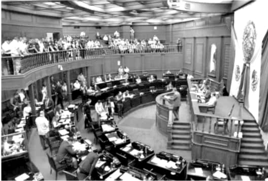
Una sesión en el Congreso del Estado.

El legislador comentó que en ocasiones se consensan entre las bancadas la designación de un car-