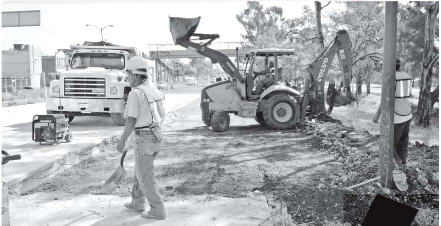
La inversión para este tipo de infraestructura en Michoacán será de cuatro mil 600 millones de pesos

EN PRÓXIMOS días se dará el arranque oficial de la construcción de la autopista Zamora-Ecuandureo