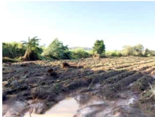
ZAMORA, MICH.- Reportes del DDR 088 de la Sader, indican que más de 100 hectáreas de aguacate y zarzamora, han sido afectadas por granizadas en los municipios de Tocuambo y Tingüindín.

"En el municipio de Tocuambo, en Santa Clara, se nos reportó un siniestro por inundación que afectó la zarzamora a 40 productores con 70 hectáreas, esa es la mayor afectación que se ha registrado actualmente", asentó.