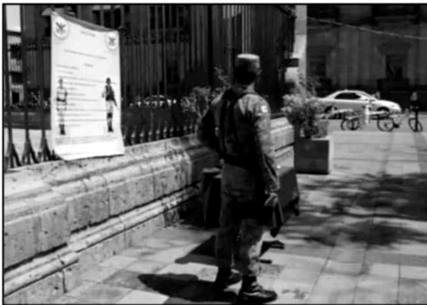
SÓLO HA LLEGADO AL ESTADO UNA PARTE DE LOS ELEMENTOS ACORDADOS; NO HAY FECHA PARA EL ARRIBO DEL RESTO

Uno de los puntos que fue destacado por los medios locales, fue