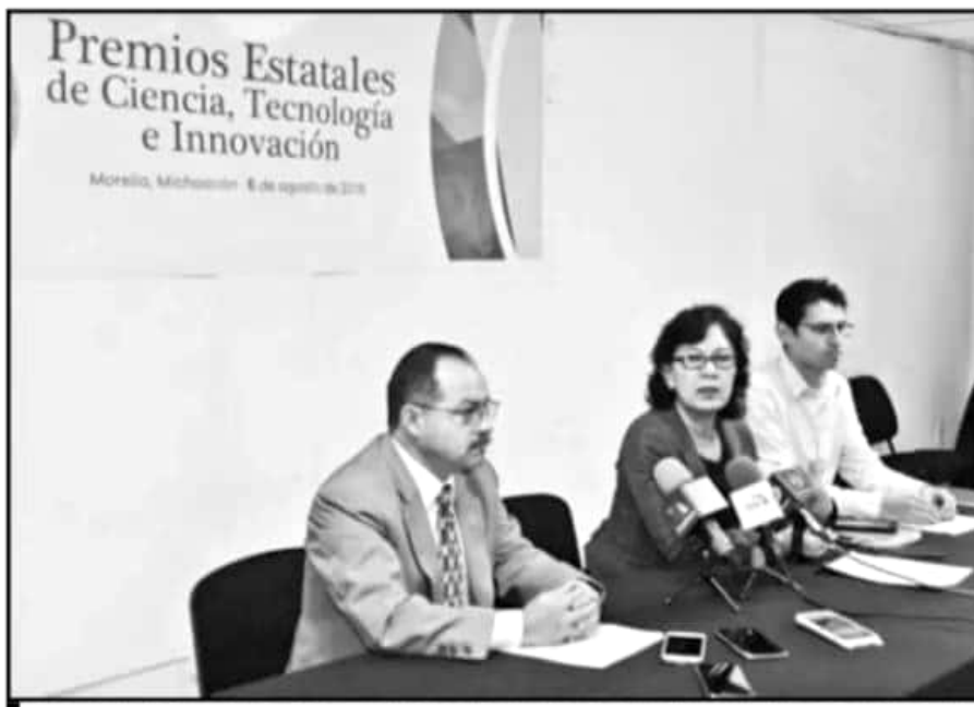
LOS ORGANIZADORES DIERON LOS DETALLES DE LA CONVOCATORIA, QUE ESTARÁ ABIERTA HASTA EL 20 DE SEPTIEMBRE.

los carros puedan pasar sin detenerse. Si los autos rebasan el límite, el tope se queda levantado.