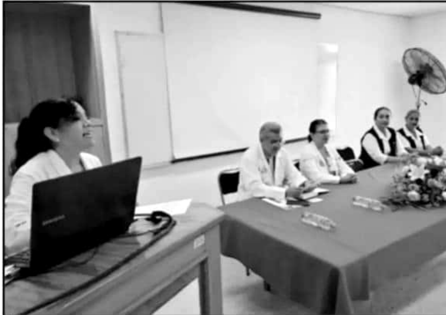
ESPECIALISTAS DEL HOSPITAL REGIONAL DE URUAPAN RESALTARON LA IMPORTANCIA DE LA LACTANCIA MATERNA.

Los beneficios directos e indirectos a corto, mediano y largo plazo de la lactancia materna, no solo son para el bebé pues estudios de los últimos años, relacio-