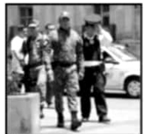
EL CENTRO ES UNO DE LOS PUNTOS DONDE MÁS DE CONCENTRAN