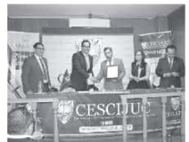
Es una labor constante de la comisión capacitar a los servidores públicos para concientizarlos respecto al tema.

Indicó que sólo con el fortalecimiento de las instituciones educativas se podrá transitar hacia una mejor sociedad, donde haya igualdad, y no conductas discriminatorias, excluyentes y misóginas que dañan y vulneran a los ciudadanos.