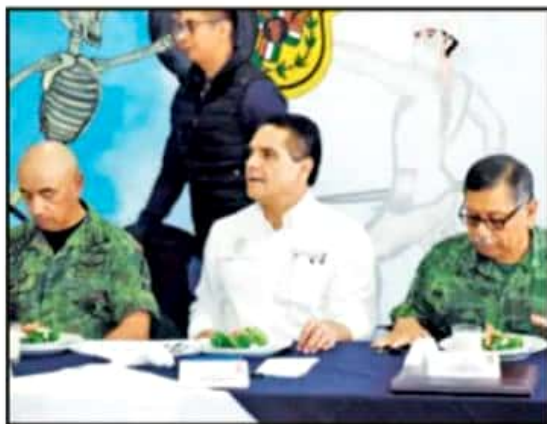
EL GOBERNADOR DE MICHOACÁN, SILVANO AUREOLES CONEJO, ENCABEZÓ EL ENCUENTRO SEMANAL DE LA MESA DE SEGURIDAD EN LA ZONA.