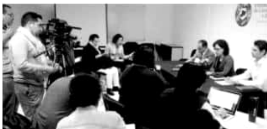
MORELIA, MICH.- Abrió la Convocatoria 2019 para postular candidatos a los Premios Estatales de Ciencia: la Condecoración más alta que otorga Michoacán.

Datos de contacto: Instituto de Ciencia, Tecnología e Innovación del Gobierno del Estado de Michoacán Calzada Juárez 1446, Colonia Villa Universidad Tels. (443) 3149907, 3249080 Ext.109 Correo electrónico: piedad_2359@hotmail.com