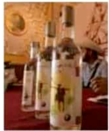
Michoacán es el segundo estado con mayor producción de mezcal.

Los productores interesados en participar en este programa pueden solicitar informes en la oficina de la Sefeco, ubicadas en boulevard García de León 753, colonia Chapultepec Sur, o al teléfono 443 147 8260. CRISTIAN RUIZ