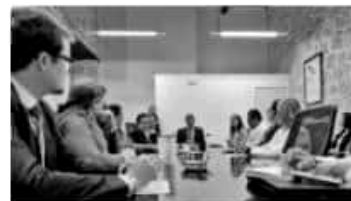
MORELIA, MICH.- El comité del Consejo Estatal de Salud (Coesa).

La salud de las mujeres michoacanas es una prioridad por lo que se está trabajando para que Michoacán registre cero defunciones provocadas por hemorragia obstétrica, sepsis, enfermedad hipertensiva, edema, proteinuria en el embarazo, parto y puerperio por mencionar algunas.