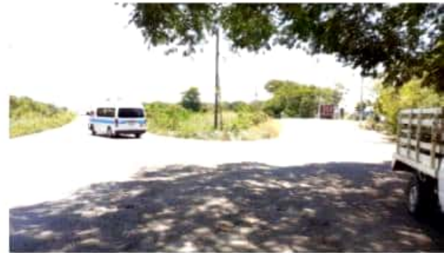
CD. LÁZARO CÁRDENAS, MICH.- La SCT realizó los trabajos de balizamiento como parte de una primera etapa de una serie de obras, las cuales están contempladas para ofrecer un mejor acceso y señalamientos que advierte sobre el conocido cruce de El Habillal.

Sin embargo y bajo un estudio hecho por personal de la SCT que atiende a la petición, se desprende la necesidad de construir carriles de aceleración y desaceleración, a fin de ofrecer mayor seguridad a los automovilistas que transitan por la zona y evitar en lo mayor posible, accidentes viales en la zona, proyecto que fue autorizado por la Federación y que en breve se realizarán los trabajos correspondientes para su ejecución.