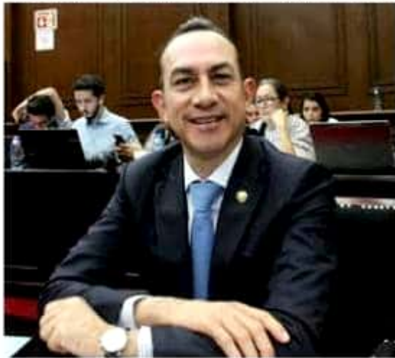
El diputado Antonio Soto recordó que entidades como Michoacán se vieron fuertemente impactadas este año por los recortes federales en materia turística.

Asimismo consideró la necesidad de una participación activa de los estados de la República como Michoacán, que cuentan con amplia experiencia en materia turística, de manera que las acciones caminen acordes a las particularidades e identidades de cada una de las regiones que se tienen previstas.