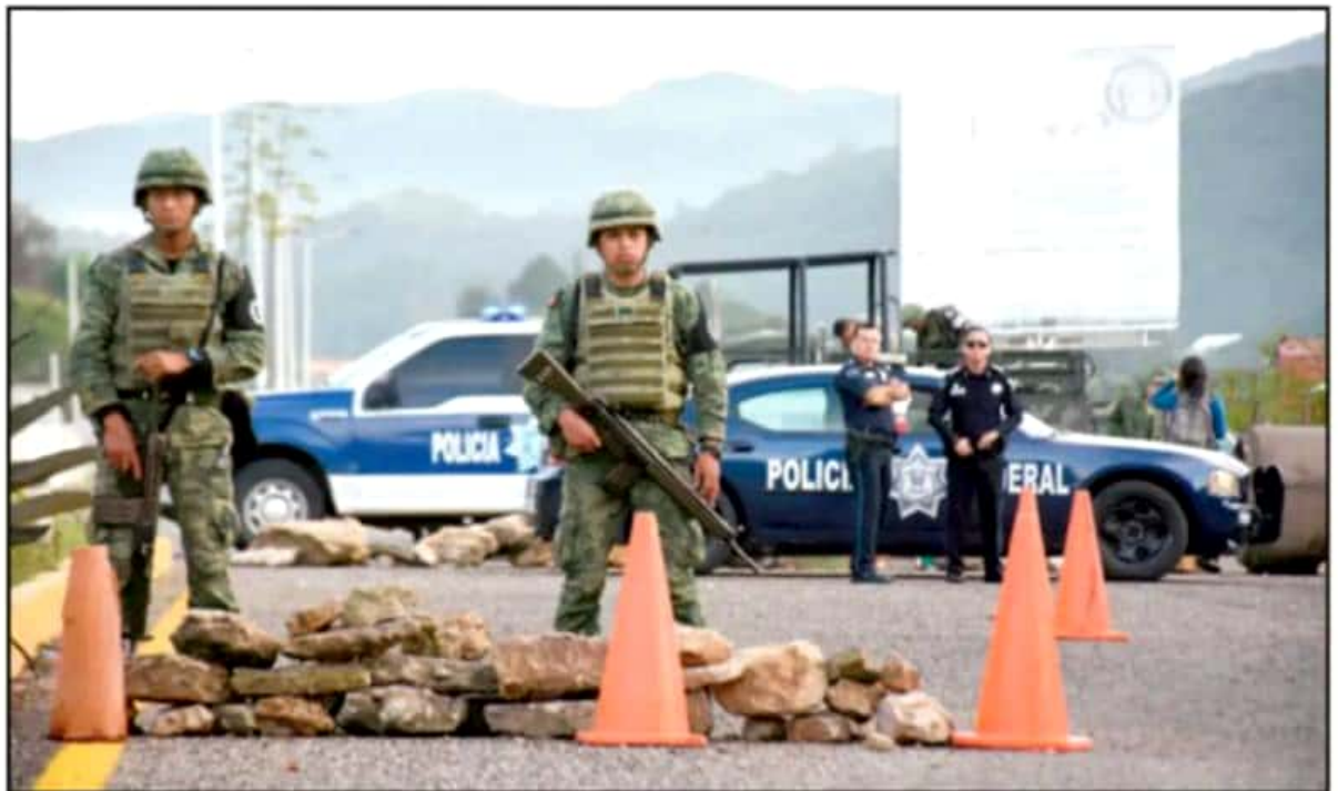
PRÁCTICAMENTE POR ÓRDENES DE ESTADOS UNIDOS. DESPUÉS DE LA CRISIS DE EXPORTACIONES, LA FEDERACIÓN MANDÓ LA GUARDIA NACIONAL AL SUR.

Sobre esa línea, coincidió con autoridades federales en que el reciente tiroteo en un centro comercial de El Paso, Texas, en el que murieron al menos siete mexicanos, debe ser considerado como un acto terrorista, y añadió que este tipo de conductas se originan por una “narrativa” de