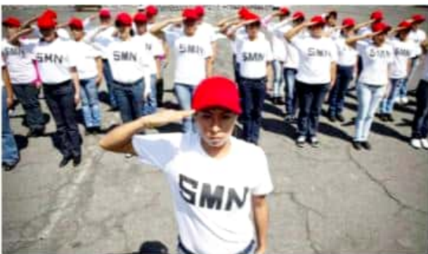
CD. LÁZARO CÁRDENAS, MICH.- El 82 Batallón de Infantería informó sobre las nuevas disposiciones para entrega de cartillas de identidad del SMN a mujeres.

Asimismo se les expedirá a hora de liberación a las mujeres que asistan a las sesiones de adiestramiento sabatinas, en igualdad de circunstancias que el personal masculino.