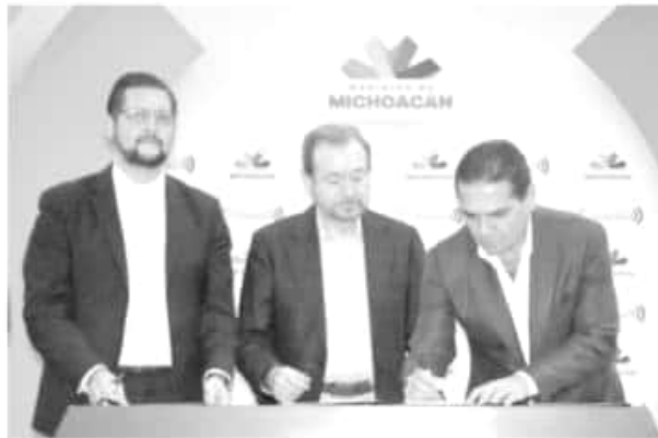
La firma de convenio deriva en un financiamiento de 500 mdp de los cuales 200 serán vía Nafin, 200 de FIRA y 100 con el Fondo Nacional del Desarrollo Rural.

Agregó que es histórica la bolsa de financiamiento que contempla el convenio, gracias a la coordinación entre los gobiernos estatal y federal.