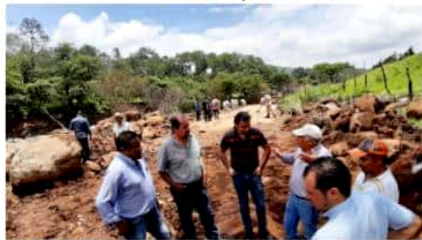
LOS REYES, MICH.- Funcionarios y regidores constataron el avance en los trabajos de habilitación del paso provisional en la carretera hacia Atapan, tras el colapso del puente "La Guajolota".