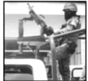
SE PUEDEN VER PATRULLANDO ALGUNAS CALLES DE LA CIUDAD

Va a ser un proceso gradual, se siguen reclutando y capacitando elementos, ya hay un número importantes distribuidos en las 13 regiones del estado