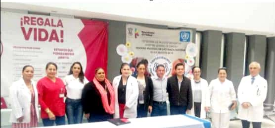
ZAMORA, MICH.- En materia de donación altruista de sangre, la ciudadanía tiene una tarea pendiente, pues apenas el cuatro por ciento de la población es activa en este sentido.

La donación es importante para las personas que tienen un familiar enfermo, pues cada paquete tiene un costo en el mercado privado de hasta 2,500 pesos, y sin embargo lleva solo unas horas el recuperarse y regenerar su sistema; es indispensable donar antes de llegar a necesitar.