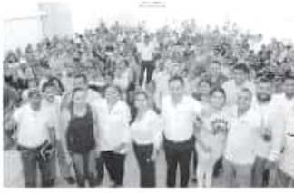
Servidores públicos del Registro Civil coordinan esfuerzos.