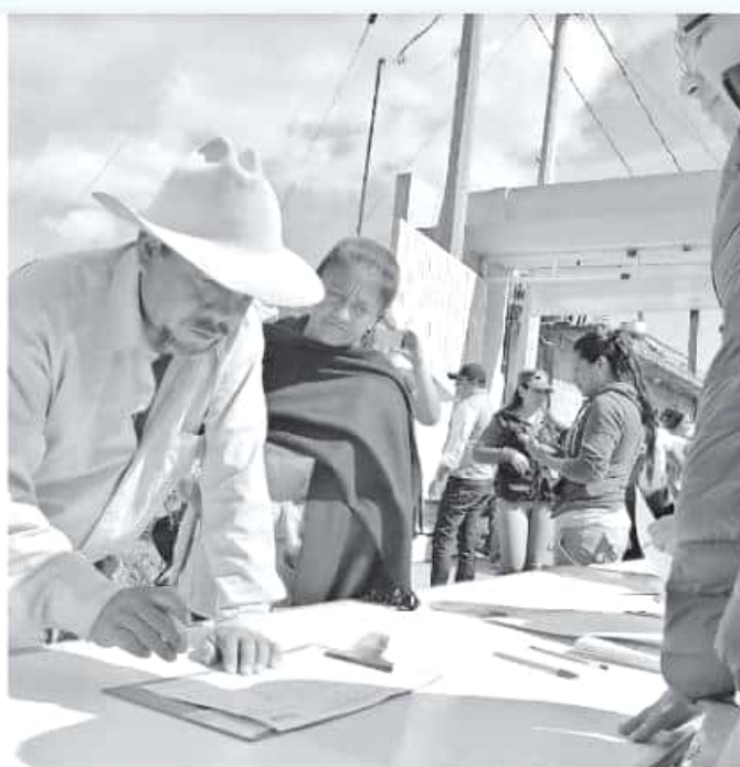
La Sala Regional Toluca mantiene la vigencia de la consulta que se hizo en la comunidad.

"Seguramente ya de ahí habría una definición todavía más puntual, porque si bien recuerdas se había presentado un amparo y ya quedó sobreesido, entonces prácticamente los elementos están para que se dé el siguiente paso que es concretar la transferencia de recursos y la administración directa de la comunidad, sola-