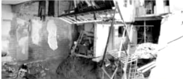
CAMBIO | GRECIA PONCE

Por ello piden que también se les reconstruyan sus viviendas, sobre todo dos de las cuales son las más afectadas. Una que es la que desapareció en el hundimiento, que estaba en el número 665 y la otra, una que está a punto de desplomarse, que es la número 667.