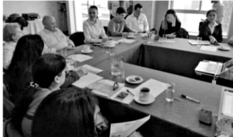
URUAPAN, MICH.-IMPLAN instaló formalmente su Consejo Consultivo representado por ciudadanos de varios ámbitos de la vida productiva y social del municipio, a quienes se entregaron nombramientos y trabajarán dentro del programa "Uruapan 2033 Planeando el Futuro"

Cabe destacar que los participantes ingresaron al consejo de manera voluntaria y sin remuneración económica, además se estudiaron ampliamente sus perfiles profesionales y trayectoria.