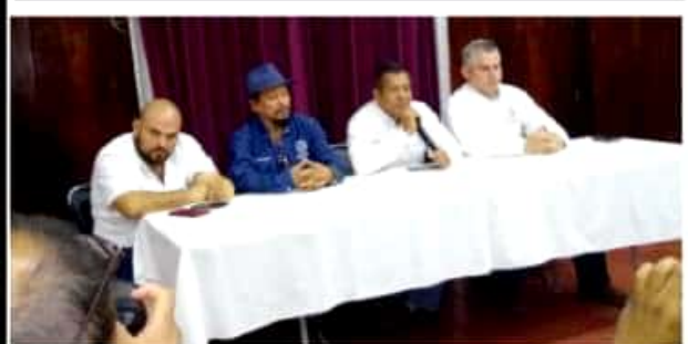
APATZINGÁN, MICH.- Aseo Público recolecta diariamente 180 toneladas de basura, que sumadas a las que recaban concesionarios, llegan a las 300 toneladas diarias, informó el director de Servicios Municipales.

Para tal comportamiento no existe una explicación ni concesionario o administrador de empresa alguna ha salido a ofrecer información de lo que los consumidores de la región califican como "práctica monopólica".