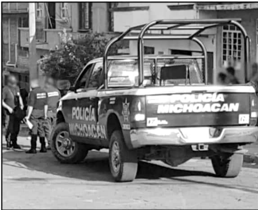
DE ACUERDO CON LA CONSTITUCIÓN, SON LOS MUNICIPIOS LOS PRINCIPALES Y PRIMEROS ENCARGADOS DE LA SEGURIDAD.

109 ALCALDES firmaron el anterior Mando Único