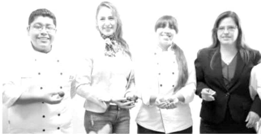
Tomarán parte ocho equipos de alumnos de la Escuela de Gastronomía de la UTM; también apoyan el concurso los productores integrados al Consejo Estatal de Productores de Higo.

El 50 por ciento de los recursos de premiación del concurso,