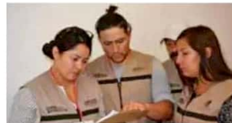
El titular de la Secretaría del Bienestar aseguró que se han cuidado los programas para que los apoyos lleguen a quienes más los necesitan.

Pantoja Arzola adelantó que también se encuentran en la promoción e identi-