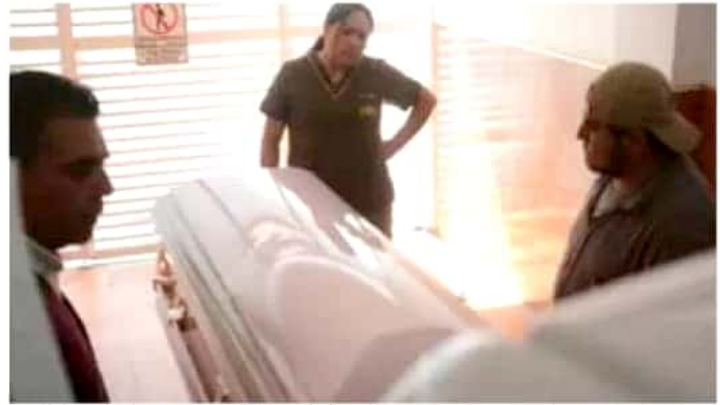
Autoridades municipales mantienen los operativos en las funerarias para revisar que cumplan con las normas.

Aseguró que el Ayuntamiento no será omiso en los casos de las funerarias que