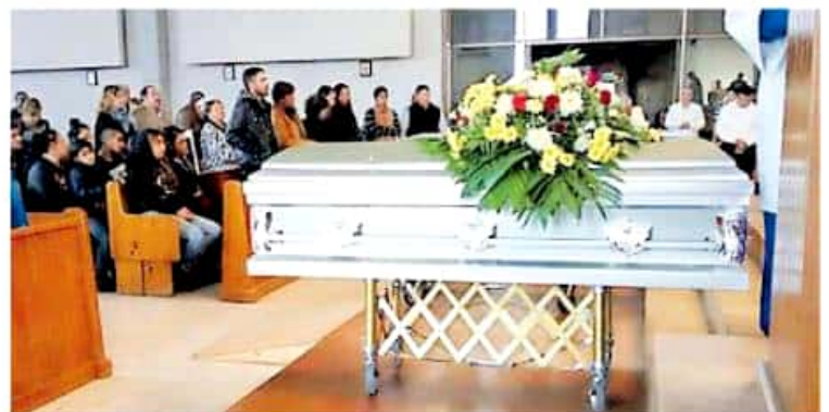
Sólo cuatro de estas compañías estaban en orden.

Las multas para quienes infringen los reglamentos municipales oscilan entre los cuatro mil y 18 mil pesos, dependiendo de la falta en la