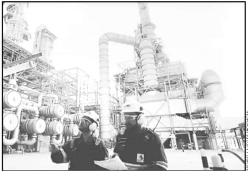
LA ASOCIACIÓN NACIONAL DE ESPECIALISTAS FISCALES SEÑALA QUE LAS VERIFICACIONES SON UN GRAN DESAFÍO.

Los delitos imputables a las empresas tienen que ver principalmente con temas de contrabando, lavado de dinero, el no