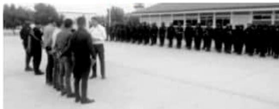
EL titular de la SSP Israel Patrón Reyes y mandos regionales de la Policía Michoacán, revisaron acciones desplegadas en la zona para garantizar el Estado de Derecho y preservar el orden.

Asimismo, el Secretario de Seguridad refirió que el trabajo conjunto entre los tres órdenes de gobierno, ha permitido efectuar detenciones de implicados en hechos delictuosos, el aseguramiento de armas de fuego, cartuchos útiles y de vehículos empleados en actividades ilícitas. De igual forma, se verificó el correcto funcionamiento de las cámaras del Subcentro del Centro Estatal de Comando, Comunicación, Cómputo, Control e Inteligencia (C5i), mismas que se encuentran distribuidas de manera estratégica para salvaguardar la integridad de la población. De esta forma, la SSP ratifica su compromiso de mantener labores firmes a favor de las y los michoacanos.