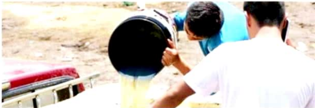
CD. LÁZARO CÁRDENAS, MICH.- En base a la Encuesta Nacional de Seguridad Pública Urbana, un ocho por ciento de la población mayor a los 18 años aseguró haber presenciado o escuchado sobre el robo o la venta ilegal de gasolina o diesel en el municipio porteño.

Sin embargo, como La Paz, Baja California Sur; Tijuana, Baja California; Saltillo, Coahuila; Chilpancingo, Guerrero; Fresnillo, Zacatecas, entre muchas otras más, que no presentaron resultados.