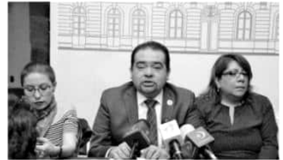
MORELIA, MICH.- La determinación de la Suprema Corte de Justicia de la Nación (SCJN), al avalar la Norma Oficial Mexicana (NOM) 046-SSA2-2005, mediante la cual se ordena a todos los hospitales públicos interrumpir los embarazos resultado de violación sin necesidad de que la víctima denuncie el delito ante el Ministerio Público, es un gran avance para nuestro país.

Recordó que con base en información documental y estadística, los riesgos inminentes y consecuencias - incluso mortales - que representa la realización de un aborto clandestino, mismos que se reducen en la medida que se elevan los costos; es decir, la mujer que tiene mayores posibilidades económicas, corre menor riesgo que la que no cuenta con dichos medios, aunado a que las clínicas que practican abortos clandestinos están presentes ante una sociedad que opta por invisibilizarlas. Con esta propuesta se protege a las niñas, adoles-