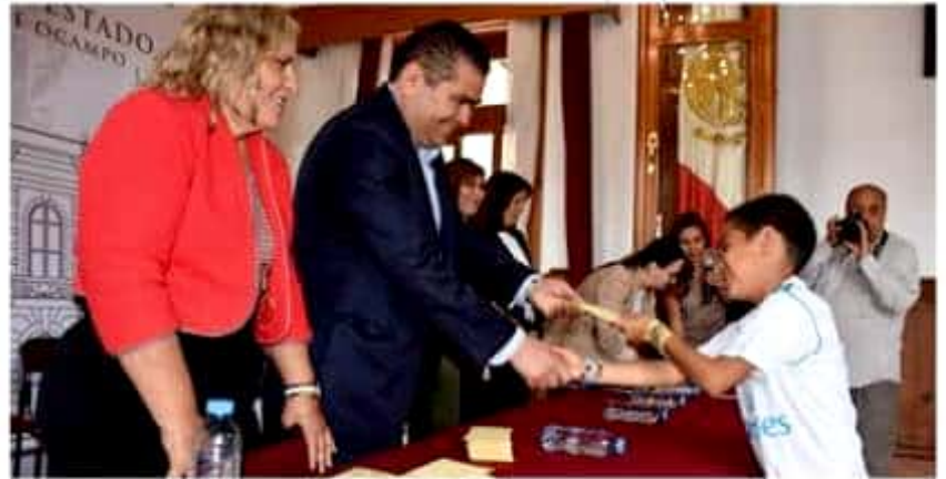
El Congreso del estado hizo entrega de incentivos económicos a hijos estudiantes de trabajadores del Poder Legislativo.

Asimismo, señaló que continuarán impulsando la entrega de estímulos para la capacitación, profesionalización y actualización de sus agremiados, a fin de que tengan mejores herramientas para brindar un mejor servicio a la ciudadanía.