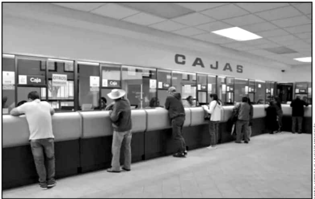
LA CAMPAÑA PARA PAGAR EL PREDIAL ACTUAL Y CONDONAR LOS ADEUDOS Y MULTAS DE AÑOS ANTERIORES NO HA TENIDO EL IMPACTO ESPERADO EN ARCAS.