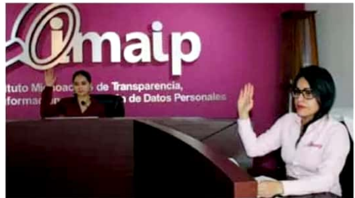
El Instituto lleva a cabo las revisiones de las denuncias.

Por ello, dijo que el próximo mes el pleno del Instituto sesionará para determinar las multas a los sujetos obligados que son omisos en materia de