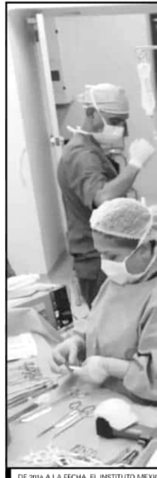
DE 2014 A LA FECHA, EL INSTITUTO MEXICANO DEL SEGURO SOCIAL HA REALIZADO EN MICHOACÁN 182 TRASPLANTES DE RIÑÓN Y 62 EN LA NUEVA UNIDAD DEL IMSS EN CHARO.

De acuerdo con Aguado Arteaga, cerca de 60 pacientes michoacanos se encuentran en espera por