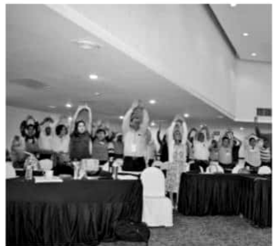
MORELIA, MICH.- La Secretaría de Salud de Michoacán (SSM), realiza la "Tercera Reunión Anual de Vigilancia Epidemiológica", a concluir mañana en esta capital michoacana.

Asimismo, se cumple con los parámetros de calidad de capacitación continua al personal adscrito a la institución, donde se les brindan las herramientas necesarias para mejorar el desarrollo de su labor diaria, logrando así mejores servicios de salud a los usuarios.