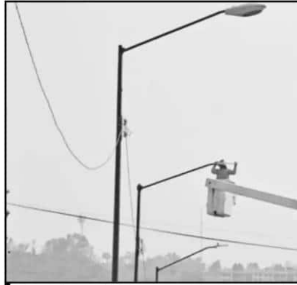
HACE ALGUNOS MESES QUE INICIÓ EL CAMBIO DE LUMINARIAS Y EN VARIOS LUGAR

Cuando pasan el dictamen a cabildo, ahora no sale la cantidad, únicamente especifica las luminarias que se van a adquirir, entonces el dictamen queda abierto por si hay un incumplimiento