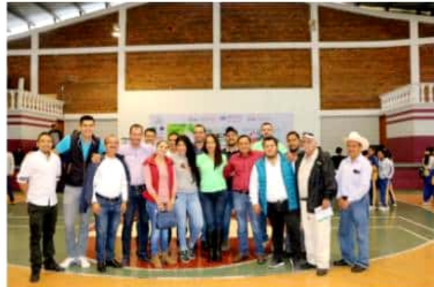
LOS REYES, MICH.- Con éxito se llevó a cabo la Feria Ambiental con motivo del Día del Medio Ambiente.