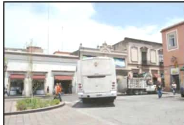
UN COLECTIVO SE AVIENTA EN SENTIDO CONTRARIO. OTRO CAMIÓN ESTORBA.

Por el lugar circulan una cantidad importante de rutas de colectivos, que van desde las combis de la Ruta Roja, Ruta Naranja, Ruta Crema, hasta camiones tipo urbano que van a distintas zonas de la ciudad. A esto se suma un colectivo de taxistas que se han asentado en el lugar para hacerlo sitio y algunos particulares quienes, pese a saber el riesgo al que se enfrentan, siguen imitando el comportamiento de los transportistas e invaden el carril cen-