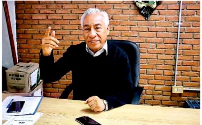
El encargado de este lugar señaló que la infraestructura del plantel también tiene algunas problemáticas. FERNANDO MALDONADO

Se prometió un domo, pero hasta la fecha los resultados han sido nulos. Lo único es la pintadita y de una pintura que se cayó"