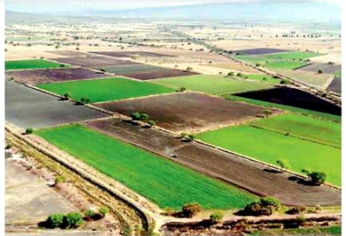
Se procurará el transporte ágil, seguro y adecuado de personas y mercancías en este trayecto.

De esta forma, el Ejecutivo del estado a cargo de Aureoles Conejo, procura el transporte ágil, seguro y adecuado de personas y mercancías en este trayecto, facilitando especialmente el traslado de los productos agrícolas de la región, que distinguen a Micho-