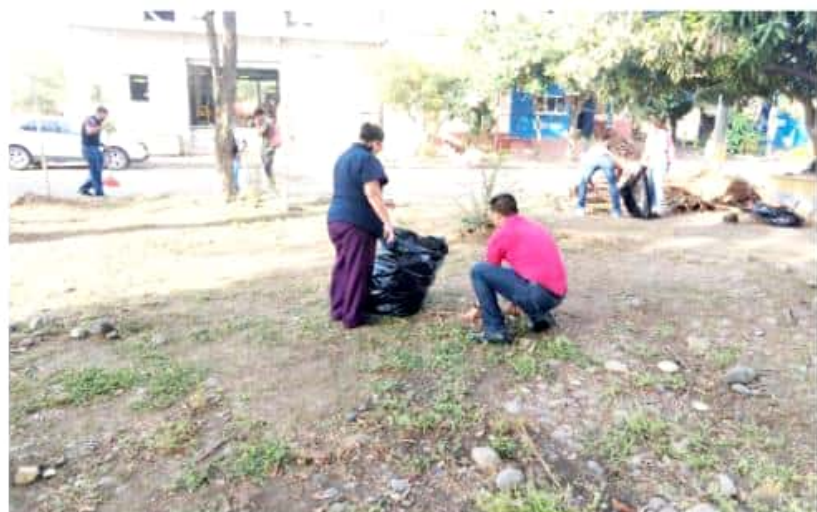
CD. LÁZARO CÁRDENAS, MICH.- Alumnos del Cobaem, realizaron una campaña de limpieza en la Unidad Deportiva Municipal, mientras que comerciantes y enramaderos hicieron lo propio en Playa Jardín.

Durante la campaña, se reiteró en el llamado a la población para que conserve en buen estado las playas del municipio, puesto que con ello evita la generación de enfermedades, principalmente.