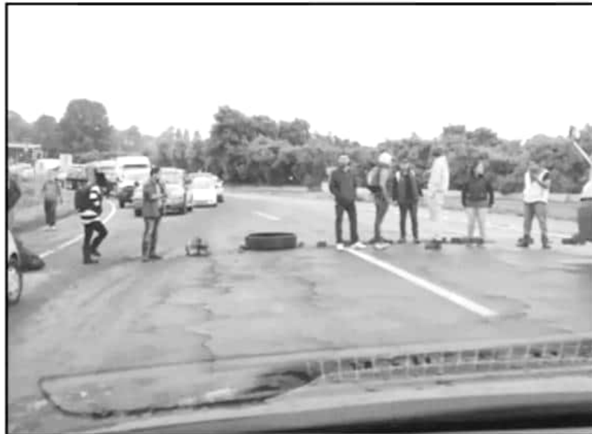
CON OBJETOS COMO PIEDRAS Y LLANTAS, COMUNEROS DE CALTZONTZIN BLOQUEARON LA AUTOPISTA SIGLO XXI.

Por lo anterior, añadieron la semana pasada, los aproximada-