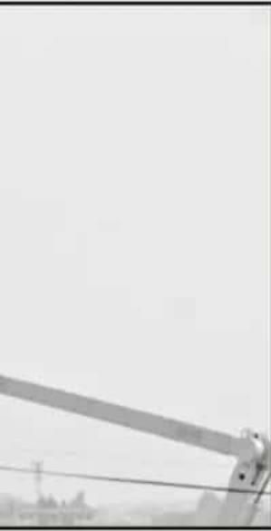
ES SIGUE FALLANDO EL ALUMBRADO.

resulta que no... mbinarias que se... se dejan un can-