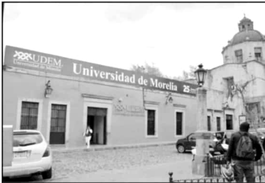
LA UNIVERSIDAD DE MORELIA RENUEVA SU PLAN DE ESTUDIOS PARA LA CARRERA DE ADMINISTRACIÓN DE EMPRESAS.

innovadores como es el de 'neuromarketing', el saber cómo vender un producto o llegar a los consumidores a través de nuevos planteamientos es lo