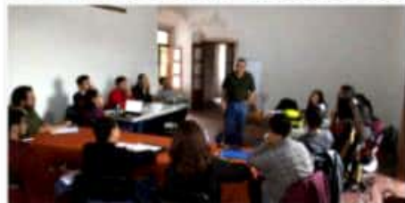
MORELIA, MICH.- Creadores en capacitación.

■ Estructura y Pensamiento Arquitectónico