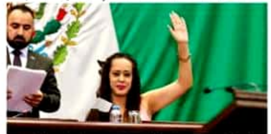
La legisladora afirmó que aportaciones de los jóvenes serán eje total para el trabajo legislativo en materia de juventud.

Por lo que, respaldarán todas las propuestas legislativas que priorice la salud y bienestar de los ciudadanos, como el fortalecimiento de las instituciones. >>> 11