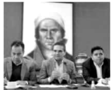
MORELIA, MICH.- El Gobernador del Estado, Silvano Aureoles Conejo, refrendó este jueves el llamado a redoblar esfuerzos para la regularización de las huertas de aguacate establecidas en predios forestales.

torio a partir de 2019, con respaldo del Gobierno Federal.