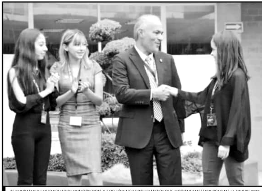
AUTORIDADES EDUCATIVAS RECONOCIERON A LOS JÓVENES ESTUDIANTES QUE ORGANIZAN Y PRESENTAN EL KMUN 2019.

Bajo el modelo KMUN, los debates entre el alumnado se desarrollan mediante representaciones de tres de los seis órganos principales de la ONU y sus res-