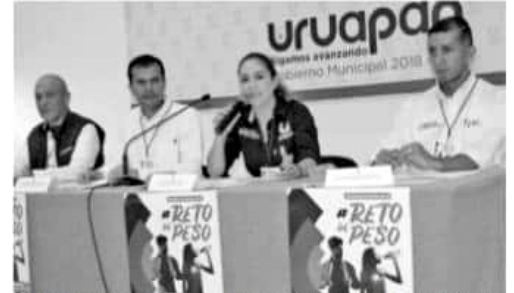
URUAPAN, MICH.- Con el fin de promover hábitos saludables y prevenir enfermedades entre la población, el próximo miércoles 12 de Junio a las 8 horas, se llevará a cabo el programa de activación "Reto de Peso"

Anotó que estas actividades se alinean al Eje 1 del Plan Municipal de Desarrollo, denominado Desarrollo Humano y Social.