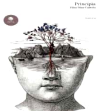
MORELIA, MICH.- Invita El Traspatio a ser parte de la Biblioteca de Escritoras Mexicanas.