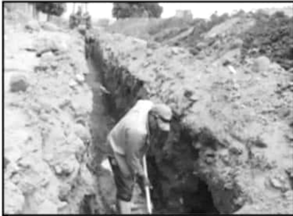
EL AYUNTAMIENTO DE PURUÁNDIRO HA EMPRENDIDO UNA SERIE DE OBRAS PARA MEJORAR Y FORTALECER LA INFRAESTRUCTURA EN TODO EL MUNICIPIO.