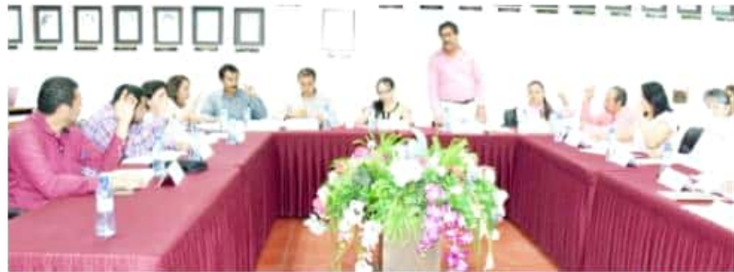
CD. LÁZARO CÁRDENAS, MICH.- Por unanimidad, el Órgano de Gobierno autorizó solicitar a la Conamer la renovación del Prosare.