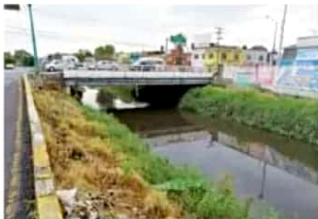
Autoridades mantienen vigilancia en los ríos y drenes de la capital.