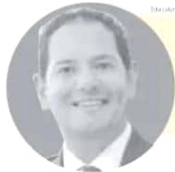
Una columna en línea al portal de vista del autor, se de patrimonio

JESÚS MELGOZA @JESUS_MELGOZAV UNIVERSO ECONOMICO