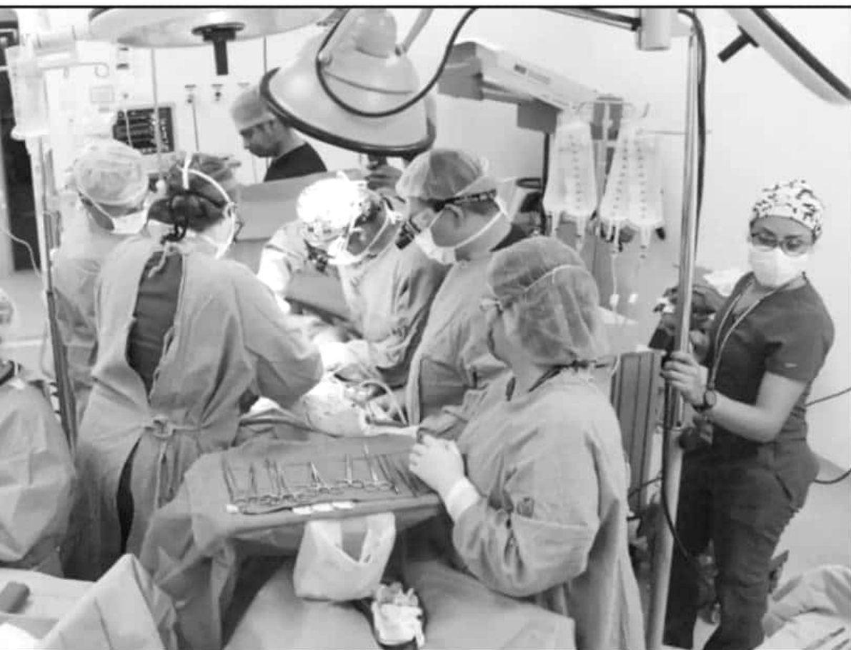
EL CANO DEL SEGURO SOCIAL EN MICHOACÁN REPORTA QUE SE HAN REALIZADO 63 TRASPLANTES; LA CULTURA DE LA DONACIÓN HA SIDO EL PRINCIPAL FACTOR PARA ESTE LOGRO.