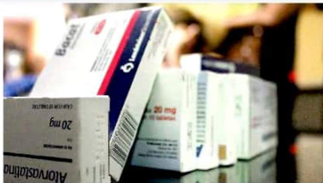
El subsecretario de Salud reconoció dificultades en algunas claves básicas por causas administrativas. MARIANA LLINA

Ramos Esquivel reconoció dificultades en algunas claves básicas por causas administrativas, aun así se atienden los re-