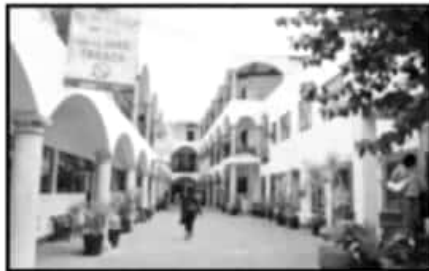
LA FORMACIÓN INTEGRAL DE LOS JÓVENES ES UNO DE LOS OBJETIVOS QUE TIENE COMO BASE LA UDEM.