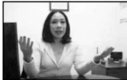
LA DIRECTORA DE LA CARRERA EN ADMINISTRACIÓN DE EMPRESAS DIÓ DETALLES DEL NUEVO PLAN ACADÉMICO.