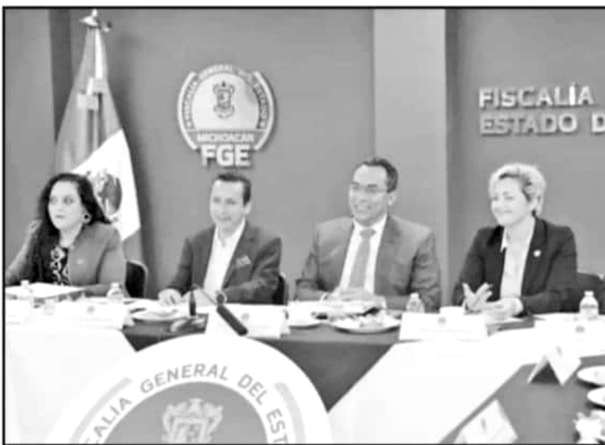
AUTORIDADES DE LA FISCALÍA GENERAL DEL ESTADO PRESENTARON SU REPORTE A 100 DÍAS DE COMENZAR LABORES.

Los legisladores presentaron ante el fiscal un informe respecto a los objetivos que se encuentran en estatus de aprehender en los principales focos rojos de la entidad. Entre las ciudades más afectadas, se encuentran Zamora, la Región de la Tierra Caliente y el municipio de Uruapan, además de la región Costa.