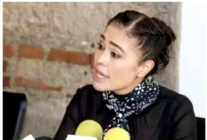
Solicitará una orden de restricción para que no se acerque a ella.

Agregó que ayer (miércoles), cuando salió del Congreso con rumbo al hotel donde sostendría una reunión de trabajo, tal directivo y dos reporteros se "abalanzaron" sobre ella para "hostigarla", pero sólo el primero la siguió hasta el establecimiento, in-