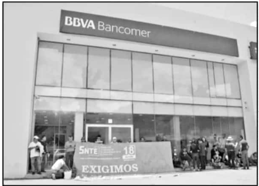
LOS MAESTROS DEL SNTE SEÑALARON QUE DEFINIRÁN SUS ACCIONES SOBRE LA MARCHA; LA TOMA FUE PACÍFICA.

Por ello continuarán en la Avenida Ventura Puente con plantón y seguirán con acciones, como extender el bloqueo hacia la Avenida Acueducto y la presencia de maestros en la Torre Financiera, como se realizó ayer.