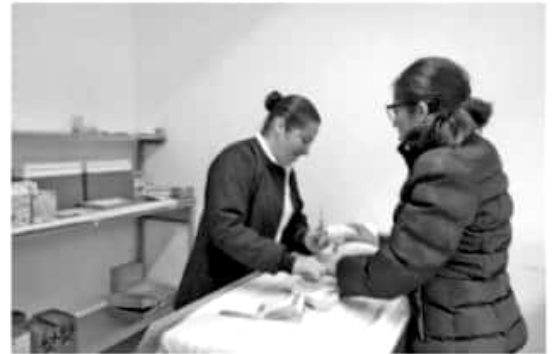
MORELIA, MICH.- Durante 2018, Michoacán rebasó la meta en la aplicación del tamiz metabólico y auditivo neonatal.

Así como, toma de muestras en casos especiales, alimentación, medicamentos, prematuros y transfusiones, envío de información y cálculo de indicadores y protocolo de confirmación y seguimiento de los casos sospechosos en el estado.