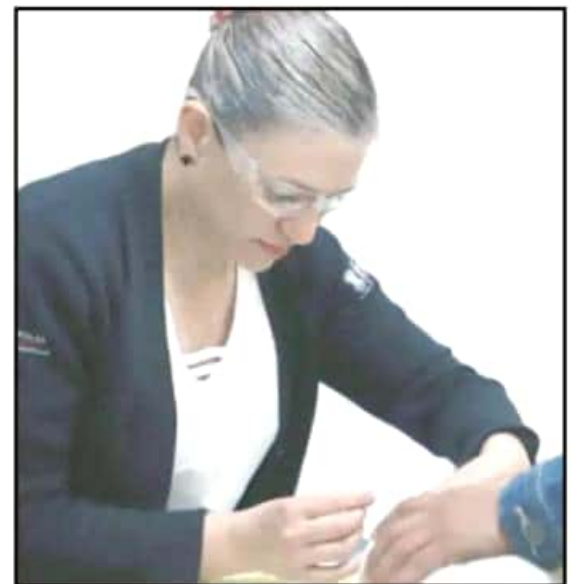
LA PRUEBA SE REALIZA ENTRE EL TERCER Y QUINTO DÍA DE NACIDOS.

INVERTIMOS MÁS DE 2 MIL MILLONES DE PESOS EN EL MEJORAMIENTO DE PLANTELES EDUCATIVOS