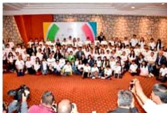
Legisladores locales dieron la bienvenida a los participantes del Primer

Los interesados pueden revisar la convocatoria y requisitos en la página www.congresomich.org.mx/parlamentojuvenil2019 .