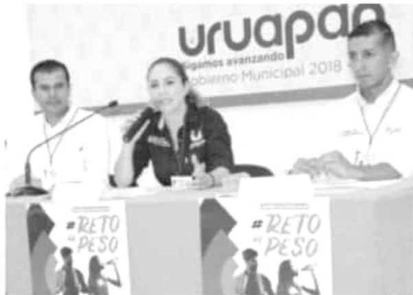
Está programado el 12 de junio, a las 08:00 horas en la Unidad Deportiva, cuya entrada será gratuita.

Kick boxing y de Zumba. La perla del Cupatitzio es uno de los tres municipios michoacanos que participarán en este Reto, junto a Morelia y Lázaro Cárdenas.