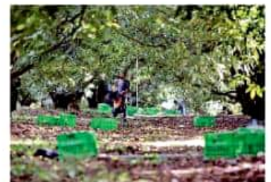
Las zonas de reserva forestal serán atendidas con "Sembrando vida".

"Buscaremos con la Federación un planteamiento para convocar a los productores a que se regularicen y definir áreas vedadas a la plantación de aguacate y espacios donde esta actividad podrá llevarse a cabo", agregó.