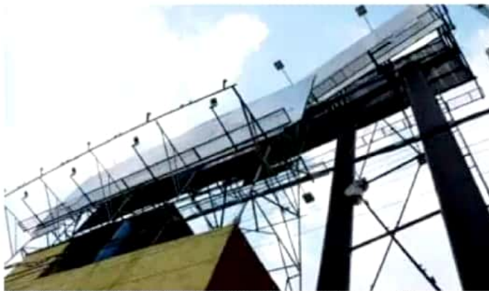
Personal de la Secretaría de Movilidad y Espacio Público mantiene recorridos de supervisión.

Afirmó que hay 600 licencias para anuncios adosados (es decir, que se encuentran fijos ya sea en el techo o entrada del negocio o institución) registrados en todo el municipio, y en lo que va del