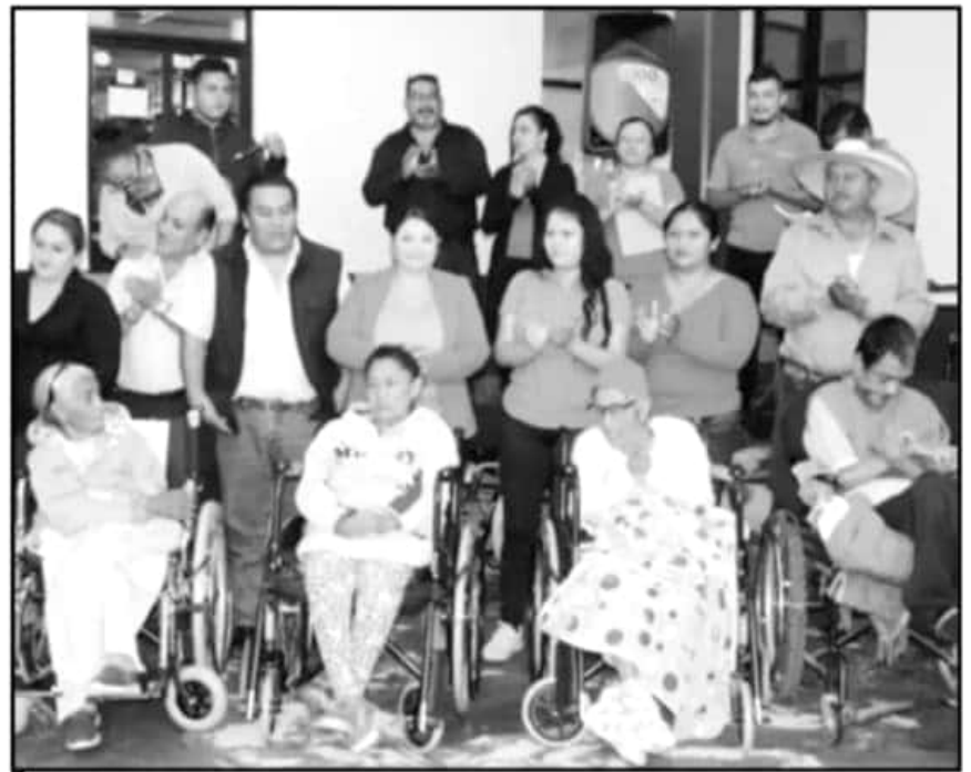
PERSONAL DEL AYUNTAMIENTO DE COPÁNDARO CON ALGUNOS DE LOS CIUDADANOS BENEFICIADOS ESTE JUEVES.

El emotivo acto de entrega de apoyos, entre ellos diez sillas de ruedas, andaderas, bastones y pañales para personas adultas con necesidades apremiantes por su delicado estado de salud y edad, se llevó a cabo en las instalaciones del Palacio Municipal, en el cual la Presidenta Municipal se comprometió a redoblar esfuerzos en bien de la población en condiciones de vulnerabilidad en todo el municipio.