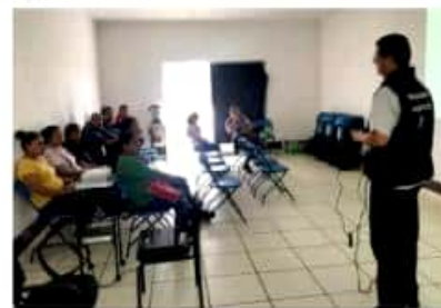
TINGÜINDÍN, MICH.- Autoridades municipales y sanitarias brindaron una capacitación a comerciantes ambulantes.

Finalmente señaló que durante la capacitación se puntualizó que la limpieza de los carros que se emplean para la preparación de algunas comidas deben llevarse a cabo a conciencia para que no se convierta en un foco de infección y contamine los alimentos.