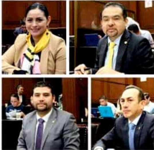
Diputados integrantes del grupo parlamentario del PRD en el Congreso local.