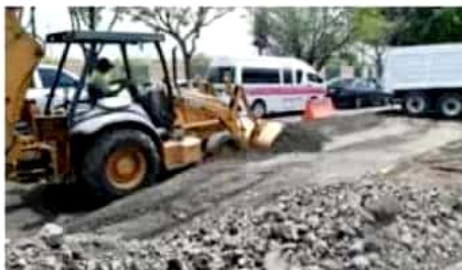
La Secretaría de Urbanismo y Obras Públicas (SUOP) del gobierno de Morelia inició este jueves los trabajos de reencarpamiento de la calle Francisco J. Múgica, y en los siguientes días comenzará con la rehabilitación de la avenida Siervo de la Nación, por lo que se sugiere a la ciudadanía considerar los tiempos de traslado.