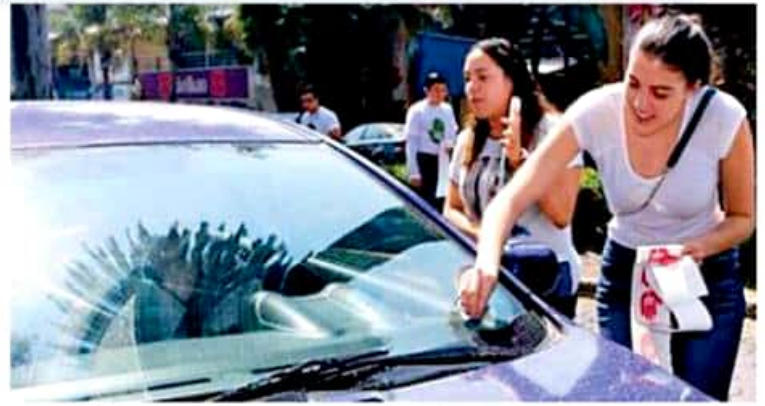
Ante tal situación se relanzará la campaña "Yo no doy mordida".

Consideró que mientras exista una simplificación administrativa, se disminuirá el costo de