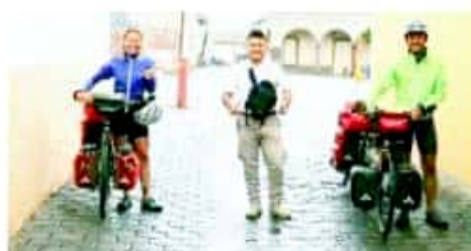
ECUANDUREO, MICH.- Esta cabecera municipal recibió la visita de 2 ciclistas franceses, que conocieron parte de su arquitectura en iglesia y portales del centro, así como la muestra gastronómica con que cuenta.