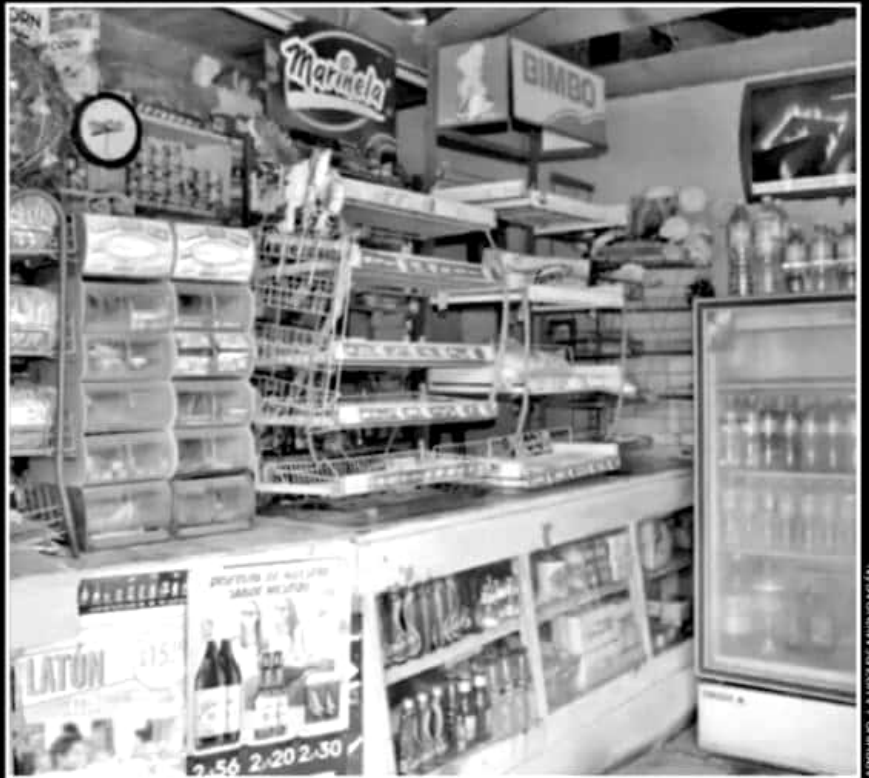
LOS MICRO Y PEQUEÑOS NEGOCIOS, POR SU CAPACIDAD ECONÓMICA, SON LOS QUE MÁS RESIENTEN LA CRISIS.

CONSEJERO CONSULTIVO DE LA CANACOPE-URUAPAN