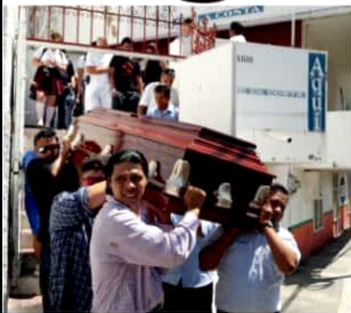
CD. LÁZARO CÁRDENAS, MICH.