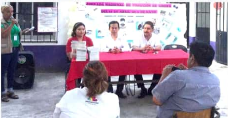
CD. LÁZARO CÁRDENAS, MICH.- El Instituto Nacional de Educación para los Adultos cerró su jornada de donación de libros con objetivos logrados satisfactoriamente.

Y en ello, se llamó a que se visiten las Plazas Comunitarias INEA ya que todas tienen biblioteca, cuyas obras están disponibles para investigación y consulta, que se puede complementar, incluso, usando internet.