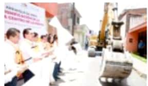
LA PIEDAD, MICH.- El gobernador Silvano Aureoles Conejo da banderazo de arranque a obras de dignificación en el centro de La Piedad, con una inversión de casi 20 mdp.

"Estamos trabajando de la mano con la sociedad, haciendo obras con el respaldo de su gobierno señor gobernador, trabajando sin colores, ni distinciones, con el firme objetivo del bienestar de los y las piedadenses", expresó. Durante su visita al municipio, el titular del Ejecutivo Estatal, realizó un recorrido de supervisión en el Boulevard Lázaro Cárdenas, donde comprometió que, una vez resuelto el tema de la nómina educativa, contribuirá con el Ayuntamiento para concluir esta obra a la brevedad.