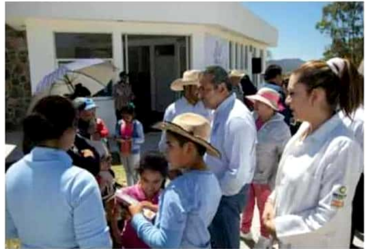
Raúl Morón destacó las acciones que se han realizado en sus primeros meses de gobierno.

Anunció que en próximos meses se abrirá, en alguno de los 24 Centros del Bienestar de Morelia, la primera Escuela Municipal para Adultos, en la que se impartirá educación primaria y secundaria a adul-