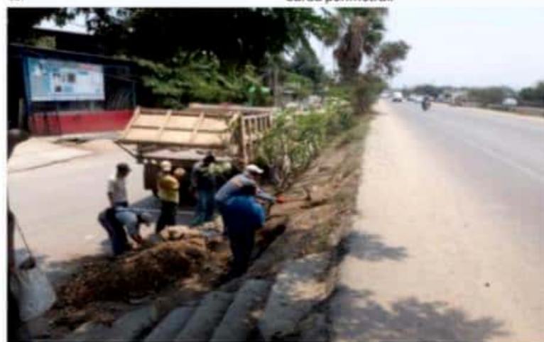
CD. LÁZARO CÁRDENAS, MICH.- La Secretaría de Obras Públicas y Desarrollo Municipal, apoyó con mano de obra la construcción de una escalera de uso peatonal para la calle José María Morelos, colonia Aeropuerto.

Dichos trabajos, recordó, consisten en mejorar el campo de fútbol, rehabilitar una cancha de usos múltiples y dotar de una cancha de fútbol rápido. De igual manera, se proyecta un gimnasio al aire libre, estacionamiento, pasillos, gradas y barda perimetral.