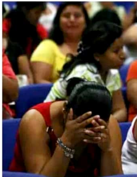
El número de mujeres que tendrían que regresar a los hogares donde han sufrido violencia podría alcanzar 100 al mes.