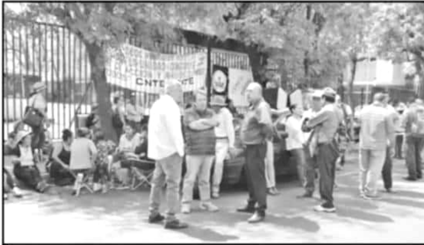
PROFESORES DE LA COORDINADORA ESTUVIERON DURANTE LA MAÑANA EN LA SECRETARÍA DE FINANZAS.