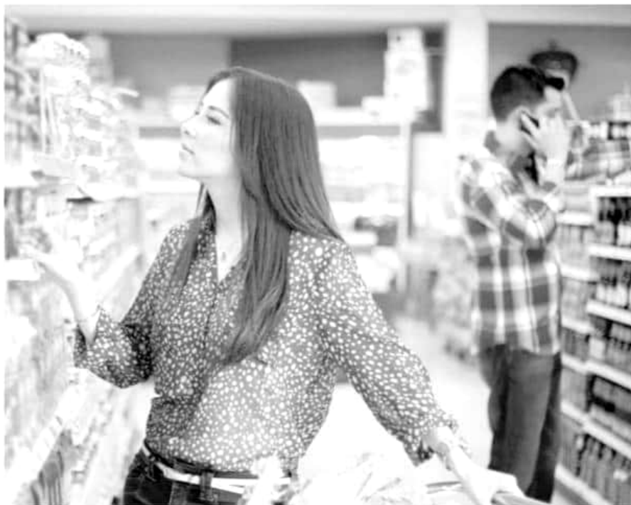
La confianza del consumidor creció 10.2 puntos respecto de abril del 2018.

Pese a la disminución de la confianza, los hogares continúan con altas expectativas sobre el futuro. En lo que más con-