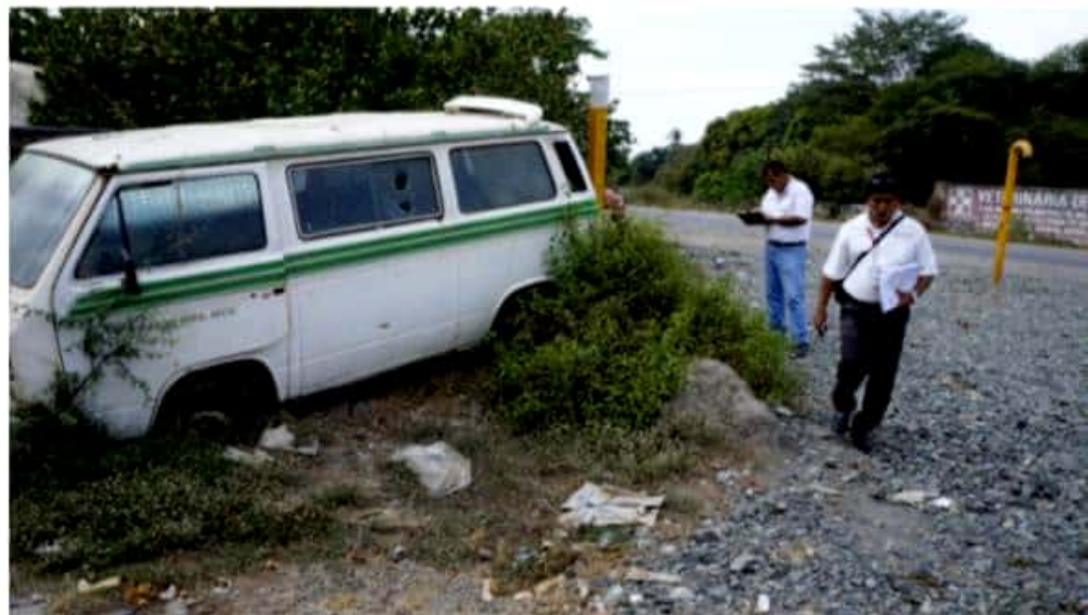
CD. LÁZARO CÁRDENAS, MICH.- Reglamentos Municipales y en coordinación con la delegación estatal de Tránsito alistan un operativo para el retiro de vehículos chatarra, así como del mobiliario que se encuentre abandonado o colocado en la vía pública.

Por otro lado, expresó que no se ha tomado una decisión de con quién harán alianza, lo que sí está decidido en la línea política es que deben ir de manera prioritaria como partido político a las fuerzas progresistas.