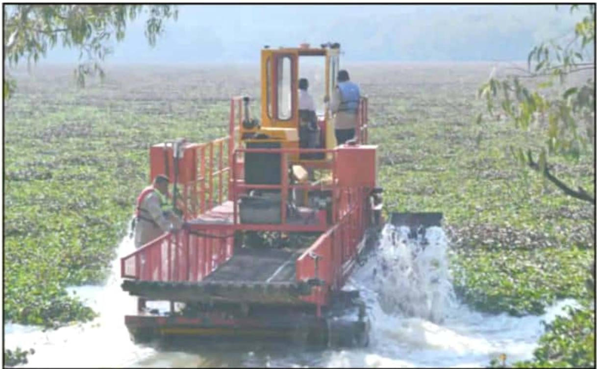
HACE DOS MESES INICIARON LAS LABORES DE LIMPIEZA EN LA PRESA, SIN EMBARGO, NO SE CUMPLIERON LAS ETAPAS Y SIGUE INVADIDA POR EL LIRIO.

Incluso, durante un recorrido la mañana del lunes por el