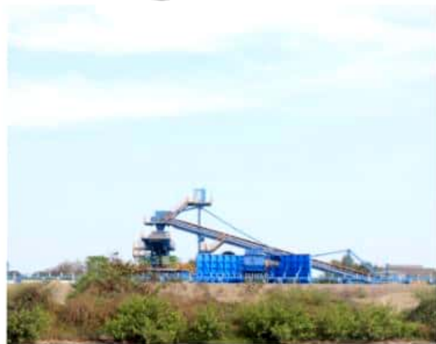
CD. LAZARO CÁRDENAS, MICH.- CFE inició operaciones en la Terminal de Minerales a Granel maniobrada por la empresa Terminales Portuarias del Pacífico.

El Puerto Lázaro Cárdenas es fundamental para las estrategias de inversión y la apertura de mercados en desarrollo. Con el arribo de diversos tipos de carga, el recinto cuenta con la tecnología, la calidad y los servicios para operar de manera más eficiente cualquier clase de mercancía.