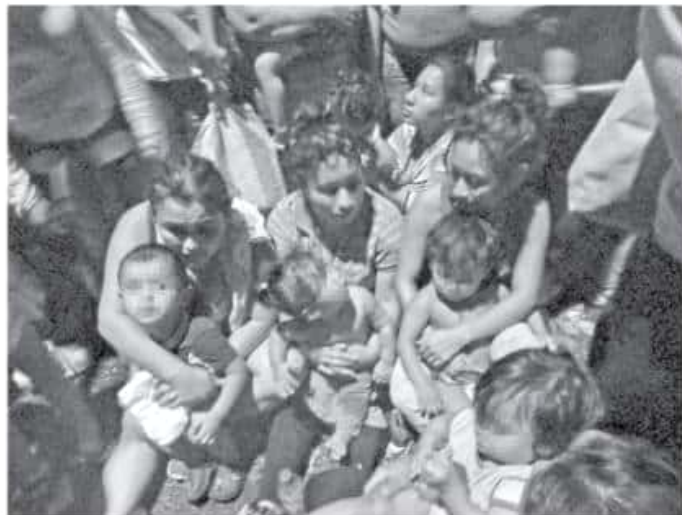
El alojamiento tiene un protocolo de atención en el cual las víctimas pueden acudir para resguardarse de una situación de violencia.