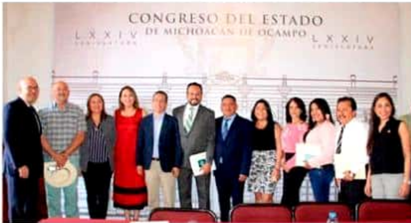
El Congreso del Estado, a través del Comité Organizador, invita a participar a niñas y niños de Michoacán que cursen el quinto o sexto grado de educación primaria, en escuelas públicas y privadas.

Morelia; Michoacán, 06 de mayo de 2019.- Con la finalidad de darle voz a las generaciones de niñas y niños michoacanos y con ello, fortalecer la unidad entre Instituciones de gobierno y sociedad, la 74 Legislatura, instaló el Comité Organizador del Primer Parlamento Infantil del Estado de Michoacán 2019.