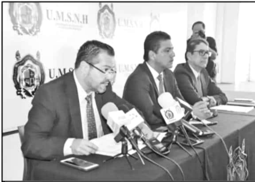
EL RECTOR NICOLAITA Y OTROS FUNCIONARIOS OFRECIERON UNA RUEDA DE PRENSA SOBRE LA SITUACIÓN ACTUAL.

trición, de igual forma no se logró acreditar la carrera de Ingeniero Agrónomo Horticultor, que se oferta en Apatzingán.