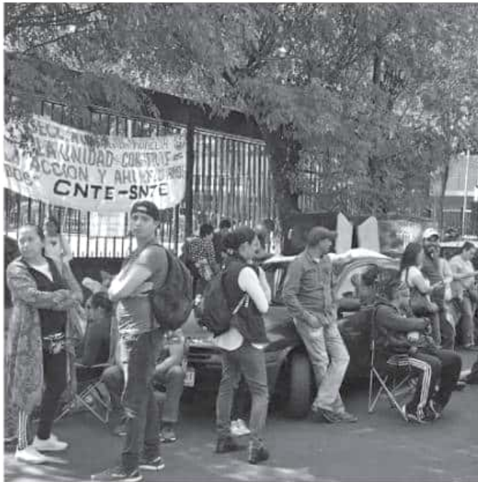
Gobierno estatal tiene pendientes económicos con mil 200 trabajadores.