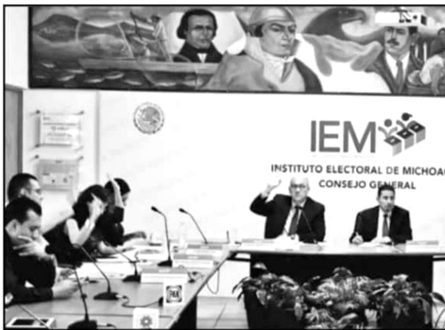
EN LA SESIÓN DE ANOCHÉ, EL IEM RATIFICÓ LAS MULTAS A PARTIDOS QUE HABÍA IMPUESTO EL INE POR IRREGULARIDADES.

equivalente al 100 por ciento del monto involucrado.