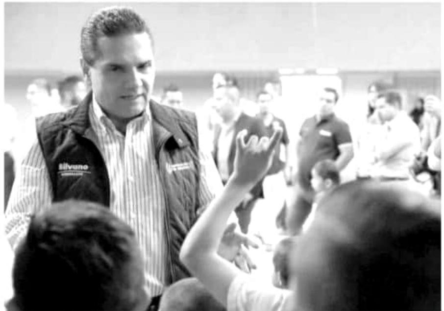
El gobernador Silvano Aureoles Conejo.

El presidente municipal de La Piedad, Alejandro Espinosa, reconoció y agradeció el compromiso del gobernador, por brindar el apoyo necesario al municipio