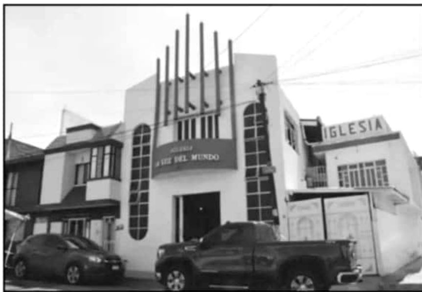
LA LUZ MUNDO NO TIENE TANTOS FIELES EN MICHOACÁN, AUNQUE NO TODOS LOS TEMPLOS ESTÁN DADOS DE ALTA.

"Estas 152 que tenemos en Michoacán, muchas de ellas cubren a otras iglesias pequeñas, les dan cobertura. Si quisiéramos hacer un recuento de templos, lugares de