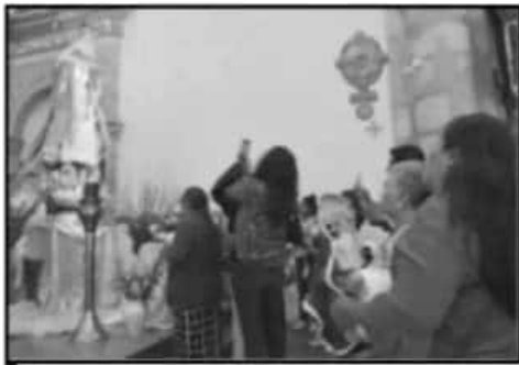
LAS RELIGIONES CON RAÍCES EN EL CATOLICISMO Y CRISTIANISMO, PROPIAMENTE, SON LAS QUE TIENEN MÁS DEVOTOS.