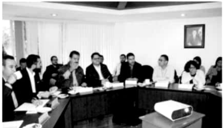
MORELIA, MICH.- El Gobierno de Michoacán, a través de la Secretaría de Medio Ambiente, Cambio Climático y Desarrollo Territorial (Semacddet), integró 30 proyectos de obra de infraestructura y servicios a realizar en las tres Zonas Metropolitanas.

Agregó que, una vez definida la cartera, se presentará ante la Secretaría de Finanzas y Administración (SFA), a fin de que la instancia continúe el proceso, que implicará la valoración de la pertinencia y la viabilidad de las acciones, para su dictaminación. La expectativa es lograr captar la mayor cantidad de financiamiento procedente del Fondo Metropolitano de la Federación, para maximizar el impacto positivo en las tres zonas metropolitanas que en Michoacán se encuentran reconocidas por ésta.