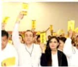
promiso de cerrar filas, trabajar cerca y de la mano de la gente, en las plazas públicas y en cada sitio en donde la necesidad y la

problemática social no se diluyen tras la visión de escritorio, elaborada en oficina.