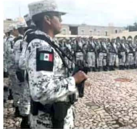
El despliegue de los elementos implicará gastos para el gobierno federal, señaló el presidente del Consejo Coordinador Empresarial.

"Yo he escuchado que el gobierno del estado les ha abierto las puertas de estas bases de operaciones mixtas en los municipios; creo que son ocho o