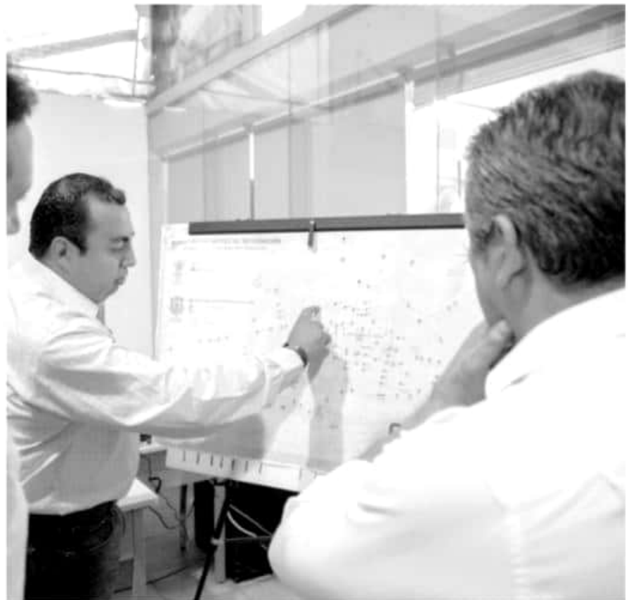
El alcalde Raúl Morón, acudió al Centro Integral de Semáforos Morelia, donde constató el mantenimiento de software, actualización de tecnología, refacciones, modernización de detectores vehiculares e inclusión de cruceros, los puntos a reforzar.

Actualmente, la administración municipal tiene el control de 142 intersecciones con semáforos, los cuales recientemente modificaron su sistema de iluminación por tecnología led, lo que ha generado ahorros de hasta el 70 por ciento en el consumo de energía.