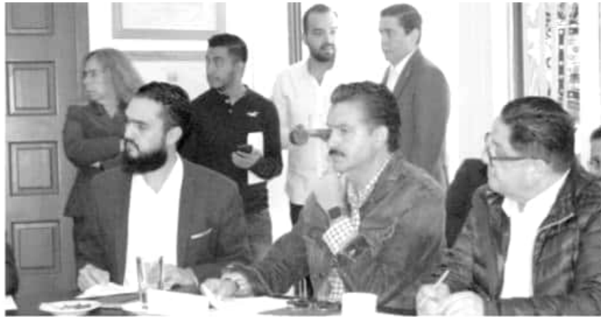
Un total de 30 proyectos de obra de infraestructura y servicios con un presupuesto superior a los 3 mil millones de pesos, busca obtener el gobierno de Michoacán de la Federación a través del Fondo Metropolitano.