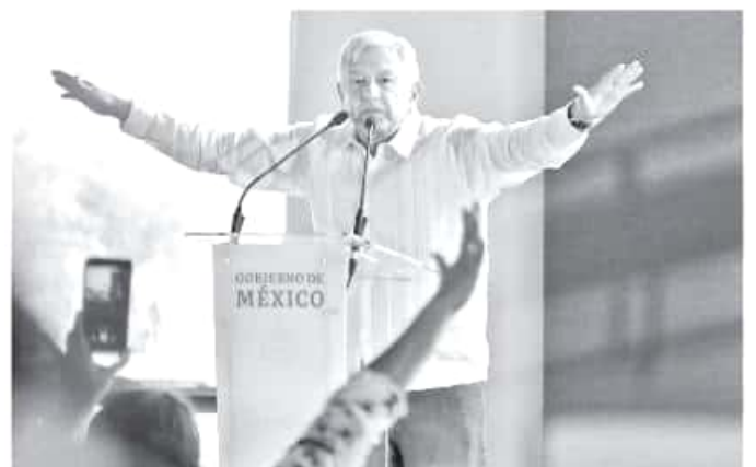
El Presidente visitará los nosocomios de Tierra Caliente.