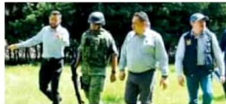
Autoridades municipales se reúnen coordinando con los agentes.

Indicó que ya fue autorizada por el Cabildo la donación de un terreno situado al norte de la ciudad, rumbo a la salida a Paracho, que se solicitó para la edificación del cuartel de la Guardia Nacional, obra que iniciará en