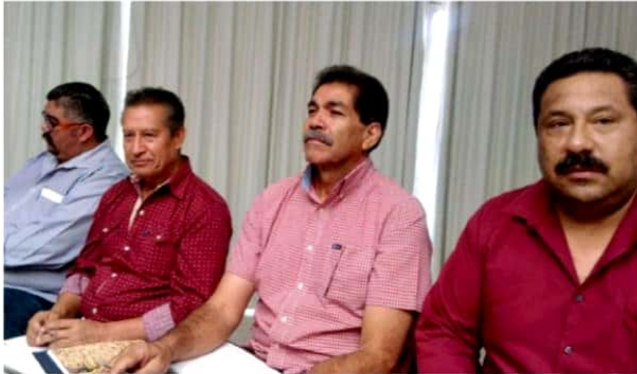
Los jefes de CADER en la región fueron removidos de sus cargos.