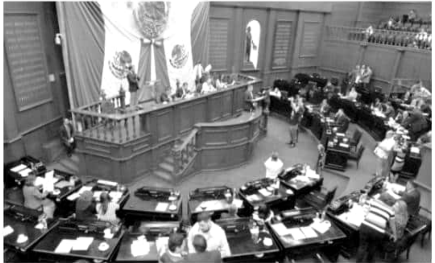
Aspecto de una sesión en el Congreso del Estado.

Refirió que actualmente la ley contempla un periodo de 60 días hábiles para que la comisión dictamine una propuesta, pero además puede solicitar una ampliación del plazo por otros 60 días, en el mejor de los casos, por que de no ser así la propuesta se queda sin dictaminar, es decir en «La