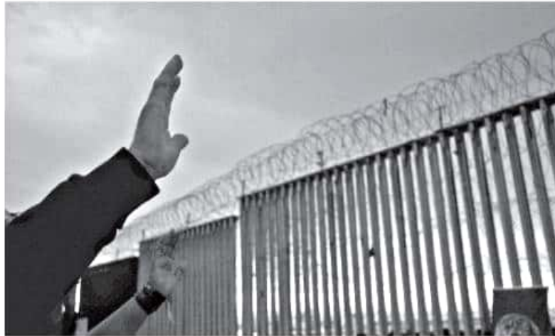
Los paisanos michoacanos organizados no tendrán acceso a recursos para apoyar iniciativas productivas o de infraestructura.