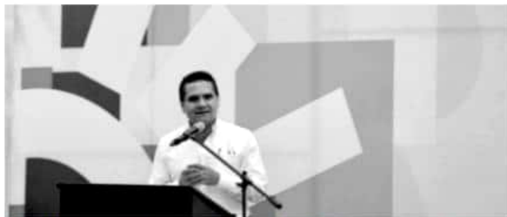
MORELIA.- El Gobernador Silvano Aureoles señaló que es imposible que Estado y municipios asuman los gastos de operación de los elementos de la Guardia Nacional

los 4 mil 600 elementos que serán movilizados en la entidad como parte de la estrategia federal contra la inseguridad. Durante una entrevista con los medios, el titular del Ejecutivo manifestó que su gobierno ha puesto a disposición de la Guardia Nacional las instalaciones de los 9 cuarteles regionales para que los elementos sean instalados. Recordó que cuando el gobierno solicitó el apoyo de las fuerzas castrenses, el gobierno pagó por los gastos de movilización y permanencia de las fuerzas militares, pero ahora la situación es distinta, porque no hay recursos.