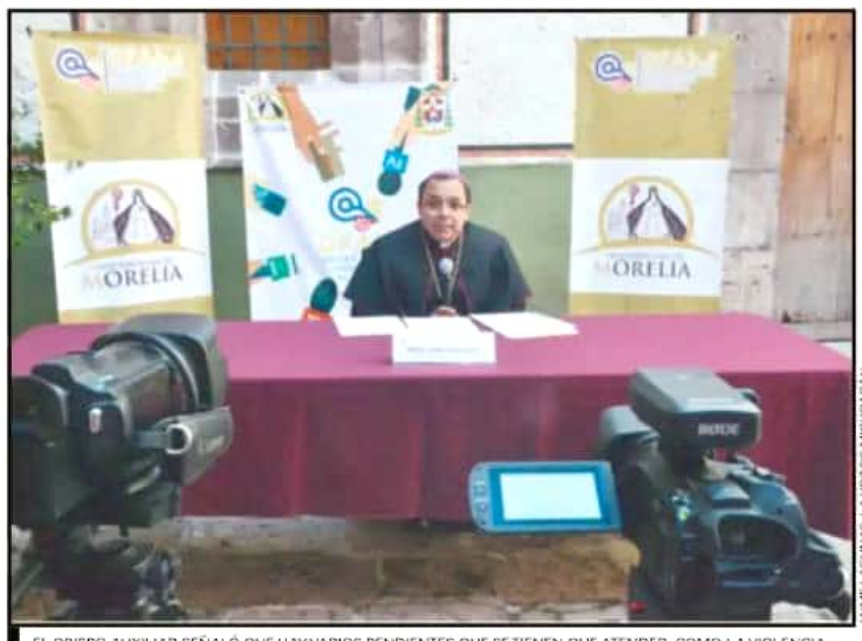
EL OBISPO AUXILIAR SEÑALÓ QUE HAY VARIOS PENDIENTES QUE SE TIENEN QUE ATENDER, COMO LA VIOLENCIA.

“Las mayorías que votaron necesitan quedar satisfechas con los resultados, y las minorías que pensaban de otra manera también necesitan ser convencida de que el camino que se lleva en el país es el mejor”, dijo el obispo auxiliar, quien tras su regreso de labores en Colombia consideró que Michoacán vive una situación “muy semejante” a ese país, conocido a nivel internacional por figuras del crimen organizado.