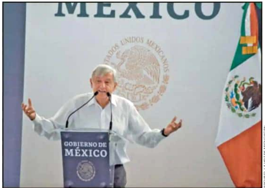
LA TERCERA VISITA DEL MANDATARIO NACIONAL FUE APENAS DURANTE LOS PRIMEROS DÍAS DEL PASADO MES DE ABRIL.