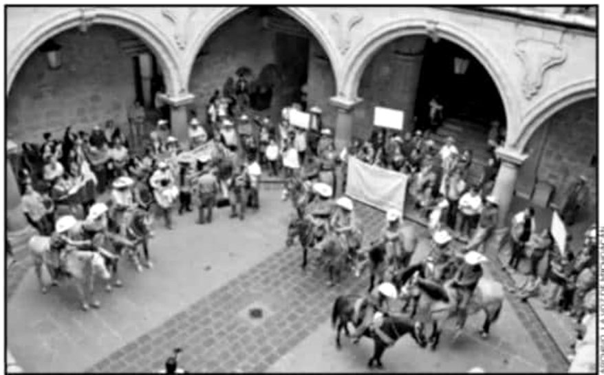
EL PASADO 17 DE JUNIO HABITANTES DE JESÚS DEL MONTE PROTESTARON CONTRA LA PRIVATIZACIÓN DE MANANTIALES.

URÓLOGO JORGE BARBA UNAM D.G.P. 660385 S.S.A. 84288