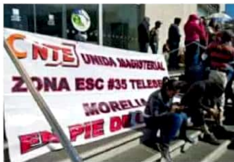
El líder de la CNTE advirtió que estarán listos para iniciar acciones si no se les paga a los maestros.

Mientras se llevan a cabo las obras, los habitantes de las colonias señaladas contarán con apoyo de pipas, sin costo; sólo deberán llamar al teléfono 1132200, para programar su envío. MIMORELIA