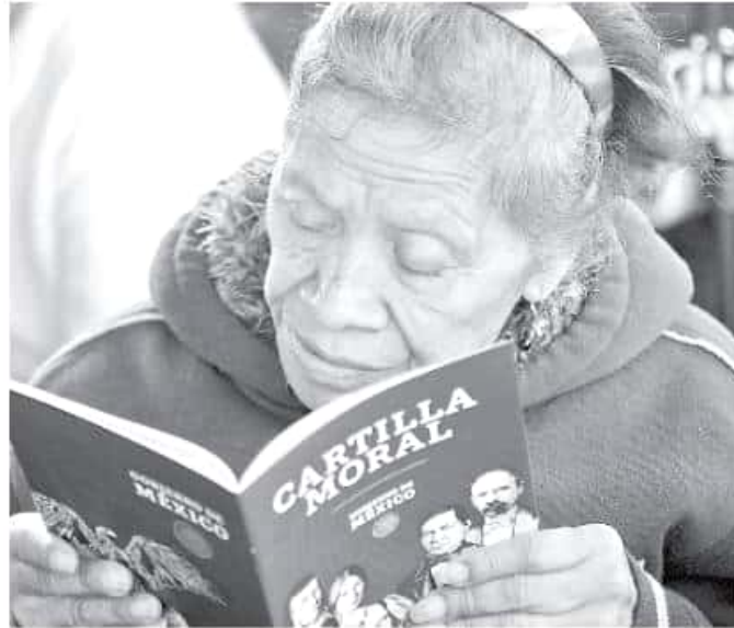
El texto escrito por Alfonso Reyes, fue presentado recientemente por el presidente Andrés Manuel López Obrador. CUARTOSURDO

"No tenemos ningún problema en trabajar en unidad con nuestros hermanos de otras Iglesias... creo que estas cartillas pueden servir; cualquier iniciativa que vaya en la línea del bien común y de crear una ética que nos lleve a ser mejores personas lo podemos apoyar", aunque dijo esperar que exista la apertura para que las otras religiones se sumen a este esfuerzo