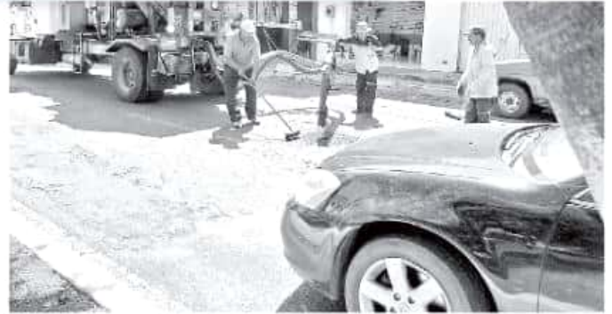
A decir de las autoridades, los trabajos de obra en curso y las brigadas de bacheo no han cesado. MARIANA LUNA

El tiempo de respuesta a cada una de las solicitudes es variable ya que se toman en consideración diferentes aspectos como el tipo de intervención que requiere la vialidad (bacheo, riego de sello o repavimentación), el número de solicitudes que hay para una sola vía y la cantidad de tráfico en circulación, según señaló el titular