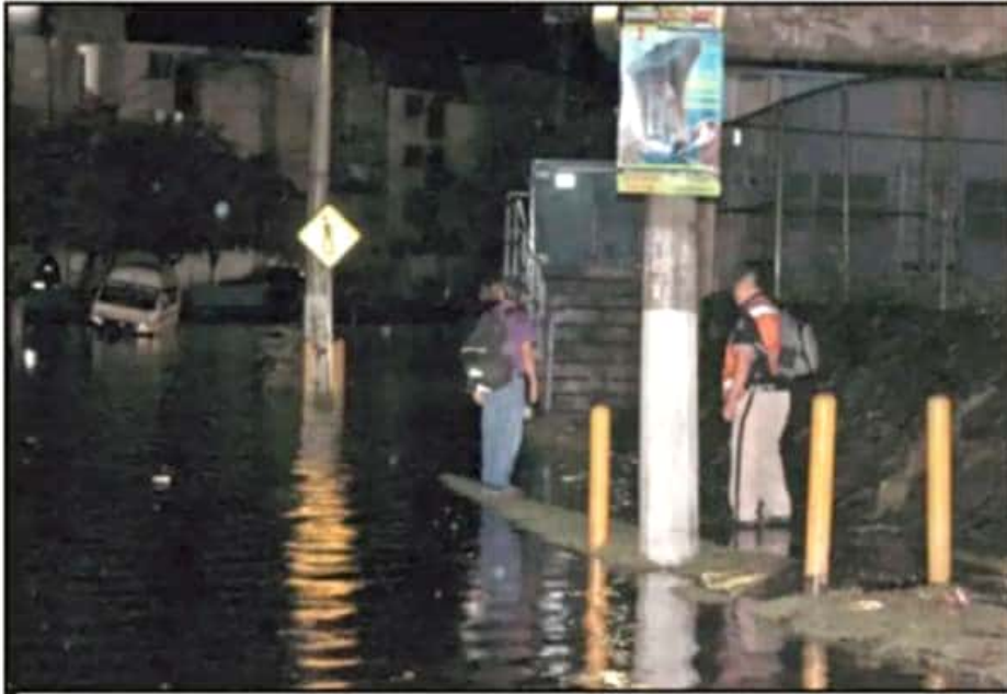
VARIAS CALLES QUEDARON ENCHARCADAS, PERSONAL DEL PROTECCIÓN CIVIL SE DESPLAZÓ DESDE LA MADRUGADA.

PROTECCIÓN CIVIL YA ATIENDE Y EVALÚA LA PROBLEMÁTICA TRAS LA FUERTE TROMBA