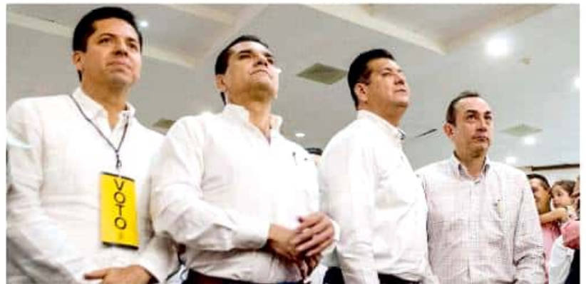
El también fundador del PRD se dijo dispuesto a revisar la eficiencia en la que operan los titulares de algunas dependencias para quitar a quienes no dan resultados. CARMEN HERNÁNDEZ

“Se requiere de entrega y pensando en el proyecto político, si no hay que ayudarles... a que se vayan, nadie los tiene a fuerzas, porque todavía hay quienes se pasan de la raya y hasta nos echan chingadazos: ‘pinche Silvano culero’, no se puede así”, recriminó el mandatario estatal durante la sesión del X Consejo Estatal, en la que precisamente se encontraba más de un docena de funcionarios