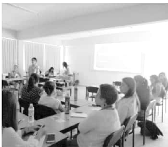
El IMCED inició la oferta de sus diplomados de capacitación a docentes.

Son nueve diplomados los que se encuentran abiertos en estos momentos, ofrecidos principalmente a profesionales del sector educativo, profesores que