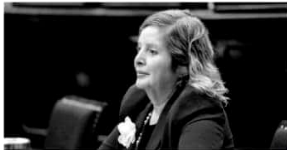
Coadyuvará GP de Morena en despliegue de apoyos a jóvenes estudiantes.

Dijo que como representante de la Cuarta Transformación en la LXXIV Legislatura buscará siempre el bienestar de las y los jóvenes estudiantes de Michoacán, a través de los apoyos que han