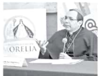
El prelado mencionó que el evangelio invita a la conversión. MARIANA LUNA

"Las terapias de conversión no son guiadas por investigaciones científicas o