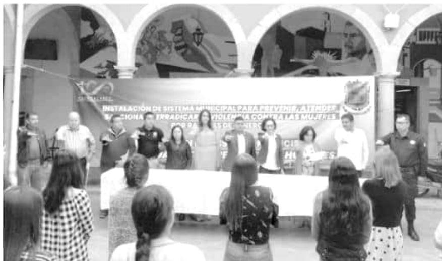
El objetivo es lograr la instalación en los 113 municipios, ya que se trata de acciones integrales en beneficio de la sociedad en general, Seimujer.

A tres años de la Declaratoria de Alerta de Violencia Género en contra de las Mujeres (AVGM), es la primera ocasión que se logra la instalación de estos mecanismos municipales, indicó la titular de la Secretaría de Igualdad