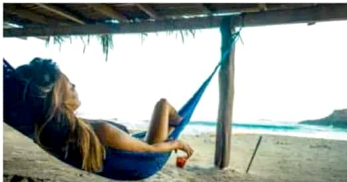
Las playas se ubican en los municipios de Lázaro Cárdenas, Aquila y Coahuayana.

En entrevista, informó que el mes pasado la Comisión realizó las inspecciones y los muestreos, como cada año durante los tres periodos vacacionales, en 16 puntos de 12 playas michoacanas que se ubican en los municipios de Aquila, Coahuayana y Lázaro Cárdenas. Los resultados indicaron que todas son