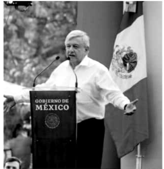
MORELIA, MICHOACÁN.- El presidente de la República Mexicana, Andrés Manuel López Obrador, supervisará el siguiente fin de semana cinco hospitales de Michoacán como parte de la gira de trabajo que realiza en todo el país.

Bienestar en el Estado de Michoacán, resaltó que "como nunca se está atendiendo al pueblo, sobre todo a la gente humilde, a la gente pobre", es por ello la importancia de que el presidente de México escuche de primera mano las inquietudes de la población, de los derechohabientes y de los trabajadores de salud.