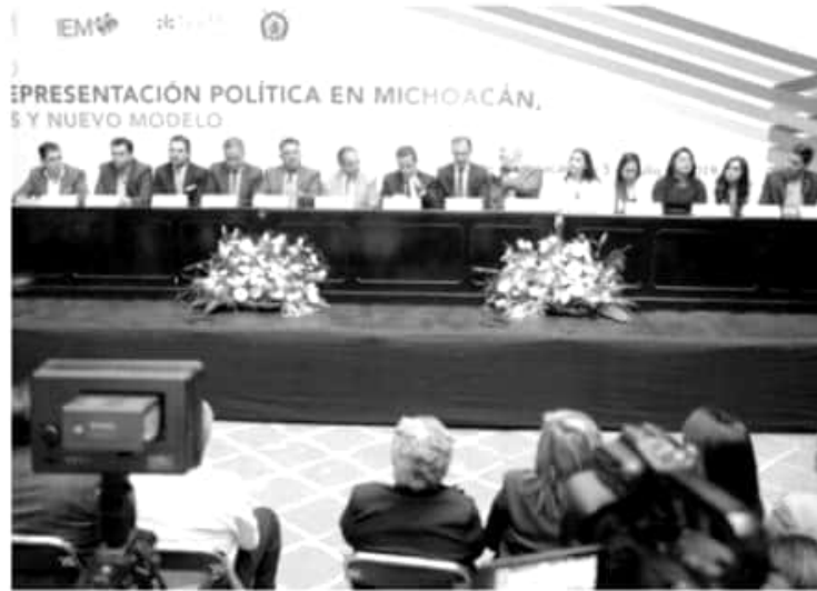
A finales de la semana pasada, durante jueves y viernes, se llevó a cabo un foro sobre «La Representación Política en Michoacán. Retos y Nuevo Modelo».

En base a la demanda presentada por la comunidad de San Benito de Palermo en