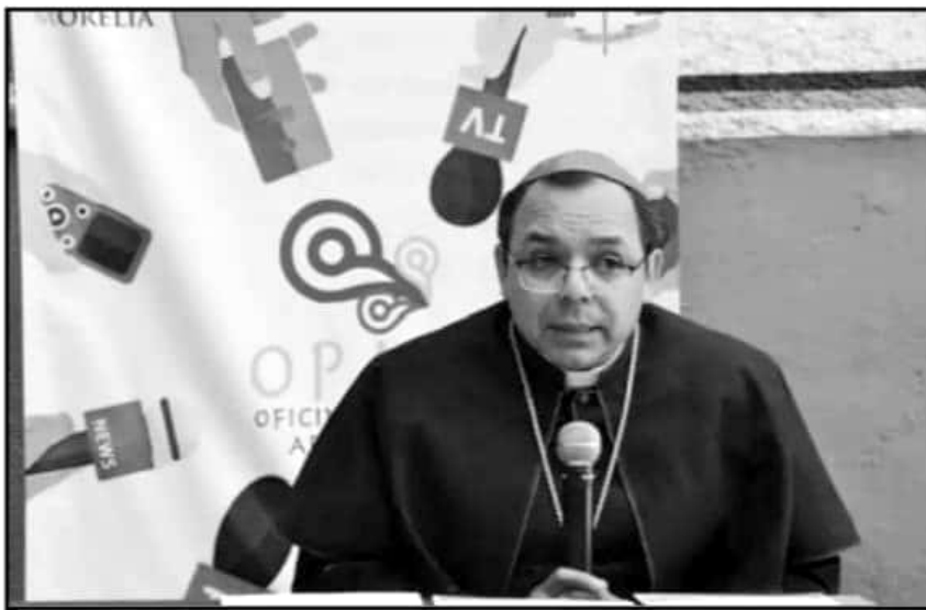
PESE A LA CONTROVERSI QUE HAN CAUSADO ESTE TIPO DE DECLARACIONES, LA IGLESIA CATÓLICA OFRECE 'AYUDA'.

"La Iglesia nunca ha marcado con etiqueta y condenado, la Iglesia tiene una atención pastoral para las personas que viven esas situaciones, los invita al cambio, los invita a la conversión. Yo no estuve en esa conferencia y yo no me atrevería tampoco a expresar un punto de vista sin haber estado, pero lo que yo vi y yo supe es que hubo la apertura de que la Inmaculada pudiera tener esa conferencia y la Iglesia lo pone a disposición de cualquier persona, siempre y cuando vayan las cosas para bien de la comunidad, no tenemos por qué excluir ni por qué etiquetar. Si hay un cambio y una conversión, bendito sea Dios", respondió el líder católico en conferencia de prensa, tras ser cuestionado sobre si durante el evento se llevaron a cabo "terapias de conversión", que son intervenciones con las que se busca cambiar la identidad u orientación sexual de una persona.