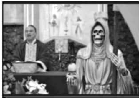
LA VARIEDAD DE CULTOS ES ALTA EN EL ESTADO, SE CUENTAN MÁS DE 150 REGISTRADOS EN FORMA ANTE LAS AUTORIDADES.