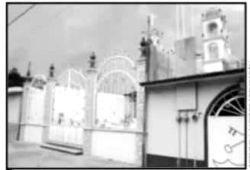
EN MICHOACÁN, LA ENORME MAYORÍA DE LOS HABITANTES PROFESA ALGUNA RELIGIÓN, POR LO QUE HAY MILES DE TEMPLOS.

RELIGIÓN LA MITAD NO CUENTA CON REGISTRO EN EL ESTADO