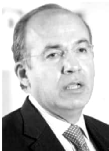
Felipe Calderón Hinojosa.