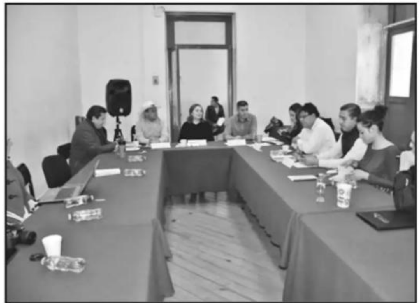
LEGISLADORES LOCALES SE REUNIERON A FIN DE TRAZAR LA AGENDA QUE PERMITA MEJORAR SERVICIOS DE SALUD.

Todo lo anterior con el propósito de mejorar las condiciones de los centros educativos de la ciudad y con ello motivar el desarrollo de los jóvenes morelianos brindándoles espacios dignos para el aprendizaje, así como reiterar el compromiso del Ayuntamiento de Morelia con el sector educativo y la labor docente en la capital del estado.