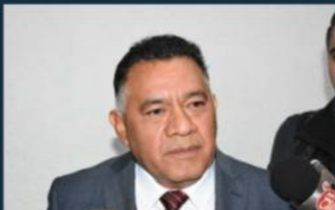
MORELIA, MICH.- Morelia presenta iniciativa de decreto para modificación de Ley de Procedimientos Legales.

La iniciativa también contempla que la obligatoriedad de las sesiones sea de al menos dos veces por semana, con el fin de hacer eficiente el trabajo legislativo, pues mencionó son más de 200 iniciativas las que están en la congeladora de las diversas comisiones, sin embargo, muchas de ellas no han progresado porque simplemente las sesiones de las comisiones que tienen la obligación de desahogarse no se reúnen o posterga las reuniones por falta de quórum.