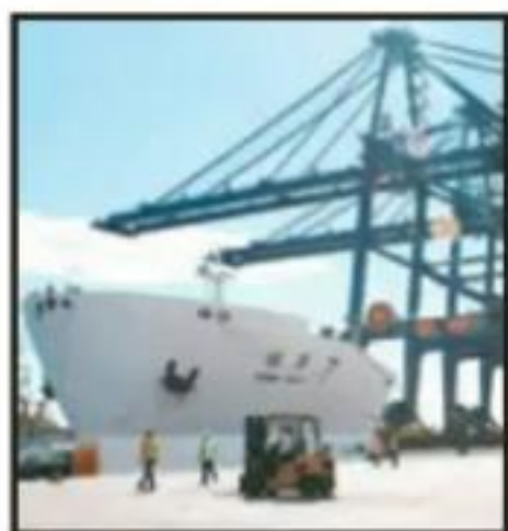
MÉXICO CUENTA CON SERVICIOS LOGÍSTICOS PARA EL COMERCIO.