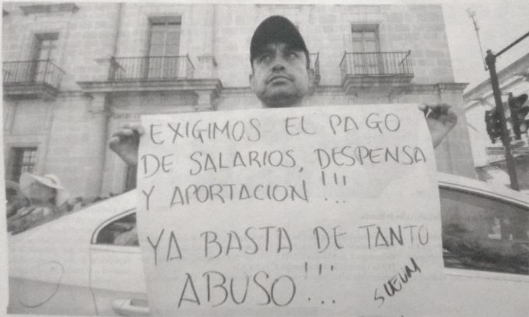
Demandas de trabajadores.

Finalmente, el rector de la UMSNH reiteró su compromiso de seguir gestionando los recursos extraordinarios faltantes para el cierre del presente año, incluyendo la aportación de depósito y el 40 por ciento no cubierto de la primera quincena de octubre de 2018.