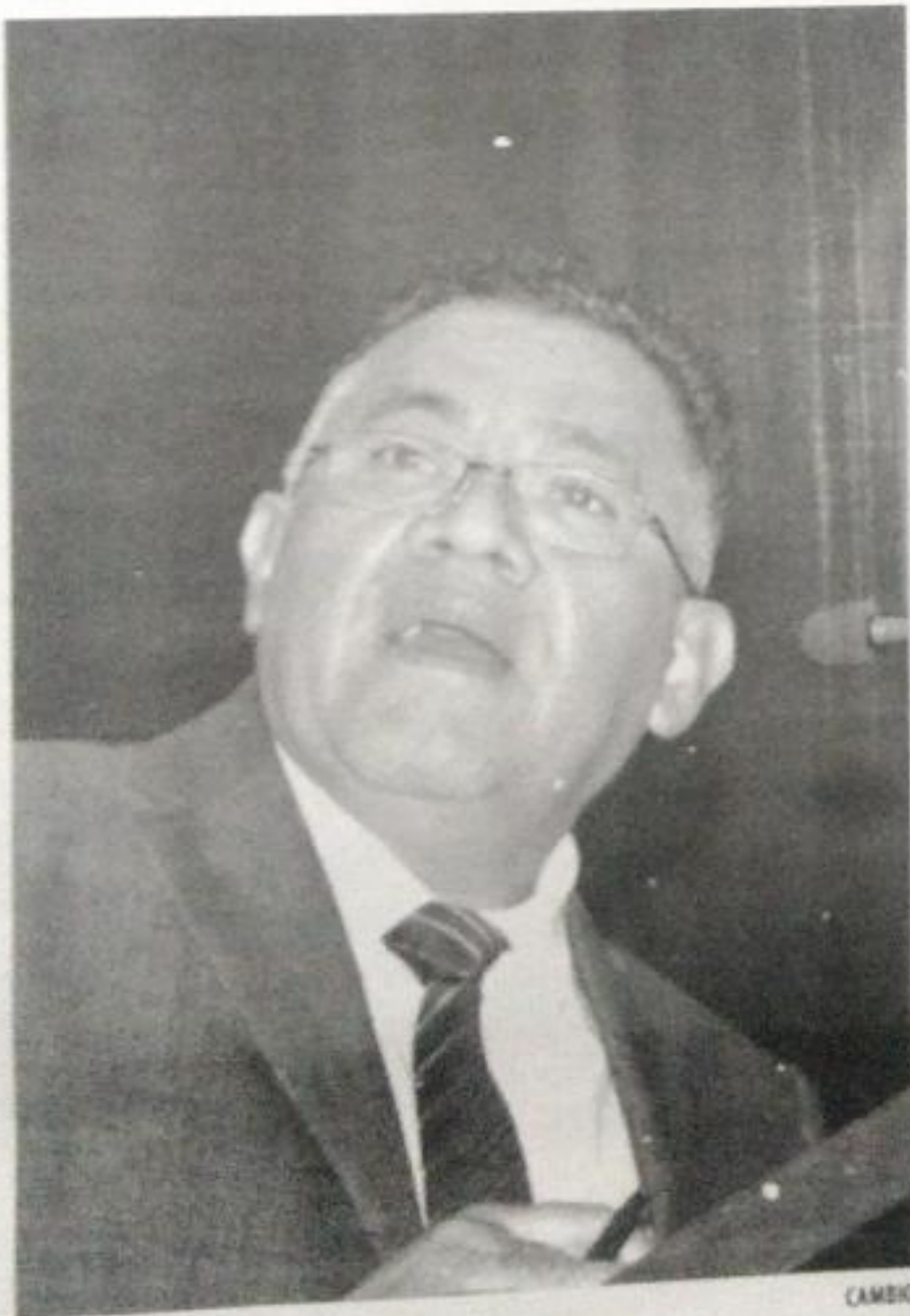
Fermin Bernabé Bahena, diputado del Distrito X de Morelia.