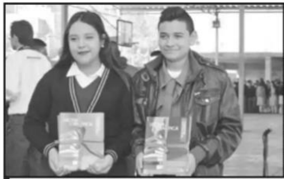
A TRAVÉS DE LA LECTURA BUSCAN QUE ALUMNOS DE NIVEL SECUNDARIA EN TODO EL ESTADO SE INTERESEN MÁS EN LA INVESTIGACIÓN CIENTÍFICA.

Sobre la queja ante la Comisión Estatal de los Derechos Humanos, Tena Flores destacó que es importante como base para extender otras denuncias y fortalecer el emplazamiento a huelga, sin menoscabo de que se pueda declarar de puertas abiertas.