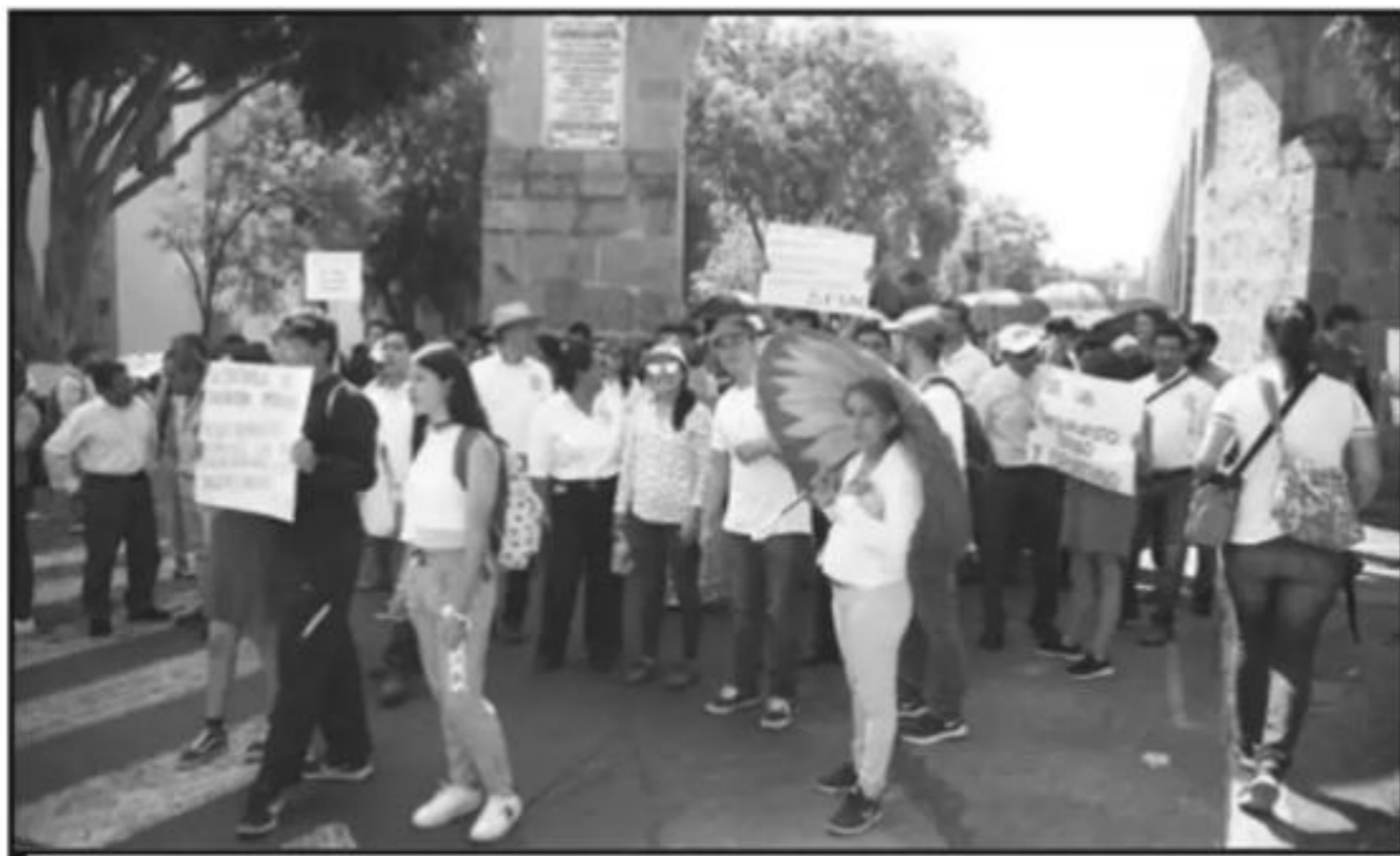
TRAS DÍAS DE FALSAS PROMESAS Y PROTESTAS, PROFESORES Y TRABAJADORES NICOLAITAS RECIBIERON SU NÓMINA.