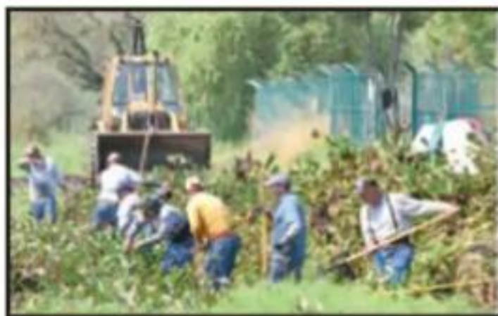
EXTRAER EL LIRIO SE ANTOJA UNA LABOR TITÁNICA.