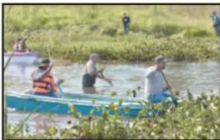
A BORDO DE LANCHAS, LAS CUADRILLAS INICIARON.