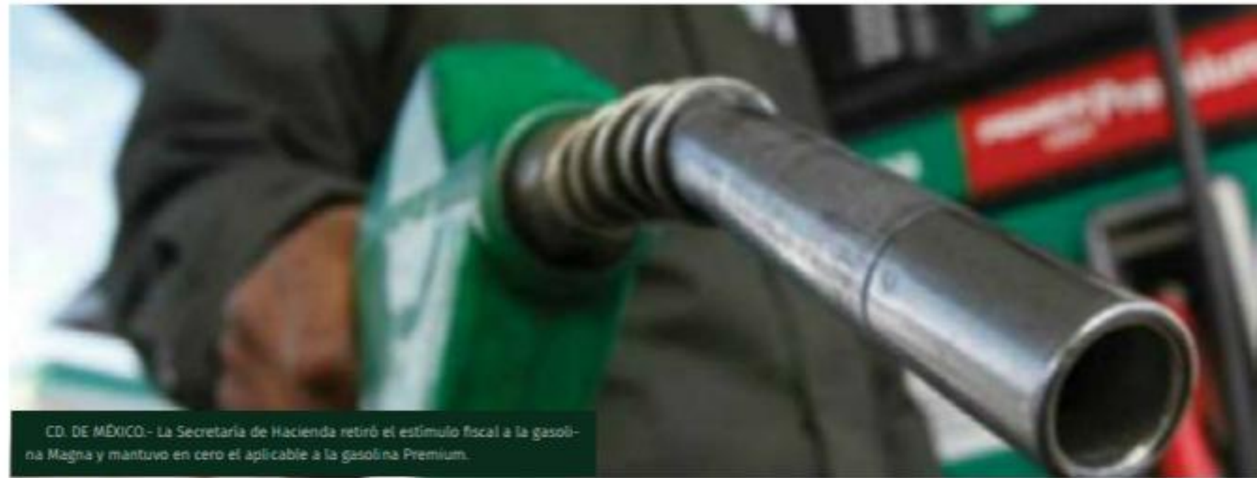
CD. DE MÉXICO.- La Secretaría de Hacienda retiró el estímulo fiscal a la gasolina Magna y mantuvo en cero el aplicable a la gasolina Premium.

Batopilas está ubicado a 395 kilómetros de la capital de Chihuahua y a 150 kilómetros de Choix, Sinaloa.