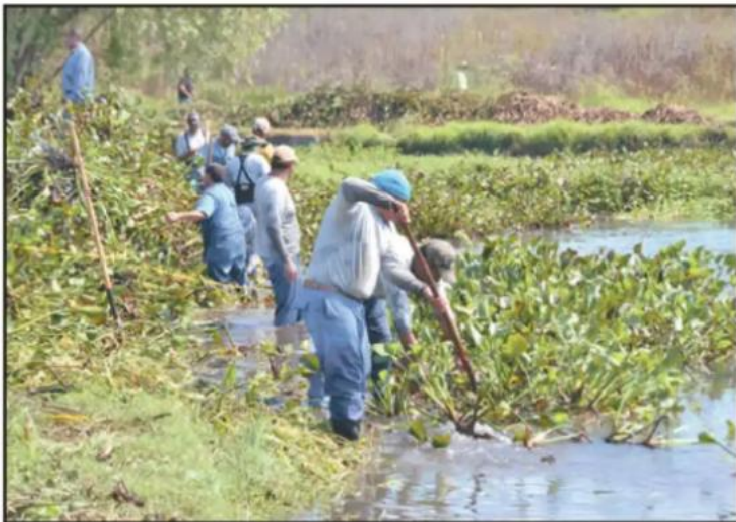
LA PRESENCIA DE LIRIO ES INDICATIVO DE QUE HAY ALTOS NIVELES DE CONTAMINACIÓN ORGÁNICA, SEGÚN EXPERTOS.

sitio Ramsar de humedales hace ya algunos años.