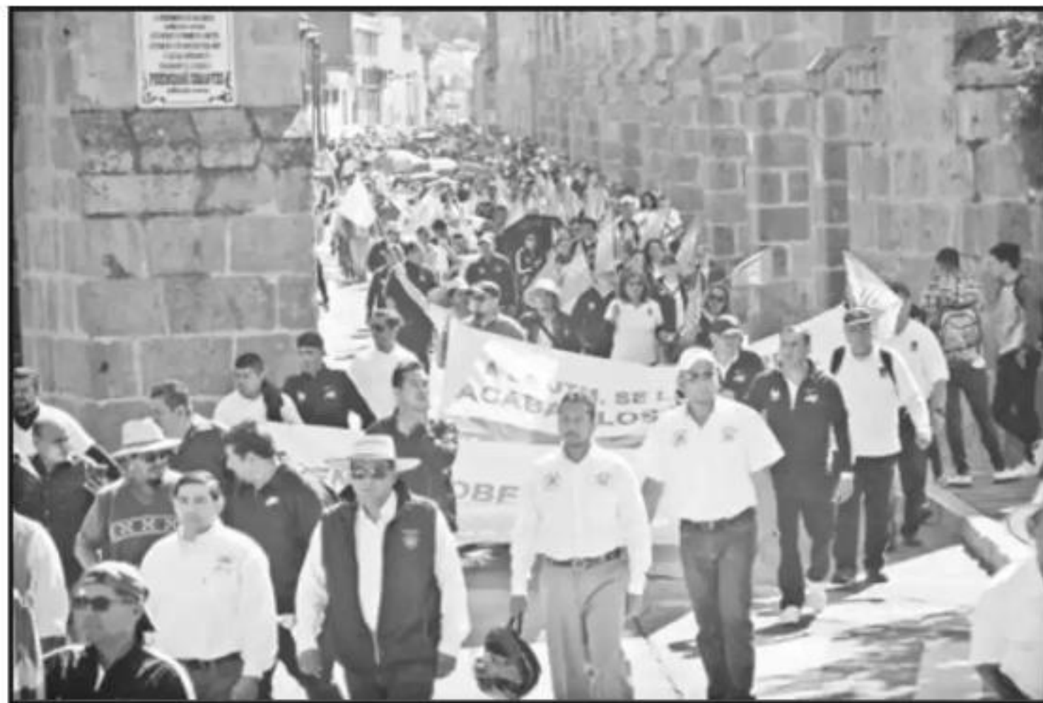
EL SINDICATO DE TRABAJADORES DE LA UNIVERSIDAD TECNOLÓGICA SE MOSTRÓ INCONFORME CON LA DECISIÓN.

La demanda principal del sindicato de la UTM era la revisión al incremento salarial del 50 por ciento y las prestaciones no ligadas al salario del 5 por ciento, y en el Contrato Colectivo de Trabajo (CCT), en su cláusula 37, establece que la revisión salarial será cada año, de acuerdo con la