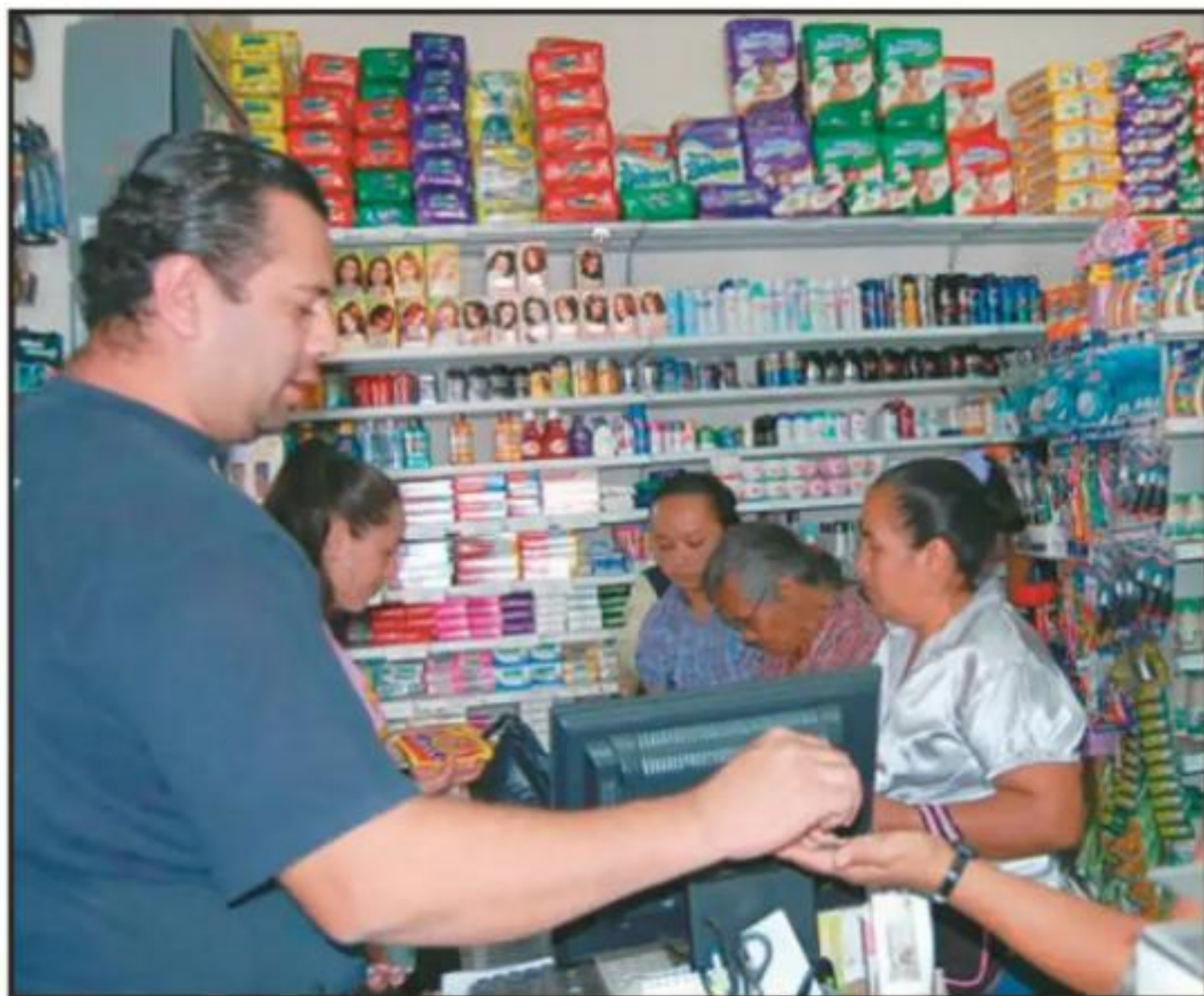
EL SECTOR COMERCIO FUE EL QUE EMPUJÓ LA ECONOMÍA DEL PAÍS EN EL TERCER TRIMESTRE DEL AÑO: INEGI.

Finalmente, los rubros donde no hay cambios importantes, son las altas tasas de la población en pobreza y de los trabajadores que se encuentran laborando de manera informal, sin prestaciones y bajos salarios.