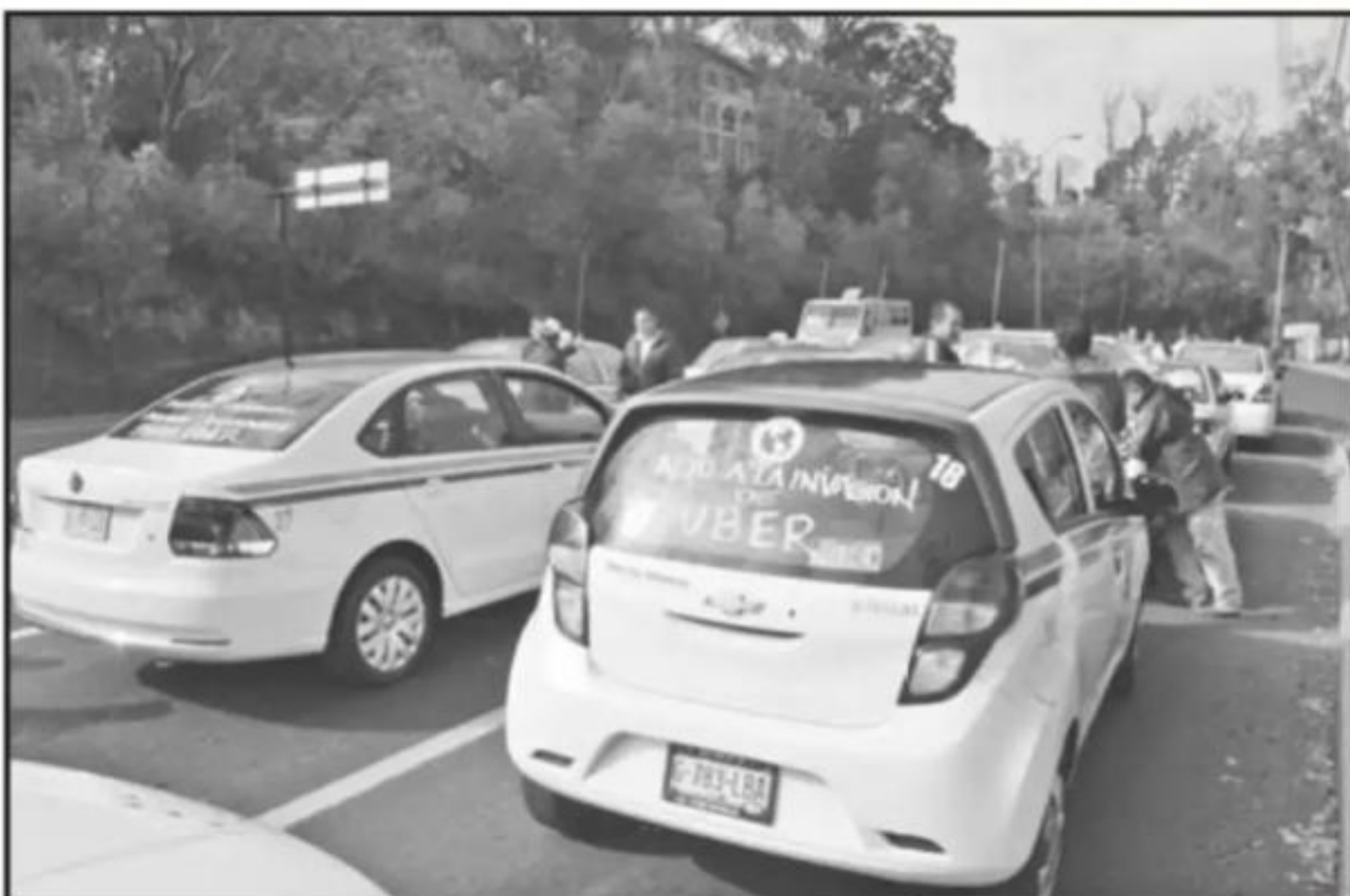
LUEGO DE LAS MANIFESTACIONES CONTRA UBER, TAXISTAS LOGRARON QUE SE IMPLEMENTARAN OPERATIVOS PARA 'CAZARLOS'.

tenido durante los operativos en la zona del Centro Histórico.