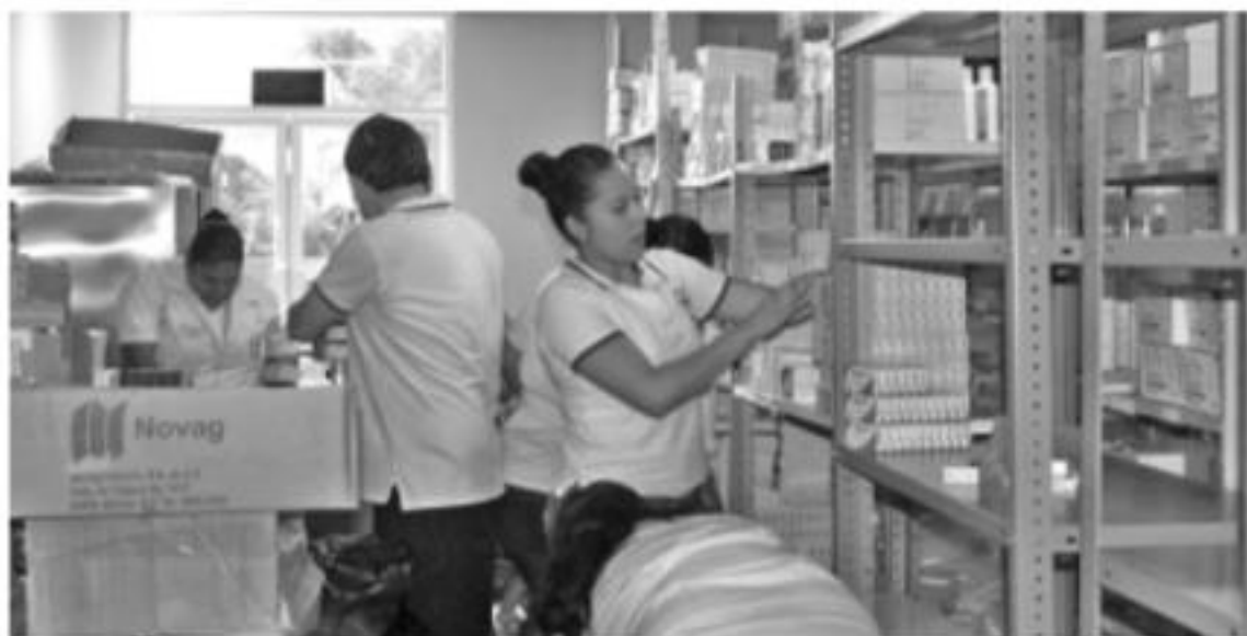
MORELIA, MICH.- La Secretaría de Salud de Michoacán (SSM), que dirige Diana Carpio Ríos, lleva a cabo la construcción, rehabilitación y dignificación de 29 centros de salud en los seis municipios pertenecientes a la región Apatzingán.

La salud de las y los michoacanos es una prioridad para el Gobierno del Estado, por ello se trabaja continuamente en la mejora de la infraestructura hospitalaria en beneficio de la población.