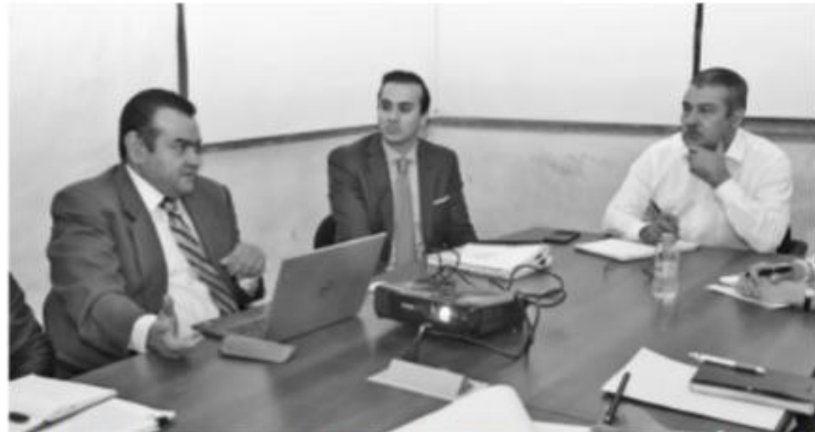
MORELIA, MICH.-Sedeco a través de la Dirección de Mejora Regulatoria, asesora y acompaña al Ayuntamiento de Morelia para la implementación de la simplificación de trámites en la administración municipal.

Para finalizar, el director de Mejora Regulatoria recordó al edil que en marzo se llevará a cabo la tercera sesión del Consejo Estatal de Mejora Regulatoria, del cual forma parte el Ayuntamiento de Morelia.