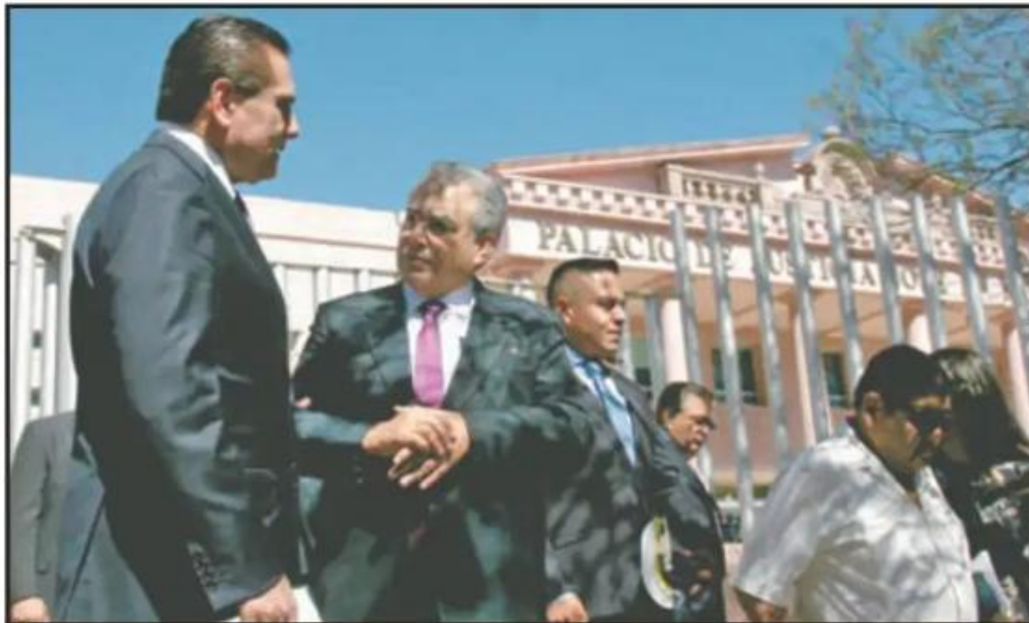
EL GOBERNADOR SILVANO AUREOLES ASISTIÓ AL ÚLTIMO INFORME DEL PRESIDENTE DEL PODER JUDICIAL, ANTONIO FLORES.

de la Escuela Judicial, presupuestada en 63 millones de pesos, quedando descartado ya algún problema estructural, "solo hay que ponerles un refuerzo de acero en algunas pla-