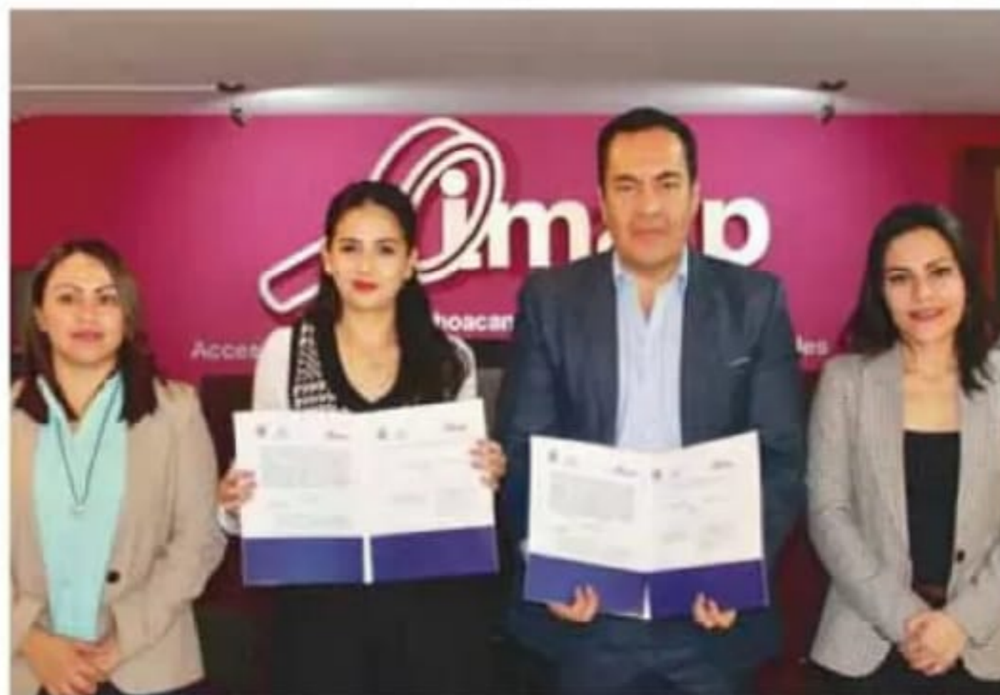
El Instituto Michoacano de Transparencia y el ayuntamiento de Zitácuaro firmaron un convenio de colaboración.

En tres años, pasó de 0 a 100% en el cumplimiento de obligaciones