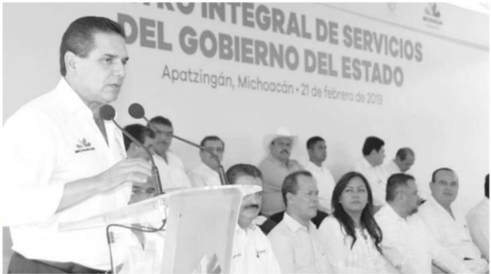
El gobernador Silvano Aureoles Conejo, en Apatzingán donde se realizó la apertura del centro integral de servicios del gobierno del estado y le entrega de apoyos asistenciales por parte del sistema DIF Estatal.

Dijo que en política también se cumplen ciclos y recordó que alguna vez el propio PRD jugó un papel muy importante en la vida política del país.