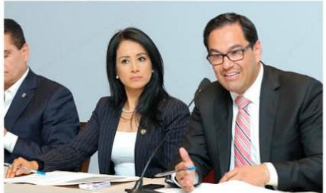
Ayer las Comisiones unidas de Justicia y Gobernación, aprobaron la lista de los diez candidatos a ocupar la Fiscalía General del Estado.

Finalmente dijo que aunque hay buenos resultados, se continuarán redoblando esfuerzos en Michoacán sobre esta problemática, mismas acciones que son necesarias en todo el territorio nacional, para lograr un país libre de violencia.