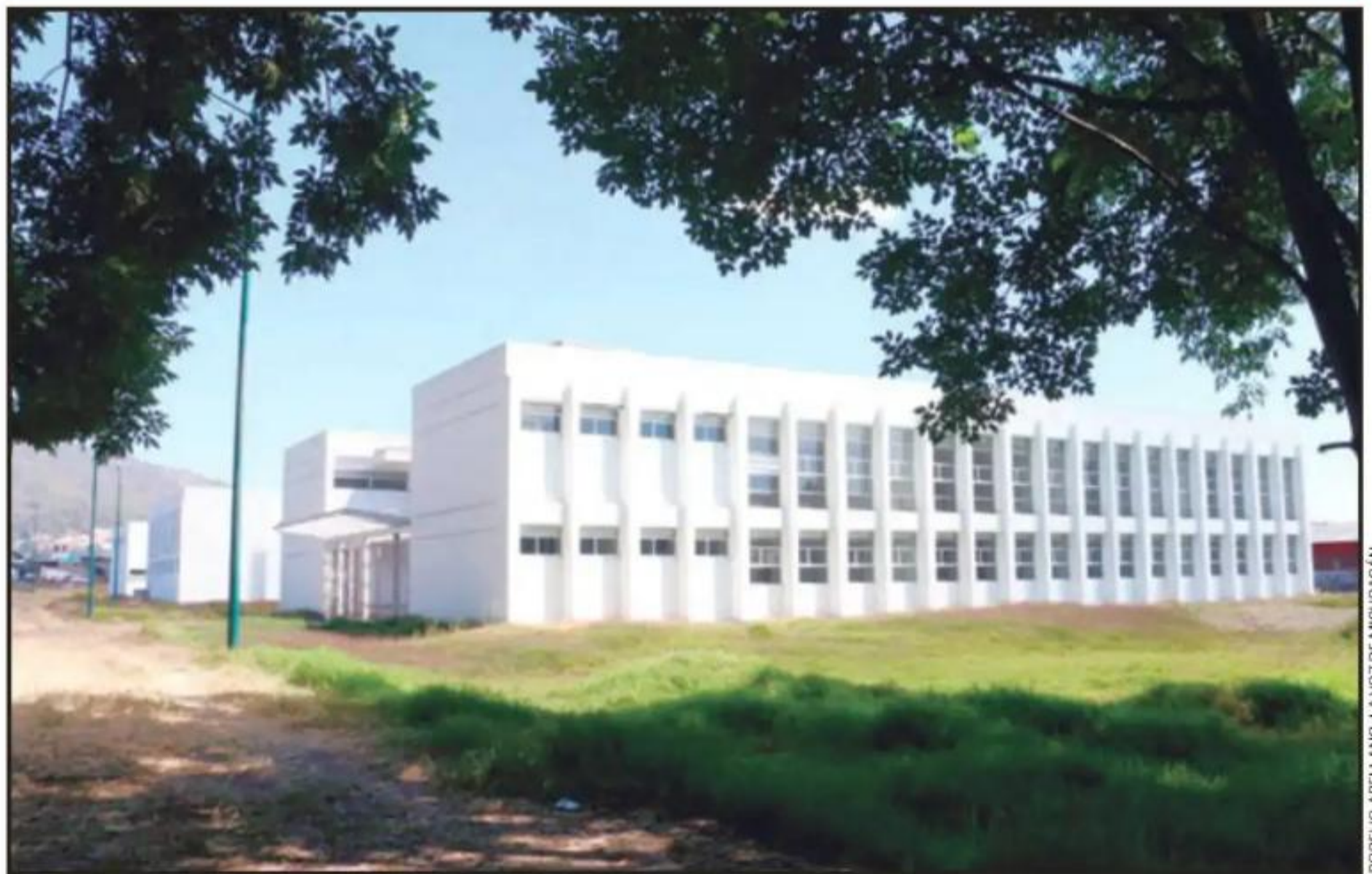
EN CONDICIONES DE USO SE ENCUENTRAN LOS EDIFICIOS DEL CAMPUS DE LA UNIVERSIDAD MICHOACANA DE SAN NICOLÁS DE HIDALGO CAMPUS URUAPAN.

para la inspección física permitió constatar que dos edificios del Campus están en condiciones de ser utilizados, solamente resta equiparlos, pero ello dependerá de las estrategias financieras de la máxima casa de estudios lo que debe incluir la capacidad de ampliar la nómina de maestros y empleados.