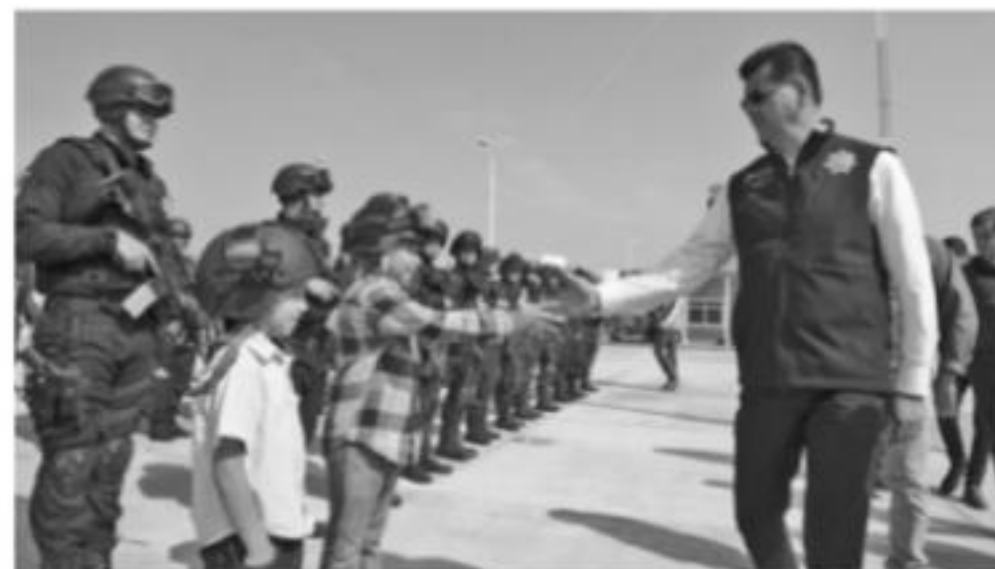
APATZINGÁN, MICH.- El Gobierno del Estado, a través de la Secretaría de Seguridad Pública (SSP), benefició a cerca de 22 mil personas de la región Apatzingán con diversas actividades preventivas,

En actividades deportivas encaminadas a alejar a jóvenes de conductas antisociales, participaron 565 personas; además, 248 personas se han unido a los Comités de Vigilancia Vecinal (Comvives), participando de la mano con la institución para promover una cultura preventiva en las diferentes colonias de esa región.