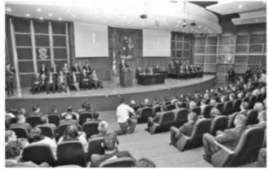
MORELIA, MICH.- El Gobernador Silvano Aureoles Conejo refrendó el respeto de su gobierno y la colaboración con el Poder Judicial para seguir garantizando el acceso a justicia de las y los michoacanos.

"Mi agradecimiento para el ingeniero Silvano Aureoles Conejo, con quien mantuvimos una constante comunicación, enmarcada en el respeto institucional", pronunció.