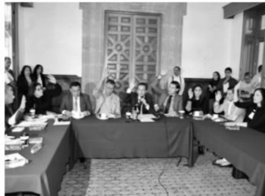
MORELIA, MICH.- En reunión de trabajo las Comisiones Unidas de Justicia y Gobernación, aprobaron la lista de diez candidatos a ocupar la titularidad de la Fiscalía General del Estado.