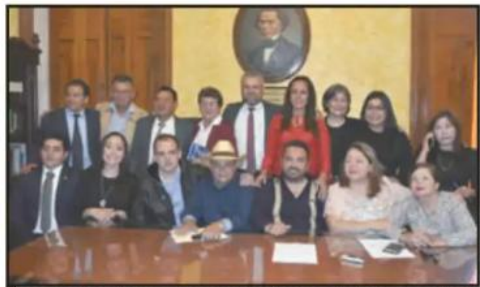
LOS AHORA DIPUTADOS EXPERREDISTAS SE SUMAN A LAS FILAS DE MORENA Y PT.

Es magistrada de la segunda sala civil del STJE. Tiene maestría en derecho por la UMSNH y una especialización en impartición de justicia. Ha sido jueza en Morelia y Pátzcuaro. Desde inicios de los años 90 ha sido catedrática nicolaita. Ha tenido intensa vida académica, a través de cursos, talleres y diplomados