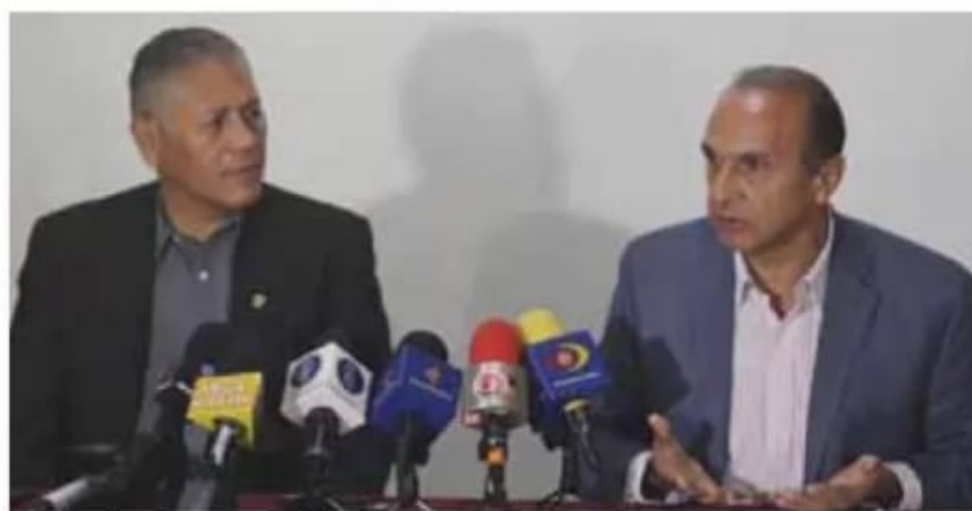
Los funcionarios reiteraron que están abiertos al diálogo con el Sidemm.