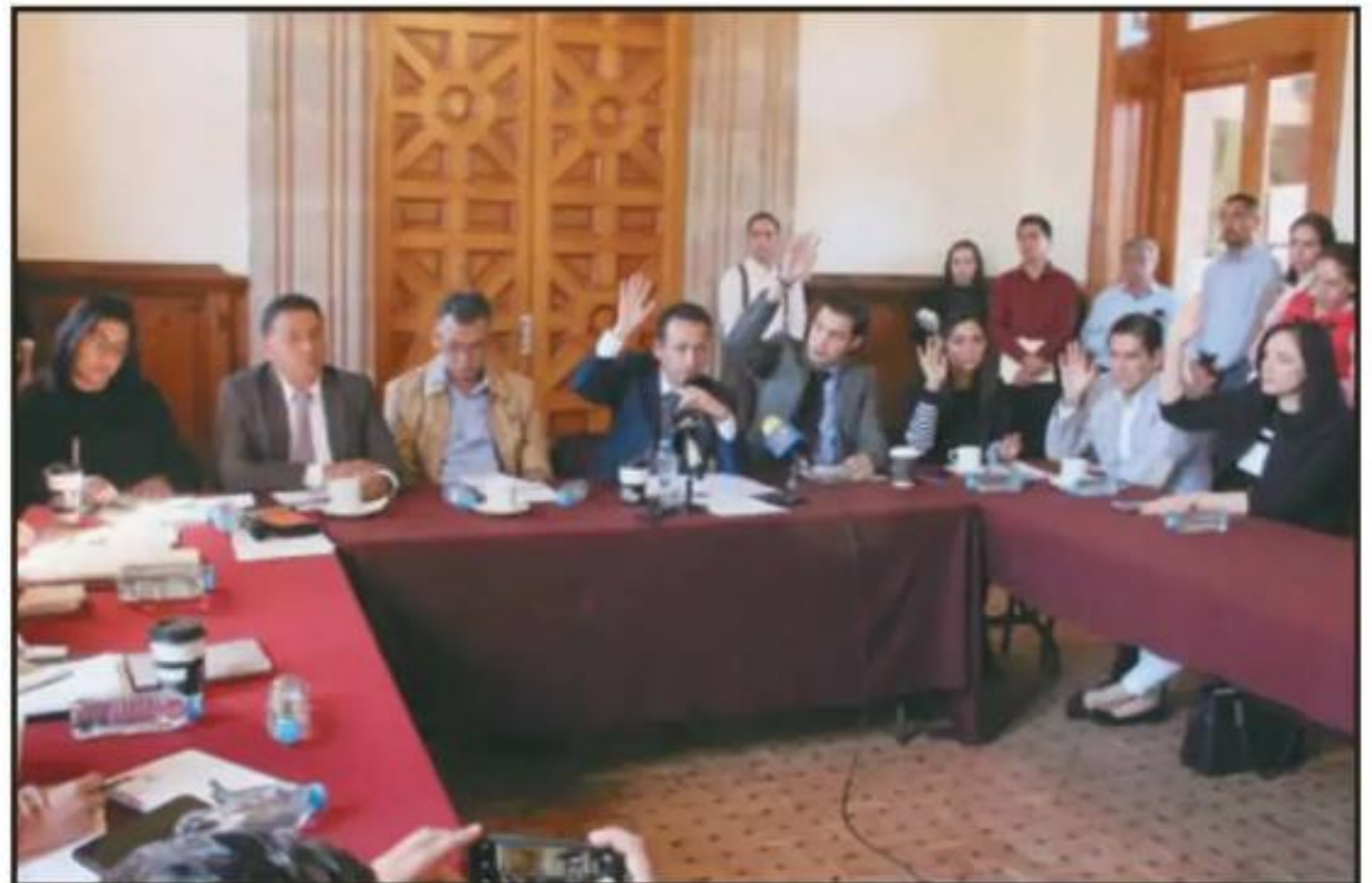
POR LA MAÑANA DE AYER, INTEGRANTES DEL CONGRESO LOCAL DIERON A CONOCER LA LISTA DE 'SEMIFINALISTAS'.

Una vez que el pleno del Congreso local vote la lista de 10 finalistas, ésta será remitida al gobernador Silvano Aureoles para que en el plazo de 10 días haga la integración de la terna respectiva.