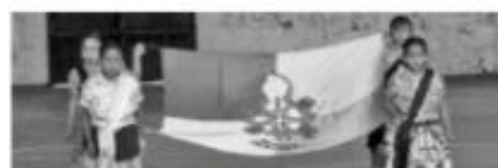
MORELIA, MICH.- Cabe resaltar que Michoacán es una de las entidades que poseen una gran diversidad cultural debido a la importante presencia de grupos indígenas

teriales didácticos y realizar textos que ayudarían a otros docentes y a sus alumnos con el uso y manejo de la lengua materna en mención. "El Vocabulario", editorial Plaza y Valdez de México, 2000 primera edición, fue uno de sus libros que con el apoyo del Instituto Tecnológico de Cherrán y el Consejo Nacional de Ciencia y Tecnología (Conacyt), se logró la distribución de mil ejemplares en algunas escuelas, pues tiene un método en el que compara el Español con el Purépecha, el cual tiene la finalidad de que a través de su vocabulario los docentes y sus alumnos aprendan el idioma, lo valoren y lo conserven. "La guía lingüística" es otro libro importante que se editó en año 2006 para docentes y estudiantes de educación básica donde se valora el idioma purépecha no sólo en cuanto al aspecto de sus palabras sino inclusive a las conjugaciones, para facilitar enseñanza de los no hablantes y hacer comprender. "Texto narraciones" es una recopilación de cuentos intercalando vocablos en Purépecha en el texto de los cuentos este es para los que están olvidando el idioma se editó en el 2008 y se imprimieron 500 ejemplares, además se realizó una selección de cuentos, los cuales fueron grabados en discos que se repartieron en escuelas indígenas, en el Lago y Meseta Purépecha.