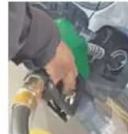
En promedio se venden entre 90 y 100 mdp diarios en el estado. | RED 113

La gráfica también señala que las ventas para adquirir gasolinas para Michoacán se promedian entre 90 y 100 millones de pesos diarios; pero durante las semanas de mayor desabasto se vendieron aproximadamente 50 millones de pesos de combustible al estado. JOSIMAR LARA