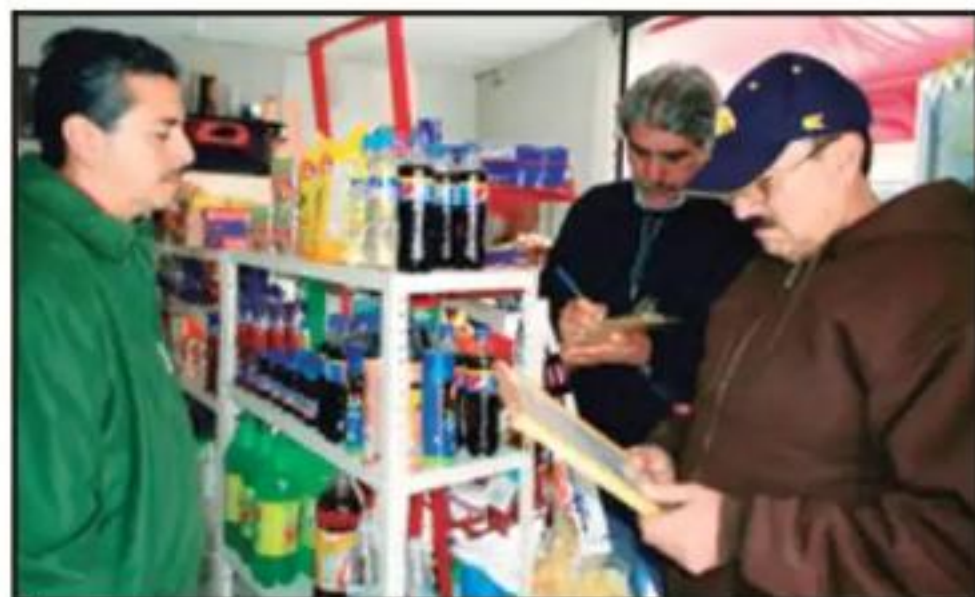
PERSONAL DEL AYUNTAMIENTO DE LA PIEDAD REALIZA VISITAS A LOS ESTABLECIMIENTOS PARA INVITAR A PROPIETARIOS A RENOVAR SUS LICENCIAS.

La otra vialidad que fue dotada de alumbrado público fue la Avenida Manuel Pérez Coronado, entre las calles Berlín y Caracas, en la que se instalaron 47 lámparas en 24 postes metálicos ello al margen de que entregó la pavimentación integral en concreto hidráulico de mil 500 cuadrados de la Avenida Manuel Pérez Coronado. Esta obra también incluye 250 metros de drenaje sanitario, 551 metros cuadrados de banquetas, 56 descargas domiciliarias entre otros servicios, en lo que junto con el alumbrado se invirtieron 4 millones 402 mil 102 pesos.