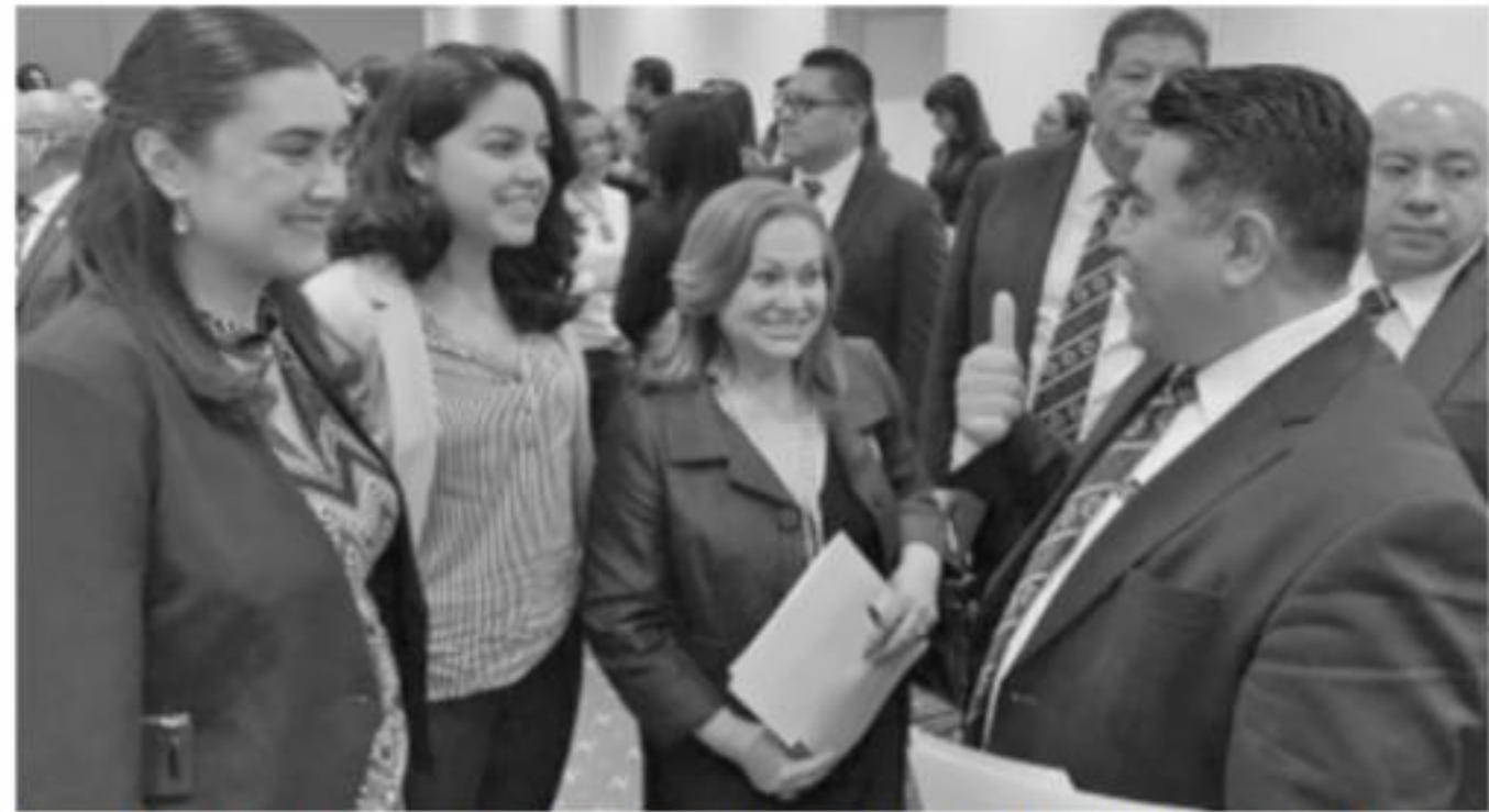
MORELIA, MICH.- Autoridades estatales reconocieron la labor del Gobierno Municipal de Uruapan para atender la Alerta de Género y de los distintos sectores sociales que se han sumado a las mismas.