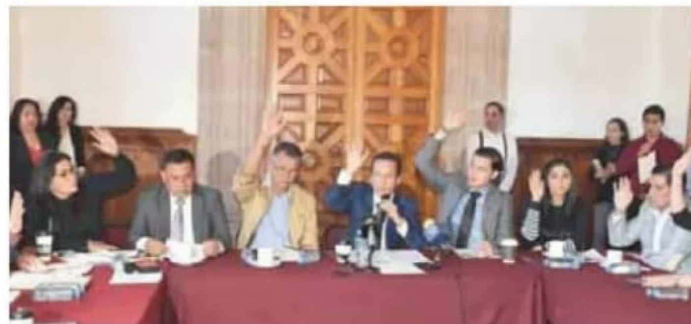
Ese listado se manda al titular del Ejecutivo estatal para que elija una terna y la envíe de nuevo al Congreso.