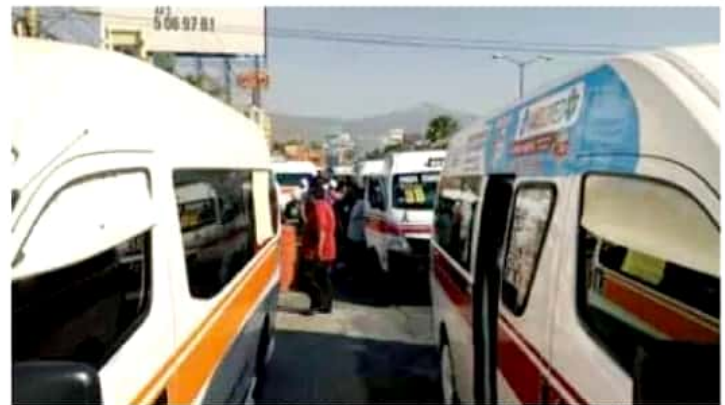
Los transportistas recordaron que este programa fue impulsado por el pasado gobierno municipal y un exdiputado.

"Vinimos a ver cuándo nos podrían instalar los catalizadores cuando recién se lanzó el programa y primero nos dieron largas, nos dijeron que volviéramos en 15 días, y después nos pedían los vales del catalizador; algunos se los dieron, y cuando volvieron, en la empresa les dijeron que ellos