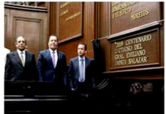
Diputados de la 74 Legislatura estatal, rinden homenaje al Caudillo del Sur.