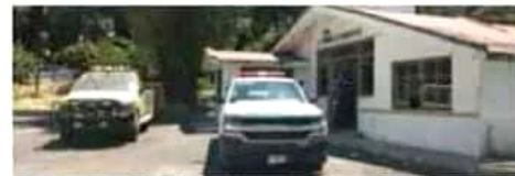
El proyecto para rehabilitar la estación 2 está contenido en el PAI correspondiente a 2019.

En entrevista con medios, el funcionario dijo que este proyecto es necesario para poder reactivar esta estación, que por muchos años funcionó, pero debido al abandono en que se encontraba la estructura significaba un riesgo para los bomberos que ahí realizaban sus guardias. Sin embargo, el Ayuntamiento pretende volver a