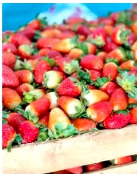
Con las nuevas tecnologías se protege la fresa de los factores climáticos, plagas y contaminación.

Es así como se les brindará del vital líquido a los alumnos, personal administrativo y docente que acude a la escuela, con ello están abonando a que los asistentes tengan una mejor salud y un mayor rendimiento escolar.