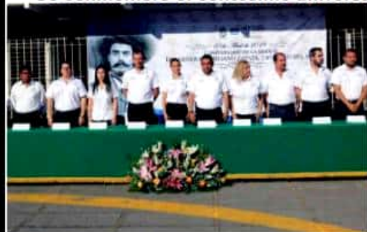
LOS REYES, MICH.- Autoridades municipales encabezaron la conmemoración del centésimo aniversario luctuoso de Emiliano Zapata.

■ Se conmemoró el centésimo aniversario del fallecimiento del Caudillo del Sur