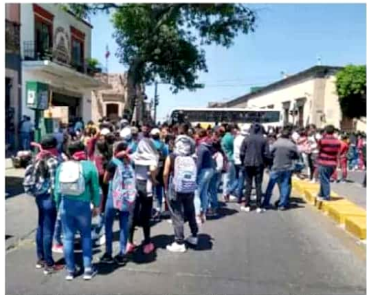
El funcionario explicó que los estudiantes conocen el procedimiento para justificar los recursos que reciben.

Desde hace un par de semanas los estudiantes de las Normales han realizado bloqueos e incluso saqueo de empresas