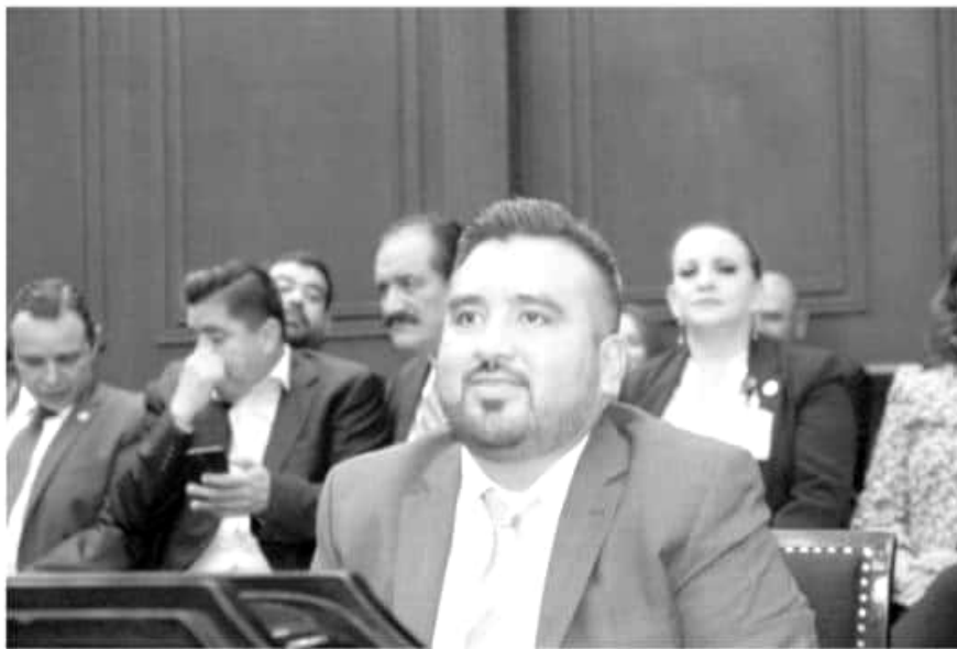
Erik Juárez Blanquet, presidente de la Comisión de Puntos Constitucionales en el Congreso del Estado.

En nuestro estado existe una discrecionalidad en la asignación de sueldos, lo que deriva en falta de criterios claros que establezcan un sistema de percepciones adecuado a la realidad económica y a las finanzas públicas de Michoacán