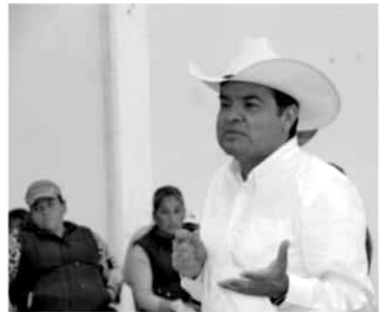
MORELIA, MICH.- El no recortar recursos al campo y optar por fortalecerlo, sería una mejor manera de honrar a Emiliano Zapata y su lucha, más que discursos y la promoción de eventos protocolarios

En ese sentido, el diputado integrante del Grupo Parlamentario del PRD en el Congreso del Estado hizo mención que, nuestra entidad mantiene el primer lugar a nivel nacional en el valor de la producción agrícola con más de 80 mil millones de pesos, y que en Michoacán se han registrado cosechas en 117 cultivos que han representado el incremento en el valor de la producción aportando nuestro estado el 13.75 % de la producción agrícola nacional.