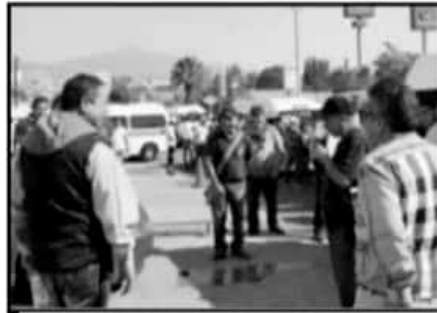
LOS CHOFERES SE SIENTEN ENGAÑADOS POR EL ASUNTO.