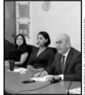
CONSEJEROS ELECTORALES RE- PROBARON ACTOS VANDÁLICOS