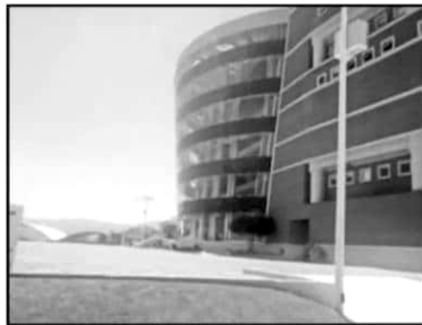
LA UNIVERSIDAD DE LA CIÉNEGA SERÁ LA SEDE DEL PRIMER FORO REGIONAL CIUDADANO, QUE BUSCA PROPUESTAS PARA REFORMAR LA LEY ORGÁNICA.

Derivado del rezago de este instrumento legal, durante las dos legislaturas anteriores intentaron realizar reformas profundas al documento rector de la vida municipal, al grado de concluir que ante la gran cantidad de modificaciones que se hacían necesarias era más viable la construcción de una nueva Ley Orgánica.