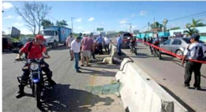
En sucesos más graves, lo que sucede es que el conductor o sus acompañantes llevan un casco muy simple o inadecuado que no protege la cabeza.

En accidentes de motocicleta más graves, dijo, lo que sucede es que el conductor o sus acompañantes llevan un casco muy