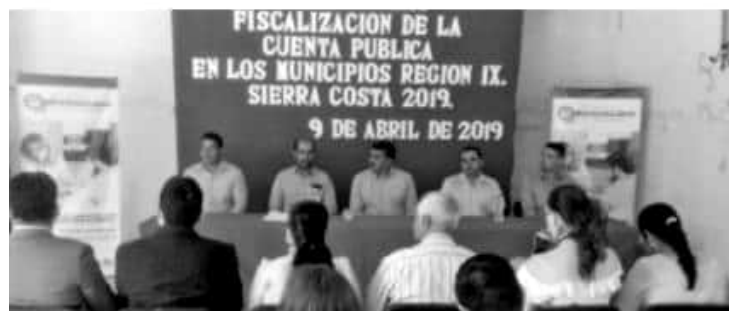
COALCOMÁN, MICH.- Los contralores municipales fueron capacitados en materia de Fiscalización de la Cuenta Pública en los municipios, por parte del personal de la Auditoría Superior de Michoacán.