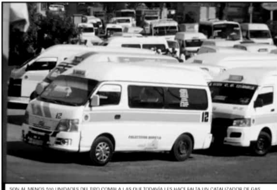
SON AL MENOS 500 UNIDADES DEL TIPO COMBI A LAS QUE TODAVÍA LES HACE FALTA UN CATALIZADOR DE GAS.

quedarse con más de 12 millones de pesos en refacciones.