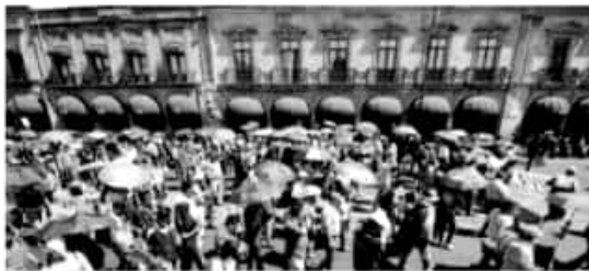
MORELIA, MICH.- Con la federalización de la nómina educativa se deben cuidar diversos aspectos, pero sobre todo el no perder sus logros ni afectar sus derechos laborales.

Zavala manifestó que en ello se engloba el salario, bonos y prestaciones, sumado a la antigüedad de cada uno de los trabajadores y de la seguridad social, ya sea ISSSTE o en otro sistema. Reiteró que el Gobierno estatal y el