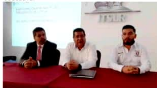
LOS REYES, MICH.- Se anunció la creación de una extensión del Tecnológico de Los Reyes en Cotija.

Actualmente, la máxima casa de estudios de la región cuenta con 21 alumnos del municipio de Cotija, por lo que se prevé abrir la extensión con una matrícula de mínimo 95 alumnos con la idea de llegar a 200 o 300 en un par de años, cifras que el municipio confía en superar con la debida promoción, esperando además incrementar la oferta educativa.