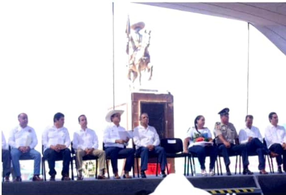
CUATRO CAMINOS, MICH.- El gobernador del estado, Silvano Aureoles Conejo, encabezó el acto cívico luctuoso para cumplirse el primer centenario del asesinato del General Emiliano Zapata.

Y así, remarcó que una vez que haya más desarrollo en las zonas rurales en la entidad, bajará la inseguridad y la criminalidad. Asimismo, remató al indicar que se implantará una estrategia de seguridad en la Tierra Caliente y en la Sierra Gorda.