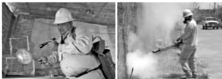
MORELIA, MICH.- Con acciones de fumigación, patios limpios, descacharrización, lavar, tapar, voltear y tirar recipientes que acumulen agua, se ha logrado el control adecuado del contagio de las enfermedades transmitidas por este vector.

Cabe destacar que, en el marco de la Semana Nacional de la Lucha contra el Dengue, la SSM intensificará acciones vectoriales de manera conjunta con la comunidad, ayuntamientos y escuelas, a efecto de limpiar de manera exhaustiva todas las áreas verdes o deportivas que sean focos rojos para la reproducción del mosquito.