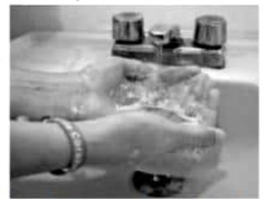
MORELIA, MICH.- La SSM, recomienda lavarse las manos, desinfectar las frutas y verduras, preparar los alimentos con la mayor higiene y, cuando estén listos, ingresarlos al refrigerador y conservarlos tapados.

Por ello, la importancia de que las y los michoacanos se sumen a implementar acciones preventivas desde el hogar, para el cuidado de su salud y la de sus familias.