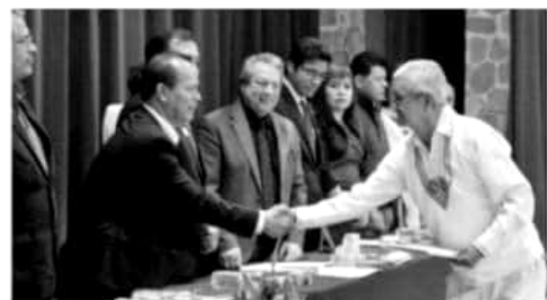
MORELIA, MICH.- Desde Sedrua, se continúa con el cuidado del medio ambiente y la preservación de los recursos naturales, en especial de la tierra.