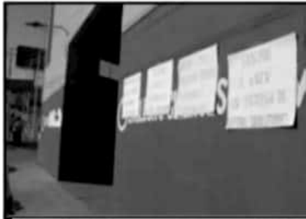
COLOCARON CARTULINAS EN LA FACHADA DE LA EMPRESA.