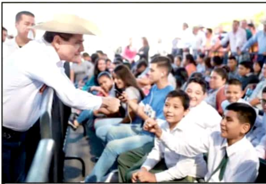
EL GOBERNADOR SALUDÓ A ALGUNOS DE LOS ASISTENTES AL ACTO POR EL ANIVERSARIO LUCTUOSO DE EMILIANO ZAPATA.