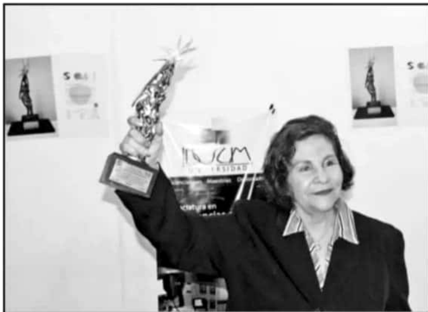
LA RECTORA DE LA UNIVERSIDAD IDESUM LLEVA MÁS DE 30 AÑOS DEDICADA A LA EDUCACION DE EXCELENCIA.