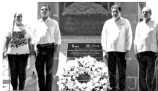
CUATRO CAMINOS, MPIO. DE MÚGICA, MICH.- Aureoles Conejo con otros funcionarios estatales y municipales en el marco del centenario luctuoso del general Emiliano Zapata Salazar.

En ese tenor, el mandatario estatal recae que ahora, se dará un nuevo giro al campo, e implica el apoyo a la Escuela de Ciencias Acolas de la Universidad Michoacana de San Nicolás de Hidalgo en este prodigioso Valle Apatzingán, así como el empoderamiento a mujeres, para que tengan la capacidad de ir adelante a sus familias.