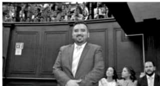
MORELIA, MICH.- Michoacán se pondrá a la vanguardia, al establecer reglas claras para regular y transparentar de manera efectiva las remuneraciones de los servidores públicos.

En ese contexto, remarcó que es urgente que se retomen los ideales de Zapata, quien tenía la visión del desarrollo del país a partir del apoyo a los del campo, ante lo que se hace apremiante que las políticas públicas que se emprenden tengan como objetivo el rescate y hacerle justicia a los campesinos y a los indígenas, para que mejoren las condiciones de vida todos los grupos sociales desprotegidos, en particular de aquellos que se desarrollan en el sector rural.