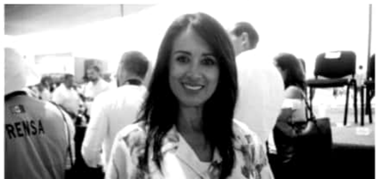
MORELIA, MICH.- El mejor homenaje que se le puede hacer a Emiliano Zapata, es combatiendo la desigualdad y luchando por el desarrollo del campo.