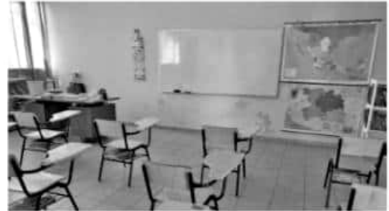
MORELIA, MICH.- La Secretaría de Educación en el Estado (SEE), informa que el próximo lunes, 15 de abril del año en curso, inicia oficialmente el periodo vacacional.

Además de reforzar acciones para la mejora de infraestructura educativa y brindar espacios dignos y óptimos que abonen a la excelencia académica de las niñas, niños y jóvenes de Michoacán.