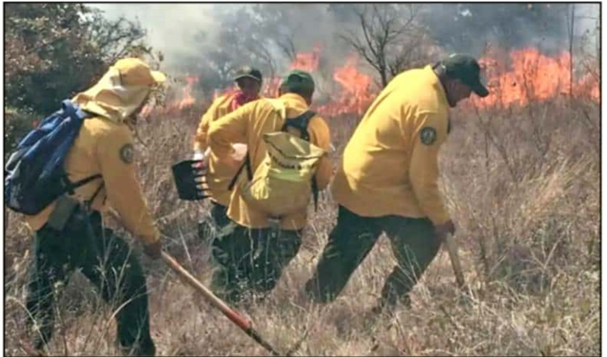
SON MILES DE HORAS HOMBRE LAS INVERTIDAS POR LOS BRIGADISTAS PARA EXTINGUIR LOS INCENDIOS, QUE SON PROVOCADOS EN SU MAYORÍA.

hectáreas. En el último de los casos, cifra que aumentó a partir de los incendios del fin de semana que incrementaron los niveles de contaminación del aire en la zona urbana.