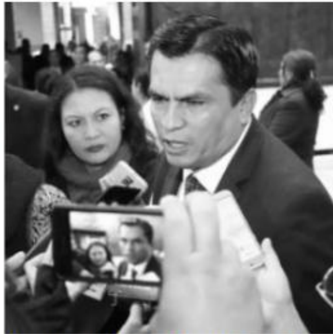
MORELIA, MICH.- El legislador panista explicó que la liberación del priista ha generado una estela de dudas