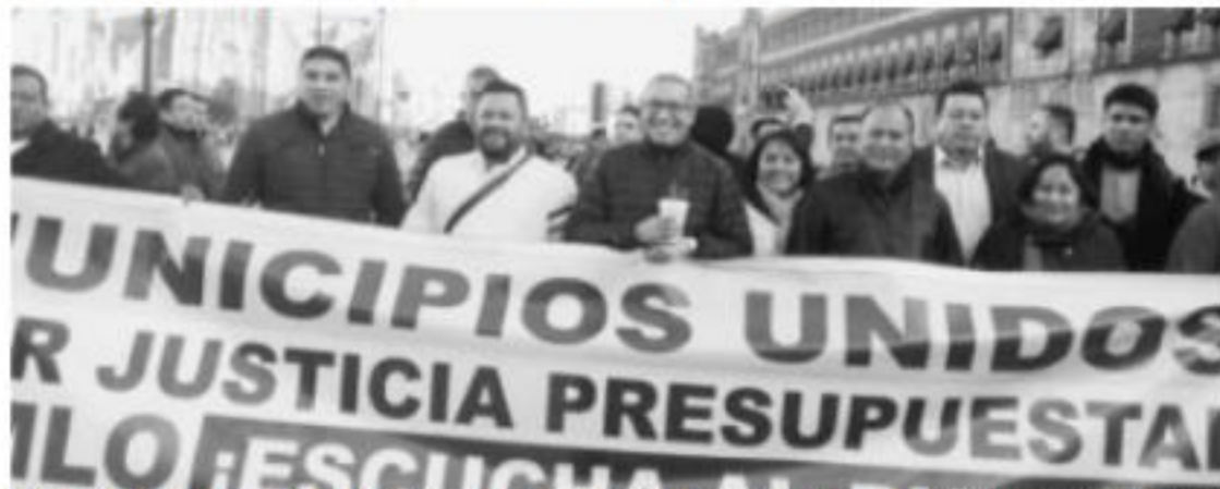
MORELIA, MICH.- El Comité Ejecutivo Estatal (CEE) del Partido de la Revolución Democrática (PRD), se sumó a la exigencia de los presidentes municipales michoacanos de obtener un presupuesto federalista.

Es importante señalar que los presidentes municipales michoacanos están pugnando para que en el Presupuesto de Egresos de la Federación 2019 no haya recortes presupuestales a los municipios; y que se les etiqueten recursos suficientes para atender las demandas de la población.