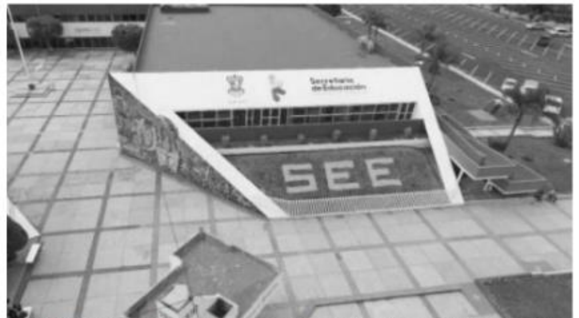
MORELIA, MICH.- A partir de las 10:00 horas se estará realizando el pago de nómina del magisterio estatal.

Finalmente reiteró que la cita para cobrar es el próximo lunes 24 de diciembre a partir de las 10:00 horas en oficinas centrales de la Secretaría de Educación.