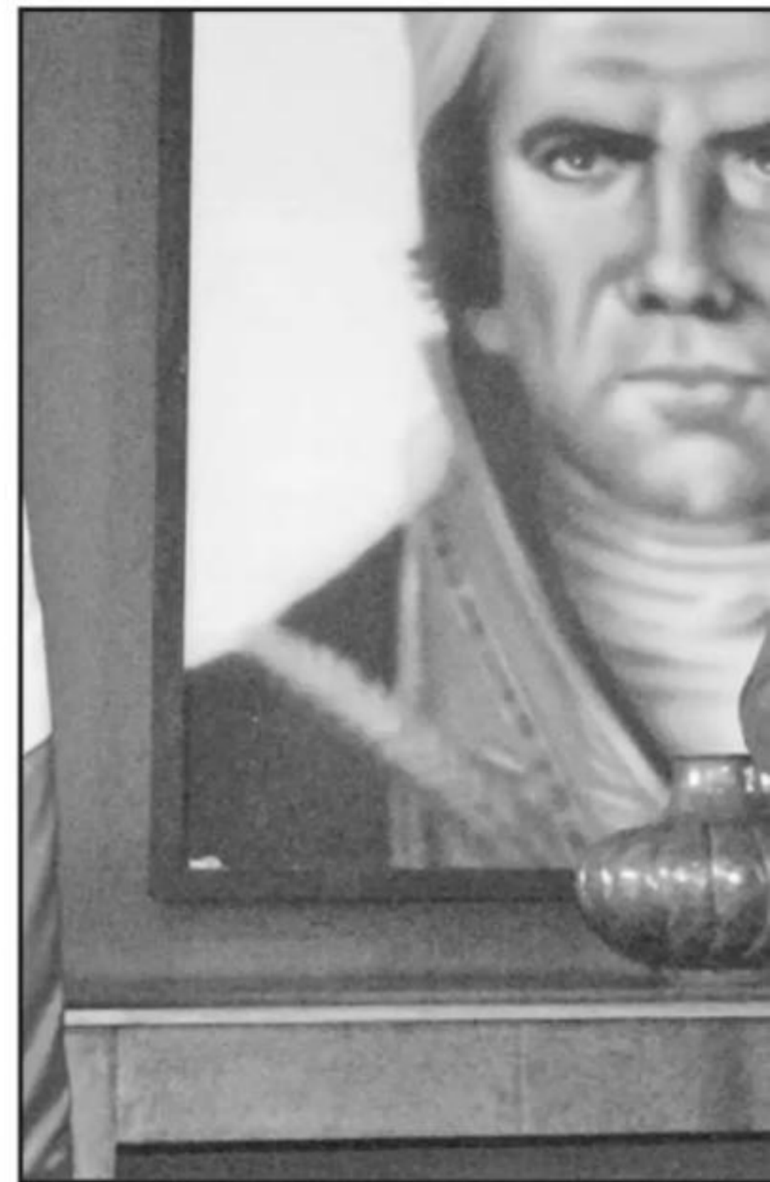
JESÚS REYNA GARCÍA OCUPÓ BREVEMENTE LA GUBERNATURA DE MICHOACÁN DE

Ésta ha sido una etapa difícil sin duda, muy dura, prolongada, tan difícil, dura y prolongada, como injusta, que nos ha tocado vivir a mí y a mi familia. En ese trecho también, como muchos saben, lamentablemente me tocó perder a una hija que ahora tengo que salir a buscar. Sí, tengo muchas cosas que decir, todas las diré para que se sepa con exactitud qué fue lo que pasó, para que se conozca tam-