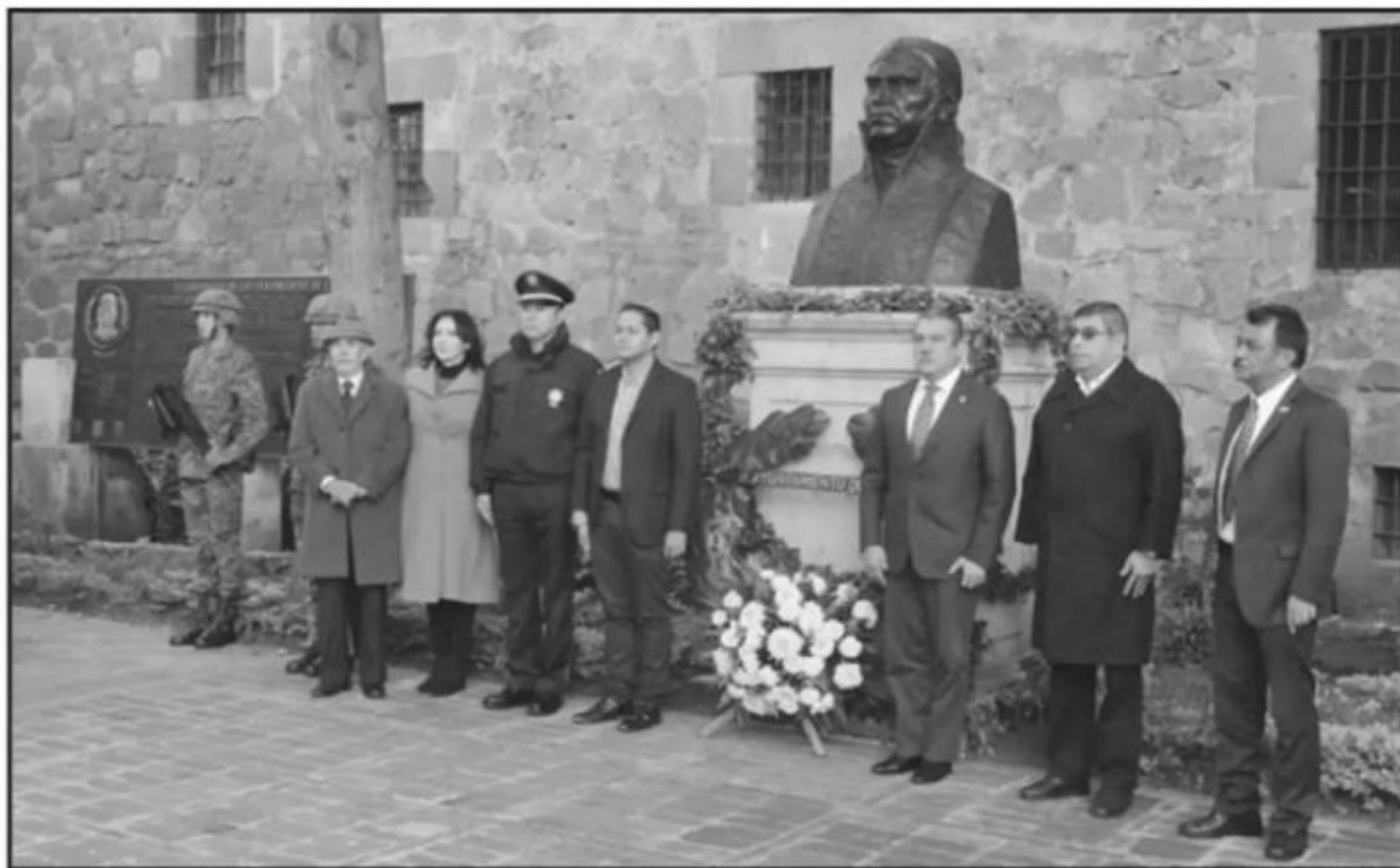
AUTORIDADES MORELIANAS RINDIERON HONORES POR EL 203 ANIVERSARIO LUCTUOSO DEL SIERVO DE LA NACIÓN, DON JOSÉ MARÍA MORELOS Y PAVÓN.