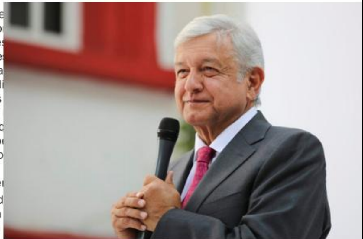
MORELIA, MICH.-El presidente de la República, Andrés Manuel López Obrador, estará en esta ciudad el próximo 3 de enero para iniciar las obras de reparación vial de la capital, a las cuales la Federación ha destinado 300 millones de pesos.

"Nos complace por él, por su familia y por sus amigos", concluyó en entrevista telefónica.