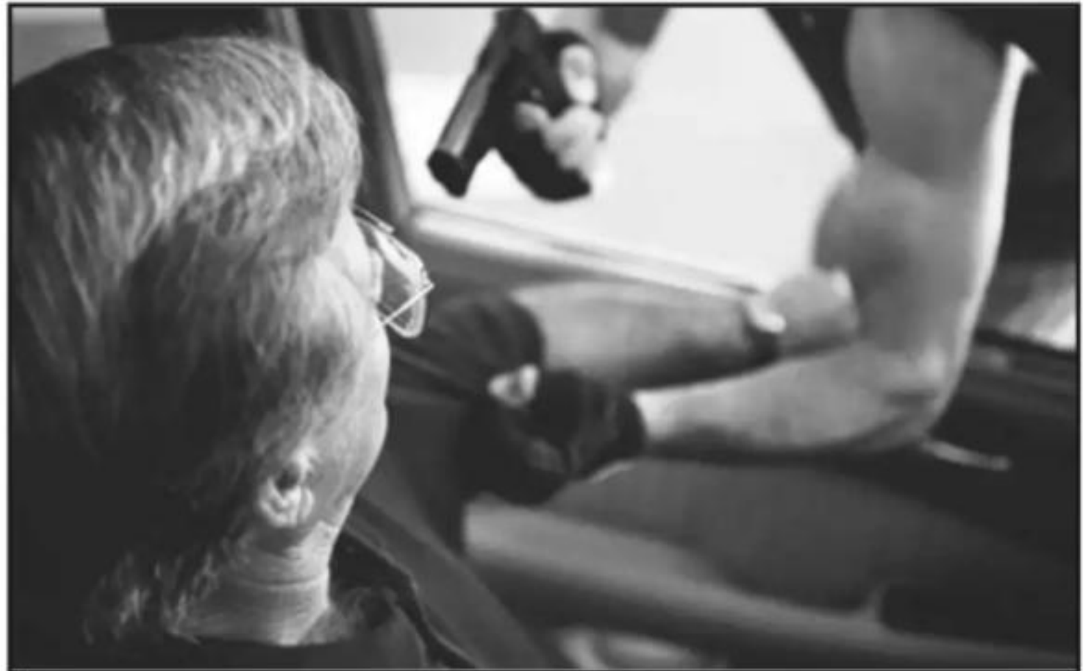
LOS ROBOS CON VIOLENCIA ESTÁN ENTRE LOS DELITOS MÁS COMUNES QUE AFECTAN A MILES DE MICHOACANOS.

CASOS de personas detenidas por narcomenudeo