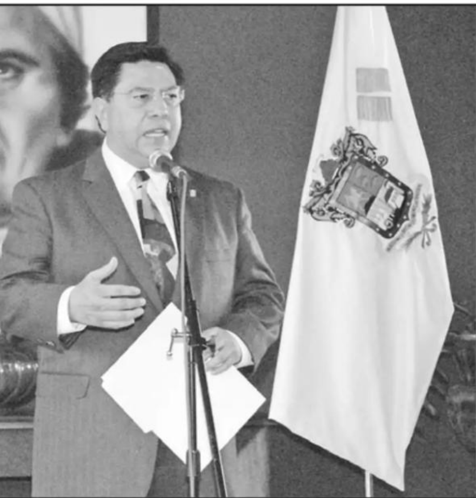
MANERA INTERINA; EL PRIISTA ASEGURÓ QUE EN UN FUTURO MUY CERCAÑO ‘HABLARÁ TODO’ LO QUE SABE SOBRE EL TEMA.

bado que el proceso legal que enfrentó fue mucho más largo de lo normal, lo cual atribuyó a que fueron cuestiones políticas por parte del entonces gobierno federal.