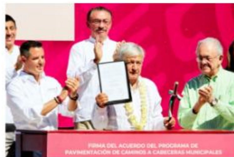
FIRMA DEL ACUERDO DEL PROGRAMA DE PAVIMENTACIÓN DE CAMINOS A CABECERAS MUNICIPALES

En San Juan Evangelista Analco, municipio de la sierra norte señaló que Oaxaca es uno de los estados que tienen menos caminos pavimentados hacia sus cabeceras municipales, y resaltó la forma de organización de sus pueblos.