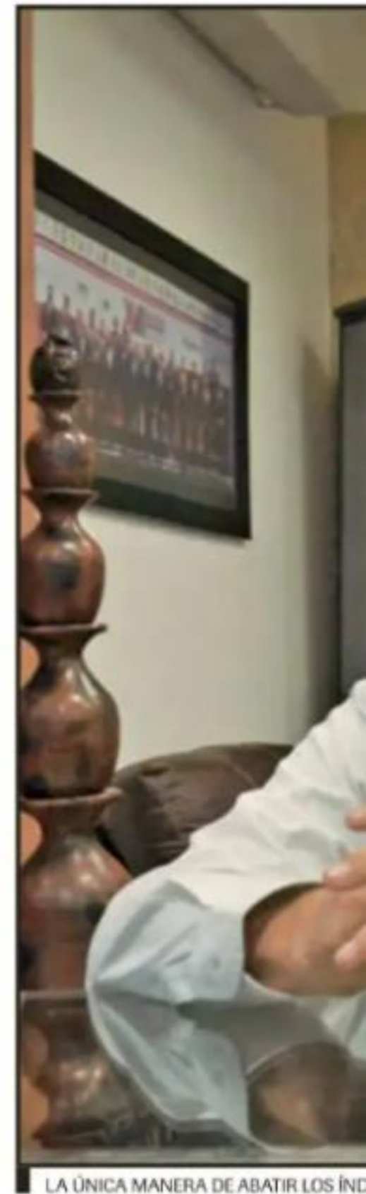
LA ÚNICA MANERA DE ABATIR LOS ÍNDICES

ENCONTRAM TUACIONES CONTAMINA CIA, CON PR ELEMENTOS