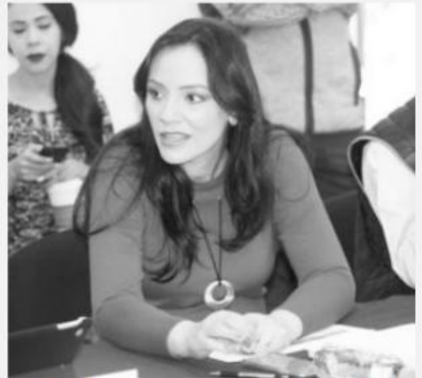
MORELIA, MICH.- La legisladora del tricolor refrendó su confianza en la justicia y señaló que es clara la inocencia del exgobernador

Ante la falta de pago a trabajadores de otros sectores en el estado, como el magisterio, Alfredo Ramírez Bedolla expresó que la obtención de recursos extraordinarios para la UMSNH es la mejor muestra de que la suma de voluntades para trabajar en unidad, priorizar el diálogo respetuoso con la Federación y la construcción de amplios acuerdos, es la mejor ruta para sacar adelante a Michoacán.