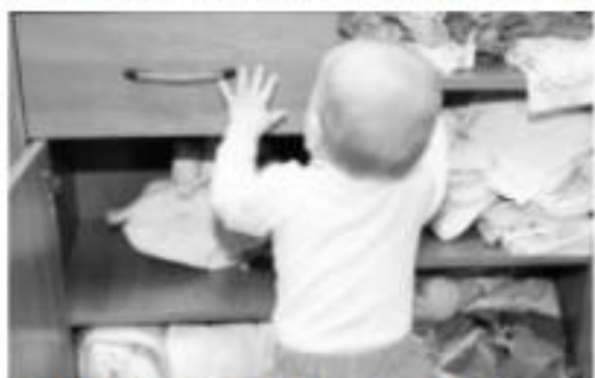
MORELIA, MICH.- a SSM exhorta a las y los padres de familia a extremar precauciones para el cuidado y seguridad de sus hijos

Por ello, la SSM exhorta a las y los padres de