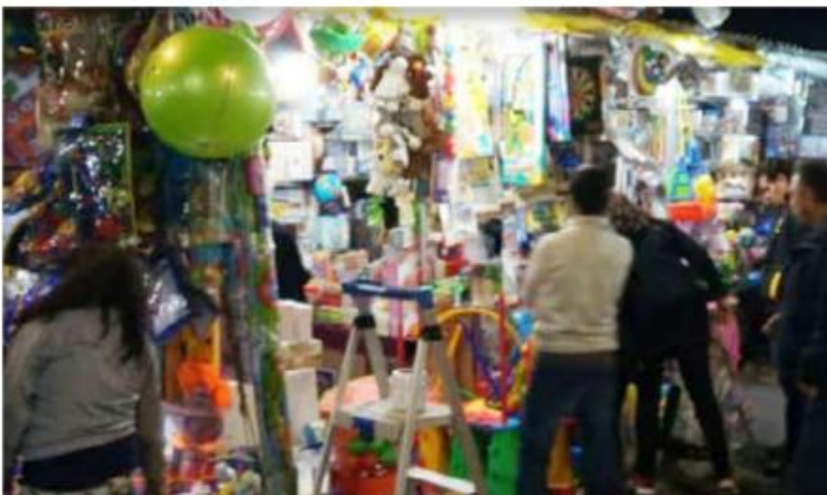
URUAPAN, MICH.- Con normalidad y con saldo blanco fue como se llevaron a cabo las compras de los tres Reyes Magos en todos los tianguis del juguete y puestos que se instalaron en diferentes partes del Municipio.

Durante el transcurso de la tarde, noche y madrugada, los Reyes Magos, estuvieron realizando sus compras en los diferentes tianguis y locales donde ofertaban los juguetes y diferentes artículos que pidieron los niños y niñas a través de las cartas que les hicieron llegar desde días antes.