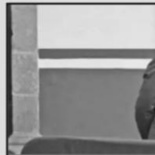
Transparencia, algo que se negó fortale

le darán el voto de confianza a ningún perfil que mantenga vínculos o lazos con Medardo Serna González o Salvador Jara Guerrero, pues resaltan que ellos dos han sido los responsables de la crisis que ha vivido la institución. Los sindicatos mantienen la misma postura y aseguran que no se va a aceptar que lleguen un perfil con estas características.