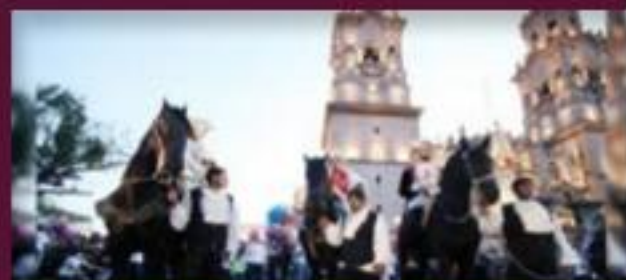
MORELIA, MICH.- A unas horas de repartir juguetes a los hogares morelianos, los tres Reyes Magos, Melchor, Gaspar y Baltasar, junto con caravanas de bailarines y personajes animados, desfilaron las calles del Centro Histórico.

Que María Santísima, Nuestra Señora María de la Salud, Madre de la Sagrada Familia de Nazareth interceda por nosotros y a todos nos ayude a imitarlo para vivir en su paz".