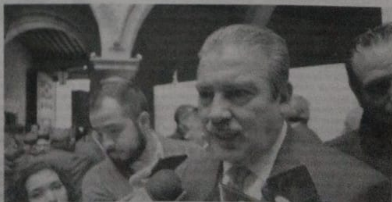
Raúl Morón, alcalde de Morelia.

Aclaró que tanto el homicidio de una persona en el boulevard García León el pasado viernes y la supuesta emboscada de la fueron objeto tres policías federales en la carretera Pátzcuaro-Morelia son hechos aislados, que no se vinculan a la versión que el crimen organizado está ingresando a la ciudad.