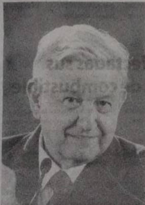
Andrés Manuel López Obrador.