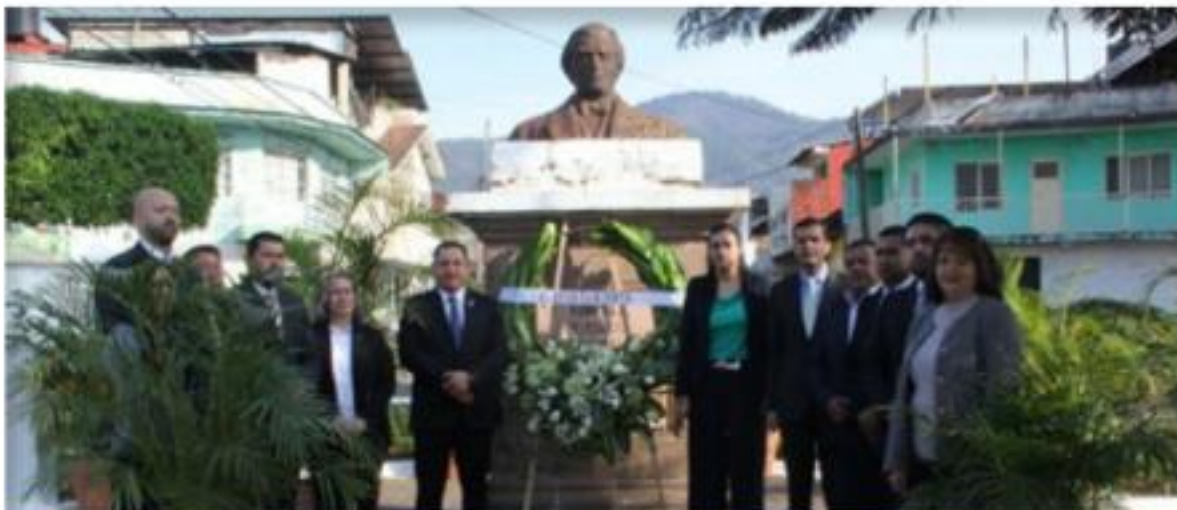
URUAPAN, MICH.- Autoridades municipales colocaron la ofrenda floral y montaron guardia de honor al pie del busto erigido en su honor, seguidos de las Respetables Logias Masónicas de Uruapan que hicieron lo propio.