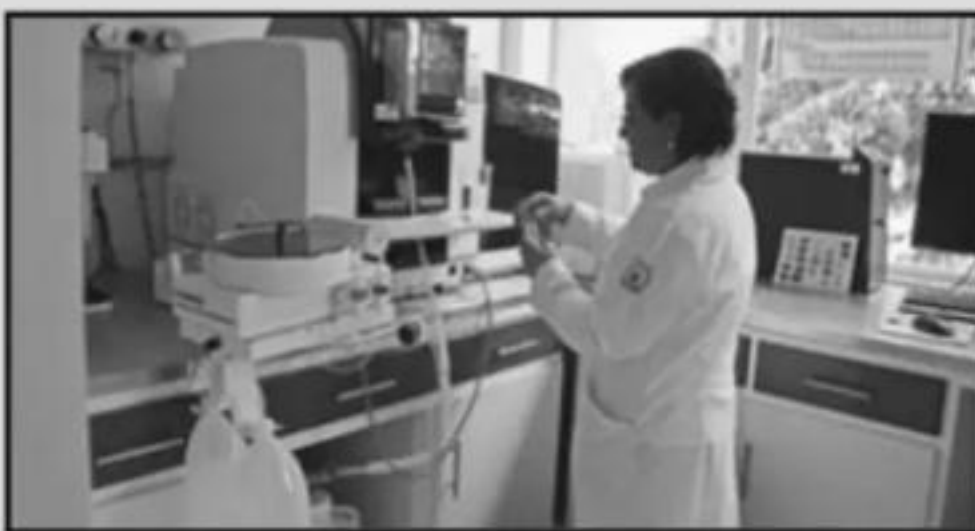
Investigación, que parece que quedó de lado durante la vigente administración.

Si bien la crisis financiera ocupa los reflectores, la Universidad Michoacana tiene una serie de retos diversos que tendr