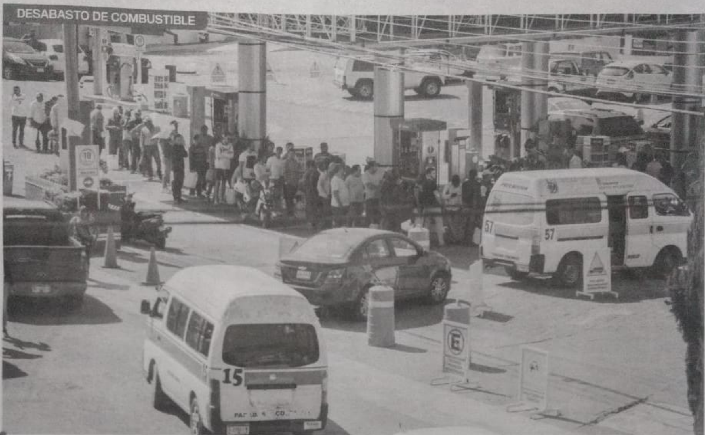
Detalló que debido a la escasez y las compras de pánico, las estaciones de servicio de la capital de Michoacán llegan a vender hasta 20 mil litros en apenas dos horas.