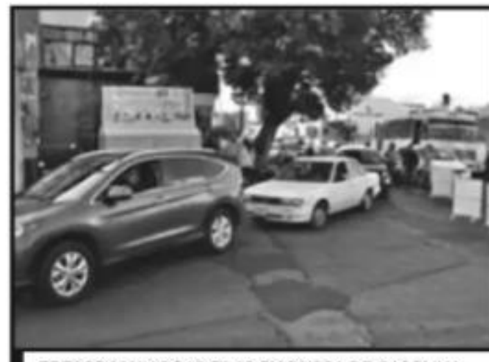
ZOZOBRA Y LARGAS FILAS EN BUSCA DE GASOLINA.