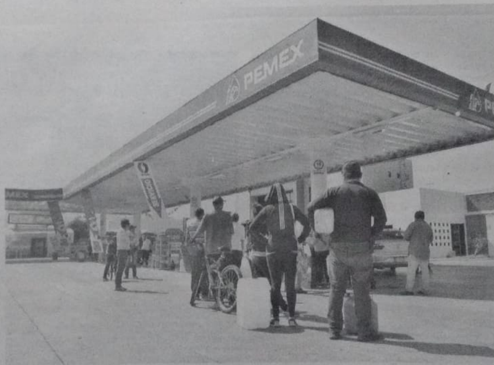
Gasolineras sin servicio continúan por la ciudad.

comprometió a garantizar la cobertura y distribución en todo el país y dijo que los retrasos en la distribución de gasolina se resolverán a la brevedad.