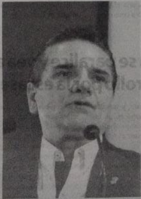
Silvano Aureoles Conejo.