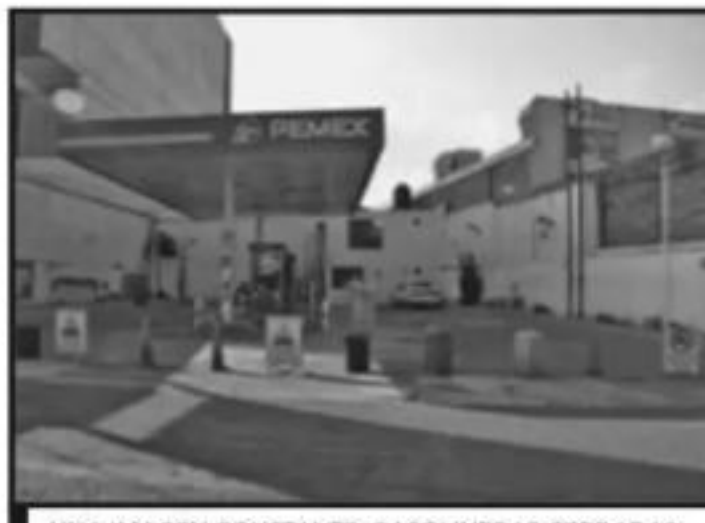
UNA IMAGEN CONSTANTE: GASOLINERAS CERRADAS.

A través de las redes sociales, el gobernador de Michoacán, Silvano Aureoles Conejo, ha pedido a Petróleos Mexicanos que ante el des-