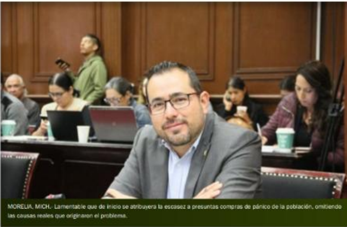
MORELIA, MICH.- Lamentable que de inicio se atribuyera la escasez a presuntas compras de pánico de la población, omitiendo las causas reales que originaron el problema.