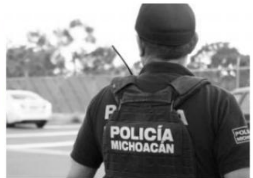
MORELIA, MICH.- La Secretaría de Seguridad Pública (SSP), en coordinación con la Federación, mantienen el operativo de prevención y vigilancia a lo largo de los 310 kilómetros de extensión de la Autopista siglo XXI.

Asimismo, se realizan patrullajes en distintos puntos de la carretera federal y se monitorea a través de cámaras de video conectadas directamente al Centro Estatal de Comando, Comunicaciones, Cómputo, Control, Coordinación e Inteligencia (C5i), para actuar de manera inmediata ante algún hecho. La SSP continúa trabajando de manera coordinada con la federación, con el objetivo de brindar paz y tranquilidad en todo el territorio michoacano.