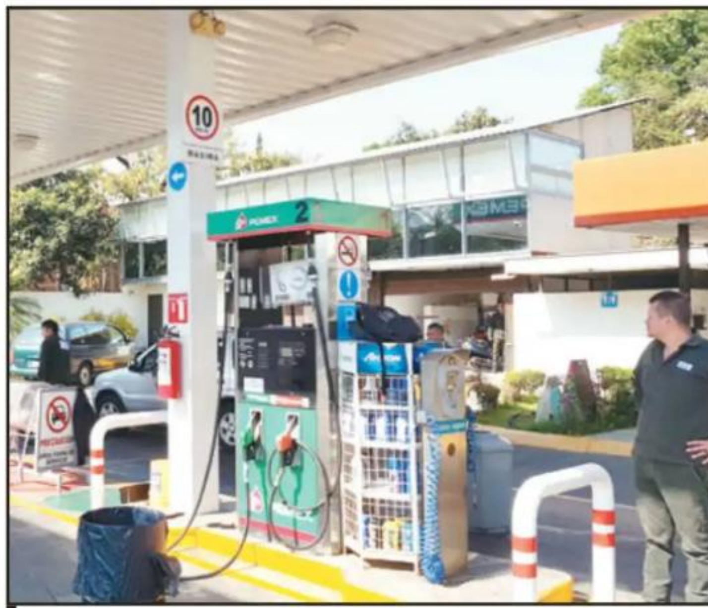
ESTACIONES DE GASOLINA EN URUAPAN FUERON SURTIDAS, PERO MATERIALMENTE LES ARREBATARON EL COMBUSTIBLE.

Precisaron que sí existe combustible, sin embargo los carro-pipa de Pemex son insuficientes para atender la demanda. "Hoy (ayer) nos llegó una pipa de gasolina como a las 8 de la mañana,