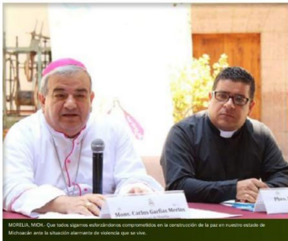
MORELIA, MICH.- Que todos sigamos esforzándonos comprometidos en la construcción de la paz en nuestro estado de Michoacán ante la situación alarmante de violencia que se vive.