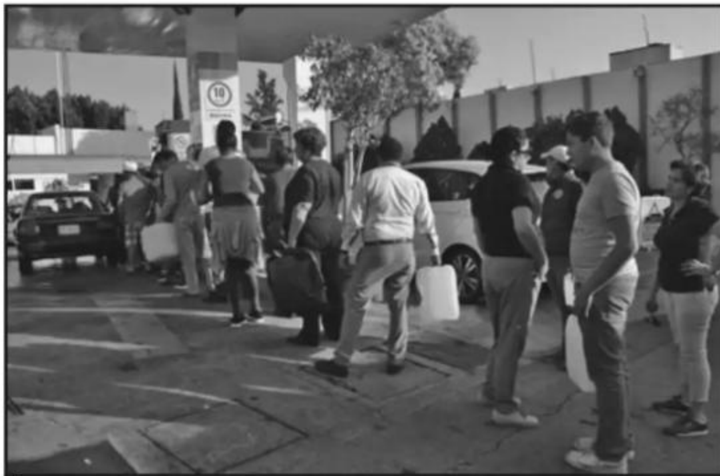
EN CARRO O A PIE. EL CHISTE ES ENCONTRAR AUNQUE SEA DIEZ LITROS DE COMBUSTIBLE PARA PODER TRASLADARSE.

abasto de gasolina en Morelia y otros puntos del estado, "apelamos a que el suministro pueda normalizarse lo más pronto posible para evitar mayores afectaciones a la población y a los sectores productivos.