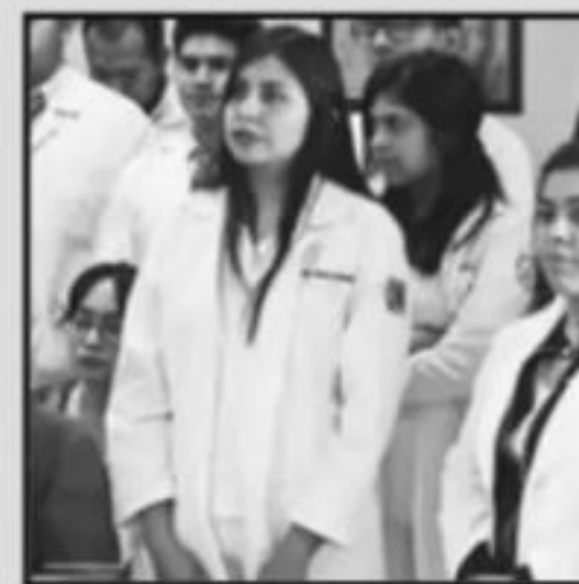
Certificar varios programas educativos h