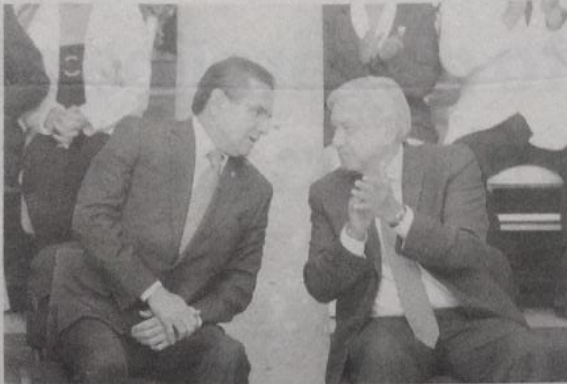
El presidente Andrés Manuel López Obrador y el gobernador Silvano Aureoles Conejo tuvieron esta semana que terminó, su primer careo del año.

Sería ingenuo desconocer que desde el gobierno del estado y del federal hay interés por al menos «palomear» al elegido, aunque en esta ocasión el segundo de los entes tendría relativa ventaja a raíz del apoyo otorgado a la UMSNH en el cierre del 2018, ante todo cuando el primero de ellos aseveró que no daría respaldo extraordinario.