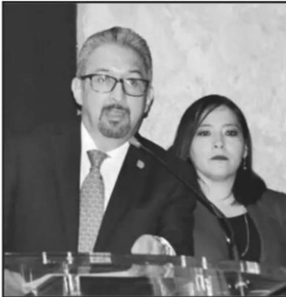
EL RECTOR MEDARDO SERNA COMPROMETIÓ QUE EL PLAN DE AUSTRERIDAD PARA LA UNIVERSIDAD MICHOACANA SERÁ PÚBLICO Y TRANSPARENTE.