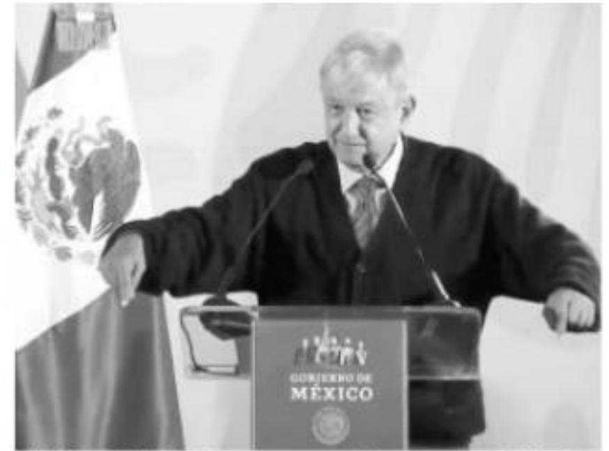
CIUDAD DE MÉXICO.- Ante el panorama de desabasto en entidades donde el combustible ya no se tiene en las gasolineras y ha provocado pánico entre la población

"Hace 25 días se robaban más de mil pipas diarias de casi 15 mil litros. ¿Cómo distribuyen esa gasolina robada? Había una actitud de complacencia al interior de Pemex", sostuvo.