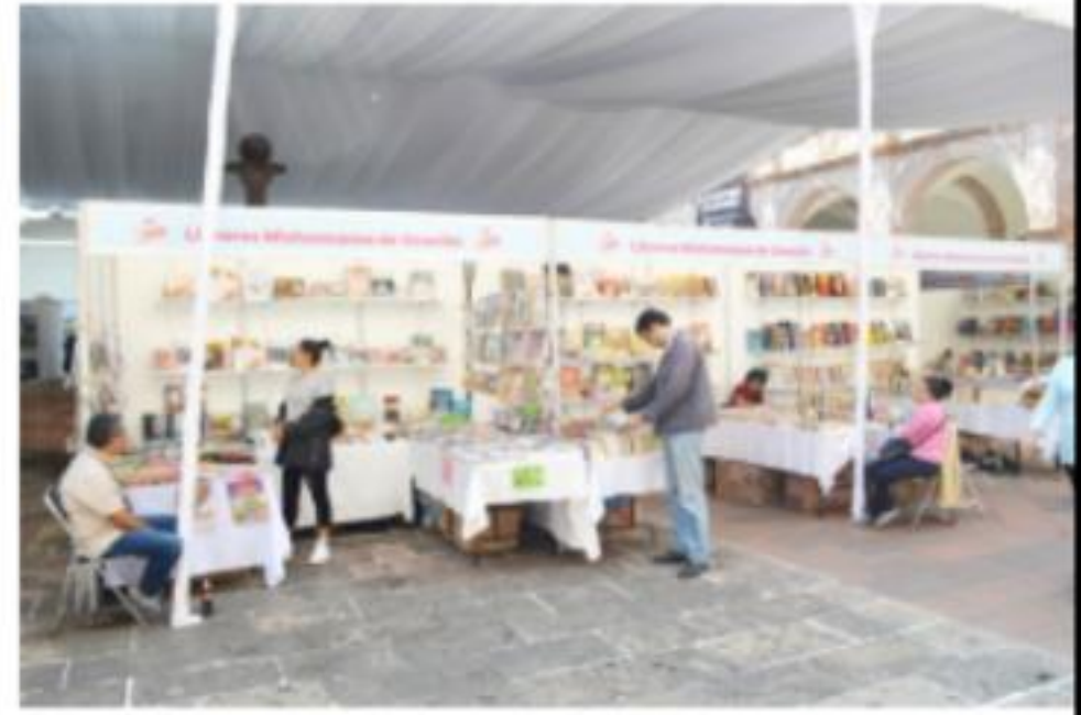
MORELIA, MICH.- Centro Cultural Clavijero alberga 11ª Feria Nacional del Libro y la Lectura.

La programación completa de la FENAL pueden consultarla en www.cultura.michoacan.gob.mx