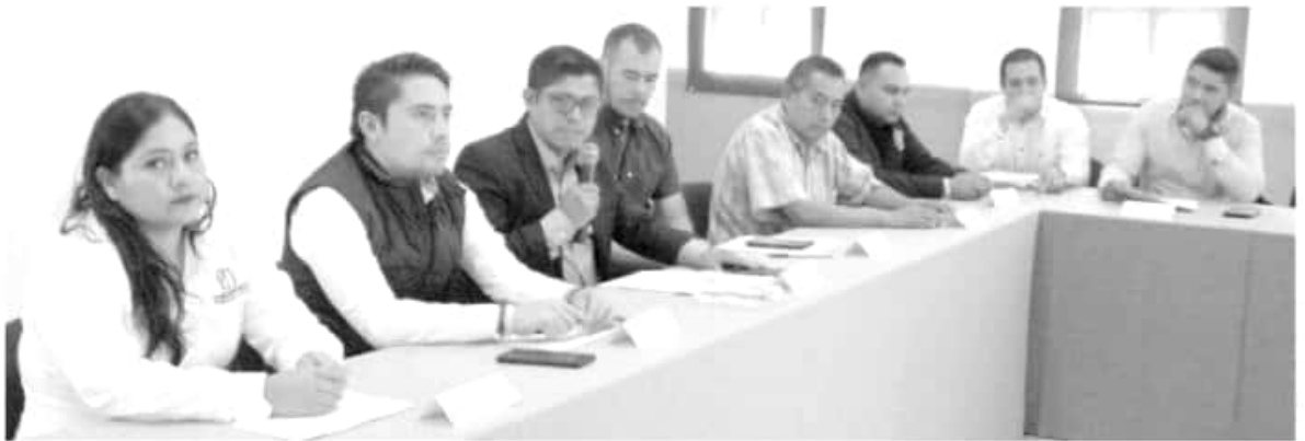
Sesión de instalación.

los distintos sectores de la ciudadanía en las tareas de planeación, programación, supervisión y evaluación, a través de las unidades de consulta y participación de la comunidad, así como proporcionar información requerida por el Secretariado Ejecutivo, entre otras funciones.