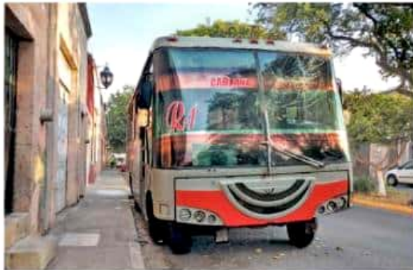
Automotores circulan con parabrisas estrellados lo que pone en riesgo a los usuarios. Fernando Maldonado