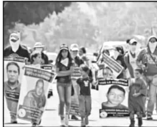
MADRES, HERMANAS, ABUELAS, HIJOS E HIJAS DE PERSONAS DESAPARECIDAS CAMINARON POR AVENIDAS ACUEDUCTO Y MADERO HASTA EL CENTRO.