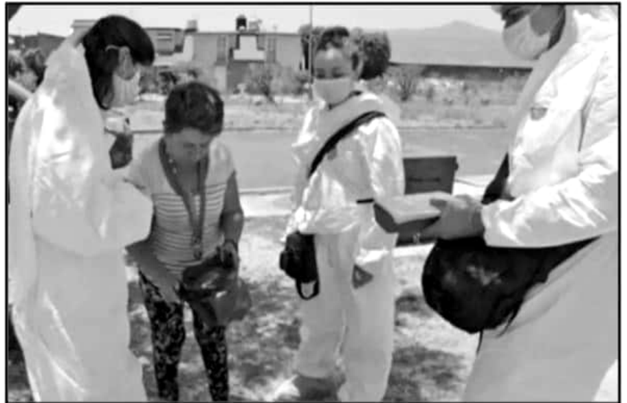
ACTIVISTAS Y PERSONAL DE LA FISCALÍA GENERAL DEL ESTADO ATENDIERON UNA DENUNCIA EN ARKO SAN ANTONIO.

sino únicamente animales en condición de calle, por lo cual propusieron llevar a estos ejemplares al centro para buscarles un hogar adoptivo, lo cual fue rechazado por parte de los vecinos de la zona.