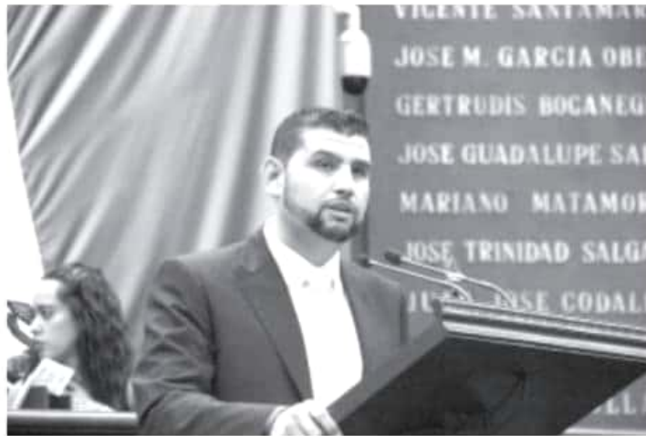
En esta iniciativa también se plantea el eliminar la corrupción en las instituciones, al transparentar los apoyos que se entregan al sector rural, con el objetivo de que los apoyos los reciban quienes verdaderamente lo necesitan.

Con estas reformas se otorga al Gobernador la facultad de expedir y actualizar el Programa Estatal de Financiamiento Rural con el propósito