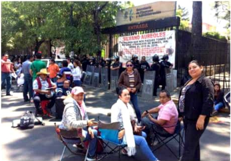
CD. LÁZARO CÁRDENAS, MICH.- La CNTE rechazó el ofrecimiento de parte del gobierno de Silvano Aureoles, para el pago a los maestros eventuales, la deuda de 65 millones de pesos en 2 emisiones, una en lo inmediato y otra en una fecha posterior sin decir cuándo.

1,200 millones y después 80 millones, para liquidar los adeudos con el magisterio michoacano y que una de las prioridades era el pago a eventuales, "hoy nos dicen que no hay dinero, que se está esperando a que la Federación deposite", añaden. Por este motivo, señala el magisterio, hacen un llamado al gobierno de Aureoles, aunque desde ayer ya con la presencia de los cuerpos policíacos, "en el plantón hay mujeres y niños, hacemos responsable al Gobierno de Aureoles Conejo de la integridad física de nuestros compañeros", sentencia la CNTE. El plantón sigue frente a la Oficina de Finanzas, aunque desde ayer ya con la presencia de los cuerpos policíacos, "en el plantón hay mujeres y niños, hacemos responsable al Gobierno de Aureoles Conejo de la integridad física de nuestros compañeros", sentencia la CNTE.