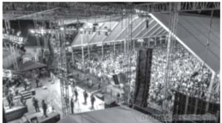
Los Angeles Azules se llevaron un gran aplauso de su público, conformado por personas de todas las edades que salieron felices de esta presentación ofrecida en el marco de la Expo Fiesta.

Los Ferbis y la Sonora Guayanguera abrieron la actividad musical en el abarrotado Teatro del Pueblo, que este viernes recibirá al cantante Mijares, en lo que se espera será otra exitosa presentación dedicada especialmente a las mamás en su día, quienes tendrán acceso gratuito solo con su boleto de entrada.