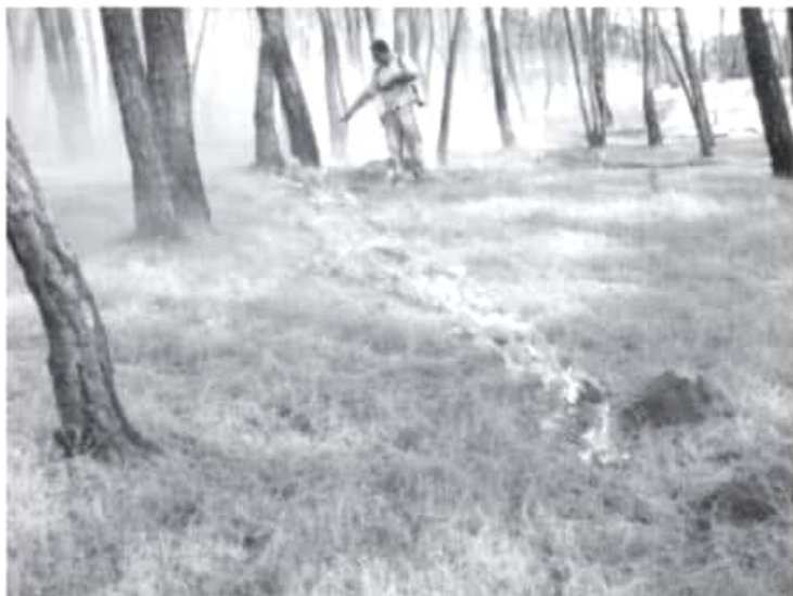
Serán dos las demandas que interpondrá la subdirección de Ecología y Medio Ambiente Municipal, contra causantes de incendios en El Candelero y El Naranjo.

Añadió que a la fecha, la Brigada Municipal de Ecología ha atendido 22 incendios forestales, pero Bomberos, Protección Civil y Seguridad Pública han acudido a otros más, por lo que la cantidad de este tipo de siniestros es alto, y seguramente continuarán por las altas temperaturas que se registran.