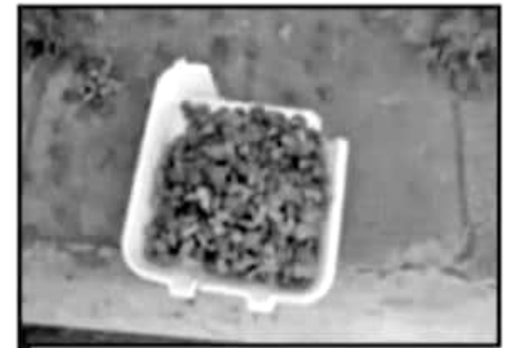
AL PARECER EN ESTAS CROQUETAS ESTABA EL VENENO.