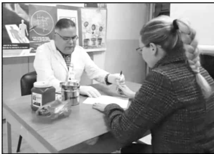
LA SSM ATIENDE DE MANERA INTEGRAL A LOS PACIENTES CON VIH/SIDA Y GARANTIZA LOS MEDICAMENTOS NECESARIOS.

toman sus medicamentos, siguen las indicaciones del médico, reducen actividades de riesgo, son conscientes de que para estar bien ellos, también deben poner