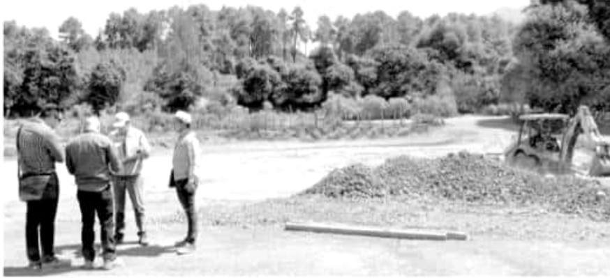
El Departamento de Dictamen Técnico sugirió la imposición de una medida de seguridad consistente en la clausura total temporal.

en un predio de ocho mil metros cuadrados, en el cual el avance de los trabajos de construcción,