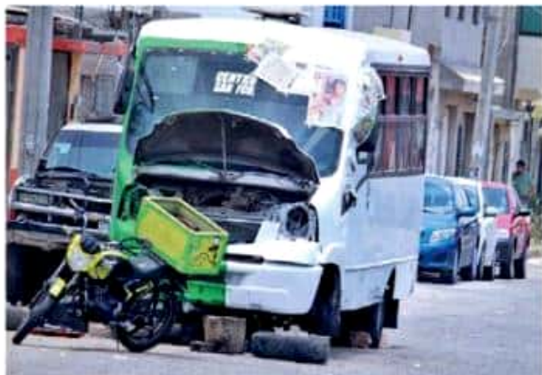
Los vehículos se descomponen mientras dan el servicio e invaden las calles sin señalización. Fernando Maldonado