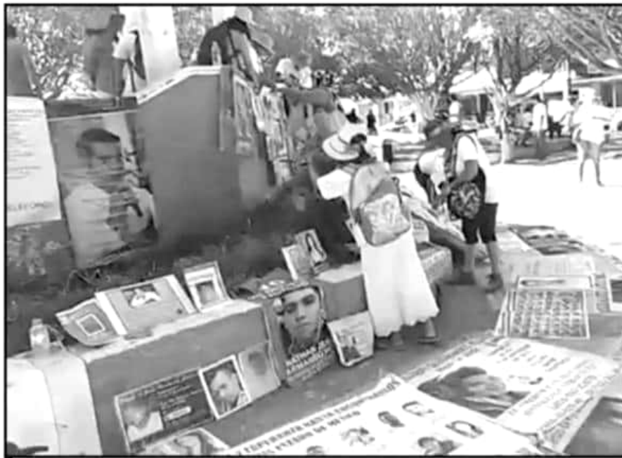
LOS INTEGRANTES DE LA CARAVANA EXPLUSIERON LAS FOTOS DE SUS FAMILIARES PARA VER SI ALGUIEN LOS RECONOCÍA.

"Caleta, mirando, también está apoyando", decían los padres y madres de familia que llegaron el pasado martes a esta parte de Michoacán y que mantienen la esperanza de ubicar indicios que les permitan encontrar a sus seres queridos y lo reafirmaron durante su caminata diciendo: "Hijo, escucha, tú madre