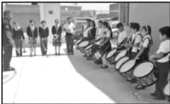
ALGUNAS DE LAS BECAS DEL PROGRAMA FEDERAL 'JÓVENES CONSTRUYENDO EL FUTURO' ES PARA SER INSTRUCTORES DE BANDA DE GUERRA.

Es de resaltar que en estos días los caravaneros han sido arrojados también por los habitantes de la tenencia de Caleta de Campos y por integrantes de colectivos como lo es El Bejuco en Movimiento y la sociedad civil en general.