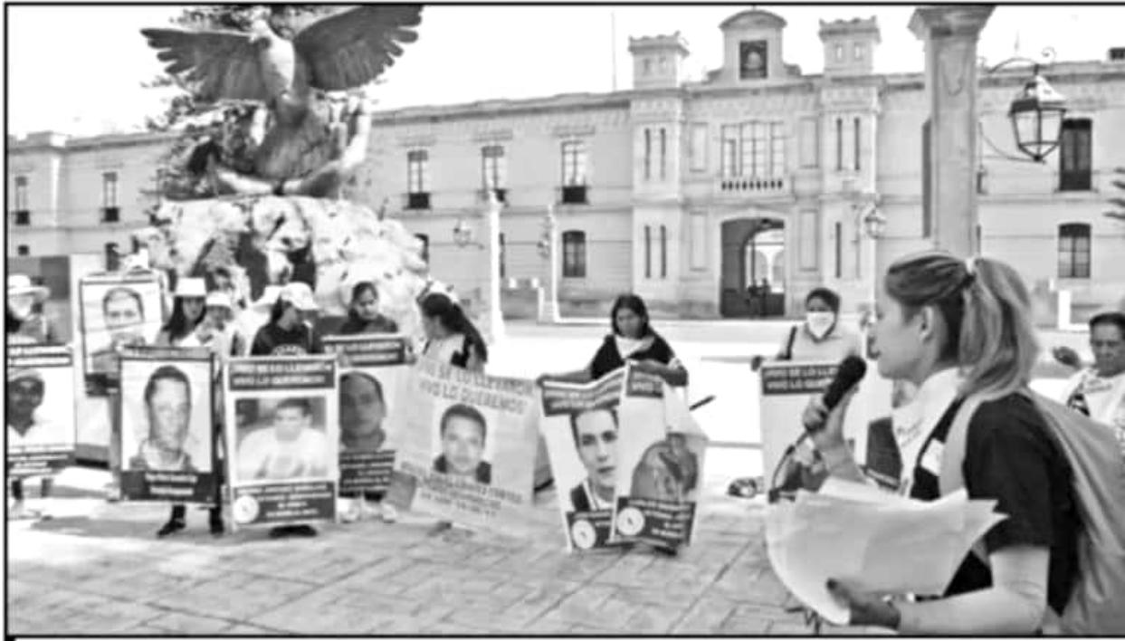
LA PRIMERA PARADA FUE FRENTE A LA XXI ZONA MILITAR. EN VIRTUD DE QUE EL EJÉRCITO TIENE MUCHAS ACUSACIONES DE DESAPARICIÓN DE PERSONAS.

forense y psicológica, de igual forma tener acceso a los expedientes o carpetas de investigación para poder dar un seguimiento puntual.