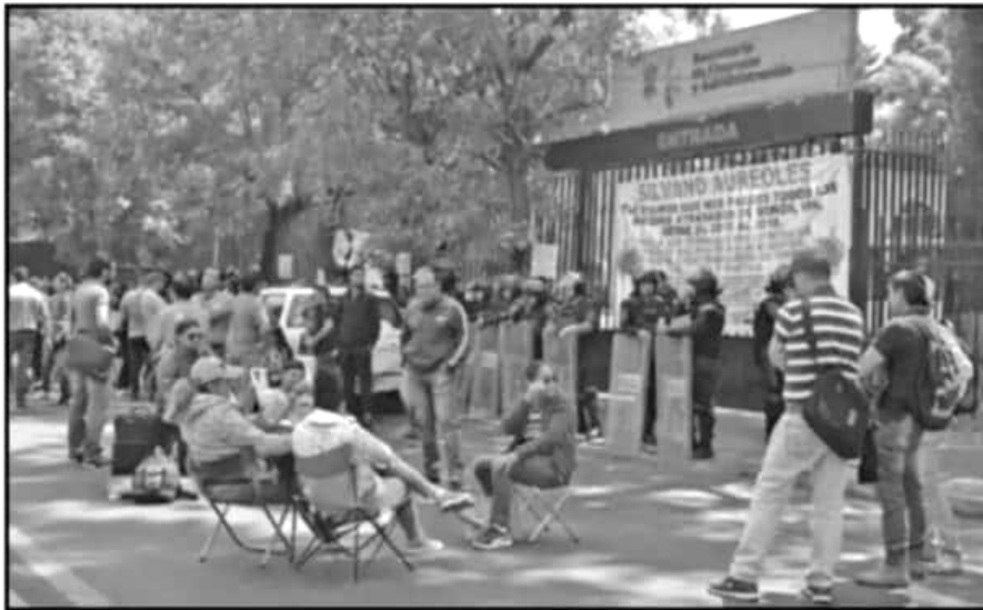
INTEGRANTES DE LA DELEGACIÓN DIII-6 SE MANIFESTARON AFUERA DE LA SECRETARÍA DE FINANZAS PARA EXIGIR PAGOS.

aplicar el dinero que se invertía en dichos eventos en un solo bono que se repartía de manera equitativa entre los trabajadores de la delegación.