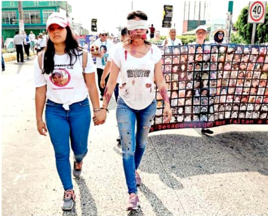
En Xalapa, la marcha fue encabezada por una mujer que representaba a una persona secuestrada, atada amordazada y torturada