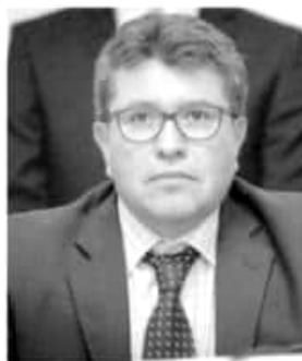
Ricardo Monreal, presidente de la Junta de Coordinación Política del Senado.

Ahí, según ellos, condicionó recursos presupuestales que pu-