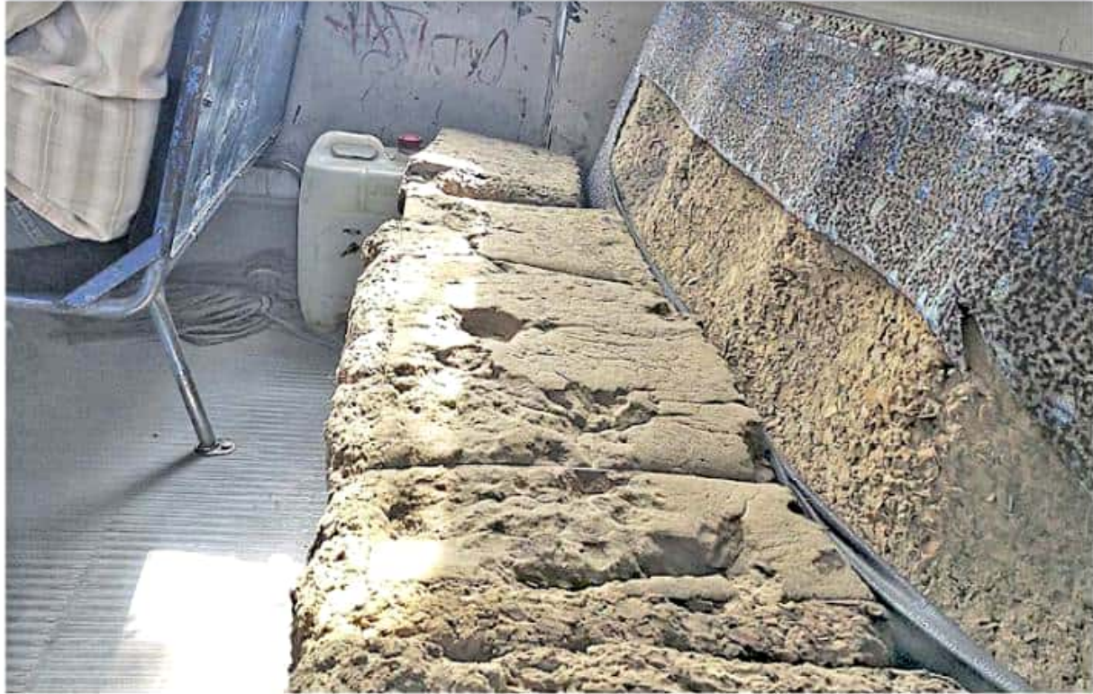
La mayoría de los camiones que dan el servicio a la población se encuentra en malas condiciones. Fernando Maldonado