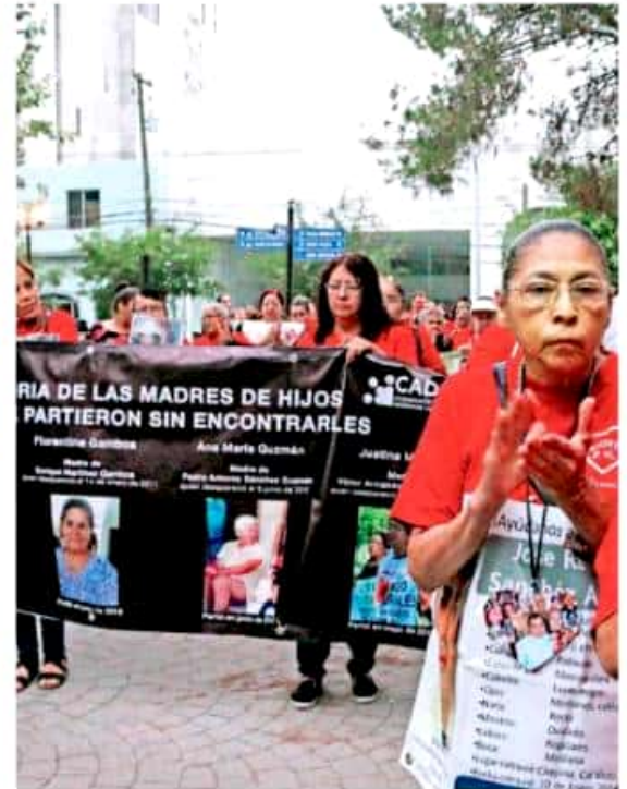
AMORES y CADHAC recordaron a cinco madres de desaparecidos que partieron antes de encontrarlos / DAVID CASAS