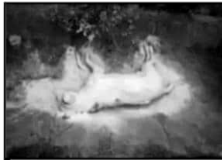
AL MENOS 14 PERROS SUFRIERON ENVENENAMIENTO.

Los reportes de agencias refieren que personal del Centro de Atención Animal (CAA) del Ayuntamiento de Morelia acudió al sitio, donde entabló contacto con los vecinos y recorrió el área pero no ubicó fuentes de envenenamiento de los perros