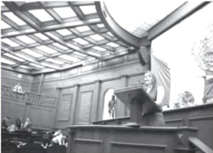
La diputada priista destacó que las reformas previstas a la Ley de Salud, buscan garantizar la cobertura de los servicios de salud, para que toda persona pueda hacer efectivos sus derechos.

-Actualmente se estima que alrededor de un 26 por ciento, es decir más de 200 mil michoacanos no tienen acceso a servicios de salud