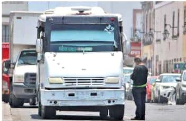
Es evidente la falta de placas de circulación en algunas unidades. Fernando Maldonado