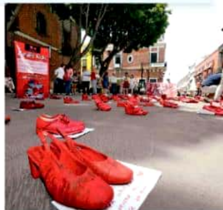
En Puebla, el Colectivo Voz de los Desaparecidos denunció ineficacia de las autoridades

El contingente se reunió en el Jardín de las Madres a las 10:00 horas de ayer, para partir rumbo a Plaza de Armas atravesando la avenida Hidalgo.