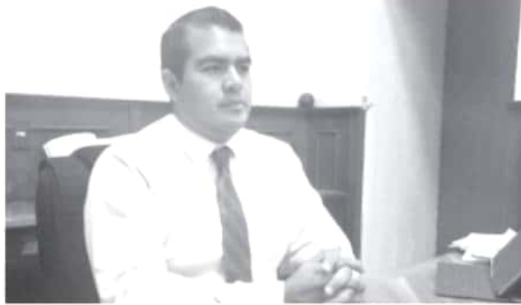
El presidente municipal considera indispensable, para alcanzar el desarrollo pleno y la generación de empleos, que el municipio cuente con la infraestructura que necesita la producción agroalimentaria.

El presidente municipal considera indispensable, para alcanzar el desarrollo pleno y la generación de empleos, que el municipio cuente con la total infraestructura que necesita la producción agroalimentaria: «Estamos estimando que en el rubro del aguacate entre 2019 y 2020 debemos de generar cerca de 20 mil empleos, si logramos la meta de instalar uno o dos empaques, esto nos va a