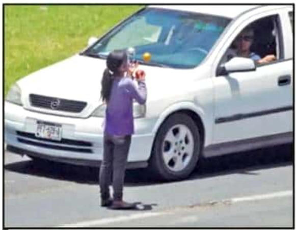
SI BIEN LA MAYORÍA SON HOMBRES, EXISTEN TAMBIÉN DECENAS DE NIÑAS QUE TRABAJAN EN LAS CALLES DE LA CAPITAL. EL PROBLEMA VA EN AUMENTO.

rentan ser sus padres. El Centro Histórico de Morelia no se escapa de esta situación. En el lugar es común ver a decenas de niños en diferentes puntos, ofreciendo a los turistas y visitantes desde dulces hasta artesanías locales. Este tipo de casos son los más difíciles de documentar para las autoridades. Cuando se acerca cualquier autoridad a hacer preguntas, los niños salen corriendo a esconderse.