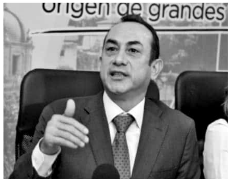
MORELIA, MICH.- El dirigente estatal del PRD, recalcó que México no puede asumir una política migratoria de rottweiler para tranquilidad de Estados Unidos.

Por ello, consideró más que oportuno que el Senado de la República llame a comparecer al Secretario de Relaciones Exteriores, Marcelo Ebrard para que explique de qué se tratan las "letras chiquitas" del acuerdo con Estados Unidos.