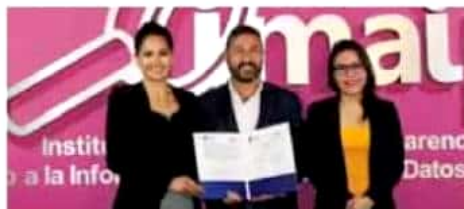
El Ayuntamiento de Pátzcuaro y el Imaip firman convenio de colaboración.