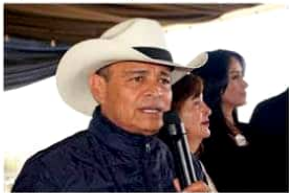
El diputado local convivió con algunos representantes de los medios de comunicación en el marco del "Día de la Libertad de Expresión".