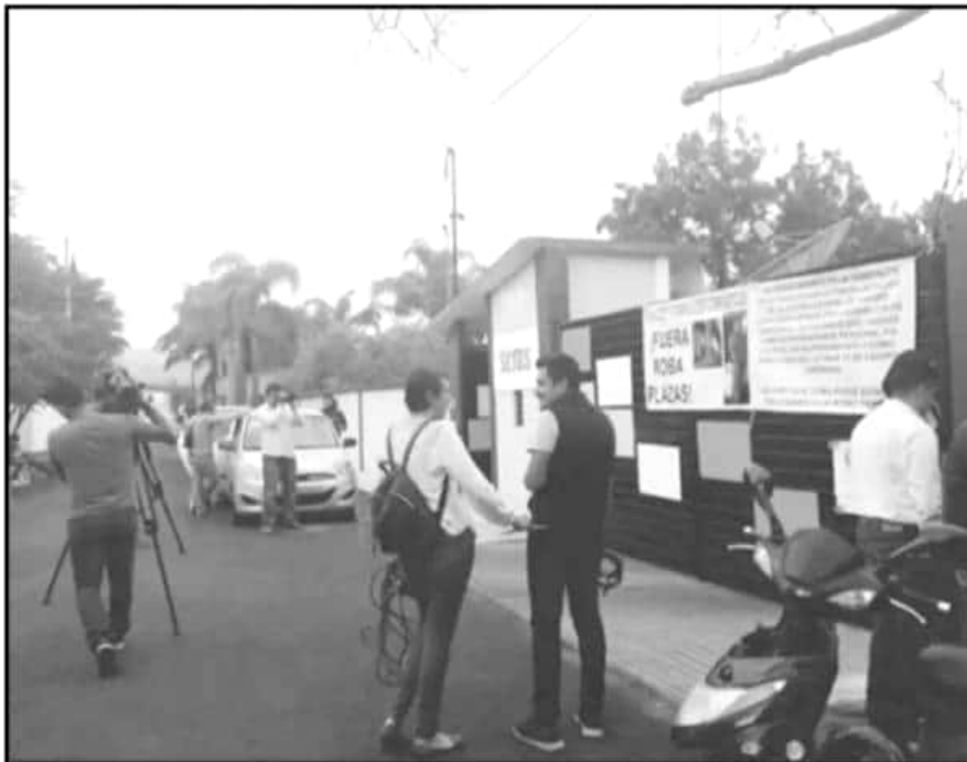
MANIFESTANTES SE QUEJARON DE PERFILES QUE NO PUEDEN DIRIGIR LA EDUCACIÓN AGROPECUARIA DEL ESTADO.

donde aparecen personas totalmente desconocidas y los movimientos de quincenas posteriores que se podrán encontrar".