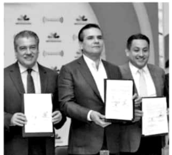
MORELIA, MICH.- En tan sólo un año, Michoacán logró subir del lugar 30 al 17 a nivel nacional en mejora regulatoria, lo que además abona a generar un entorno de mayor confianza para la inversión.