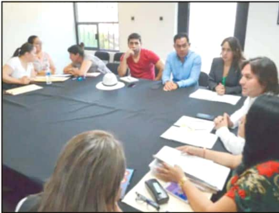
VECINOS DEL FRACCIONAMIENTO VISTA BELLA EXIGEN RESPUESTAS POR LA VENTA A LA CONSTRUCTORA DE UN ÁREA VERDE.

GOBIERNOS atrás se aprobó la venta del terreno