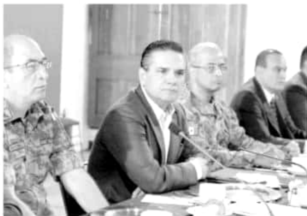
Silvano Aureoles Conejo, gobernador de Michoacán.

Independiente de la continuidad o no de la Zona Económica Especial (ZEE) de Lázaro Cárdenas-La Unión, la reunión entre el presidente Andrés Manuel López Obrador y el propietario de la empresa Arcelor Mittal, Laskhmi N. Mittal, dan certeza en la continuidad de la inversión en el Puerto de Lázaro Cárdenas, afirmó el gobernador, Silvano Aureoles.