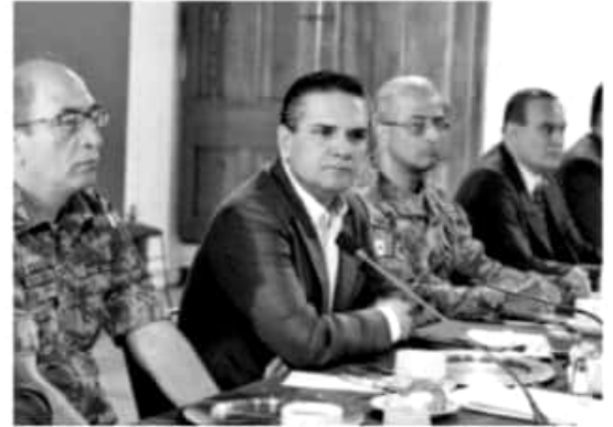
MORELIA, MICH.- El Gobernador Silvano Aureoles Conejo, encabezó este martes la reunión semanal de la Mesa de Coordinación Estatal para la Construcción de la Paz.

Aureoles Conejo solicitó a las autoridades federales y estatales que integran este grupo de trabajo, no disminuir el ritmo de trabajo y la coordinación, al tiempo que confió en que, con la próxima llegada de la Guardia Nacional a Michoacán, podrán reforzarse las operaciones por mantener el orden, la gobernabilidad y la paz.