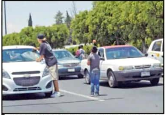
LAS PELOTAS SE HAN VUELTO SU PRINCIPAL HERRAMIENTA. PRACTICAN Y LLEVAN SUS HABILIDADES HACIA LOS CRUCEROS PARA BUSCAR EL SUSTENTO DIARIO.