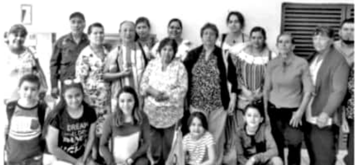
MORELIA, MICH.- Durante la presente administración, 92 beneficiarios de una pensión del seguro social americano, han sido apoyados por el Gobierno de Michoacán.

Si bien, aun falta mucho por hacer, Michoacán como estado binacional, avanza y mantiene acciones permanentes en favor de los connacionales y sus familias, como una forma de retribuirles el esfuerzo que hacen por la entidad y el desarrollo de sus seres queridos y sus comunidades.