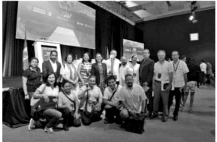
MORELIA, MICH.- La Delegación Regional del Instituto Mexicano del Seguro Social (IMSS) en Michoacán, será sede del XXVI Foro Norte de Investigación en Salud en el 2020.

en la Unidad de Medicina Familiar No. 80 de Morelia, que actualmente cuenta con pacientes que trabajan en la misma y que han reducido sus niveles de sobrepeso y obesidad y, en consecuencia, retrasado o abatido la llegada de enfermedades crónico degenerativas como la insuficiencia renal crónica.