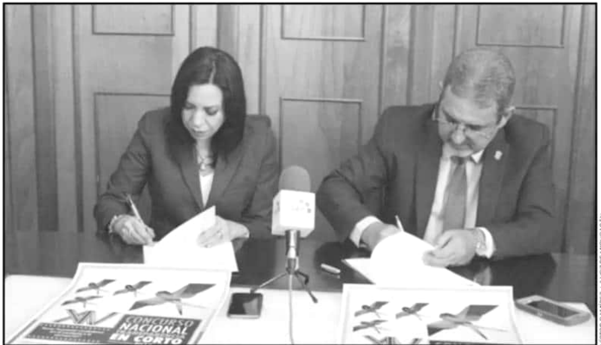
LA RECTORA DE LA UNLA Y EL TITULAR DE LA SECOEM FIRMARON EL CONVENIO PARA PARTICIPAR EN EL CONCURSO NACIONAL ‘TRANSPARENCIA EN CORTO’.

Ante funcionarios de la Secoem y medios de comunicación, la rectora también compartió la anécdota de un joven egresado del bachillerato de la UNLA que contaba con conocimientos de inglés, francés y mandarín, y solicitó una beca en una universidad de Puebla para cursar la carrera