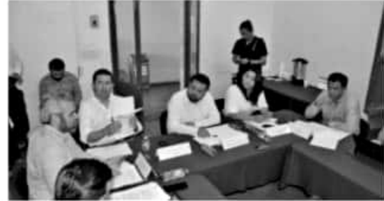
MORELIA, MICH.- La Comisión de Puntos Constitucionales otorgó el lugar a admitir a discusión diversas iniciativas turnadas por el Pleno del Congreso para su estudio y análisis.

Finalmente, los integrantes de esta Comisión reiteraron su compromiso de hacer guardar los principios constitucionales y con ello, construir marcos legales acordes a la realidad y a las necesidades de nuestra sociedad.