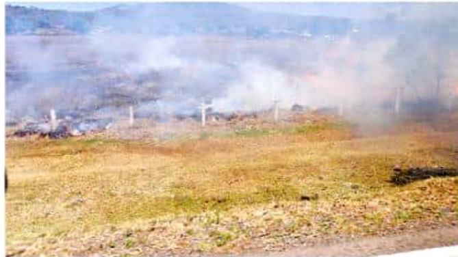
En fechas próximas el Ayuntamiento iniciará la reforestación de áreas dañadas con una plantación de 200 mil árboles.