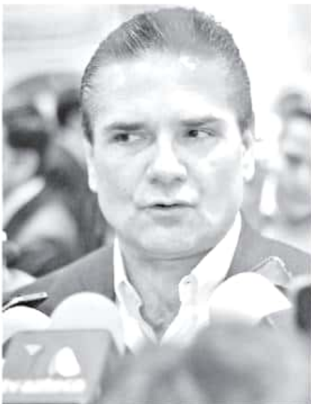
El gobernador afirmó que la violencia se ha mantenido latente en los últimos 100 años. MARIANA LUNA

Finalmente, Aureoles Conejo enfatizó nuevamente que los ediles o ayuntamientos son los responsables de garantizar la seguridad pública de sus municipios, invitándoles a que antes de priorizar cualquier otro tema, como obras públicas, hagan el reforzamiento de elementos policíacos y diseño de sus propias estrategias.