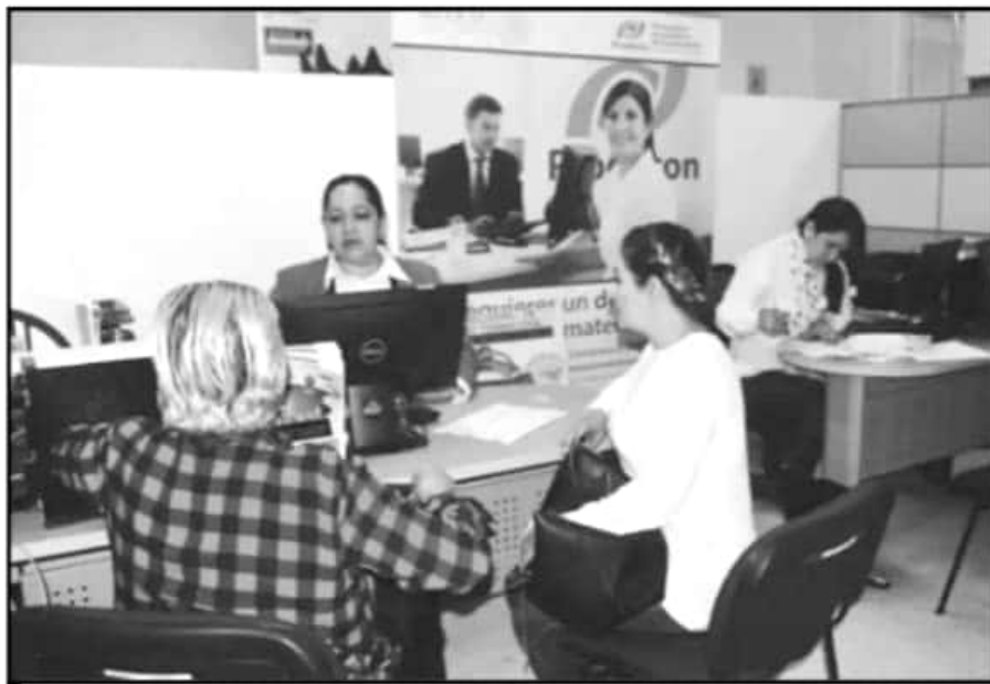
ANTE LA RECURRENTE CORRUPCIÓN Y "MOCHES" EN LOS TRÁMITES BUROCRÁTICOS, PROMUEVEN LA DIGITALIZACIÓN.

También se pretende lograr la simplificación 87 de los 879 trámites y servicios prioritarios, con lo que se pretende generar un ahorro de mil 035 millones de pesos de gasto en trámites burocráticos, estimación que hizo el Consejo Coordinador Empresarial en Michoacán (CCEEM) sobre cuánto le cuesta al ciudadano hacer un trámite tomando en cuenta el costo real y el tiempo invertido.