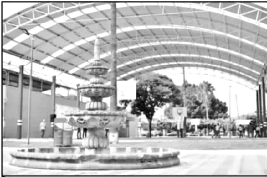
LA OBRA SE CONCRETÓ GRACIAS AL TRABAJO CONJUNTO DE MUNICIPIO, FEDERACIÓN, FEMSA Y EL CONGRESO.