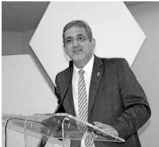
MORELIA, MICH.- Michoacán será sede de la Segunda Reunión Ordinaria de la Región Centro-Pacífico de la Comisión Permanente de Contralores Estados-Federación (CPCE-F).

En este sentido, mencionó que esta actividad forma parte del Plan Anual de Trabajo que se lleva a cabo en la CPCE-F para darle seguimiento y aplicación de las líneas de acción, actividades y proyectos a desarrollar por parte de la región Centro-Pacífico. La Comisión Permanente de Contralores Estados-Federación vincula a los órganos de control y evaluación de la gestión pública del gobierno federal y de los gobiernos estatales, que promueve la ejecución de mecanismos o instrumentos de control bajo los conceptos de transparencia y rendición de cuentas.