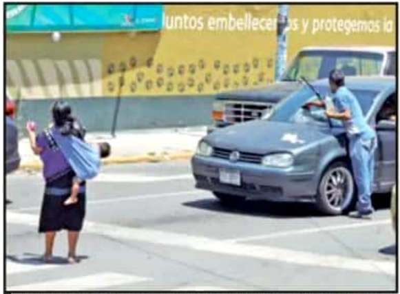
LIMPIANDO PARABRISAS O VENDIENDO, ALGUNOS MENORES ESTÁN CERCA DE QUIENES APARENTEMENTE SON SUS PADRES; LA CALLE ES SU CENTRO LABORAL.