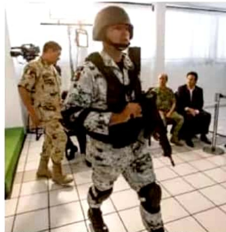
En los próximos días iniciará la construcción de la base.

"Si nosotros dijéramos que no, estaríamos mintiendo; lo más importante es que nos hagamos cargo de lo que nos corresponde al municipio, la federación y el estado. Cuan-