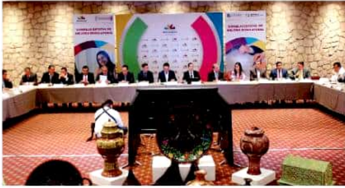
Sector privado, autoridades del estado y de varias comunas signaron el convenio de Agenda Estatal de Mejora Regulatoria y Vinculación Municipal. MARIANA LUNA