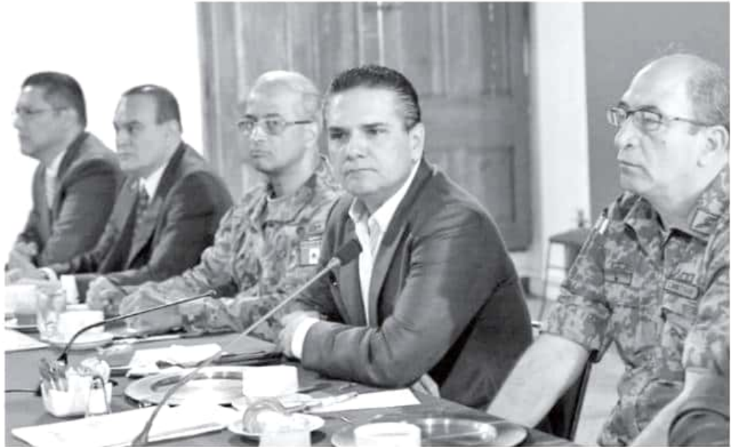
El gobernador Silvano Aureoles revisó la aplicación de la segunda fase del Plan Integral de Seguridad, que incluye precisamente el despliegue de elementos de la Policía Michoacán para reforzar las labores en regiones estratégicas.