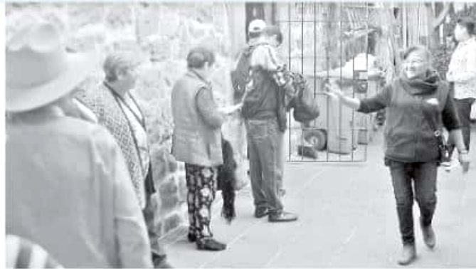
Los primeros interesados en que se fortalezca el régimen actual son los trabajadores, aseguró Nava Hernández. CARMEN HERNÁNDEZ

De acuerdo a su relato, los atendió la directora general de Educación Superior,