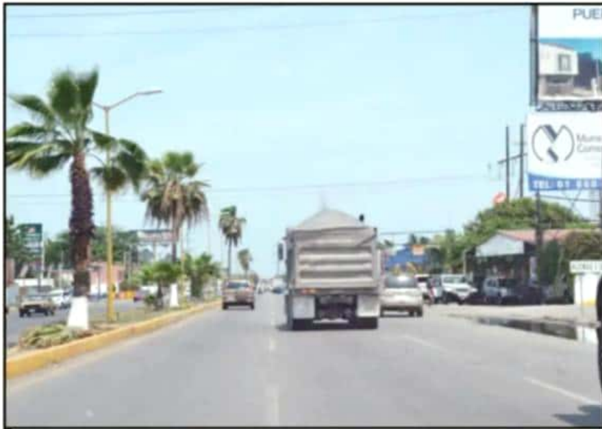
CON EL MACRO DISTRIBUIDOR VIAL SE MEJORARÁ EL TRÁFICO DE ENTRADA Y SALIDA A LA AUTOPISTA SIGLO XXI

Para formalizar los trabajos, los representantes del gobierno