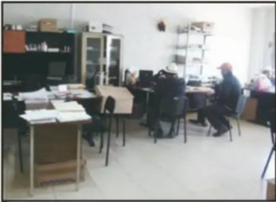
EL 14 DE DICIEMBRE ES LA FECHA LÍMITE PARA QUE LOS PRODUCTORES ACUDAN A LAS OFICINAS DE LA SADER A ENTREGARLA COMPROBACIÓN.