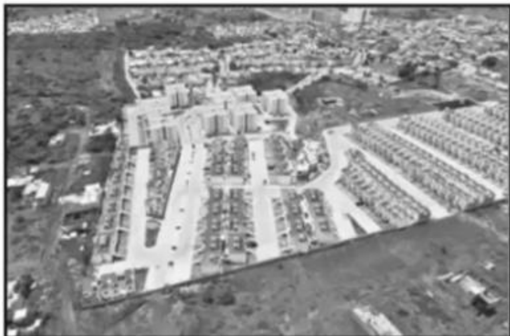
LA MESA DE SEGURIDAD AMBIENTAL SOLICITARÁ A LAS CONSTRUCTORAS QUE COMPROBEN LOS TRES DICTÁMENES QUE DEBIERON SACAR PARA FRACCIONAR.

"En el Cerro del Quinceo hay pseudodirigentes que se valen de