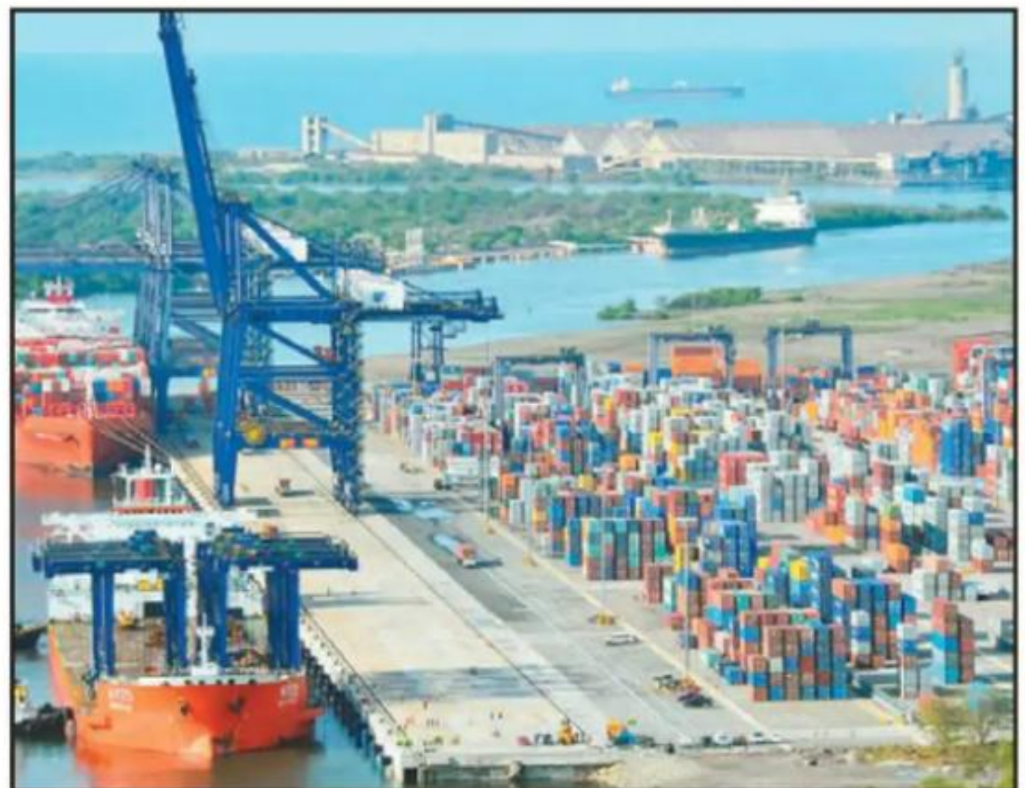
El gran proyecto de la Zona Económica Especial de LC podría venirse abajo ante declaraciones de AMLO.

Señor presidente de la República, hoy más que nunca necesitamos que la Federación haga justicia a Michoacán, y que tome la administración de la educación pública en nuestro estado para que los profesores, reciban a tiempo sus pagos, y que no se sangre más a los sectores del campo, y de la infraestructura socioeconómica del pueblo Michoacano, no son tiempos de venganzas o pleitos electoreros o partidistas, confiamos en su comprensión y en su visión de cambio y de estadista, por el bien del pueblo de Michoacán y del país.