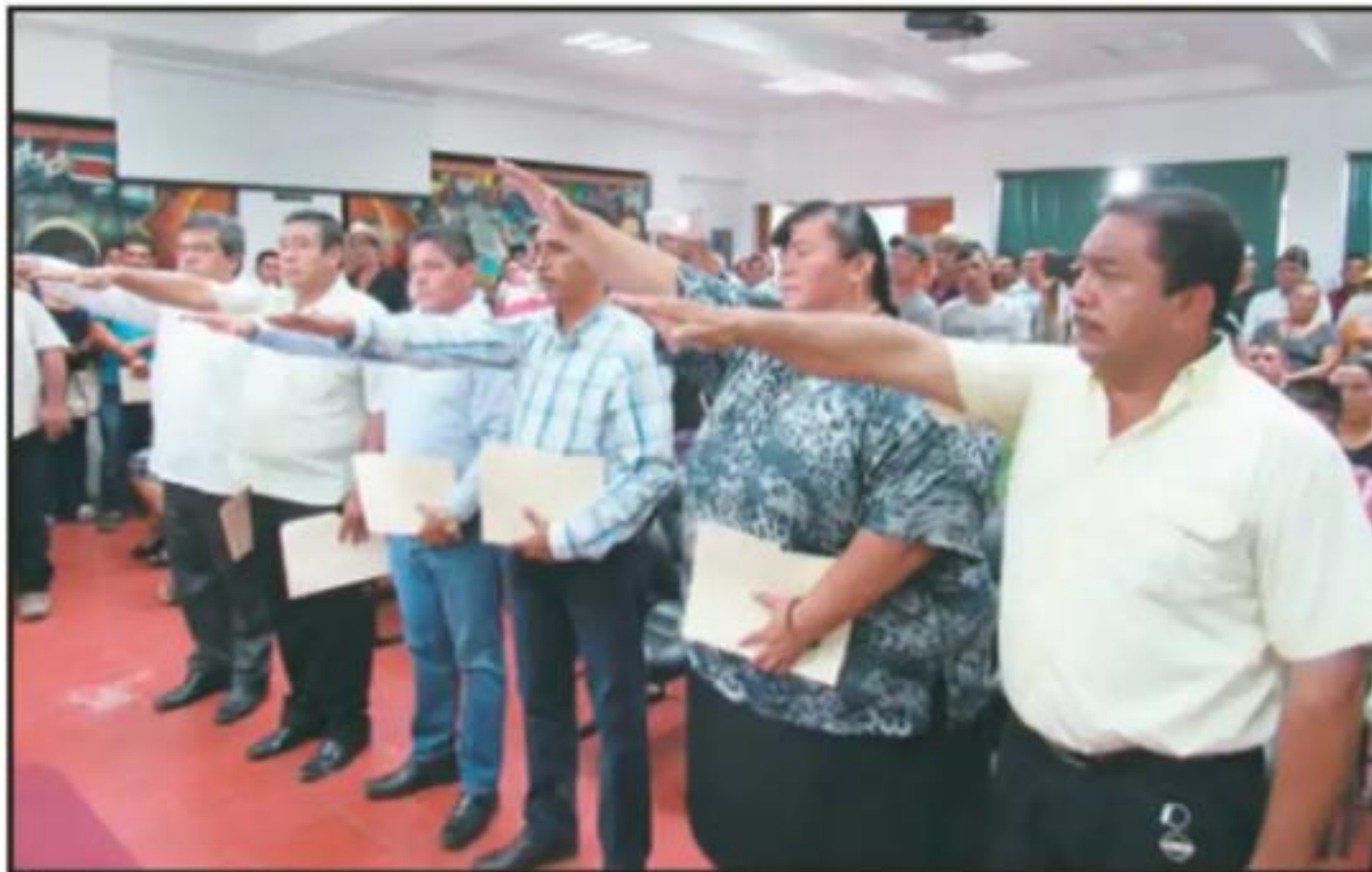
AYER SE ENTREGARON LOS NOMBRAMIENTOS A LOS NUEVOS AUXILIARES DEL AYUNTAMIENTO DE LÁZARO CÁRDENAS.

ción, comentó que si bien las nuevas autoridades auxiliares están identificadas con algún partido político desde el momento en que toman posesión de su encargo habrán de trabajar, incansablemente, para todos los ciudadanos del municipio, "por qué los cargos se ganaron por un plebiscito ciudadano quedando afuera los