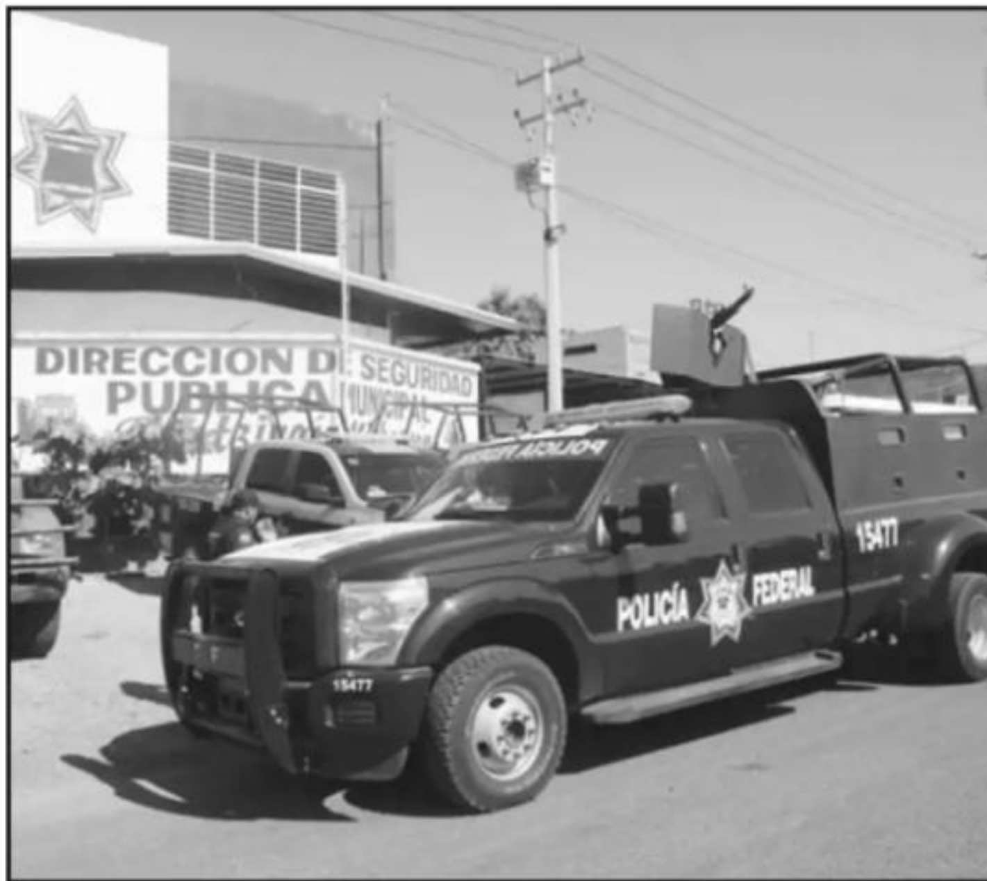
POLICÍAS MILITARES POR FEDERALES, COMPONEN LA GUARDIA NACIONAL INSTRUMENTADA POR EL GOBIERNO.

Cuestionado sobre si la presencia de elementos de la Policía Militar y la posible conformación posterior de una Guardia Nacional puede incidir para que no se requiera de efectivos de la Policía Michoacán en la ciudad capital, respondió que estas agrupaciones tendrían atribuciones similares a la de las policías estatales, pero en el caso de Morelia no llegarían a hacer una sustitución. "La Guardia Nacional tendría reacción ante delitos que atiende la Policía estatal, pero siempre es importante mantener la participación de