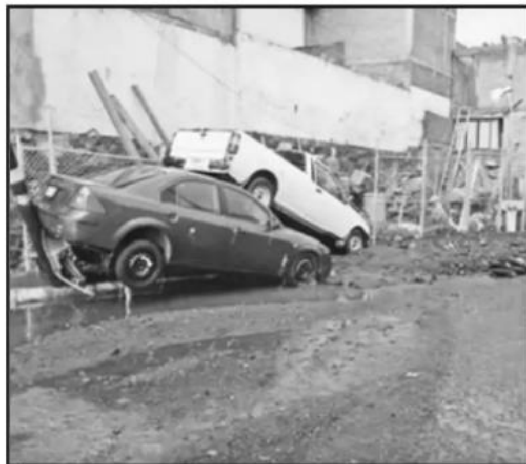
LAS LLUVIAS DE JULIO DEMOSTRARON EL PELIGRO QUE CORREN LAS CASAS Y FAMILIAS QUE ESTÁN TANTO EN ASENTAMIENTOS LEGALES COMO ILEGALES.

la necesidad de la gente, la vivienda y de los terrenos y empiezan de manera ilegal a generar expectativas a terrenos donde no corresponde. Las autoridades o quienes tienen responsabilidad andamos haciendo desalojo y estas gentes nos reclaman a nosotros. En el caso del Quinceo se tiene que hacer una acción conjunta entre el Ayuntamiento y el gobierno del estado para desalojar a los que de manera ilegal están ahí porque no hay permisos para estos asentamientos y es una tarea conjunta a impedir que se siga estirando la mancha urbana", explicó el funcionario estatal en entrevista para La Voz de Michoacán.