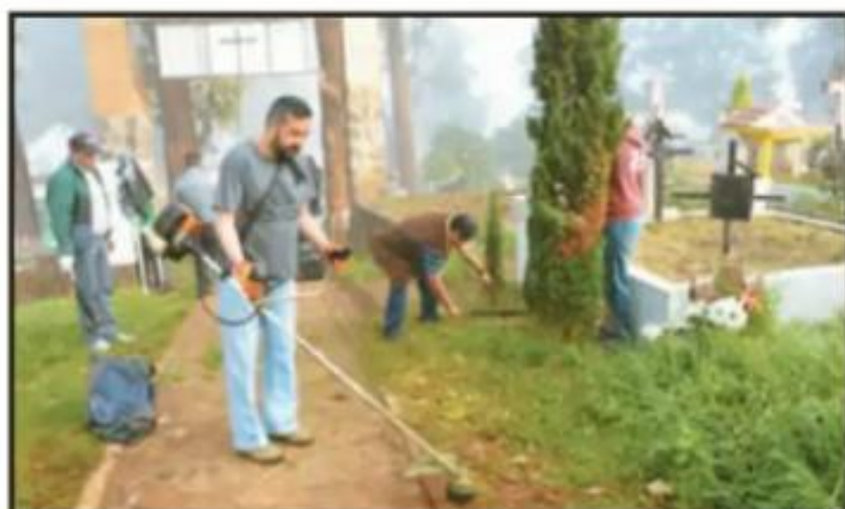
EL EDIL DE PÁTZCUARO INVITA A LA POBLACIÓN A SUMARSE A LAS ACCIONES.