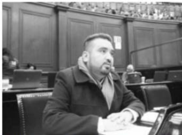
MORELIA, MICH.- Con la llegada del nuevo Gobierno Federal, se requiere de una nueva visión en el impulso de políticas públicas para la atención de los migrantes y sus familias en nuestro país

"Los migrantes representan una importante derrama económica para Michoacán, sin embargo, muchos de sus derechos son vulnerados, por ello, desde la Ley debemos garantizar que las autoridades promuevan, fomenten y difundan estos derechos, pero también para que desde los diversos niveles de Gobierno se establezcan las condiciones para su progreso, protección y bienestar". Recordó que son más de 4 millones de michoacanos radicados en el extranjero, por lo que también se pronunció a favor de garantizar la representación directa de ese sector de la población en el Congreso Estatal, por lo que también se trabajará en una propuesta legislativa.