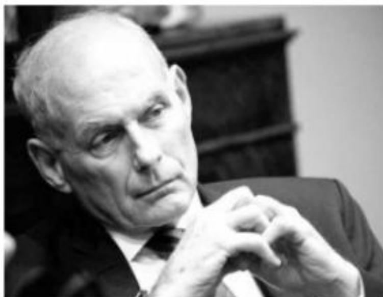
WASHINGTON.- El presidente estadounidense, Donald Trump, anunció hoy que su jefe de gabinete, el general John Kelly, dejará su cargo a fin de año