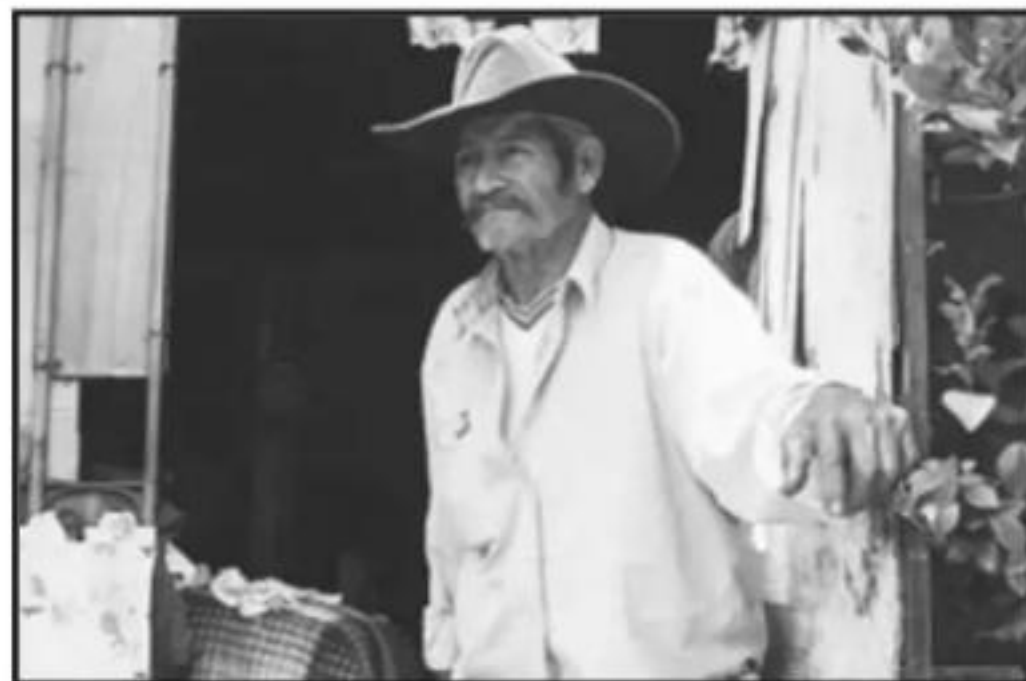
MUCHAS FAMILIAS ACUDEN A ESTA ZONA COMO ÚLTIMA OPCIÓN PARA ENCONTRAR UN LUGAR PARA SU VIVIENDA ANTE EL CRECIMIENTO DEMOGRÁFICO.