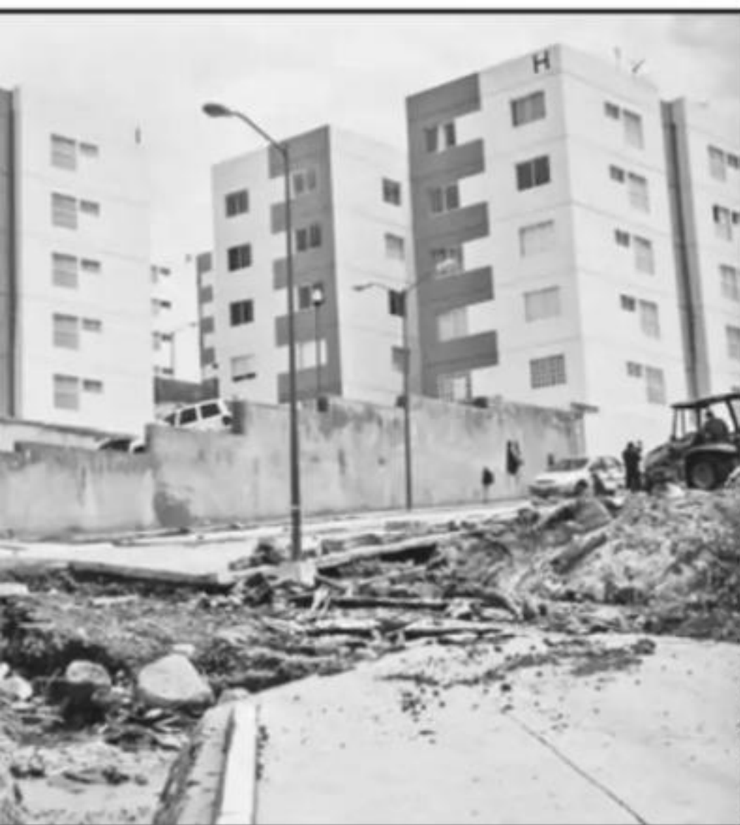
SE ENCUENTRA BUENA PARTE DE LOS FRACCIONAMIENTOS EN EL QUINCEO, DICE SEMACDDET.