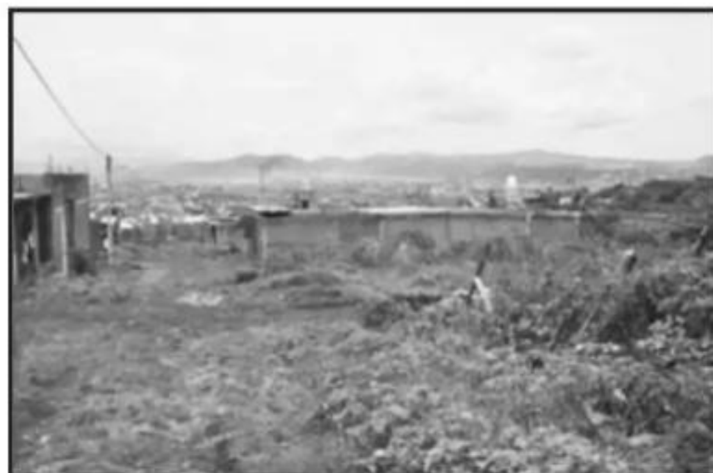
DESGRACIADAMENTE, ASOCIACIONES DE TODO TIPO APROVECHAN ESTAS ZONAS Y LA NECESIDAD DE LA GENTE PARA LUCRAR CON ELLA EN EL QUINCEO.