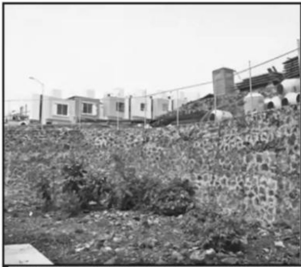
LA MALA DISPOSICIÓN DE CALLES Y LOS CURSOS DEL AGUA AYUDARON PARA HACER MÁS DRAMÁTICAS LAS TORRENCIALES LLUVIAS DE MEDIADOS DE AÑO.