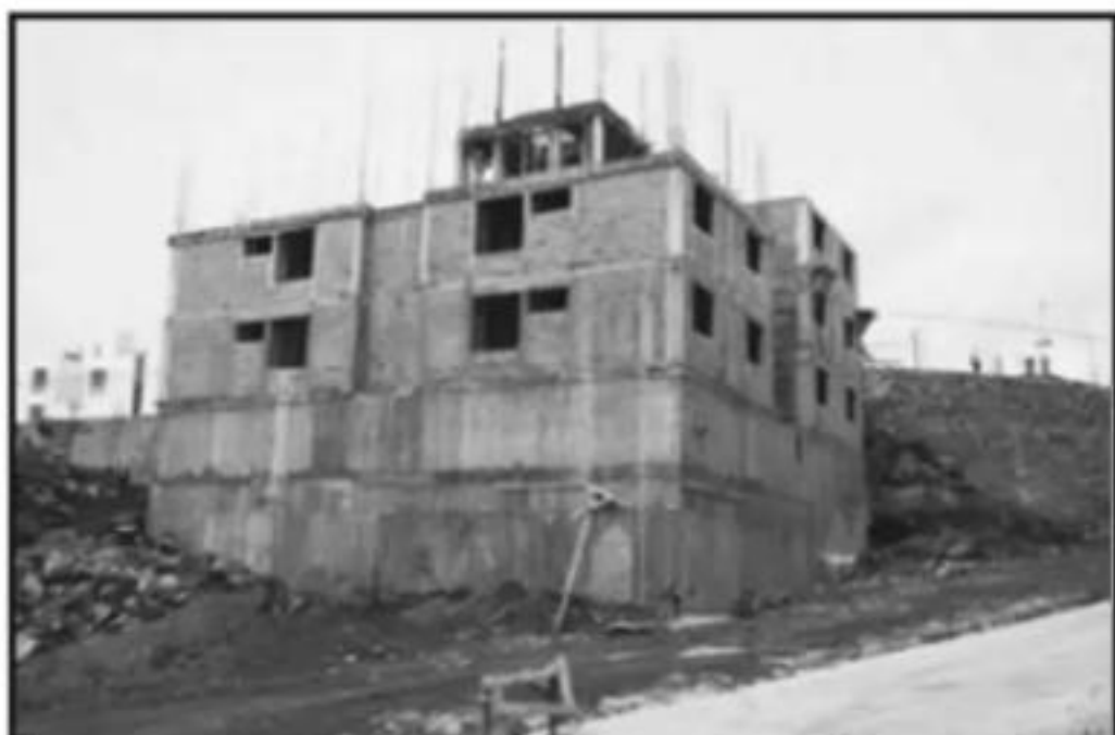
ANTE EL AUMENTO DE LA POBLACIÓN, EL ANILLO PERIFÉRICO HA SIDO UNA OPCIÓN TANTO PARA LAS FRACCIONADORAS COMO PARA LOS MORELIANOS.