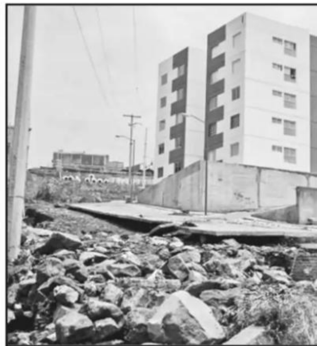
SIN PERMISOS, BAJO EL RIESGO DE GRAVES DESLAVES Y SIN CUMPLIR LA NORMA SE EN

cas con los dirigentes y representantes para ver la gente que está ahí y todas las personas tienen que salir de ahí y ver quienes tienen necesidad de vivienda y quiénes no. Y bajo un acuerdo buscar dónde hay una reserva y una previa investigación porque mucha gente se dedica a andar especulando y van y se meten y cuando se trata de superficies de gobierno del estado nosotros hacemos una exhaustiva investigación de las personas que lo necesitan y se dota de acreditación a las personas que demuestran que no tienen vivienda", manifestó el funcionario.