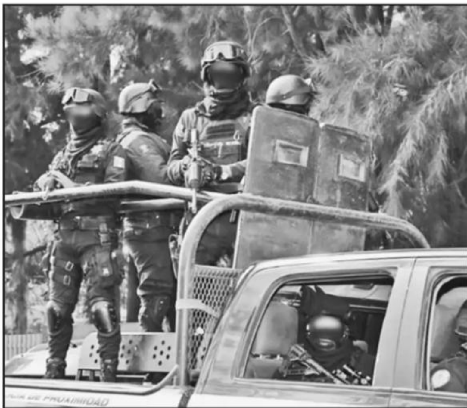
CORPORACIONES POLICIAICAS DE TODOS LOS NIVELES, PRINCIPALMENTE DE LA SSP, TIENEN MUCHAS OBSERVACIONES.

Según el informe, son 356 quejas por haber violentado el derecho a no ser detenido, al uso desproporcionado o indebido de