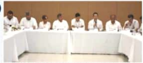
CD. LÁZARO CÁRDENAS, MICH.- Secretarios de Desarrollo Económico del Estado de Michoacán y Guerrero, legisladores y empresarios de Michoacán sostuvieron un encuentro en el puerto de Lázaro Cárdenas, desde el cual exhortaron al Ejecutivo Federal a dar continuidad a la Zona Económica Especial Lázaro Cárdenas-La Unión.

El secretario de Desarrollo Económico hizo énfasis en que esta política fiscal y administrativa (ZEE), si genera inversión, si genera empleos y además generará un tope fiscal para la recaudación de la Secretaría de Hacienda.