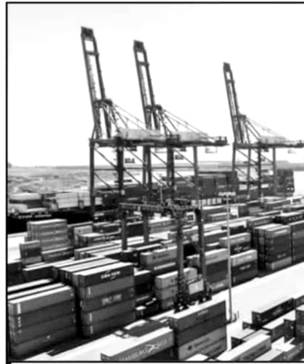
CUATRO DÉCADAS LLEVA EL PUERTO DE LÁZARO CÁRDENAS ACUMULANDO INCOM