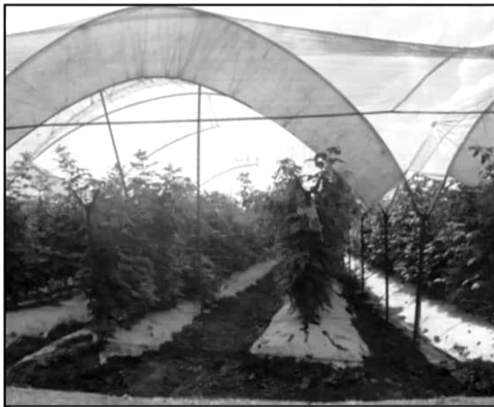
A FIN DE CUIDAR LOS CULTIVOS SE USAN PLÁSTICOS QUE NO SON DESECHADOS DE MENARA ADECUADA AL FINAL

DIRECTOR DE DESARROLLO MUNICIPAL DE ZAMORA