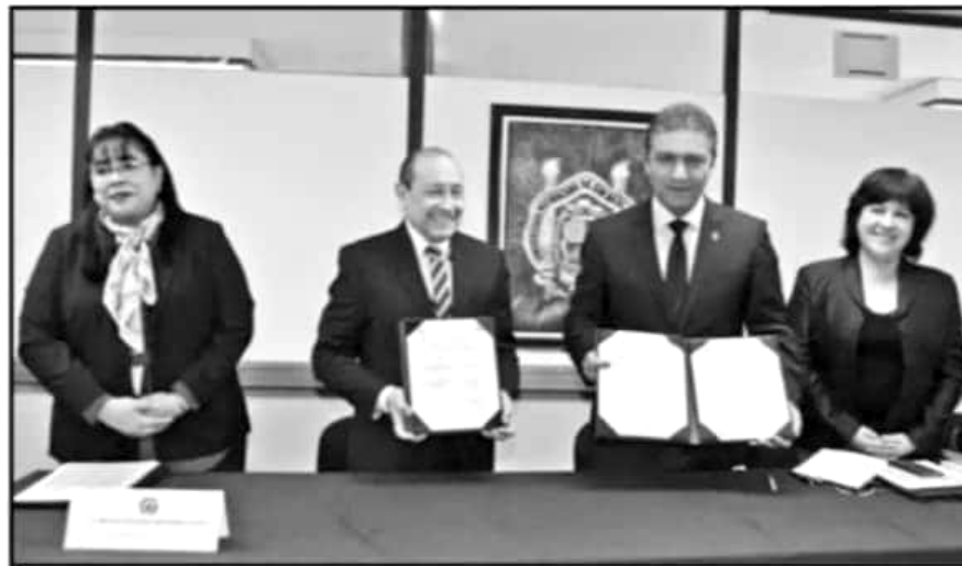
EL COORDINADOR REGIONAL DEL INEGI Y EL RECTOR DE LA CASA DE HIDALGO FIRMARON UN CONVENIO DE COLABORACIÓN.

Reconoció que, a tres meses de su nombramiento, la relación con los gremios ha sido positiva para trabajar en acuerdos, lo que ya permitió conjurar dos emplazamientos a huelga, incluyendo el del Sindicato de Profesores, además de que ha sido