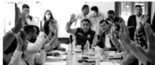
URUAPAN, MICH.-El Presidente Municipal Víctor Manríquez hizo extensivo al Ayuntamiento local el logro de haber alcanzado la certificación nacional del programa de Mejora Regulatoria, con una calificación histórica de 9.62.

La aplicación de dicha herramienta y su metodología, permitirá atender los compromisos del Estado Mexicano y el cumplimiento de la Agenda 2030, así como sus objetivos de desarrollo sostenible