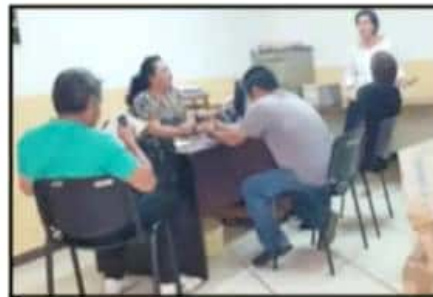
AFIRMAN QUE REGRESANDO SEGUIRÁN EN DIALOGO.