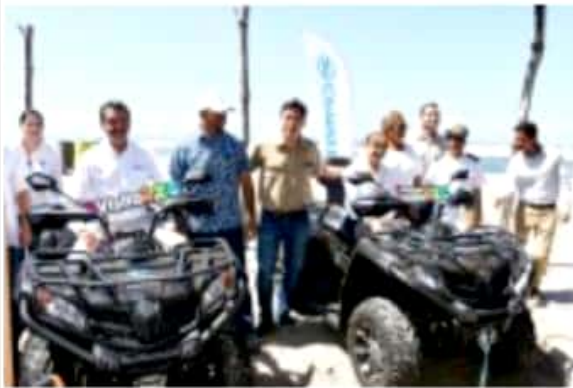
CD. LÁZARO CÁRDENAS, MICH.- Este viernes se llevó a cabo la entrega de apoyos para el fortalecimiento de los campamentos tortugueros.

Para finalizar, añadió que, en los permisos expedidos por la Semamat, se tiene registro de las especies de tortuga laúd ( Dermodochelys coriácea ), tortuga golfina ( Lepidochelys olivácea ) y tortuga negra ( Chelonia agassizii ), para las cuales se realizan acciones de monitoreo y protección en la temporada de anidación; de ahí la importancia de estos campamentos en la vigilancia y protección de las especies en riesgo y que son nativas del estado.