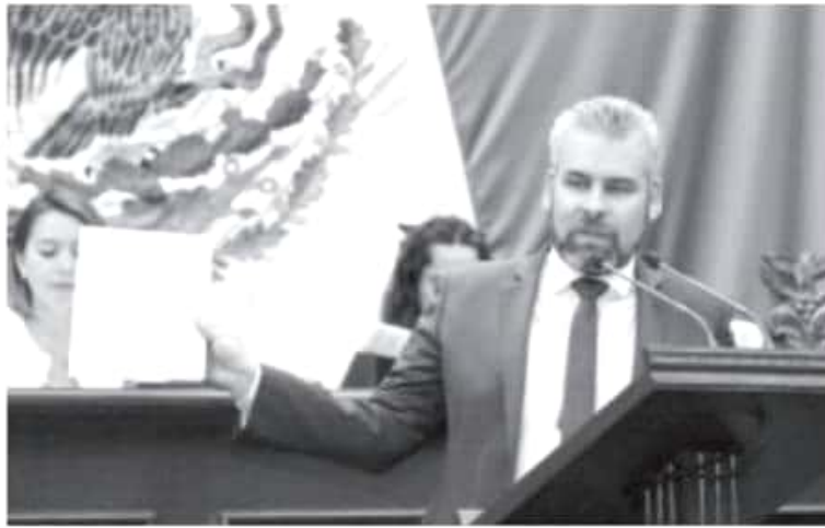
Alfredo Ramírez Bedolla propuso a la LXXIV Legislatura, que por primera vez, convoque a una consulta ciudadana para someter dos iniciativas de reforma al consenso de las michoacanas y michoacanos.

Lo que plantea Ramírez Bedolla es la posibilidad de que por primera vez, el Congreso del Estado recurra a mecanismos de