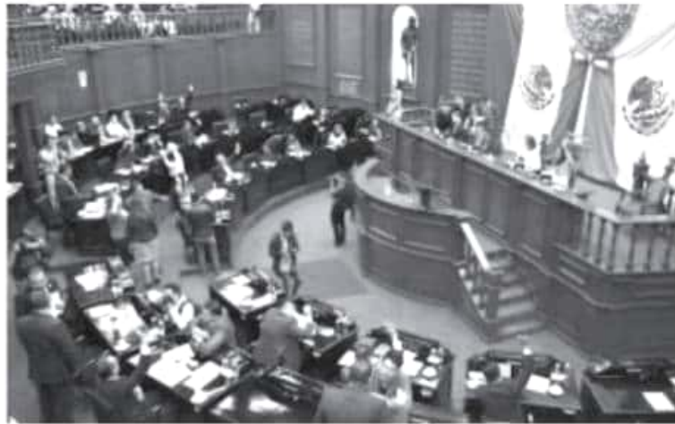
El Pleno del Congreso del Estado, aprobó la convocatoria para entregar la Condecoración "Melchor Ocampo", el máximo galardón que otorga esta Soberanía.

Cabe señalar que para este fin, se solicita cumplir los siguientes requisitos: carta de propuesta a recipiendario, emitido por institución u organismo público, privado o autónomo; carta de aceptación de la persona o institución propuesta; acta de nacimiento, en caso de que sea persona física. Clave Única de Registro de Población; comprobante de domicilio; credencial expedida por el INE o IFE; carta bajo protesta de decir verdad, que no ha