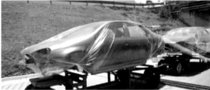
Hasta ahora no se han podido recuperar los niveles de 2015, cuando el crecimiento era positivo de 15 a 20%.

"A estas alturas era para que ya estuviéramos creciendo (a un ritmo de 2%), sin embargo las personas todavía no tienen