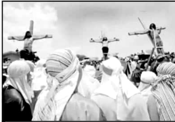
EN TLALPUJAHUA TENDRÁ LUGAR EL VIACRUCIS VIVIENTE.