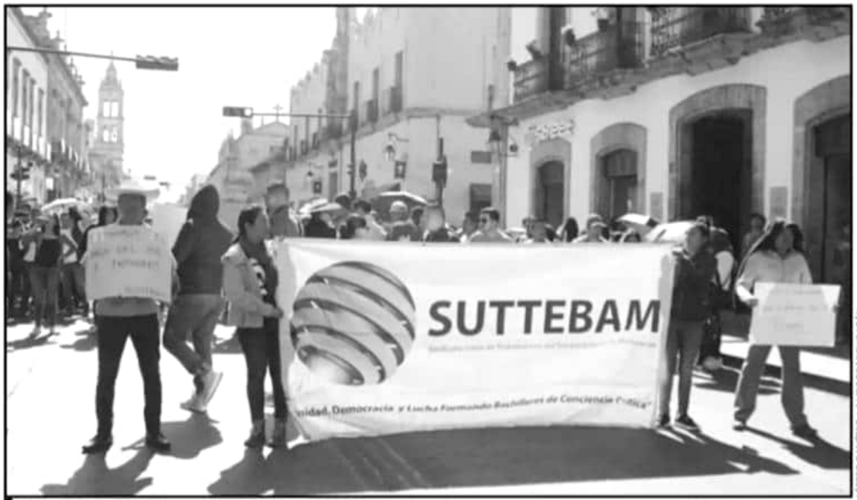
EL SINDICATO DEL TELEBACHILLERATO AMAGÓ CON REALIZAR MÁS BLOQUEOS Y TOMAS SI NO ACEPTAN SUS EXIGENCIAS EN CUANTO A AUMENTO DE SUELDO

ahora llega a los 60 millones de pesos en el pago de las cuotas obrero patronales, tuvo como origen la creación en el 2015, por parte de Francisco Mora Ciprés, de 15 extensiones del Telebachillerato sin sustento financiero.