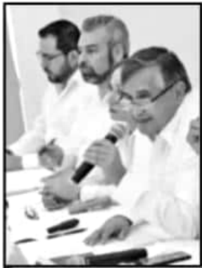
LIDERAZGOS EMPRESARIALES Y LEGISLADORES, EN LA SEDE DE LA API