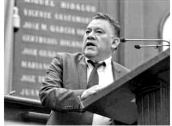
MORELIA, MICH.- Los diputados de Morena en el Congreso de Michoacán se mantienen a la expectativa de la resolución que emita el Senado de la República en torno a las leyes secundarias correspondientes a la Guardia Nacional.