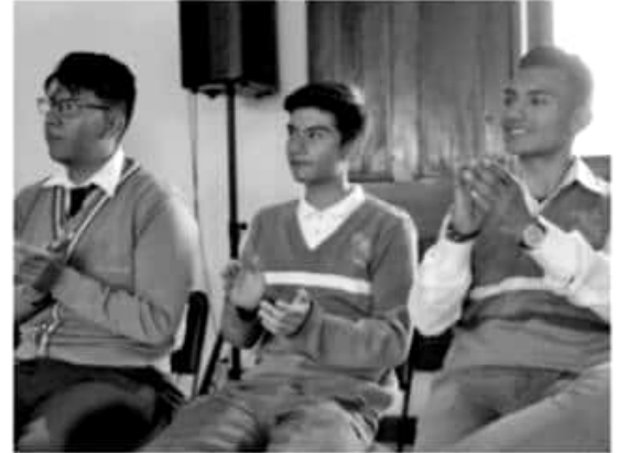
MORELIA, MICH.- El Gobernador Silvano Aureoles Conejo, felicitó a 28 alumnos y alumnas del Centro de Estudios Científicos y Tecnológicos del Estado de Michoacán (CECyTEM).