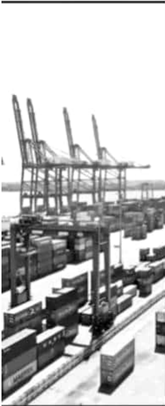
IPRENSIONES Y SUEÑOS DE GRANDEZA