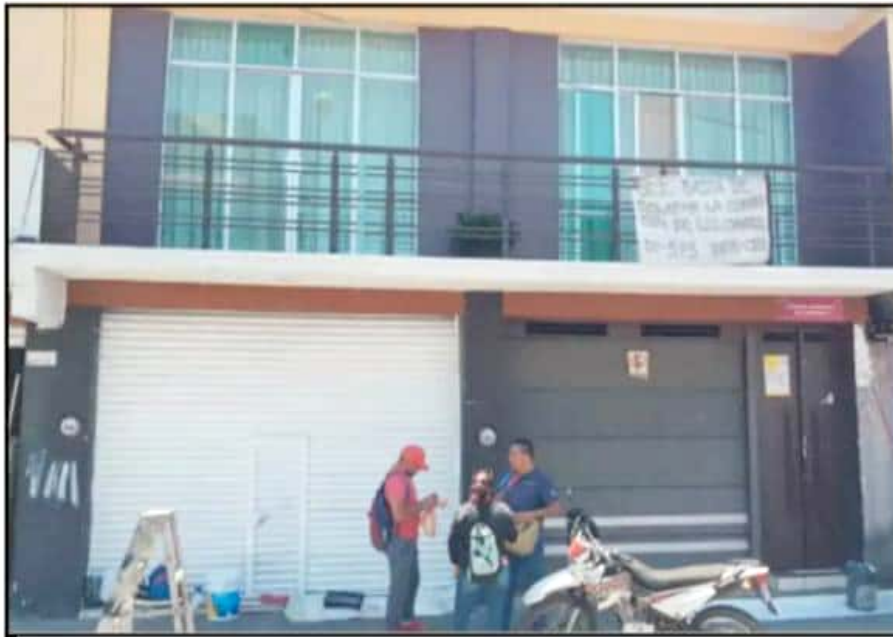
LA TOMA FUE EN PROTESTA POR UNA INTEGRANTE DE LA CNTE "A LA QUE SE LE VIOLARON SUS DERECHOS ESCALAFONARIOS"