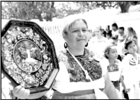
URUAPAN TENDRÁ SU TRADICIONAL DESFILE Y TIANGUIS DE DOMINGO DE RAMOS.