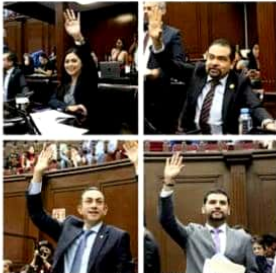
Integrantes del Grupo Parlamentario del PRD en el Congreso local.

Los ponentes coincidieron en que el tema de la revocación de mandato debe instrumentarse como una medida para que la ciudadanía tenga mayor participación y no para un asunto de venganza política, por lo que señalaron que debe cuidarse mucho el que sean los ciudadanos quienes participen y no los partidos políticos.