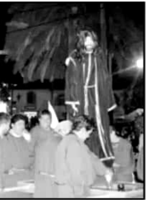
...TZCUARO SERÁ ESTE VIERNES SANTO.