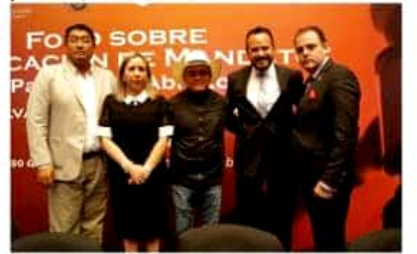
El legislador local concluyó con un ciclo de foros en donde se analizó esta herramienta de participación ciudadana.