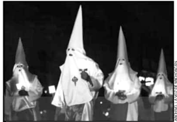
PROCESIÓN DEL SILENCIO, LA SEGUNDA MÁS EMOTIVA DEL PAÍS.