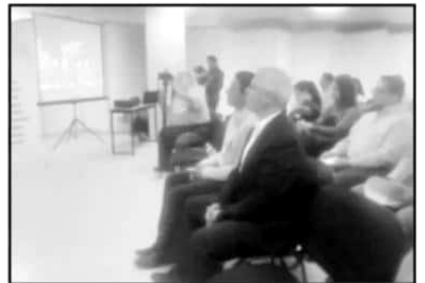
APENAS UNA TREINTENA DE PERSONAS SE DIERON CITA EN LA UCÉMICH PARA CONOCER LA PROPUESTA DE NUEVA LEY ORGÁNICA MUNICIPAL EN SAHUAYO.