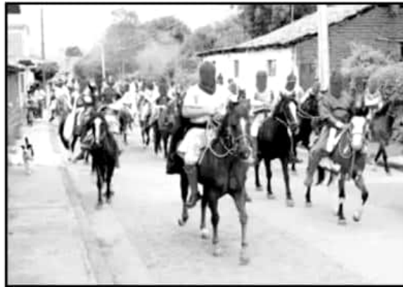
EN TZINTZUNTZAN PENITENTES INICIAN CEREMONIA CON "ESPIAS" A CABALLO.