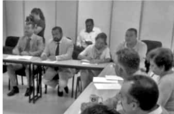
SAHUAYO, MICH.- Por su importancia clave en el desarrollo de las regiones, el Instituto de Ciencia, Tecnología e Innovación (ICTI), propuso impulsar estos rubros desde los Ayuntamientos michoacanos.

Habló también de la necesidad de gestionar ante Conacyt la creación de un Laboratorio Nacional en Nanotecnología, que se albergue en las instalaciones de la UCEM, al haber sido la primera institución pública en el País en abrir la carrera de Ingeniería en Nanotecnología.