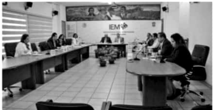
MORELIA, MICH.- Los integrantes del Consejo General del Instituto Electoral de Michoacán (IEM)

En cuanto a las convocatorias emitidas, algunas todavía cuentan con plazo para que los ciudadanos soliciten integrarse a los observatorios correspondientes. Una vez concluido el plazo de la convocatoria se llevará a cabo el análisis correspondiente para ver si cubren con los requisitos emitidos. En la sesión extraordinaria también se determinó retirar el punto segundo del orden del día, el cual determina la ratificación, remoción y nombramiento de las personas titulares de la Secretaría Ejecutiva, Direcciones Ejecutivas y Unidades Técnicas de este Órgano Electoral. Sobre dicha decisión el Consejero Presidente mencionó que retirar el punto tiene como propósito hacer un análisis y fortalecimiento de la documentación, mismo que se va a presentar en una sesión posterior.