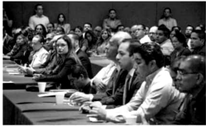
Los servidores estatales están dispuestos a disminuirse el salario.

No obstante, insistió en que no será sólo la venta de propiedades estatales lo que proporcionará los recursos necesarios para el plan de rescate financiero, al recordar que a nivel federal la sola venta de los vehículos oficiales no alcanzó ni siquiera mil millones de pesos.