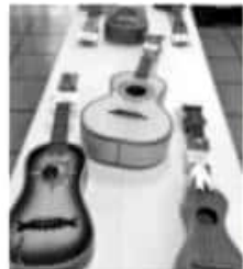
MORELIA, MICH.- La inscripción de piezas para el concurso artesanal se realizó durante los días 8 y 9 de abril, donde cada artífice pudo inscribir un total de dos piezas como máximo.

Todas las piezas participantes y ganadoras del concurso permanecerán en exposición y venta en la Casa de la Cultura de Uruapan los días 13 y 14 de abril, en horario de 10 a 19 horas.