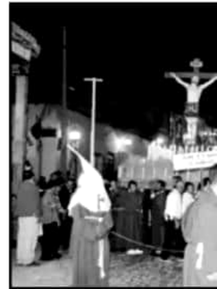
LA PROCESIÓN DE LOS CRISTOS EN PÁZCUARO.

■ VACACIONES ■ ESPERAN CAPTAR IMPORTANTE DERRAMA E