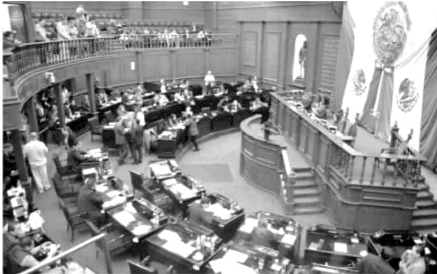
Los diputados locales alistan en tres días sesiones parlamentarias en las cuales se tomarán decisiones importantes.

La Comisión de Desarrollo Urbano, Obra Pública y Vivienda presentará el dictamen con proyecto de acuerdo, que contiene la glosa en relación al Tercer Informe del estado que guarda la administración