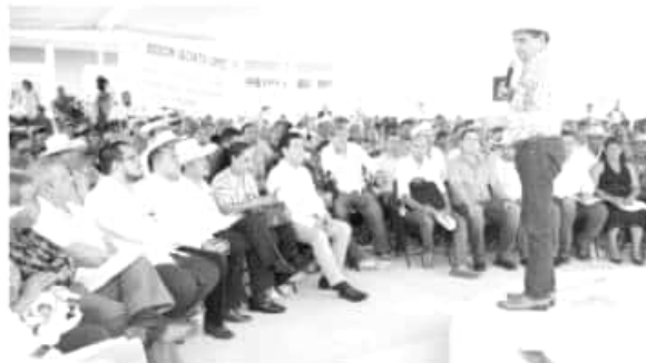
También se entregaron pagos de seguro catastrófico a 458 productores afectados por desastres naturales.

hizo entrega de las órdenes de pago a los beneficiarios del seguro agropecuario catastrófico que les permitirá ponerse nue-