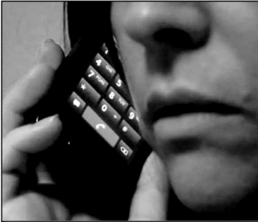
DESAFORTUNADAMENTE, ALGUNOS PROBLEMAS LLEGAN A CRECER AL GRADO DE ATENTAR CONTRA LA VIDA DE UN FAMILIAR.

das, precisan un avance importante en los trabajos de inteligencia y, sobre todo, en la procuración de justicia.