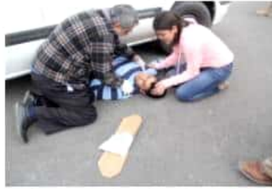
LOS REYES, MICH.- Agotado está el cupo para el curso de primeros respondientes.

Al final está previsto un macro simulacro en la plaza principal de la ciudad con prácticas de diferentes situaciones de urgencia médica, reiterando la invitación a la población en general a presenciarse y a no alarmarse por la presencia de un gran número de ambulancias y paramédicos en el lugar.