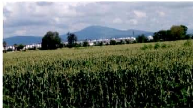
ZAMORA, MICH.- En esta zona de la franja productora de granos básicos, ha disminuido la superficie cultivada de maíz debido a la poca rentabilidad de las cosechas.

Aunque la temporada es propia para la producción punteada o de riego de maíz y sorgo, en esta ocasión los usuarios del Módulo de Riego 02 no han registrado el cultivo del sorgo, el que al parecer es de menor atracción para ellos.