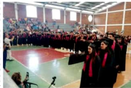
LOS REYES, MICH.- El Conalep Los Reyes-Santa Clara entregó una generación más de egresados.