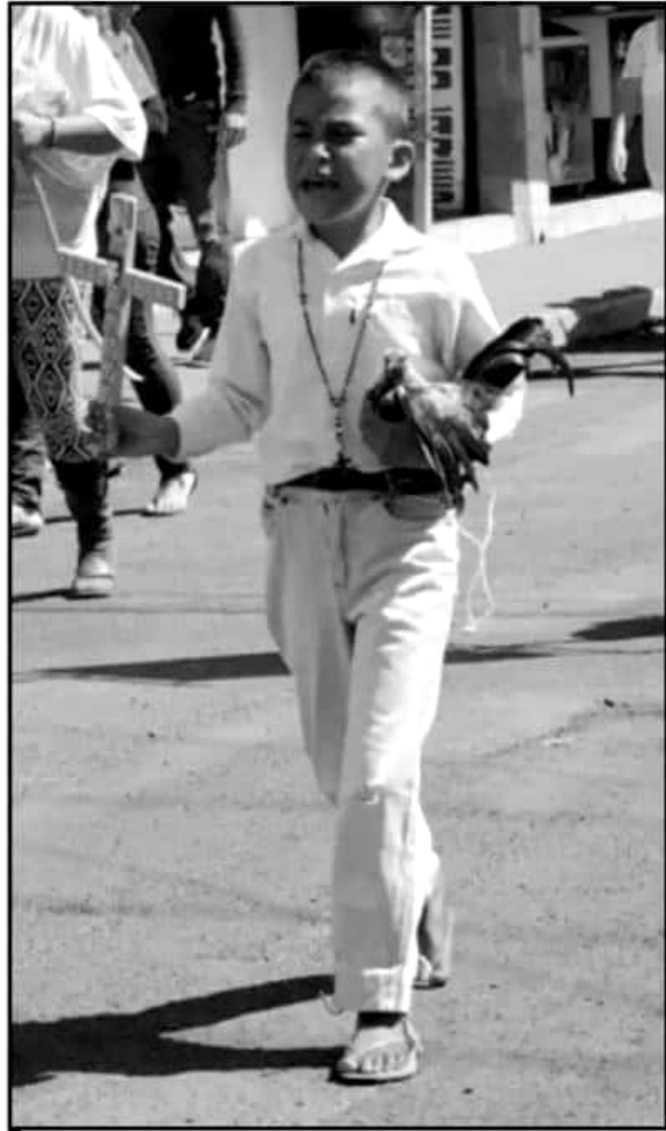
EL AMOR A FLOR DE PIEL QUE VIVEN DESDE NIÑOS POR JOSELITO.