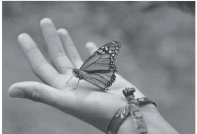
El uso del químico glifosato mata a las plantas nativas de algodoncillo que las orugas monarca necesitan para sobrevivir.

La especialista recordó que algunos de los problemas ambientales de todo el mundo como las emisiones de gases de efecto invernadero, la sobrepesca y la contaminación de los cuerpos de agua tienen soluciones locales que pueden generar impactos globales.