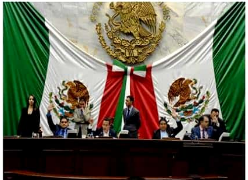
La Comisión de Salud y Asistencia Social, sometió a consideración del Pleno diversas reformas, con la finalidad de ampliar y mejorar la cobertura de servicios de salud.

Finalmente, se adicionaron los artículos 262, 263, 264 y 265 de la Ley de Salud del Estado, propuesta con la cual, buscan que las autoridades sanitarias en el Estado, promuevan programas de atención médica para la oportuna prevención, detección y atención integral de la insuficiencia renal, con la creación de la Comisión de Atención a enfermos renales.