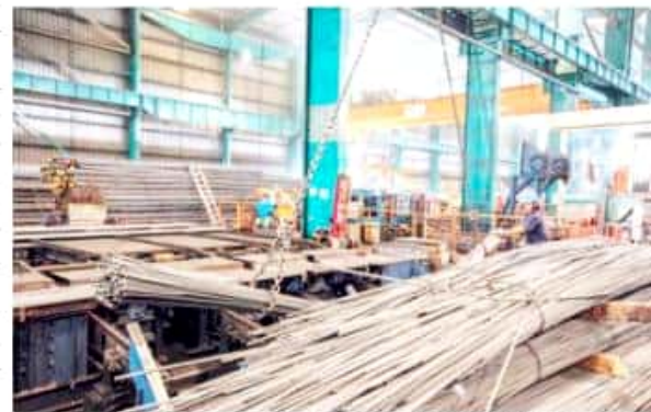
CD. LÁZARO CÁRDENAS, MICH.- La empresa ArcelorMittal informó durante su Reporte de Sustentabilidad correspondiente al 2018, que el costo de la nómina en el 2018 fue de 233 millones de dólares.

Por otro lado, en el 2018, hacen mención de que su modelo de desarrollo sustentable contó con la participación de 1,262 proveedores nacionales e internacionales, de los cuales el 15% correspondió a fuentes locales de Lázaro Cárdenas. Según su reporte, el monto de inversión en tales proveedores nacionales correspondió al 47% del gasto total.