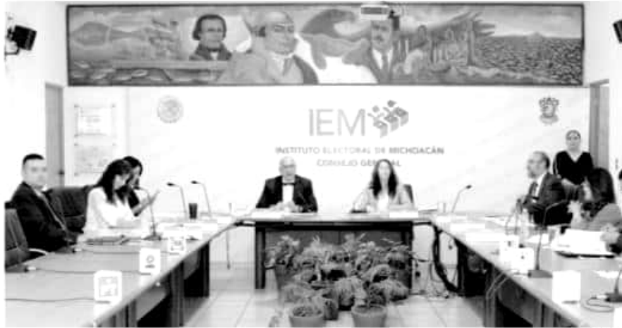
La sesión del IEM.

Refleja, dijo, que «estamos a un déficit de participación ciudadana que debe llamar la atención a todos», tanto al instituto,