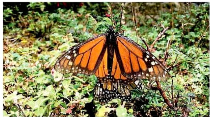
Los lepidópteros se enfrentan varios problemas como la pérdida de su hábitat.

En el programa de monitoreo de insectos más grande que se haya llevado a cabo