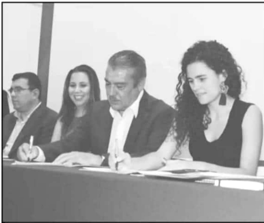
LUISA MARÍA ALCALDE FIRMA CON EL EDIL DE MORELIA EL CONVENIO DE COLABORACIÓN DEL PROGRAMA FEDERAL.

zaciones y asociaciones en el estado que ya contaban con becarios, en lo que se realiza un proceso de auditoría general ante las irregularidades detectadas en un gran número de este tipo de organismos.