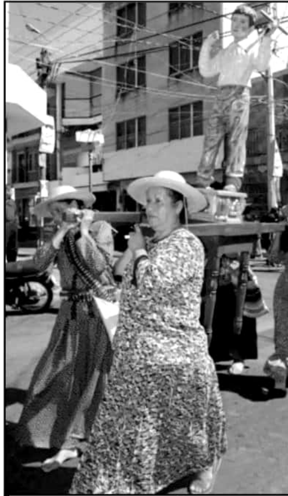
DE GENERACION EN GENERACION ESTA DEVOCION SIGUE VIVA EN LUGAREÑOS.

poblador hablar del vecino municipio o viceversa, sabrá descubrir que pese a la pretendida cortesía entre los municipios existe una marcada distancia interpuesta por los propios pobladores y es justo eso lo que permanece aún como un resabio de la Guerra Cristera pues si bien el triángulo San José, Sahuayo y Cotija formaron parte activa de este movimiento, los jiquilpenses, al menos de manera general, se mantuvieron del lado gobiernista, actitud que nunca fue perdonada por los cristeros, máxime que fue a un jiquilpense, Lázaro Cárdenas, a quien se le encomendó pactar la deposición de las armas de los jefes cristeros que después fueron desapareciendo entre las brumas de la sierranía o los fangos de la Ciénega.