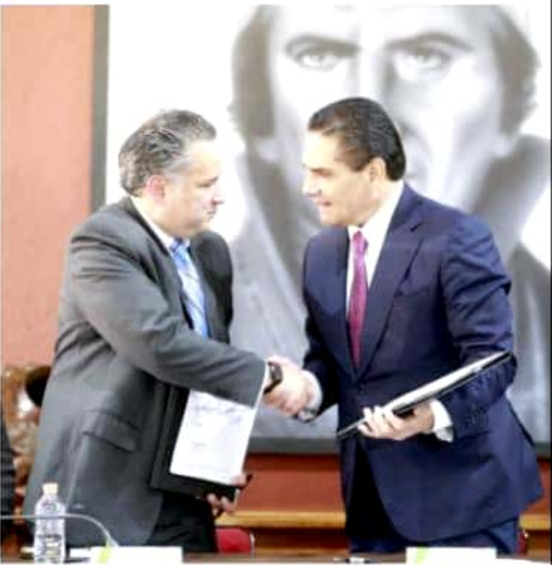
MORELIA, MICH.-Con la finalidad de fortalecer el combate a los delitos de lavado de dinero, corrupción y delincuencia organizada, el Gobernador Silvano Aureoles Conejo firmó este viernes un convenio de colaboración con la Unidad de Inteligencia Financiera de la Secretaría de Hacienda y Crédito Público.

Y sobre el caso Odebrecht en Michoacán, el funcionario señaló que no hay ningún proceso abierto, pero no se descarta abrir una investigación; "ya se han presentado 4 denuncias a nivel nacional", recordó.