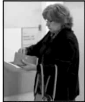
DURANTE LAS VACACIONES SE PODRÁN HACER PAGOS ESTATALES.

Explicó que en México se requiere reforzar las medidas en el combate al lavado de dinero e incrementar los decomisos y la extensión de dominio de bienes relacionados a este delito, acciones en las que han contado con todo el respaldo del Gobierno de Michoacán.