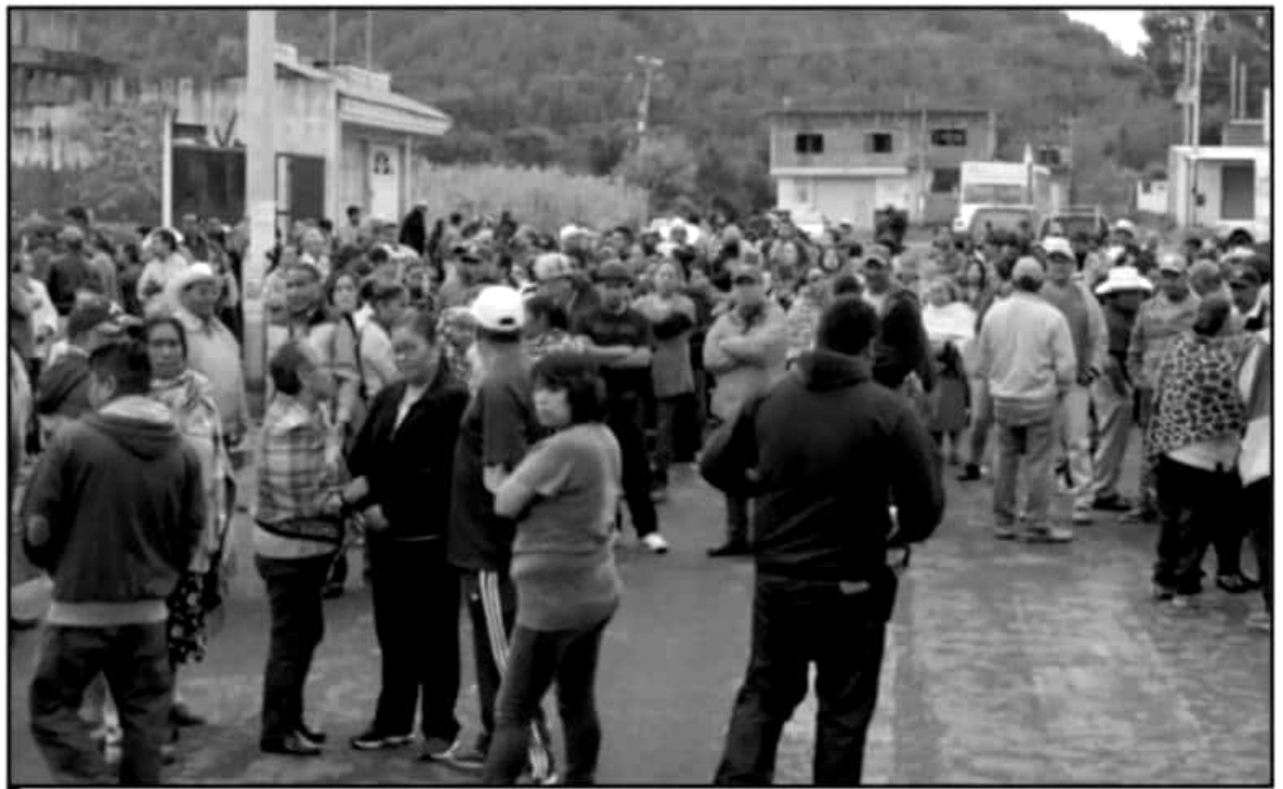
LA CABECERA MUNICIPAL DE NAHUATZEN ES UNA DE LAS COMUNIDADES QUE TIENE SERIOS CONFLICTOS POR EL MANEJO DIRECTO DE LOS RECURSOS.

nuncias de los municipios donde operan comunidades bajo el régimen de ejecución directa, es que los consejos se rehúsan a entregar cuentas sobre el uso de los recursos que erogan. Paradójicamente, los que sigan siendo fiscalizados por los recursos de los consejos son los mismos ayuntamientos a quienes se les quitó este recurso.