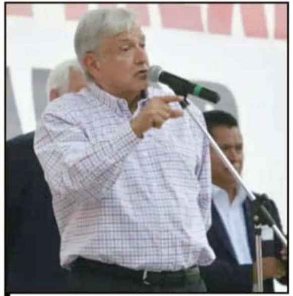
LA VISITA DEL MANDATARIO CAUSA EXPECTATIVA POR LOS DISTINTOS PENDIENTES QUE HAY EN SEGURIDAD, SALUD Y FEDERALIZACIÓN DE NÓMINA.