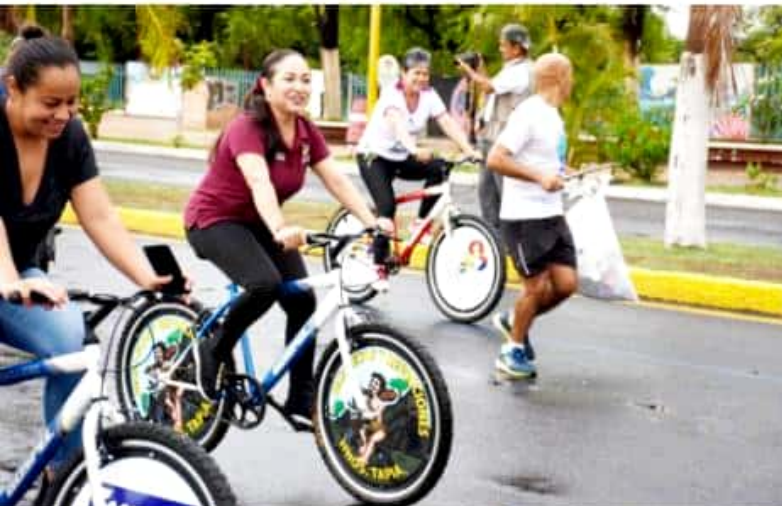
CD. LÁZARO CÁRDENAS, MICH.- El Gobierno municipal invita a la ciudadanía en general a asistir al segundo "Domingo Familiar" que se llevará a cabo este 21 de julio.

Asimismo, a fin de lograr una mayor comodidad de los asistentes, se establecerán dos circuitos: uno para ciclistas y otro para las personas que opten por correr y caminar.