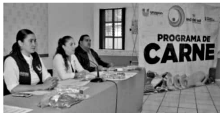
URUAPAN, MICH.- Se trata de carne de primera calidad certificada en un Rastro Tipo Inspección Federal (TIF), la cual está empacada al alto vacío con las mayores medidas de higiene e inocuidad. Cada beneficiario podrá adquirir al mes un combo, de los seis establecidos

kilo de jamón de pavo y medio kilo de chistorra de pavo. El sexto combo es de Pollo y vale 75 pesos, que incluye medio kilo de hígado, tres cuartos de kilo de pollo y 300 gramos de pechuga en bistec.