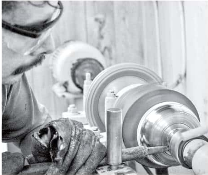
Las manos mágicas de los artesanos dan forma a un promedio de 500 toneladas de metal reciclado al año.

ca de la fundición y el martillado, las cuales perduran hasta nuestros días. Este espacio que conserva la arquitectura de los pueblos purepechas es visitado por 40 mil personas al año; las mejores temporadas son el verano, Noche de Muertos y Semana Santa.