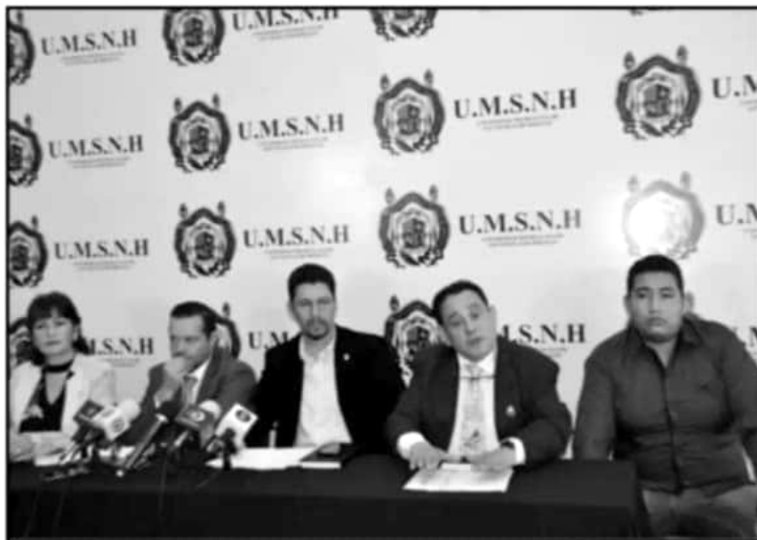
AUTORIDADES DIERON A CONOCER LA SEGUNDA CONVOCATORIA DE INGRESO, TRAS SER APROBADA POR EL CONSEJO

El funcionario expuso la ampliación de los espacios disponibles que reportaron las dependencias universitarias, la cual se hizo apenas el jueves con la autorización del pleno del Consejo Universitario, por lo que en casos como la Facultad de Odontología, donde sólo se tenía un cupo de 600 estudiantes, se llegó hasta 700 por lo que los 100 lugares restantes se entregan de acuerdo con la lista de prelación.