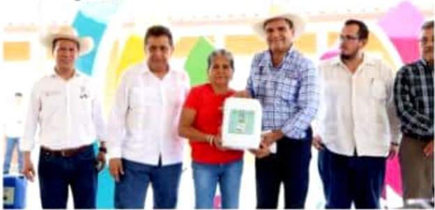
APATZINGÁN, MICH.- Con la entrega de 3 millones 154 mil pesos distribuidos a productores beneficiados se cubre el programa de seguro agropecuario, así como la entrega de insumos.