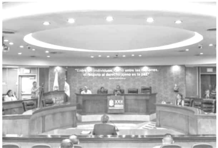
Aspecto de una sesión del Congreso del Estado de Baja California.

Finalmente, en coordinación con los grupos parlamentarios del PRI en las Cámaras, promoverá que, desde el Poder Legislativo y el Poder Ejecutivo de la Unión, se solicite a la Suprema Corte atender con prioridad esta demanda, por su trascendencia para nuestra democracia.