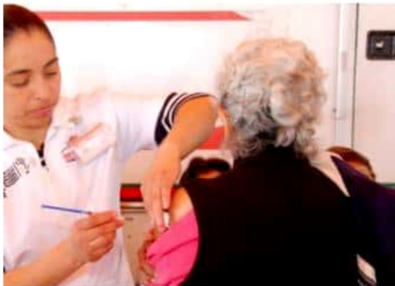
APATZINGÁN, MICH.- La Fundación San Rafael mantiene vigentes sus jornadas médico-asistenciales.

de la fundación, así como de sus auxiliares y el personal de apoyo para brindar los beneficios que se consiguen para llevarlos a los núcleos de población que los requieren.