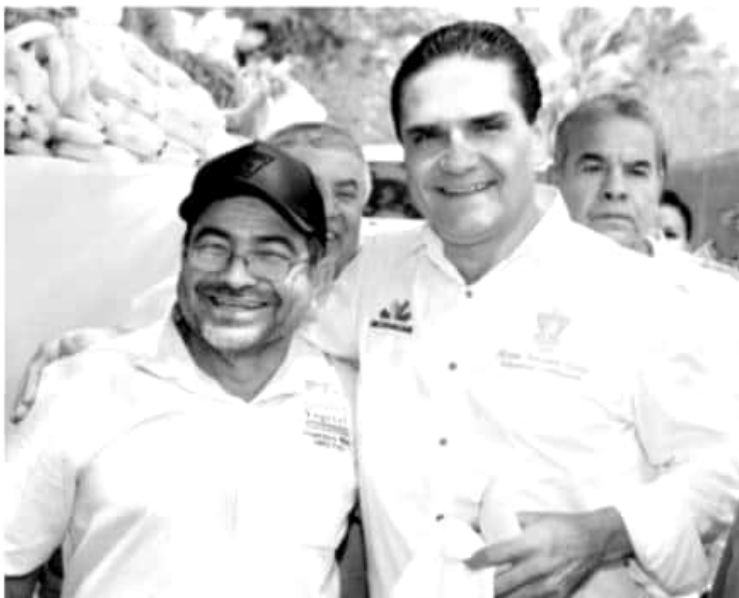
COAHUAYANA, MICH.- El mandatario Estatal destacó que esta festividad lleva más de 50 años realizándose, por ello "hoy le daremos el apoyo y respaldo para que se conozca a nivel nacional y hasta el mundo", señaló.

Finalmente, en reunión con productores de la Región, el gobernador reiteró su compromiso de redoblar esfuerzos y fungir como intermediario con el Gobierno Federal para garantizar la sanidad e inocuidad de los productos y cultivos michoacanos.