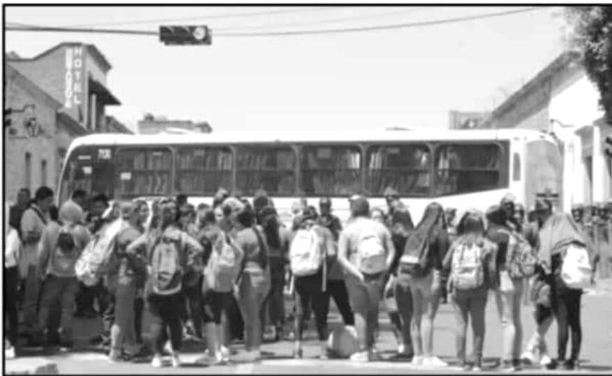
DESDE EL MES PASADO LOS NORMALISTAS ESTÁN ACTUANDO MEDIANTE MARCHAS Y BLOQUEOS EN EL CENTRO.

Explicó el funcionario que las acciones de presión son innecesarias, en términos de que hay disposición al diálogo antes de que ellos ejerzan acciones de presión, "explicamos el tema de los adeudos en la Escuela Normal de Tiripetío, hubo un retraso de