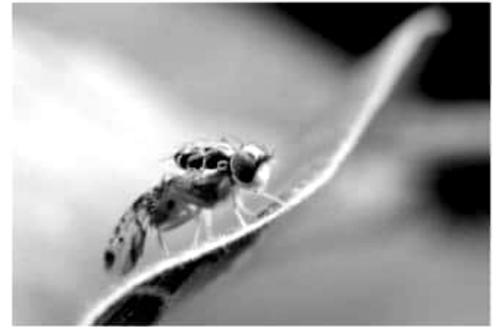
MORELIA, MICH.- Tras la detección de larvas de la Mosca del Mediterráneo en Colima, el Gobierno de Michoacán, a través de la Secretaría de Desarrollo Rural y Agroalimentario (Sedrua), estableció de inmediato un cerco sanitario en las fronteras con los estados de Jalisco y Colima.