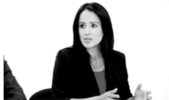
MORELIA, MICH.- En México la política de la improvisación mantiene en picada la actividad industrial en México, misma que registra una evolución negativa permanente.

Refirió que en la recta inicial de 2019, mientras el índice nacional en la actividad económica permanecía a pique, en Michoacán registró un incremento del 1.1 por ciento. "Sin duda la tarea en los estados se vuelve titánica, pues implica no sólo no ser arrastrados por la ola negra que producen las políticas del Gobierno Federal, sino nadar a contracorriente y lograr un crecimiento sostenido", subrayó.