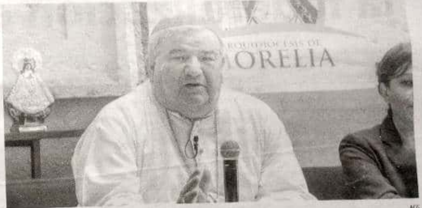
El arzobispo, Carlos Gafias Merlos.

de mayor seriedad o peligrosidad se les canaliza a instituciones especializadas o bien a los centros de escucha.