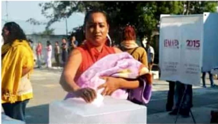
Los datos preliminares fueron publicados, pero se harán oficiales este lunes.