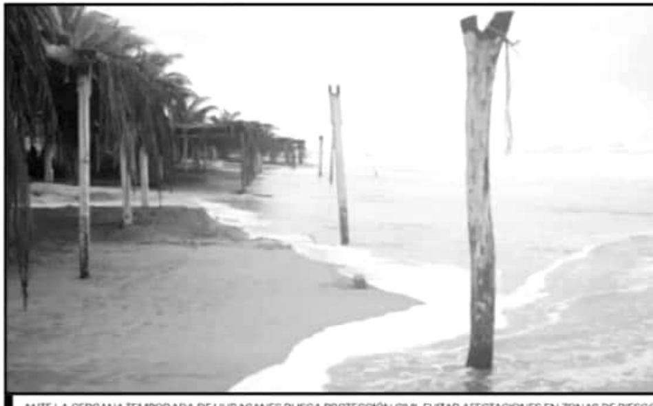
ANTE LA CERCANA TEMPORADA DE HURACANES BUSCA PROTECCIÓN CIVIL EVITAR AFECTACIONES EN ZONAS DE RIESGO.