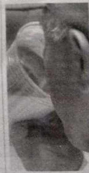
En caso de diarrea es muy importante tomar Sobre de Vida Suero Oral.

En caso de diarrea, es muy importante tener en casa el Sobre de Vida Suero Oral, el cual se entrega de manera gratuita en todos los centros de salud, porque es el tratamiento para atender la deshidratación, que es la principal complicación por esta enfermedad.