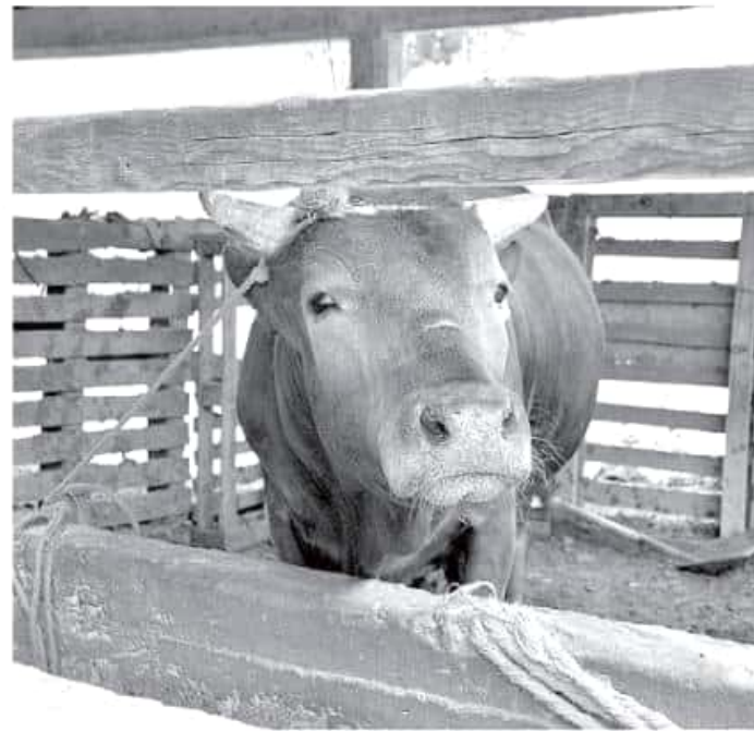
Para este año hay modificación a las reglas de operación y se pueden conocer a detalle en las oficinas en la delegación en cada municipio. Lázaro Morales

No obstante, los componentes incluidos en las presentes reglas de operación están sujetos al presupuesto autorizado en el Decreto de Presupuesto de Egresos de la Federación para el año fiscal 2019, y se sumarán a la perspectiva transversal del Programa Especial Concurrente para el desarrollo rural, dijo.