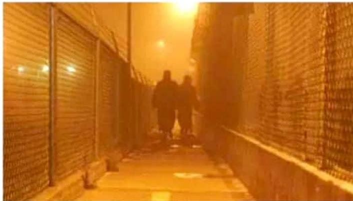
Quiénes no cumplan con la Ley de Responsabilidades Administrativas del estado pueden ser destituidos o encarcelados.

Suspensión o destitución, fuertes sanciones económicas, embargos, inhabilitación por hasta 20 años para desempeñar actividades en el servicio público, detenciones y arrestos por hasta 36 horas contempla la Ley de Responsabilidades Administrativas del estado de