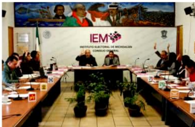
MORELIA, MICH.- El IEM deberá lanzar nueva convocatoria.