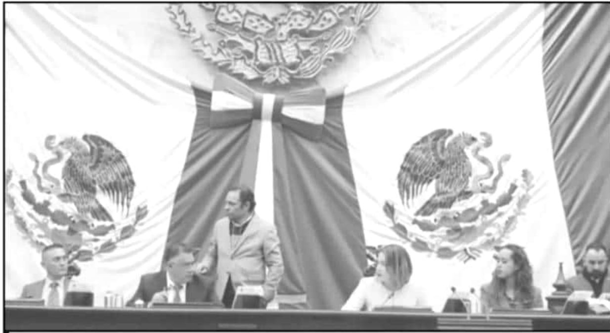
EL CONGRESO LOCAL INCUMPLE CON DAR INFORMACIÓN SOBRE EL MANEJO DE RECURSOS, PESE A QUE ESTÁ ESTIPULADO, Y FUE BANDERA DE CAMPAÑA.

Lo anterior adquiere relevancia luego de que se anunció que ningún servidor público del país podrá tener un salario mayor a los 108 mil pesos mensuales per-