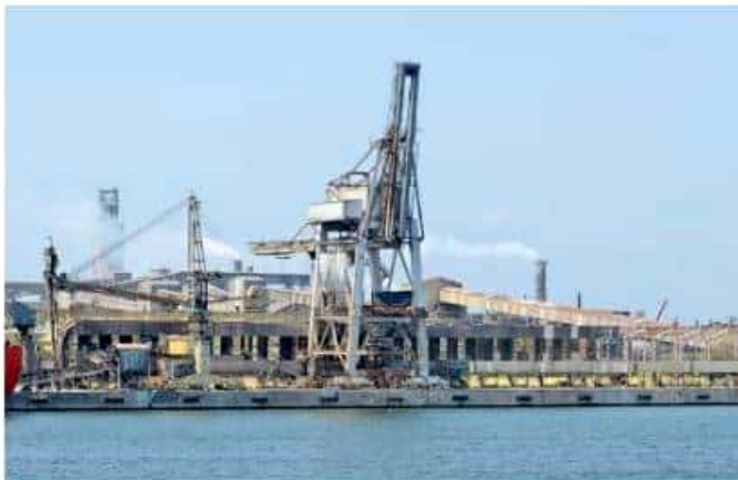
Integrantes del Cabildo buscan presentar en próximos días la propuesta de proyecto integral a la Presidencia de la República.

"Tenemos que ir por un desarrollo integral como se está pensando en el Istmo y la frontera; son proyectos generales en beneficio de la gente, no de pequeños espacios, islas apartadas, no, son cuestiones generalizadas; también pensamos