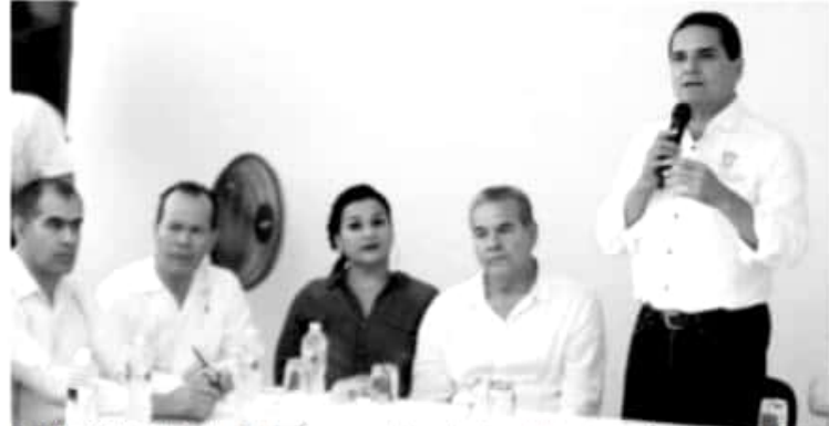
COAHUAYANA, MICH.- La Entidad, conformada por los Municipios de Coahuayana, Coalcomán, Chinicuilá, Tepalcatepec y Aquila, será la primera en Michoacán certificada en materia de Seguridad.