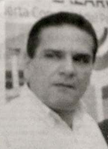
Silvano Aureoles Cataño