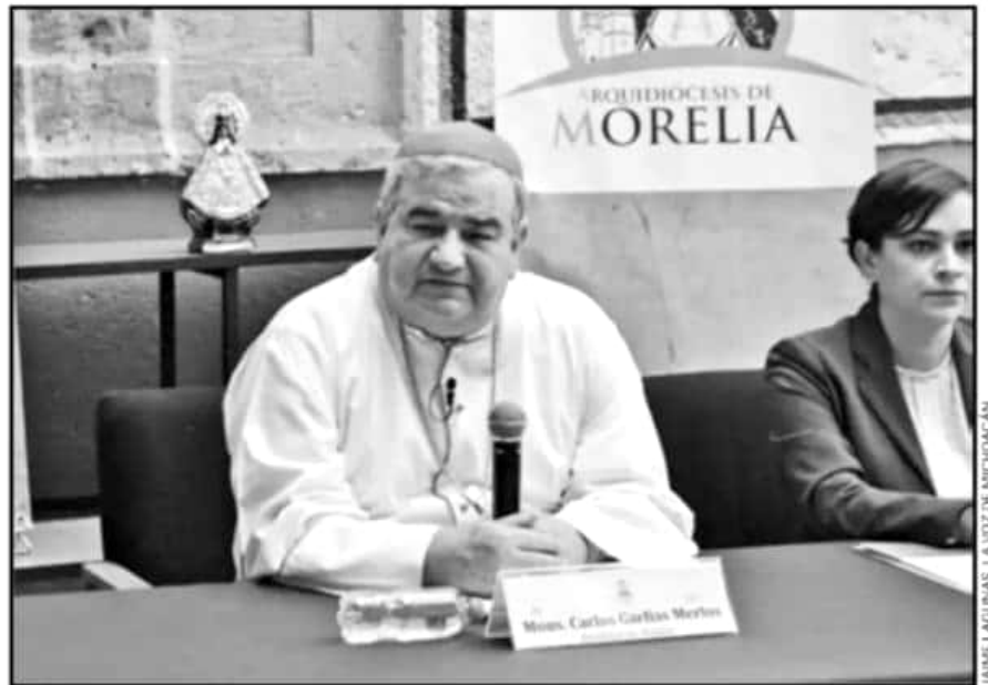
EL ARZOBISPO CARLOS GARFIAS OFRECIÓ SU TRADICIONAL ENCUENTRO CON MEDIOS DE COMUNICACIÓN ESTE DOMINGO.

Entre los puntos de la carta apostólica también se encuentra que se deberá dar asistencia espiritual y terapéutica a las presuntas víctimas, y se establecerán los "plazos dentro de los cuales se debe llevar a cabo la investigación". Anteriormente, Carlos Garfias ya había señalado que los obispos están obligados a informar a las autoridades religiosas y civiles sobre los presuntos casos de abuso de los que tengan conocimiento, así como también reveló que aproximadamente en los últi-