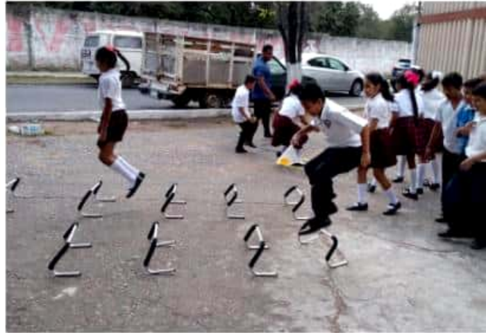
CD. LÁZARO CÁRDENAS, MICH.- Las escuelas que han logrado la validación como escuelas promotoras de la salud son las primeras que están recibiendo la unidad móvil de alimentación de la Secretaría de Salud que está recorriendo el estado de Michoacán.