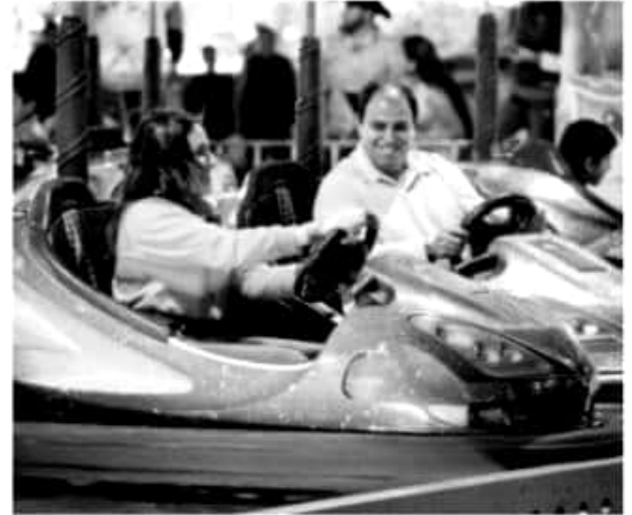
LA GOLETA, MPIO DE CHARO, MICH.- A 16 días de haber iniciado, la Expo Fiesta Michoacán registra un 10 por ciento de incremento en el número de visitantes, en comparación con el mismo periodo del año anterior

Por la suma de esfuerzos, se tiene confianza de alcanzar una derrama económica del orden de los 700 millones de pesos y de esa forma dar un paso más para lograr que sea una feria autosustentable.