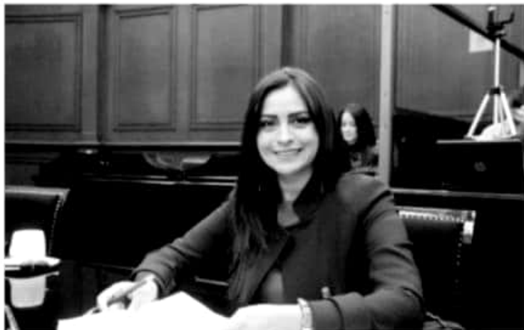
MORELIA, MICH.- La Federalización educativa es una medida que genera certeza laboral en la noble profesión de enseñar, por lo que su cristalización en Michoacán garantiza los derechos de los profesores en la Entidad.

La legisladora perredista apuntó que si bien en el ámbito nacional existen medidas que se han priorizado como la reforma educativa, para Entidades como Michoacán lo prioritario es concretar la Federalización de la nómina, pues de lo contrario no sólo se verán afectados los profesores por la imposibilidad del Estado para hacer frente a sus pagos, sino que se ahondará el colapso en las finanzas estatales a las que los resulta insostenible hacer frente a las enormes necesidades de este sector.