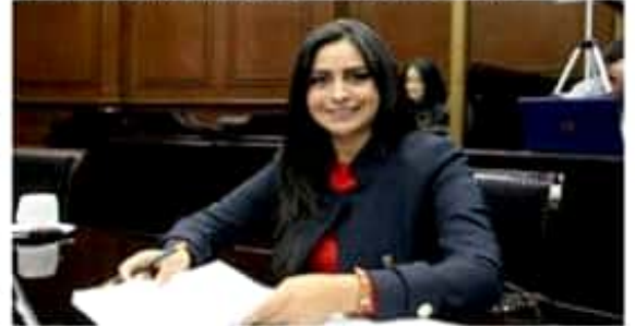
Araceli Saucedo Reyes, coordinadora del Grupo Parlamentario del Partido de la Revolución Democrática en la LXXIV Legislatura del Congreso del Estado.

de lo contrario no sólo se verán afectados los profesores por la imposibilidad del Estado para hacer frente a sus pagos, sino que se ahondará el colapso en las finanzas estatales a las que les resulta insostenible hacer frente a las enormes necesidades de este sector.