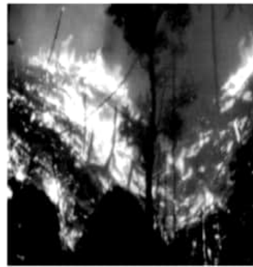
URUAPAN, MICH.- Los malos ciudadanos siguen prendiendo fuego en los cerros de la Cruz y de la Charanda, lo que ocasionó una contingencia ambiental

Finalmente, el funcionario hizo un llamado para que los ciudadanos reporten a las autoridades municipales, cualquier irregularidad relacionada con los bosques de Uruapan, que son el pulmón verde de la ciudad.