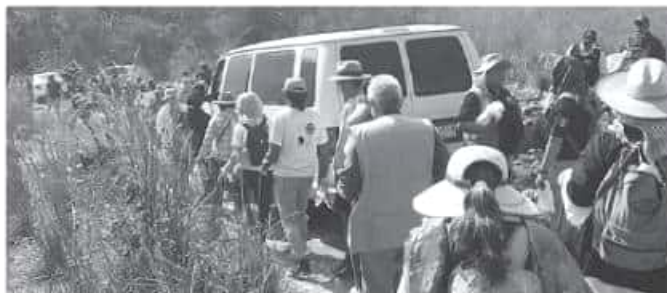
El fenómeno de la detención y desaparición en México tiene tanto motivos sociales como políticos.

Precisó que estos fenómenos se dan principalmente donde hay intereses económicos, como el norte del país, "aquí en Michoacán se dio con el paramilitarismo,