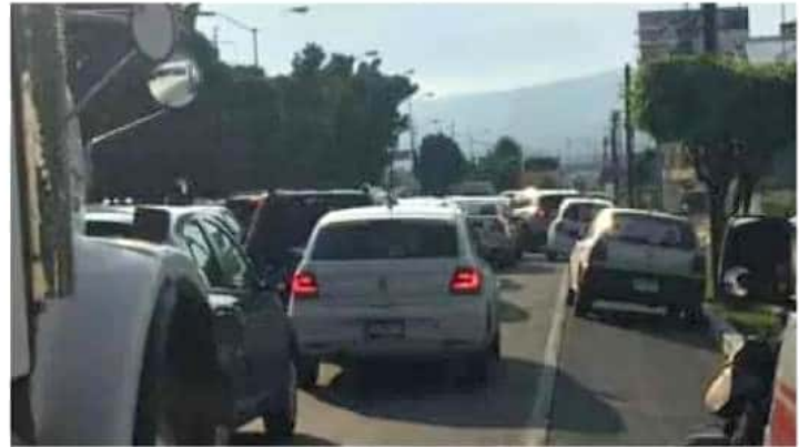
Recientemente, autoridades acordaron implementar el programa de la calidad del aire en Morelia.