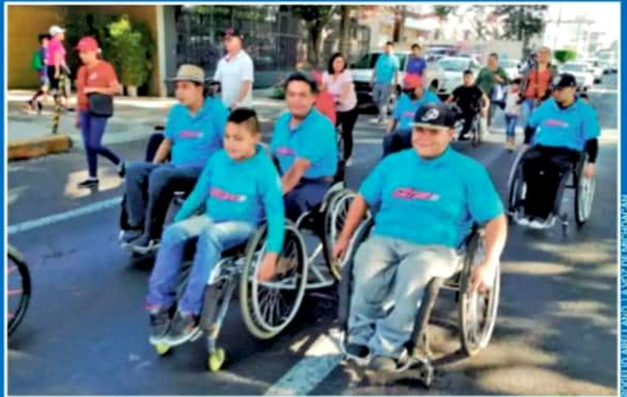
LA ORGANIZACIÓN 'VIDA INDEPENDIENTE' ALISTA UNA SERIE DE ACTIVIDADES A FAVOR DE PERSONAS CON DISCAPACIDAD

Las desventajas son muchas. "Por ejemplo la mayoría de centros comerciales, escuelas y oficinas no tienen baños públicos para personas discapacitadas y no se diga del transporte público. No es mucho lo que pedimos como ciudadanos responsables, sólo respeto, por ello la campaña que iniciaremos el 1 de junio".