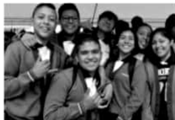
MORELIA, MICH.- El Cobaem oferta servicio educativo a todos los sectores de la población juvenil.

De igual forma, se abordan temas de sexualidad y prevención de embarazo mediante el Programa Institucional de Salud, donde se emprenden diversas actividades grupales en todos los centros de trabajo. Asimismo se refuerzan de manera continua las Habilidades socioemocionales de las y los estudiantes mediante el Programa ConstruyeT, con lo que se ayuda a las y los jóvenes en la toma de decisiones para elevar su bienestar, presente y futuro; a fin de que puedan enfrentar exitosamente sus retos académicos y personales.