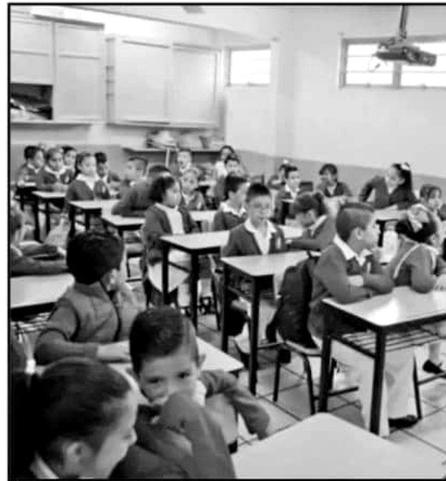
LA REFORMA EDUCATIVA TAMBIÉN ABATIRÁ LOS EXÁMENES DE CALIDAD Y APETITUD

"Normal por normal reflexionaron ese tema y se nombraron cinco delegados por escuela, que participaron en una fase estatal que también ya ocurrió, se nombraron por asamblea por representación y hubo una fase estatal", dijo.