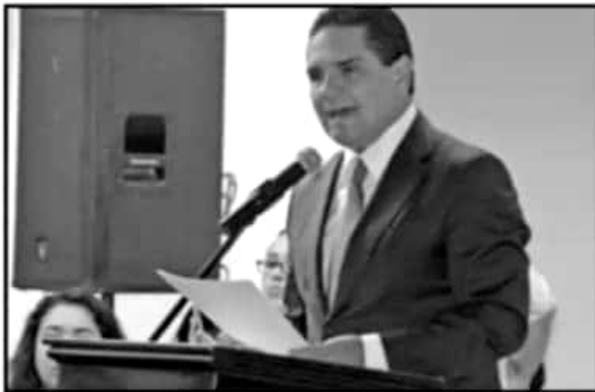
Silvano Aureoles Conejo.

El Gobierno del Estado ha anunciado que el próximo mes habrá un acuerdo formal para la federalización de la nómina educativa; sin embargo, el magisterio está irritado. Desde marzo se debió hacer un calendario para cumplir con los compromisos que existen y que se han venido arrastrando, aunque aún se adeudan seis