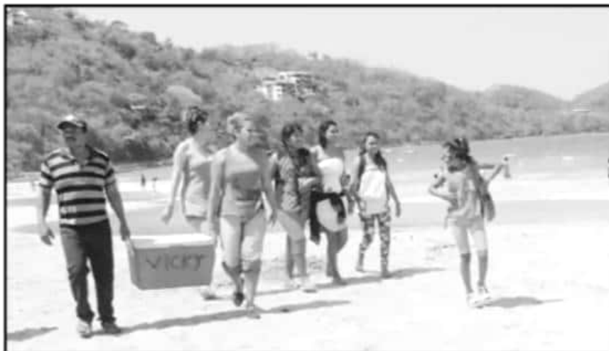
LAS NUEVAS RUTAS TURÍSTICAS EN EL ESTADO CONTEMPLAN TURISMO DE TODOS LOS SECTORES Y NIVELES.