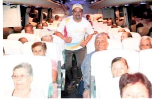
IXTLÁN DE LOS HERVORES, MICH.- Un nutrido grupo de vecinos adultos mayores de este municipio obtuvieron visa americana, para viajar al vecino país del norte, dentro del programa "Palomas Mensajeras".

De igual manera los 75 adultos mayores se mostraron muy agradecidos con el personal municipal como del edil, luego de recibir su visa, están en espera de la fecha de su salida al vecino país del norte, que permita unirse con sus familias, quienes van a visitar a sus hijos y nietos principalmente, que por décadas no han podido abrazar.