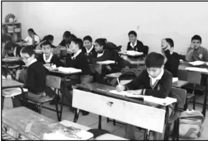
LA IDEA ES QUE LOS ALUMNOS DE PRIMARIA TENGAN OTRO TIPO DE CONOCIMIENTOS Y APRENDIZAJE DESDE PEQUEÑOS.