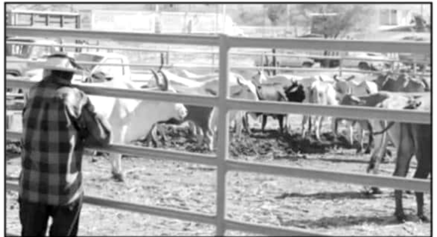
EL GOBIERNO MUNICIPAL ANUNCIÓ EL PROGRAMA PARA MEJORAR LA CALIDAD DE LOS HATOS GANADEROS

Aprovechando la gran producción de ganado que se lleva a cabo en esta localidad e intentando apoyar a quienes se encargan del mismo se empieza una nueva etapa en la región con este programa el cual consiste en la implementación de sementales de tipo bovino de las razas Charoláis, Angus y Cimental, limosín los cuales son conocidos por su producción de carne y leche, dichos especímenes fueron adquiridos en el estado de Chihuahua estado en el cual el