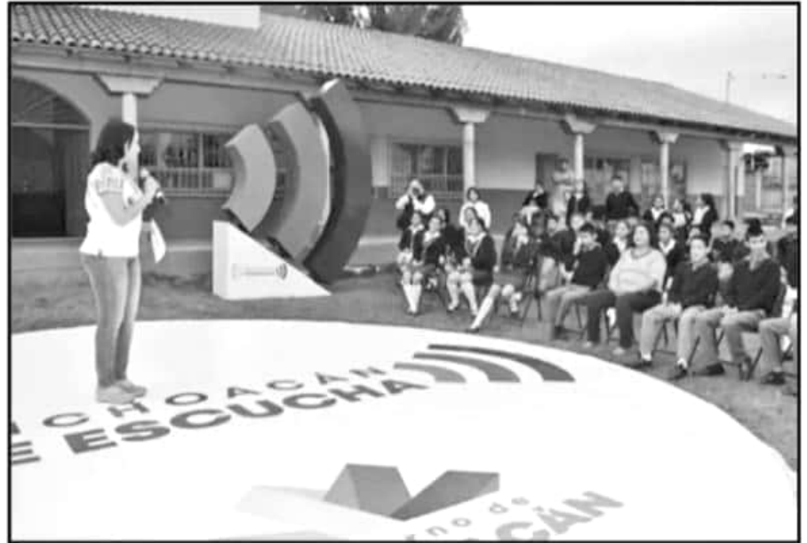
DECENAS DE ALUMNOS DE LA TELESECUNDARIA 523 RECIBIERON LAS MEJORAS DE LAS INSTALACIONES.

"A nosotros nos tocaba poner dinero y tratar de arreglar el techo