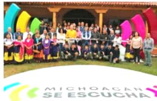
SANTA FE DE LA LAGUNA, MICH.- Entregan autoridades edificio histórico en Santa Fe de la Laguna; restauración Telesecundaria de 85 años de vida.

entre otras acciones, siendo la primera vez en sus 85 años de vida, en recibir atención, pese a las constantes solicitudes de sus autoridades y ante el riesgo de desplome que representaba la estructura que alberga a 107 estudiantes y 8 docentes.