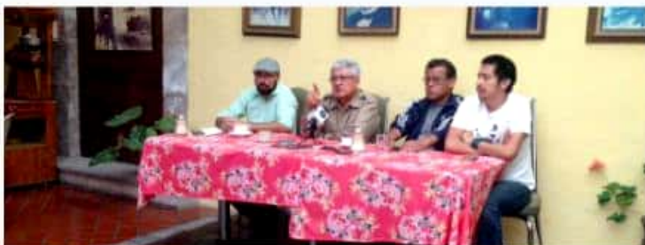
MORELIA, MICH.- Jubilados exempleados de la Universidad Michoacana están en contra de la Reforma de Pensiones.