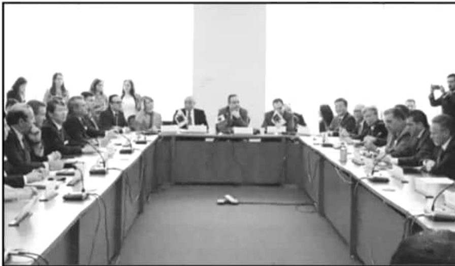
REPRESENTANTES DE COREA DEL SUR NO DESCARTAN LA POSIBILIDAD DE INVERSIÓN EN EL PUERTO MICHOACANO.