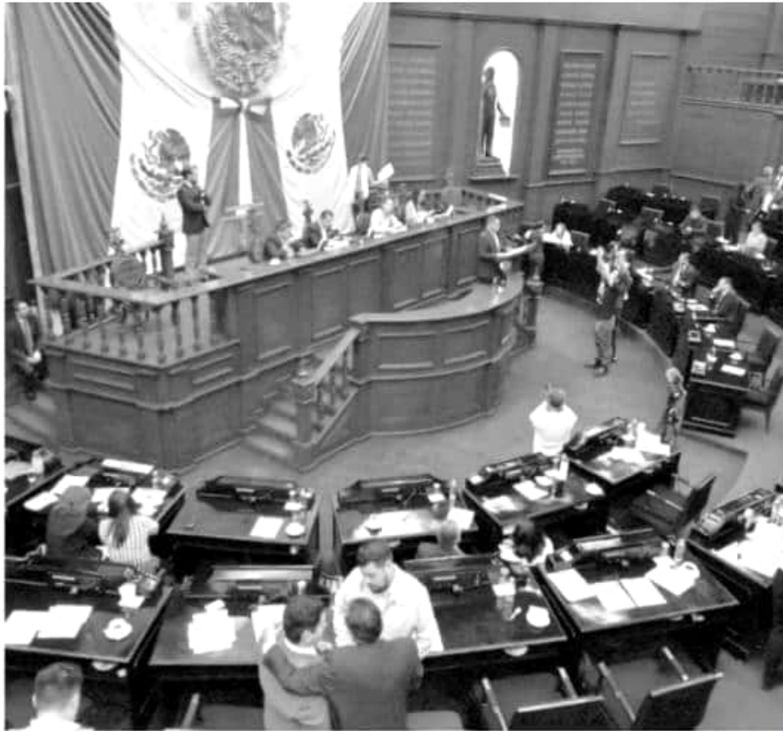
La sesión de ayer en el Congreso del Estado.