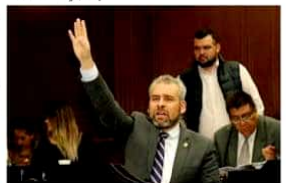
Alfredo Ramírez Bedolla, integrante del grupo parlamentario de Morena en el Congreso local.