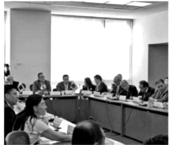
CIUDAD DE MÉXICO.- La Secretaría de Desarrollo Económico de Michoacán (Sedeco), participó en la reunión regional de la Asociación Mexicana de Secretarios de Desarrollo Económico (AMSDE).

Las reuniones regionales son convocadas por la Secretaría de Relaciones Exteriores y responden a los mecanismos de diálogo y coordinación permanente con los integrantes de la AMSDE para promocionar los intereses de las Entidades Federativas de manera eficaz, principalmente con países considerados prioritarios.