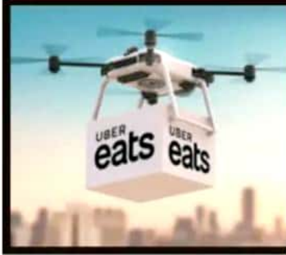
LA VOZ DE MICHOACÁN