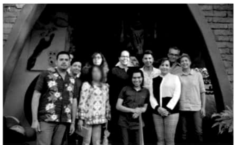
MORELIA, MICH.- Los representantes de cada colectivo, agradecieron la apertura y disposición del Gobierno del Estado por escucharlos y atender sus necesidades.