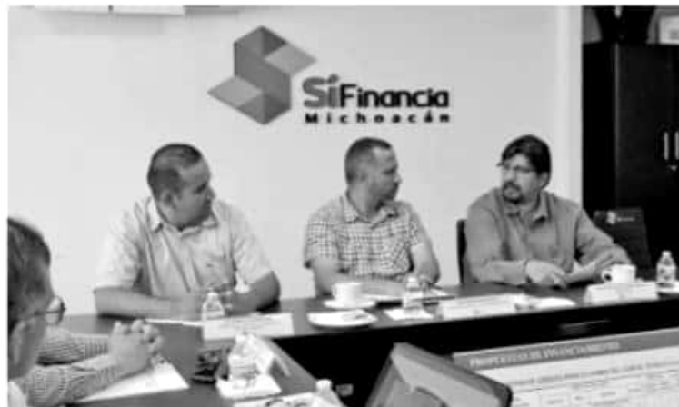
MORELIA, MICH.- El Sistema Integral de Financiamiento para el Desarrollo de Michoacán (Sí Financia), autorizó créditos por un monto de 2 millones 365 mil pesos que beneficiarán a 18 pequeños productores.

señaló. Los créditos fueron autorizados en sesión ordinaria del Comité Técnico del FOGAMICH, fondo que administra Sí Financia y que además tiene una participación de la Secretaría de Desarrollo Rural y Agroalimentario (Sedrua), la Secretaría de Finanzas y Administración (SFA), la Secretaría de la Contraloría (Secoem), así como la Secretaría de Bienestar y el Instituto Nacional de Economía Social (INAES). El destino de los créditos, los cuales van de 50 mil a 150 mil pesos, será para el mantenimiento de huertas de mango, guayaba y ciruela; así como para la cría de bovinos de doble propósito. En esta ocasión, los municipios beneficiados son Gabriel Zamora, Huetamo, Jungapeo, Nuevo Urecho, Tuxpan, Tzitzio y Zinapécuaro.