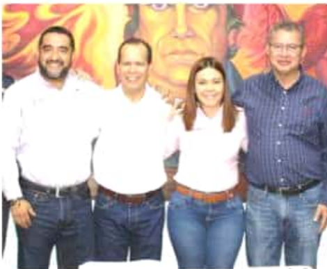
LOS REYES, MICH.- El titular de Sedrua, Rubén Medina y el jefe regional del gobierno estatal, Rafael Servín, con municipios de la región tras la reunión en que se dio a conocer el programa de Agricultura Sustentable para la entidad.

Lo anterior mediante apoyos consistentes en biofertilizantes y mejoradores de suelo, subsidiados en un 66 por ciento por el gobierno del Estado y con un seguimiento permanente por parte de especialistas para la evaluación y seguimiento a los resultados. La reunión concluyó con intercambio de opiniones e ideas con el fin de enriquecer la operatividad del programa, que en el caso de la zarzamora estará dirigido a mil 200 hectáreas en su etapa inicial.