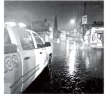
Se llevó a cabo un primer recorrido por las zonas más vulnerables.

Esto ante el cuestionamiento del caso de los asesores de Aureoles Conejo, ante lo que enfatizó que lo que se solicita es la "información mínima requerida" por la ley.