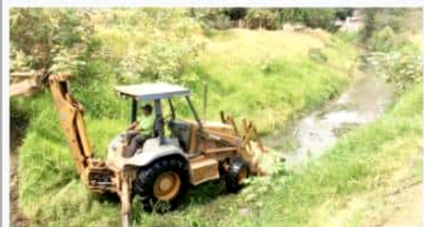
JACONA, MICH.- Con la finalidad de evitar contingencias en la presente temporada de lluvias, trabajadores del Sapaj se encuentran limpiando drenes, canales y alcantarillas.

Lo anterior porque ahí es donde termina el 100 por ciento del plan preventivo que tienen, pues es donde concluye la basura que se tira en las calles, que se deja en las banquetas, o que al barrer las banquetas ahí la depositan algunas personas; han sacado de las alcantarillas artículos impensables, que van desde ropa, llantas, animales, piezas de plástico, entre muchas otras.