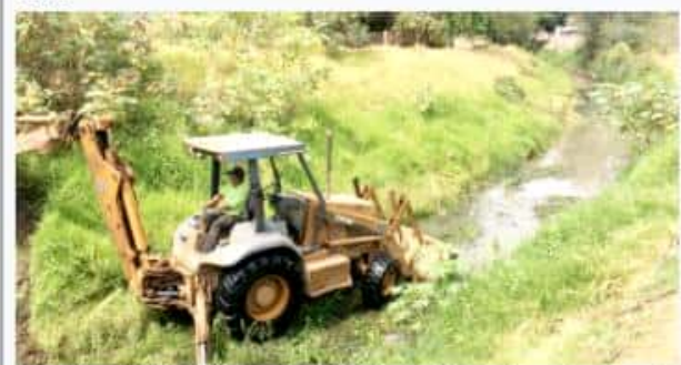
JACONA, MICH.- Con la finalidad de evitar contingencias en la presente temporada de lluvias, trabajadores del Sapaj se encuentran limpiando drenes, canales y alcantarillas.

Lo anterior porque ahí es donde termina el 100 por ciento del plan preventivo que tienen, pues es donde concluye la basura que se tira en las calles, que se deja en las banquetas, o que al barrer las banquetas ahí la depositan algunas personas; han sacado de las alcantarillas artículos impensables, que van desde ropa, llantas, animales, piezas de plástico, entre muchas otras.