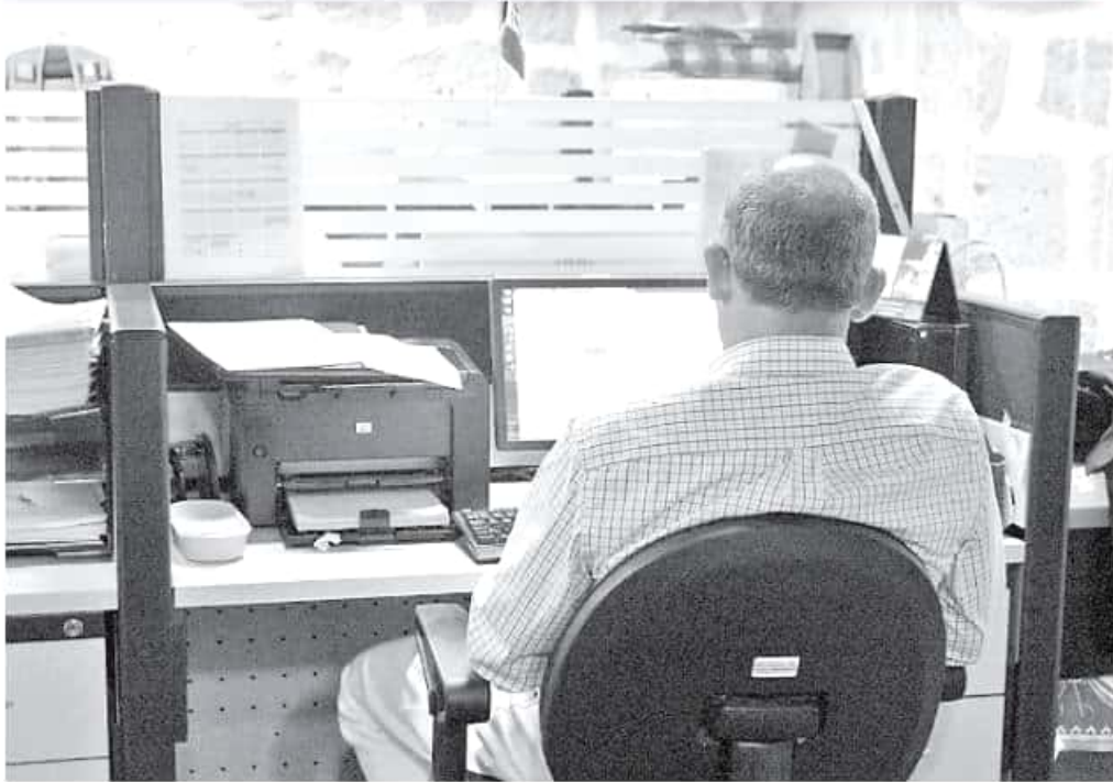
Navarrete Naranjo expuso que los municipios señalados deben hacer un esfuerzo por realizar la búsqueda de la documentación faltante. MARJANA LUNA