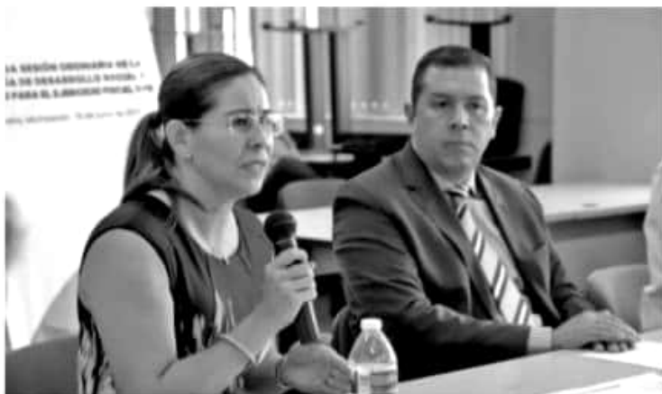
MORELIA, MICH.- Se avanza en la integración del Padrón Único de Beneficiarios de Programas Asistenciales en Michoacán.