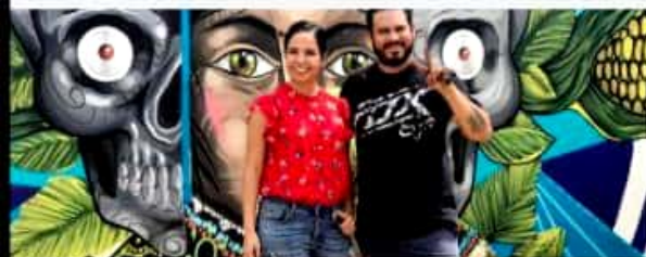
ECUANDUREO, MICH.- Gran participación se obtuvo en el concurso de artes gráficas en la modalidad de muralismo, que organizaron el gobierno municipal y la Casa de la Cultura.

Los ganadores recibieron 5 mil pesos al primer lugar, 2 mil pesos para el segundo lugar y mil pesos para el tercer lugar.