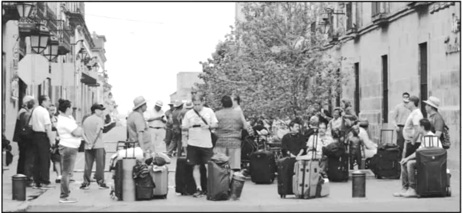
GRUPOS DE TURISTAS LLEGAN A MORELIA PARA PARTICIPAR EN EL CONGRESO "MICHOACÁN UN DESTINO EN TURISMO DE SALUD Y BIENESTAR" Y CONOCER LOS DESTINOS DE LA RUTA DE LA SALUD.

■ ATRACTIVO ■ ALISTAN RUTA CON MÁS DE 40 SITIOS