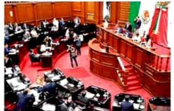
El pleno del Congreso local aprobó la Glosa del Tercer Informe de Gobierno en materia de migración y salud.

Además, el Congreso del Estado, al aprobar por mayoría esta propuesta, se manifestó a favor de que se genere un gran acuerdo migratorio para las Américas, y que se privilegie la cooperación internacional en favor del desarrollo de la región.