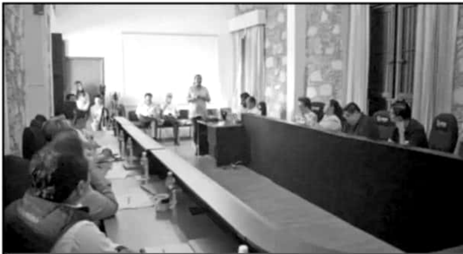
EL DÍA DE AYER SE LLEVÓ LA SESIÓN DE CABILDO EN DONDE SE VIERON LOS PUNTOS PENDIENTES DE LA ORDEN DEL DÍA.

rán los lugares para los regidores de las fracciones del PRI, Movimiento Ciudadano y MORENA, así como el tiempo de duración que tendrá como intervención.