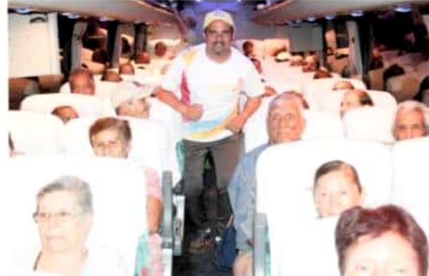
IXTLÁN DE LOS HERVORES, MICH.- Un nutrido grupo de vecinos adultos mayores de este municipio obtuvieron visa americana, para viajar al vecino país del norte, dentro del programa "Palomas Mensajeras".

De igual manera los 75 adultos mayores se mostraron muy agradecidos con el personal municipal como del edil, luego de recibir su visa, están en espera de la fecha de su salida al vecino país del norte, que permita unirse con sus familias, quienes van a visitar a sus hijos y nietos principalmente, que por décadas no han podido abrazar.