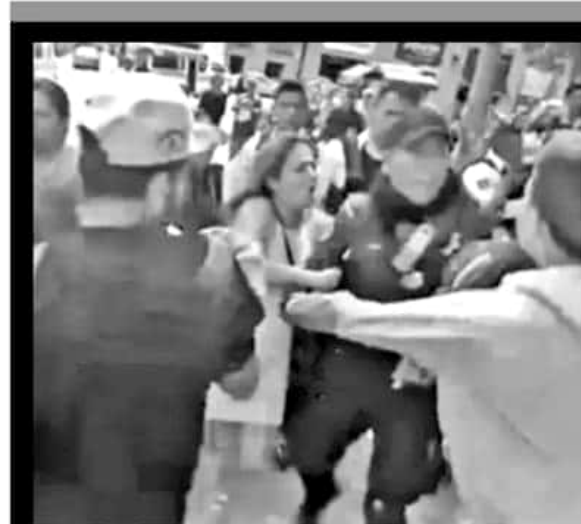
Trifulca en el Centro Bronca en Capuchinas al intentar despojar a ambulantes de su mercancía y herramientas este jueves.

Serrato Lozano reconoció que uno de los principales problemas al