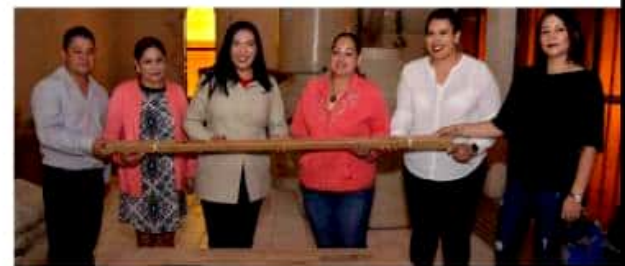
JACONA, MICH.- 702 toneladas de cemento gris y mortero, tinacos y calentadores solares, en beneficio de 700 familias jacconenses, ha entregado la actual administración pública municipal.