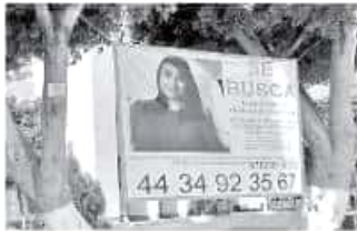
Familia de Nilda, amigos y compañeros la siguen buscando. MARIANA LUNA