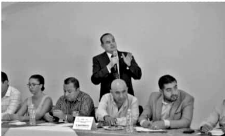
SAHUAYO, MICH.- Las y los michoacanos están en todo su derecho de exigir policías confiables y acreditados, y el Gobierno está dando cumplimiento a dicha exigencia.