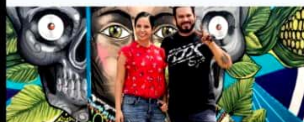
ECUANDUREO, MICH.- Gran participación se obtuvo en el concurso de artes gráficas en la modalidad de muralismo, que organizaron el gobierno municipal y la Casa de la Cultura.

Los ganadores recibieron 5 mil pesos al primer lugar, 2 mil pesos para el segundo lugar y mil pesos para el tercer lugar.