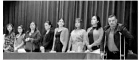
MORELIA, MICH.- Visibilizar la violencia digital contra niñas y mujeres, es una prioridad para el Gobierno del Estado; las cifras de este problema, a nivel nacional, son alarmantes: 9 millones de mexicanas han vivido algún tipo de ciber acoso.