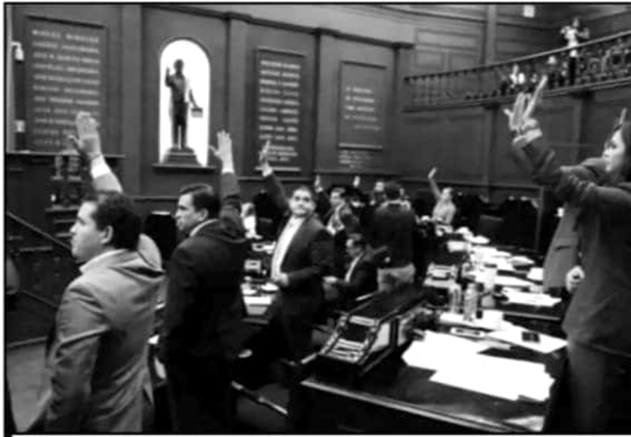
ALGUNOS DIPUTADOS LLAMARON A BOICOTEAR LA ECONOMÍA ESTADOUNIDENSE NO COMPRANDO SUS PRODUCTOS