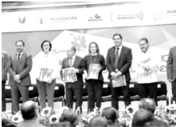
CAMBIO | ESPECIAL

Explicó que para quienes no cuentan con seguro médico en