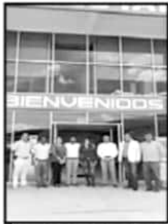
EL CECYTE DE PANINDÍCUARO FACILITARÁ LOS EQUIPOS DE CÓMPUTO A LA UNIVIM