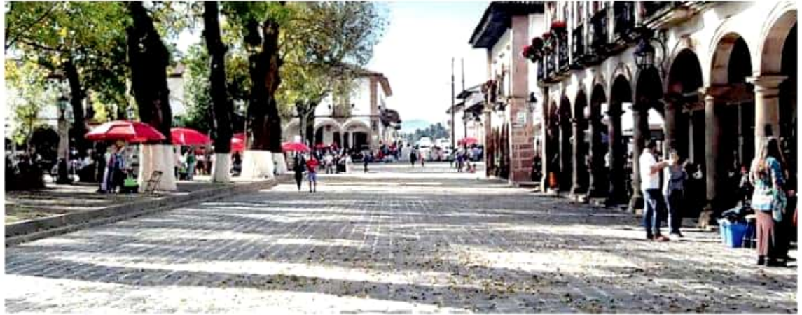
En Pátzcuaro se mejoró todo el entorno de la Plaza Vasco de Quiroga. SILVIA HERNÁNDEZ