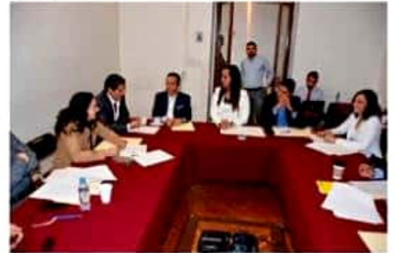
Integrantes de Comisiones Unidas de Derechos Humanos y Justicia de la 74 Legislatura local.

En ese mismo contexto, los datos aportados respecto a las obras realizadas, resultan insuficientes, toda vez que no se aportaron datos concretos respecto a los municipios que resultaron beneficiados. De igual ➤ 10