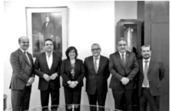
MORELIA, MICH.- Este jueves el Gobernador de Michoacán, Silvano Aureoles Conejo se reunió con el Auditor Superior de la Federación, David Colmenares Páramo y con la secretaria de la Función Pública, Irma Eréndira Sandoval Ballesteros.

No obstante, esos esfuerzos han sido insuficientes, por lo que confió en que se cumplirá la palabra del Presidente de México, Andrés Manuel López Obrador, y a la brevedad esta federalización de la nómina educativa será una realidad que cambie el panorama económico de la Entidad.