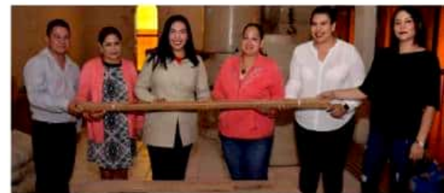
JACONA, MICH.- 702 toneladas de cemento gris y mortero, tinacos calentadores solares, en beneficio de 700 familias jacconenses, ha entregado la actual administración pública municipal.