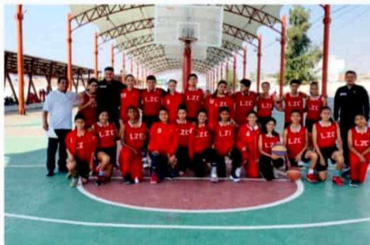
CD. LÁZARO CÁRDENAS, MICH.- La Escuela Secundaria Ricardo Flores Magón, resultó ganadora de los Juegos Deportivos Estatales celebrados en Morelia, logrando así su pase a la etapa Nacional.