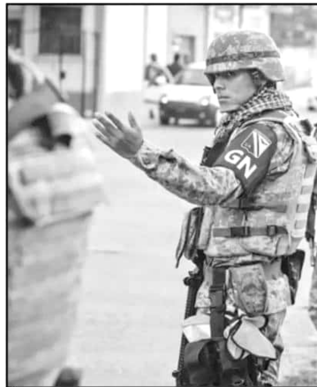
UNO DE LOS PUNTOS MÁS CONTROVERTIDOS ES QUE LA GUARDIA NACIONAL ESTAR