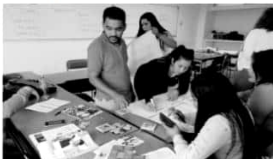
MORELIA, MICH.- Fue abierta la convocatoria para cursar la nueva licenciatura de Inclusión Educativa, en el Instituto Michoacano de Ciencias de la Educación

Para mayores informes, los interesados podrán obtenerlos en la página www.imced.edu.mx , e-mail dudas@imced.edu.mx , Facebook imced página oficial o twitter @Oficial_IMCED .