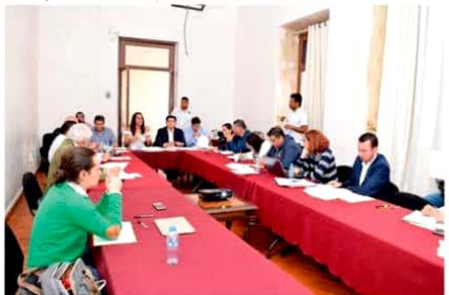
El Comité Organizador del Séptimo Parlamento Juvenil 2019, analiza los últimos de talles para el lanzamiento de la convocatoria respectiva.