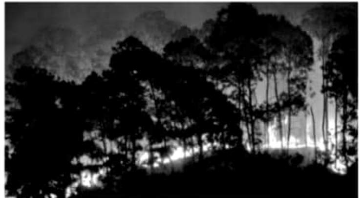
URUAPAN, MICH.- Las brigadas contra incendios forestales, de las diferentes dependencias, no se dan abasto con el trabajo que deben hacer para sofocar los incendios

las personas interesadas en ayudar, pueden llevar viveres a la presidencia municipal o directamente al área de montaña del Parque.