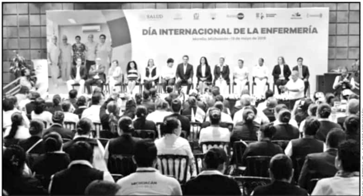
CON UN ACTO PROTOCOLARIO AUTORIDADES ESTATALES CELEBRARON EL DÍA INTERNACIONAL DE LA ENFERMERÍA, DONDE RECONOCERON LA LABOR QUE REALIZAN.

cual se conocerán los costos para cubrir el déficit de personal de enfermería y el número de profesionales que deben tener una mejora de sus condiciones laborales por contar con un mayor rango académico del que tenían cuando fueron contratadas.