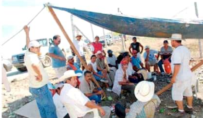
Los ejidatarios y posesionarios del ejido de Zacatula tienen audiencia hoy martes por una demanda que recién entablaron. GEORGINA GASCA

Los posesionarios y ejidatarios demandan pagos de las tierras y los bienes distintos a ellas, reclamo que han