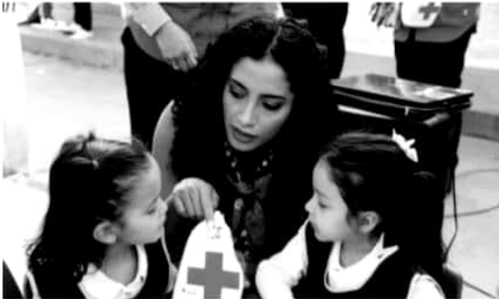
MORELIA, MICH.- Sin importar la edad que se tenga, el llamado de solidaridad hacia la Cruz Roja es para todas y todos.

Las y los representantes de la Cruz Roja también acudieron al segundo edificio de la Secretaría de Desarrollo Rural y Agroalimentario, donde trabajadores y trabajadores mostraron su generosidad al dar su aportación, que contribuirá a mejorar la atención y equipamiento de la corporación.