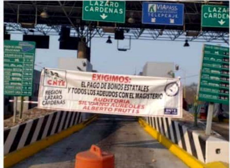
CD. LÁZARO CÁRDENAS, MICH.- Como parte de su Jornada Nacional de Lucha, CNTE anunció una serie de movilizaciones a partir del próximo miércoles. (Foto: Archivo).

■ Van por tomas de casetas, de ayuntamientos y marchas