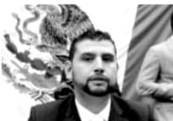
MORELIA, MICH.- En México es necesario un acompañamiento efectivo en la búsqueda de desaparecidos, en donde las autoridades no deleguen sus responsabilidades a las familias de las víctimas.