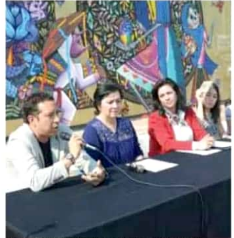
Anuncian el 6º Congreso Peatonal “Encaminando a la Ciudad”.

La sede principal de las actividades será la Plaza de la Paz, de Morelia, con sedes alternas en la calzada