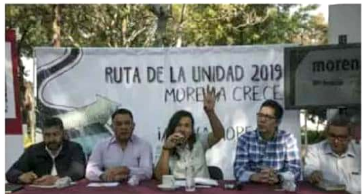
La próxima semana se discutirán y aprobarán las leyes secundarias de la reforma que da vida a la Guardia Nacional.

"Es muy grave, y lo más grave es que pensamos que no lo es; eso es terrible para nosotros, que nos acostumbramos a la violencia, y si hay dos decapitados en un lugar, no pasa nada, y al día siguiente cuatro, y no pasa nada; es parte de nuestra cotidianidad", lamentó; además, mencionó que Morena busca que todas las acciones de la Guardia Nacional se instrumenten en Michoacán "con toda su fuerza".