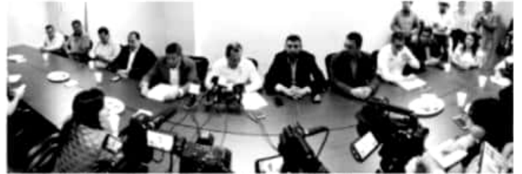
MORELIA, MICH.- Apartir de hoy, la Secretaría de Desarrollo Rural y Agroalimentario (Sedrua), tendrá abiertas 45 ventanillas regionales para la recepción de solicitudes de apoyo al campo

También, en Paracho, Chilchota, Tzintzuntzan, Pátzcuaro, Lagunillas, Tacámbaro, Carácuaro, Huetamo, Coahuayana, Lázaro Cárdenas, Coalcomán, Múgica, Nuevo Urecho y La Huacana; la mayoría de las ventanillas estarán ubicadas en presidencias municipales y, a partir del lunes, los interesados podrán consultar en la página de Sedrua, el listado y ubicación de ventanillas.