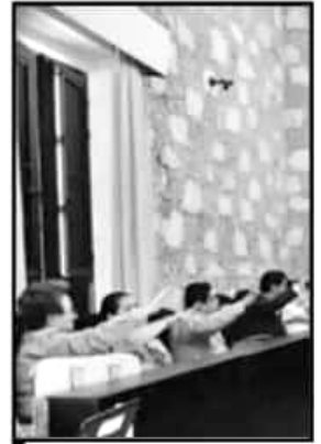
POR UNANIMIDAD, EL CABILDO DE LA PIEDAD APROBÓ LAS OBRAS.