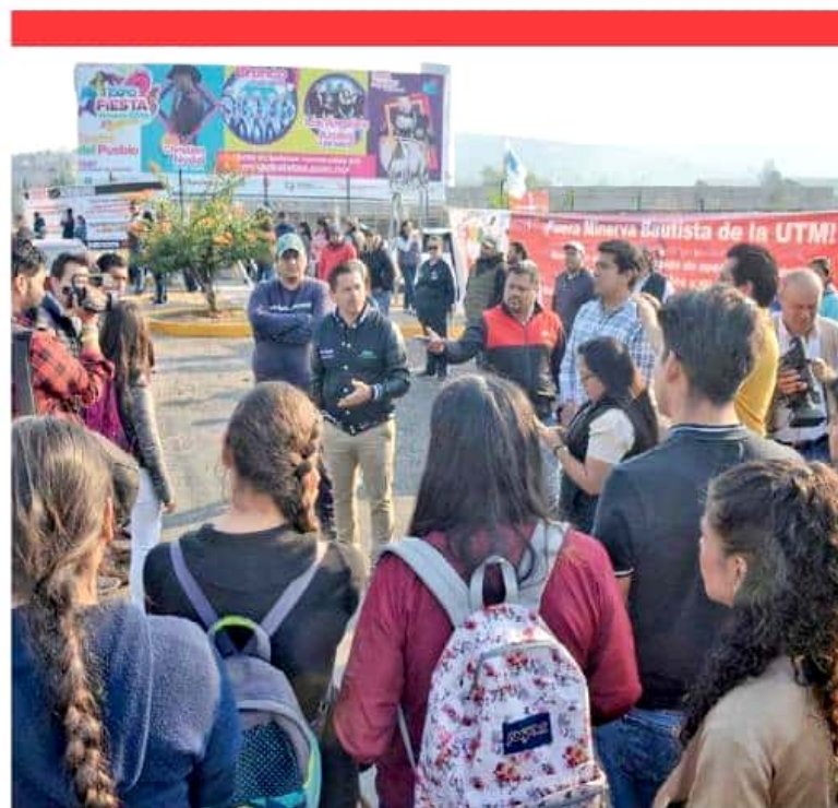
Alumnos de la Universidad Tecnológica de Morelia se manifestaron en el acceso principal del campus para exigir a los docentes que les permitan ingresar para iniciar con las actividades del cuatrimestre. CARMEN HERNÁNDEZ

"Esto parece un cheque en blanco para algunos personajes que se han dedicado a vivir del tema educativo... regresa un tema en esta reforma que tiene asfixiado al estado, como son las plazas automáticas. Aquí en el Congreso de Michoacán se vana topar con pared", advirtió.