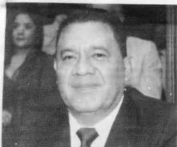
Fermín Bernabé Bahena, presidente de la Junta de Coordinación Política del Congreso del Estado.

Fermín Bernabé reconoció que no se ha llegado a cumplir todavía al cien por ciento los aspectos planteados en la austeridad planteada por Morena, aunque destacó que se debe a que ellos son sólo doce diputados locales, y muchas veces la mayoría decide otras cosas.