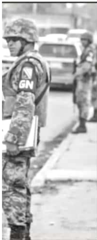
CONFORMADA POR SOLDADOS, NO POLICIAS.

cionales de mayor tamaño y densidad poblacional, así como uno de los de mayor incidencia delictiva.