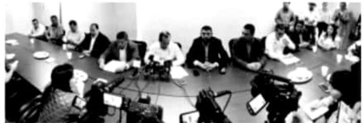
MORELIA, MICH.- A partir de hoy, la Secretaría de Desarrollo Rural y Agroalimentario (Sedrua), tendrá abiertas 45 ventanillas regionales para la recepción de solicitudes de apoyo al campo

También, en Paracho, Chilchota, Tzintzuntzan, Pátzcuaro, Lagunillas, Tacámbaro, Carácuaro, Huetamo, Coahuayana, Lázaro Cárdenas, Coalicomán, Múgica, Nuevo Urecho y La Huacana; la mayoría de las ventanillas estarán ubicadas en presidencias municipales y, a partir del lunes, los interesados podrán consultar en la página de Sedrua, el listado y ubicación de ventanillas.