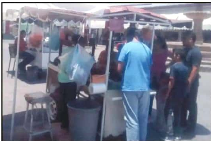
EXPENDIOS DE ALIMENTOS EN TIANGUIS Y MERCADITOS, DE LOS PRINCIPALES LOCALES EN LA MIRA DE AUTORIDADES.