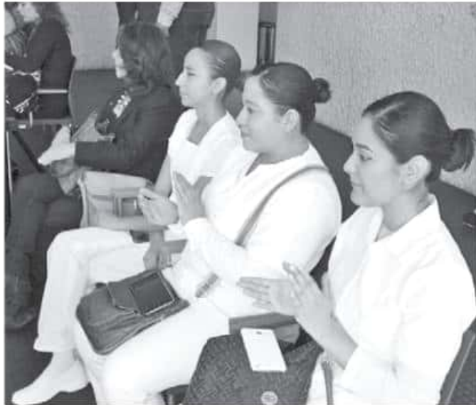
El gobierno estatal anunció el inicio de la campaña mundial "Nursing Now" en Michoacán.

En entrevista previa al evento, indicó que en la entidad hay tres mil enfermeras, pero que el déficit en zonas específicas se debe a situaciones regionales "como Apatzingán, ahí se debe a que cambiaron de inmueble y no se contrató a gente nueva, doblan turnos y las enfermeras nunca han sido suficientes".