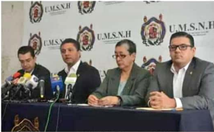
El rector reiteró la importancia de tomar conciencia del problema financiero que enfrenta la UMSNH.