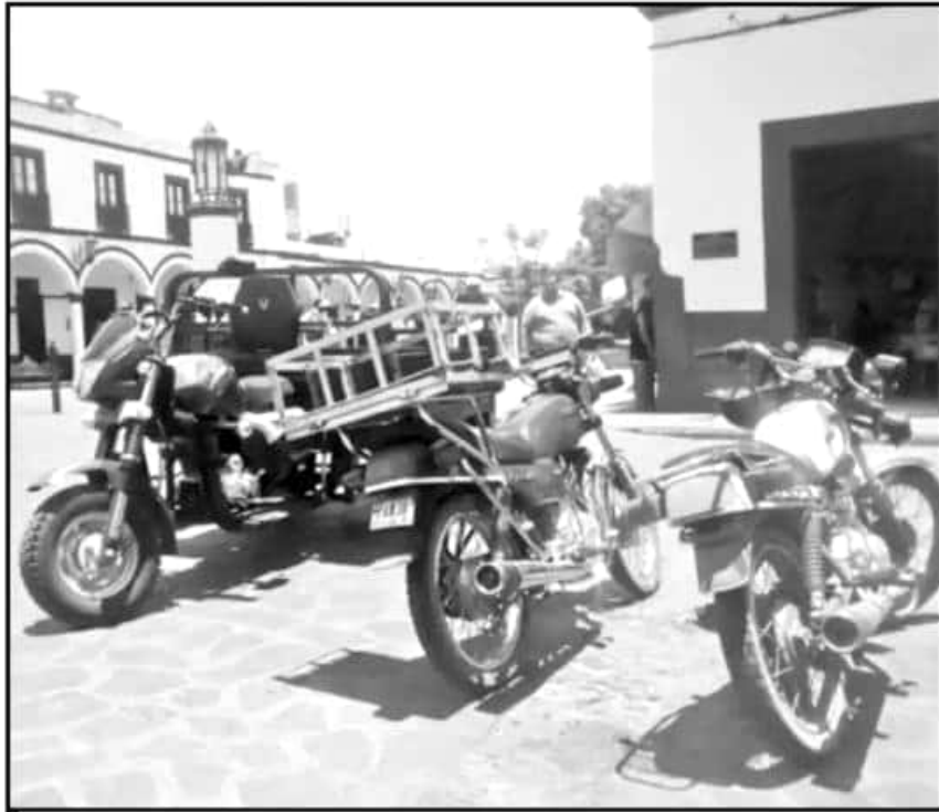
ANTE EL ROBO DE PLACAS ES NECESARIO LEVANTAR LA DENUNCIA CORRESPONDIENTE PARA EVITAR COMPLICACIONES.

Es de señalar que, por ejemplo en el municipio de Sahuayo, dos de cada cinco eventos delictivos consumados están relacionados con motocicletas robadas o con placas sobrepuestas. En ese sentido, las autoridades de los municipios de esta región han recomendado a los propietarios que traten de regularizar sus vehículos y tramitar la obtención de placas para hacer más fácil su localización en caso de robo tanto del