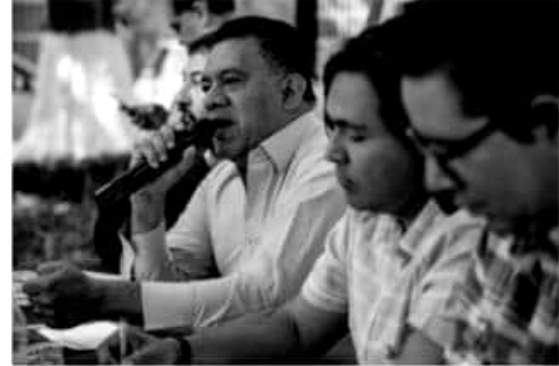
MORELIA, MICH.- Las y los diputados de Morena en la LXXIV Legislatura del Congreso del Estado trabajan a marchas forzadas para potenciar la transparencia y la rendición de cuentas en la Entidad.

las y los diputados en la entidad decreció a 95 mil pesos", agregó. En el caso específico del Congreso de Michoacán reconoció la necesidad de trabajar en impulsar más plataformas de austeridad, luego de recapitular que el Instituto Mexicano para la Competitividad (IMCO) posicionó al Legislativo Local en la tercera posición entre los Congresos que mayores gastos generan, apenas por debajo de los congresos del Estado de México y Ciudad de México. "Aun cuando el escenario sea adverso para Morena, seguiremos dando la batalla mediante acuerdos con el resto de fracciones parlamentarias, a fin de que acondicionar un plan legislativo que proyecte mejoras sociales para las y los michoacanos", concluyó.