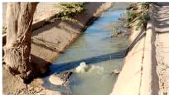
Directivos de la empresa Sustenta Michoacán, explicaron a integrantes del Órgano de Gobierno de este municipio, del estudio que tiene sobre el mal llamado relleno sanitario de este lugar.

Además en cada temporada de lluvias eleva riesgos, no hay control de los lixiviados a pesar de que contendrían metales pesados, no hay lugares específicos para valorizables es decir ➡➡ 6