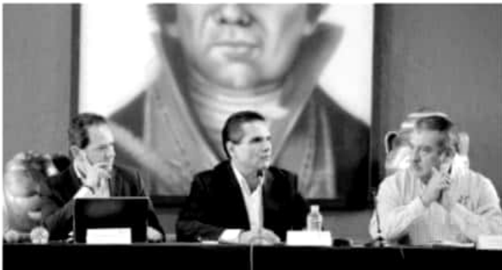
MORELIA, MICH.- El Gobierno del Estado que encabeza Silvano Aureoles Conejo continúa el trabajo coordinado con el Ayuntamiento de Morelia, para desplegar todas las acciones sociales, económicas y de seguridad que demanda la población de esta región.

También se desempeñó como Subsecretario de Gobierno, Director General de Gobernación y Secretario General de Gobierno del Estado de Hidalgo.