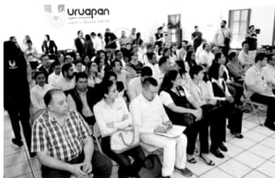
URUAPAN, MICH.- Es de suma importancia consolidar prácticas eficientes e innovadoras en la administración y gestión de los datos personales