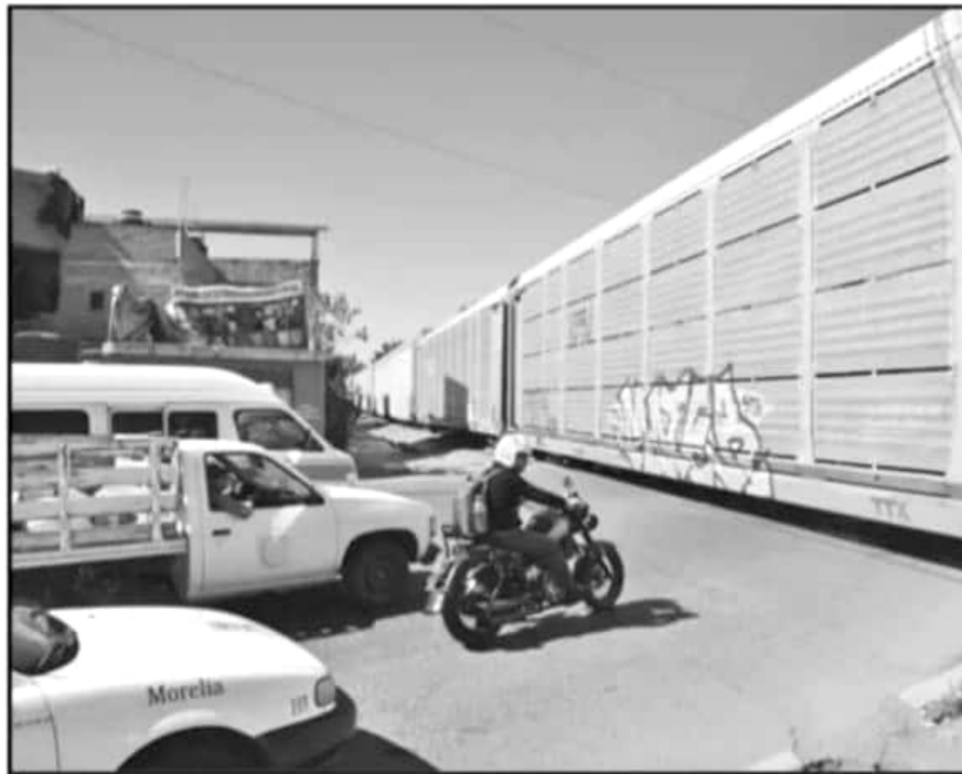
LOS 'ATORONES' QUE CAUSA EL TREN EN SU PASO POR LA CIUDAD ES LA PRINCIPAL QUEJA DE LOS MORELIANOS

pasaremos a actuar para generarles las condiciones y que esto se dé lo más pronto posible. A finales de la próxima semana se dará la reunión de valoración, donde tendremos ya una opinión técnica de Kansas City y veremos qué más hace falta, pero la idea es que este mismo mes ya tengamos todos los requerimientos de Kansas y que a finales de este mes ya podamos estar firmando el acuerdo con el gobierno federal, el del estado y la empresa Kansas City para ver