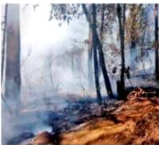
Siniestros afectaron el Imeca en la capital estatal.

Como referencia, se puede citar que en la Ciudad de México los índices de calidad del aire, del 10 al 14 de mayo, estuvieron entre 109 a 161 Imecas, lo que ha derivado en la activación del protocolo de contingencia atmosférica ambiental extraordinaria.