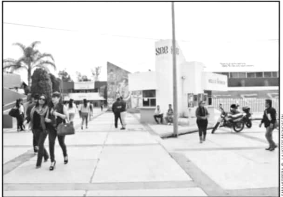
EL SECTOR EDUCATIVO ES DE LOS QUE MÁS SEÑALAMIENTOS TIENE POR IRREGULARIDADE EN EL MANEJO DE RECURSOS

Uno de los puntos que se destacan es el endeble derecho a la información pública, la precaria rendición de cuentas y las omisiones de las autoridades para cumplir con sus responsabilidades y asumir sus facultades legales, lo que abre la puerta a la impunidad, expresada como tolerancia al abuso en la nómina educativa.