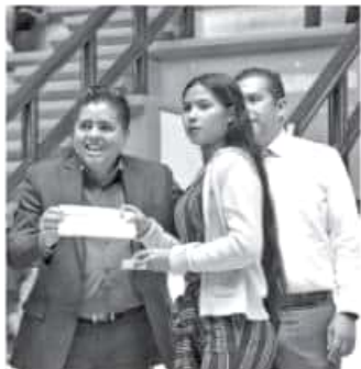
Los beneficiarios recibirán apoyos de cuatro mil 800 pesos.