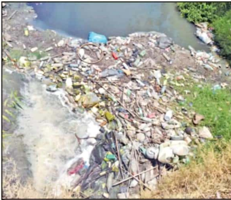
HOY INICIA FORMALMENTE LA TEMPORADA DE LLUVIAS Y LOS RÍOS Y DRENES LUCEN TONELADAS DE BASURA.

a escasos kilómetros de distancia, la situación no es muy diferente. En una de las colonias que sufrieron la mayor afectación por las lluvias del año pasado, aún se ven los estragos del agua. En algunas viviendas aún se alcanzan a notar las marcas de los niveles que alcanzó el agua con la precipitación del pasado octubre.