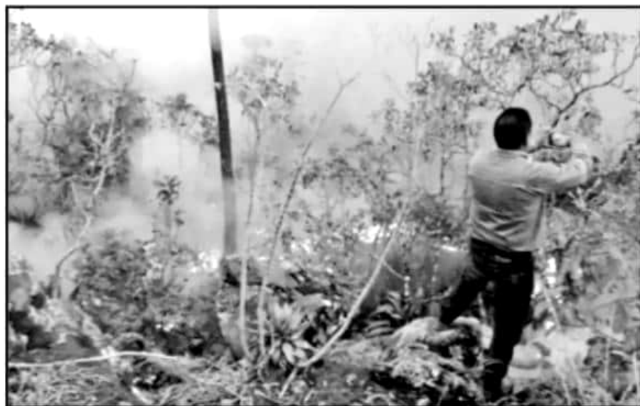
UN INCENDIO EN EL EJIDO DE NUEVO SAN JUAN SE PROPAGÓ Y LLEGÓ A LA ZONA NATURAL DEL PARQUE NACIONAL.