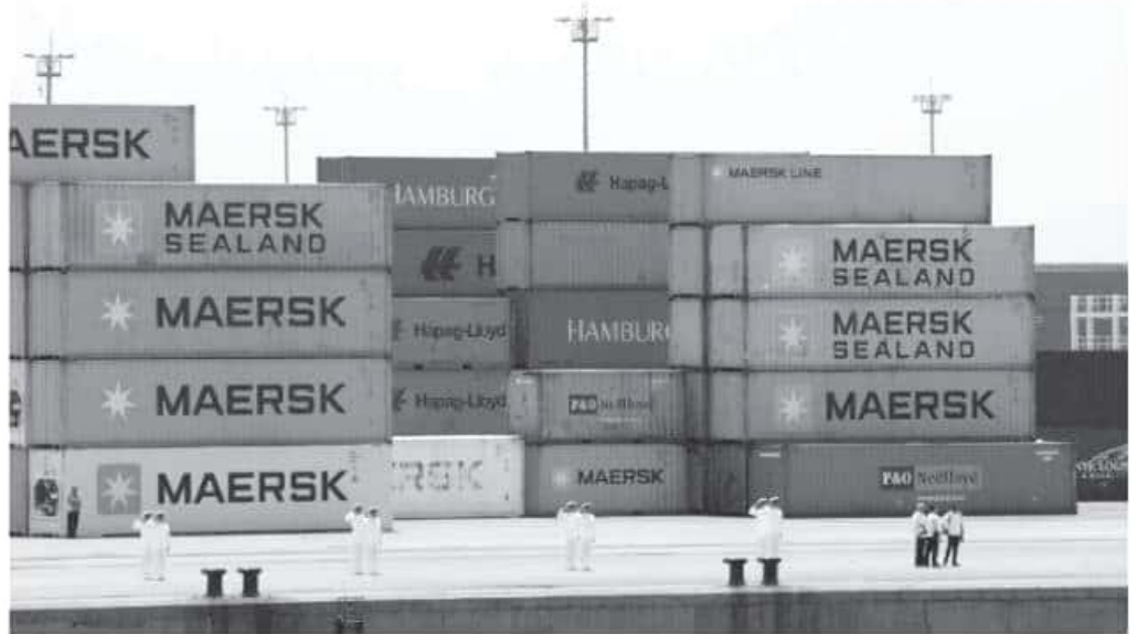
Por el tema de seguridad, muchas de las intenciones de inversión se han visto detenidas, por lo que de manera gradual se deberá trabajar a través de la Guardia Nacional.