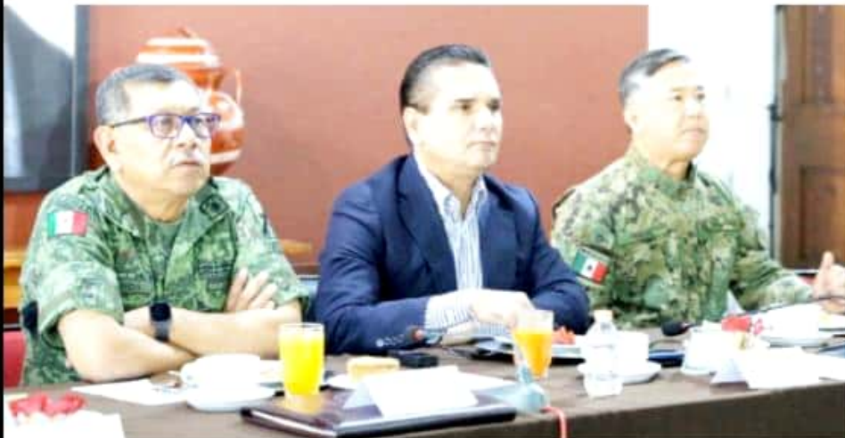
MORELIA, MICH.- El Gobernador Silvano Aureoles presidió la reunión de la Mesa de Coordinación Estatal para la

Asimismo, revisó la estrategia a desplegar en las zona entidad, con la próxima descentralización del Plan, para se prevé contar con la presencia del secretario de Segui Protección Ciudadana, Alfonso Durazo Montañó