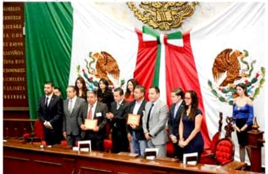
Por su trayectoria, la 74 Legislatura condecoró al Centro Regional de Educación Normal, con licenciatura en educación primaria, secundaria con especialidad en telesecundaria, así como al Centro Regional de Educación Normal en su licenciatura en educación preescolar, ambas del municipio de Artega.

quín Encires Gasca, así como a la Escuela Normal Rural Vasco de Quiroga, Escuela Normal Urbana Federal Profesor J. Jesús Romero Flores, Escuela Normal Indígena de Michoacán, Escuela Normal de Educación Física, Escuela Normal de Educadores de Morelia Prof. Serafín Contreras Manzo, Escuela Normal Superior de Michoacán y al Centro de Actualización del Magisterio en Michoacán.