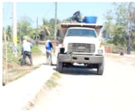
CD. LÁZARO CÁRDENAS, MICH.- El Departamento de Parques y Jardines, iniciaron con los trabajos de limpieza de la avenida Palmira, ubicada en la tenencia de Las Guacamayas.