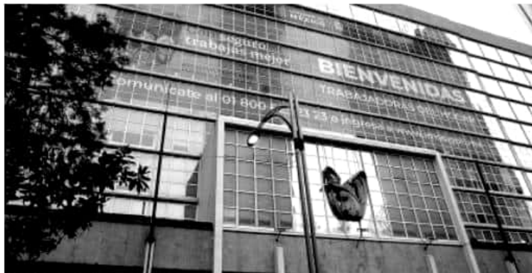
CIUDAD DE MÉXICO.- El IMSS informa que a mes y medio de haber puesto en marcha el Programa Piloto para la Incorporación de Personas Trabajadoras del Hogar se han recibido 3 mil 629 solicitudes de afiliación en todo el país.

Para mayor información sobre la inscripción de las personas trabajadoras del hogar a este programa, el Seguro Social pone a disposición el teléfono 01 800 623 2323, en un horario de atención, de lunes a viernes, de 08:00 a 20:00 horas.