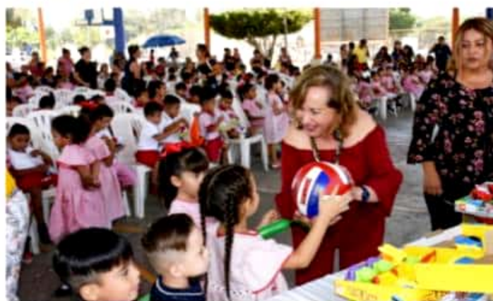
CD. LÁZARO CÁRDENAS, MICH.- El DIF Municipal festejó este martes a los 300 alumnos adscritos a los once CAIC's del municipio.