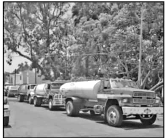
CHOFERES SEÑALAN QUE SÓLO EXISTE UN CARGADERO Y ESTO ATRASA TODO.

"No tenemos otra opción, tenemos que esperar hasta cuatro horas por cada viaje y eso merma nuestras ganancias", refirieron.