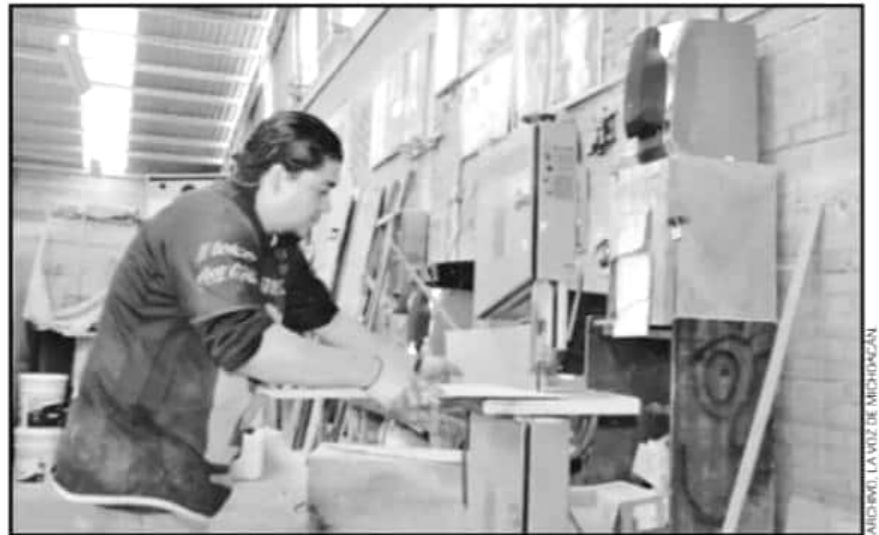
LA FIRMA BC&B DESTACÓ QUE EL REPARTO DE UTILIDADES DEBE ENTREGARSE A TRABAJADORES EN TIEMPO Y FORMA.

Entre las organizaciones que no están obligadas a repartir utilidades son: las empresas con un año de creación, el Instituto Mexicano del Seguro Social (IMSS),