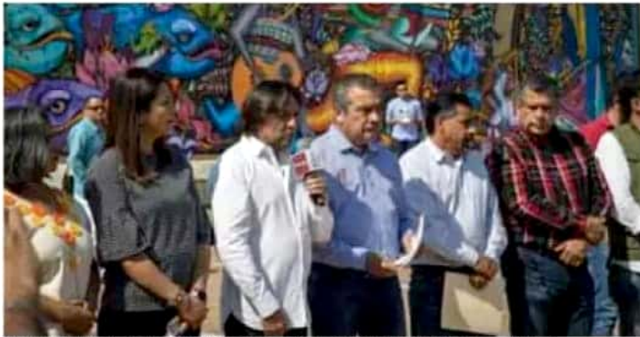
Autoridades municipales inauguraron la Plaza de la Paz y el corredor urbano Bartolomé de las Casas.

Recordó que recientemente se inauguró la rehabilitación de la calle Eduardo Ruiz, del