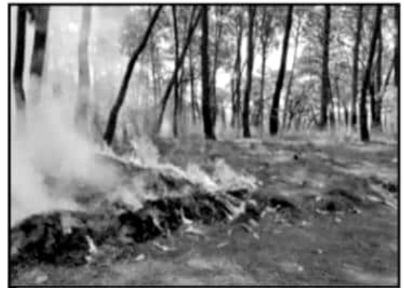
UN DESCUIDO AL MOMENTO DE APAGAR UNA FOGATA PUEDE OCASIONAR QUE EL FUEGO SE PROPAGUE Y DAÑE DECENAS DE HECTÁREAS DE BOSQUE.