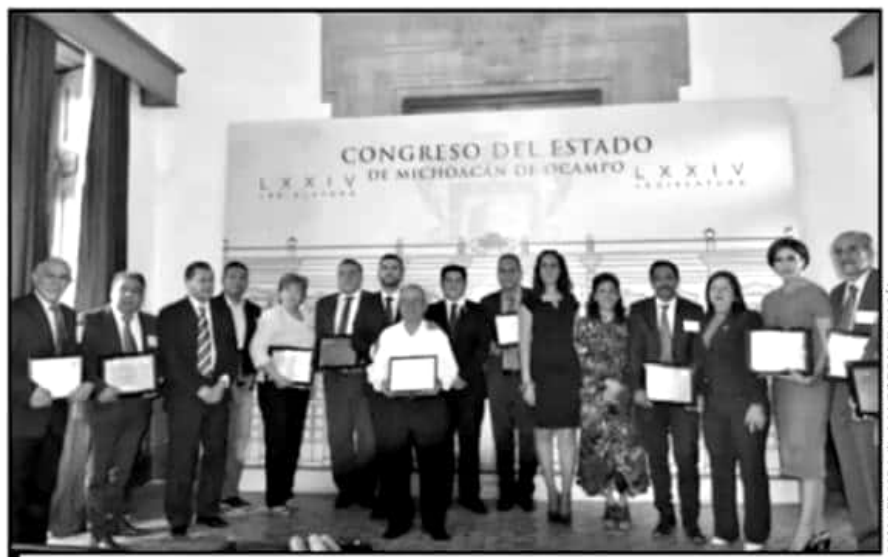
DIRECTIVOS DE LAS NORMALES DE ARTEAGA RECIBIERON EL GALARDÓN AL MÉRITO DOCENTE DEL CONGRESO LOCAL.