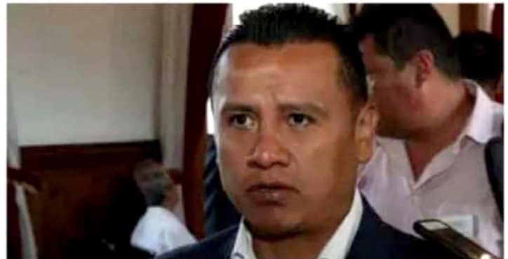
El diputado federal dijo que a más tardar el día 25 de este mes deberán estar aprobadas las leyes secundarias del proyecto.