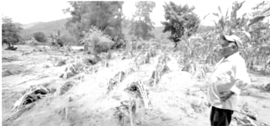
Daños en cultivos.

► Cubre 811 mil hectáreas de granos, frutales y hortalizas, además de 72 mil metros cuadrados de granjas acuícolas y dos mil 900 botes ribereños