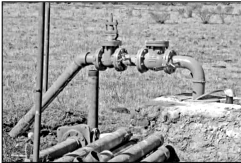
AYUNTAMIENTO RECURRIRÁ A LA REHABILITACIÓN E INTERCONEXIÓN DE ALGUNOS OTROS POZOS PARA MITIGAR ESCASEZ.

lizados, se dio arranque con la perforación de un nuevo pozo que, tras la culminación de los trabajos, no logró satisfacer el gasto de agua esperado, por lo que técnicamente se ha considerado como inviable.