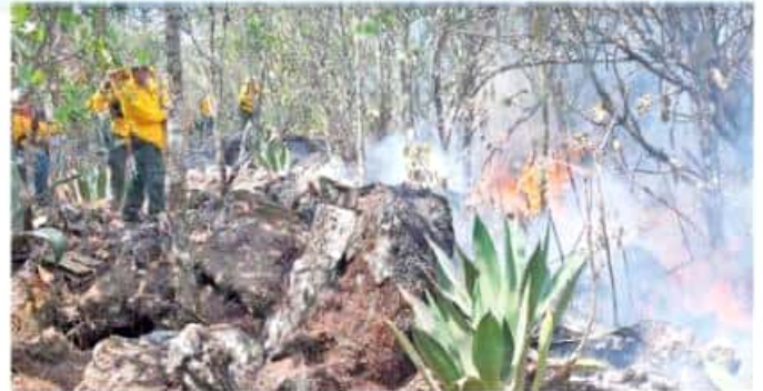
El presupuesto destinado al combate del fuego es de 52 millones de pesos y se activa a 186 brigadistas en 12 campamentos.

En cuanto a la extensión de territorio que se ha visto afectado por el fuego, se han