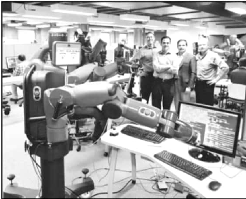
ANÁLISIS DE LA OCDE SOBRE EL FUTURO DEL TRABAJO PREVE UN AUMENTO EN LA AUTOMATIZACIÓN DEL MISMO.

Falco señaló que el segundo problema de México en materia laboral es la informalidad, que llega a 57 por ciento de los tra-