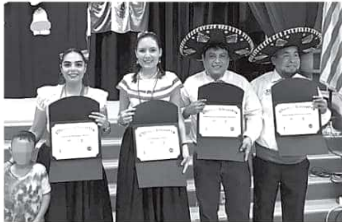
A través del Probem se da seguimiento a los casos de niños nacidos en el extranjero que por alguna circunstancia llegan al país a continuar su formación básica.

Afirma que a diferencia de docentes de otros estados, los michoacanos que participan en este programa diseñan un proyecto de enseñanza que se desarrolla durante su estancia en California, para lo cual debe presentarse a lo largo de varios meses, no solo en lo que tiene que ver con reforzar sus