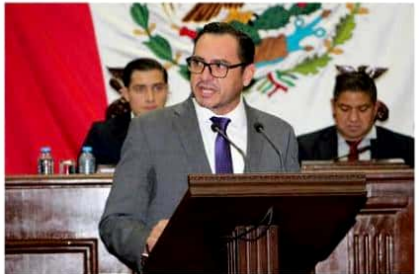
El legislador presentó una iniciativa para reformar la Ley Orgánica Municipal en Michoacán.

"Se debe facilitar a los Ayuntamientos el celebrar convenios de coordinación administrativa con otro o varios Ayuntamientos para diversos fines, entre los que se incluye la prestación de los servicios públicos y la constitución de "Concejos intermunicipales", aunque éstos ya están previstos en la ley como instancias de colaboración para la planeación y ejecución de programas y acciones", indicó.