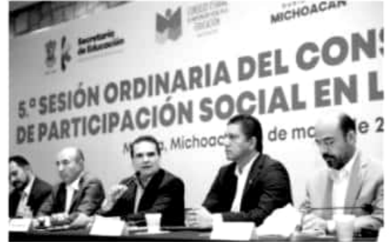
MORELIA, MICH.- Defender el tema educativo, porque es el futuro de nuestros hijos e hijas, de Michoacán y de México, fue el llamado que hizo a todos los sectores el Gobernador del Estado, Silvano Aureoles Conejo.