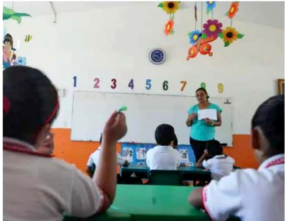
El sueldo base de un docente frente a grupo es de 17 mil pesos mensuales.

Autoridades de salud estimaron que "por la circunstancia climática de este año vamos a tener más casos", sin embargo, aseguraron que ya se realiza una campaña de lucha para prevenirlo. JOSMAR LARA