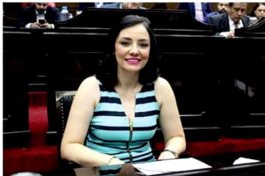
La legisladora priista dio a conocer que en México 74 mil menores de edad fuman a diario.