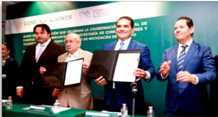
Anuncian ampliación de infraestructura del Puerto LAC.

siempre, no falta quienes se quieren colgar las medallas, pero todo el pueblo sabe quiénes las tienen merecidas. ¿o no?... Pero creo que me desvíe tantito del tema, pero como les decía, ojalá que con esa entrega de nuestros atletas, el equipo Monarca vaya a la capitrucha y se la rife como los buenos . ¿Estaremos pidiéndole peras al olmo? Pues quién sabe, pero mejor nos vemos porque ahí viene otra vez mi tía que está de sensible como los políticos que no se les puede decir nada de sus errores, aunque muchos de ellos, en cuanto agarran hueso , se olvidan hasta de los que los ayudaron. Mmmh , no les digo... PERO CAMBIANDO de temas, Pues déjenme decirles que un buen panorama se avizoró este jueves para Michoacán , tras la gira de trabajo que realizó el gobernador Silvano Aureoles Conejo por la Ciudad de México. Y es que en primer lugar, déjenme comentarles que el mandatario estatal firmó con el