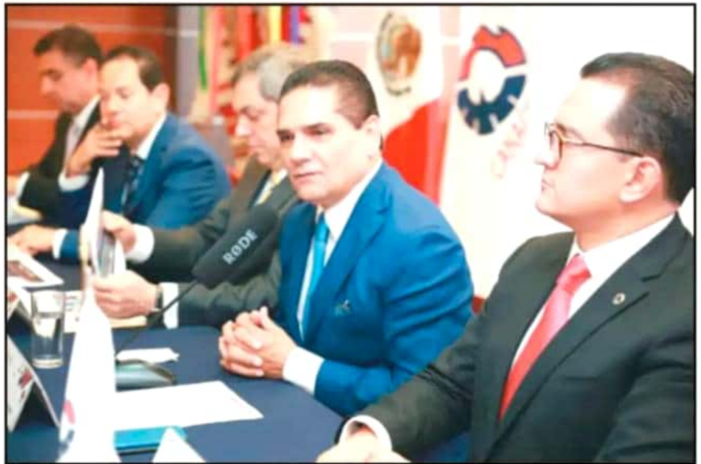
EL GOBERNADOR DE MICHOACÁN ANUNCIÓ EL EVENTO DE INDUSTRIALES QUE SE REALIZARÁ EN EL MES DE OCTUBRE.