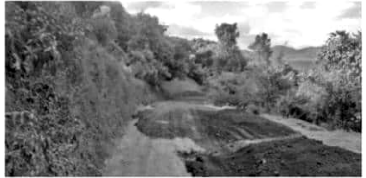
URUAPAN, MICH.- Desde mayo del año en curso se han llevado a cabo estos trabajos, que incluyen también mil 180 viajes de materiales pétreos para mejora de los caminos en comunidades como Santa Ana Zirosto y Nuevo Zirosto, La Caratacua, Angahuan y Corupo, entre otras.

Por último, reiteró el compromiso con los habitantes de las comunidades, pues para ellos es de suma importancia contar con caminos en buen estado ya que la agricultura es la base económica de las mismas y por ende de generación de empleos.