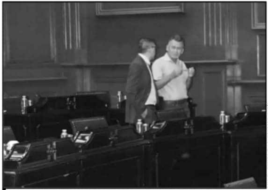
ACTUALMENTE LOS DIPUTADOS ESTÁN EN RECESO LEGISLATIVO. SIN EMBARGO, PARECIERA QUE SON VACACIONES.

El integrante de la Junta de Coordinación Política prevé reunirse el próximo 19 de agosto, antes de la sesión solemne del Congreso en la población de Zitácuaro, en donde habrá de conmemorarse la instalación de la Suprema Junta Nacional Americana. Proyectó que para el miércoles 21 de agosto podría celebrarse sesión extraordinaria del Pleno para sacar temas pendientes e invitar a los integrantes