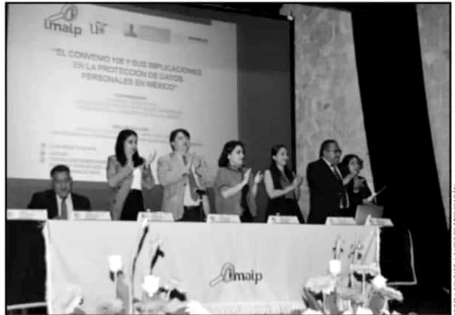
REALIZA IMAIP FORO INTERNACIONAL PARA PROMOVER EL CUIDADO Y BUEN MANEJO DE LOS DATOS PERSONALES.

“Los datos que tiene ese teléfono sobre mí son inmensos, puede monitorearme por todo el mundo y saber por dónde voy, con la posibilidad que eso tenga para la comisión de delitos. Porque si estoy en México, no estoy en España y mi vivienda puede ser asaltable y todo esto yo no di la información, yo no quería que