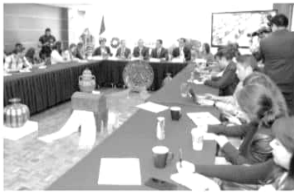
Puerto de Lázaro Cárdenas, punto estratégico y futuro de la inversión en México, destaca el mandatario estatal.

El encuentro reunirá a empresarios de México agremiados a la Canacinttra, durante los días 16,