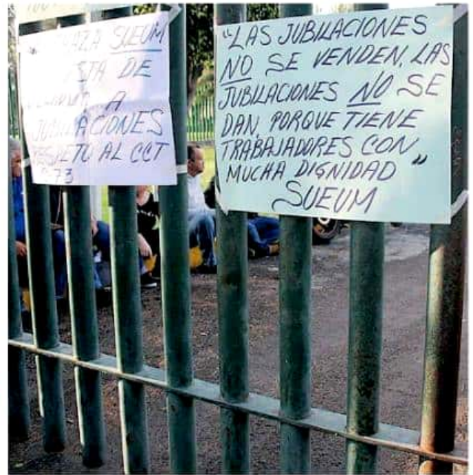
La acción se realizó en Rectoría y el CIAC, en CU