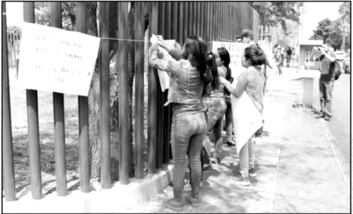
DESDE ESTE MIÉRCOLES, SINDICALIZADOS DEL SUEUM AMENAZARON CON ACCIONES DE PROTESTA Y TOMA EN CIUDAD UNIVERSITARIA Y EL CENTRO HISTÓRICO.

El rector Raúl Cárdenas Navarro informó que ayer se liquidarán los pagos referentes a la nómina ordinaria (la quincena) de trabajadores académicos, administrativos, personal de apoyo, pensionados y jubilados; de la misma manera, se hizo la entrega de diversas prestaciones estipuladas en los Contratos Colectivos de Trabajo (CCT), como