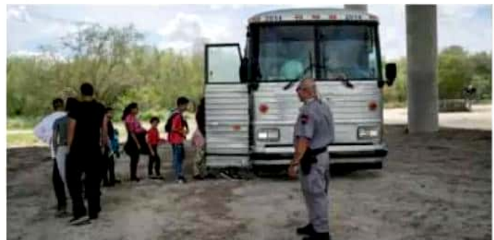
Michoacán se encuentra entre los estados con más deportaciones.

En su momento, la delegada del Instituto Nacional de Migración (INM) en Mi-