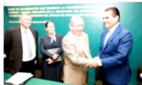
CIUDAD DE MÉXICO.- Firman Gobernador y Coordinación de Puertos y Marina Mercante acuerdo de colaboración para los próximos 5 años.