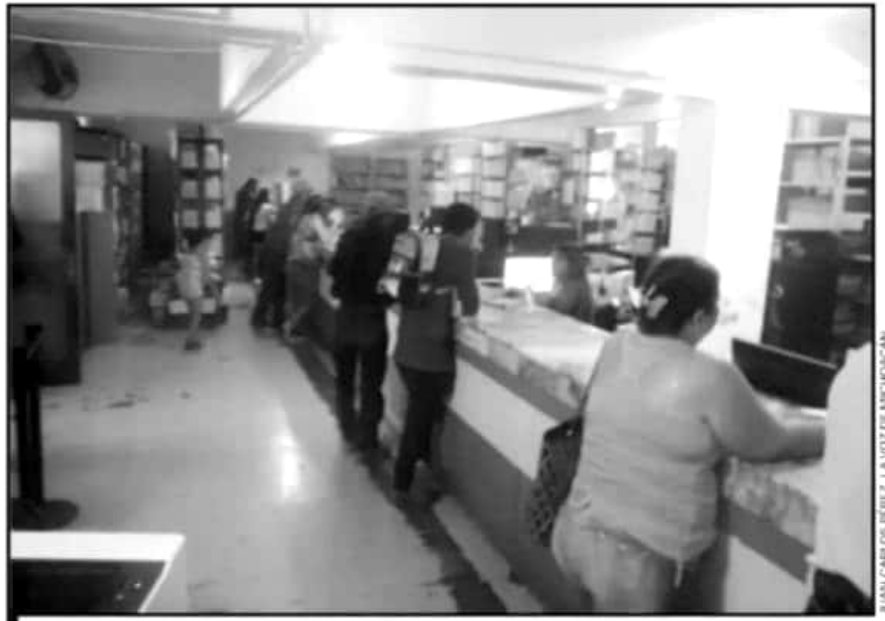
EL PROGRAMA DE BORRÓN Y CUENTA NUEVA ESTARÁ VIGENTE HASTA EL PRÓXIMO 15 DE OCTUBRE, DETALLARON.