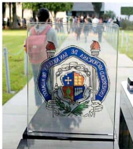
La UM tiene pocas posibilidades de recibir presupuesto extraordinario

los próximos días y estar en condiciones de continuar trabajando con la normalidad que implica el próximo inicio del ciclo escolar 2019/2020.