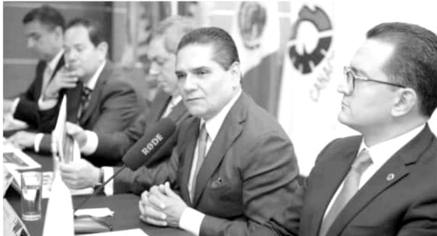
En la entidad se cuenta con una de las mejores unidades de lucha antisecuestro del país.

cil, habían secuestros, extorsiones pero ahora la cosa ha cambiado» pues de pasar a ser un sitio de delitos constantes, en los últimos 15 días solo se