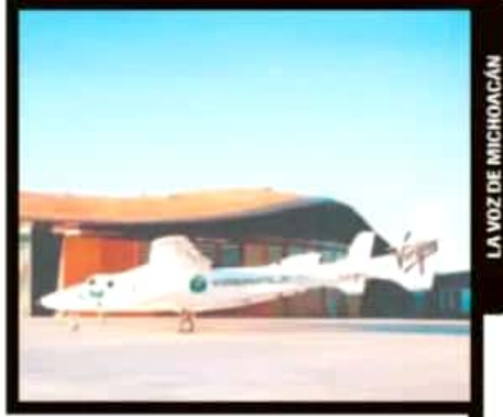
LA VOZ DE MICHOACÁN