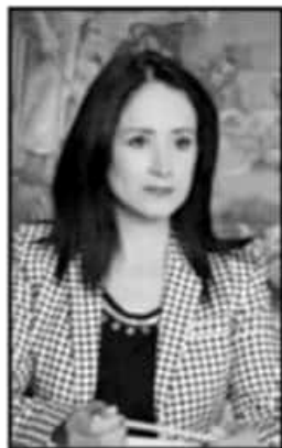
LA DIPUTADA PROPONE DESCONTAR A LOS INCUMPLIDOS.