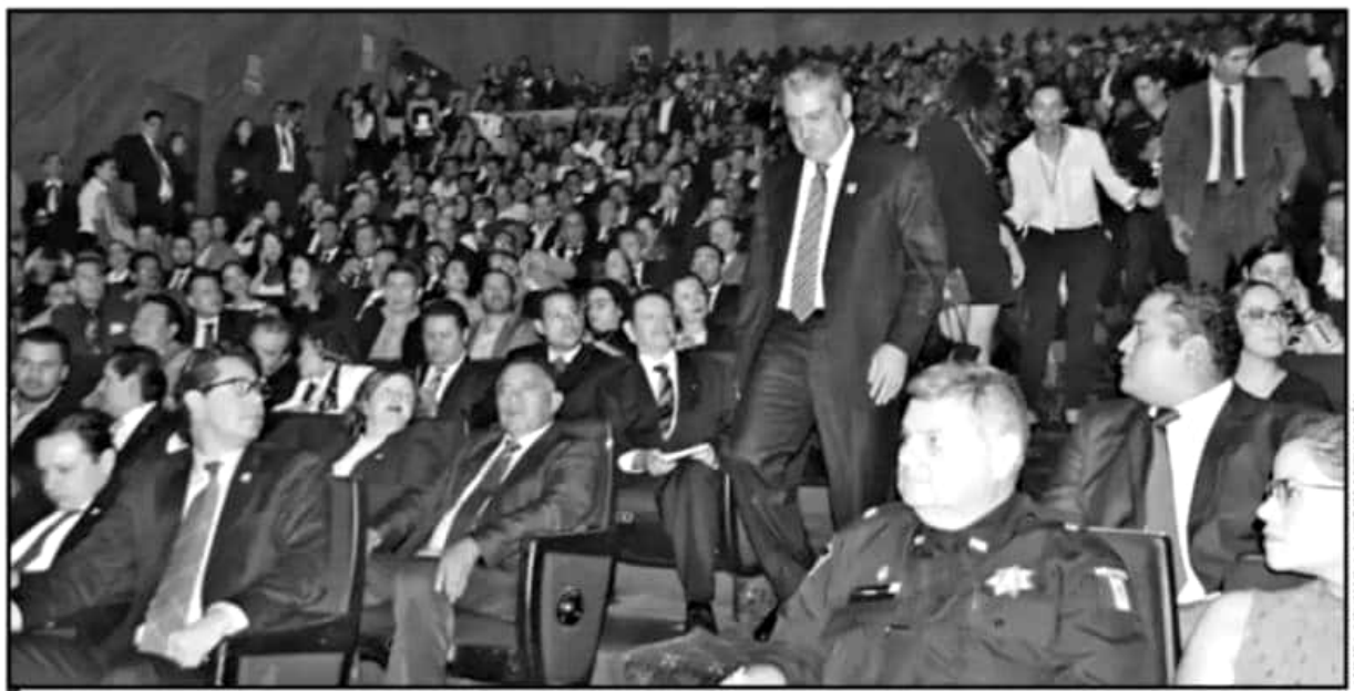
SIGUE PENDIENTE LA INFORMACIÓN DE LOS GASTOS EN PUBLICIDAD DEL PRIMER INFORME DEL ALCALDE MORELIANO, PESE A QUE SE COMPROMETIÓ A ELLO.

120 ASESINATOS en Morelia, en lo que va del año