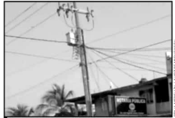
BUSCAN CONCLUIR LOS TRABAJOS PARA INSTALAR EL CABLEADO SUBTERRÁNEO QUE QUEDARON PENDIENTES DESDE HACE CASI UNA DÉCADA.

A ello se aseguró por el representante del Nacional Minero que hasta lo que han platicado con ArcelorMittal no le interesa comprar los activos de Altos Hornos de México, "a ArcelorMittal le interesa hacer inversión en Lázaro Cárdenas y es por alrededor de 300 millones de dólares" estableció el Secretario de Actas del Nacional Minero.