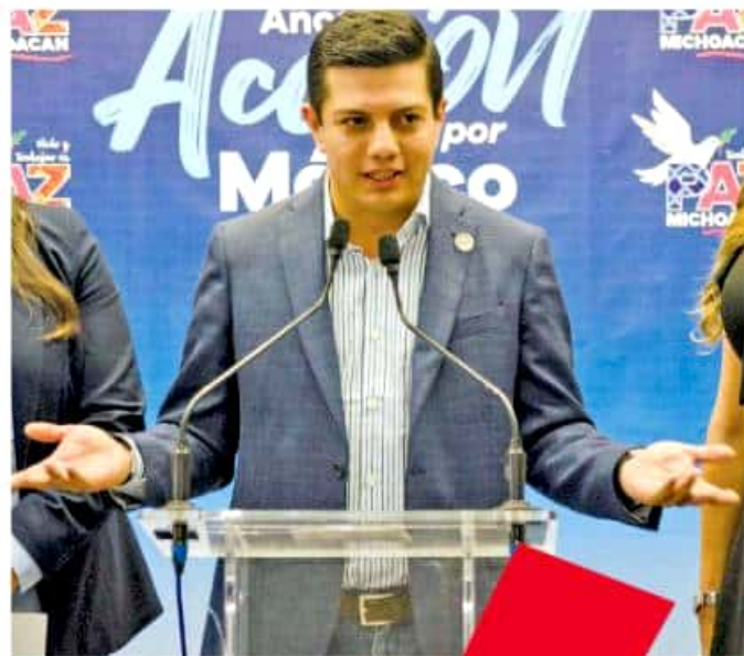
El líder del partido afirmó que el trasfondo de dicha medida es "exterminar" la oposición política AMLO

Al reconocer no debe haber un mal uso de los recursos públicos por parte de los partidos, afirmó que el Comité Estatal ha logrado generar ahorros por el orden de