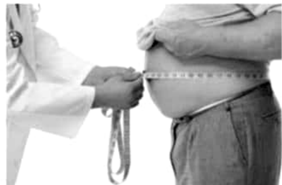
CIUDAD DE MÉXICO.- Controlar la obesidad, diabetes y metabolismo son las principales acciones de atención médica que se realizan en el Instituto Mexicano del Seguro Social (IMSS) para evitar el desarrollo de hígado graso y prevenir complicaciones como la cirrosis.

La especialista del Seguro Social indicó que si el paciente no mejora o a pesar del tratamiento continúa con inflamación del hígado, es referido a las especialidades de gastroenterología, medicina interna o endocrinología para mejorar la reducción de peso o el control metabólico de las enfermedades de fondo.