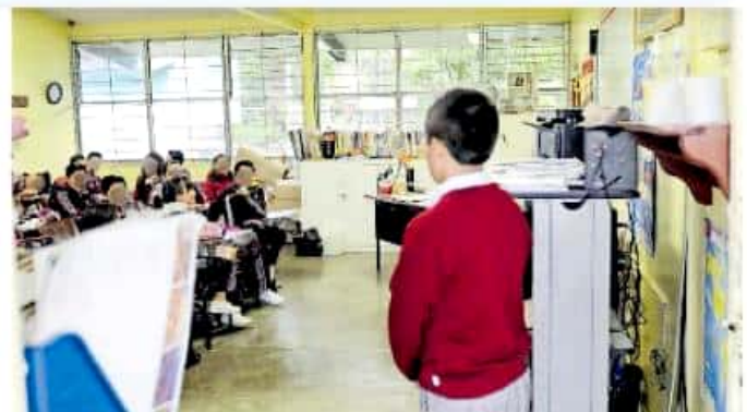
Una vez que arranque el próximo ciclo escolar 2019-2020, se llevará a cabo una revisión física a los más de nueve mil 400 centros escolares.