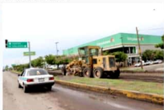
APATZINGÁN, MICH.- Poco más de 5.5 millones de pesos se invertirán en la reconstrucción de un tramo de la avenida Francisco I. Madero.

Expuso que la rehabilitación de la avenida no representará mayores complicaciones para los automovilistas o para las personas que habitan en esa zona de la ciudad, ya que es una vía que tiene varios carriles y fácilmente se puede transitar por ellos.