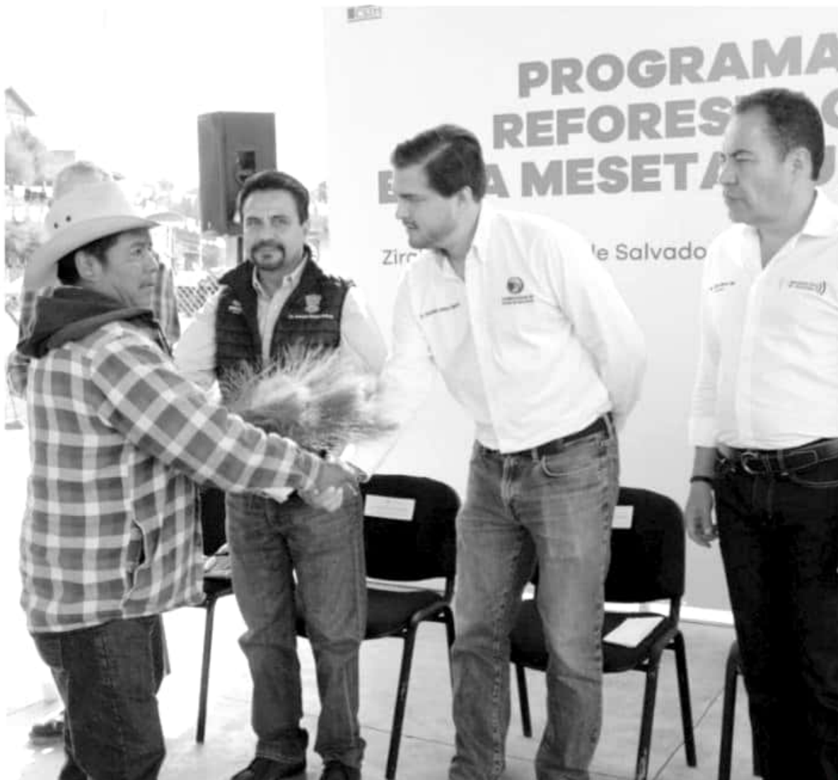
El gobierno de Michoacán, Consejo Supremo Indígena y Federación, comprometidos con el cuidado de los bosques de esa región. Este jueves se hizo la primera entrega de 137 mil 300 plantas.

Agregó que la siguiente semana se llevará a cabo la cuarta y última entrega convenida, la cual constará de 138 mil 400 plantas.