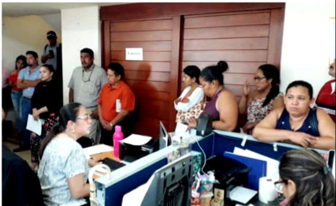
CD. LÁZARO CÁRDENAS, MICH.- La CNTE Sección XVIII, informó sobre la sorprendente falta de pago de la primera quincena de agosto, a profesores estatales del municipio, sin conocerse aún los motivos por el incumplimiento del gobierno michoacano.

los habilitados para que bueno pudiéramos decir que van a cobrar mañana (viernes), pero no los han llamado aún, es probable que si pagan mañana, pero lo más seguro es que paguen hasta el día lunes", concluye.