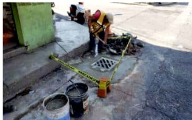
ZAMORA, MICH.- Las brigadas del Sapaz intensifican los trabajos de limpieza en alcantarillas y la red de drenes, para evitar encharcamientos ante las fuertes lluvias.