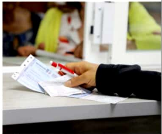
CD. LÁZARO CÁRDENAS, MICH.- La CNTE, pidió al presidente Andrés Manuel López Obrador, interponer una "queja formal" en contra del gobernador Silvano Aureoles Conejo, por la retención y retraso de la primera quincena del mes de agosto.

"Por lo antes expuesto, solicitamos su intervención para que de inmediato se paguen los salarios correspondientes a esta quincena y que se tomen medidas para que no se vuelva a repetir", cierran el escrito.