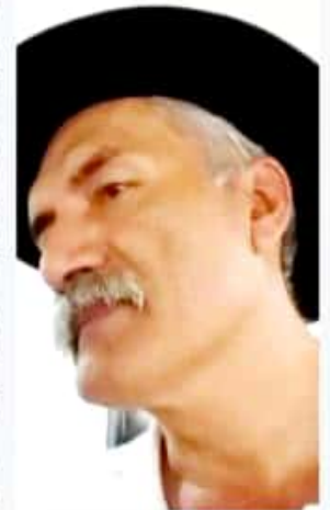
LÁZARO CÁRDENAS, MICH.- Durante su visita a la región, el exlíder de las autodefensas y que en su momento fue considerado para dirigir la Guardia Nacional, señaló que el combate a la delincuencia es una función única y exclusiva de las instituciones de gobierno.

Mireles Valverde que su fundación no se inmiscuirá en asuntos relacionados a la inseguridad, como prevención del delito. Si bien dijo que su origen tuvo como objeto el velar por los derechos humanos de todos los ciudadanos, enfatizó que su función va relacionada en brindar un servicio social a la población. "La Fundación Mireles no se mete en asuntos de Estado, la Fundación Mireles sólo va a colaborar en situaciones de servicio social a la comunidad, no de seguridad. La Fundación Mireles no va a prevenir nada", finalizó.