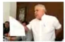
El SUEUM confirmó la ruptura de toda relación con el rector.

Europeo creó en 1981 el Convenio 108 –el primer instrumento legal internacional en materia de protección de datos–, y tiene el objetivo de proteger el procesamiento de datos de cualquier individuo, sin importar cuál sea su nacionalidad o su lugar de residencia. Inicialmente estaba conformado por los países de la Unión Europea, pero había la posibilidad de que cualquier país se uniera por invitación del Consejo Europeo. Actualmente están incluidos México, Uruguay y Argentina.