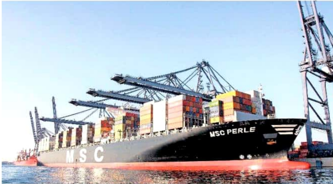
Los inversionistas pretenden inyectar recursos en el Puerto de Lázaro Cárdenas