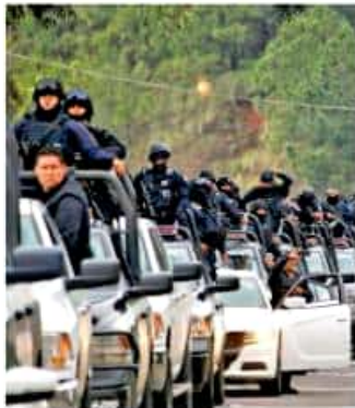
Son realizados en conjunto por la SSP y la Sedena