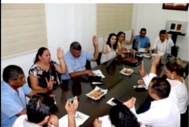
APATZINGÁN, MICH.- Para atender el grave problema de adicciones y alcoholismo entre jóvenes del Valle, el ayuntamiento en pleno aprobó aplicar el Acuerdo 236 del Congreso del Estado.

■ Ayuntamientos obligados a cumplir Acuerdo 236 del Congreso del Estado