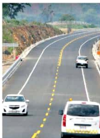
Se afirma que la vía no tiene los servicios reales de una autopista