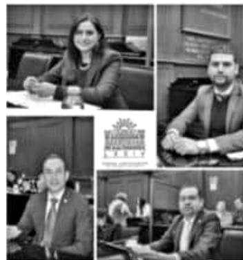
MORELIA, MICH.- El adelanto condicionado de participaciones a Michoacán, no es la solución para resolver de fondo la situación financiera que prevalece en la entidad.

Recordaron que por segunda ocasión, la salida de la Federación es que Michoacán recurra al adelanto condicionado de participaciones, lo cual pone en riesgo la estabilidad presupuestal de la entidad, no sólo para este año sino también para el siguiente, finalizaron.