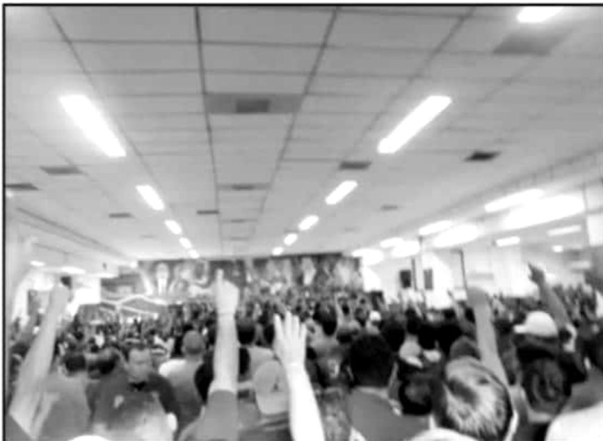
TRABAJADORES MINEROS MOSTRARON EL RESPALDO PARA AMPLIAR LA INVERSIÓN EN LA PLANTA DEL PUERTO.