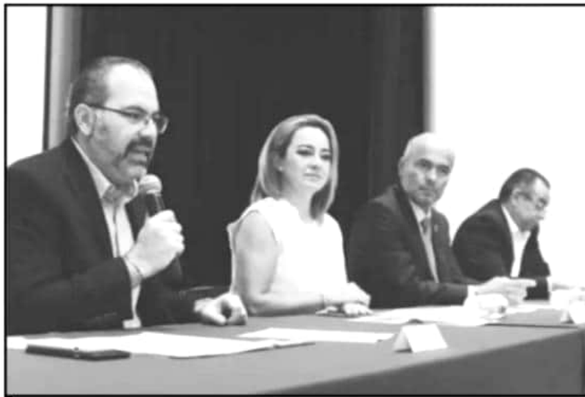
LA SECRETARÍA DE TURISMO AVALÓ LA MEDIDA DE LA EMPRESA AÉREA Y ESPERAN ÉXITO EN LA NUEVA RUTA.