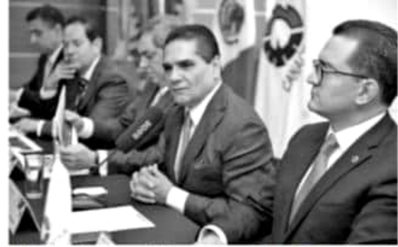
CDMX.- El gobernador de Michoacán, Silvano Aureoles Conejo, aseguró que la Convención Nacional de la Cámara Nacional de la Industria de la Transformación (Canacintra) 2019, será la mejor de los últimos años.

nómica de México, Sector Agroalimentario y el Enfoque Logístico Portuario.