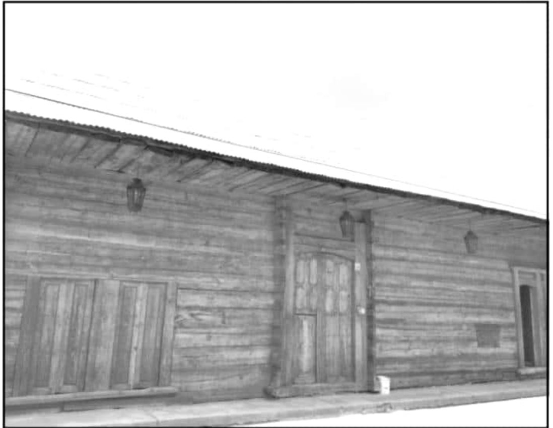
Más de 10 millones de pesos es el monto destinado a la rehabilitación de trojes, mejoramiento de imagen urbana e instalación de ecotecnias en las zonas Lacustre y Meseta purépecha.