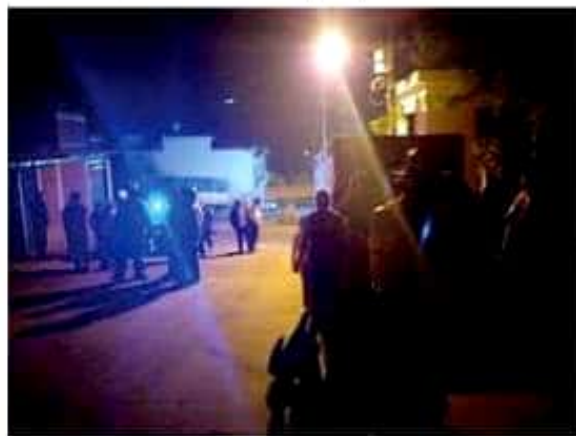
Ayer en Cotija, en diferentes hechos, cuatro hombres fueron ejecutados a balazos.