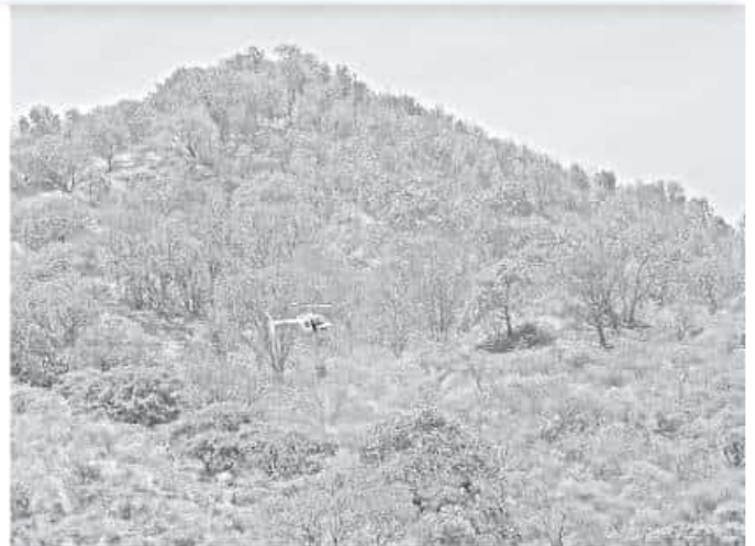
El funcionario federal reiteró que el programa de manejo del fuego opera con 184 combatientes. CUARTOSURCO

"Por la situación que prevalece en el país, vamos en la cola de las solicitudes. Hubo un incendio que sí ameritaba el uso del helicóptero, en Capacuaro, por lo pedregoso del terreno, sin embargo se atendió con personal de tierra".