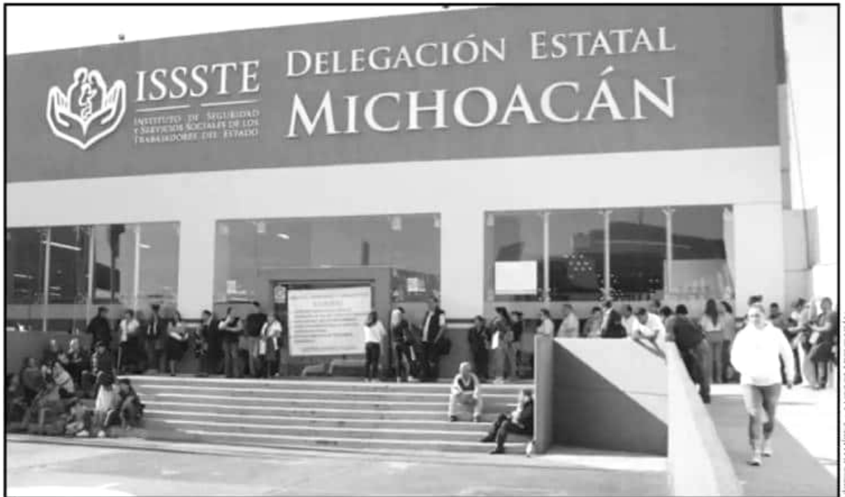
SE PREVÉ QUE HOY CONTINÚEN CON LAS MANIFESTACIONES EN LA DELEGACIÓN DEL ISSSTE, DE ACUERDO CON EL LÍDER DE LOS PROFESORES SINDICALIZADOS