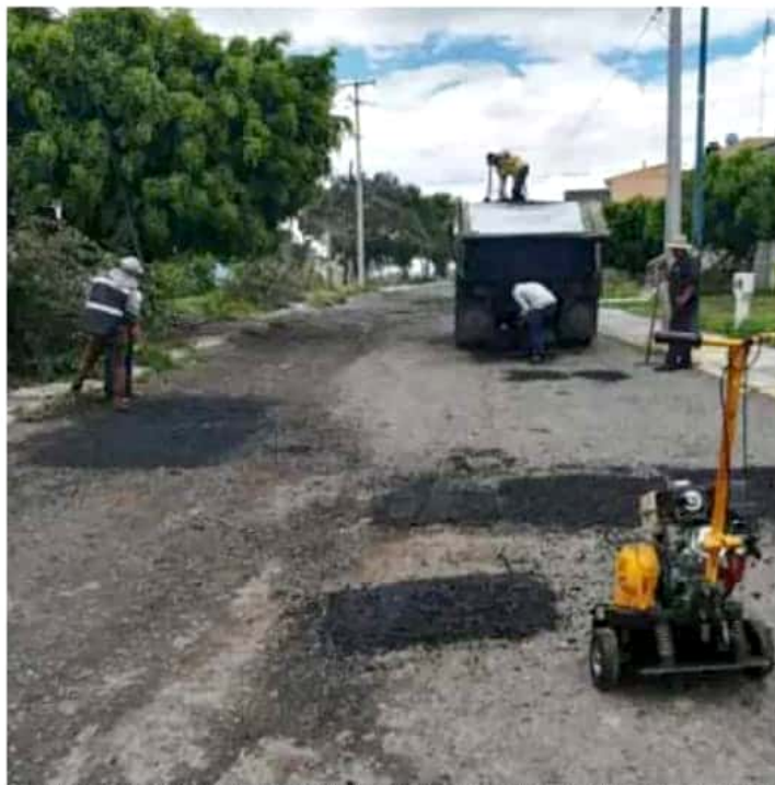
A través de las redes los ciudadanos se han expresado sobre la poca atención que se les dio a las vialidades en años previos.

Vecinos de colonias como Ciudad Jardín; José Vasconcelos, primera y segunda etapas; El Terrero; Pablo González Casanova; Vicente Lombardo Toledano; La Nueva Aldea; Hombres Ilustres; Peña Blanca, e incluso algunas casas de Villa Magna, llevan hasta 15 años en espera de que proceda la regularización, para así acceder a servicios básicos y estar en regla para cualquier