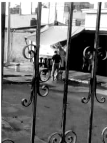
URUAPAN, MICH.- Capasu anunció la aplicación de multas económicas para quienes de forma consciente o inconsciente desperdicien el agua en la ciudad de Uruapan.

Es de señalar que para recibir reportes ciudadanos se pondrán a disposición los números 071 de teléfonos fijos o a los celulares 452 10 3 11 99 y 452 12 0 69 56.