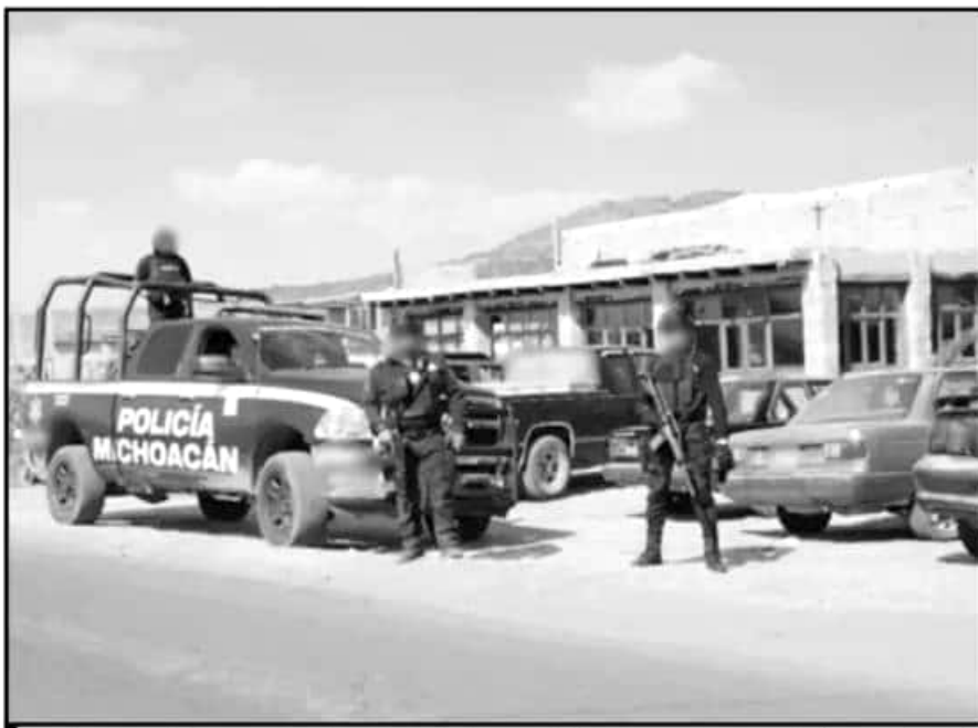
EL BLINDAJE DE LAS CARRETERAS ES PARTE DE LA ESTRATEGIA QUE IMPLEMENTA LA MESA DE SEGURIDAD Y JUSTICIA