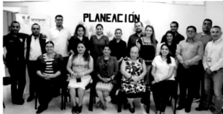
URUAPAN, MICH.- El Gobierno Municipal da muestra de su interés por fortalecer y hacer que crezca el programa "Escuela Modelo" en las instituciones educativas de Uruapan

Cabe recordar, que dicha red, que se constituyó mediante la firma de convenio en el pasado mes de abril, busca el desarrollo, diseño e implementación de acciones, programas e iniciativas en materia de prevención, con la participación de centros de estudios del nivel medio superior del municipio.