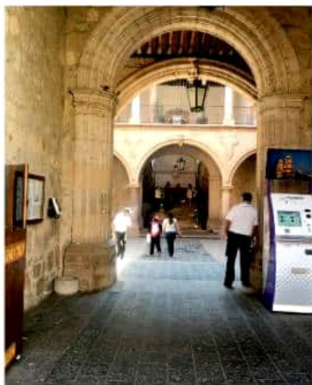
En tres meses han logrado avanzar en la admisión de 600 demandas.

El dictamen aprobado indica que pese a la omisión de algunos gobiernos, como Aguila, Coalcomán y Salvador Escalante, tienen plazo de 10 días para presentar documentación