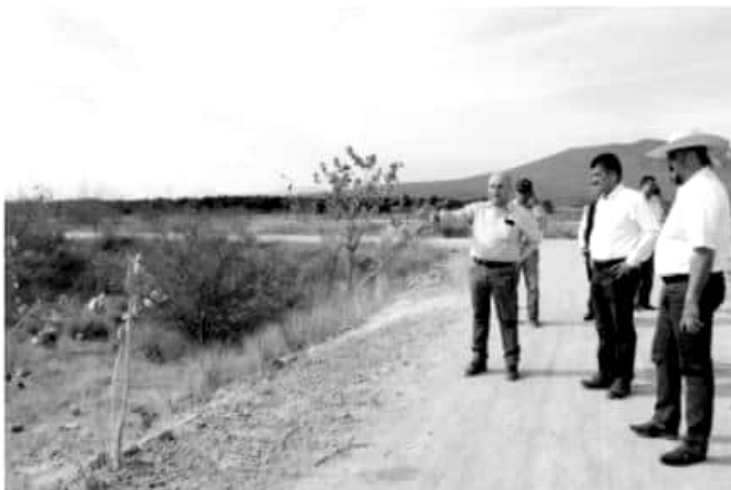
MORELIA, MICH.- Las Plantas de Tratamiento de Aguas Residuales (PTAR), y sistemas de agua potable que impulsa la administración del Gobernador Silvano Aureoles Conejo, en los municipios de Apatzingán, Buenavista Tomatlán y Parácuaro, presentan avances importantes en su construcción

Finalmente, para la zona conurbada de Úspero, municipio de Parácuaro, se construye la Planta de Tratamiento de Aguas Residuales con un presupuesto de 11 millones 816 mil pesos, con la cual se podrán sanear hasta 22.5 litros de agua por segundo y serán beneficiados más de 2 mil 500 habitantes de Tierra Caliente.