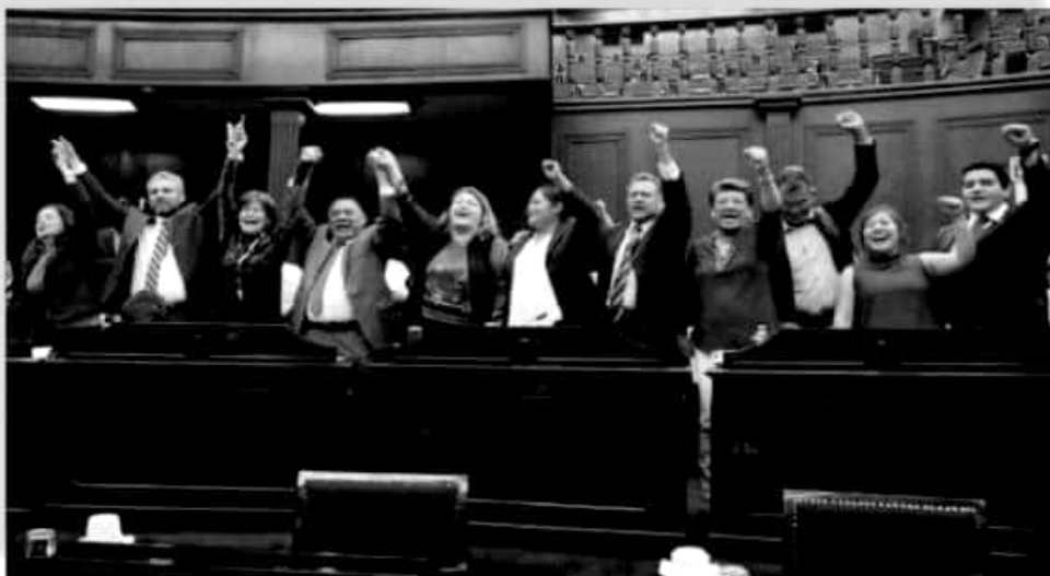
El GPMORENA, celebra jubilosamente la aprobación de la Reforma Educativa.