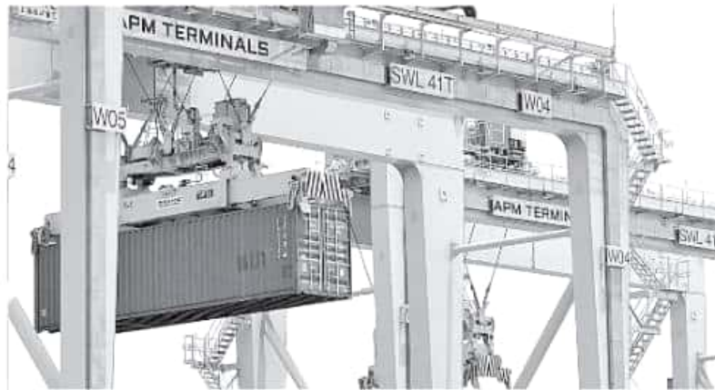
El gobierno federal intenta suspender la Zona Económica Especial.