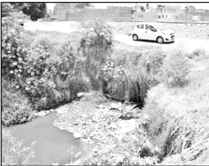
DRENES Y RÍOS TIENEN TONELADAS DE BOLSAS, BOTELLAS, LLANTAS Y HASTA JUGUETES QUE TENDRÁN QUE REMOVER.

PARTICIPANTES esperan en primera acción de limpieza