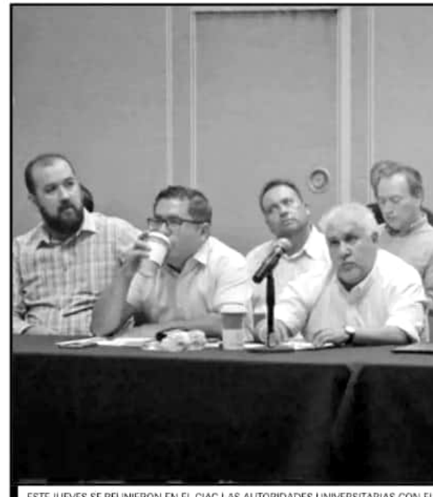
ESTE JUEVES SE REUNIERON EN EL CIAC LAS AUTORIDADES UNIVERSITARIAS CON EL

Expuso que era necesario ver punto por punto los acuerdos que firmó el rector y los acuerdos del Consejo Universitario en relación a este convenio, "donde del Consejo salva uno de estos puntos, le avienta