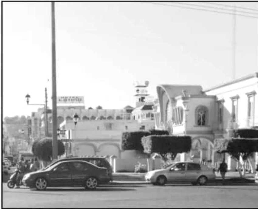
FOMENTAR EL USO DEL ETANOL ENTRE LOS CONDUCTORES AYUDARÍA AL CUIDADO DEL MEDIOAMBIENTE.

al 2010 lo recomendables es que el 30 por ciento del total del combustible usado sea etanol, la proporción puede incrementarse hasta el 50 por ciento en los modelos 2011-2018: "Hay vehículos especiales que su sistema les permite la utilización del 85 por ciento de etanol y el 15 por ciento de gasolina".