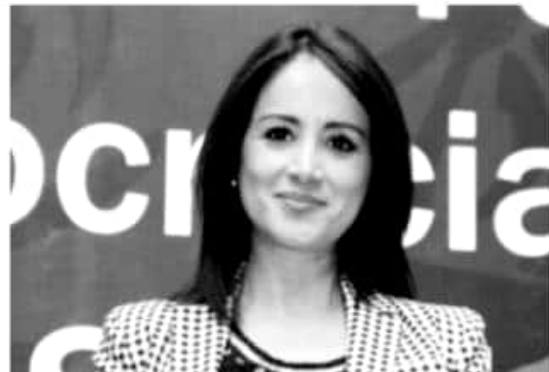
URUAPAN, MICH.- Un llamado a cerrar filas entre los ciudadanos y autoridades de los diversos niveles de gobierno en materia de protección ambiental y para fortalecer la cultura del reciclaje y separación de desechos.

Por lo anterior se pronunció por seguir cerrando filas para fortalecer la consciencia sobre que la crisis ambiental es un problema serio, que afecta a todos, por lo que se debe garantizar desde la Ley que todas las autoridades estén obligadas a establecer políticas de recolección sustentables e incluir a la sociedad en las acciones que