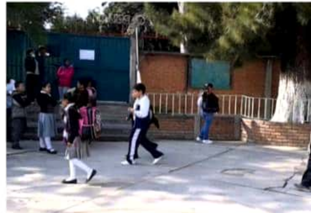
MORELIA, MICH.- Silvano Aureoles Conejo agradeció a los docentes michoacanos su compromiso con la formación de las próximas generaciones de mexicanos.

Finalmente, cabe indicar que como parte de sus acciones, hoy la CNTE protestará en los diversos ayuntamientos de Michoacán, donde pararán actividades durante la mañana y la tarde.