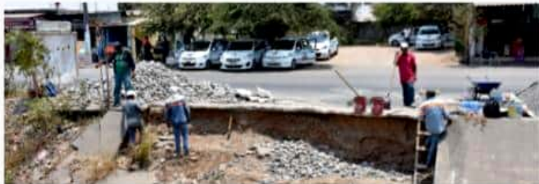
CD. LÁZARO CÁRDENAS, MICH.- La Secretaría de Obras Públicas y Desarrollo Municipal inició este jueves los trabajos de reparación de una sección del canal de la avenida Francisco Noyola.

Así también, añadió que estos trabajos forman parte de las acciones preventivas ante la próxima temporada de lluvias donde a la par, se llevará a cabo un desazolve de los canales pluviales.