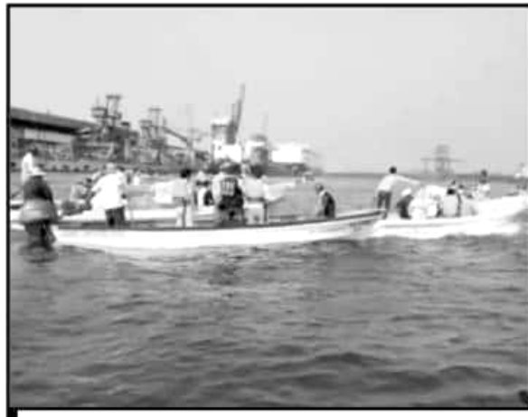
COOPERATIVAS PESQUERAS REALIZARON ESTE JUEVES UN RECORRIDO EN LA ZONA COMO PARTE DE LA DENUNCIA MEDIOAMBIENTAL QUE PRESENTARON.

En consecuencia, se advierte por los pescadores que tomarán acciones que permitan una redefinición de la actividad industrial en el Delta del Balsas y que garantice la producción y reproducción de las especies marinas que son su medio de vida de al menos 500