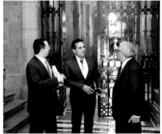
CIUDAD DE MÉXICO.- Esta tarde el Gobernador Silvano Aureoles Conejo se reunió con Carlos Manuel Urzúa Macías, titular de la Secretaría de Hacienda y Crédito Público (SHCP).

El Gobernador recordó que en los últimos tres años, la administración que encabeza ha multiplicado los esfuerzos para mejorar las finanzas públicas, refinanciar adeudos y reordenar el aparato burocrático, resultados que se han reflejado en una buena calificación crediticia y de manejo de los recursos por parte de empresas internacionales especializadas en el rubro.