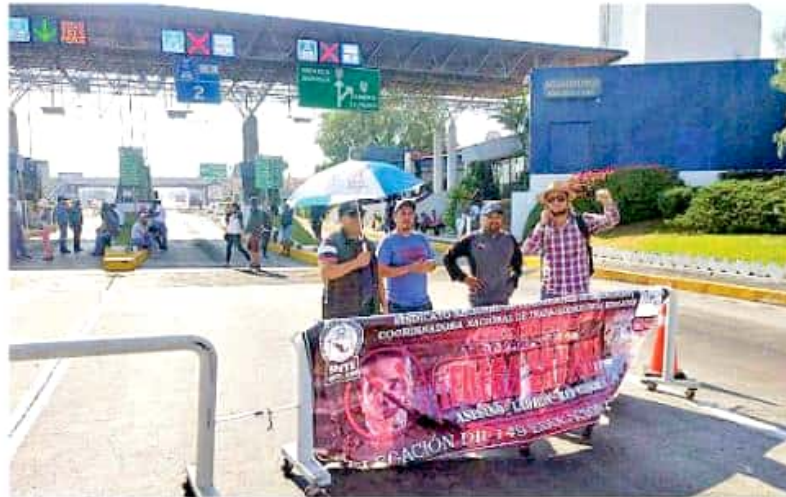
Agremiados de la Sección XVIII tomaron casetas de peaje; sustentan sus protestas en la exigencia de la abrogación total de la Reforma Educativa.