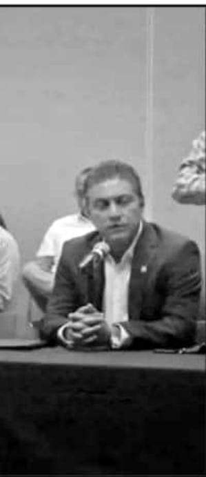
SINDICATO ÚNICO DE EMPLEADOS