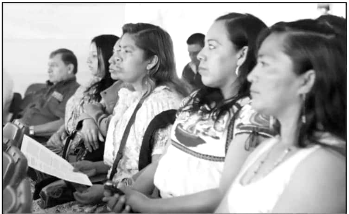
LA UNIVERSIDAD MICHOACANA DEBE TAMBIÉN TENER APERTURA Y SERVICIOS HACIA OTRAS LENGUAS ORIGINARIAS DE MICHOACÁN, ADÉMÁS DEL PURÉPECHA.

"Estas tres no han tenido mucha presencia nuestra universidad; lo que queremos es que a partir de este momento las diferentes dependencias que trabajamos con los pueblos indígenas, como el Centro Nicolaita de Estudios de los Pueblos Originarios y el Departamento de Idiomas, que ofrece clases de purépecha, también tengan interés por el análisis y el rescate y la conservación de