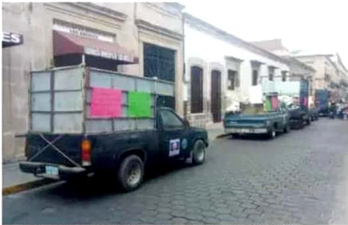
Recientemente se registraron conflictos entre los grupos recolectores de desechos en la ciudad.