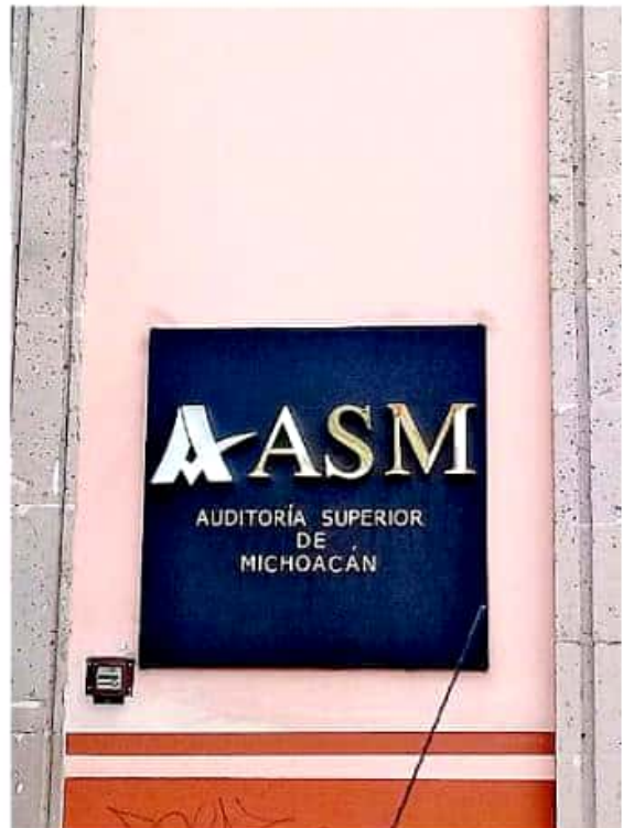
Se incluirá revisión de la gestión financiera del Ejercicio Fiscal 2018. LÁZARO MORALES

En tanto que para el municipio de Epitacio Huerta se efectuará una auditoría especial a los recursos aplicados en obras públicas, misma en la que deberá incluirse la revisión de la gestión financiera del ejercicio 2018, así como otro tipo de procedimiento correspondiente a los ejercicios 2016 y 2017 en atención a las denuncias que fueron presentadas por un supuesto presunto desvío.