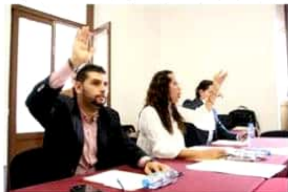
Integrantes del Comité Organizador del Séptimo Parlamento Juvenil Michoacán 2019.

Este parlamento que tiene la intención de vincular a los jóvenes con el Congreso del Estado, además de promover sus derechos sobre la libertad de expresión, información, participación y organización, aunado a que las propuestas que presenten se considerarán en la agenda que impulsa la LXXIV Legislatura Local en pro de Michoacán.