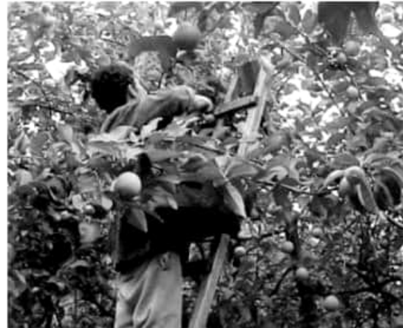
MORELIA, MICH.- Hay registrados 6 mil 731 huertos de limón; así como 5 mil 915 hectáreas de toronja, 126 hectáreas de naranja y 353 más cultivadas de lima.

xico más de 655 mil toneladas; el limón mexicano se exporta a 28 países del mundo.