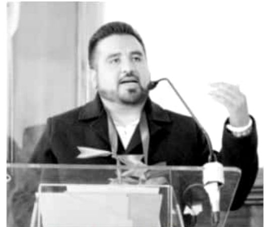
MORELIA, MICH.- Con la desaparición del Programa 3x1 en 2019, un total de 14 millones de mexicanos se verán afectados al no contar ya con recursos para desarrollar los proyectos que se venían apoyando

30 mil 290.5 millones de dólares ingresados al país en 2017 por este concepto. "En Michoacán en el primer semestre de este año las remesas ya representaban ingresos por mil 640.6 millones de pesos, lo que sin duda también será un cierre de 2018 a la alza con respecto al 2017 en que fue un total de tres mil 37.9 millones de dólares de remesas". Asimismo calificó como grave que en el proyecto de Presupuesto de Egresos de la Federación para el Ejercicio Fiscal 2019 correspondiente al Ramo General 23 Provisiones Salariales y Económicas, en el renglón de Otras Provisiones Económicas, no se prevea una asignación de recursos para el Fondo de Apoyo a Migrantes, cuando en el presente año se ejercieron alrededor de trescientos millones de pesos, gracias al cual miles de connacionales resultaron beneficiados con proyectos productivos.