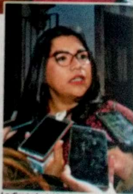
La diputada del PT comentó que al interior de la junta se siguen manifestando irregularidades.

EL PRESIDENTE de la Junta y coordinador del grupo parlamentario de Morena, Alfredo Ramírez Bedolla, "ha coincidido en que es conveniente quitarle la vigencia al acuerdo que en su momento todos los integrantes de la junta, excepto el PT, autorizaron".