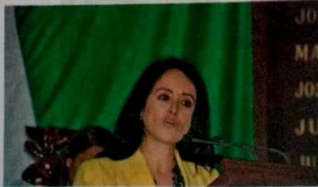
El Programa de Estancias infantiles para Apoyar a Madres Trabajadoras sufrió una reducción de 49.8%, afectando a muchas madres.