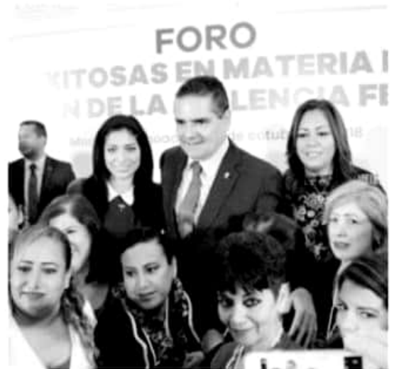
MORELIA, MICH.- La propuesta de Presupuesto Federal de Egresos 2019, presentada por el Gobierno de México, resulta desfavorable para el fortalecimiento a los programas que atienden la igualdad

En sólo esta administración, se han atendido más de 40 mil mujeres en los 30 Centros para el Desarrollo de las Mujeres (CDM). Además, Michoacán es el estado del país con el mayor número de estos centros; Se han logrado fortalecer las Instancias Municipales de la Mujer en los 113 municipios, dotándoles de material, equipamiento y capacitación; Con estos programas se generan 200 empleos directos a profesionistas certificados para atender a mujeres en situación de violencia, instalados en los CDM y Centros de Atención Fijos; Se generaron acciones de cumplimiento a indicadores de la AVGM, a través de diversas acciones de prevención, capacitación y empoderamiento, a favor de las mujeres y niñas michoacanas. También se realizaron acciones de prevención de la violencia en el noviazgo, el embarazo adolescente y de cultura de la igualdad para más de 5 mil jóvenes de todo el Estado.