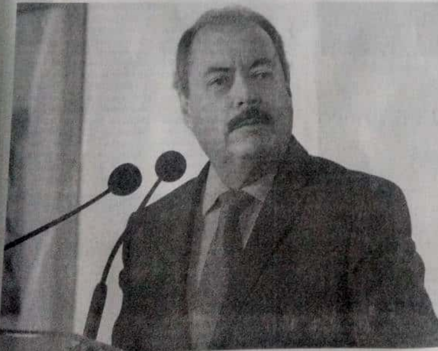
Victor Manuel Silva Tejeda anunció que su partido será una oposición que salvaguardará los intereses de todos los mexicanos.

Con información de Angelina Arredondo Elizalde