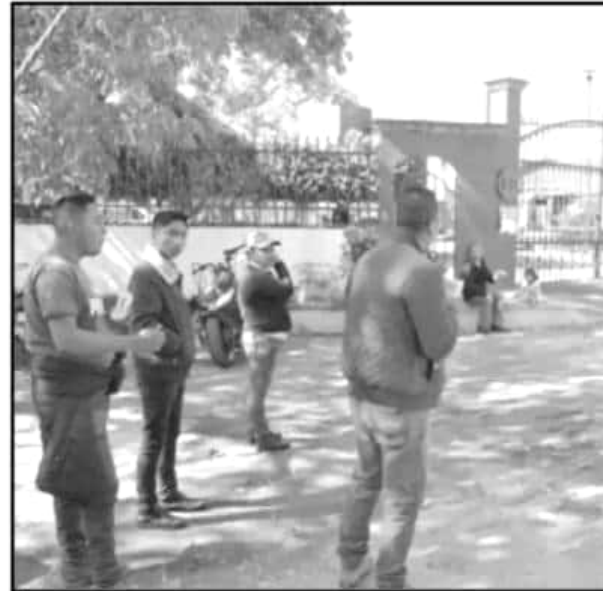
HABITANTES DE NAHUATZEN TOMARON LAS OFICINAS DEL IEM. A MANERA DE PROTESTA.

procedimientos a seguir. Ya no tenemos miedo a las represalias porque ya nos han hecho de todo", afirmó la comunera.