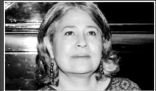
DIPUTADA POR MORENA EN EL DISTRITO XVI URUAPAN NORTE, SU PERFIL ACADÉMICO SÓLO MUESTRA QUE TIENE DIVERSOS CURSOS Y DIPLOMADOS.

regidor de Morelia y jefe de tenencia en Atapaneo. Llegó bajo las siglas del Partido del Trabajo a la curul que representa el Distrito XVI de Morelia. Es presidente de la Comisión de Comunicaciones y Transportes e integra las de Desarrollo Rural y Salud y Asistencia.