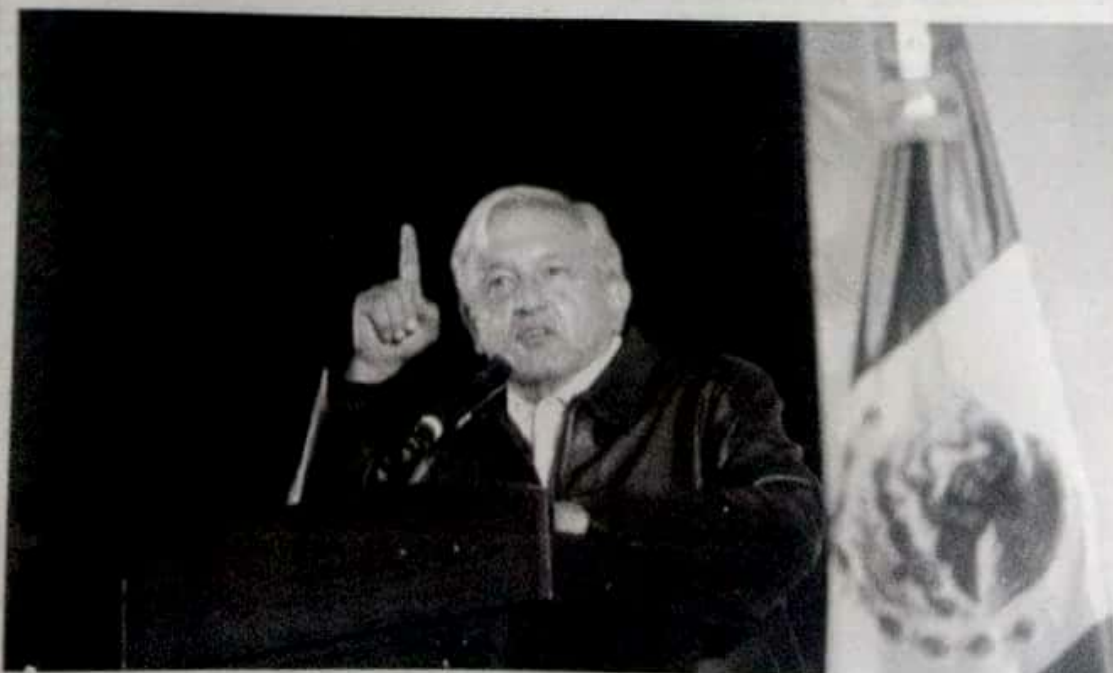
El presidente Andrés Manuel López Obrador anunció que se corregirá el error y se entregará a las universidades el presupuesto que les corresponde, y sostuvo que cuando se cometa una equivocación su gobierno va a rectificar.