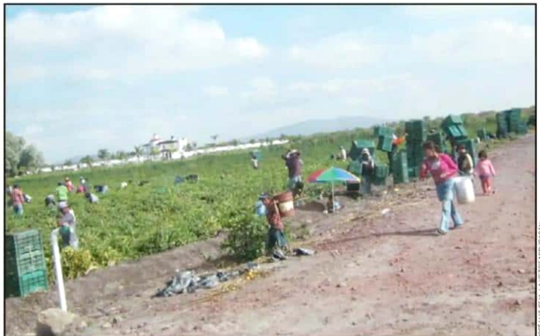
A PESAR DE LAS BAJAS TEMPERATURAS EN LA REGIÓN, LOS CAMPOS AGRÍCOLAS NO SE HAN VISTO TAN AFECTADOS; CONTINÚA LA VIGILANCIA.

6mil TONELADAS de jitomate produce Jiquilpan