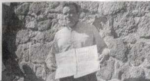
El presidente del Comité de Participación Ciudadana del SEA destacó que la Contraloría debe hacer lo conducente y, en dado caso, que inicie los procesos resarcitorios.

En las observaciones al Seguro Popular en el periodo mencionado destaca que los recursos federales destinados se transfirieron a otros