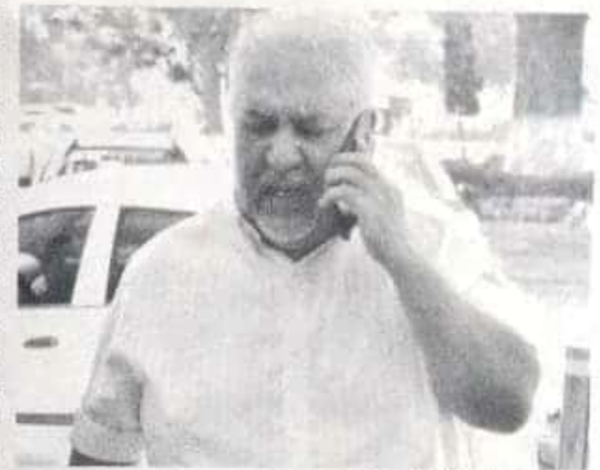
CAMBIÓ | NÉCTOR ZONATIUM