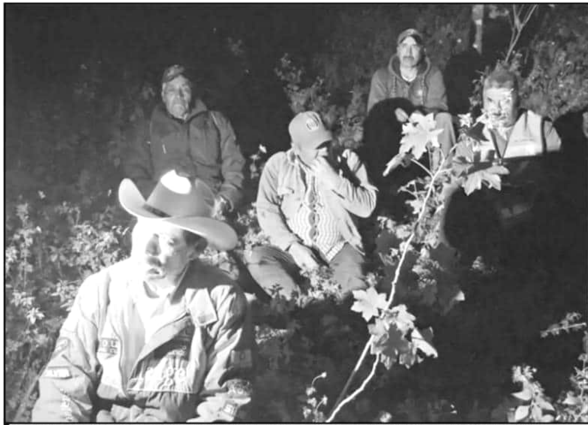
EN LA NOCHE. CON TEMPERATURAS BAJO CERO Y SIN PODER PRENDER FOGATAS, LOS EJIDATARIOS REALIZAN BRIGADAS PARA ALEJAR A LOS TALAMONTES.

La oscuridad, la niebla, la formación de hielo en el pasto, la maleza y el sonido cercano de los coyotes y otros depredadores que habitan en el Oriente michoacano no los asustan ni les impiden cum-