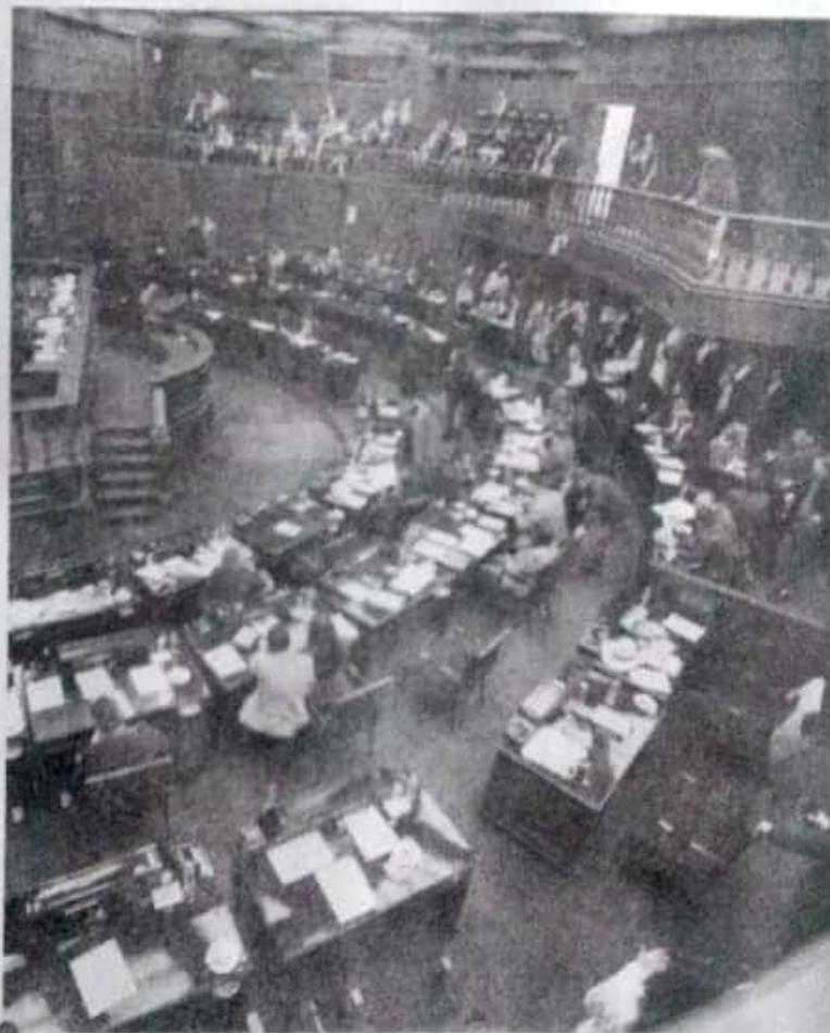
ESE TELON