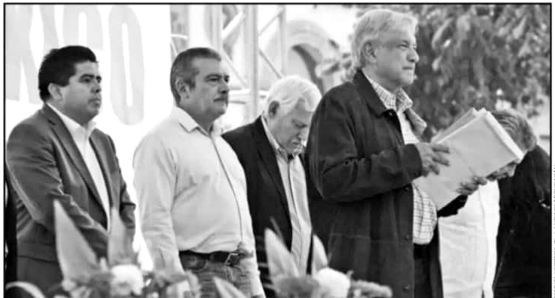
EL AHORA PRESIDENTE, ANDRÉS MANUEL LÓPEZ OBRADOR, HIZO VARIOS COMPROMISOS DURANTE SU CIERRE DE CAMPAÑA EN LA CAPITAL DEL ESTADO.

destinarán mediante participaciones federales