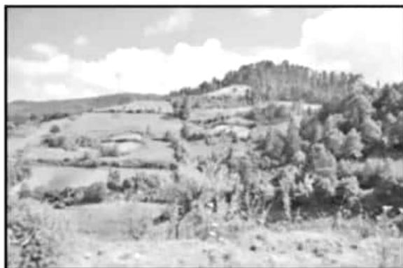
NÓ SÓLO CUIDAN SUS BOSQUES. INTENTAN RECUPERAR ANTIGUAS HECTÁREAS DE CULTIVOS Y MANTENER AL MISMO TIEMPO COSECHAS SUSTENTABLES.

tomamos acuerdos para organizarlos a cuidar los bosques y diario nos toca a unos, luego a otros y nos vamos turnando. Para nosotros es mejor cuidarlo porque nos da agua y aire, gracias a esto hemos reforestado parcelas que antes eran de cultivos de maíz porque vivimos en el ejido de El Rosario. Ejidatarios que no pueden venir mandan a un nieto o a un hijo, hay mucho interés por parte de todas las familias 77 .