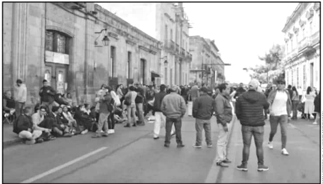
LOS TRABAJADORES DE LA UNIVERSIDAD MICHOACANA BLOQUEARON MEDIO DÍA LA CALLE FRENTE AL COLEGIO PRIMITIVO DE SAN NICOLÁS DE HIDALGO.

Aseveró que requieren saber desde un aspecto técnico administrativo el origen de la crisis, pero aclaró que cualquier ley no