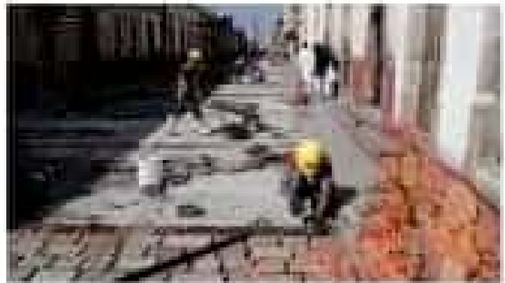
Trabajadores en la construcción de una carretera.

El alcalde de Morón aseguró que el Presidente de México conoce la situación en que están algunas ciudades.