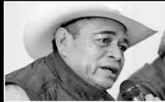
DIPUTADO POR EL PARTIDO DEL TRABAJO, DISTRITO XVI MORELIA; RECIENTEMENTE TERMINÓ COLEGIO DE BACHILLERES, PERO ENCABEZA VARIAS COMISIONES.