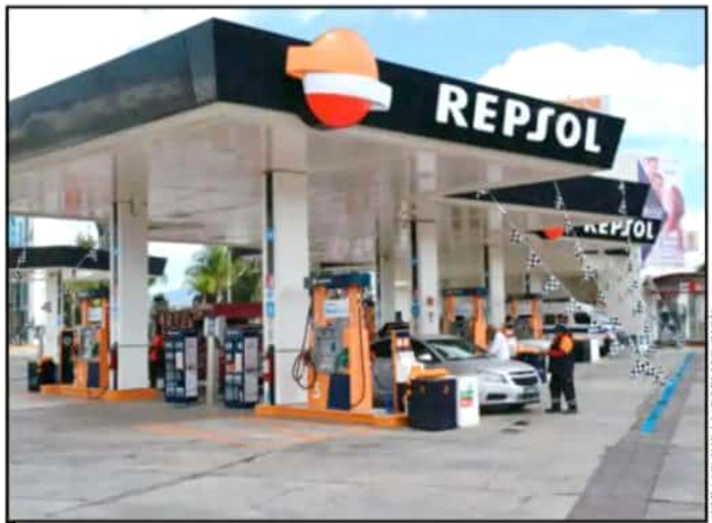
ACTUALMENTE MUCHAS ESTACIONES DE GASOLINA HAN CAMBIADO DE PROVEEDOR Y YA NO SE LLAMAN PEMEX.

Respecto al precio del combustible para el año entrante, aunque no bajara como muchos pensaron, el aumento será menor puesto que el presidente Andrés Ma-