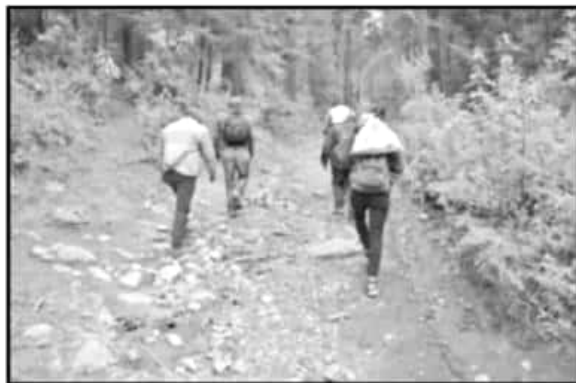
DESDE LAS 4:00 DE LA TARDE PARTEN HACIA LO MÁS RECÓNDITO DE LOS BOSQUES. LA VOZ DE MICHOACÁN LOS ACOMPAÑÓ EN UNO DE ESOS RECORRIDOS.