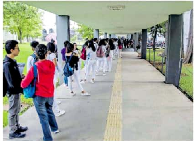
La Casa de Hidalgo recibió a casi 50 mil estudiantes

A través de un video de bienvenida, el titular del Tec, Gil Vázquez, resaltó que durante las vacaciones de verano se realizaron mejoras a las instalaciones de los dos campus del Tecnológico en esta ciudad y abonar a la preparación de los jóvenes para que "el día de mañana participen de manera activa en la transformación del país y el mundo entero. Prepárense para que sean ponys".