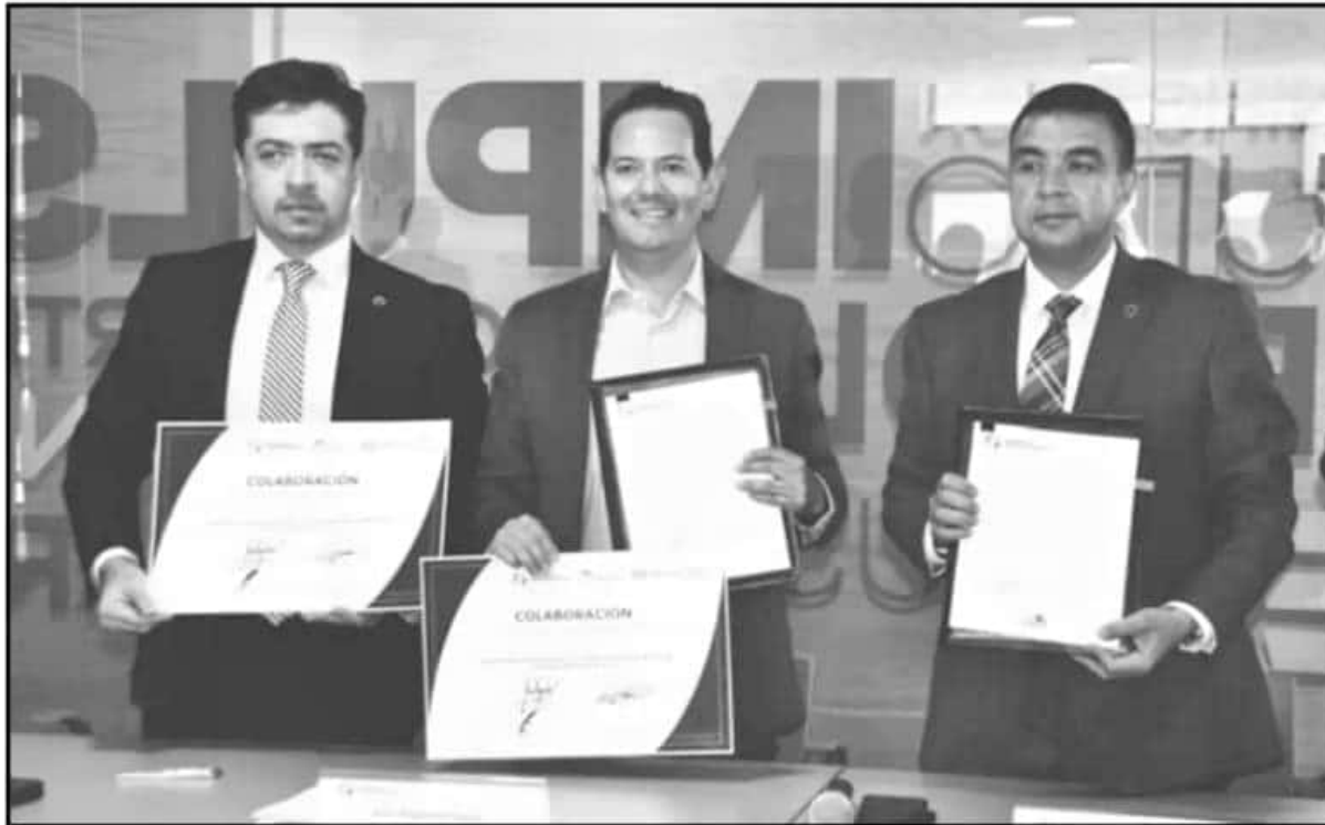
LA FIRMA DEL ACUERDO ENTRE SEDECO Y SMATTCOM ABRE MÚLTIPLES OPORTUNIDADES A LOS PRODUCTORES MICHOACANOS ALREDEDOR DEL MUNDO.