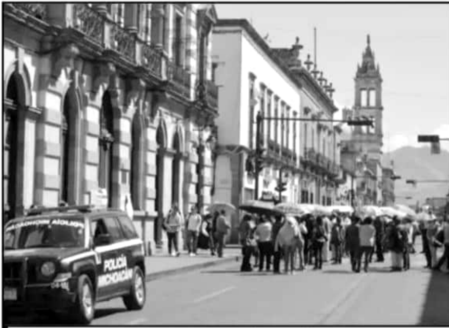
MAESTROS SE HAN MANIFESTADO POR LA FALTA DE PAGO; PREVEN QUE ESTE DÍA INICIE LA ENTREGA DE RECURSOS.

El mandatario estatal subrayó que el proceso de federalización de la nómina es complejo y que por ello trabajan con las secretarías de Educación y Hacienda para completar el diagnóstico en torno a la nómina magisterial, “el mismo presidente de la República ha señalado que no quiere ni “aviadores” ni sema-