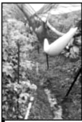
LAS MALLAS PROTEGIERON UN POCO LOS CULTIVOS DE BERRIES.

levantarán el bloqueo y se reactivará el trabajo en las distintas oficinas, con el compromiso de que el gobierno municipal atenderá a todos los grupos de ciudadanos para ser puente con otras instancias, pero a través del diálogo.