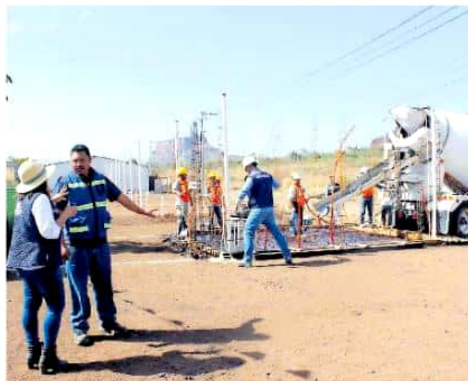
Un 70%, de las 11 mil empresas organizadas y dedicadas al sector de la construcción, se encuentran paralizadas por falta de recursos

En su encuentro con medios de comunicación, el empresario constructor reconoció que a la fecha el Ayuntamiento de Morelia ha sido el único municipio que ha contratado los servicios de sus afiliados, teniendo en curso un 20% de las cerca de 100 obras municipales ejecutadas en la actualidad, ello, gracias a que la actual administración de Raúl Morón ha sido la única en lograr una gestión histórica a los mil 270 millones, misma que ni siquiera el gobierno de Silvano Aureoles cuenta, pues