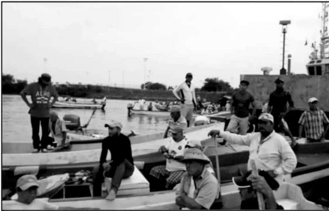
A BORDO DE SUS LANCHAS, LOS PESCADORES SE INTERNARON HASTA EL RECINTO PORTUARIO PARA EXIGIR ATENCIÓN FEDERAL A SUS DEMANDAS.

Actualmente, este campamento tortuguero cuenta con 50 personas encargadas de su operación en distintas labores durante toda la temporada de desove de las tortugas.