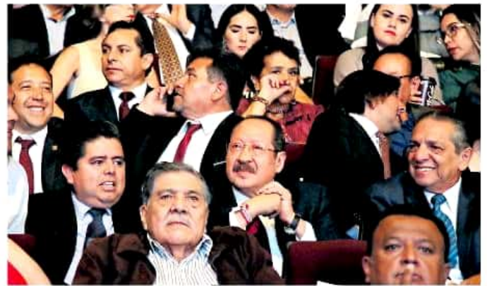
Godoy Rangel se deslindó de cualquier responsabilidad al respecto./FERNANDO MALDONADO

En contraataque, el hoy gobernador perredista aseguró casi no hablar de los exgobernadores y menos de Godoy “¿para