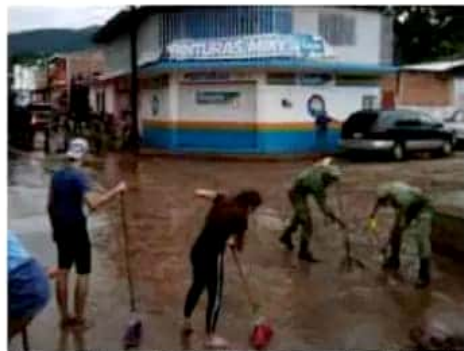
Militares y ciudadanos mantienen los trabajos de limpieza de las calles.

Al menos una decena de viviendas resultaron dañadas luego de que el Río Chiquito de Coalcomán se desbordara debido a las intensas lluvias registradas durante los últimos días en ese municipio.