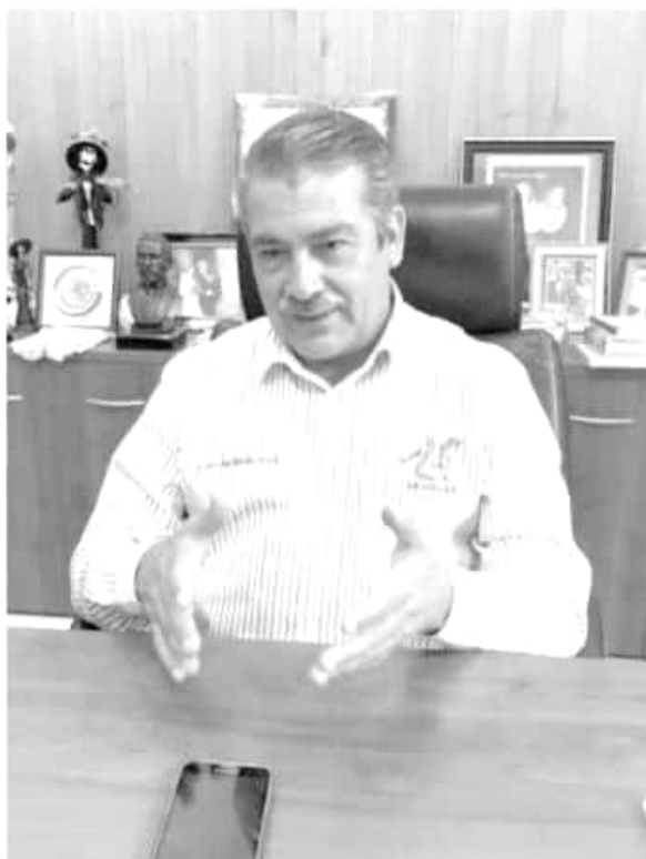
ESPECIAL Raúl Morón Orozco, presidente municipal de Morelia, en exclusiva para Cambio de Michoacán .

«La cuarta transformación significa transformar la manera en que nos relacionamos unos con otros