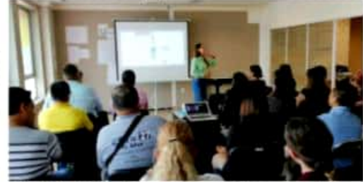
URUAPAN, MICH.- En la mesa participaron catedráticos, docentes públicos y privados, activistas sociales, integrantes de asociaciones sociales y público en general.

En dicha mesa participaron catedráticos, docentes públicos y privados, activistas sociales, integrantes de asociaciones sociales y público en general interesado en esta temática.