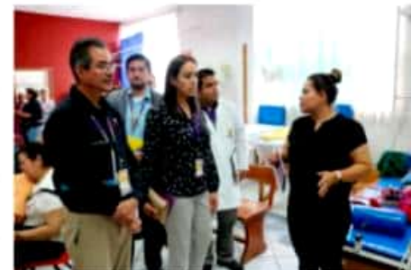
ZAMORA, MICH.- Personal del DIF municipal alista una próxima jornada de salud para personas disca-

Recalcó que las jornadas se desarrollarán de manera gratuita en un horario de 09:00 a 14:00 horas en las instalaciones del Sistema DIF Municipal, ubicadas en la Calle Obrero 746, Colonia Las Fuentes, para más información, llamar al número 512 01 23.