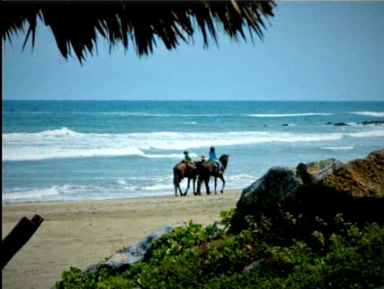
TRONCONES, GRO.- Ha sido muy poca la gente que en esta temporada ha visitado este paradisíaco lugar de playa.

En este destino se cuenta con 22 restaurantes y 90 hospederías, entre casas de huéspedes, villas y hoteles, en general hay un promedio de 850 habitaciones en promedio, así como tiendas de ropa de playa, spas, artesanías y tiendas de abarrotes.