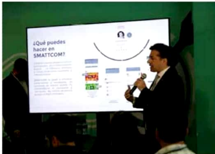
La plataforma es gratuita y facilitará la vinculación entre productores, distribuidores y consumidores.

Añadió que Michoacán decidió incorporarse a la iniciativa internacional porque, según los últimos datos del Instituto Nacional de Estadística y Geografía