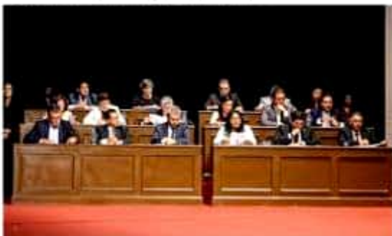
Resalta Grupo Parlamentario de Morena importancia de mantener vigentes lineamientos ideológicos de Ignacio López Rayón para el fortalecimiento democrático del estado.