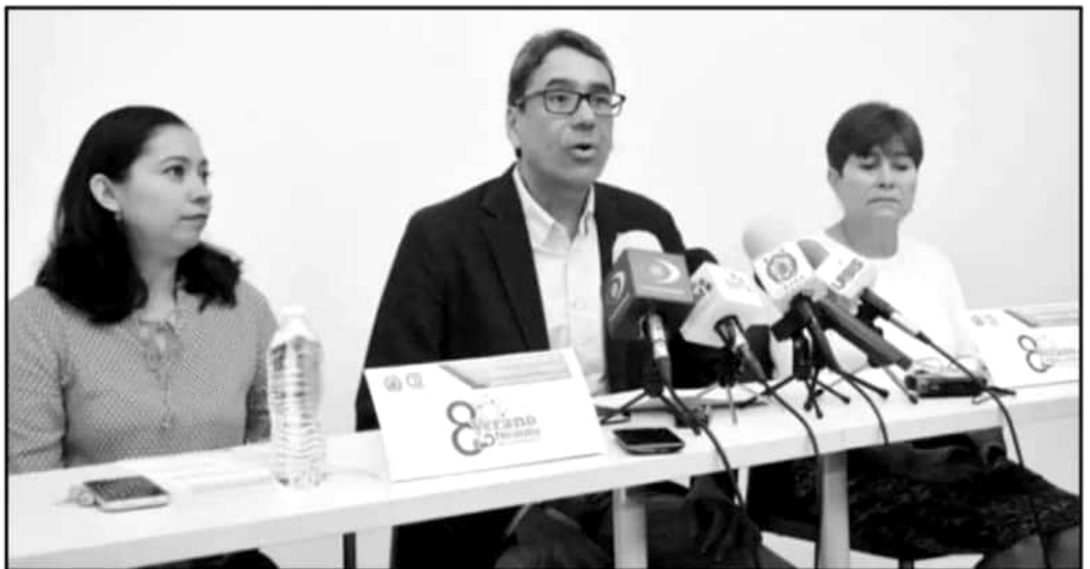
ORGANIZADORES DEL VERANO DE INVESTIGACIÓN SE DUERON SATISFECHOS CON LA RESPUESTA QUE HA HABIDO DE LOS JÓVENES AÑO CON AÑO.

JÓVENES participaron en la primera edición del programa