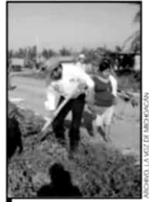
PERSONAL DEL ZOOLOGICO HIZO REFORESTACIÓN Y LIMPIEZA.

Al cierre de esta edición se conoció de una eventual reunión mediadora entre las partes, donde harían presencia autoridades federales, e incluso se dijo se esperaría una representación del gobierno del estado.