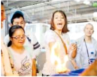
Este año, 324 alumnos se integraron al programa de ciencia