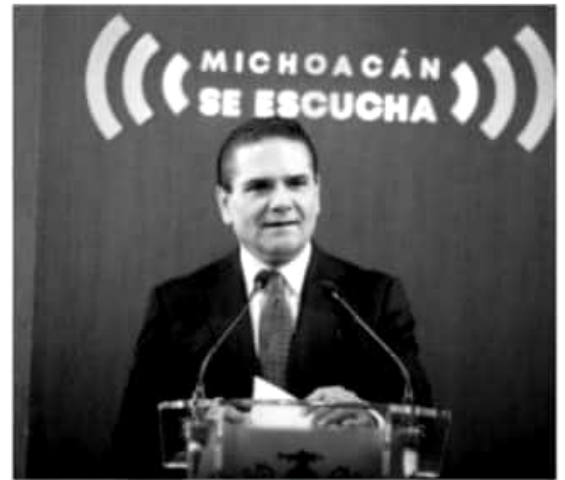
MORELIA, MICH.- Tras una política prioritaria en defensa de los derechos de las mujeres, por primera vez en Michoacán, este sector de la población cuenta con una estructura institucional sólida para garantizar a las michoacanas el acceso a una vida digna, aseguró el Gobernador del Estado, Silvano Aureoles Conejo.

Para dar continuidad a las acciones de combate a la violencia, Michoacán será sede del Foro "Mujeres trabajando juntas por la transformación de México", en el que el Gobierno del Estado participará en la consulta ciudadana de diseño del Plan Nacional para la Igualdad entre Mujeres y Hombres, PROIGUALDAD 2019-2024, para aportar las prácticas en política de igualdad de género implementadas durante los últimos 4 años, con las que se ha logrado hacer frente a la violencia y empoderar económicamente a las mujeres.