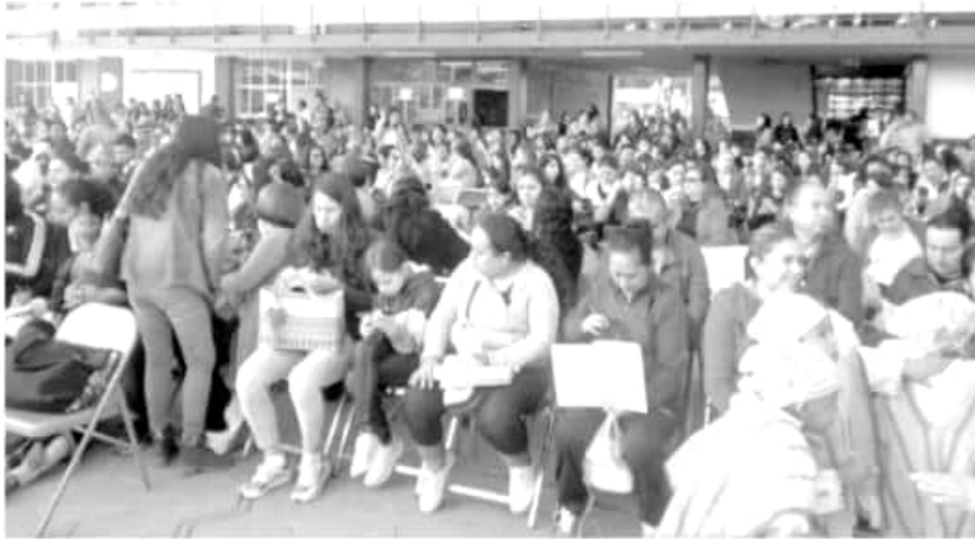
Inicio ayer lunes, en las instalaciones de la Secundaria Técnica número 4, de esta ciudad.