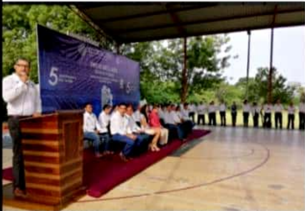
APATZINGÁN, MICH.- Sin contratiempos inició el nuevo ciclo escolar 2019-2020, en el ITSA.

Cabe destacar que fueron 444 jóvenes los que obtuvieron su ficha para presentar el examen de admisión en el Tec y la meta de la matrícula para el presente ciclo escolar es de 2 mil 200 estudiantes.