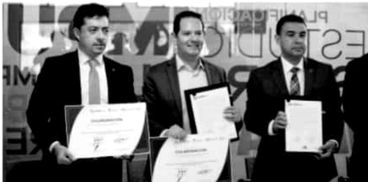
MORELIA, MICH.- La Secretaría de Desarrollo Económico (Sedeco) y la empresa Smattcom signaron convenio de colaboración para la operación de una plataforma digital, que permite la compra y venta de productos del campo.