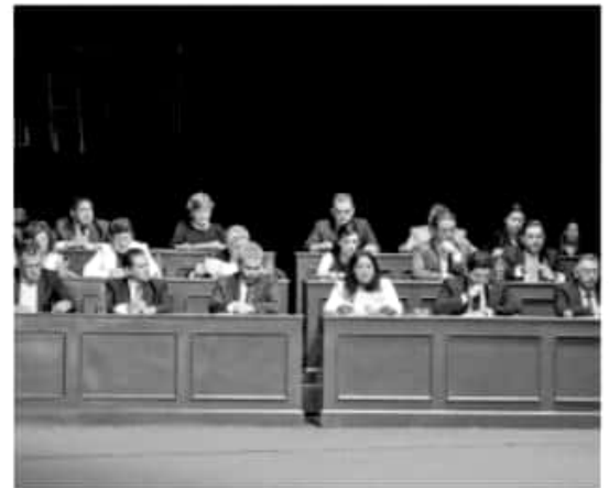
ZITÁCUARO, MICH.- El Grupo Parlamentario de Morena mantendrá un firme compromiso con el blindaje y fortalecimiento democrático de Michoacán, en apego a los lineamientos ideológicos con que Ignacio López Rayón promovió la instalación de la Suprema Junta Nacional Americana.

Bajo estos argumentos, las y los diputados de Morena en el Congreso de Michoacán reiteraron su compromiso con el fortalecimiento institucional de la entidad, por considerar que solo así se podrá reivindicar la realidad que, al paso de las últimas dos décadas, ha acompañado a las y los michoacanos.