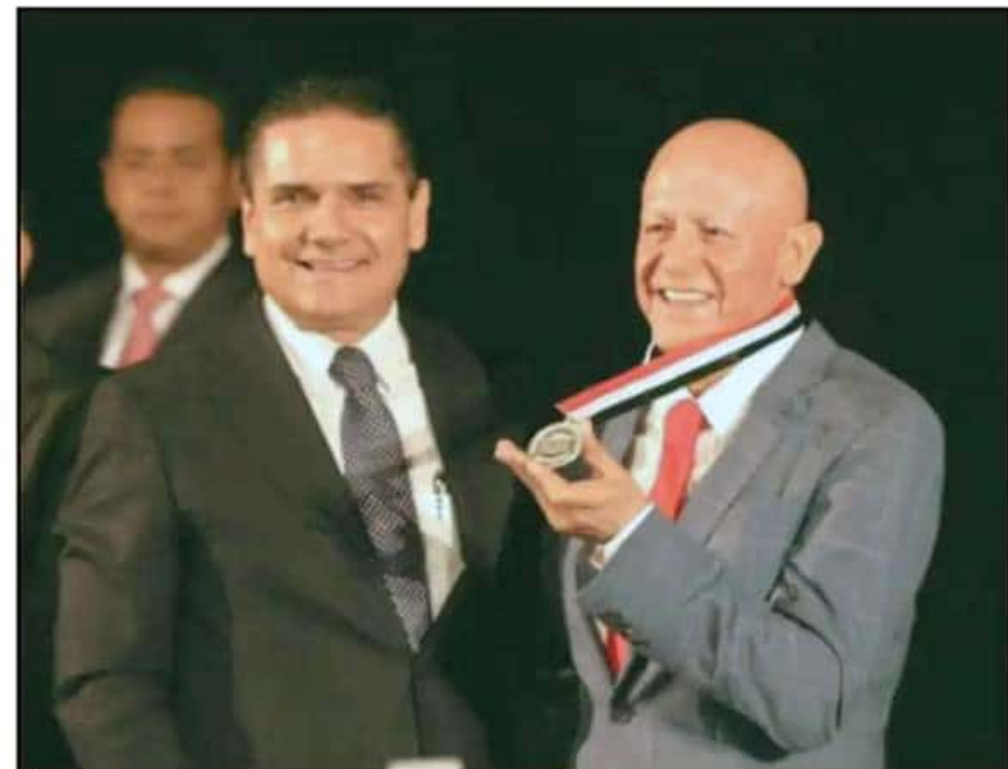
EL GOBERNADOR SILVANO AUREOLES FELICITÓ A SU EXSECRETARIO DE GOBIERNO, PASCUAL SIGALA PÁEZ, POR SU CARRERA.