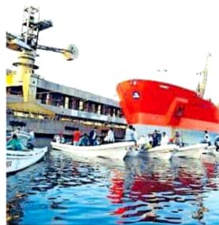
La toma se dio en la dársena, donde impiden entrada y salida de buques

"Es un mal entendido, yo ya cumplí, les acerque a las autoridades ambientales, yo no puedo resolverles el problema", señaló el titular de la Aplia,