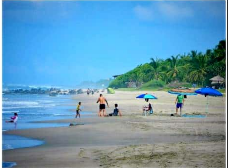
TRONCONES, GRO.- En este periodo de verano el turismo se ha visto disminuido en la playa Troncones.