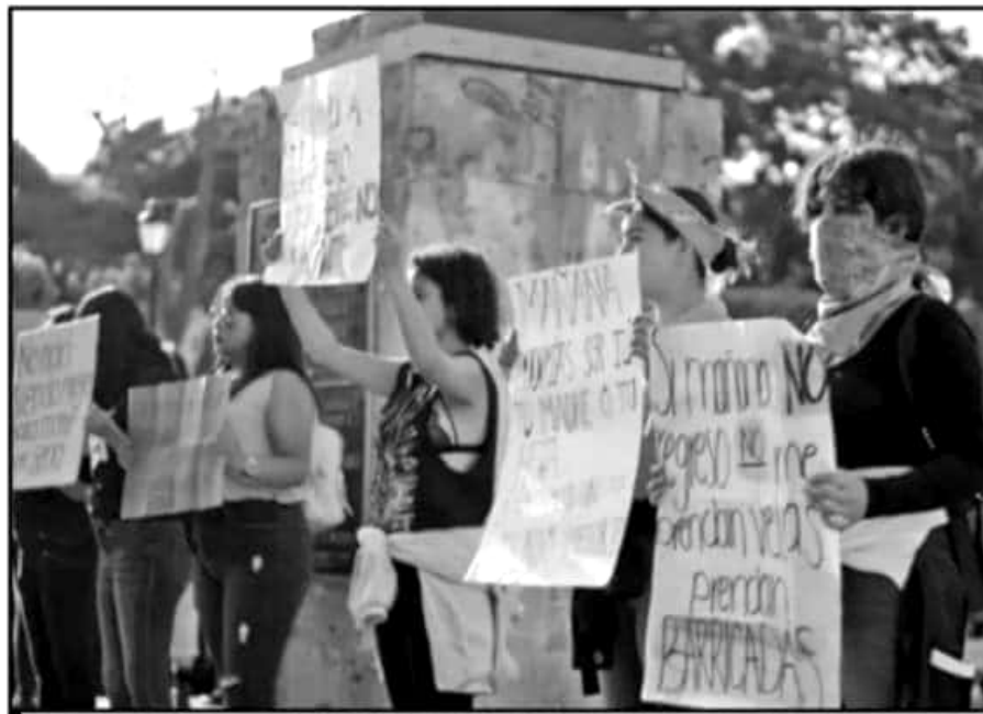
CADA VEZ SON MÁS CONSTANTES, Y RADICALES. LAS PROTESTAS PARA EXIGIR UN ALTO A LA VIOLENCIA HACIA LAS MUJERES.

Entre las medidas destacan la creación de una fiscalía de atención a los delitos contra las mujeres, la