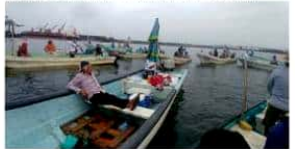
El sector pesquero de Lázaro Cárdenas lleva casi 30 años demandando indemnizaciones y freno a la contaminación que aseguran provocan las empresas que hay en el Recinto Portuario.