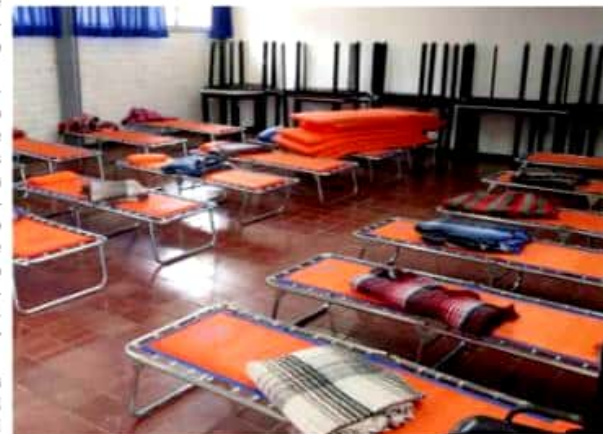
ZAMORA, MICH.- La unidad municipal de PC permanece en alerta ante posibles contingencias por lluvias, para ello se tiene diseñado el plan de emergencia que contempla la activación inmediata de albergues.

Este espacio fue revisado por personal del Gobierno del Estado, el cual debe ser un lugar digno para que las familias puedan permanecer ahí, que se tenga todo lo necesario, espacios salubres, que las personas puedan estar en dado momento atendida y no sufran algún otro tipo de contingencia hasta que pueda retornar a sus hogares.