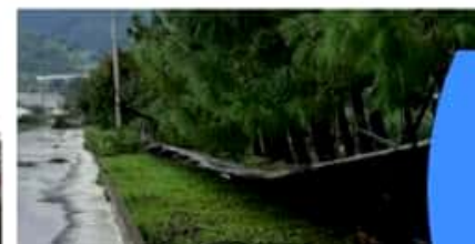
LOS REYES, MICH.- Estragos causó la tromba en esta región. Granizos de enorme tamaño dañan cultivos y propiedades.