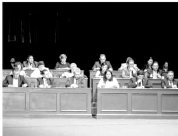
Asisten diputadas y diputados de Morena a CCVIII Aniversario de la Instalación de la Suprema Junta Nacional Americana.

Congreso de Michoacán celebró este lunes en el municipio de Zitácuaro, el legislador morenista reconoció que, «... hoy el país retoma la convicción de actores históricos como Ignacio López