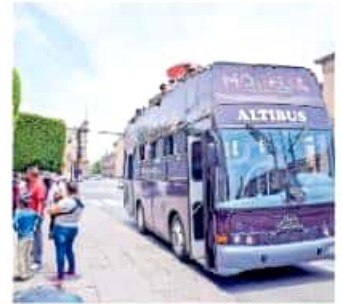
Se asegura que ha sido el año con mejor captación