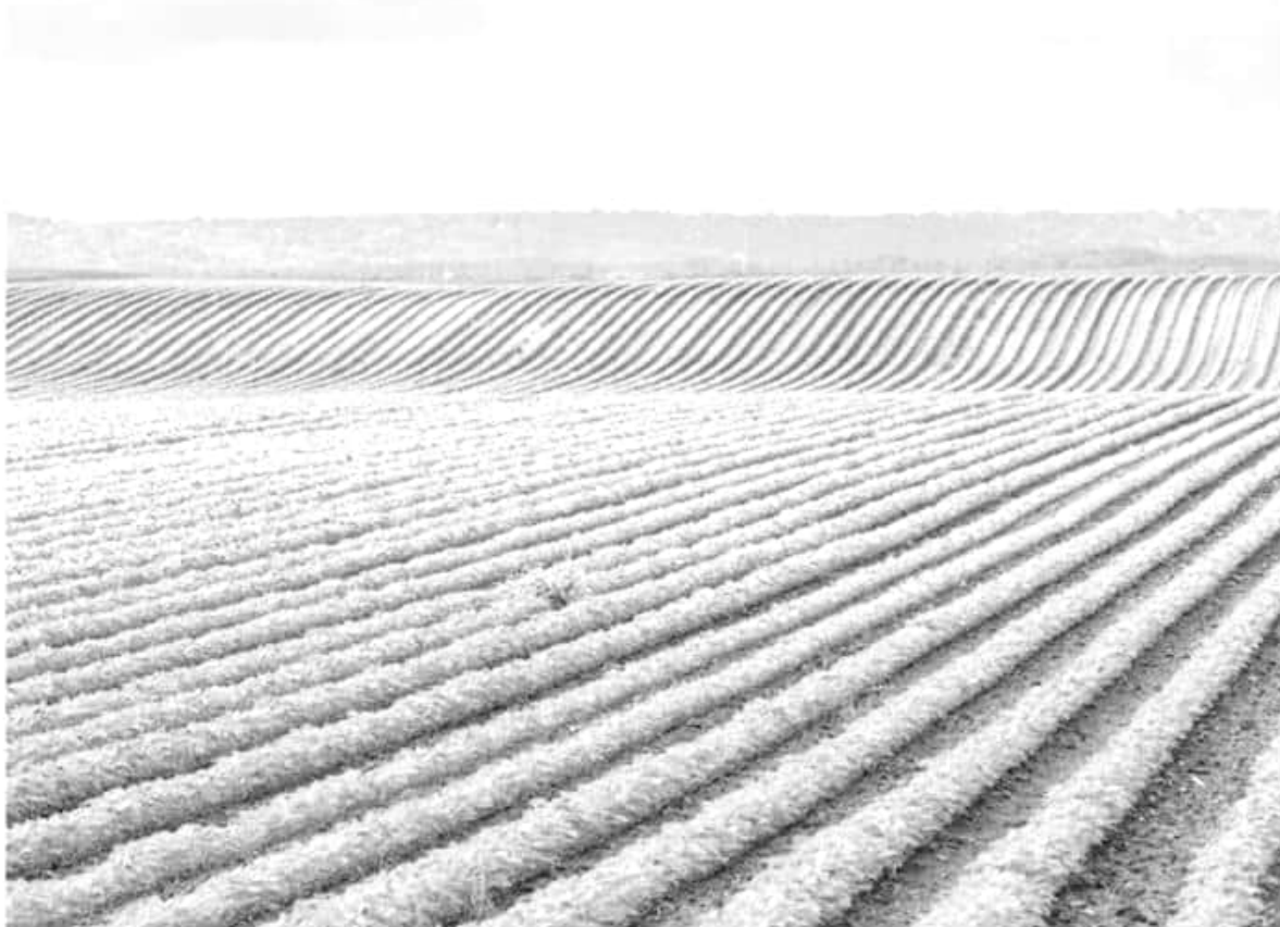
SMATTCOM será una aliada estrategia que abrirá nuevos mercados y oportunidades de desarrollo para quienes buscan comercializar sus cosechas en México y el mundo.