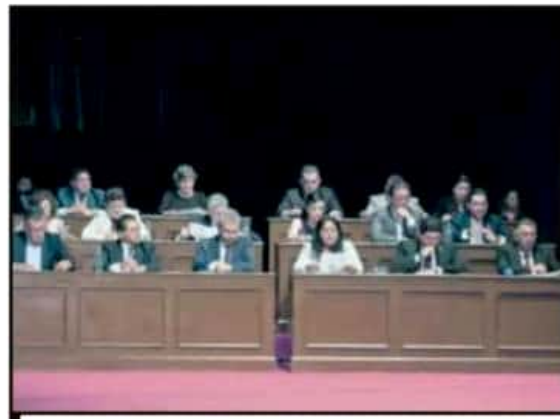
DIPUTADOS ASISTIERON A LA TRADICIONAL CEREMONIA EN ZITÁCUARO.

El diputado del tricolor recordó que en la lejana Saltillo el cura Hidalgo le dio el mando de la insurgencia a López Rayón, aunque en realidad en ese momento Ignacio Allende era quien ya tenía el rango de generalísimo,