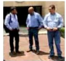
También se acordó que se construirán 148 pies de casa.

el próximo inicio de la edificación de 148 pies de casa a través de un proceso de construcción asistida en zonas de atención prioritaria; con una inversión de 25 millones de pesos de procedencia federal, se brindará asesoría, apoyo técnico y recursos económicos durante el proceso de construcción, por lo que el beneficiario cubriría únicamente el costo de la mano de obra. MIMORELIA