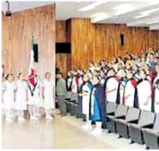
Destacaron el trabajo de 30 pasantes