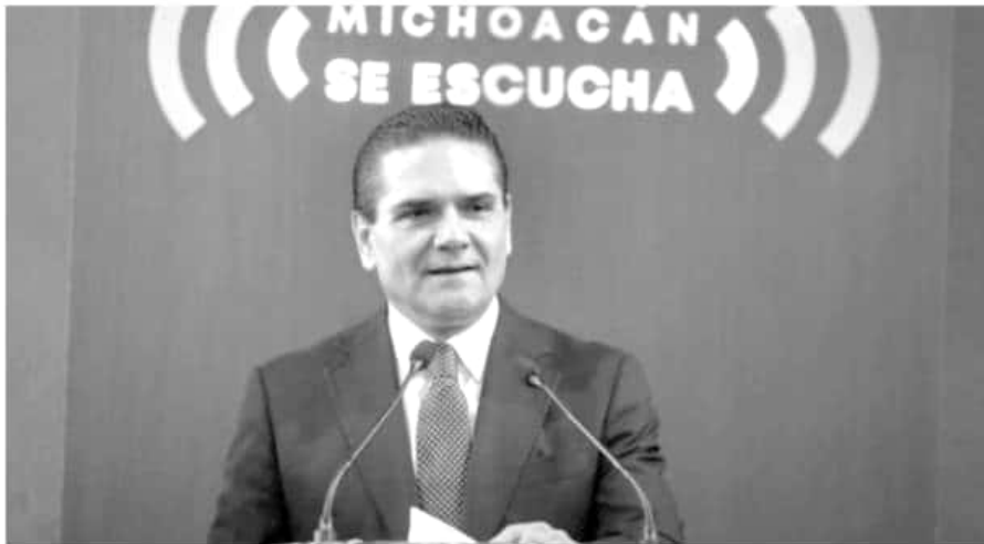
El gobernador Silvano Aureoles Conejo dijo que al estado le corresponderá aportar solo 90 millones de pesos para el pago de salario a los 32 mil maestros.

«Lo aprovechan para el golpeo y empiezan a sacar unos cartelones donde me dicen hartas cosas... me mientan de todo y raro y lamentablemente muchos