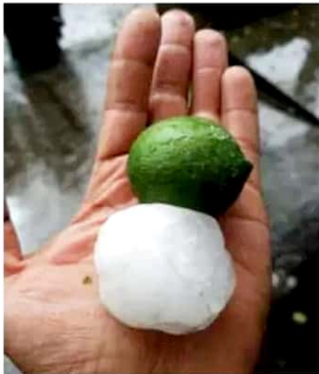
FACEBOOK | RED 113

señalaron autoridades en un comunicado de prensa.