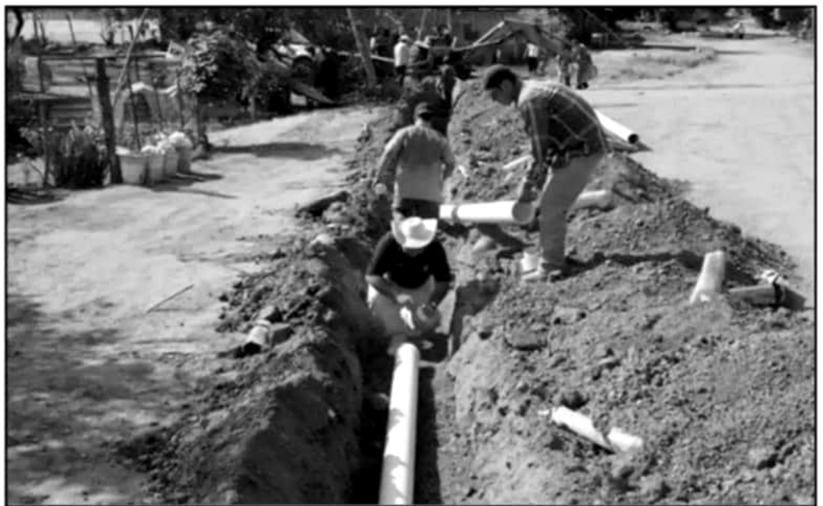
ALGUNOS DE LOS PROGRAMAS QUE SE HAN VISTO AFECTADOS SON LOS DE AGUA POTABLE Y SANEAMIENTO, A CAUSA DEL SUBEJERCICIO DE RECURSOS.

dido resolver para la gestión federalizada de recursos públicos.