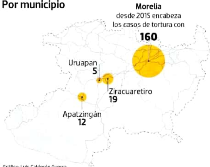
Gráfico: Luis Calderón Guerra