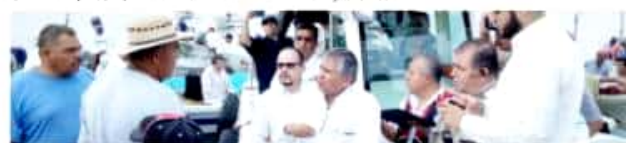
CD. LÁZARO CÁRDENAS, MICH.- Con el fin de exigir freno a la contaminación del mar, pescadores riberseños de Lázaro Cárdenas realizaron una manifestación y bloqueo a los remolcadores, al interior del recinto portuario.