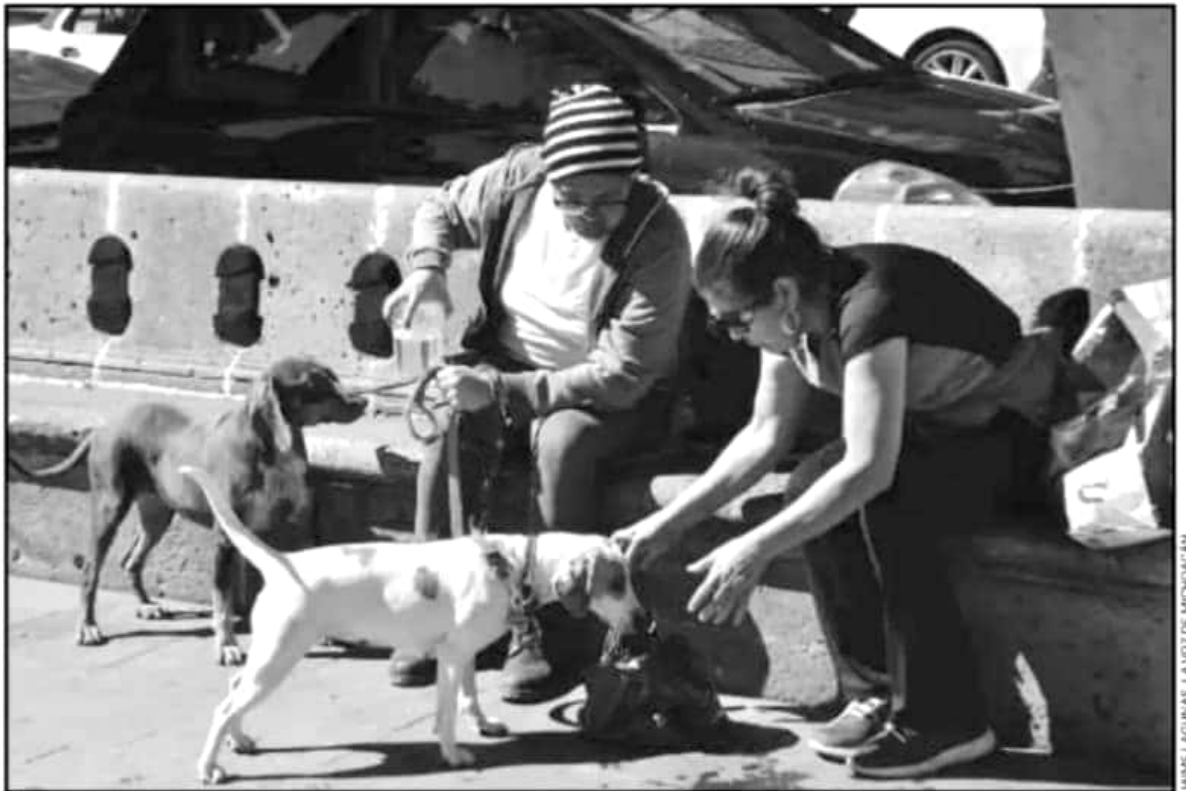
PESE A LOS INTENTOS DE ASOCIACIONES CIVILES, AÚN NO SON SUFICIENTES LOS ESFUERZOS PARA GARANTIZAR LA PROTECCIÓN DE LOS ANIMALES.

Según señaló, la creación de esta fiscalía especializada llevaría a que se cuente con personal especializado en el tema de violencia contra los animales y que