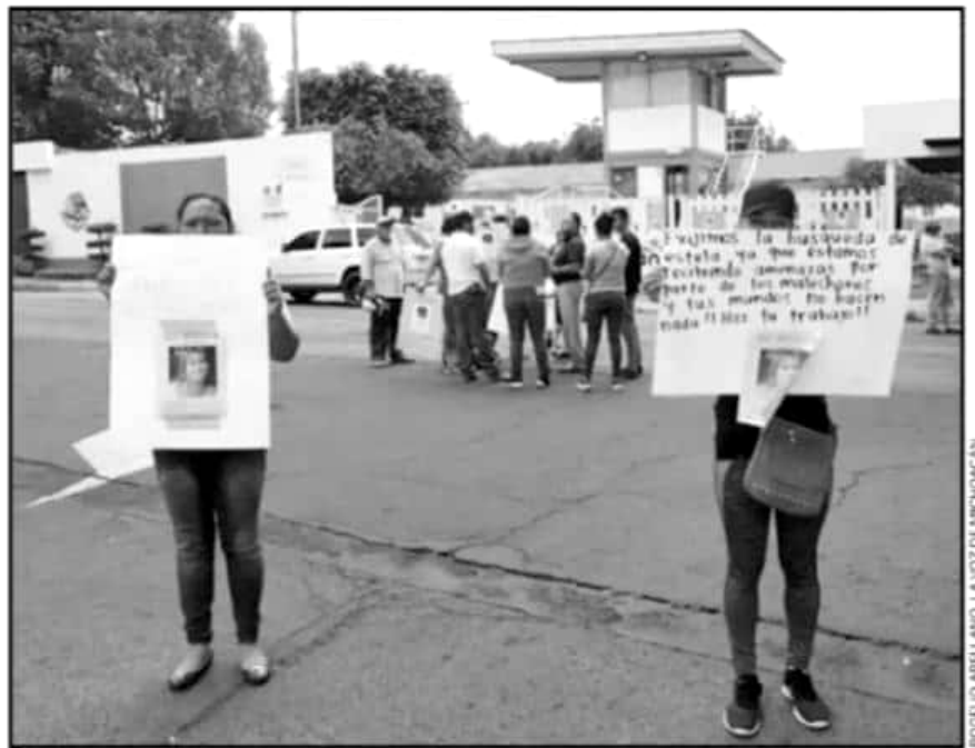
VIARIAS PERSONAS SE DIERON CITA EN LA ALCALDIA PARA HACER PATENTE SU MOLESTIA ANTE LA INACCIÓN MUNICIPAL.