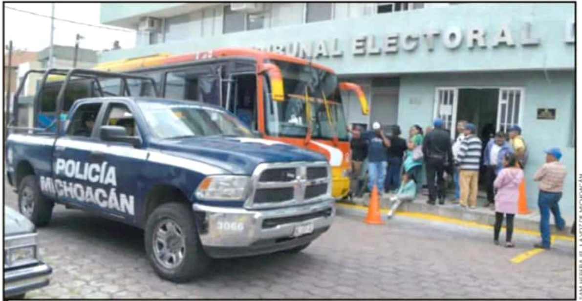
CERCA DE UN CENTENAR DE HABITANTES DE LA COMUNIDAD DE SEVINA, EN NAHUATZEN, SE MANIFESTARON EN LAS INSTALACIONES DEL TEEM EN MORELIA.

Cabe destacar que actualmente en Nahuatzen coexisten 4 consejos indígenas en el mismo número de comunidades, lo que ha suscitado constantes conflictos entre la población de este municipio, en donde incluso, han llegado a los golpes.