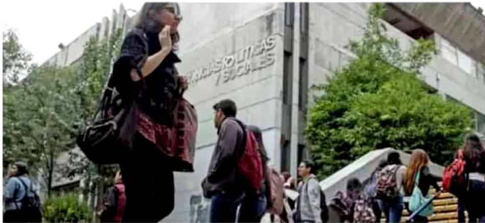
A pesar de estas cifras, la OCDE celebró que durante los últimos 16 años la proporción de adultos jóvenes que egresaron de la educación superior, con o sin haberse titulado, pasó del 17% al 23%.

De acuerdo con las últimas cifras de la Secretaría de Educación Pública (SEP), en 2018 la matrícula de estudiantes universitarios rondaba los 4 millones 209 mil y representaban el 38.4% de la cobertura de jóvenes. Es decir, que cada