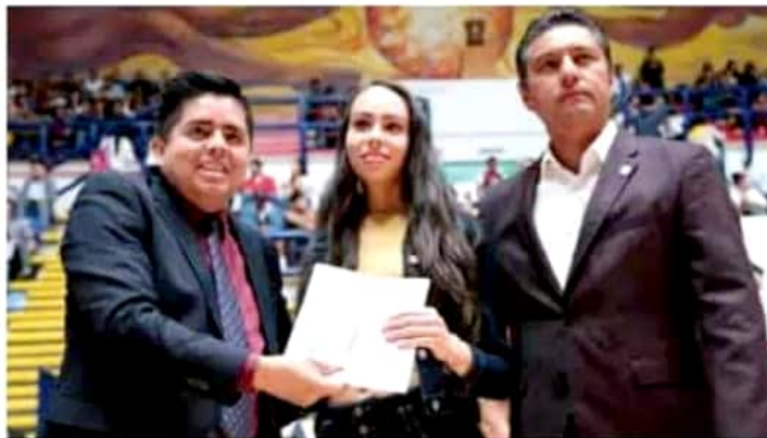
La meta para el mes de julio es entregar 12 mil becas en todo el estado.

Señaló que las críticas, la denostación y la campaña de la oposición en contra del programa de becas se debe a que "nunca en la historia del país" un gobierno federal había implementado una iniciativa de esta naturaleza en beneficio de uno de los sectores más vulnerables; por ello, dijo, se debe hacer buen uso de los recursos que son