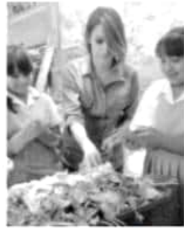
CAMBIO | ACG

Entre los beneficiarios se encuentran estudiantes de las escuelas normales de Tiripetío y Cherán quienes el pasado martes recibieron sus tarjetas.