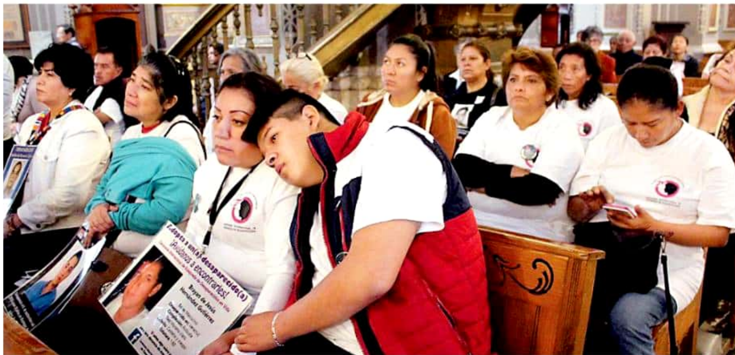
Para los colectivos de familiares en esta condición, la designación del titular fue apresurada por las autoridades. MARIANA LUNA