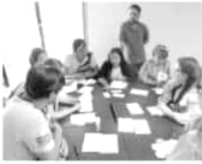
CAMBIO | ESPECIAL

Los resultados podrán chequearse en el sitio web www.imced.edu.mx