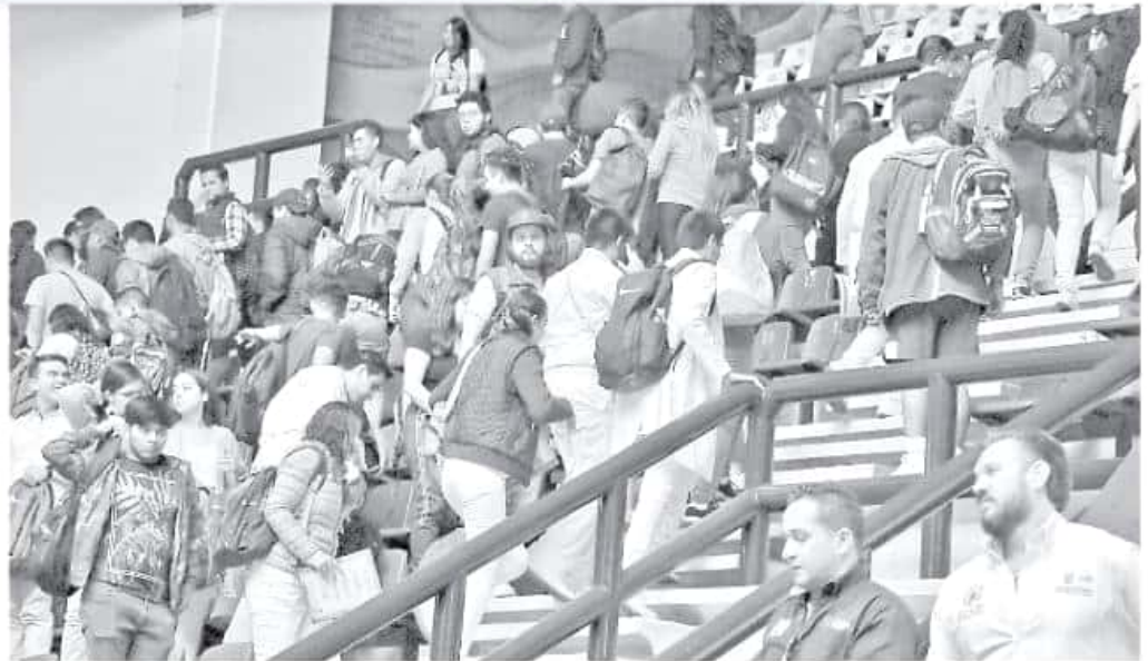
Estudiantes abandonaron el auditorio donde se realizaba la entrega de becas. FERNANDO MALDONADO

Garantizó que en el caso particular de las cinco universidades que se instalarán en Michoacán, los programas de estudio se enfocaron a las necesidades y pertinencia de los mismos en cada región, por lo que se vislumbra incluso incrementar el número de centros para el próximo año.