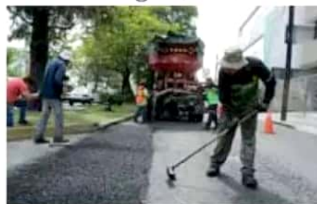
Se revisan las condiciones de las vialidades para dar prioridad a las más dañadas.

Héroes Anónimos, Siervo de la Nación y Manuel Muñiz son vialidades que ya