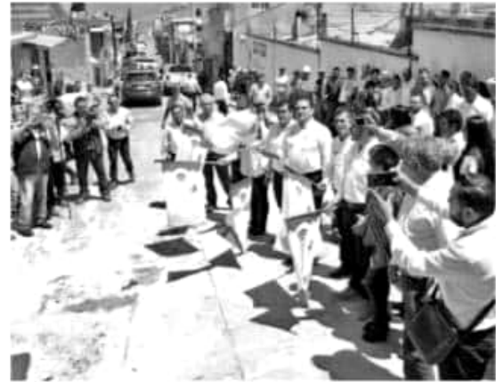
ZITÁCUARO, MICH.- Con una inversión de 150 millones de pesos para casi 50 obras hidráulicas, Zitácuaro tendrá resuelto el abasto de agua potable en la cabecera municipal y en las zonas rurales.

"Con estas obras se beneficia la producción y comercialización de aguacate y guayaba, así como a más de 6 mil 500 habitantes que viven la zona", puntualizó el funcionario Estatal.