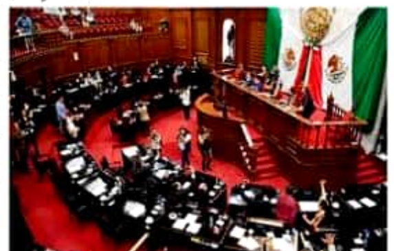
El Pleno del Congreso michoacano conminó a los Congresos de Baja California, Sonora, Sinaloa, Jalisco, Colima, Oaxaca, Chiapas, Yucatán, Tabasco, Veracruz y Tamaulipas, sumarse a este exhorto.