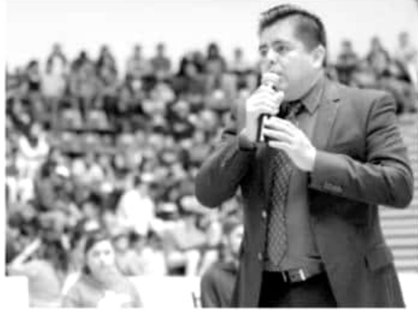
CAMBIO | ACG

Agregó que tienen conocimiento sobre los limitados recur-