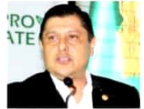
IGNACIO BENJAMÍN CAMPOS EQUIHUA DIPUTADO FEDERAL

Av. Congreso de la Unión 66, Col. El Parque, alcaldía Venustiano Carranza, C.P. 15960 Ciudad de México, edificio B, oficina 33, tel. 5036-0000 ext. 61134