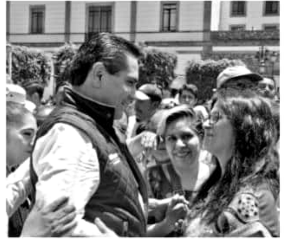
ZITÁCUARO, MICH.- En un mes, Zitácuaro se convertirá en el primer municipio de la región en cumplir con los estándares internacionales al contar con el cuerpo de seguridad óptimo para salvaguardar la tranquilidad de cada uno de los ciudadanos.

"Hemos priorizando la seguridad pública y el desarrollo, tenemos un avance en la certificación de policías de un 70 por ciento, hemos realizado más de 8 reuniones de seguridad y lo más nuevo es que creamos la policía de proximidad en cada colonia", detalló.