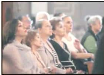
ASISTENTES DIERON GRACIAS POR UN ANIVERSARIO MAS.