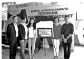
MORELIA, MICH.- Niñas, niños y jóvenes, son la piedra angular en el combate contra el deterioro de la naturaleza.