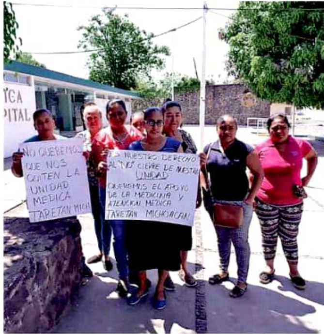
Aumenta el clamor ciudadano para solicitar al IMSS no cancelar estos espacios fundamentales para la salud.

Las 15 unidades de Medicina Urbana de Michoacán operaban con la asistencia de un médico y una enfermera, cuyo desmantelamiento inició esta misma semana.