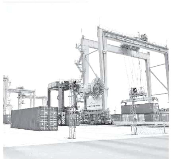
Son cuatro sitios de este rubro los importantes: Veracruz, Altamira, Manzanillo y Lázaro Cárdenas.