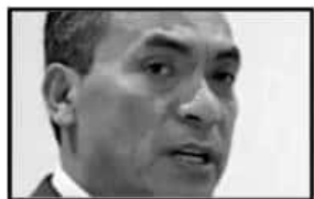
Silvano Aureoles, GOBERNADOR

"No voy a reconocer el nombre de los delinquentes, ningún nombre, no institucionalizaré la delincuencia"