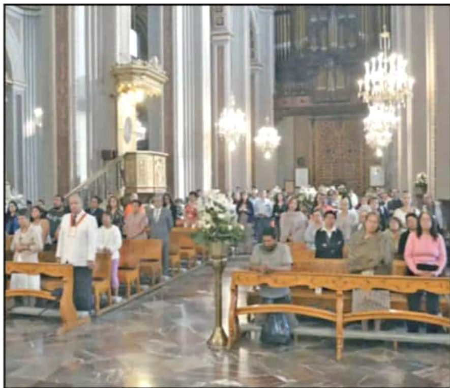
TRABAJADORES DE DISTINTAS ÁREAS DE ESTA CASA EDITORIAL ASISTIERON A LA CELEBRACIÓN EUCARÍSTICA.

se viva la justicia y podamos crear un ambiente de paz, armonía y verdad", manifestó el arzobispo Carlos Garfias al inicio de la ceremonia religiosa.