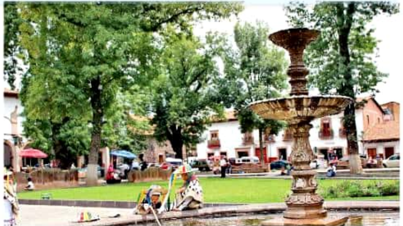
Se cuenta con rutas establecidas y protocolos de seguridad para guías y visitantes. MARIANA LUNA

Ejemplificó que en la empresa que él representa, Ecoturismo Morelia, cuenta con rutas establecidas y protocolos de seguridad, tanto para los visitantes como para los guías: las unidades motrices y personas son monitoreadas, se dispone de comunicación interna y de mecanismos de ubicación en tiempo real. "Si se observan o detectan riesgos, de cualquier tipo,