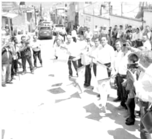
Con una inversión de 150 millones de pesos para casi 50 obras hidráulicas, Zitácuaro tendrá resuelto el abasto de agua potable en la cabecera municipal y en las zonas rurales, destacó el gobernador de Michoacán, Silvano Aureoles Conejo.

nada con autoridades del vecino estado, así como con el Centro Nacional de Inteligencia se trabajará para detener a estos delincuentes a quienes dijo, se tiene plenamente identificados: «ya sabemos quiénes son, ya sabemos dónde están, no se nos van a escapar».