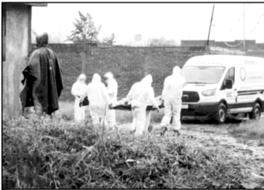
LA INCIDENCIA DELICTIVA EN LA CAPITAL. A DECIR DE GOBIERNO DEL ESTADO, ESTÁ LIGADA A GRUPOS CRIMINALES.

Y de nueva cuenta, cuestionado sobre los recientes casos de decapitados en la ciudad, así como de unos 20 casos homicidios en los que se presume la acción de grupos delincuenciales, el funcionario municipal reiteró no contar con una opinión al respecto. “No, yo no tengo ninguna opinión, yo me avengo a la información oficial que dan las instituciones encargadas de la persecución de esos delitos”, expresó el secretario del Ayuntamiento, considerado como