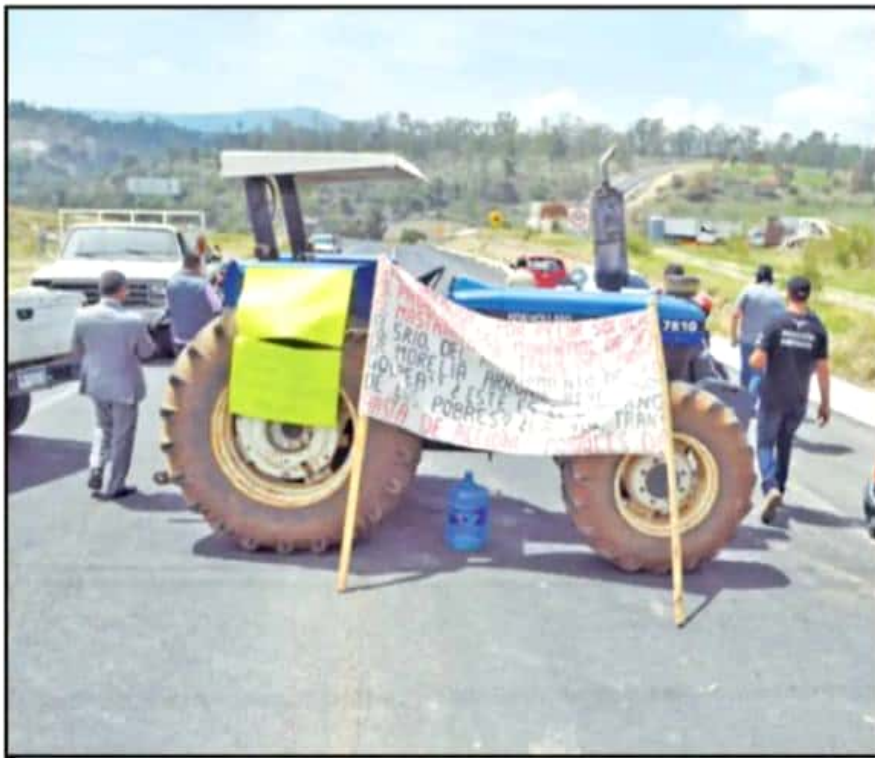
HABITANTES DE JESÚS DEL MONTE SE HAN MANIFESTADO EN EL RAMAL CAMELINAS POR EL 'ROBO' DE UN MANANTIAL

preocupación que le estamos planteando, porque la encontramos ahora que estamos pretendiendo hacer una ambiciosa reforestación", añadió el secretario del Ayuntamiento.