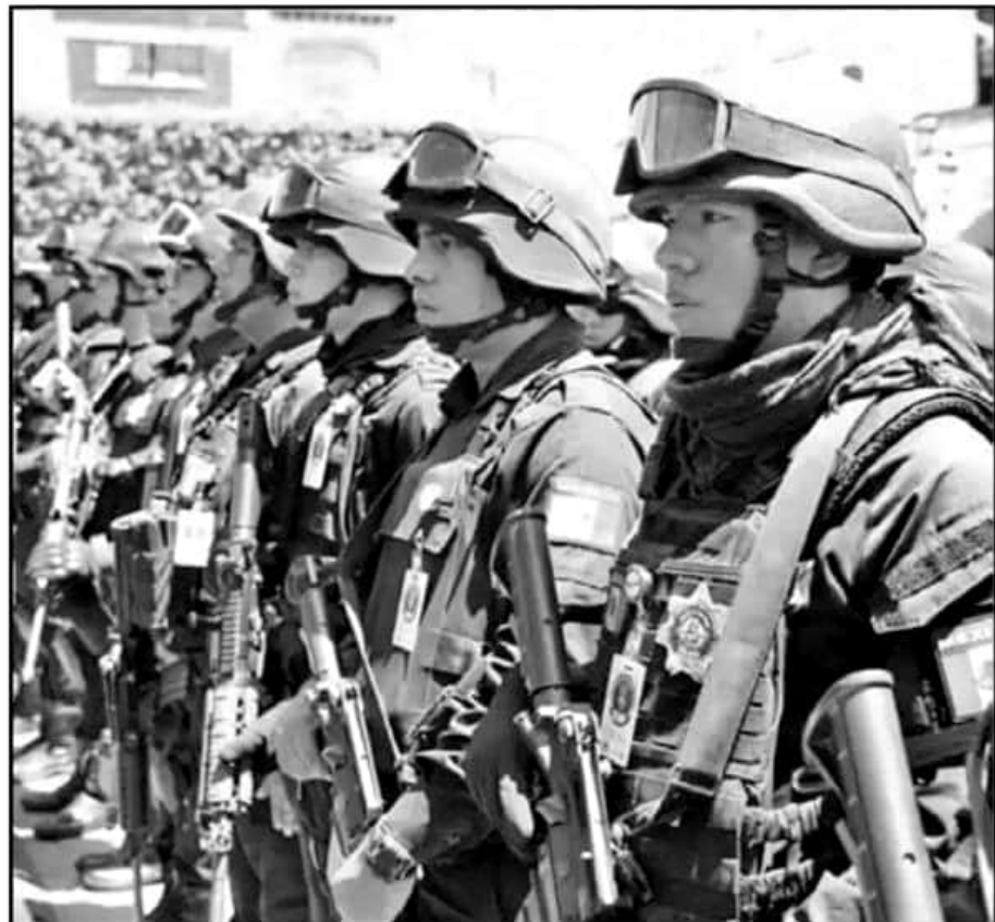
ELEMENTOS CERTIFICADOS DE LA POLICÍA MICHOACÁN FUERON DESPLAZADOS A ZITÁCUARO PARA AUMENTAR EFECTIVOS.

Durante los últimos años, la preocupación del gobierno de Michoacán ha provenido de los límites territoriales. Y es que, aseguran, los vecinos cuentan con peores índices de inseguridad y, sobre todo, con presencia de grupos delictivos