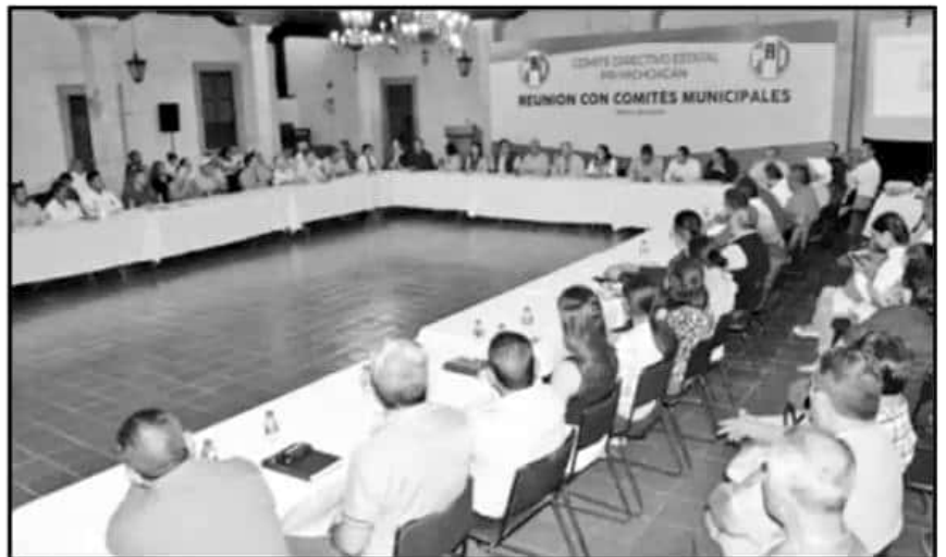
LÍDERES PRIISTAS EN LA ENTIDAD SE REUNIERON CON LOS PRESIDENTES DE LOS COMITÉS MUNICIPALES.