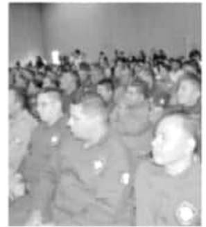
CAMBIO | ESPECIAL

Durante la gira de trabajo por Zitácuaro, el gobernador puso en marcha el arranque de la ampliación del sistema de agua potable de la localidad de Aputzio, así como de la línea de conducción por bombeo del pozo profundo «El Aguacate».