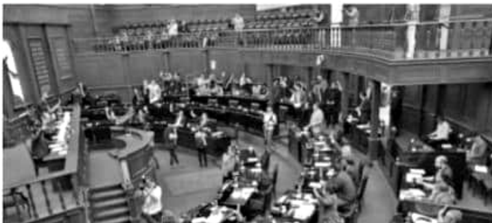
MORELIA, MICH.- De manera unánime, los integrantes de la 74 Legislatura del Congreso de Michoacán, exhortaron a la Cámara de Diputados del Congreso de la Unión para que, en el ámbito de sus facultades, establezcan en la Ley o Leyes correspondientes, un mecanismo de excepción a la aplicación del Régimen de Incorporación Fiscal.

Por lo anteriormente señalado, con este exhorto, el Congreso Michoacano contribuye al impulso de los emprendedores, al solicitar facilidades para que puedan tributar de manera más rápida y sin necesidad de contratar software especializado o despacho contable que les ayude con el cálculo de sus impuestos.