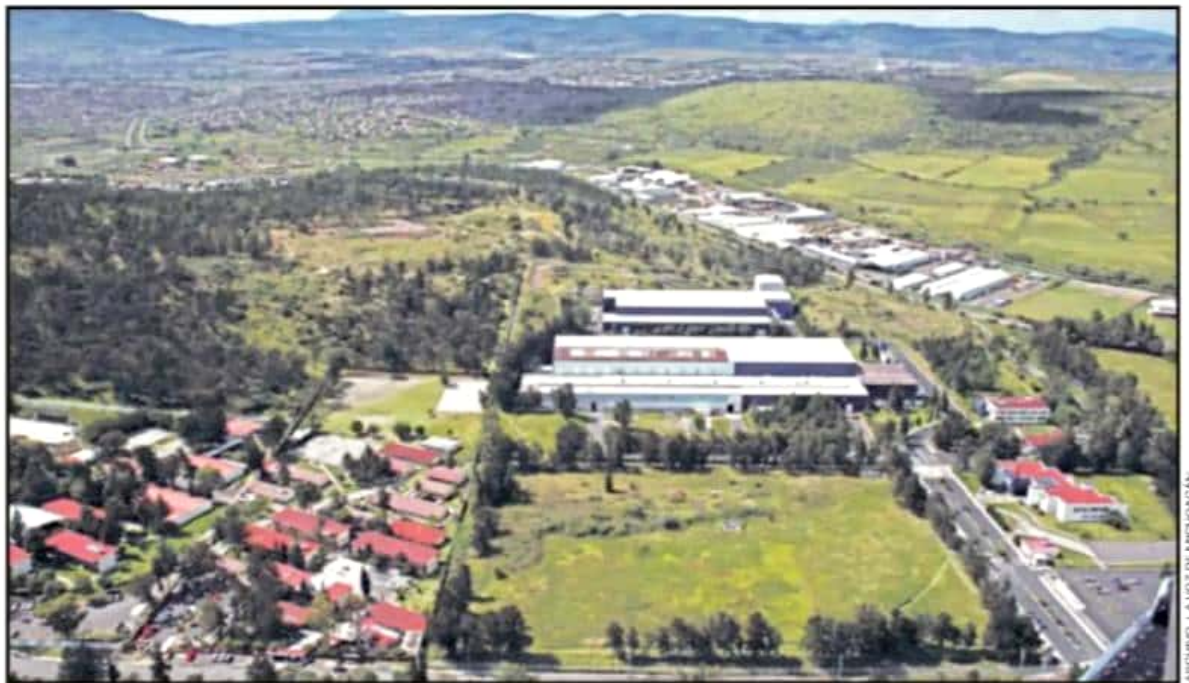
CIUDAD INDUSTRIAL ES UNO DE LOS ESPACIOS QUE ESTÁN EN CONFLICTO POR LA FALTA DEFINITIVA DE PERMISO, DE ACUERDO CON AUTORIDADES MUNICIPALES.

mientos en el orden del 42.6 por ciento, en muchos casos sin Manifestación de Impacto Ambiental, tendencia que inició en los años 80 del siglo pasado y que ha aumentado significativamente la densidad poblacional.