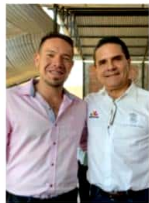
En breve el Gobernador del Estado visitará Santa Ana Maya para inaugurar el nuevo relleno sanitario y conocer un proyecto de composteo para el tratamiento integral de los desechos orgánicos.

naturales, y el próximo ciclo escolar vamos a poner en marcha en educación básica y media superior, la materia de cuidado al medio ambiente", detalló.