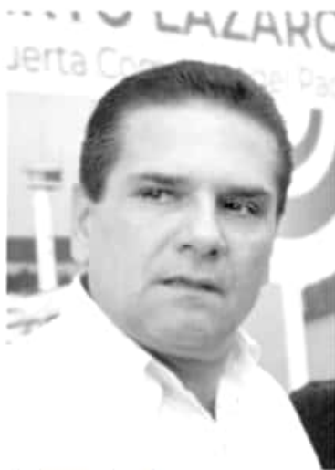
Silvano Aureoles Conejo.