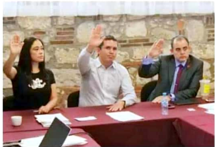
La Comisión Inspectora avaló la fiscalización en ocho municipios.

Los otros municipios que serán sujetos de fiscalización en los términos citados son Pátzcuaro, Puruándiro, Uruapan y Lázaro Cárdenas, así como los ayuntamientos de Aquila, Coacómán y Salvador Escalante. Los últimos tres, debido a que fueron omisos en el cumplimiento de la entrega de su respectiva cuenta pública.