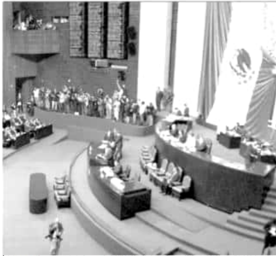
A propuesta del PRI, el grupo tendrá como tarea, la observación y seguimiento de las etapas que comprenden los procesos electorales locales.

«Hay decorosos a las bandas de ahajas, ranchos, residencias, dólares y no se sabe a dónde va a parar todo eso. Ahora, todo lo que se confisque, ya sea a la delincuencia común y a los de cuello blanco, a los corruptos, todo se le va a devolver a la gente», expresó.