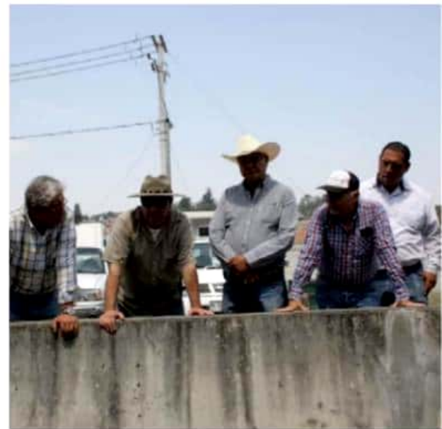
Autoridades del sector durante la supervisión de la obra.

Cabe mencionar que, además, se visitaron también los pozos de agua potable que abastece la cabecera municipal para gestionar recursos ante la CEAC para su mantenimiento.