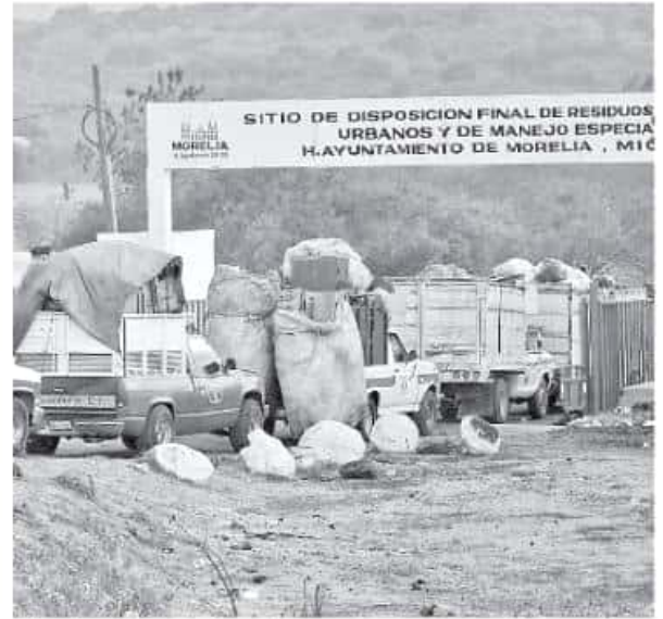
Filas de camiones repletos de basura se observaron a lo largo de la semana en la salida a Quiroga, FERNANDO MALDONADO