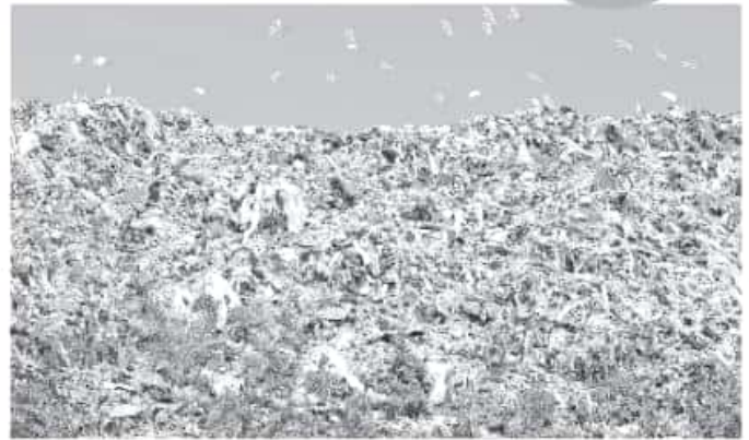
Más de 10% de los desechos de los morelianos son reutilizados.

Aunque señaló que poco más de 10% de los desechos de los morelianos son reutilizados, dijo que "los recolectores son los más convencidos en la separación porque venden algunos materiales, ellos desde