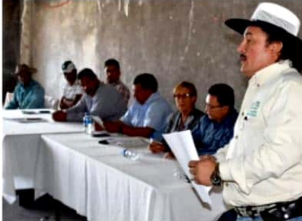
Asamblea extraordinaria del CMDRS en la Casa Ejidal de Uruétaro, Tarímbaro.

Sin embargo, cuando se distribuyó la semilla las feromonas no estuvieron disponibles, ya sea por situaciones administrativas o por cuestiones atribuibles