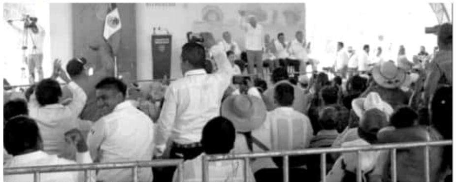
EL presidente Andrés Manuel López Obrador dijo que pondrá placas con los nombres de los cárteles y políticos corruptos a las obras que construirá con dinero y bienes confiscados.

«Lo respeto. Creo que sus declaraciones son valientes», pero «pienso simplemente que los elementos necesarios para probar una obstrucción a la justicia no están reunidos», declaró.