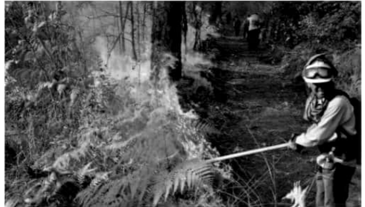
URUAPAN, MICH. Cedillo de Jesús, se comprometió a que la comparecencia sea lo antes posible, dado que el daño ambiental es grave este año rebasó daños ocasionados por el fuego

Cedillo de Jesús, se comprometió a que la comparecencia sea lo antes posible, dado que el daño ambiental es grave este año rebasó daños ocasionados por el fuego. Añadió que al interior del congreso permanecerá vigilante para que en el presupuesto 2020 se dé un incremento al tema ambiental y no haya excusa para no combatir, al contrario puedan ejecutar acciones y el trabajo se refleje en momentos de sequía e incendios.