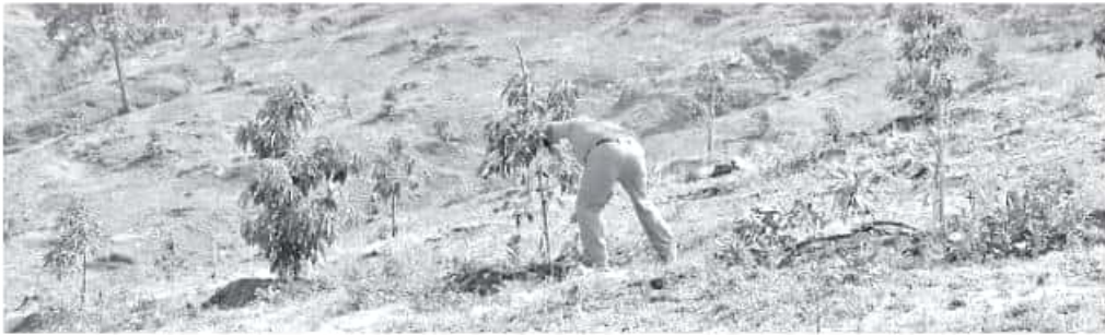
Las zonas naturales protegidas también presentan varios problemas, incluso de carácter legal y administrativo.