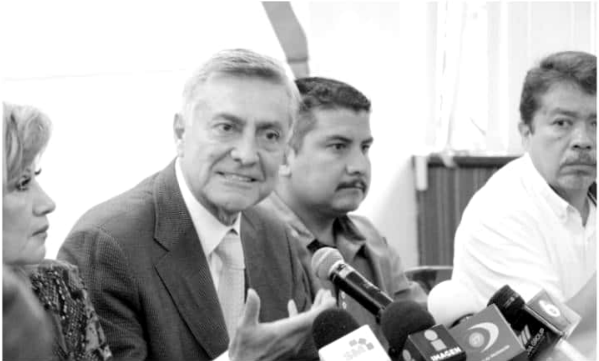
El senador de la República, Cristóbal Arias Solís, durante una rueda de prensa.

Desde la Cámara Alta, dijo, se busca sentar las bases de un nuevo «andamiaje jurídico» para el