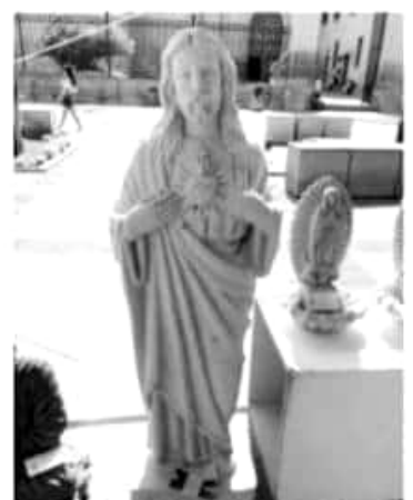
MORELIA, MICH.- Artesanos michoacanos mostraron su talento y destreza en el XXIII Concurso Estatal de Cantería y Lapidaria