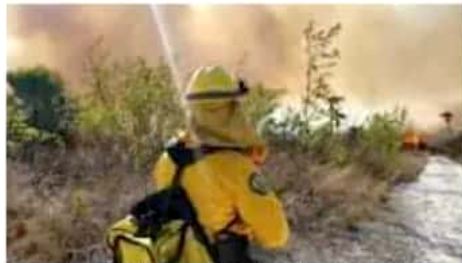
Al cierre de esta edición había incendios en siete municipios.

Una de ellas, compartió, se presentó en Morelia en contra del propietario de una parcela en el cerro del