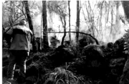
MORELIA, MICH.- Las brigadas de la Comisión Nacional Forestal, Comisión Forestal del Estado de Michoacán, Protección Civil Estatal, corporaciones de bomberos municipales y voluntarias, se encuentran desplegadas en las distintas regiones para mitigar los siniestros

Se reitera a la población el número de teléfono 9-1-1 o el 01-800-46-23-63-46 a fin de reportar cualquier incendio y que el mismo sea atendido con oportunidad.