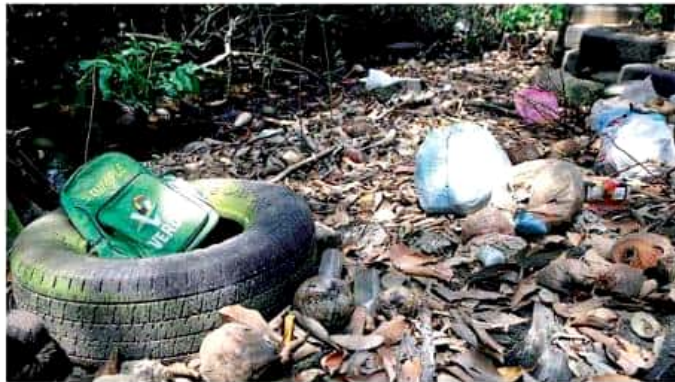
La Canacintra reiteró que el sector privado se encuentra dispuesto a colaborar con los legisladores para evitar el uso de desechables. CUARTOSURG

Ante las iniciativas que se encuentran en el Congreso del Estado sobre la prohi-