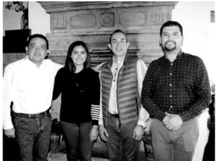
MORELIA, MICH.- Para Entidades como Michoacán lo prioritario es concretar la Federalización de la nómina, pues de lo contrario no sólo se verán afectados los profesores por la imposibilidad del Estado para hacer frente a sus pagos, sino que se ahondará el colapso en las finanzas estatales.

Se pronunciaron por generar certeza a los seis mil 315 planteles educativos con sostenimiento Estatal, de los once mil que existen en el Estado, ya que los cuatro mil 685 restantes son sostenidos por la federación y a los 32 mil maestros con plaza Estatal.