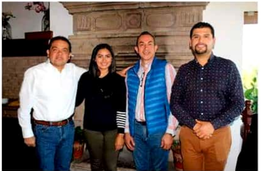
Integrantes del grupo parlamentario del PRD en la 74 Legislatura local.

Se pronunciaron por generar certeza a los seis mil 315 planteles educativos con sostenimiento estatal, de los once mil que existen en el estado, ya que los cuatro mil 685 restantes son sostenidos por la federación y a los 32 mil maestros con plaza estatal.