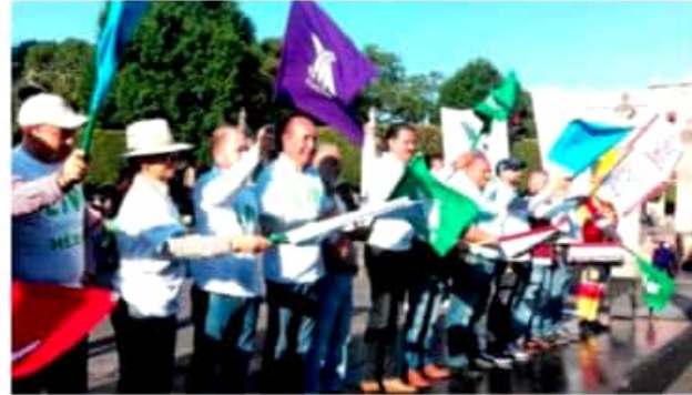
MORELIA, MICH.- Arrancó la décima edición de la campaña Limpiemos México.