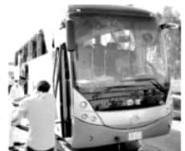
EL ataque ocurrió cerca de las pirámides de Giza; es el segundo ataque en menos de seis meses.

Es el segundo ataque contra las pirámides en menos de seis meses.