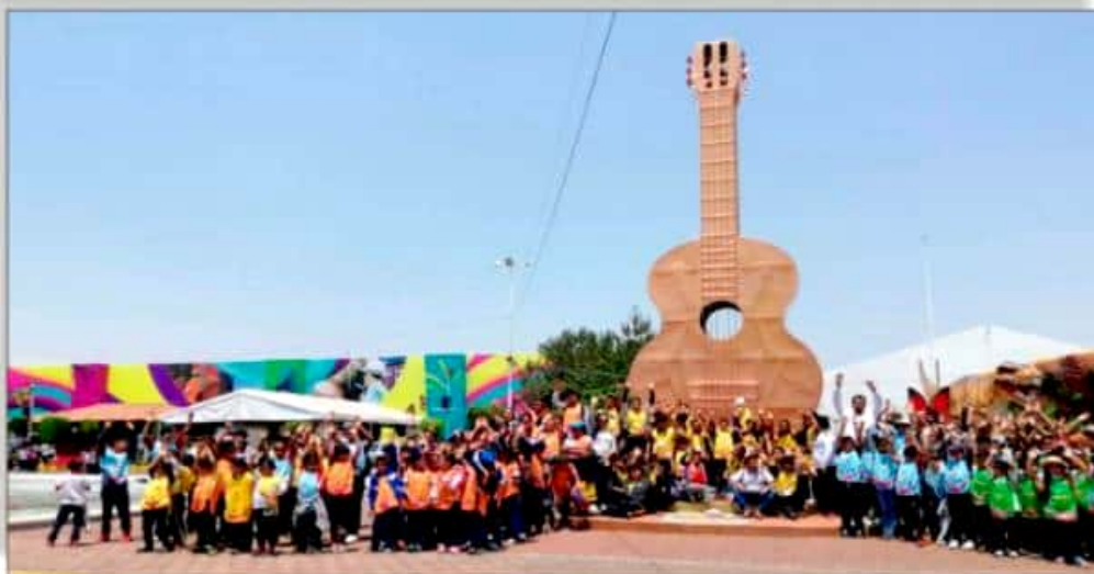
Felices niños y niñas de Huetamo visitaron la Feria de Michoacán.

les tuvo que decir que no . Que aquí, siempre hay bronca por eso y casi nadie quiere verificar. "¡Pero si ya se ve humo en varias partes de Morelia!", que dice su comadre Rosa, apuntando con su índice del Centro Histórico hacia el sur de la Ciudad, allá por la Loma de Santa María . Neta que mi tía, que ya se estaba enmuñando de ver que efectivamente jalgo se tiene que hacer! y ya en Morelia en el terreno ambiental, mejor buscó cambiar de tema y se ¡jaló a la visita ¡al Mercado de Dulces! Y más porque como ya era como la 1 de la tarde , el sol estaba quemando a tal grado y que hasta lo caliente de las banquetas traspasaba las suelas . Luego luego se los llevó a agarrar sombrita pensando en los golpes de calor que están en todo su apogeo y sumamente peligrosos. Ya ven ustedes que hasta en las noticias salió que en San Luis Potosí, varios pajaritos y aves cayeron muertos por el golpe de calor... Ante este panorama, estimados lectores, ora si que como dice mi tía: