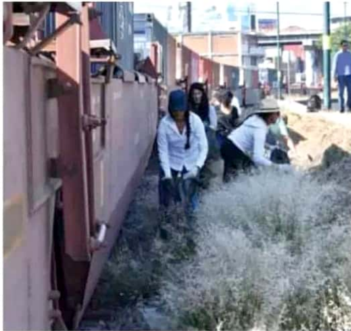
Los ciudadanos acudieron a diferentes puntos de reunión para recoger la basura.

"Están mandado sus evidencias, porque quieren un México limpio, quieren un país donde hay que darle otra oportunidad a nuestra madre tierra, porque es