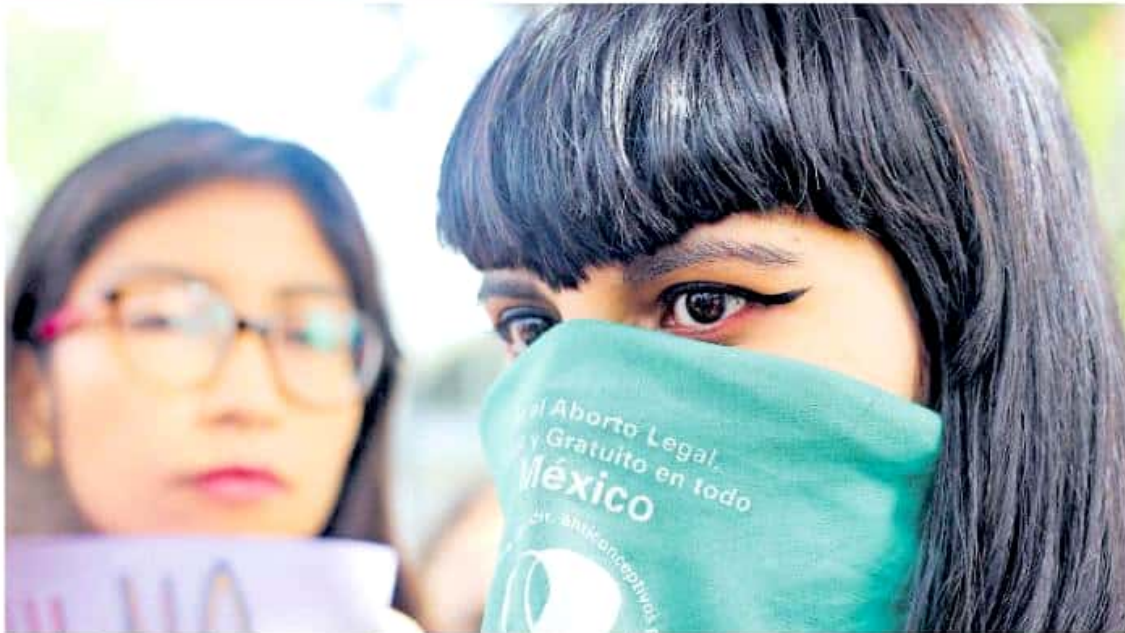
Las Universitarias expusieron que la Casa de Hidalgo ha ejercido violencia institucional contra las denunciantes.