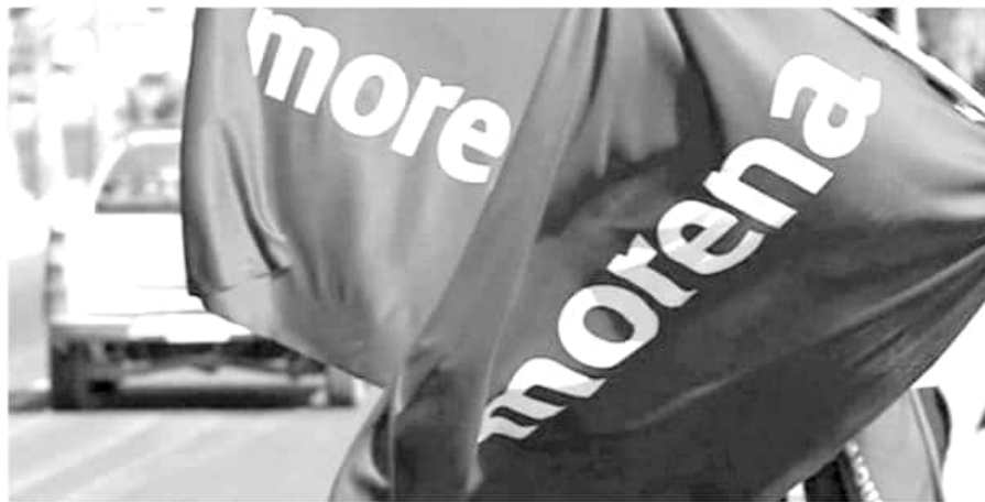
Las dirigencias estatales y nacional están por renovarse en noviembre próximo.

Cabe recordar que el propio presidente Andrés Manuel López Obrador, líder político y moral de Morena, en una reunión plenaria con la dirigencia nacional