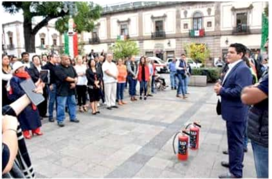
El estándar establece que son tres minutos como máximo para lograr la evacuación de un edificio, mientras que en el Palacio del Poder Legislativo se consiguió en dos minutos con 54 segundos.