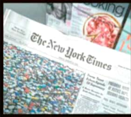
LA VOZ DE MICHOACÁN