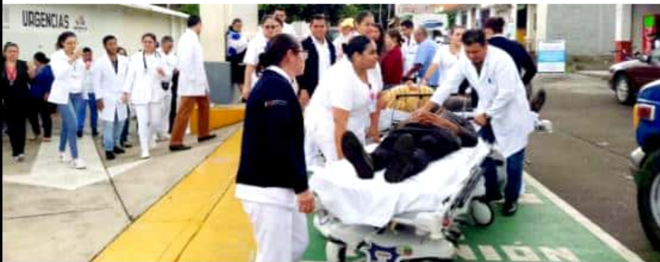
LOS REYES, MICH.- Con éxito se llevó a cabo un simulacro de evacuación del Hospital General de Los Reyes.

Esta actividad se suma a los simulacros efectuados en diferentes escuelas y empresas de la ciudad, con el objetivo no solo de conmemorar los terremotos al inicio citados sino capacitar a alumnos y personal, respectivamente, en una cultura de protección civil.