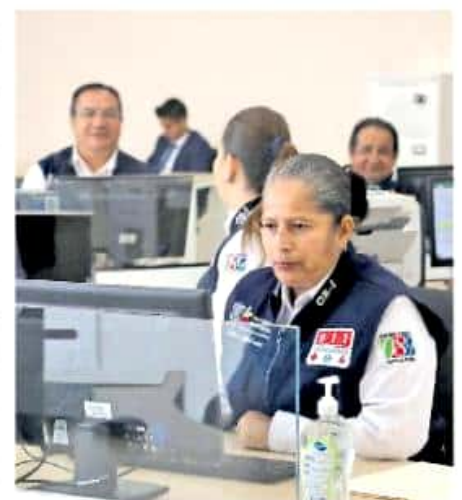
El centro de seguridad fue posible gracias al incremento al impuesto sobre nómina.

De hecho, destacó que ya se logró igualar el número de unidades automotrices robadas contra los recuperados en tan sólo los primeros 15 días de operación del C5, de 200 contra 282 automotores recuperados.