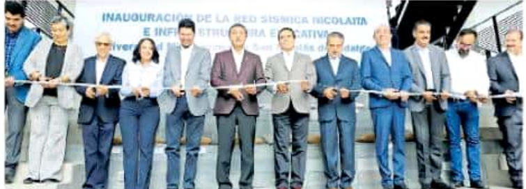
Es necesario que comunidades, como la nicolaíta, se adentren en el terreno de la protección civil, consideró el gobernador del estado

La capital del estado es la segunda ciudad del país mejor equipada con una red sísmica que permite mejorar el estudio de los fenómenos naturales de este tipo y aminorar sus efectos. Esto se dio luego de la inauguración de la red sísmica, que a decir del investigador de Ingeniería Civil de la Universidad Michoacana de San Nicolás de Hidalgo (UMSNH), José Manuel Lara Guerrero, es sólo superada por la existente en la Ciudad de México. Precisó que la puesta en operaciones de este equipamiento, lo que se enmarca en el Día Nacional de Protección Civil, permitirá tener mayores precisiones en el registro de los movimientos telúricos y ello ayudará a tener nuevos elementos del comportamiento y así mitigar riesgo a mediano plazo. Los 10 aparatos han sido instalados del Norte hacia el Sureste y Poniente de Morelia y con