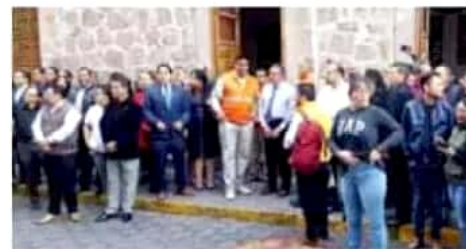
Este jueves se llevó a cabo el macrosimulacro de sismo en la ciudad.

Adelantó que uno de los primeros resultados que presentó el especialista es que existen algunas fallas en los Itzicuaro, pero de mo-