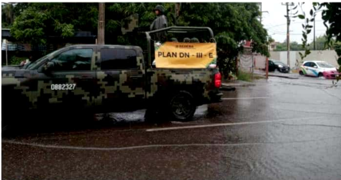
CD. LÁZARO CÁRDENAS, MICH.- La Sedena, a través del 82 Batallón de Infantería, activaron este miércoles el Plan DN-III, luego de registrarse una serie de afectaciones por motivo de la tormenta tropical "Lorena".

Cabe mencionar que para este jueves "Lorena" se alejó de la Costa michoacana, aunque por la mañana continuaron las lluvias, pero con menor intensidad. Asimismo, por órdenes de la Secretaría de Educación del Estado (SEE), las clases para el turno matutino se suspendieron.