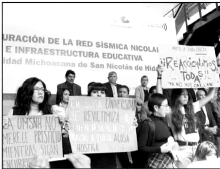
MUJERES DE RED DE INTRUSAS SE MANIFESTARON EN UN ACTO OFICIAL ANTE LA FALTA DE ATENCIÓN A LAS DENUNCIAS.

no utilizan el protocolo o no se sigue, “la autoridad pide que se siga los pasos, pero no se respeta; por lo que esto es un ejemplo equivocado si lo que se quiere es motivar a que se denuncien los casos”.