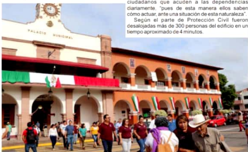
APATZINGÁN, MICH.- Funcionarios municipales y asistentes a las instalaciones del gobierno municipal participaron en el macrosimulacro de sismo, en conmemoración de los 34 y segundo aniversario de los terremotos de 1985 y 2017.

Según el parte de Protección Civil fueron desalojadas más de 300 personas del edificio en un tiempo aproximado de 4 minutos.