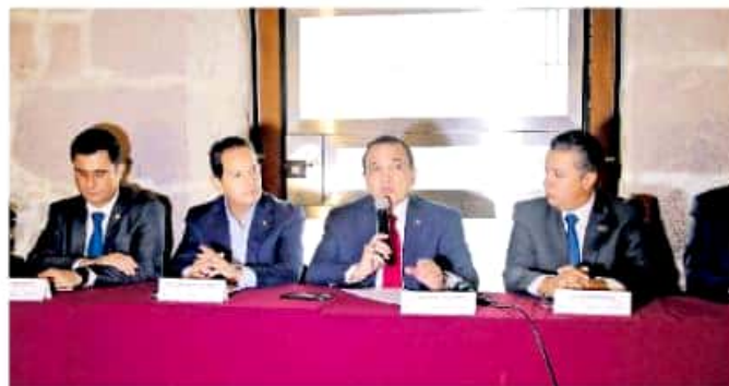
La Concanaco tuvo su reunión nacional en Palacio Clavijero

Enfatizó que la informalidad lesiona la economía nacional en todos sus sentidos, desde el ambulantaje hasta los empresarios que no pagan impuestos, privando a los trabajadores de calificar en los programas hipotecarios de vivienda, a un fondo de ahorro para el retiro, pero también les limita el servicio a la salud.