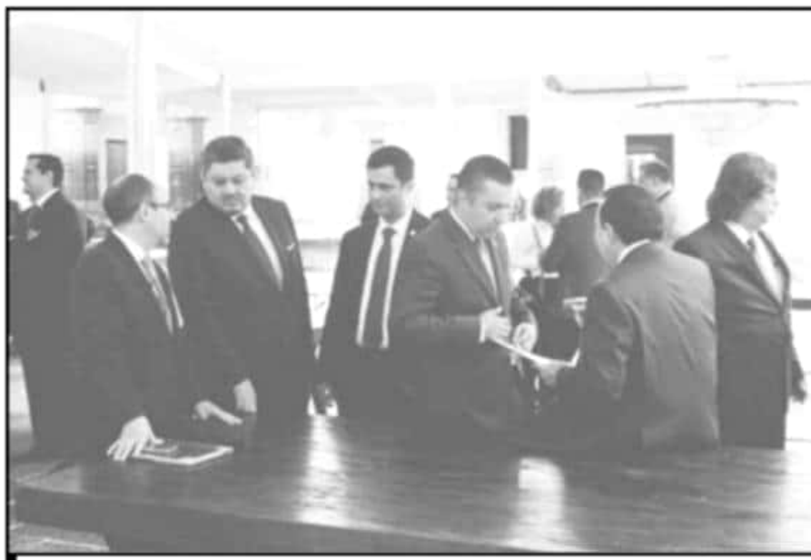
DIVERSOS EMPRESARIOS AGREMIADOS A LA CANACO SERVYTUR PARTICIPARON EN LA INAUGURACIÓN DEL EVENTO.

carga impositiva es una deducción que hace Hacienda como parte de la Ley de Ingresos del país, es una manera en que los empleados pueden acceder a los esquemas de seguridad social, recaló el empresario.