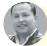
DAVID OLIVO @DOLIVO_A