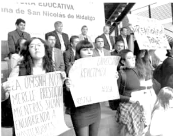
Exigen integrantes de colectivo que no queden impunes casos de violencia sexual la UMSNH.

SILVANO AUREOLES - CUARTO INFORME DE GOBIERNO -