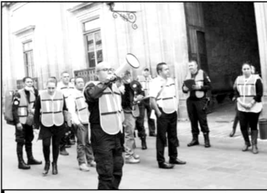
DEPENDENCIAS ESTATALES, MUNICIPALES, JUNTO A OFICINAS DEL IMSS E ISSSTE EN MORELIA SE SUMARON AL SIMULACRO.

año, la cual se extiende durante prácticamente siete meses. Debido a que muchas viviendas se han instalado en zonas de cauces de ríos, lagos secos, así como en zonas deforestadas y de pendientes pronunciadas, cada temporada de lluvias suele presentar al menos un desastre de grandes proporciones.