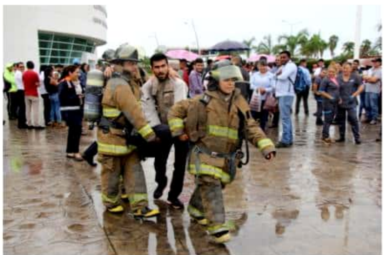
CD. LÁZARO CÁRDENAS, MICH.- La Administración Portuaria Integral de Lázaro Cárdenas llevó a cabo en sus instalaciones, Centro de Negocios de esta entidad e instalaciones portuarias, un simulacro de sismo y tsunami.

El objetivo de este simulacro es calificar y poner a prueba la coordinación y la capacidad de respuesta para hacer frente ante un hecho real, así como contar con la señalética adecuada que oriente acerca de la ubicación de las rutas de evacuación y salidas de emergencia.