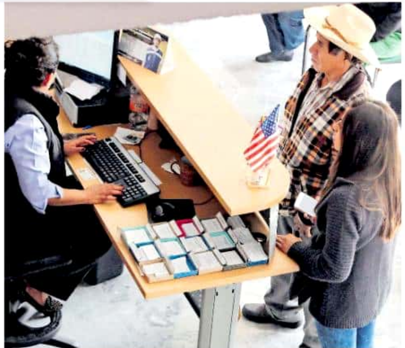
El Programa 3x1 fue desaparecido pues, de acuerdo con la Federación, los estados y municipios no aportaban el recurso comprometido, por lo que resultaba inviable.

PARA ESTE año se estima la deportación de 18 mil michoacanos y el retorno voluntario de hasta 10 mil migrantes