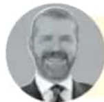
LUIS WERTMAN @LUISWERTMAN

El despliegue de programas sociales es un factor que sostiene la popularidad presidencial. De hecho, en opción abierta, las becas a estudiantes y las pensiones a adultos mayores son percibidas como los mayores aciertos del gobierno.