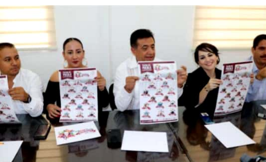
APATZINGÁN, MICH.- Fue presentado el programa de la Expo Feria Octubrina 2019, en el que destacan artistas de diferentes géneros musicales, comediantes y se contará también con la participación de un show para niños.