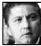
Silvano Aureoles Conejo, GOBERNADOR DE MICHOACÁN

“El tema del protocolo será abordado por el Consejo Universitario para su revisión, no tenemos una fecha, pero tendrá que ser sesión inmediata”