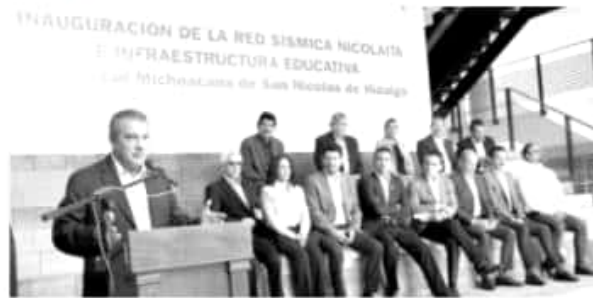
Inaugura la Red Sísmica Nicolaita que analizará los movimientos telúricos de la tierra para mitigar riesgos para la población.

Se trata de la construcción del edificio Multides y la de un andador cubierto para personas con discapacidad; terminación de talleres en la Facultad de Bellas Artes; rehabilitación del edificio académico del Instituto de Investigación en Metalurgia y Materiales; terminación del edificio de aulas y cubículos en el Instituto de Investigaciones Históricas y terminación de obra en el Instituto de Físico Matemáticas.