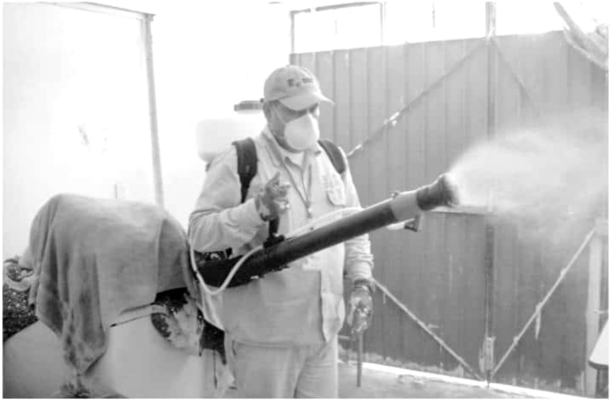
Gracias a las acciones del Sector Salud, Michoacán sigue sin registrar casos de zika y chikungunya.

Personal de la dependencia realiza acciones de nebulización en municipios