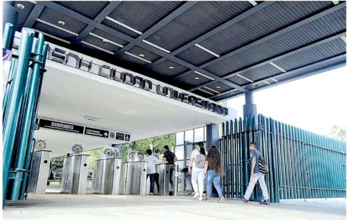
Se acerca el fin de año y el déficit nicolaíta impide cubrir enteramente la nómina, lo que repercute en la calidad educativa