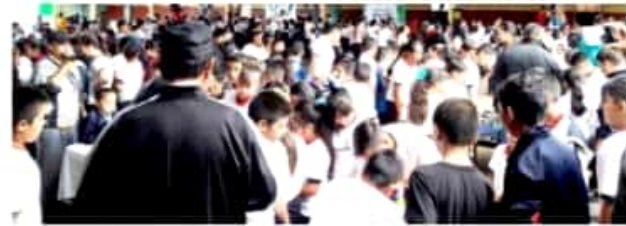
SANTA CLARA, MPIO. DE TOCUMBO, MICH.- Ayer se realizó una edición más del programa Jornada de DIFusión, programa que busca acercar los servicios del DIF a la ciudadanía en general.

El edil tocumbense reconoció el trabajo realizado por el personal del DIF en la realización de estas actividades, destacó que el organismo ha venido implementando acciones en favor de las familias, en especial las que se encuentran en estado de vulnerabilidad, refrendando su compromiso de apoyar las actividades que el DIF estará realizando en pro de la ciudadanía tocumbense.