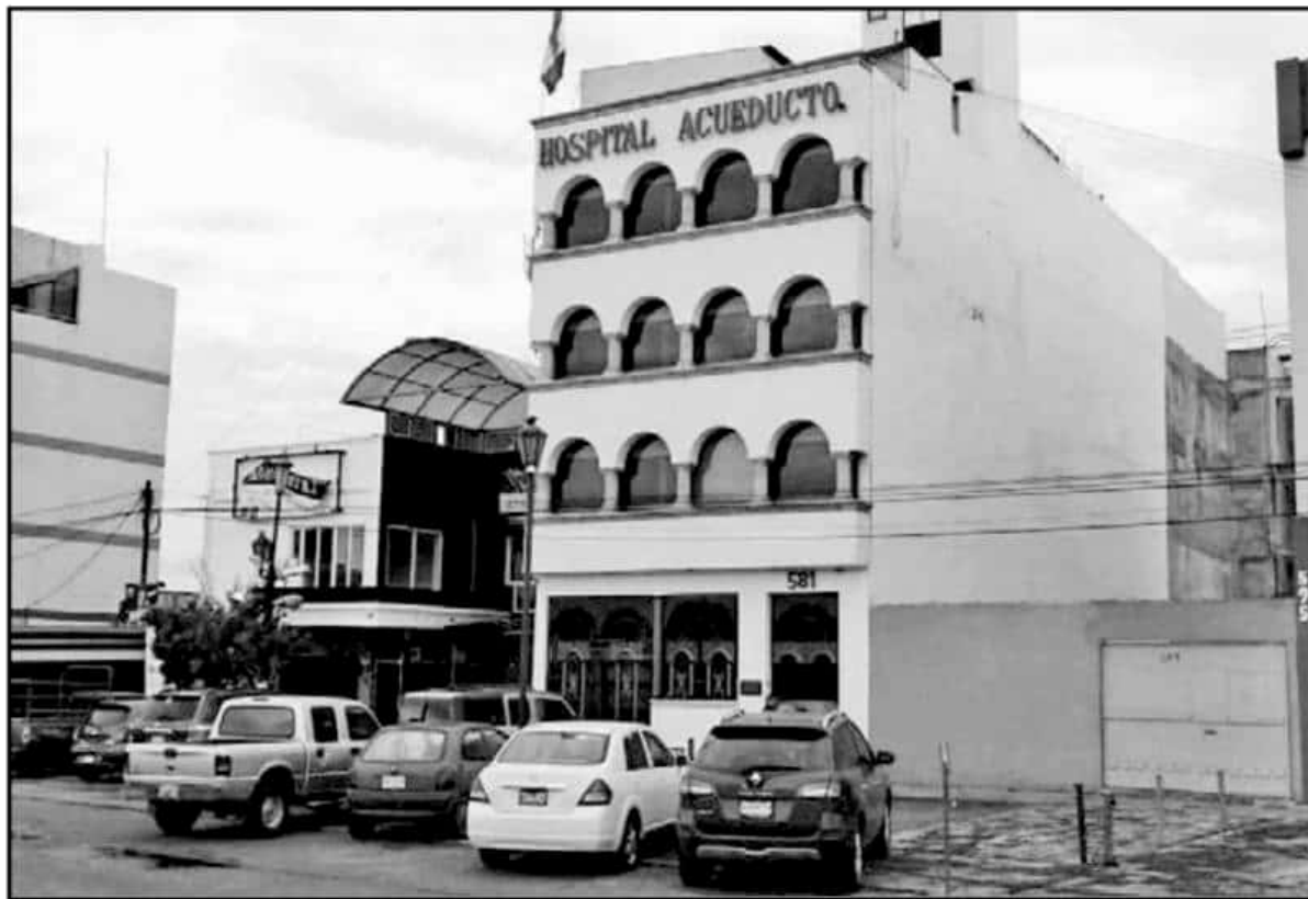
DE ACUERDO CON LAS VERSIONES POLICIALES, SUJETOS ARMADOS AMAGARON A LOS GUARDIAS EN EL LUGAR Y SE DIRIGIERON A LA HABITACIÓN DEL PACIENTE.