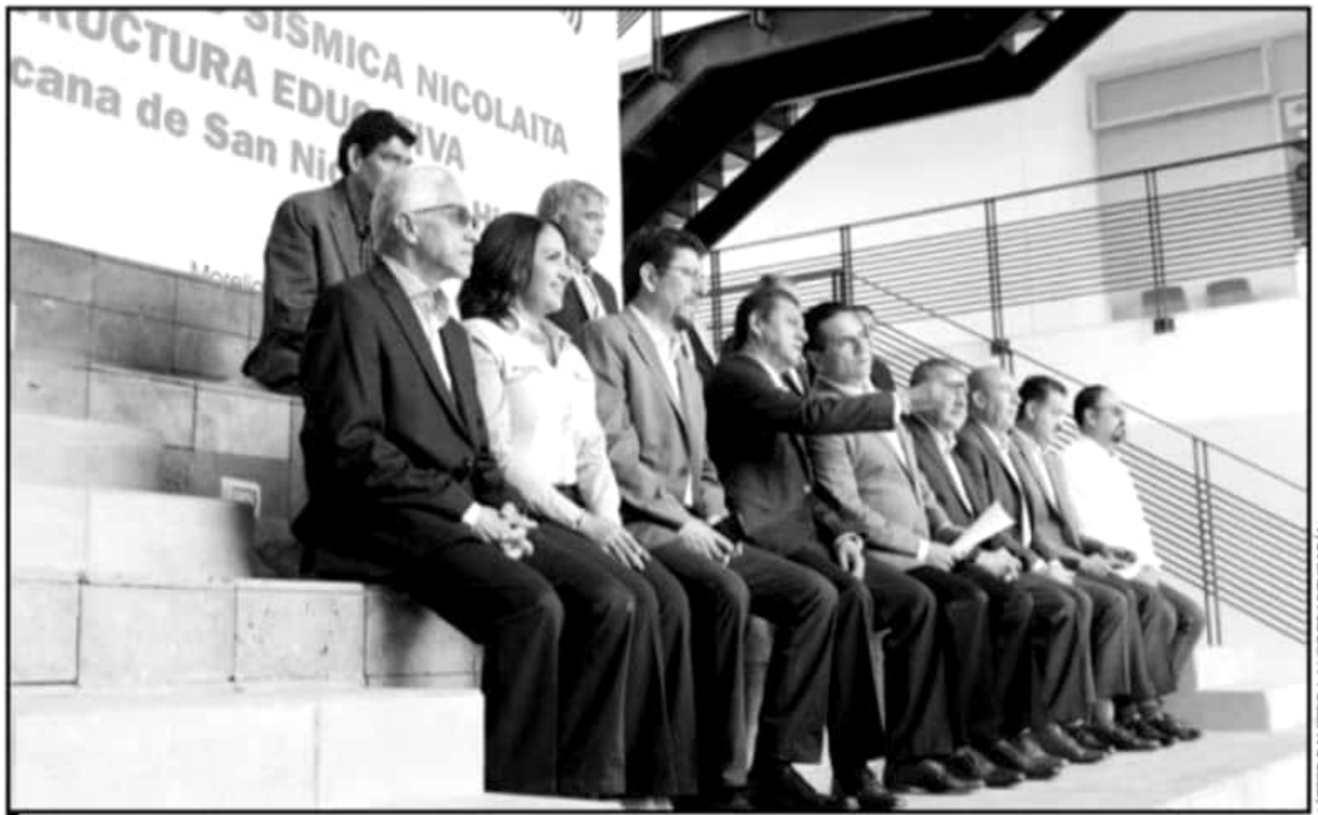
AUTORIDADES UNIVERSITARIAS Y DEL GOBIERNO ESTATAL SE DIERON CITA EN CIUDAD UNIVERSITARIA, DONDE SE LLEVÓ A CABO EL ACTO PROTOCOLARIO.

El académico aseveró que son diversos puntos en los que se han