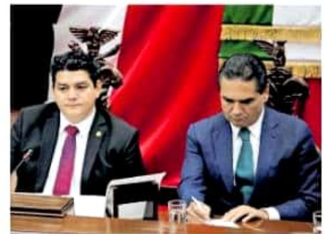
A casi un mes de haber llegado al Congreso, la iniciativa del Ejecutivo no ha sido discutida

El precio base de venta de cada propiedad contemplada entre los bienes a ofer-