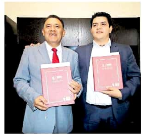
El legislador informó que presentaron 17 iniciativas propias y cinco más colectivas.

"La LXXIV Legislatura se ha distinguido por tener disenso y al final se pudo