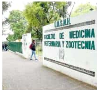
La Posta es un espacio anexo de la Facultad de Veterinaria

SE TRATA del segundo robo que se registra en el lugar, por lo que la Universidad Michoacana de San Nicolás de Hidalgo está tratando de reforzar las medidas de seguridad, espacio que tiene una extensión de 60 hectáreas