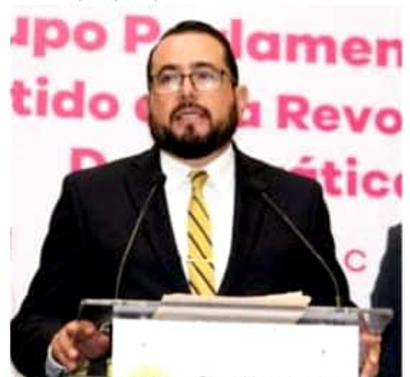
Humberto González Villagómez, presidente de Comisión de Seguridad Pública y Protección Civil de la LXXIV Legislatura del Congreso del Estado.

Por lo tanto, se espera que de los asistentes al Foro que se llevará a cabo en la ciudad de Zitácuaro, se obtengan propuestas que se convertirán en aportaciones de suma importancia para la elaboración de la iniciativa que la Comisión de Fortalecimiento Municipal, presentará ante el Pleno.