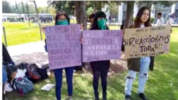
Las integrantes de Red Intrusas caminaron hasta el edificio donde se desarrollaba el acto de inauguración de la Red Sismica.

Un grupo de activistas interrumpió un acto en CU para exigir a las autoridades nicolaitas atender casos de acoso contra estudiantes