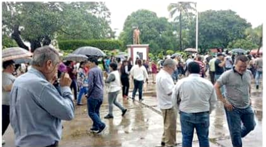
Según PCM ayer participaron alrededor de mil personas en el simulacro de sismo realizado en el palacio municipal.

Los supuestos heridos fueron clasificados 1, como verde, que significa no grave; 4 amarillos, que indica que estaban entre medio graves; 1 de color naranja, cuyo estado fue calificado de grave y 1 de color rojo, de muy grave y urgente su atención. Todos los heridos fueron subidos a alguna de las ambulancias para ser llevados al Seguro Social u Hospital General para su "atención médica".