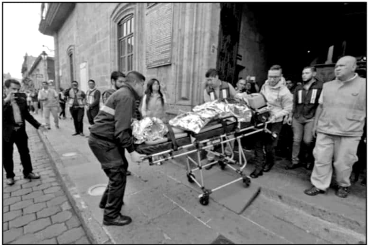
PERSONAL DE PROTECCIÓN CIVIL MUNICIPAL REALIZÓ UNA DEMOSTRACIÓN DE URGENCIA Y RESCATE DURANTE EL MEGASIMULACRO DE ESTE DÍA JUEVES

"Lo más importante para nosotros sin lugar a dudas es la capacitación a la sociedad civil, contamos con un estado de fuerza al 100 por ciento, pero si no tenemos la cultura y la capacitación no habrá manos que al-