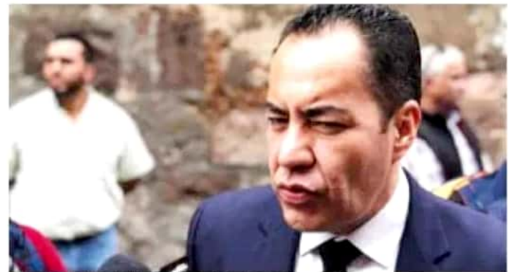
El secretario de Gobierno señaló que se trabaja para dar con los responsables.

Estos hechos violentos, señaló, hacen más necesaria la construcción de la ruta de la paz, a raíz del acuerdo que se firmó el fin de semana pasado con autoridades y diferen-