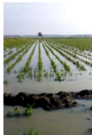
ZAMORA, MICH.- Pequeños productores de las comunidades de Aquiles Serdán y El Espíritu, se están viendo afectados por un desperfecto ocasionado en un dispositivo de riego.

Situación que se acentúa en la Sultana del Duero, donde no se cuenta con un acercamiento con los integrantes de la Asociación de Gasolineros, para que den a conocer el porqué del aumento en el costo del litro de combustible que está a escasos centavos de llegar a los 22 pesos.