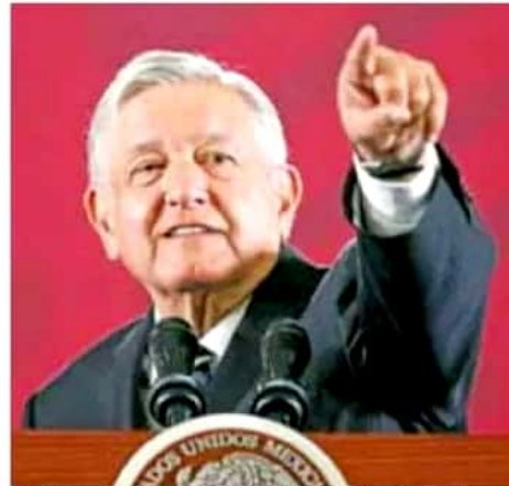
El despliegue de programas sociales es un factor que sostiene la popularidad presidencial.

Según el análisis, la aprobación presidencial se ha mantenido en niveles elevados por diversos factores, uno de ellos es que, a pesar de la desace-