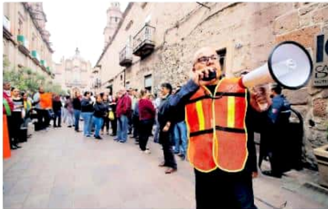
La promoción de una cultura es vital para saber cómo responder ante una situación de riesgo

Asimismo, Herrera Tello especificó que se tuvo un registro de 932 inmuebles a nivel estatal en la plataforma de Protección Civil nacional, de 80 municipios, y en el que participó un total de 212 mil 369 personas, quienes de manera ordenada realizaron los simulacros en sus respectivos centros laborales.