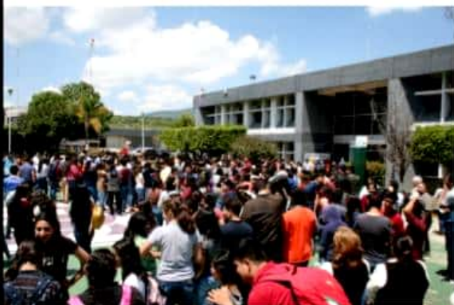
ZAMORA, MICH.- En el simulacro que trabajadores del Ayuntamiento de Zamora llevaron a cabo el día de ayer participaron cerca de 250 personas.