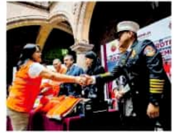
Reconocieron el trabajo de la corporación municipal

Finalmente, el funcionario estatal señaló que esta promoción de la cultura de protección civil es vital para salvar vidas, y así prevenir accidentes y saber cómo y qué hacer ante cualquier movimiento telúrico; además destacó que desde el gobierno del estado se ha insistido en estar preparados con un plan de protección civil, formar brigadas de emergencia, identificar zonas de riesgo y zonas de seguridad, así como determinar rutas de evacuación y salidas de emergencia.