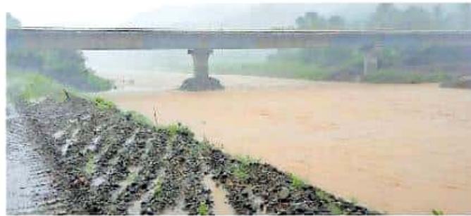
El paso de las últimas lluvias para Michoacán se calificó como positivo

"Hemos estado atentos con el gobierno federal porque se presumía que podría