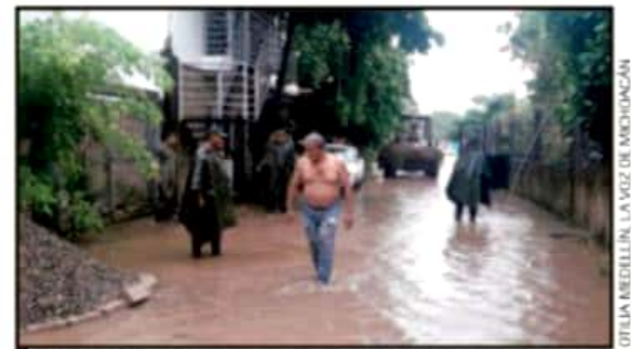
TAREAS DE DESAZOLVE, LIMPIEZA DE CALLES Y APOYO EN GENERAL, REALIZARON ELEMENTOS DEL EJÉRCITO ANTE LAS LLUVIAS POR LORENA.

A las 16:20 horas de este jueves la Capitánía regional de puerto respondió que a partir de las 9 horas fue abierto a la navegación mayor el puerto de Lázaro Cárdenas y se permaneció cerrado para la navegación de embarcaciones menores.