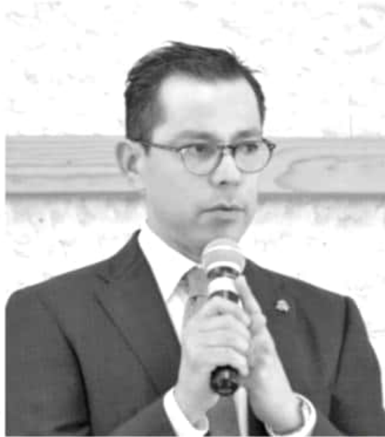
Omero Valdovinos Mercado.

El magistrado presidente Omero Valdovinos Mercado