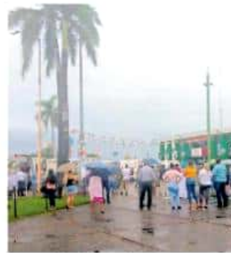
La participación de la gente en estas acciones es importante / GEORGINA GASCA

El funcionario mencionó que, en caso de un movimiento telúrico se debe mantener la calma, protegerse de objetos que puedan caer, no cruzar entre maquinaria o