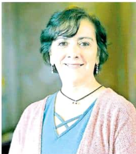
La funcionaria sufrió una triple fractura que la mantuvo incapacitada y trabajando desde casa.

cido en razón de que los estados y municipios no cumplían con su aportación monetaria, por lo que resultaba inviable.