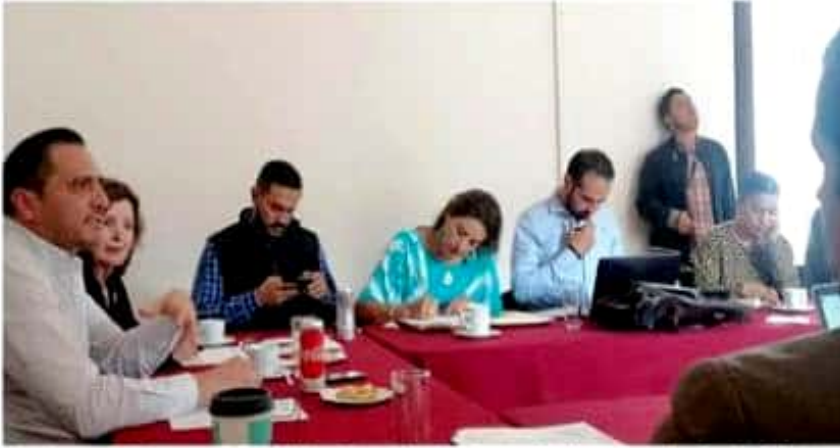
Este viernes en Zitácuaro se realizará el Foro Regional para la Construcción de una nueva Ley Orgánica Municipal.