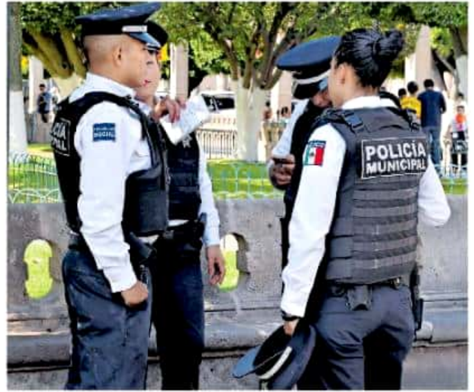
Pese a la presencia de las corporaciones de seguridad, el índice de homicidios dolosos no ha registrado una incidencia a la baja.

No obstante, aun con la llegada de la Guardia Nacional al estado de Michoacán y a Morelia, la incidencia delictiva en homicidios dolosos es un tema que no va a la