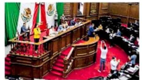
PVEM y PRD presentarán punto de acuerdo ante el Pleno local al respecto

Según el documento que preparó el legislador los comentarios del funcionario fomentan la discriminación en el acceso a los servicios de atención médica, mismo que el estado