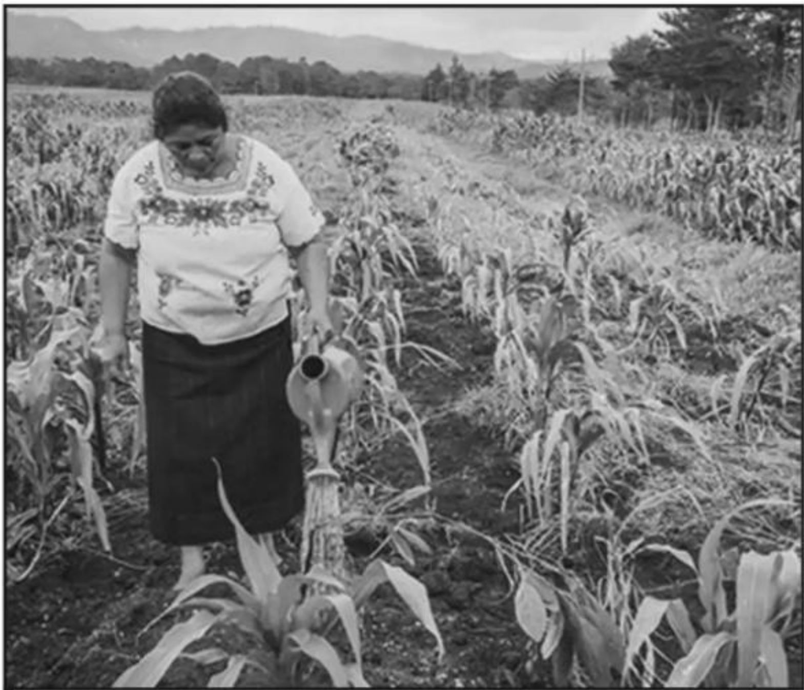
EL CAMPO ES UNO DE LOS RUBROS QUE SE VERÁN AFECTADOS POR LA DISMINUCIÓN DE RECURSOS FEDERALES.