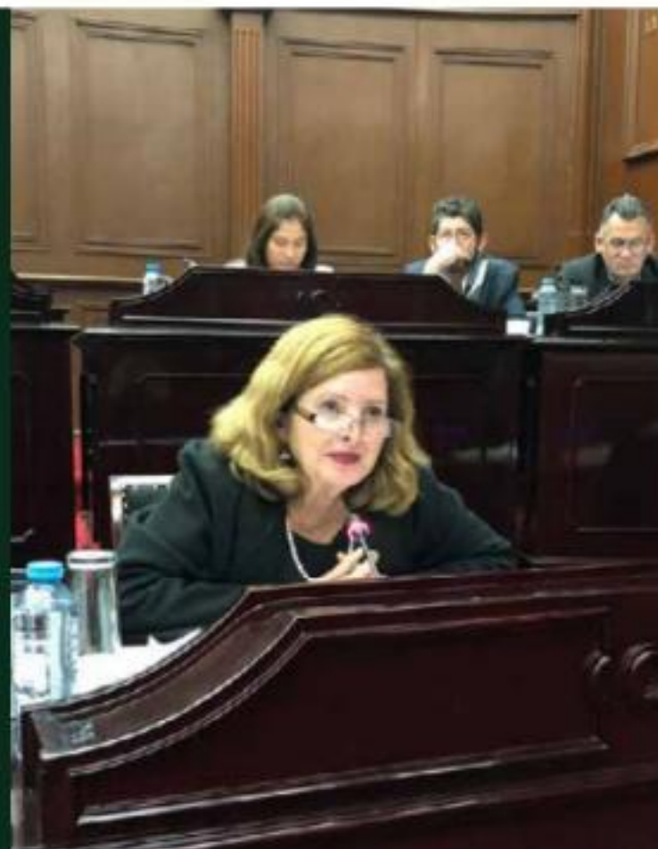
MORELIA, MICH.- La legisladora representante de Morena, propuso la reducción de la tarifa puesto que la impresión de derechos en cuanto a actas de nacimiento en Michoacán es de 124 pesos mientras que en el estado de México, por citar un ejemplo, cuesta 71 pesos.

La propuesta es en función a la situación de marginalidad y pobreza que prevalece y al bajo poder adquisitivo de las personas en los 113 municipios de Michoacán.