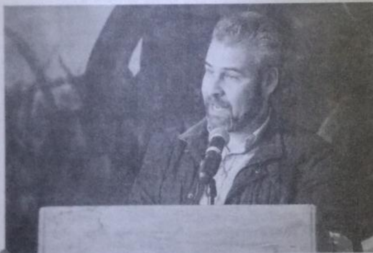
El legislador local aseguró que el presidente Andrés Manuel López Obrador aclarará el tema en próximos días.

El legislador manifestó que los despidos son los ajustes ad-