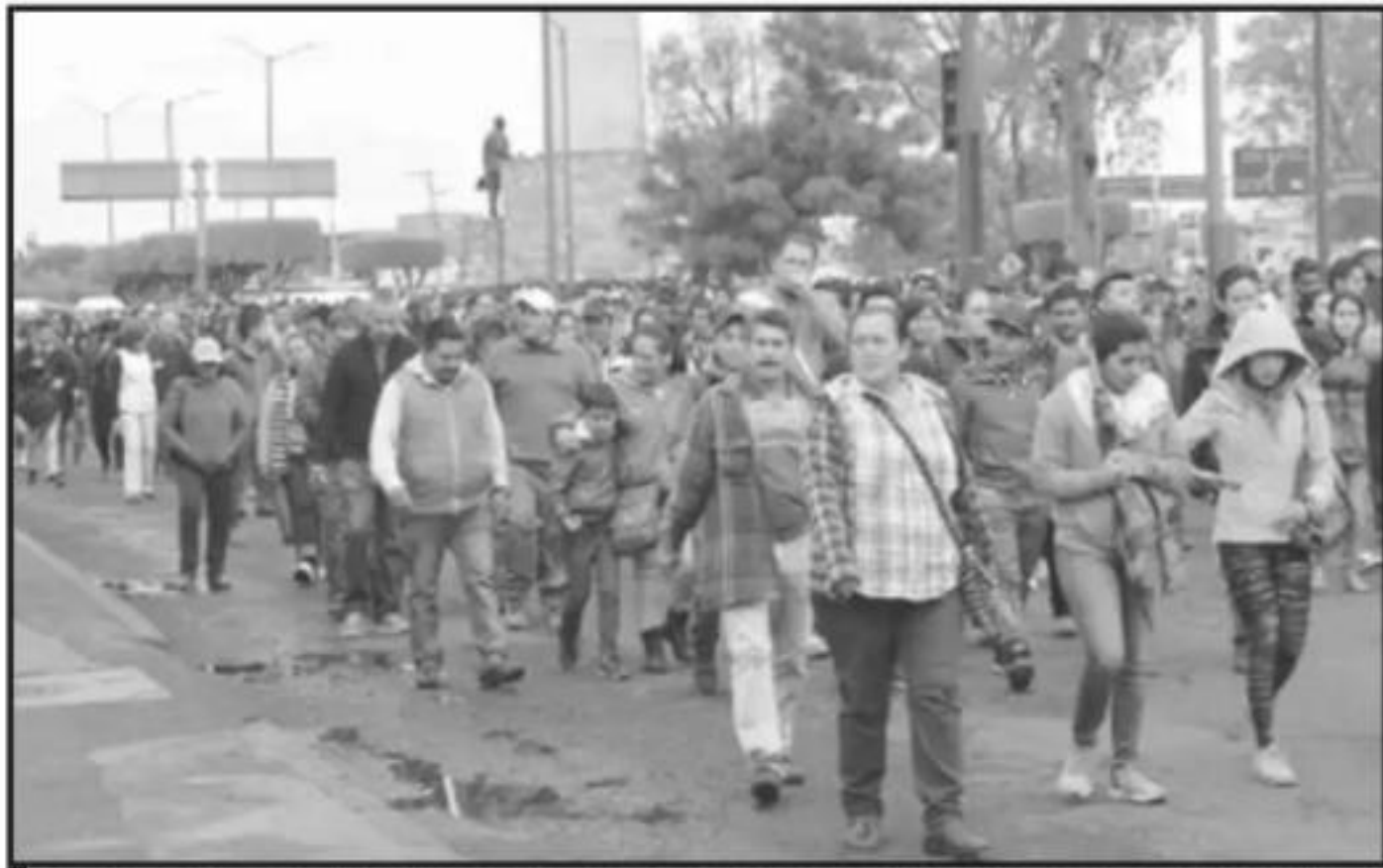
INTEGRANTES DE LA CNTE HAN SALIDO A LAS CALLES EN PROTESTA POR LOS ADEUDOS DE SALARIOS Y PRESTACIONES.