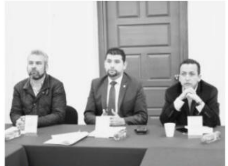
MORELIA, MICH.- Los diputados integrantes de la Comisión de Régimen Interno y Prácticas Parlamentarias, se reunieron para analizar la iniciativa de decreto mediante la cual se reforman diversas disposiciones de la Ley Orgánica y de Procedimientos del Congreso local.

Una vez concluido el análisis, los legisladores aprobaron en comisiones la propuesta, misma que será turnada al Pleno para su discusión y posible aprobación.