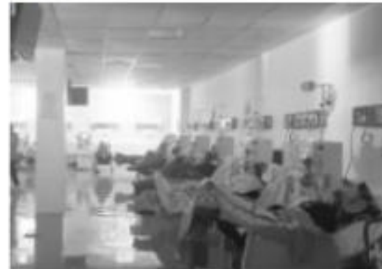
CIUDAD HIDALGO, MICH.- Los trabajos de rehabilitación y equipamiento fueron supervisados personalmente por la titular de la SSM

ple con el compromiso de atender con calidad y calidez a las michoacanas y los michoacanos.