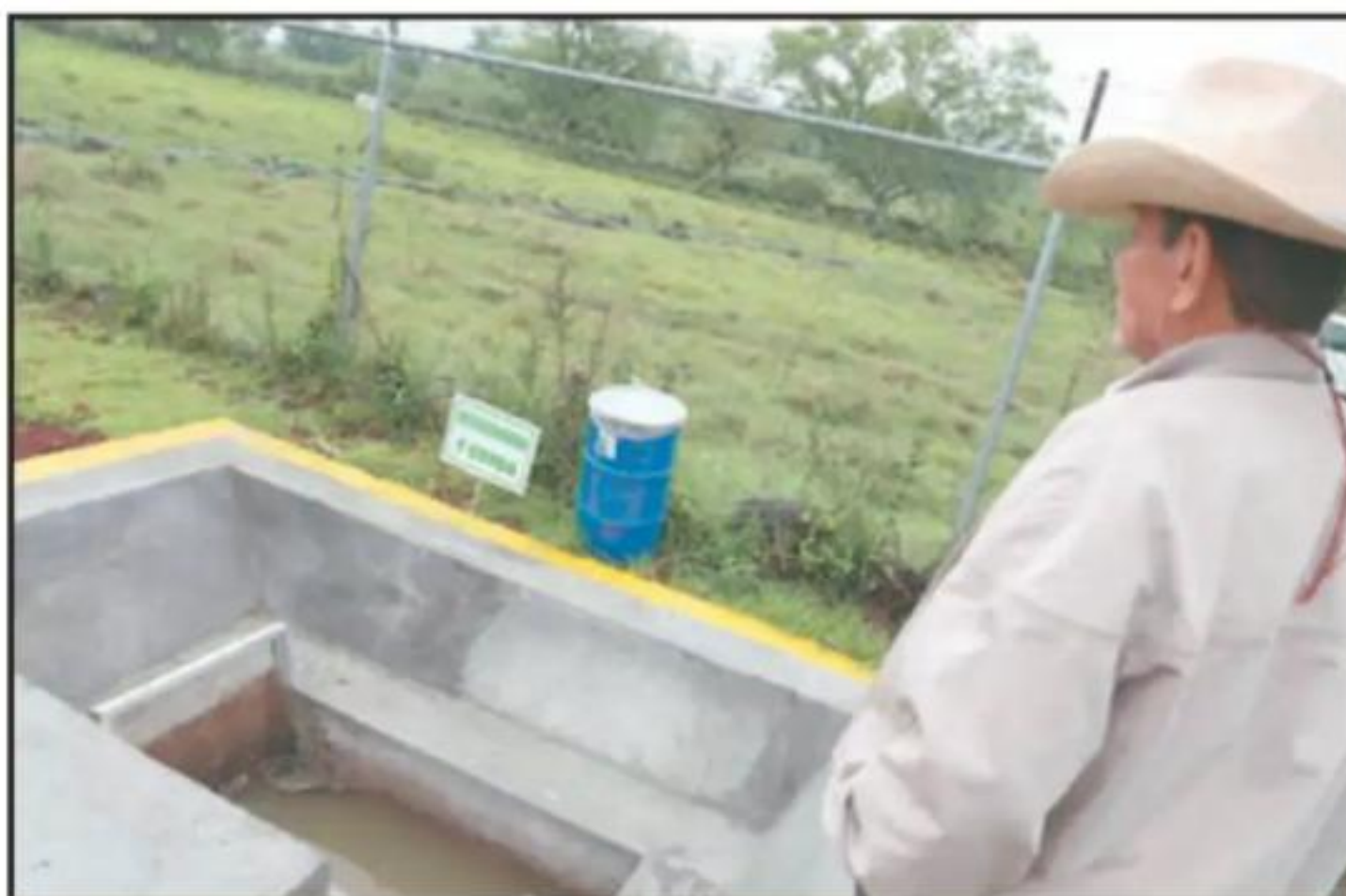
LA FALTA DE RECURSOS COMPLICA CADA VEZ MÁS EL ADECUADO MANEJO DE LAS AGUAS RESIDUALES EN EL ESTADO.

Silvano Aureoles Conejo, GOBERNADOR DE MICHOACÁN