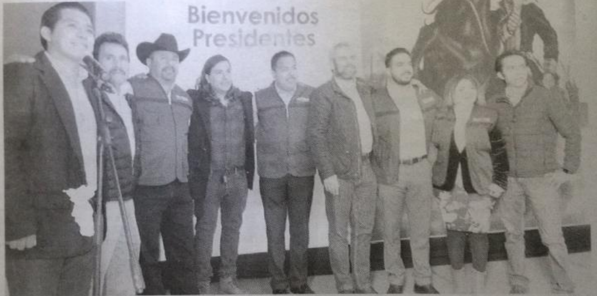
Dan la bienvenida a los presidentes municipales en Morena.

"Para convencer a estos alcaldes de que se vinieran con nosotros, les ofrecimos únicamente trabajo, respeto y voluntad para