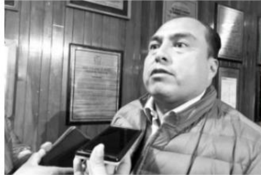
MORELIA, MICH.- En la propuesta presentada el día 15 del presente mes y año, se observa también la disminución preocupante del programa de Extensionismo Rural, además de la desaparición de varios otros programas

Enfatizó que, en la propuesta presentada el día 15 del presente mes y año, se observa también la disminución preocupante del programa de Extensionismo Rural, además de la desaparición de varios otros programas, lo cual es inaceptable, insistió.