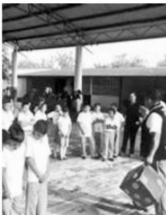
MORELIA, MICH.- Las actividades y talleres que forman parte del programa Escuelas Comprometidas por Nuestra Seguridad, han beneficiado a 97 mil 061 estudiantes michoacanos