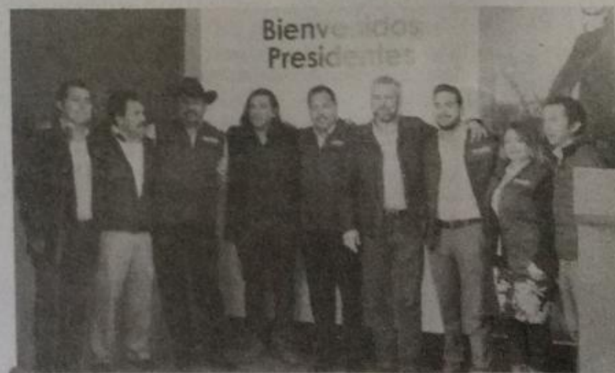
Integrantes del partido guinda dieron la bienvenida a los ediles emanados del PRD, PAN y de la vía independiente.

“Bienvenidos a los presidentes municipales y van a tener de la fracción de Morena unos aliados para trabajar a favor de las comunidades”.