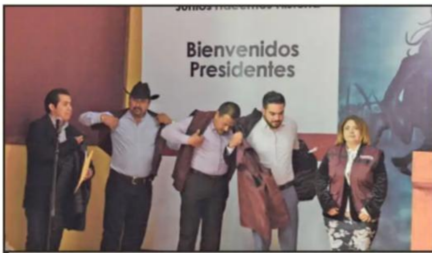
SON CUATRO ALCALDES LOS SE PONEN LOS CHALECOS GUINDAS AL SUMARSE A LAS FILAS DE MORENA.