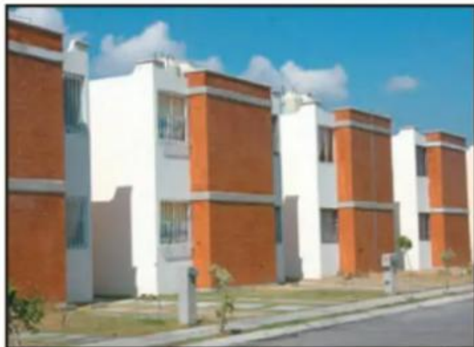
LOS PROGRAMAS DE VIVIENDA SEGUIRÁN ATENDIENDO A LA POBLACIÓN DE MENOS INGRESOS Y SIN ACCESO A FINANCIAMIENTO, DIJO SEDATU.

Además, agregó, pone en riesgo las agroexportaciones, porque se disminuyen considerablemente los recursos destinados a la sanidad e inocuidad agroalimentaria, rubro por demás importante que permite garantizar la comercialización de productos agrarios.