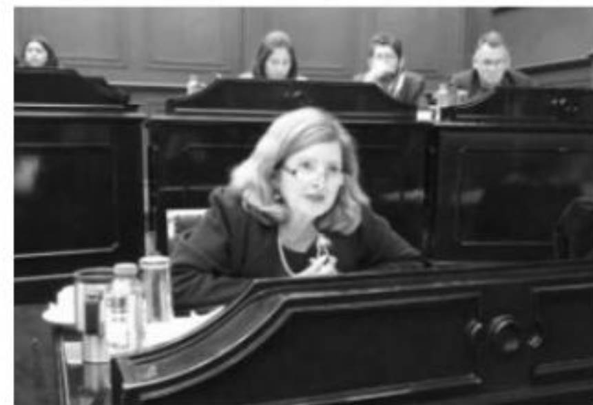
MORELIA, MICH.- Se solicita que las personas con discapacidad y los adultos mayores a 65 años de edad reciban estos trámites de forma gratuita y que los documentos expedidos por el registro civil no tengan vigencia.

La propuesta es en función a la situación de marginalidad y pobreza que prevalece y al bajo poder adquisitivo de las personas en los 113 municipios de Michoacán.